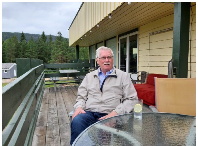
Vi satte oss ute på terrassen.