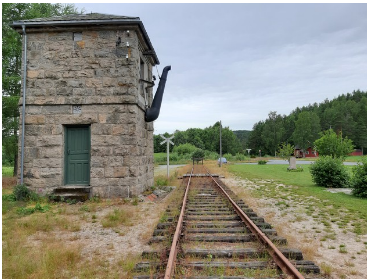
Vanntårnet sett fra en annen vinkel.