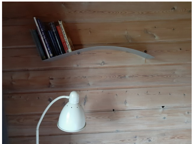
Original bokhylle på rommet.