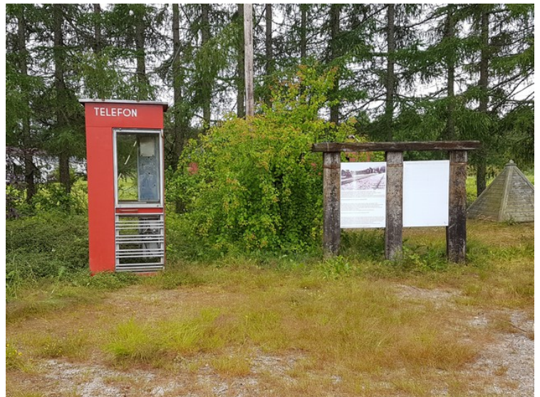
En telefonkiosk trengtes på en jernbanestasjon.