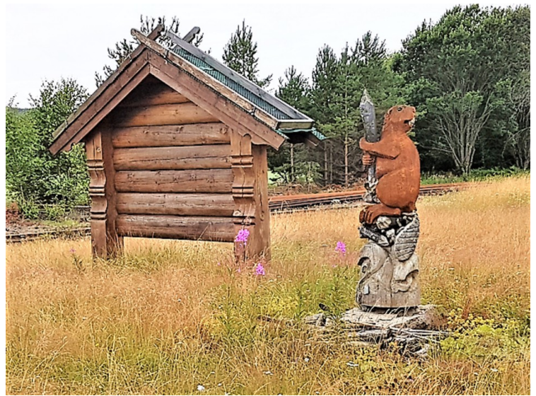
Noen hundre meter videre står det en statue av en bever.