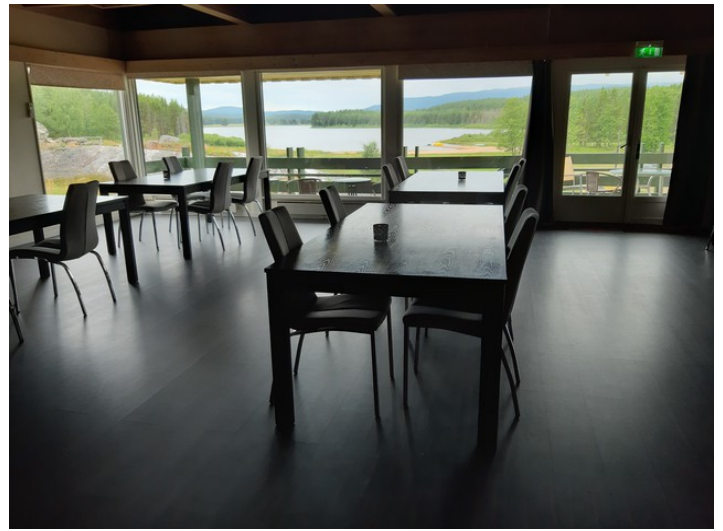
Etter at vi hadde sjekket inn og installert oss på rommet, så fant vi ut at vi skulle ha en gin&tonic før middagen. Dette er spisesalen og frokostsalen.