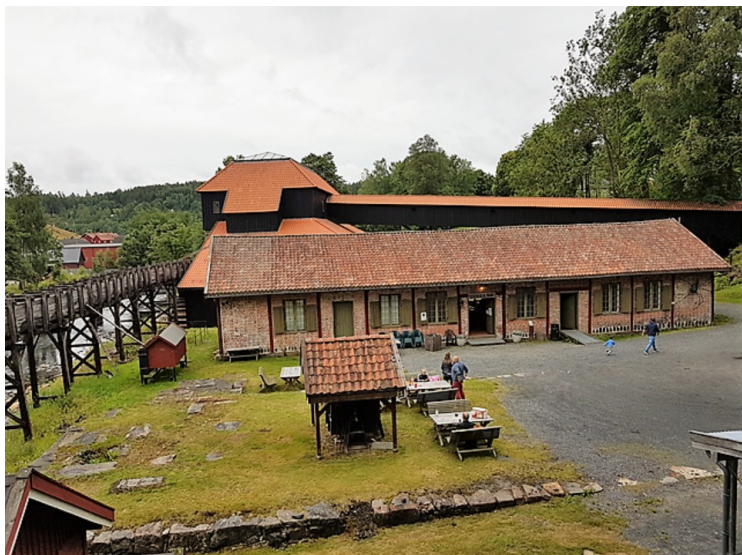
Her ser vi fremst snekkerboden/resepsjonen og bakerst huset for masovnen.