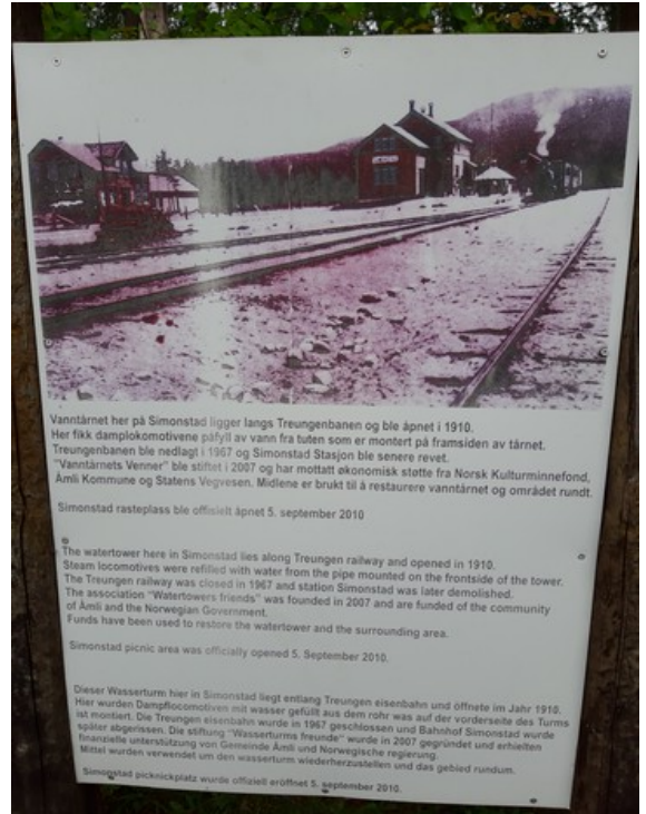
Bilde av stasjonsbygningen da den var i drift. Den ble tatt i bruk i 1910. Da Søftestad gruber ble nedlagt i 1965 ble jernbanen mellom Simonstad og Treungen nedlagt i 1967 og stasjonsbygningen ble revet.