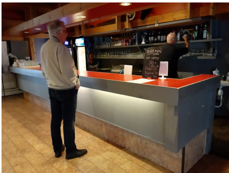
Her er også en bardisk og bartenderen er i gang med å lage drinkene.