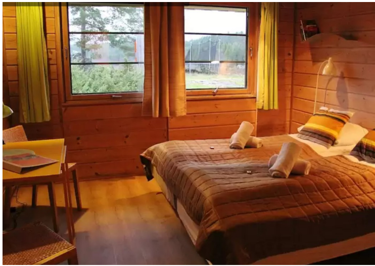
Rommet så slik ut.