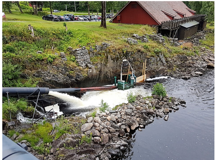
Nedenfor brua er det et overløpsrør.