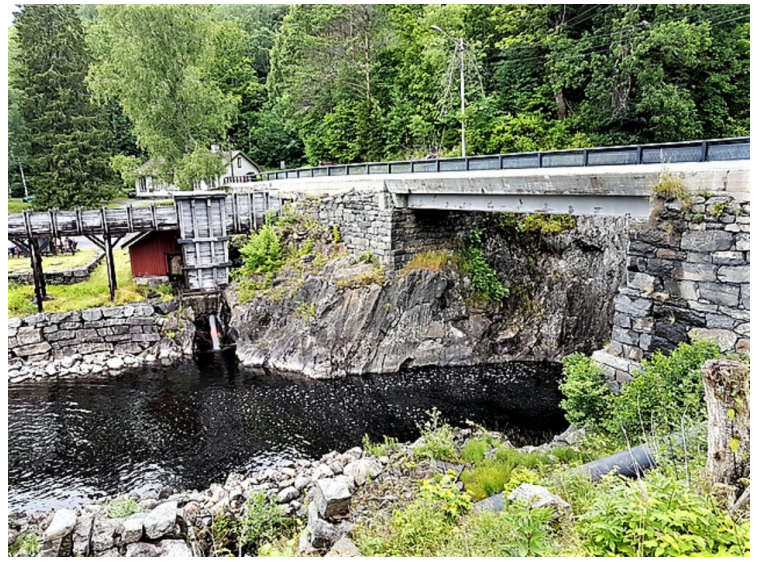
Her går veien over Storelva .