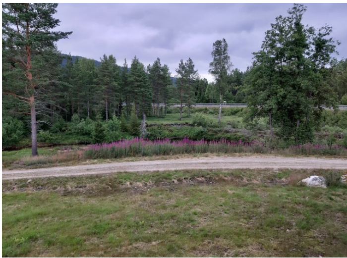
Mer utsikt. Vi ser også veien som går ned til badeplassen. Bakerst ser vi hovedveien som går forbi hotellet.