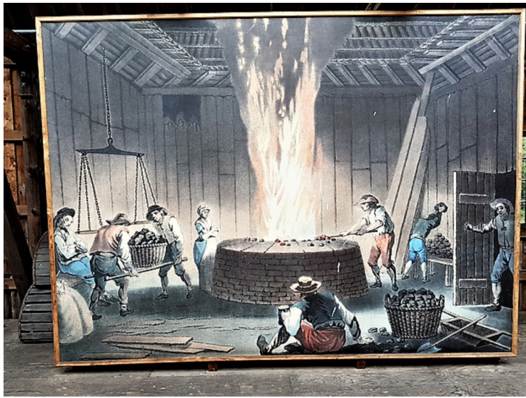
Inne i bygget står dette bildet.