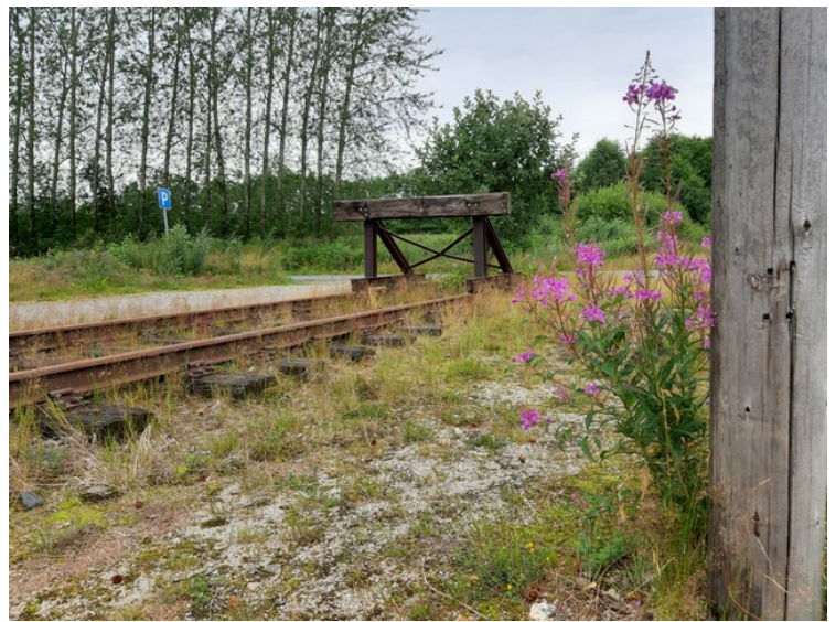
Her er det stopp.

Skinnegangen mellom Nelaug og Simonstad ligger fortsatt og strekningen er ikke formelt nedlagt. Foreningen «Vanntårnets venner» ble dannet i 2007. Den har fått midler til å restaurere tårnet og området rundt.