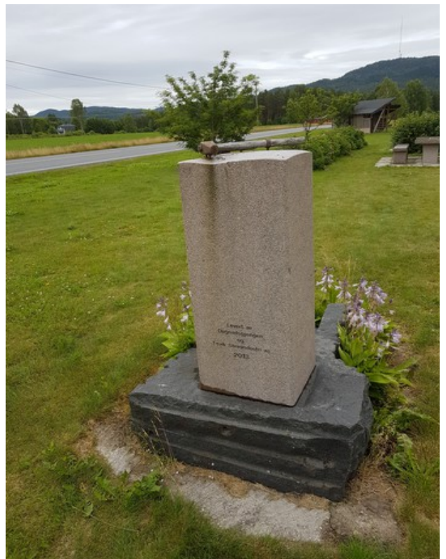
Her står det Levert av Dugnadsgjengen og Fevik Steinindustri as 2013.

Dette monumentet står ved innkjørselen fra hoveveien.