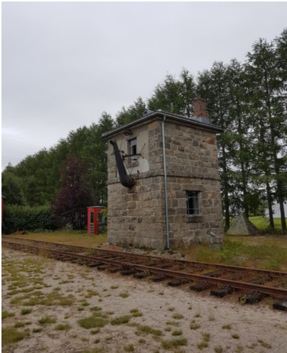
Dette vanntårnet står ved jernbanelinja på Simonstad stasjon på Treungenbanen . Her kunne man fylle vann på damplokomotivet. Jernbanelinja gikk mellom Arendal og Treungen .