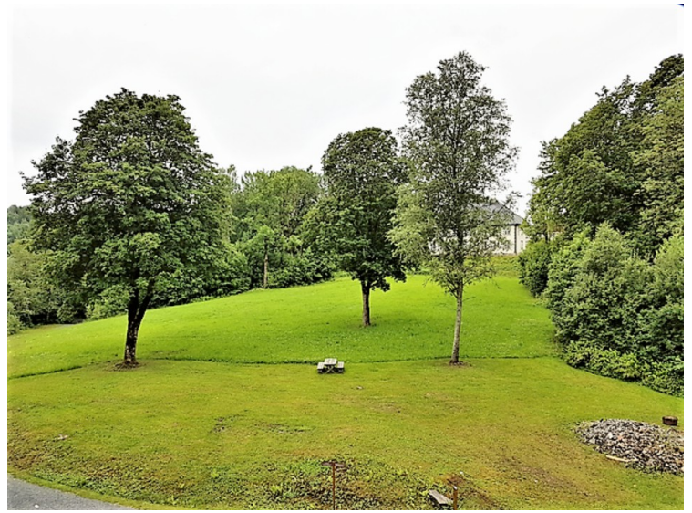
Herfra skimter vi Nes verk hovedgård.