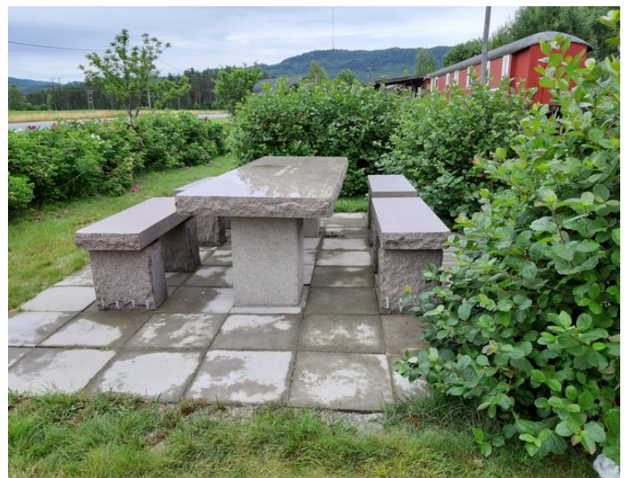
Det er laget rasteplass her med steinbord og steinbenker. Den ble åpnet i 2010.