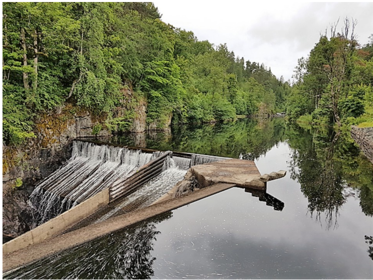
Ovenfor brua ligger Hammerdammen.