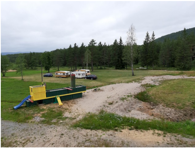
Det sto tre campingvogner nedenfor hotellet da vi var der.