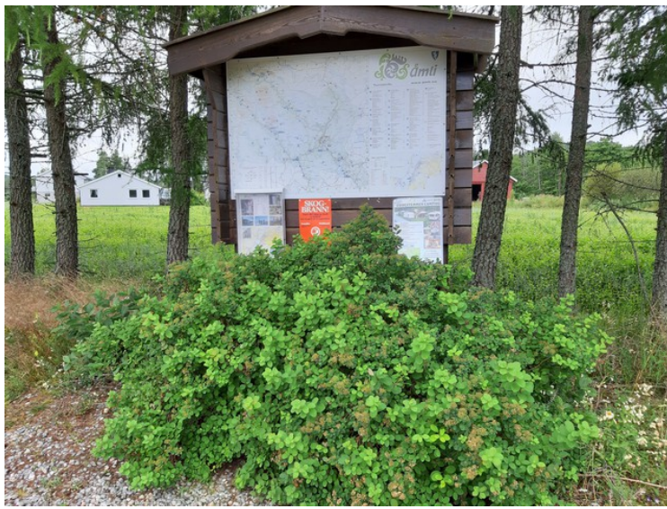
Dette skiltet sto ved siden av det andre.