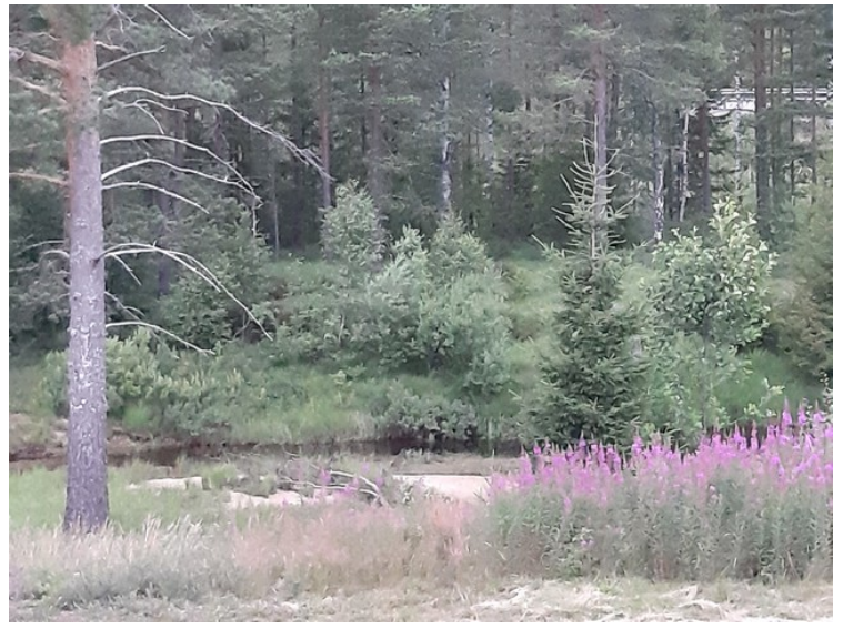
Utsikten fra rommet. Vi ser Stigvasselva før den renner ut i Valleken.