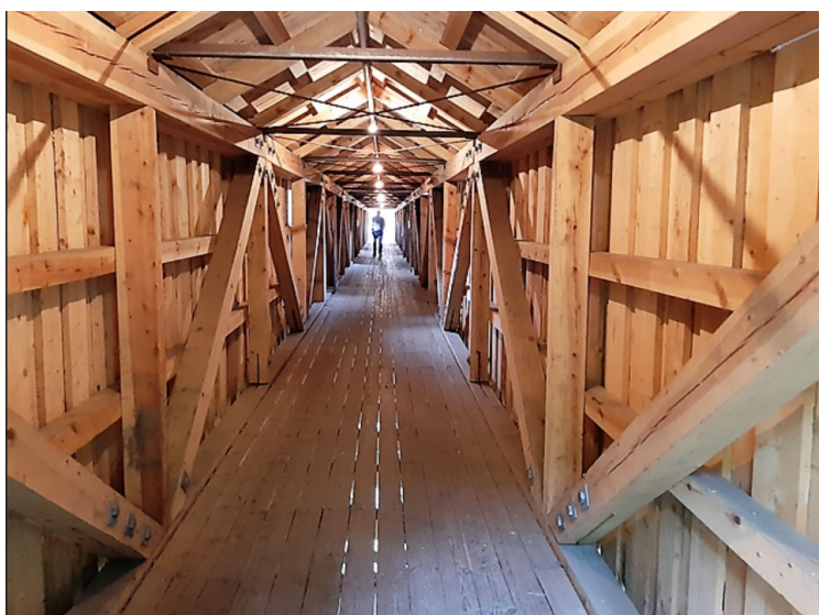
Jeg er på vei gjennom gangbroen til huset for masovnen.