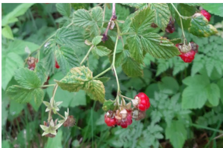
Det vokser bringebær også her.