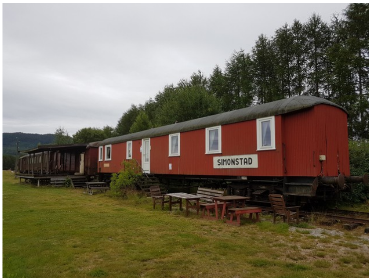
Et vognsett står til utstilling.