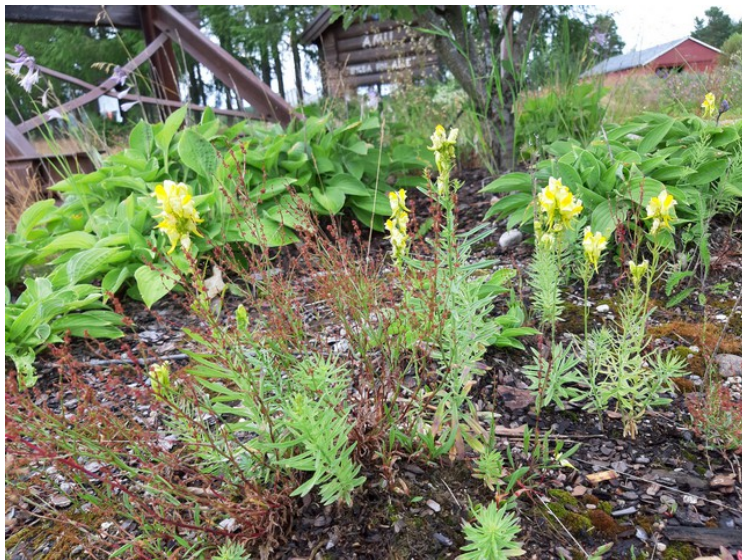
Det vokste Lintorskemunn her.

Skinnegangen mellom Nelaug og Simonstad ligger fortsatt og strekningen er ikke formelt nedlagt. Foreningen «Vanntårnets venner» ble dannet i 2007. Den har fått midler til å restaurere tårnet og området rundt.