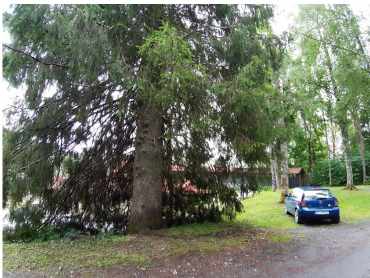
Dette er et svært grantre.