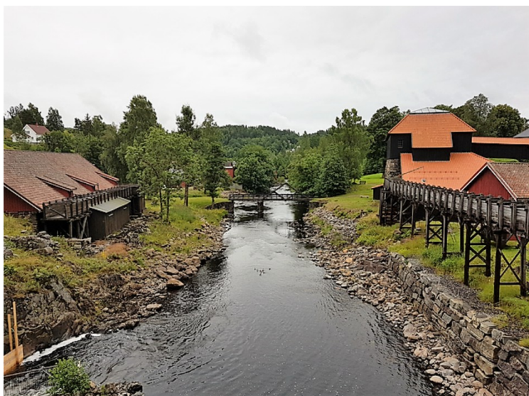
Utsikt videre nedover elva.