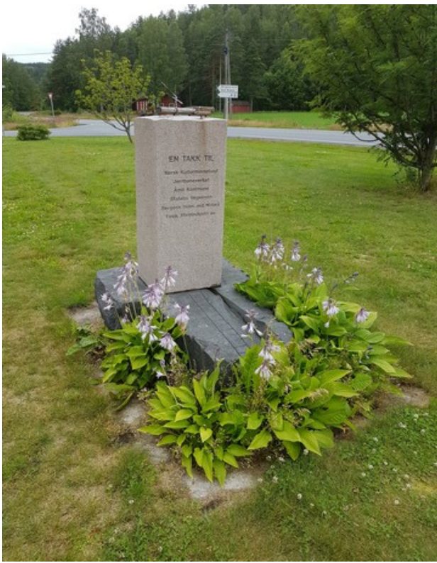
Her står det EN TAKK TIL Norsk Kulturminnefond Jernbaneveket Åmli Kommune Statens Vegvesen Bergene Holm avd Nidarå Fevik Steinindustri as

Dette monumentet står ved innkjørselen fra hoveveien.