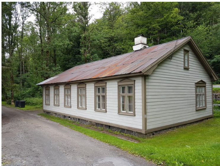
Vet ikke hva slags hus dette er.