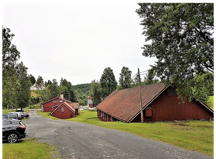
Da vi kom til Nesgrenda stoppet vi ved Nes Jernverk . Vi parkerte til venstre her.

Jernverket ble åpnet i 1665 og nedlagt i 1959. Stiftelsen Nes Jernverksmuseum ble etablert i 1992. Det nærmeste huset er Hammeren, Det neste er Stykkboden og det nederste er Digelstålverket.