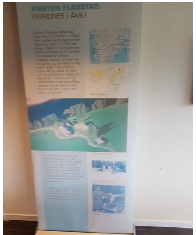
I spisesalen er det plakater med litt av Kirsten Flagstads historie. Spisesalen heter Kirsten Flagstad salen.