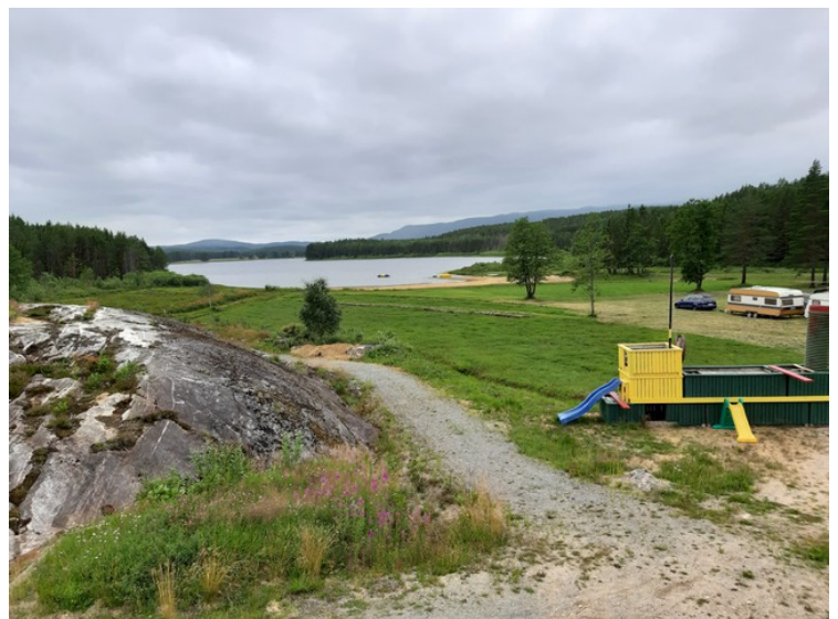
Dette er utsikten fra terrassen. Den sjøen vi ser heter Vallekilen. Det er badeplass med sandstrand rett nedenfor hotellet. Vannet fra Vallekilen renner ut i Nidelva som går bak sjøen i bildet. Sigridnes ligger på andre siden av Nidelva bak skogen til venstre. Mer om Sigridnes senere.