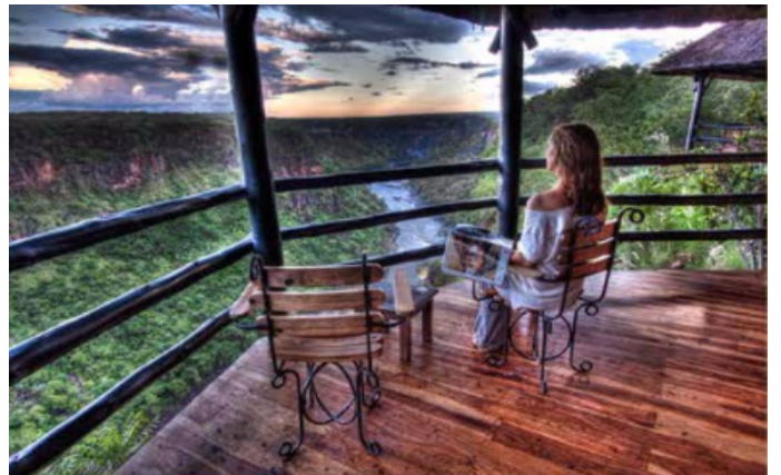
Utsikt fra baren.