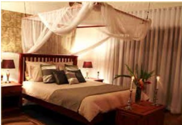
Inne fra hytta

Vi skulle bo på Gorges Lodge etter at vi hadde vært på Bomani. Den ligger rett sydøst for Victoria Falls, på kanten av den kløften som Zambesielen renner gjennom.