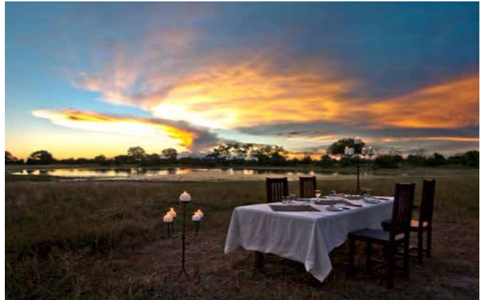
Utendørs spiseplass, ikke langt fra vannhullet.