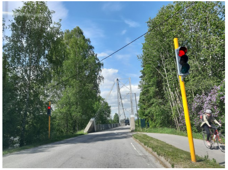
Her skal vi kjøre over brua på Brandval .