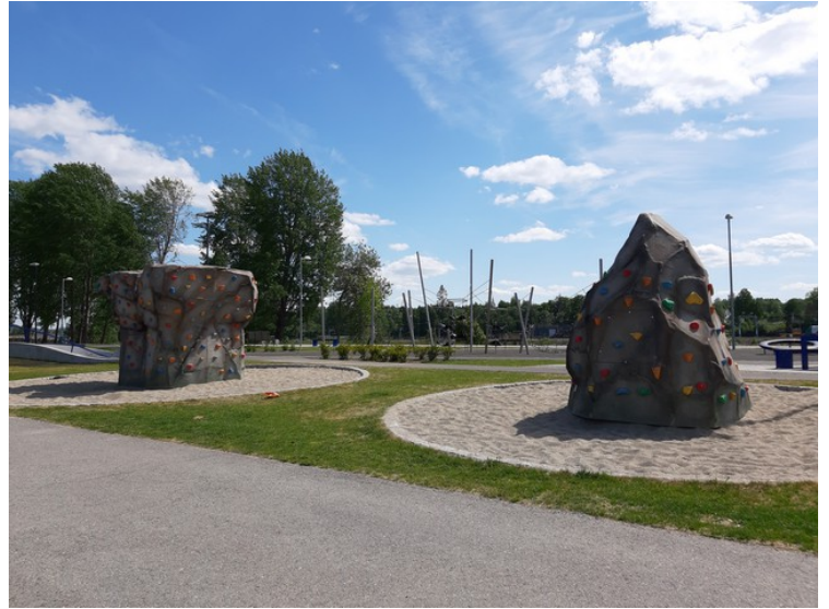
Dette er ved Tufteparken i Kongsvinger .