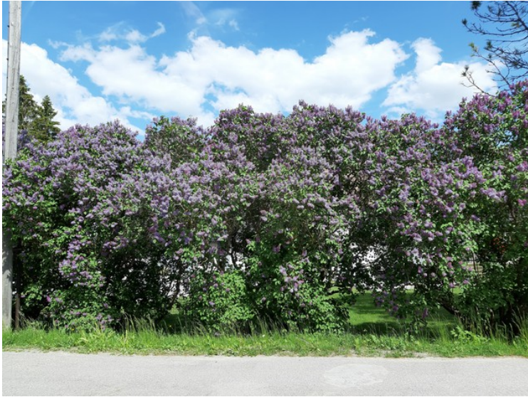
Her blomstrer syrinene .