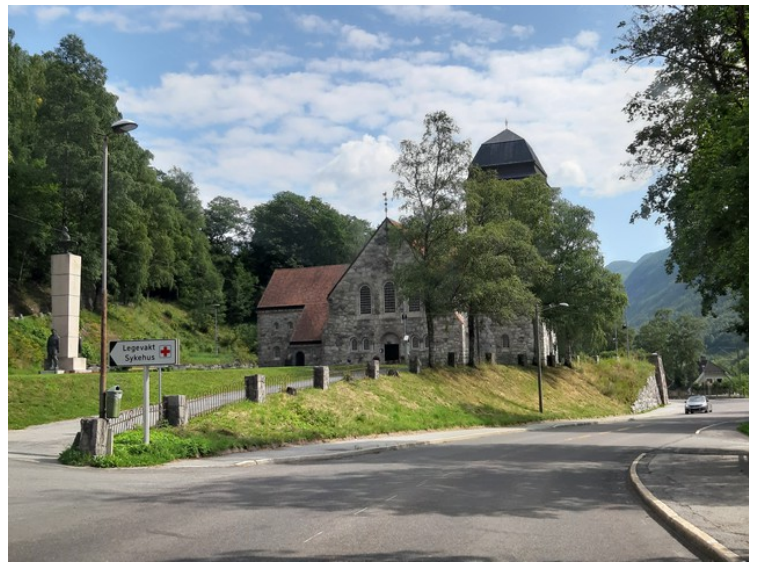
Rjukan kirke .