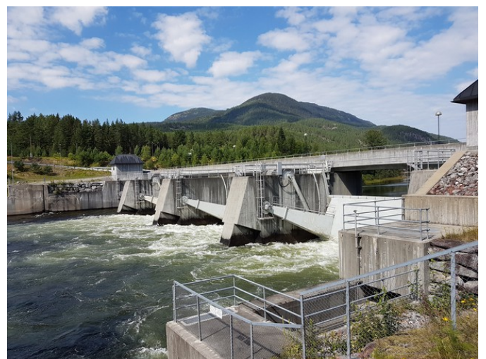
Tinnsjøen ble regulert allerede i 1880-årene. Her er demningen ved Tinnoset. Den gamle demningen ble erstattet med en ny dam i 2003.

Etter dette stoppet kjørte vi direkte hjem til Kongsvinger.