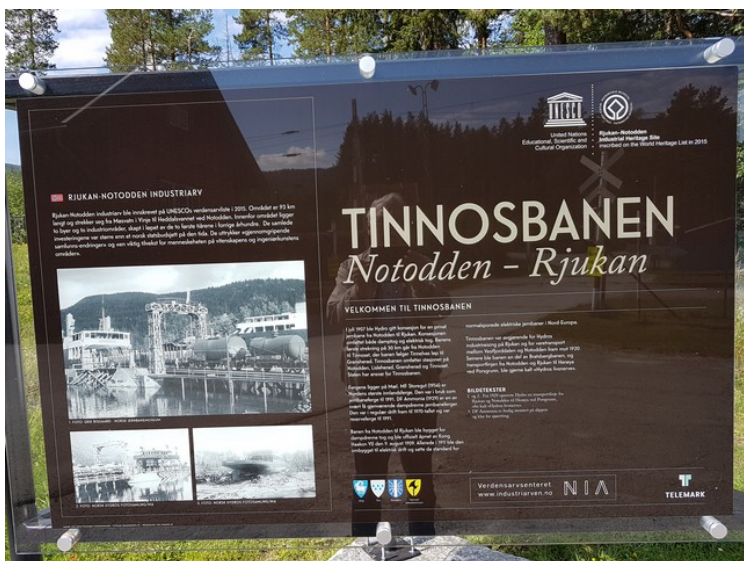
Det står er stort opplysningskilt her også.