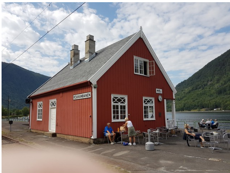
Så var vi kommet til Mæl . Dette er endestasjonen på Rjukanbanen . Den ble nedlagt i 1991 men Stiftelsen Rjukanbanen ble opprettet i 1996 for å drive museumstrafikk på banen,