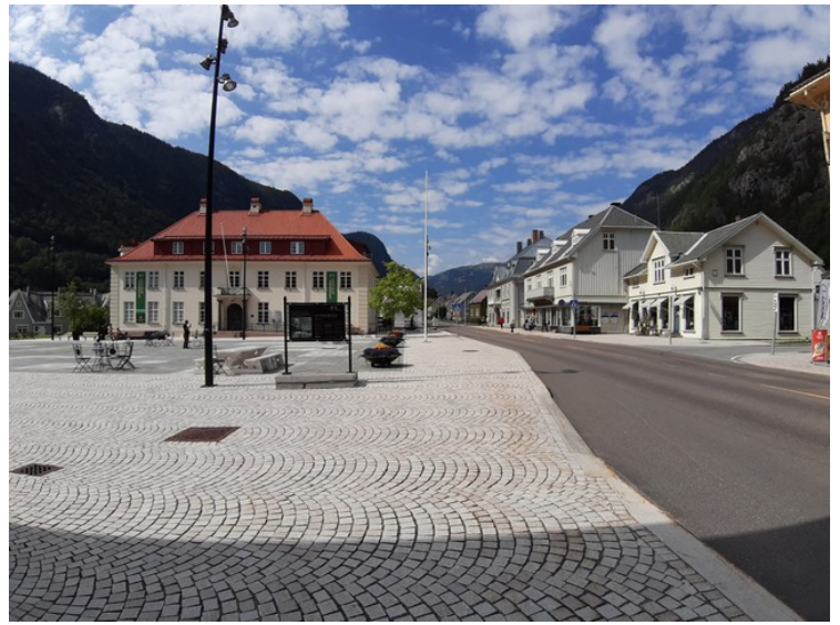
Hovedveien gjennom Rjukan . Rjukan er på UNESCOs Verdensarvliste. Den er en del av Rjukan – Notodden industriary .