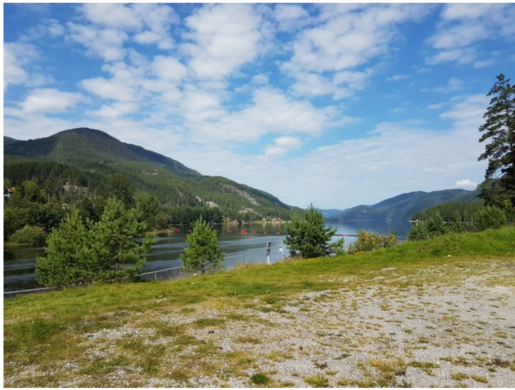
Vi kjørte langs Tinnsjøen til Tinnoset . Tinnsjøen er Norges 3. dypeste innsjø.