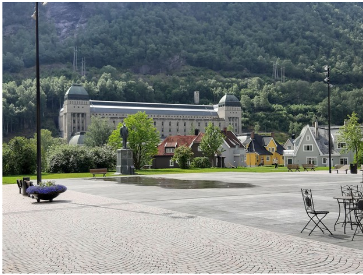
Såheim kraftverk ble satt i drift i 1916.