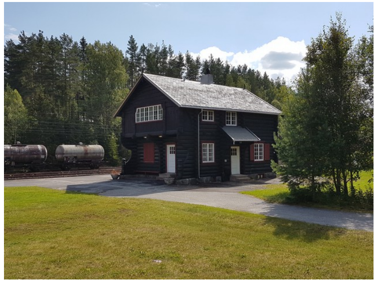
Dette er Tinnoset stasjon som var endestasjon på Tinnosbanen . Herfra gikk transporten videre til Rjukanbanen med de tre jernbanefergene.