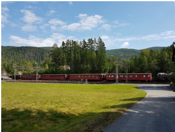
Jernbanevogner ved Tinnoset stasjon.