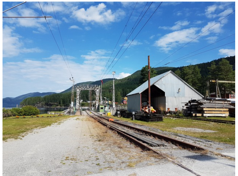
Her er terminalen og slipp for å kunne etterse fergene.