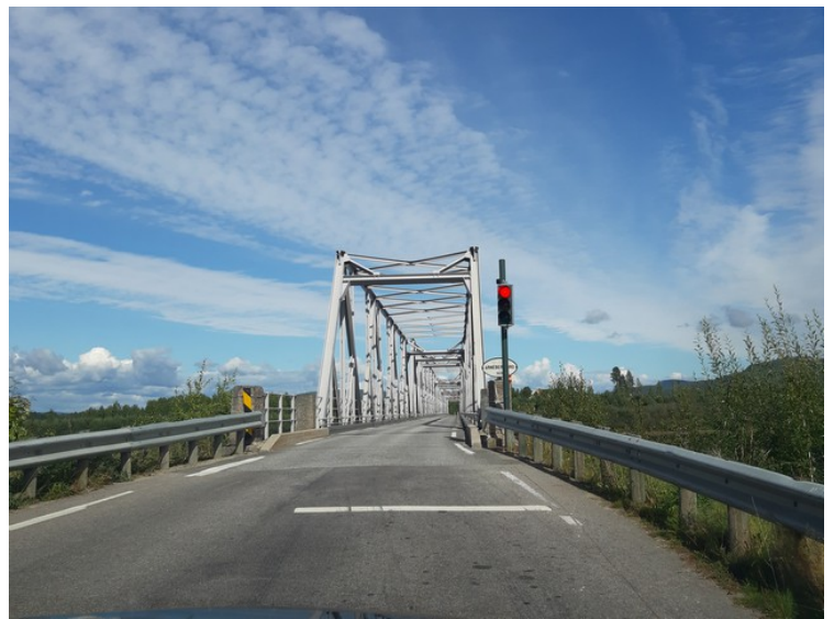
Dette er brua over Glomma ved Arneberg.