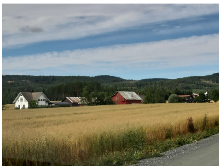
Dette er i Risberget