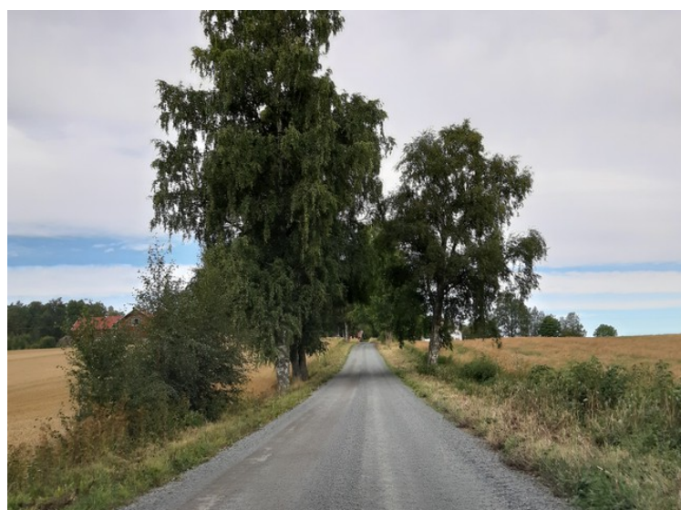
Dette er rett før vi kommer til Risberget.