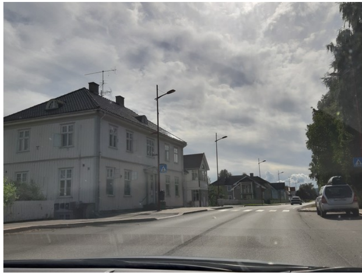
Ut av Kirkenær.