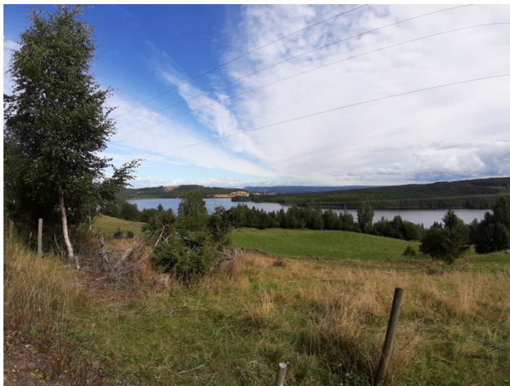
Etter at vi hadde vært ved Holmsjøen, kjørte vi ned igjen og videre nordover på vestsida av Hukusjøen.