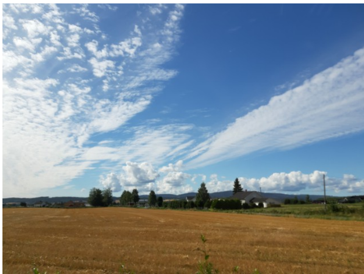
Kornet var høstet mange steder i distriktet.