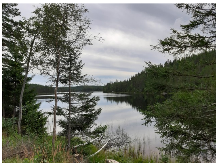
Vi kjørte videre, nesten til Hukusjøen, til Rusvekk. Der kjørte vi en grusvei opp til Holmsjøen.