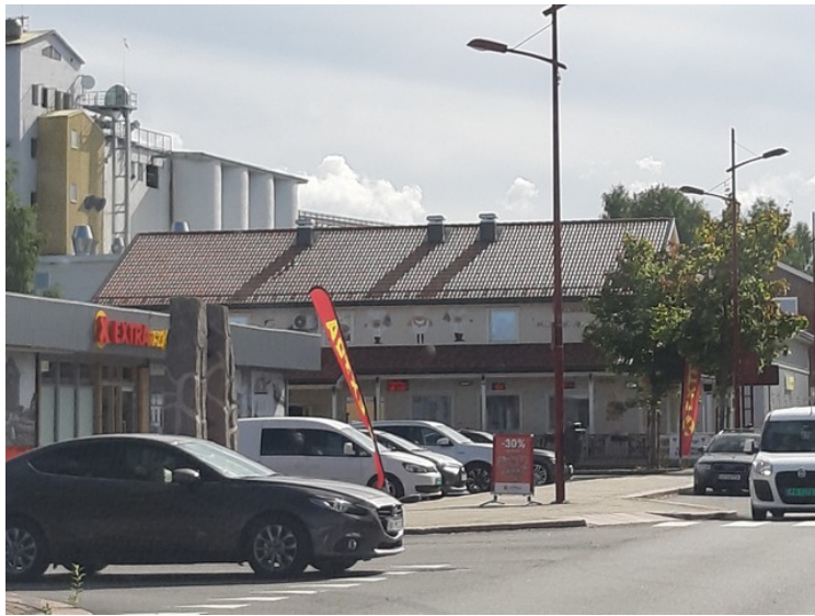
I Kirkenær. Coop Xtra og kornsiloen til venstre.