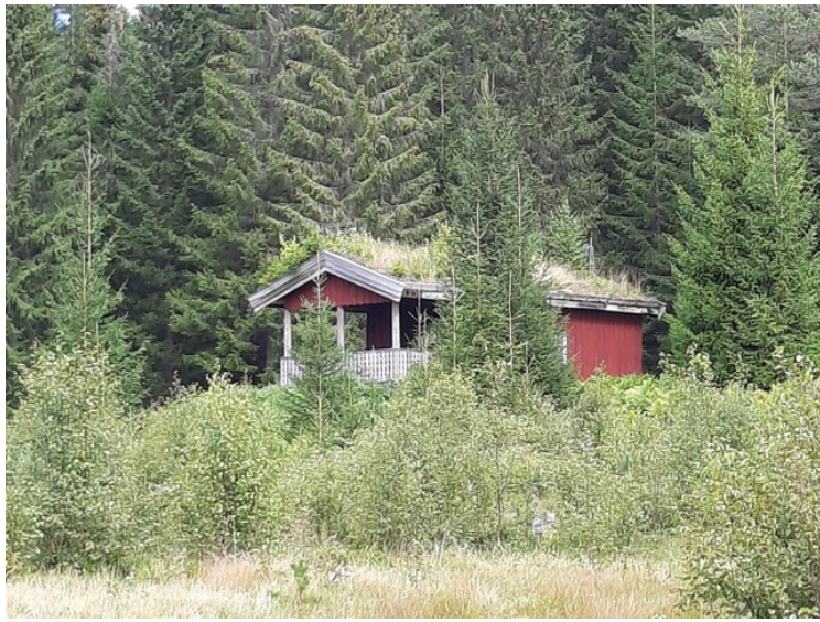
Vakkersætra ligger ved Holmsjøen.