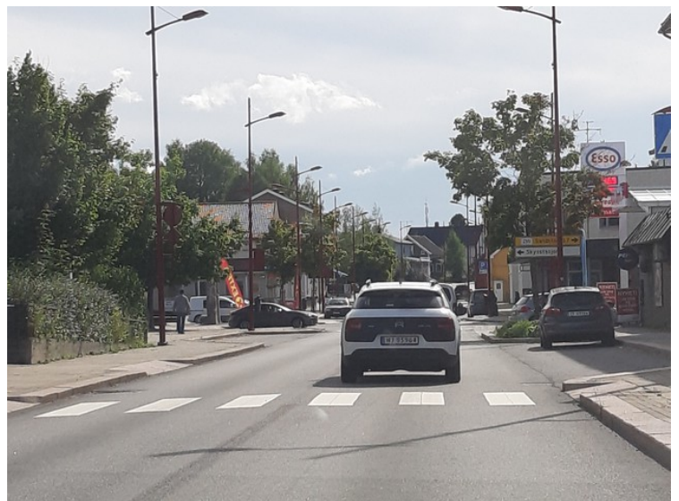
Gjennom sentrum i Kirkenær.