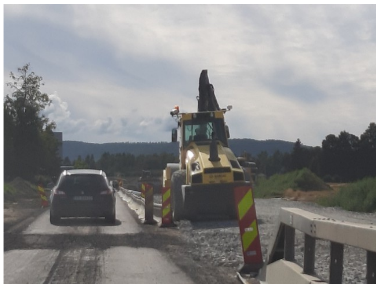
Rett syd for Kirkenær var det veiarbeid, så vi måtte vente litt for å få grønt lys.