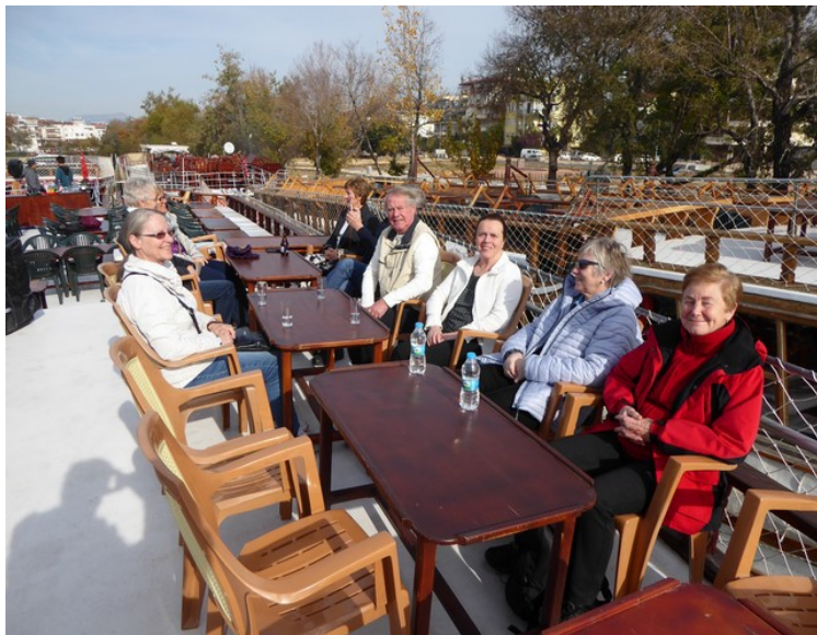
Første post på programmet neste dag var en tur til Manavgat . Der skulle vi ha en båttur på Manavgatelven . Her har vi tatt plass på soldekket på båten. Link .