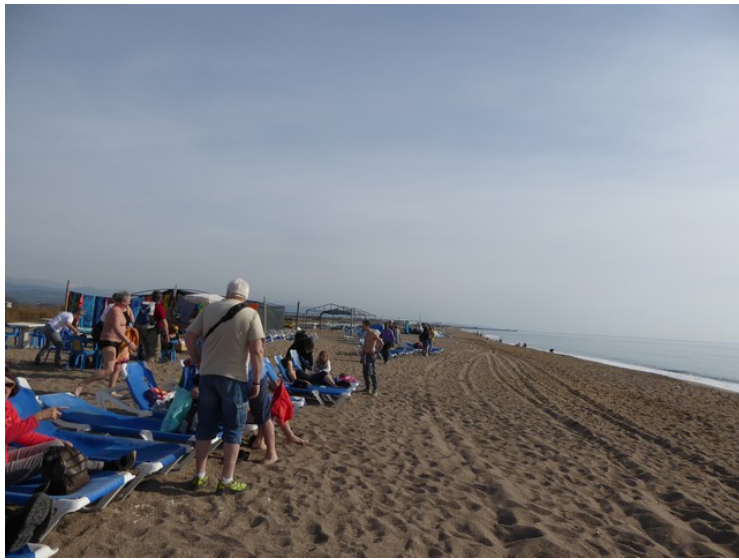
Her ser vi mot øst.