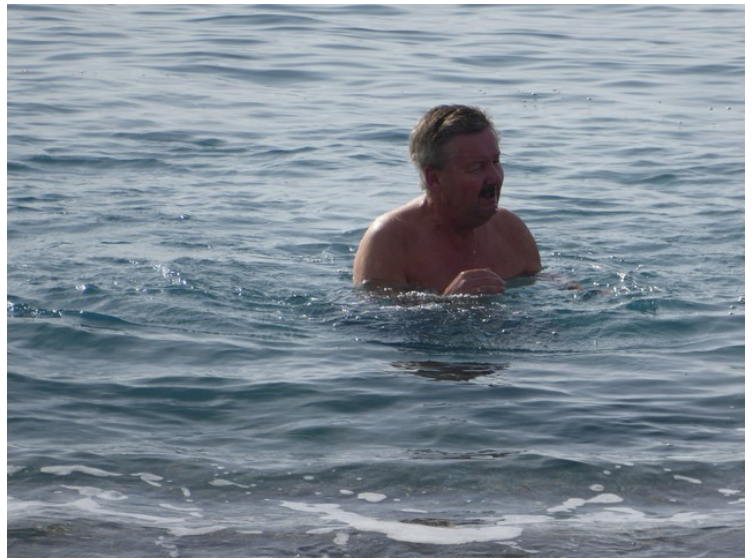
Det ble påstått at det var 18 grader i sjøen.