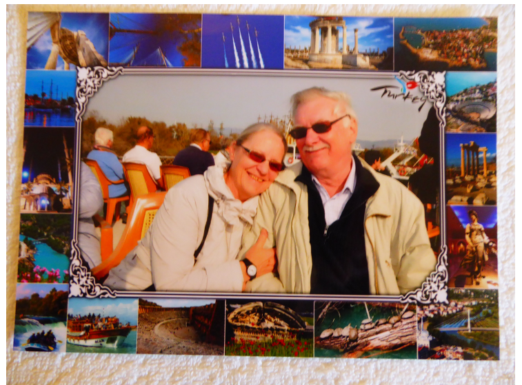
Det ble selvfølgelig tatt bilder her også, og vi kjøpte disse tre.