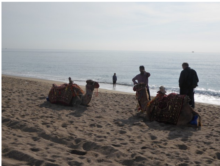
Det var et par kameler på stranden.