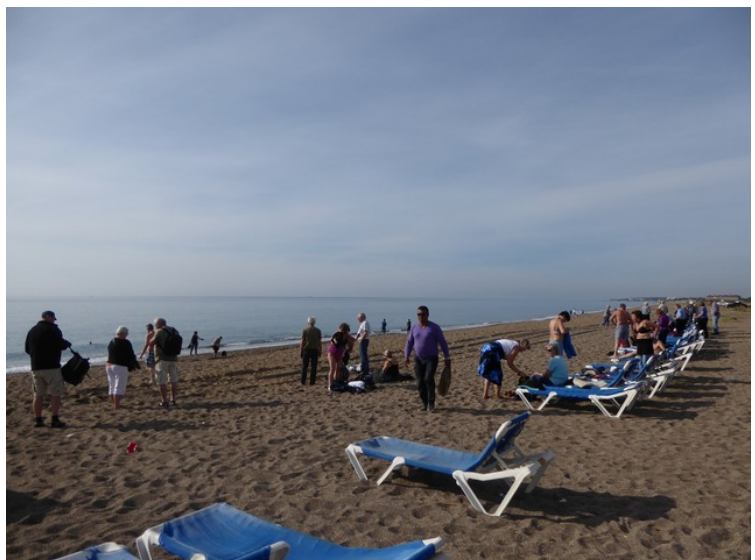
Det var mange som ville bade i sjøen. Her ser vi mot vest.