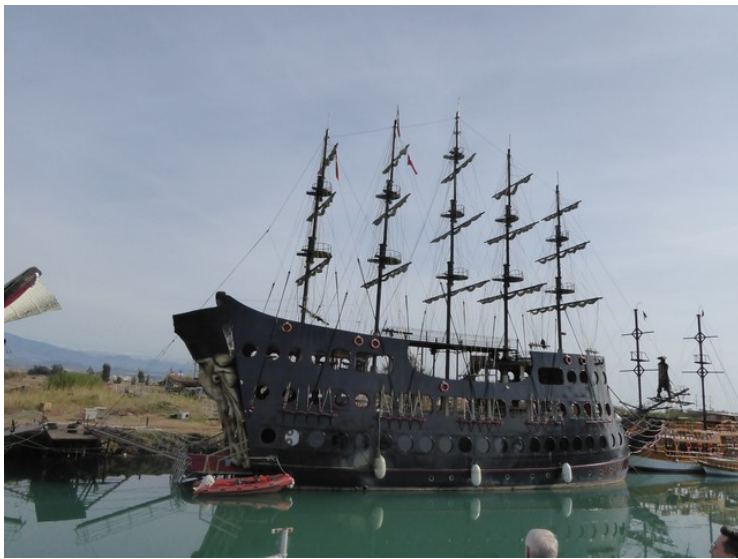
Det var flere spesielle båter her.