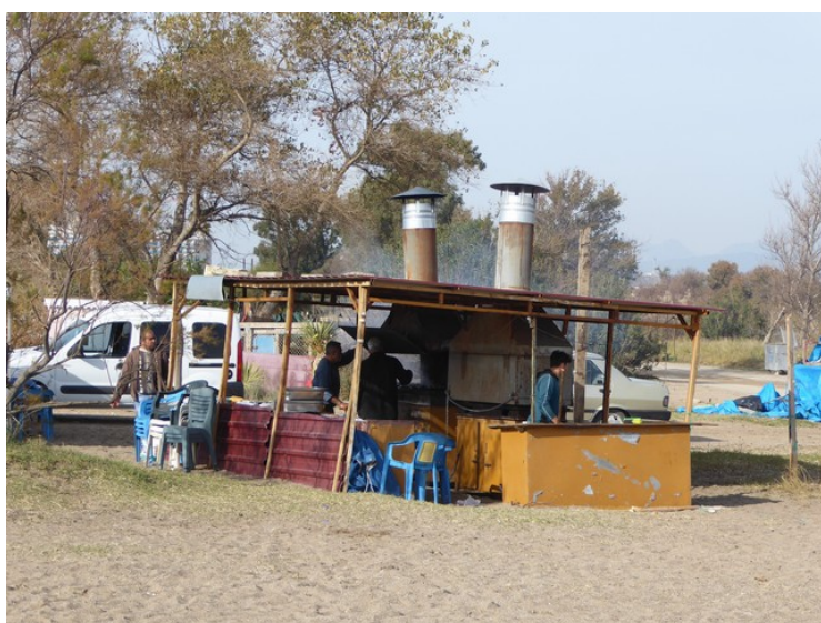
Dette er hvor maten vår ble grillet.