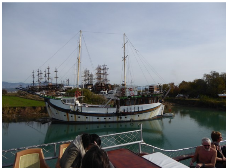
Det lå mange sightseeingbåter nedover elva.