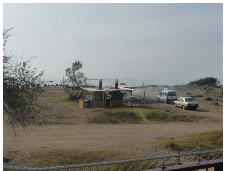
Grillplassen sett fra båten.