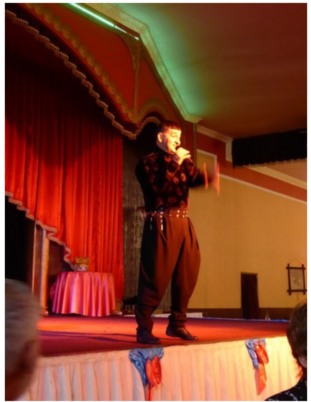
Han her introduserte det følgende programmet vi skulle få se. Det meste var tyrkiske folkedanser.