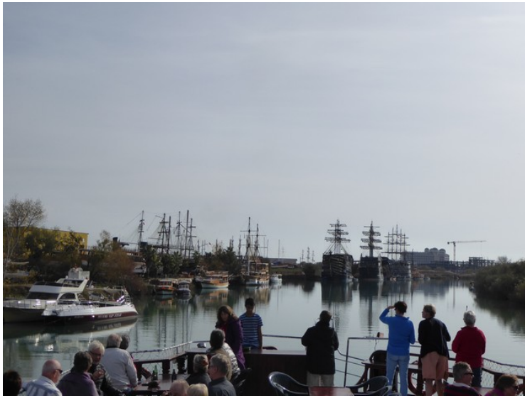
De fleste lå i vinteropplag.