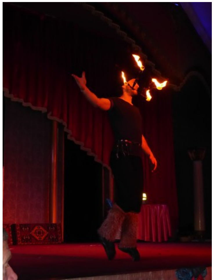
Denne karen opptrer med brennende fakler.