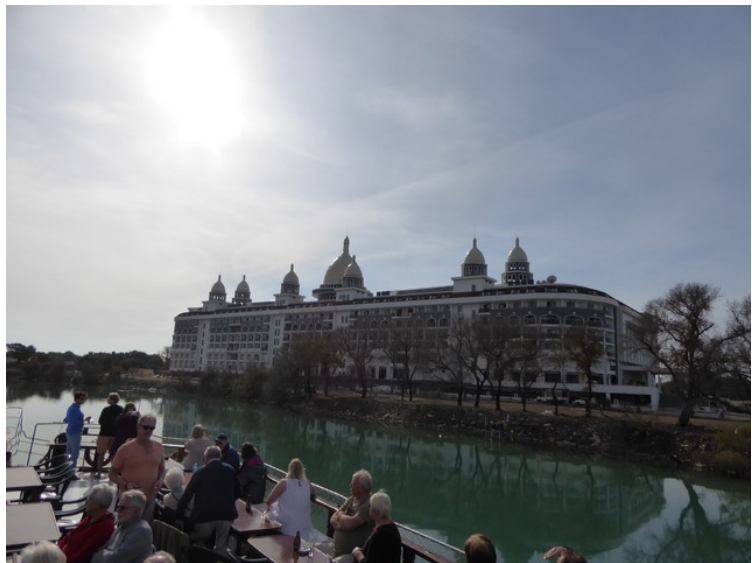
Et stort hotell.