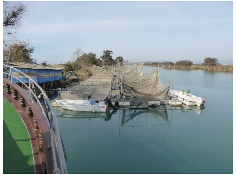
Rett ved der båten la til er det et oppdrettsanlegg for ørret.