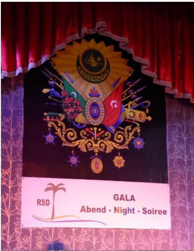
En plakat på scenen.