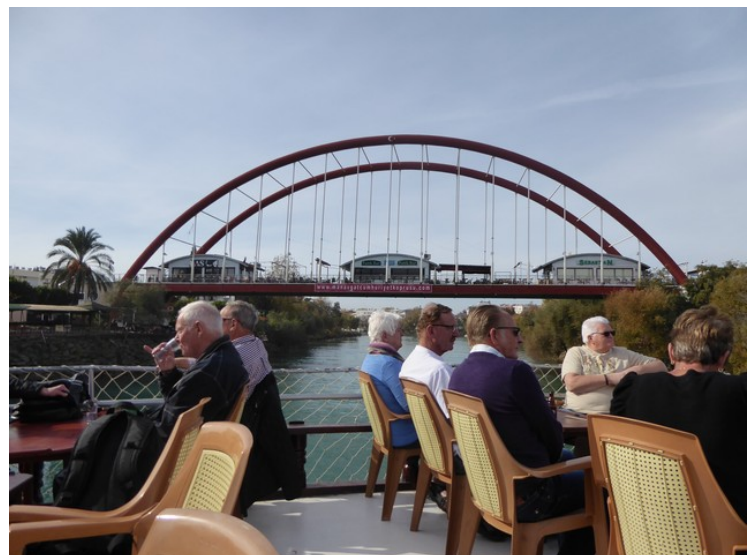
Vi kjørte et stykke oppover elva, under denne brua, for å snu, før vi kjørte nedover mot munningen.