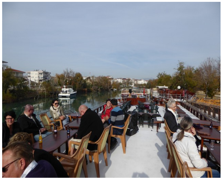
Utsikt oppover elven.