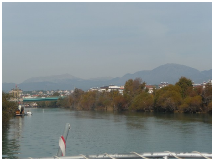
Elva er ganske brei enkelt steder.