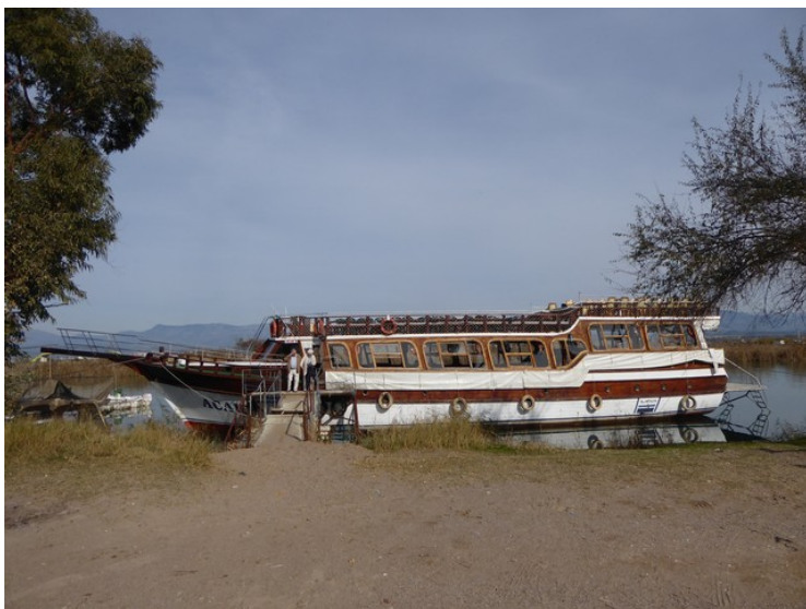
Dette var det båten vi brukte. Vi la til kai et stykke fra munningen av elven.