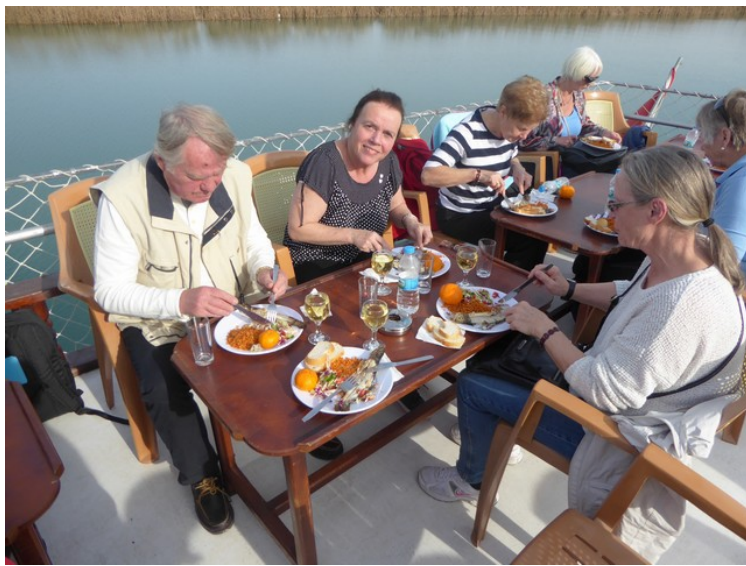
Her har vi fått maten. Det var god ørret som sikkert hadde vokst opp i oppdrettsanlegget. Kortreist mat.