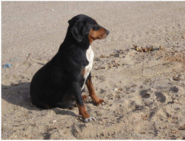
Denne hunden satt ved grillplassen. Den var ikke interessert i kontakt med oss.