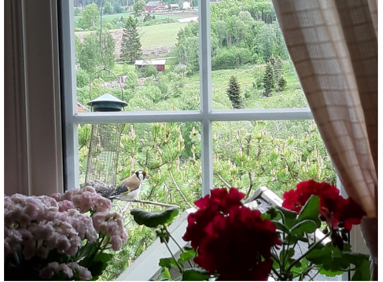
Utenfor kjøkkenvinduet så vi en stillits som spiste frø.