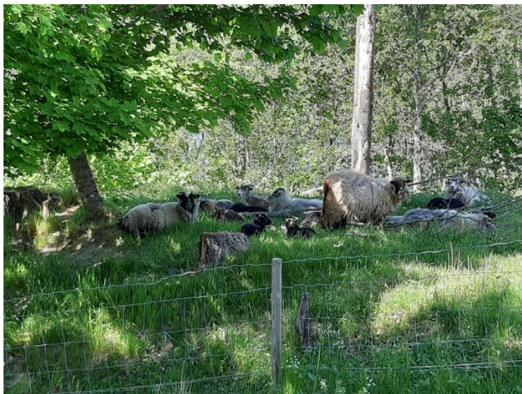
Sauer på beite ved sjøen.