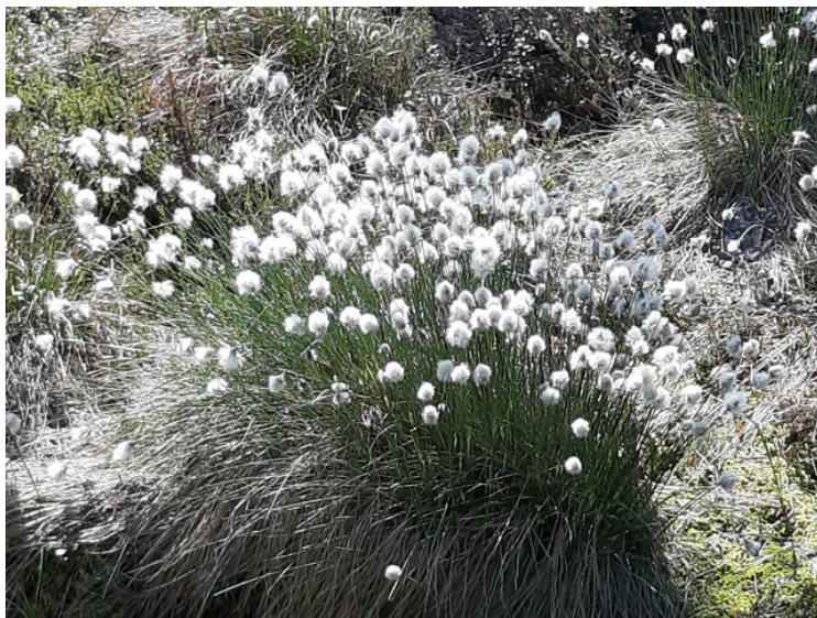
Her vokser det myrull .