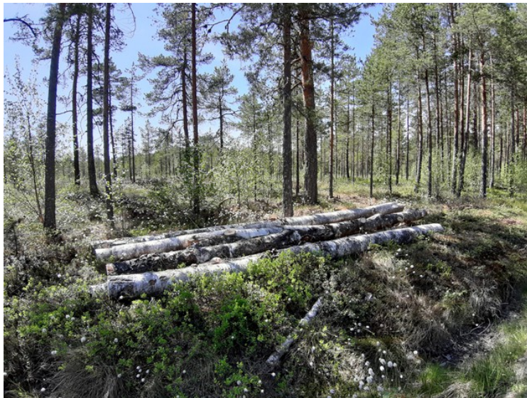
Her er vi kommet til Tysjømyra.