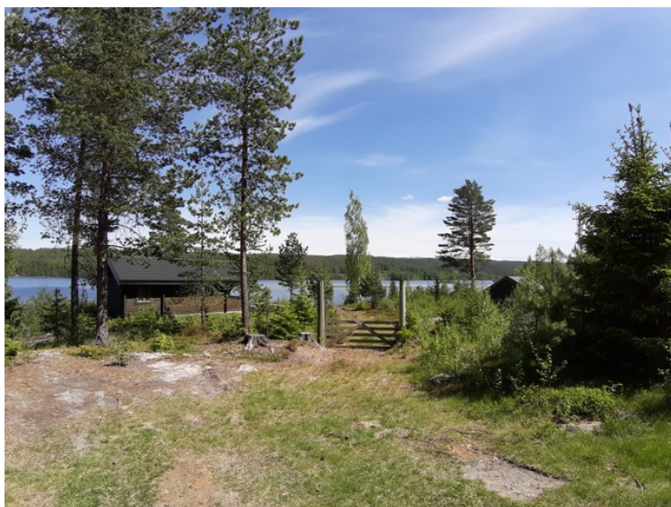
Dette er Frysjøen .

Det er mulig å fiske abbor , gjedde , mort , hork , lake og kreps om høsten. Det er også enkelte ørreter å få. Det er en del hytter rundt sjøen og fast bebyggelse i sydenden av sjøen. Det er forbud mot bruk av motorbåt. I 2010 ble det åpnet for bruk av elektrisk motor i sjøen. Vannet fra sjøen renner ned i Frysjøåa til Tysjøen der noe av vannet blir pumpet opp og brukt til drikkevann. Vannet renner videre i Tjuraåa ned til Gardsjøen og ut i Glomma.