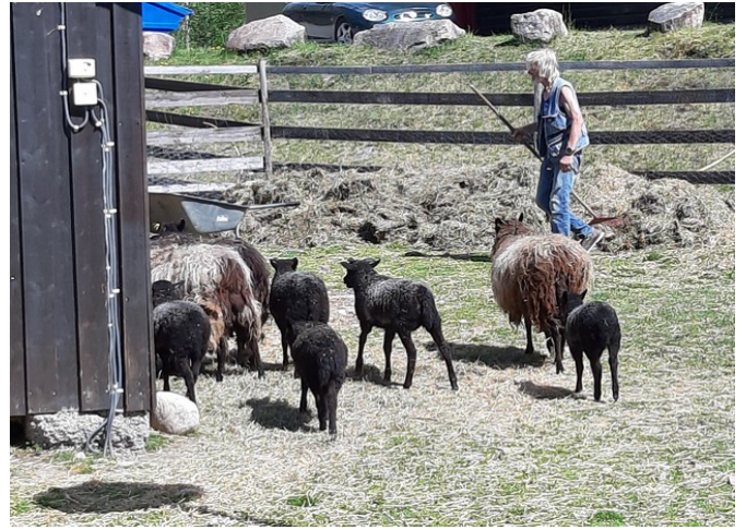
Villsauer eller gammalnorsk sau