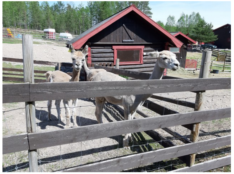
Så følger noen bilder av lamaer på Finnskogen Kro og Motell