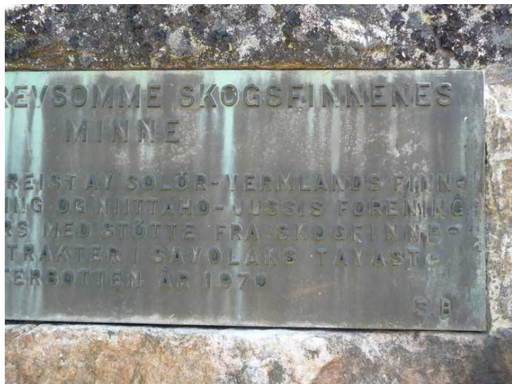
Nærbilde av overskriften på steinen.