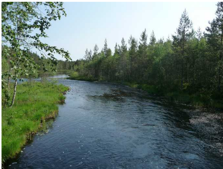
Utsikt oppover elva.