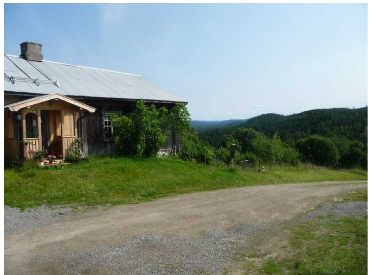
Det er god utsikt til alle kanter herfra.