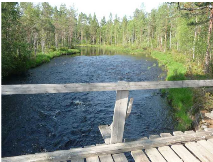
Enda et bilde oppover elva.