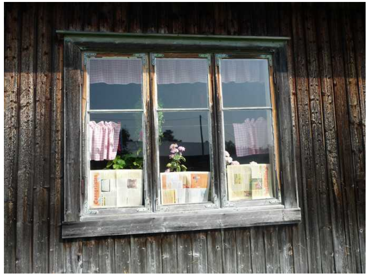
Blomsterplantene inne i vinduskarmen vernes mot sola på gamlemåten med aviser.