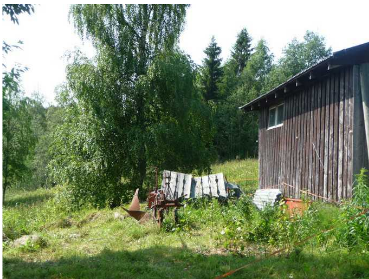
Jeg ser noe jeg drar kjensel på.