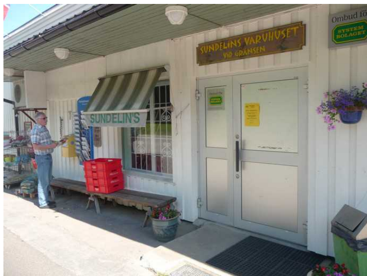
Det var søndag, så butikken var stengt.