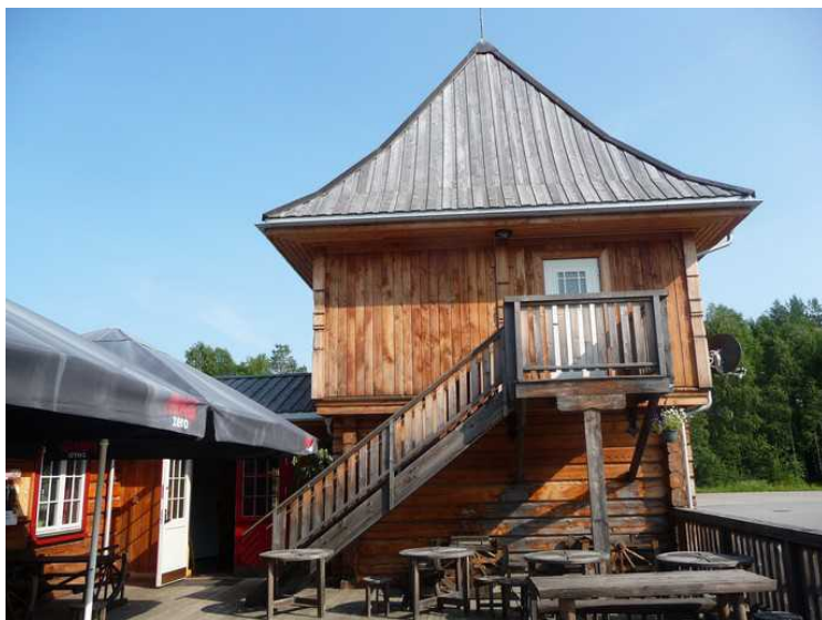
Spesiell arkitektur på hovedbygningen.