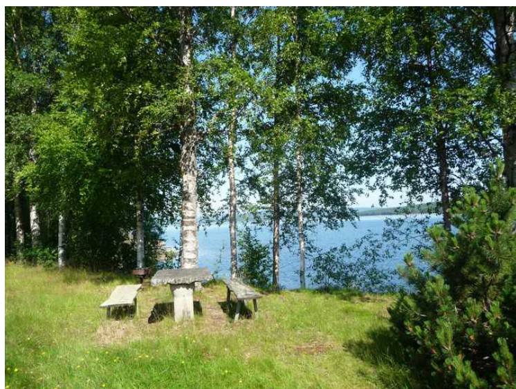
Det er satt opp benker og bord i nærheten av tavla.