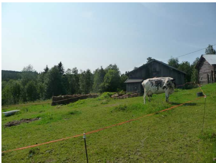
Ei ku går ute på beite.