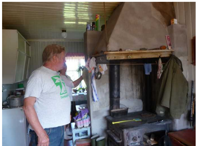
Inne på kjøkkenet. Det meste skjer på gamlemåten.