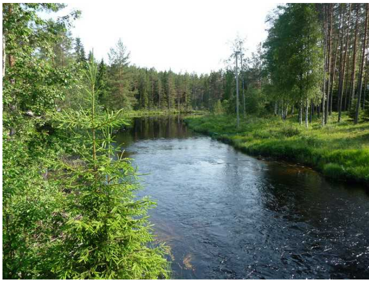
Her står vi på brua som går over Rotna i Svullrya og ser nedover elva.