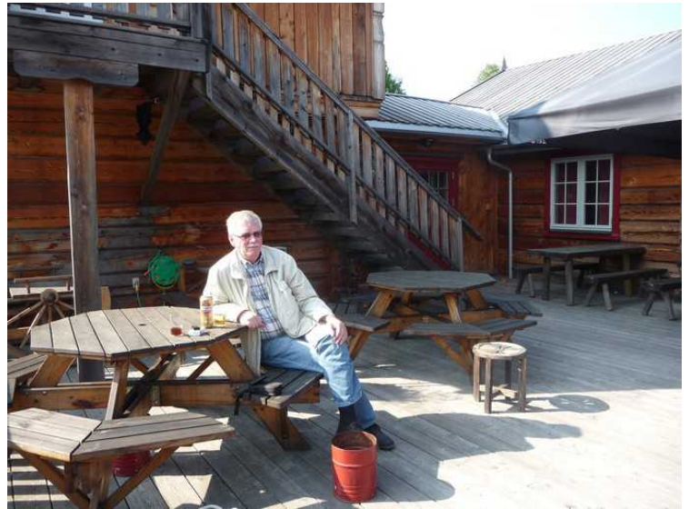
Tilbake på Finnskogen Kro og Motell smaker det godt med en øl i kveldssola.