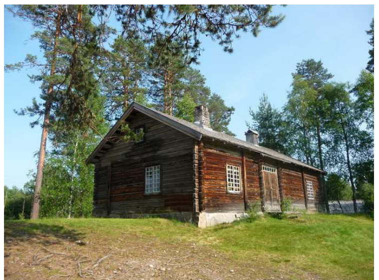
Her og på neste side ser vi noen av husene på Finnetunet.