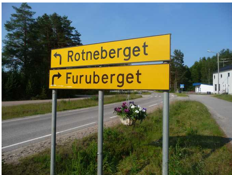
Veiskiltene er pyntet med blomsterplanter.