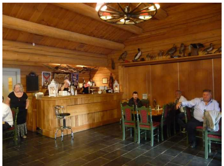
I baren er det mulig å kjøpe mat og drikke.