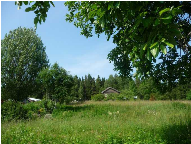
Her ser vi hovedhuset.