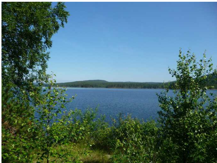
Enda et utsiktsbilde fra Røgden.