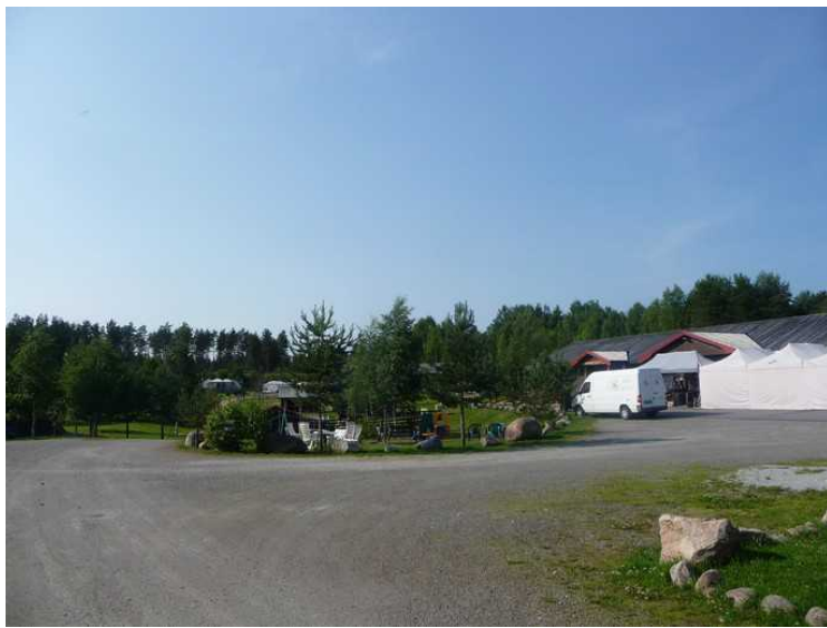
Dette er plassen på baksiden av hytta.