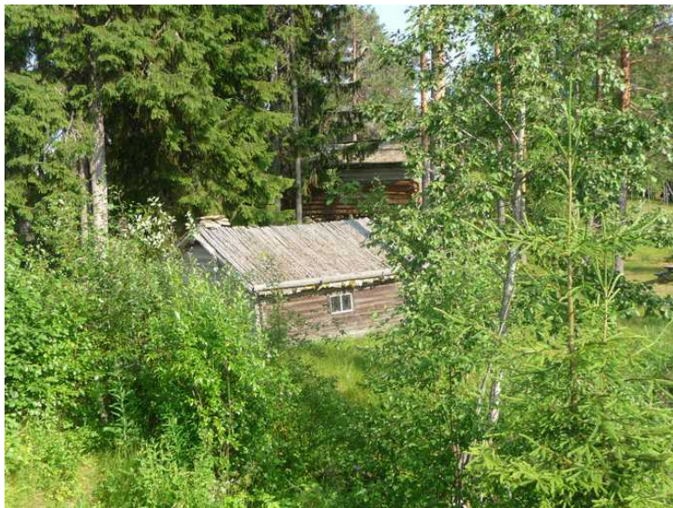
Huset sett fra en annen vinkel.