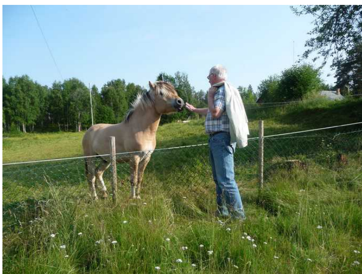
Her hilser den på.