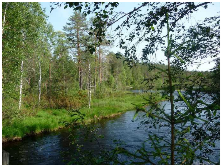
Utsikt nedover elva.