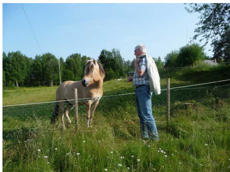
Etter det var jeg ikke interessert.