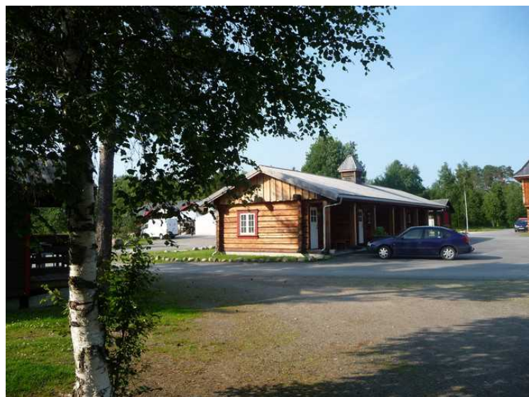
Her er hytta vi bodde i. Bilen står utenfor.