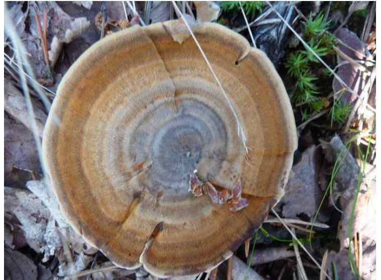
Et par sopper som vokste i skråningen.