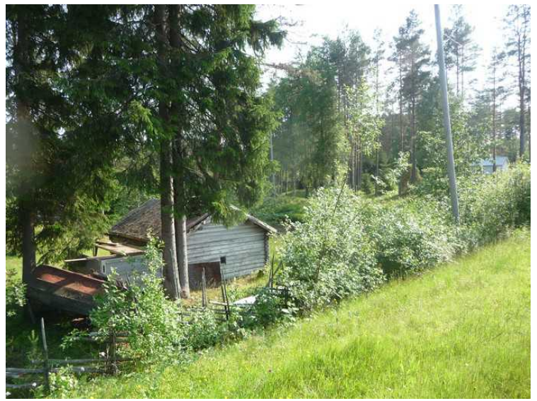
Dette er et av husene på Finnetunet som vi ser fra hovedveien.