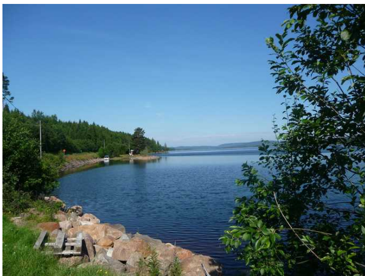
Utsikt over sjøen Rogden .