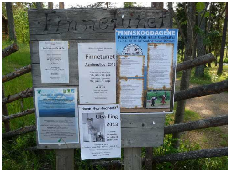
Her er vi ved inngangen til Finnetunet .