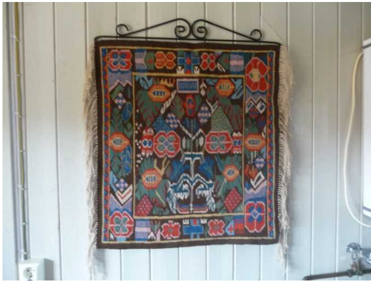
Fint åkle som er sydd av Jan Storberget.