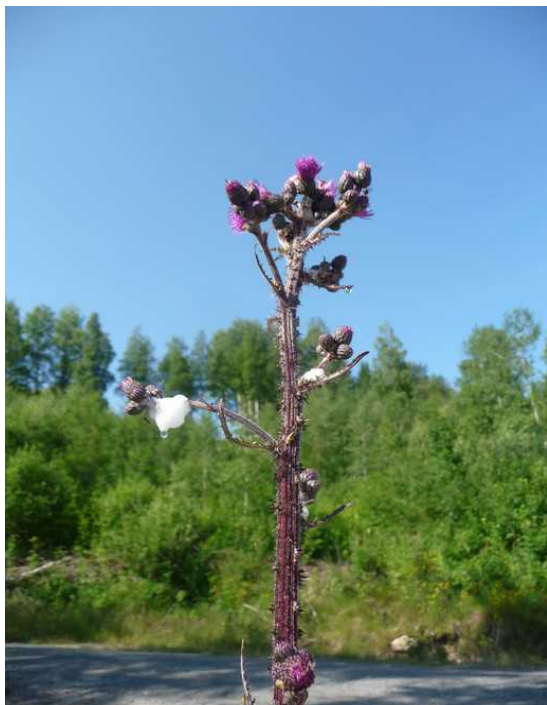
Dagen etterpå fotograferte vi en tistel.