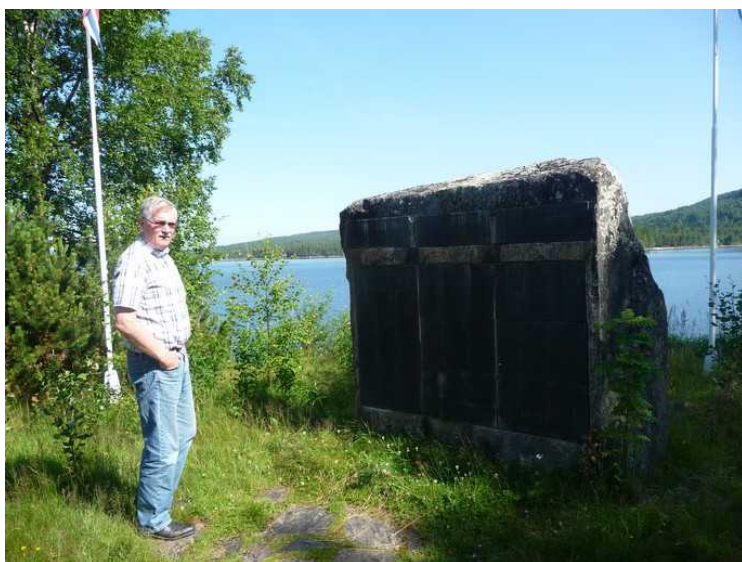
Ved siden av veien er det satt opp en tavle med de 430 finske slektene som kom hit til området.