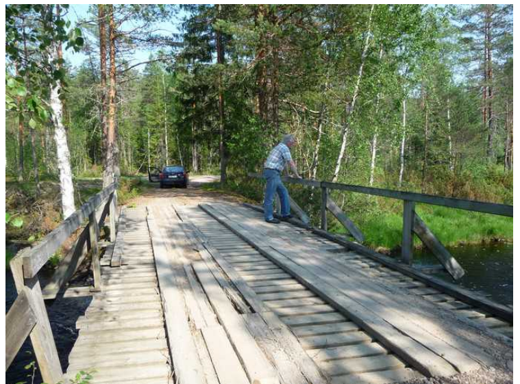
Her står jeg og ser nedover elva.