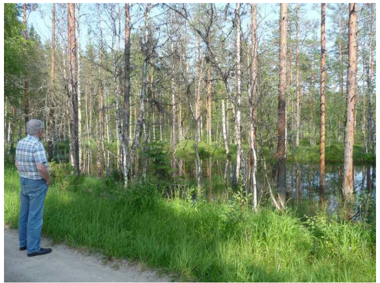
Her står jeg og ser bortover på et våtmarksområde rett før vi kommer tilbake til Svullrya.