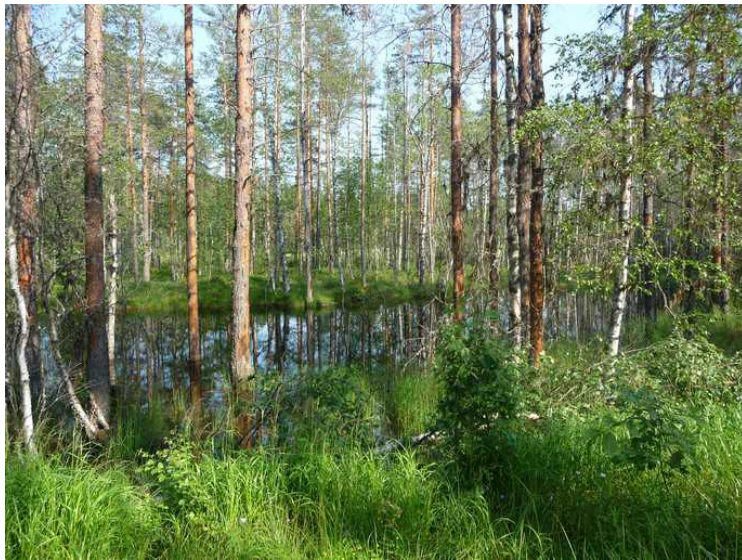
Det er Bårderudsbekken som renner gjennom dette våtmarksområdet..