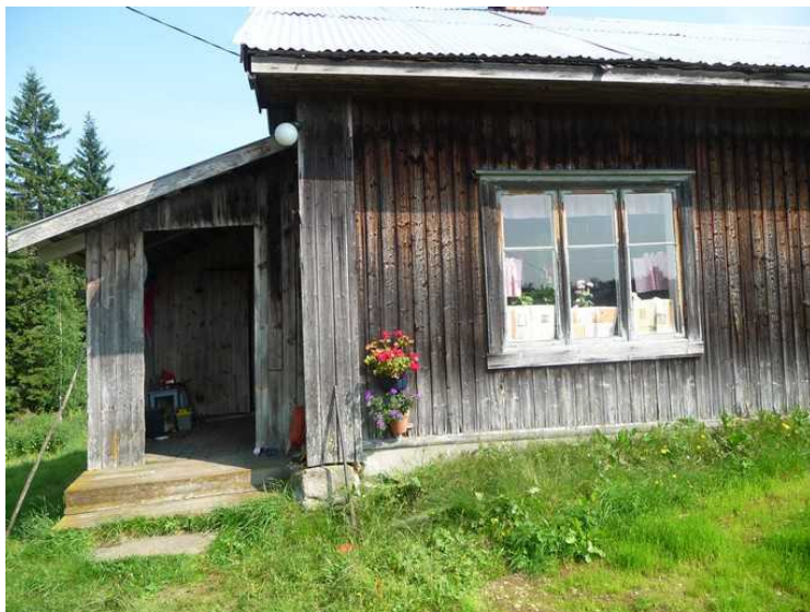
Inngangen til huset gjennom skuten.