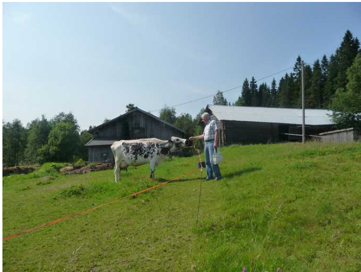
Jeg må selvfølgelig si «mø» til kua.