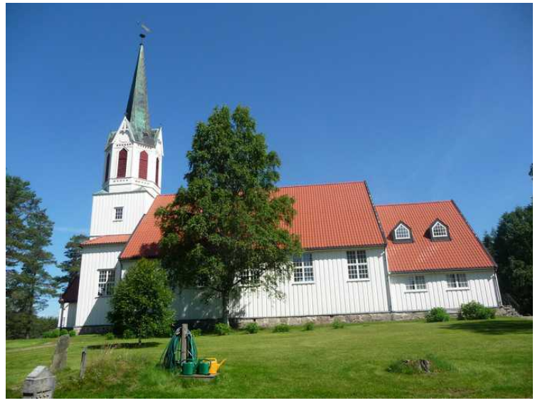
Grue Finnskog kirke på Svullrya.