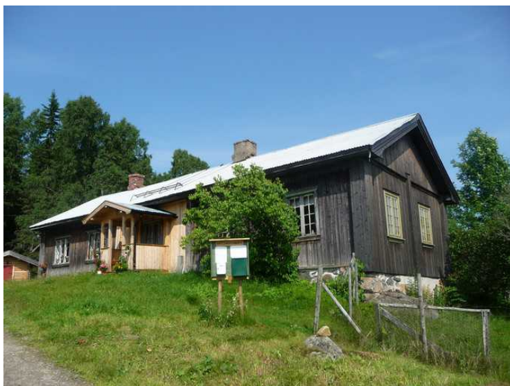
Dette er hovedhuset på Hytjanstorpet.