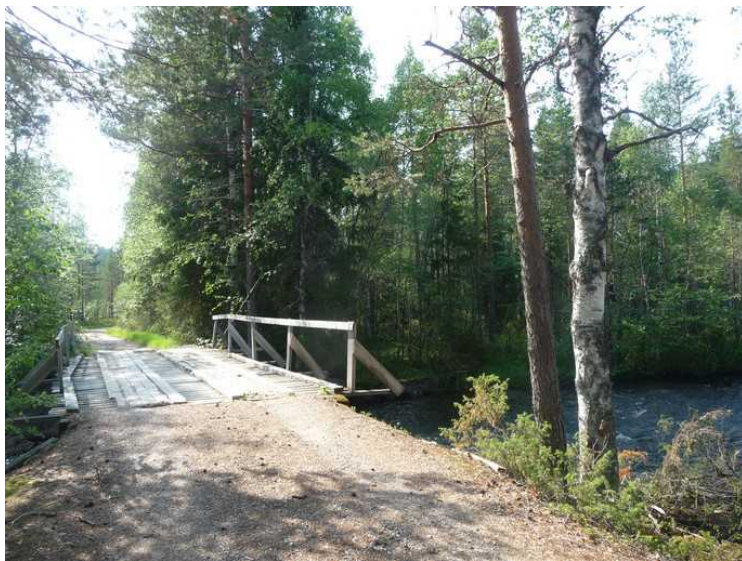
Her må vi kjøre over ei bru over Rotna.