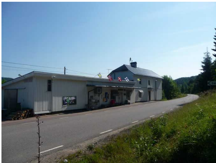
Vi kjørte rett over grensen for å se om Sundelin's eksisterte fremdeles. Det har vært vanlig at folk kjører over grensen og handler varer som er billigere i Sverige enn i Norge.