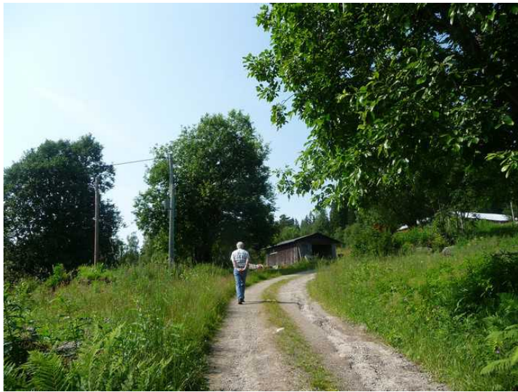
Jeg går først.