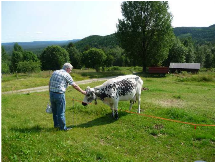
Den sier også «mø», så da er vi på bølgelengde.