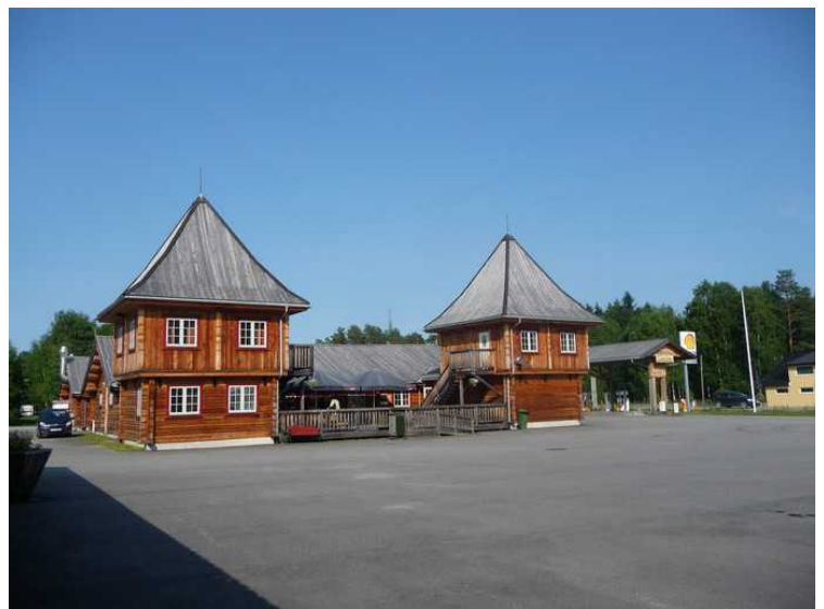
Her ser vi Finnskogen Kro og Motell fra hovedveien som går rett forbi.