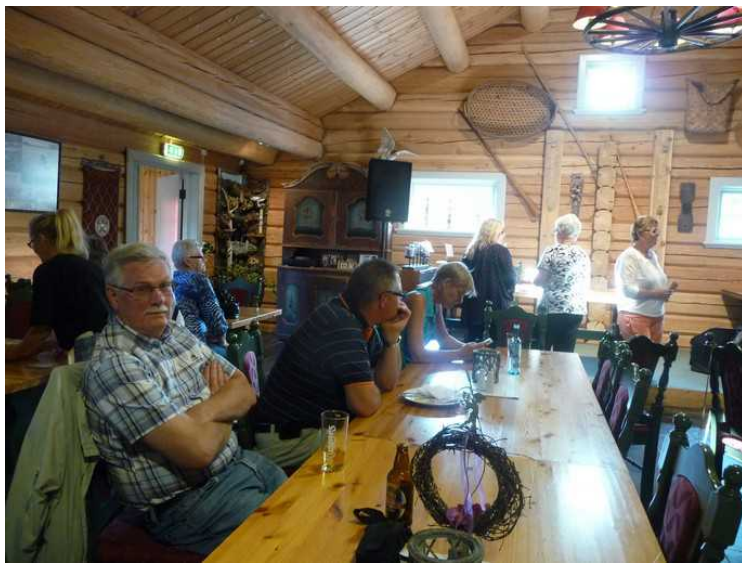
Jeg slapper av.