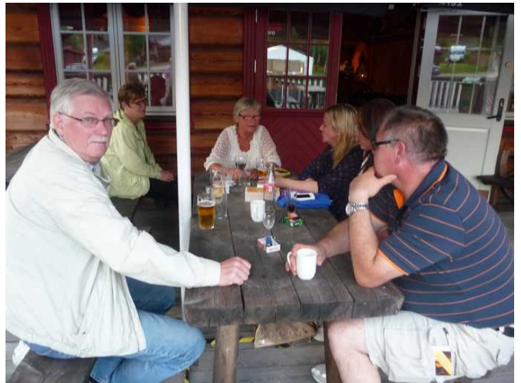
Etterpå satt vi ute en stund i det fine været.