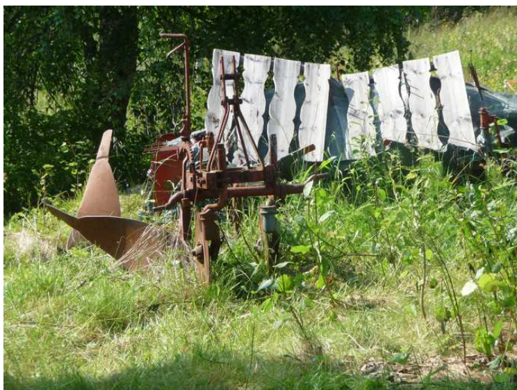
Det er en gammel Kverneldsplog.