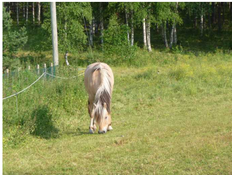
Her får jeg sjanse til å snakke med en hest som beiter rett ved Finnetunet.