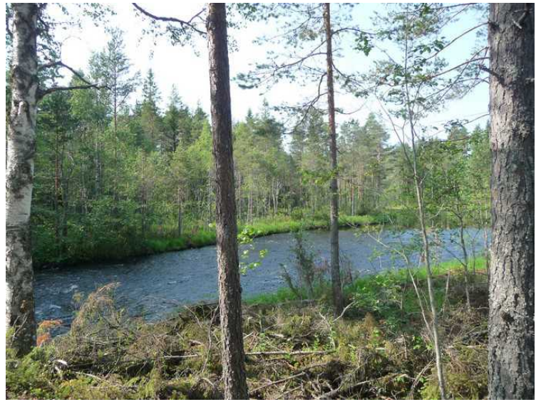
På vei tilbake til Svullrya, tok vi bilder av elva Rotna .