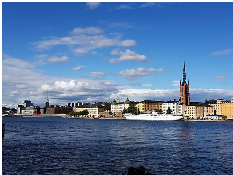
Lenger møt øst ser vi mer av gamlebyen. Vi ser også Mälardrottningen hvor vi bodde i 2008.