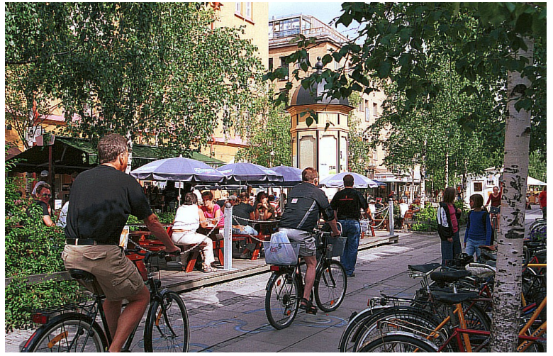
Rett bortenfor ligger Storgatan som er gågate. Her er det mange restauranter og kafeer.