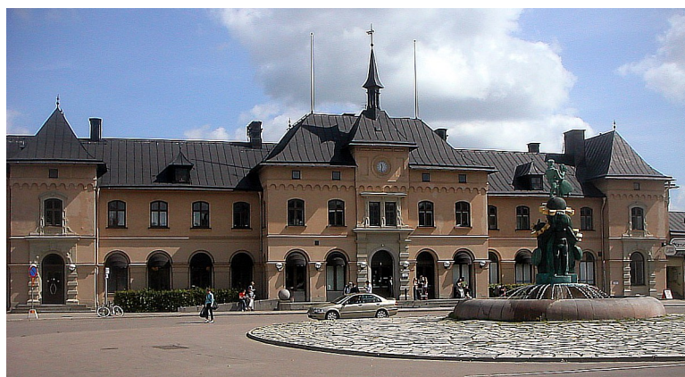
Denne dagen skulle vi til Sundsvall. Første stopp var på Uppsala sentralstasjon . Uppsala er en universitetsby og den er den 4. største byen i Sverige.