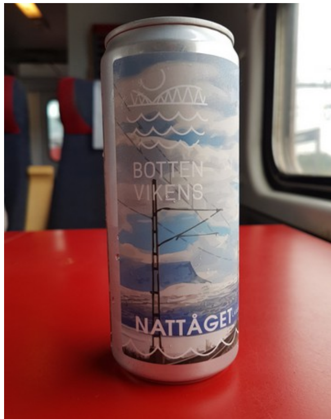
Underveis ble det en øl.