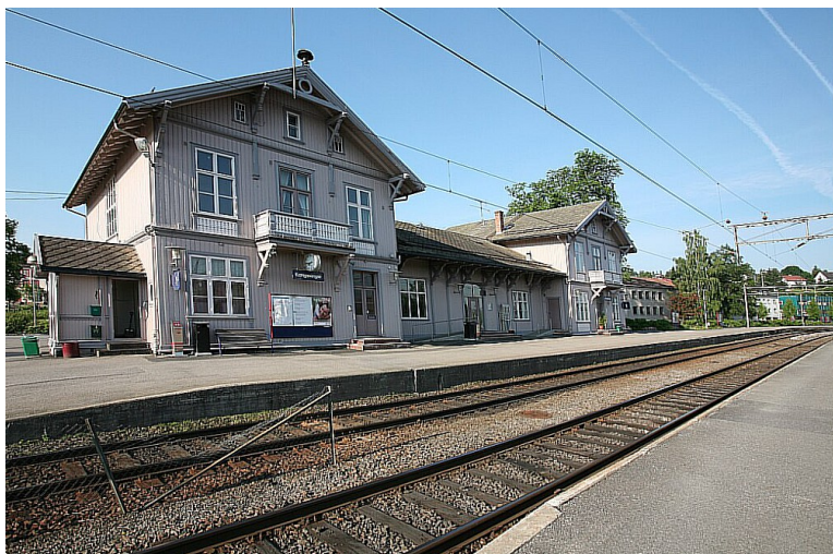
Vi tok taxi ned til Kongsvinger stasjon den 11. august. Toget gikk derfra klokka 08.58.

Vi har lenge snakket om at vi skulle reise med tog til Stockholm. Nå fant vi ut at vi skulle ta den turen. Men da vi først var i gang, ville vi fortsette nordover. Vi stoppet ikke før vi kom til Narvik.