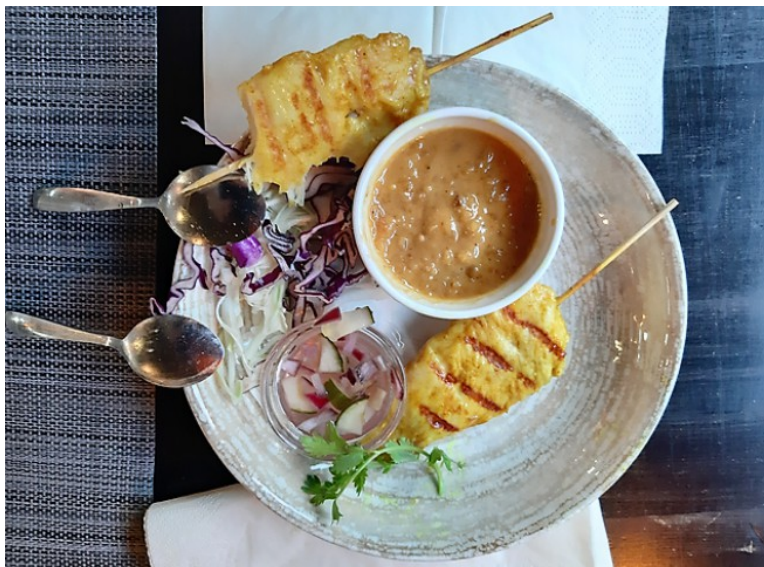
Jeg hadde Satay Gai. (Karry marinert kyllingspyd med peanøttsaus og syltet agurk).