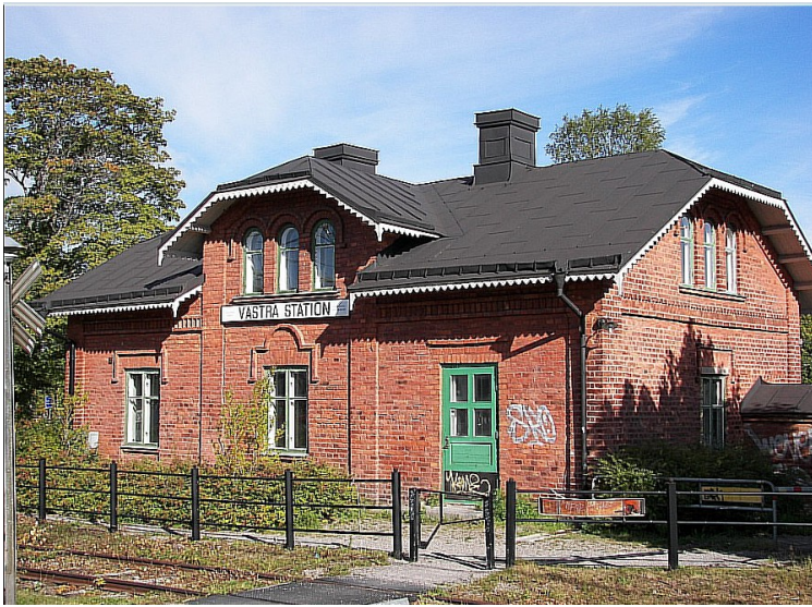
Sundsvalls västra station