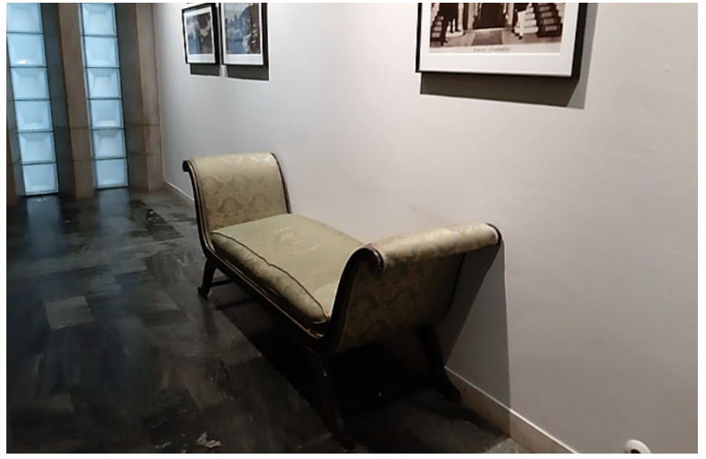
I en av gangene sto det en ottoman.

Vi hadde tenkt å reise videre neste dag, men toget videre til Narvik var fullbooket, så vi måtte ha to overnattinger her. Da fikk vi tid til å gå litt i byparken som ligger rett ved siden av hotellet.