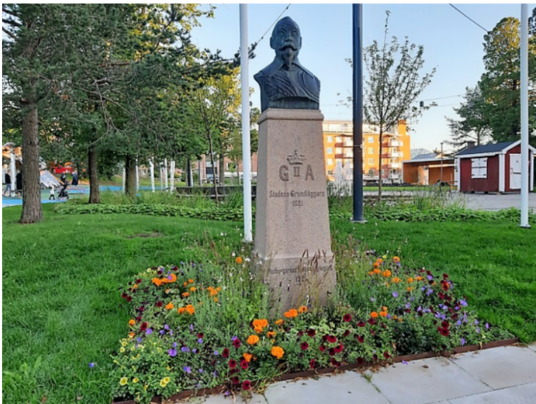
En statue av kong Oscar II Adolf som grunnla byen i 1621.