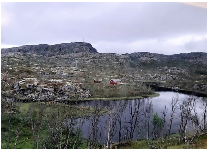
En hytte ved et vann.