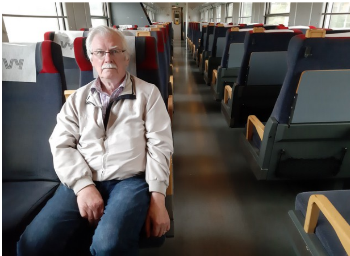
Dagen deretter, onsdag den 16., tok vi taxi tilbake til Luleå Centralstation igjen for å ta siste tog-etappe til Narvik. Toget gikk klokka 09.59.