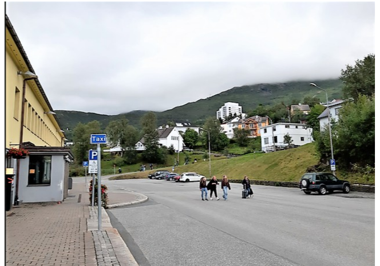
Her snakket vi med en taxisjåfør som bestilte en taxi til oss, slik at vi kunne komme oss til hotellet.