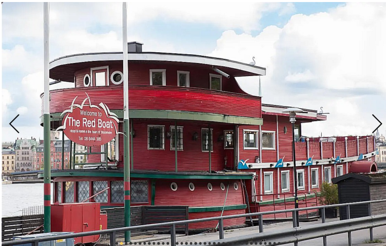
Vi skulle bo på « Den Röda Båten » Det er en båt som er innredet til hotell og restaurant.