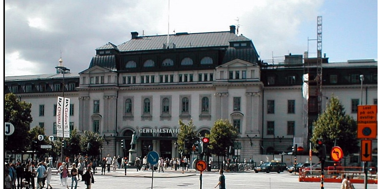
Siste jernbanestopp denne dagen var i Stockholm . Dette er Stockholm sentralstasjon som er Sveriges største jernbanestasjon. Herfra tok vi taxi bort til hotellet.