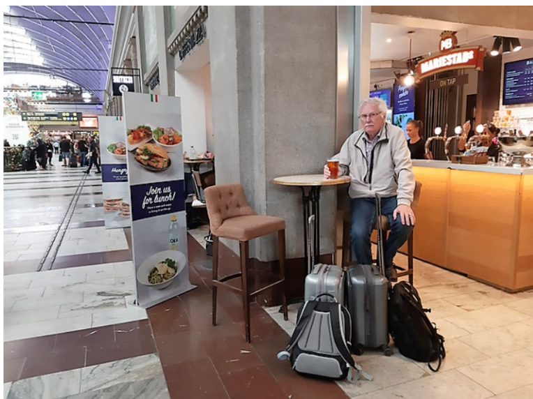
Neste dag skulle vi reise videre med tog. Her sitter vi og venter på toget som skal gå klokka 12.21. Jeg kjøpte en «reisepils».