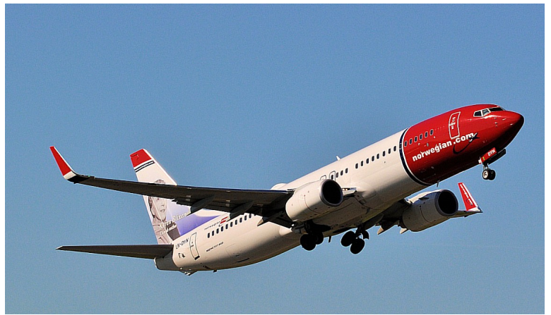
Vi skulle fly med Norwegian til Oslo. Flyet skulle gå klokka 11.05 og det gikk helt presis. Flyet var ikke mer enn halvfullt.