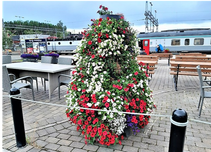
Her var det mange blomster.