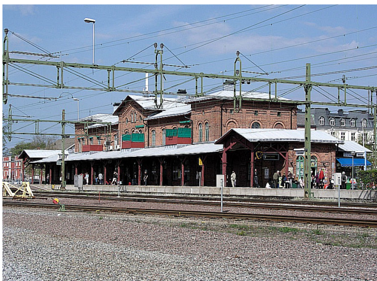
Første stopp var i Arvika . Dette er Arvika stasjon .