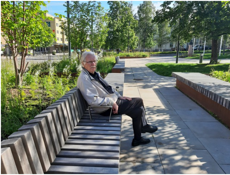
Det var laget mange trebenker til å sitte på.