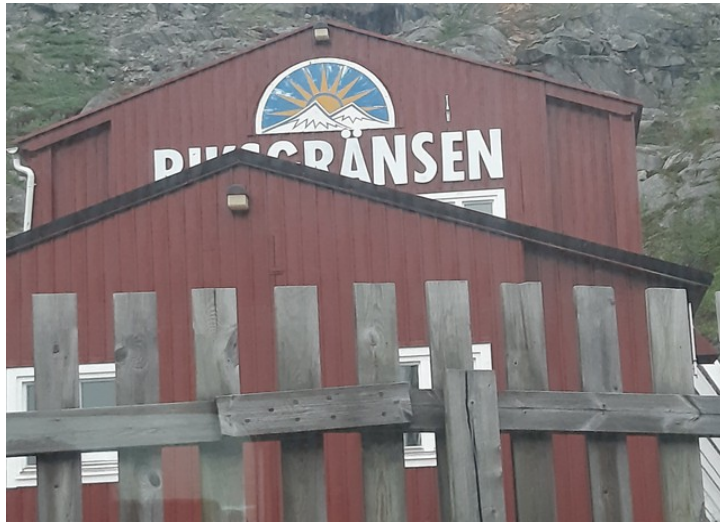
Det var besøk av tollere med hunder her før toget kunne gå videre.