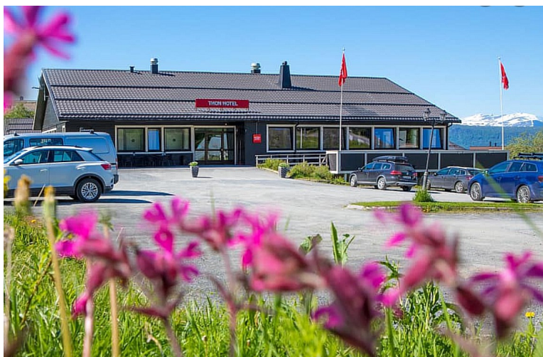
Vi skulle bo på Thon PartnerHotell Narvik.