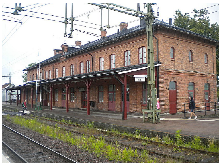
Neste stopp var i Kil . Kil stasjon er et jernbaneknutepunkt.

Vi stoppet også i Stelldalen . Her skiftet vi spor og vi fikk motsatt kjøreretning. Det samme skjedde i Valskog .