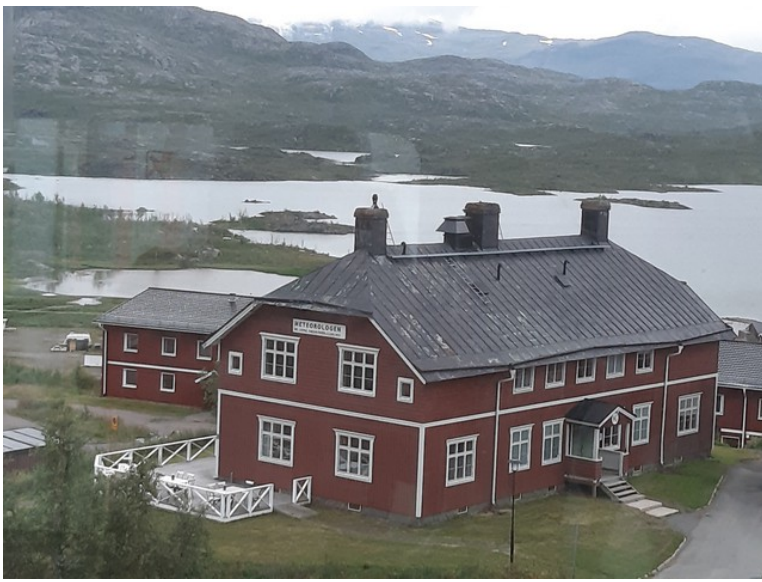
Dette er Meteorologen Ski Lodge .