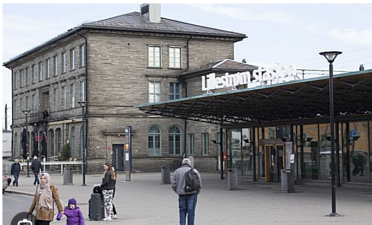
Vi var på Lillestrøm stasjon klokka 13.55, en tur på 12 minutter. Vi måtte vente til 14.15 på nytt tog mot Kongsvinger.