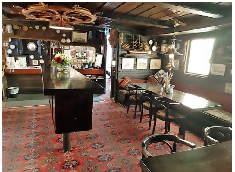
Resepsjonen og restauranten.