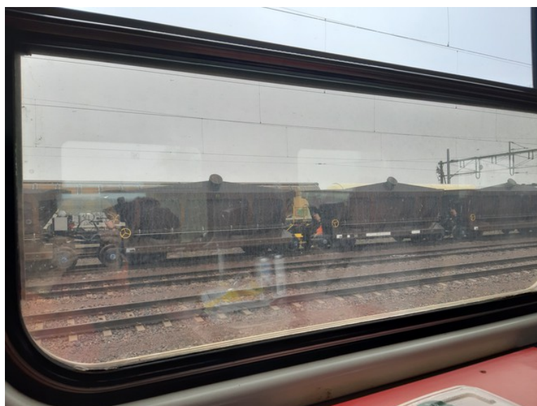
Underveis så vi gjennom slike vinduer.

Vi kjøpte også noe varm mat i kiosken for vi kom så sent til hotellet at vi syntes det ville bli for sent å spise når vi kom fram dit.