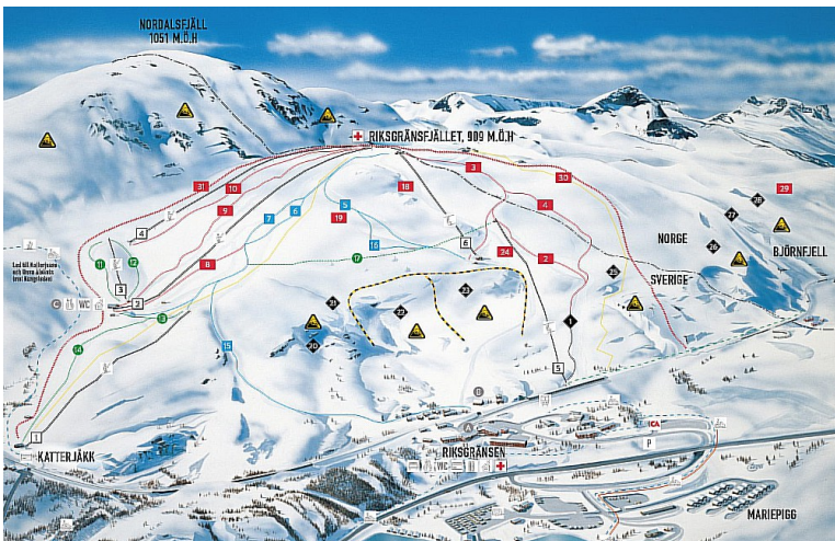
Et løypekart som viser alle skiløypene i området.