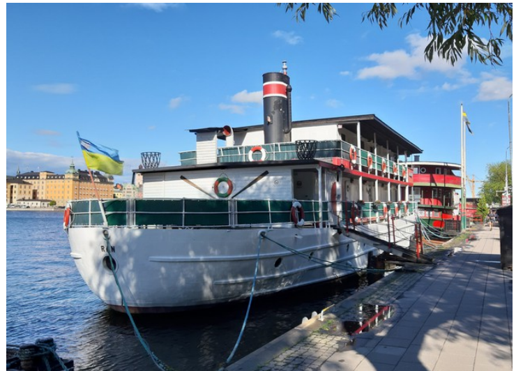
De hadde også denne båten, Ran, hvor vi fikk rom.