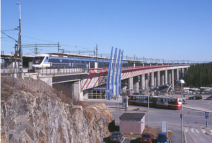
Siste stopp før Stockholm var i Södertälje . Dette er Södertälje syd stasjon