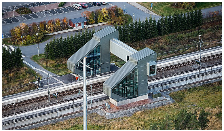
Sunderby sykehus stasjon