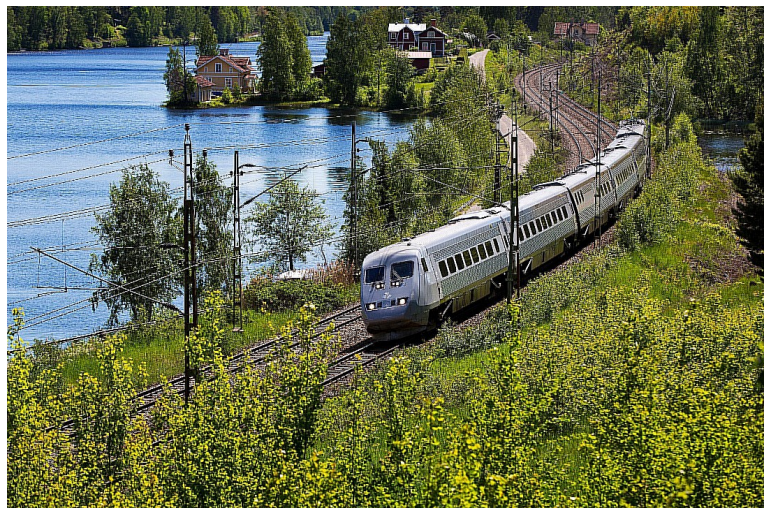
Første etappe gikk til Stockholm. Det er SJ AB som opererer denne strekningen.