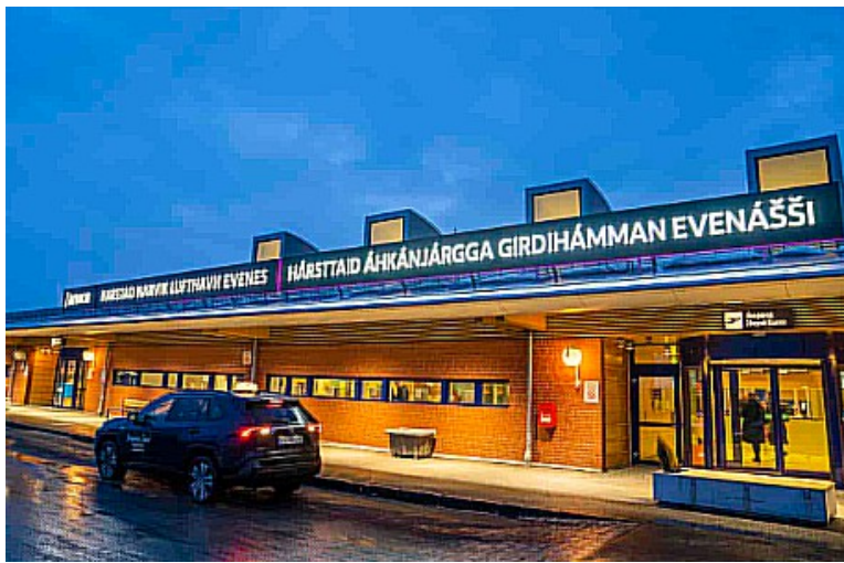
Neste dag tok vi taxi bort til Harstad/Narvik Lufthavn. Evenes . Turen tok 50 minutter.