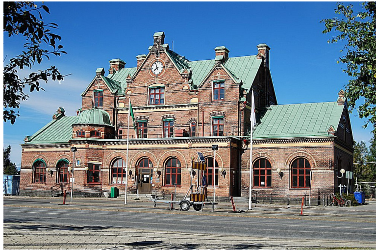
Umeå sentralstasjon Vi kom dit klokka 15.23.