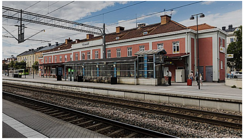
Eskilstuna centralstasjon. Den ble innviet i 1877 av Oscar II.