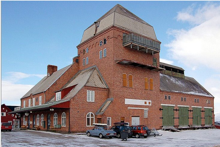
Abisko östra stasjon