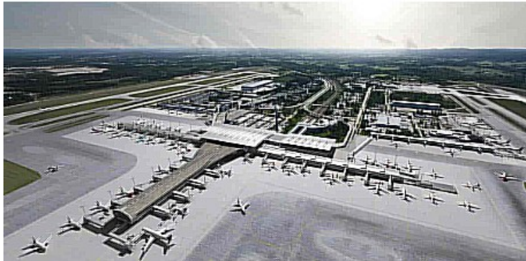
Vi ankom Oslo Lufthavn Gardermoen klokka 12.50, så turen tok ca. 1 time og 45 minutter.