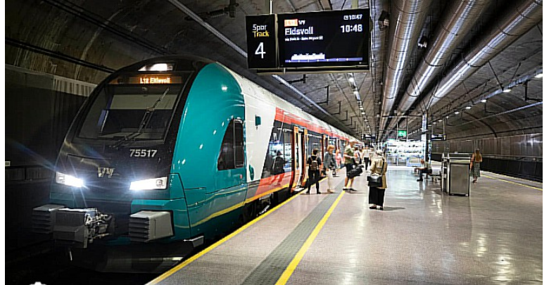
Etter at vi hadde fått bagasjen tok vi tog fra Gardermoen stasjon til Lillestrøm stasjon. Det gikk klokka 13.43, så det ble ikke så lang tid å vente.