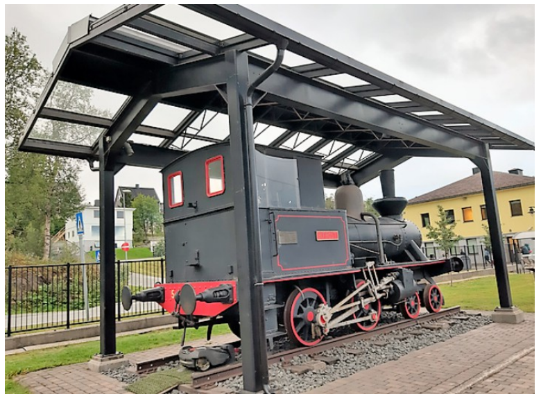
Et gammelt lokomotiv på stasjonen.