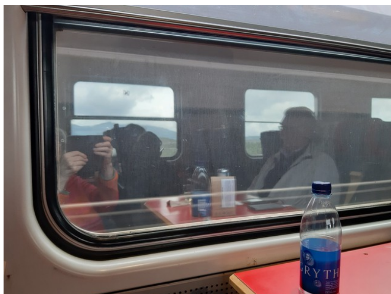
Refleksjoner i vinduet.

Vi kjøpte også noe varm mat i kiosken for vi kom så sent til hotellet at vi syntes det ville bli for sent å spise når vi kom fram dit.