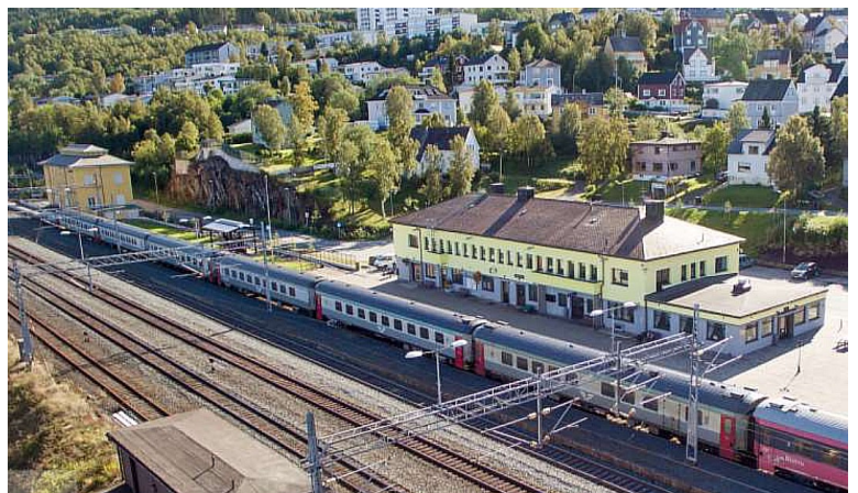
Så var vi på Narvik stasjon som var den siste stasjonen denne dagen.