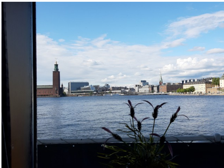
Dette er utsikten fra lugaren vår. Vi ser rådhuset til venstre og gamlebyen til høyre.