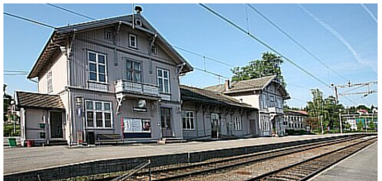
Kongsvinger stasjon som var den siste togstasjonen på denne togturen. Vi var framme klokka 15.22.

Siste etappe var med taxi fra stasjonen og hjem.