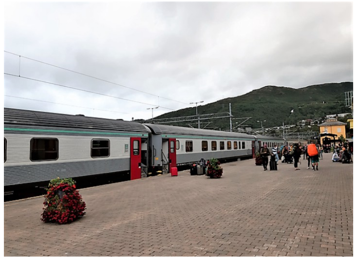
Vi kom med dette toget.