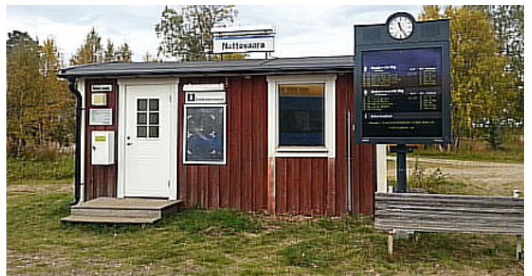
Så kommer Nattavaara .