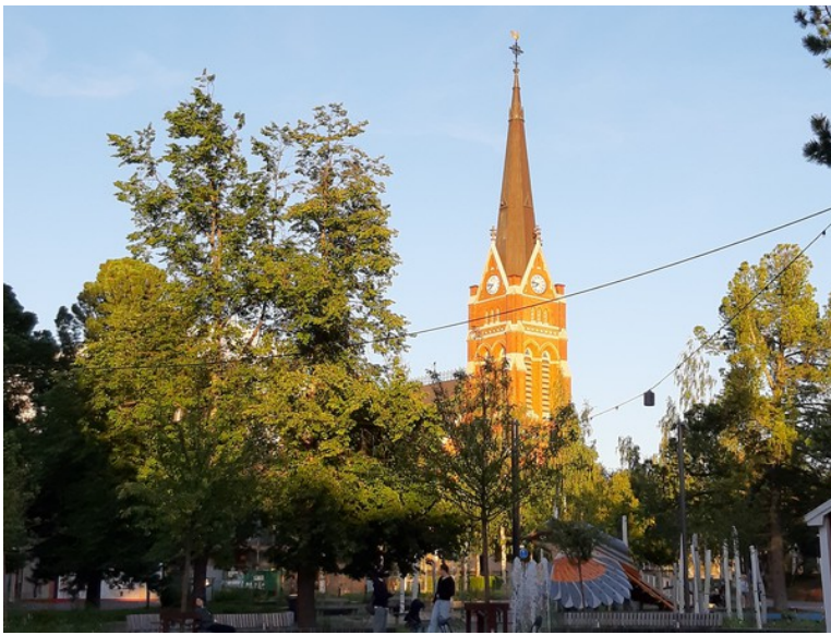
Fra parken ser vi Luleå domkirke .

Vi hadde tenkt å reise videre neste dag, men toget videre til Narvik var fullbooket, så vi måtte ha to overnattinger her. Da fikk vi tid til å gå litt i byparken som ligger rett ved siden av hotellet.