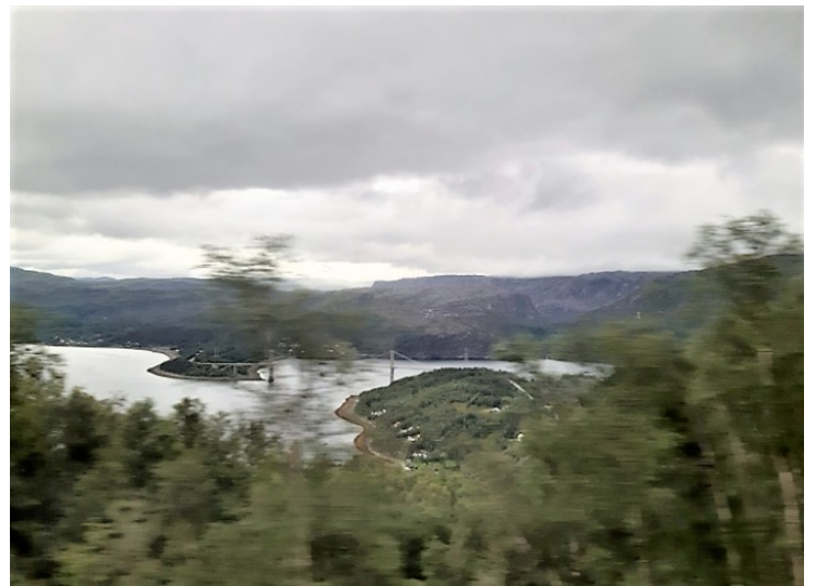
Her ser vi overgangen mellom Rombaken og Rombaksbotn. Vi kan skimte Rombaksbrua i midten av bildet.