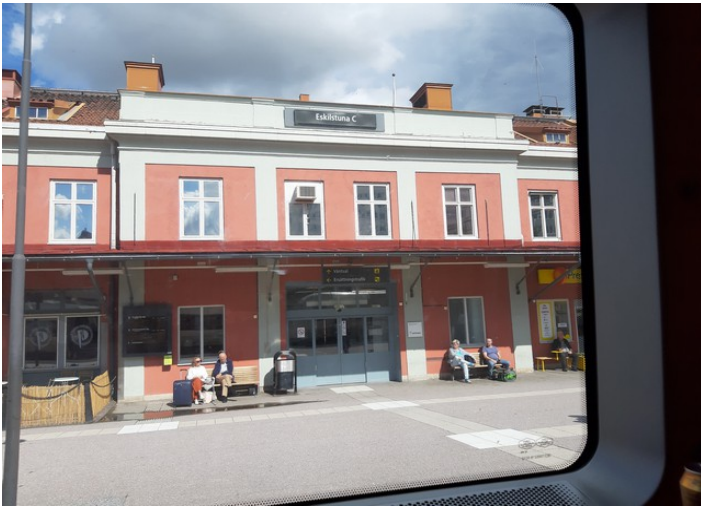
Neste stopp var i Eskilstuna .