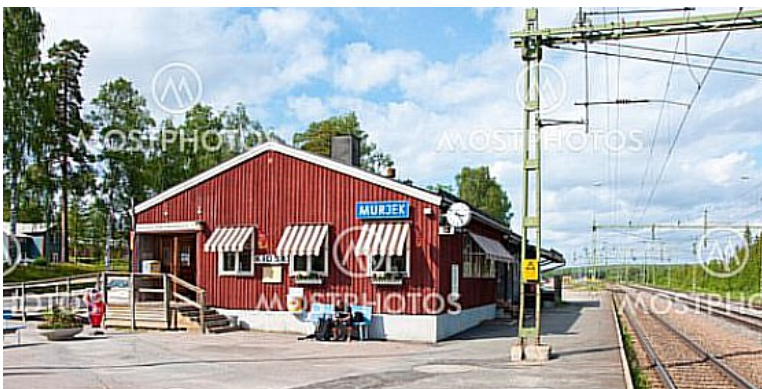
Neste stasjon er Murjek.