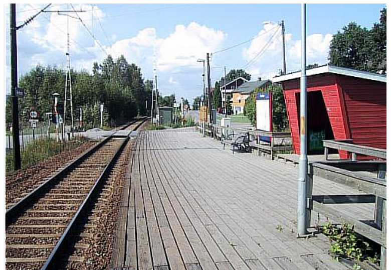
Første stopp var Nerdrum .