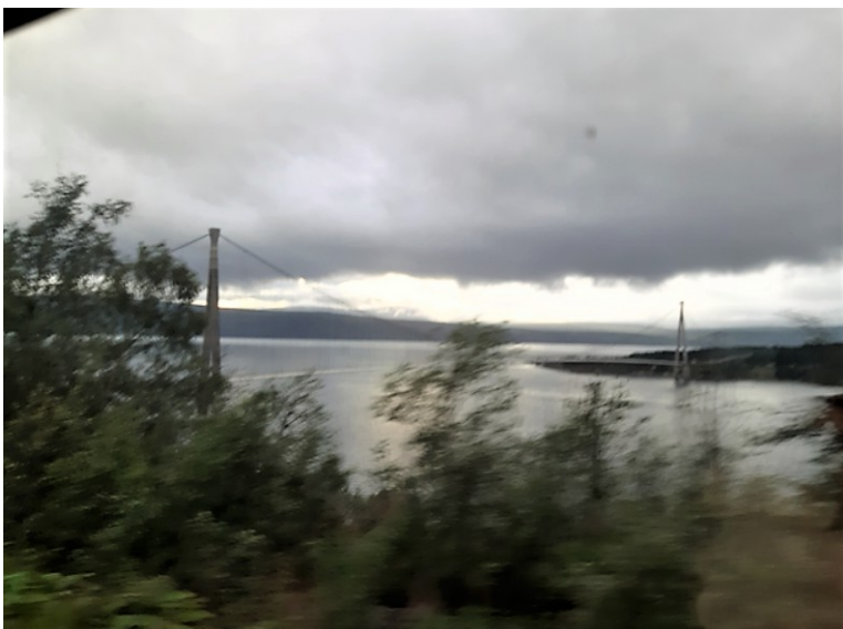
Vi kan skimte Hålogalandsbrua som går over Rombaken. Det er Norges nest lengste hengebru (1533 m).