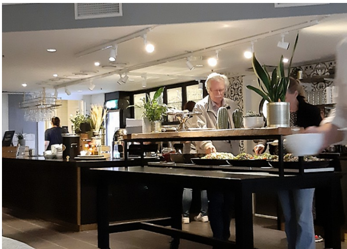
Jeg forsyner meg av maten.