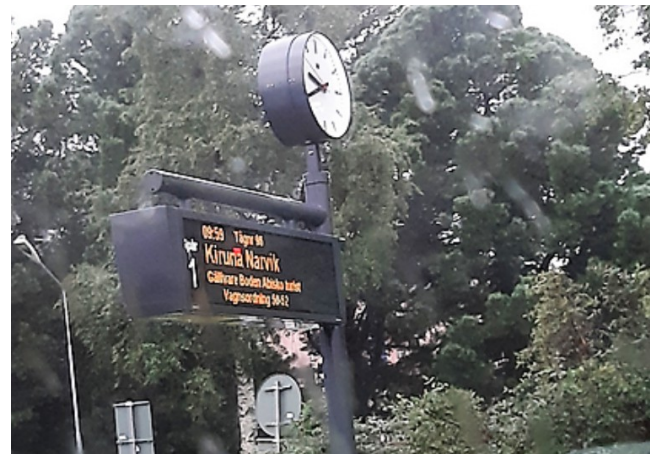
Her ser vi at vi er på rett tog. Det går tilbake til Bodén før det fortsetter videre til Kiruna og Narvik. I Bodén måtte vi vente i nesten 3 timer på et tog som var forsinket fra Stockholm. Det hadde 200 passasjerer som skulle med vårt tog.