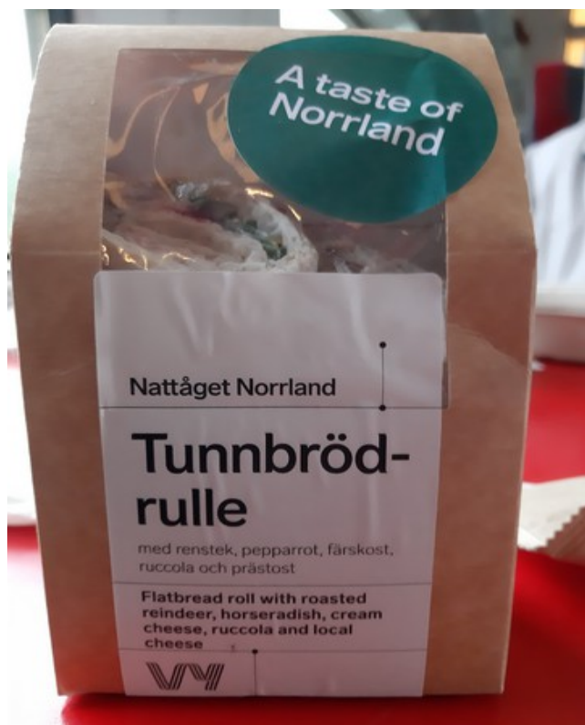
Denne var god.