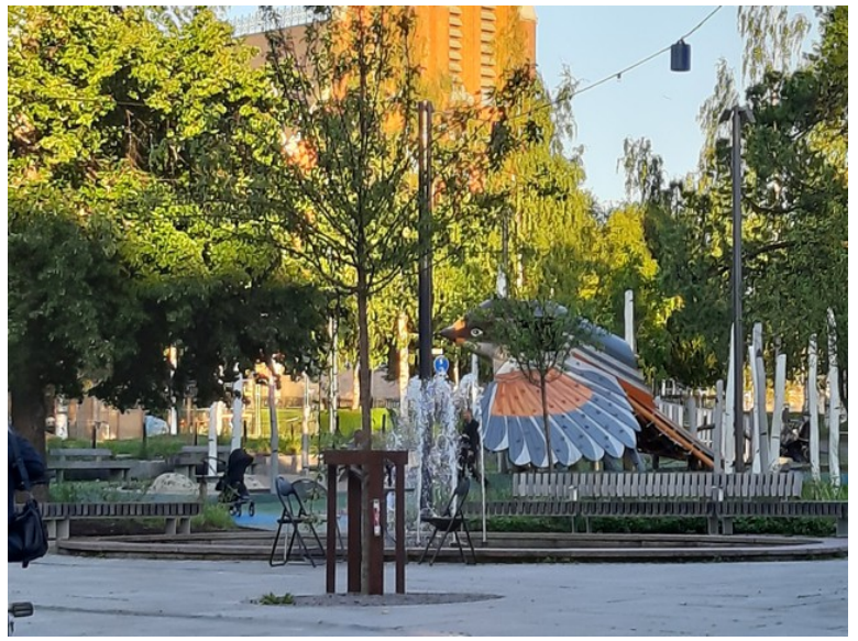
Her er det også en lekeparks.