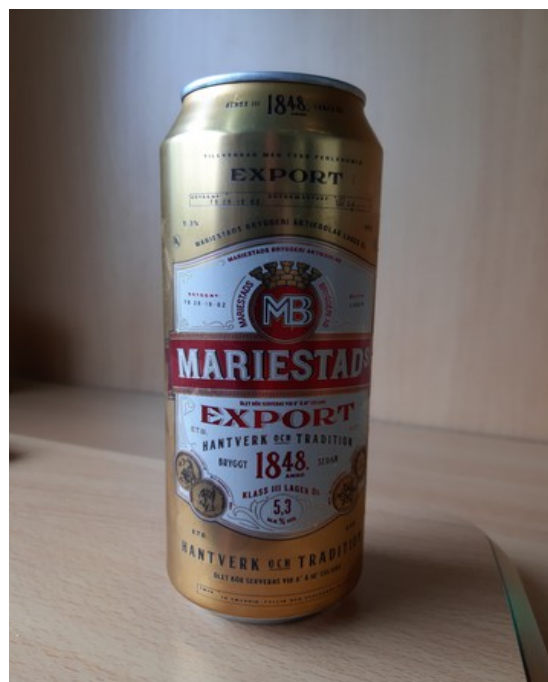
Dette er den første «reisepilsen». Jeg har aldri smakt Mariestad øl før.