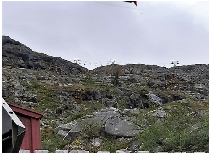
Her er det også en taubane.