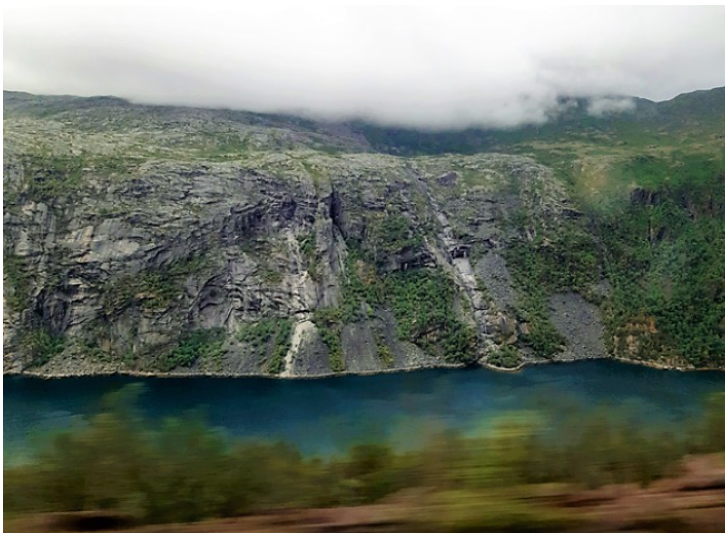
Her ser vi ned til Rombaksbotn som er den indre delen av fjorden Rombaken , som igjen er en sidegrein av Ofotfjorden .