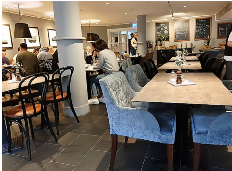
Det var ganske mye folk i restauranten.

Kveldsmaten var inkludert i hotellprisen. Vi kunne forsyne oss med forskjellige retter og maten var bra.