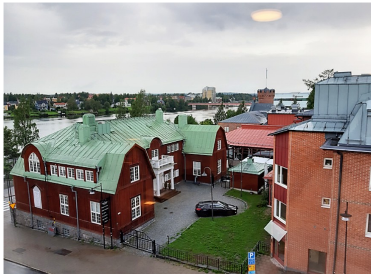
Utsikten fra leiligheten. Vi ser Umeälven i bakgrunnen.

Her skulle vi bo på Clarion Collection Hotel Uman . Jeg ga ikke klar beskjed til taxisjåføren, for jeg trodde det bare var ett Hotel Uman, så vi ble satt av på Hotel Uman. Der fant de ingen reservasjon, så vi måtte ta en taxi videre til riktig hotell.