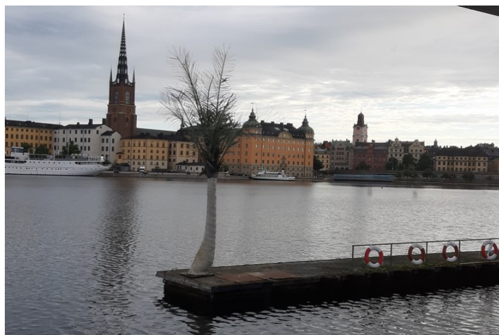
Mer utsikt fra lugaren.