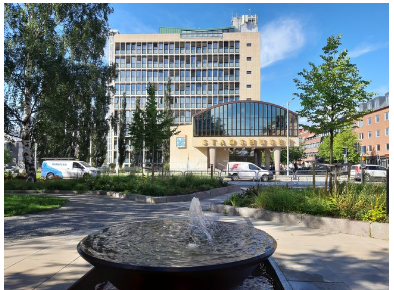
Her ligger også byens rådhus.

Byen lå da på det stedet som i dag heter Gammelstads kirkeby . Stedet hadde vært markeds plass siden 1300-tallet.