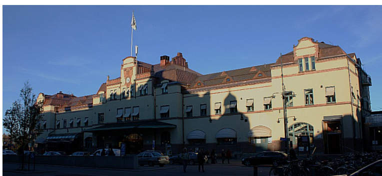
Neste stopp var i Gävle . Dette er sentralstasjonen.