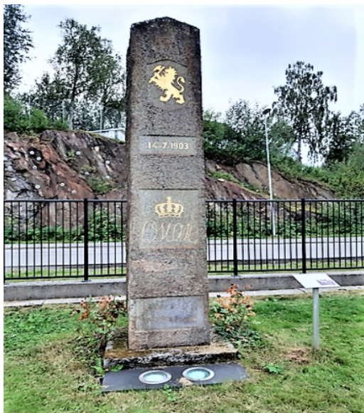
Dette er minnebautaen, kong Oscar-støtten , som ble innviet da Ofofbanen åpnet 14. juli 1903.