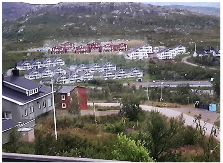
Noe av hyttebebyggelsen ved Riksgrensen.