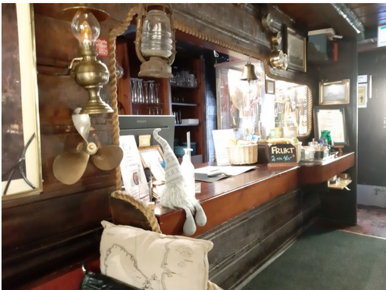
Resepsjonen i Den Röda Båten..