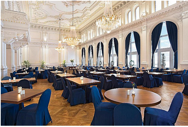
Hotellet ble bygget i 1903. Spisesalen er ganske flott i fransk renessansesstil.