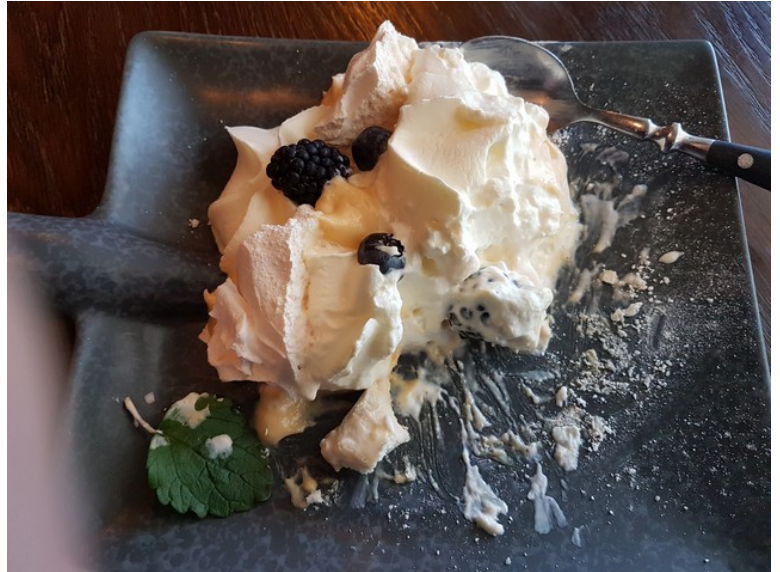
Til dessert hadde vi igjen Pavlova.