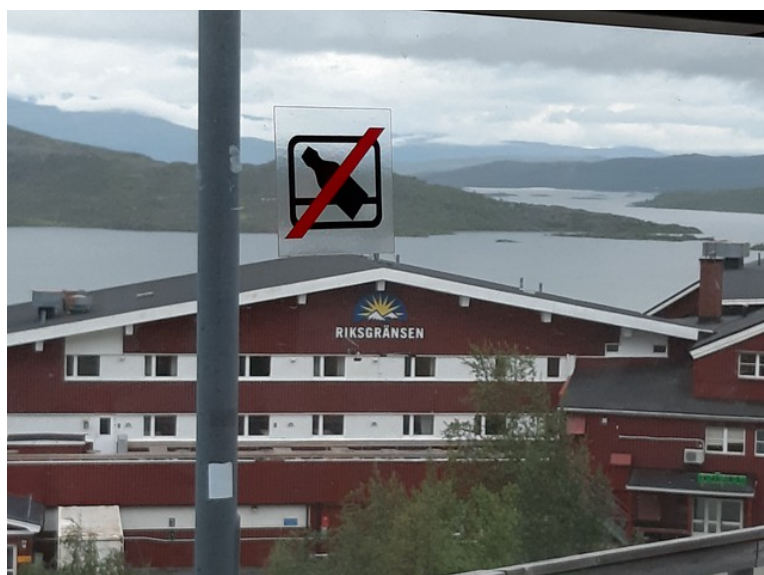
Her ser vi ned til Hotell Riksgården