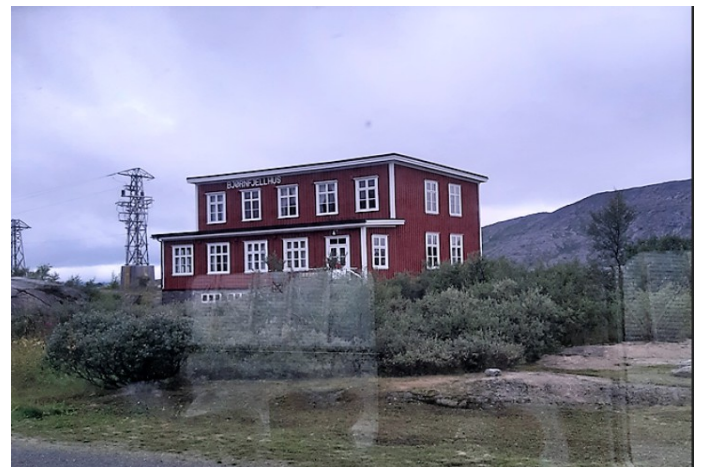
Så er vi over på norsk side av grensen. Bjørnfjell stasjon