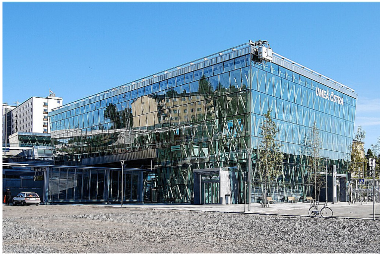
Umeå östra stasjon