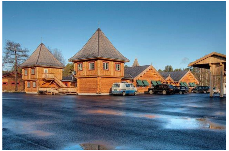
Dette er Finnskogen Kro og Motell i Svullrya.