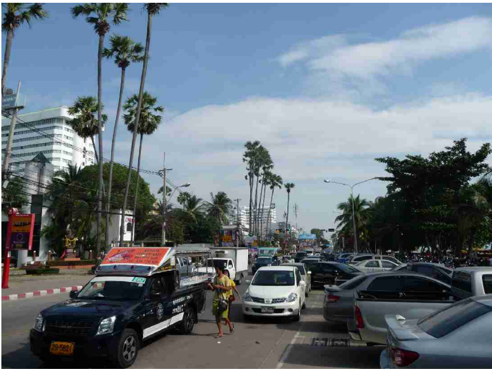
Bebyggelsen fortsetter i flere kilometer bortover.