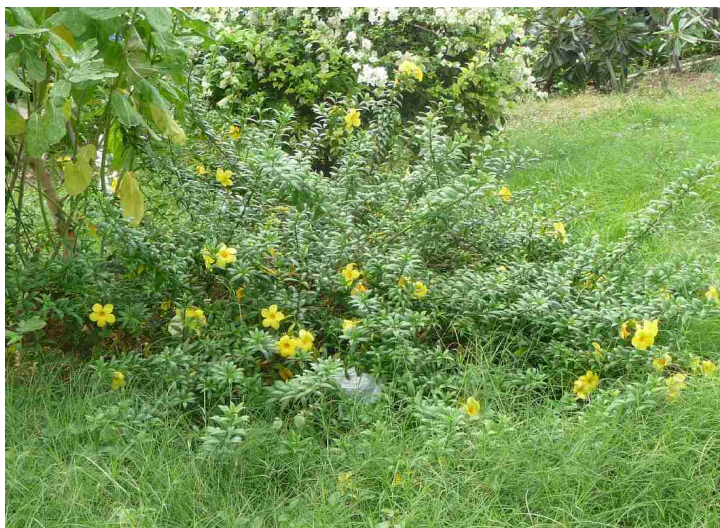
Nedenfor følger noen bilder av blomster langsetter strandpromenaden.