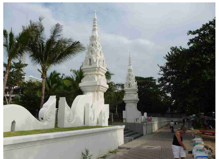
Denne inngangen syntes vi var spesielt fin.