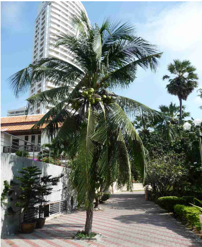
En liten kokospalme.