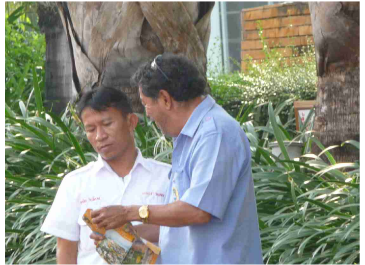
Etterpå tok vi taxi tilbake, men taxisjåføren kjørte feil. Han var langt inne i Pattaya. Her spør han etter veien.