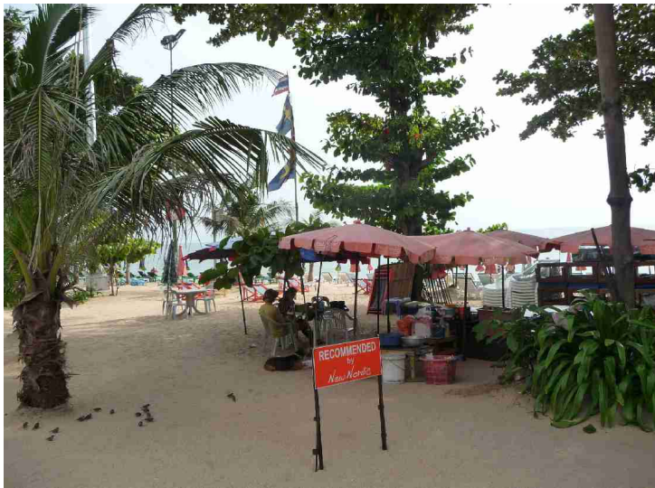
Det er diverse salgskoder bortover langs strandpromenaden.