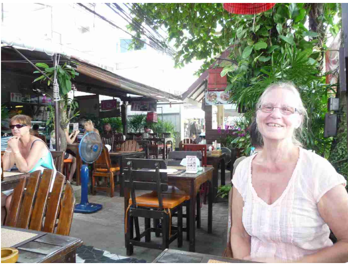
Her tar vi en forfriskning.