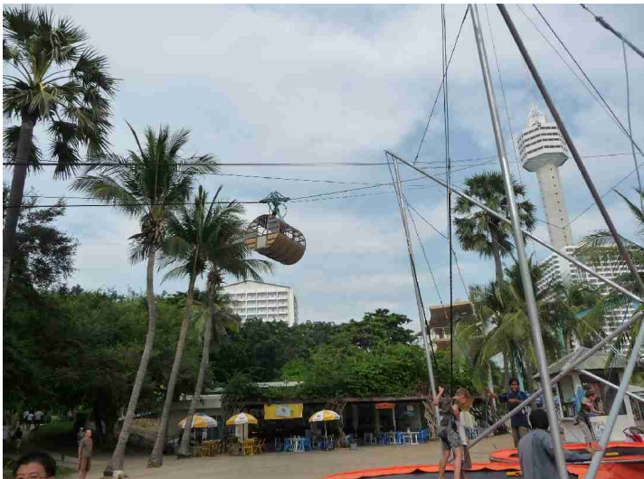
Innover her er det en stor fornøylespark.