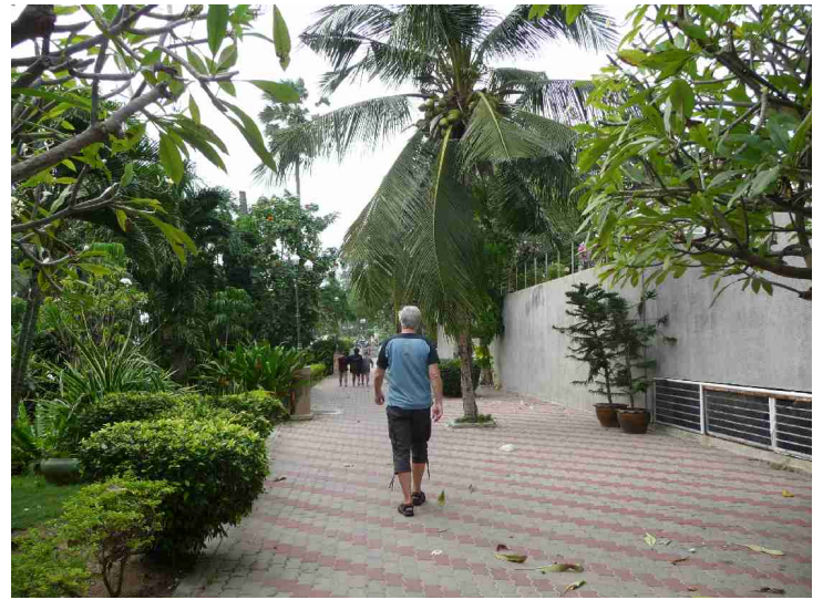
Kjell på strandpromenaden.