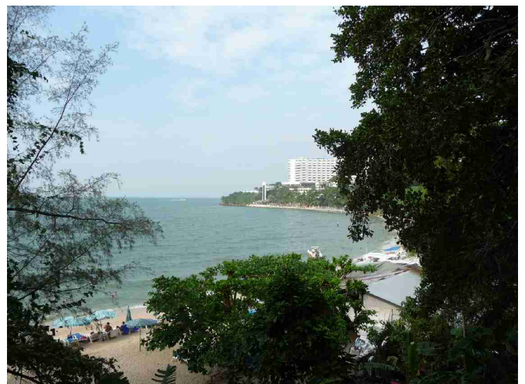
Nord for New Nordic ligger det flere strender bortover.