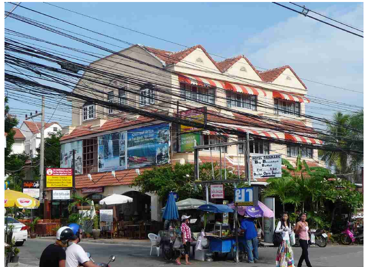
Skilt som viser til Hotel Danmark.