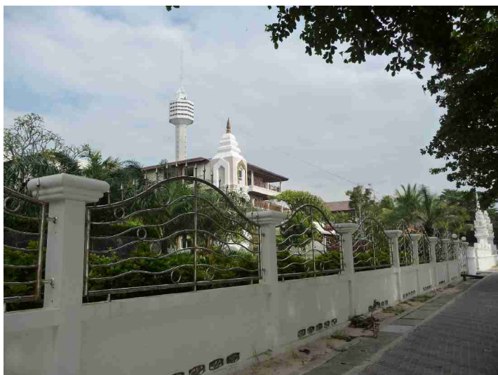
Det er mange fine hoteller bortover.