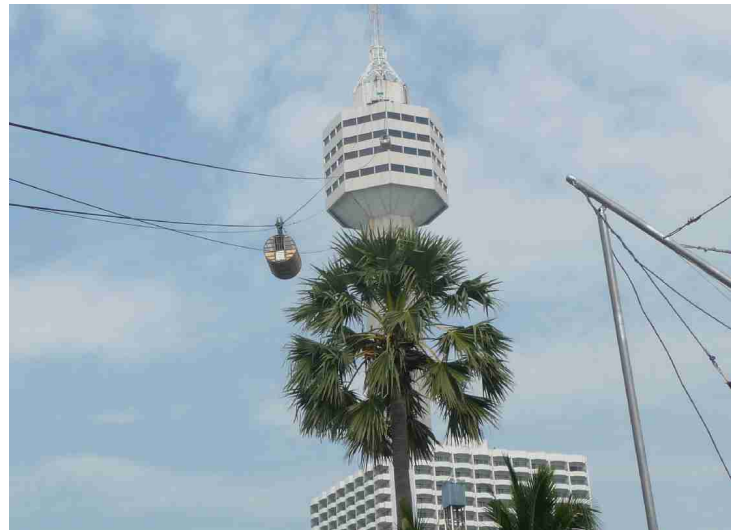
Et høyt hotell med restaurant på toppen. Det går også taubane opp og ned.