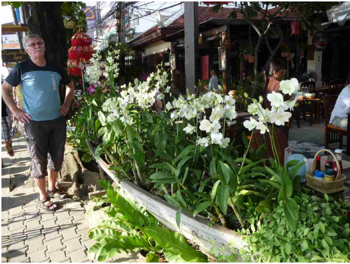
Langs gata var det en lang kano hvor det var plantet mange orkideer.