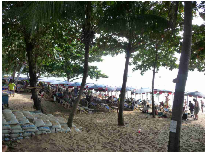
Det samme gjør stranden.