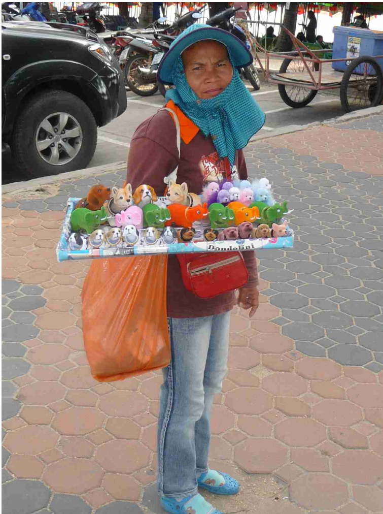
Hun selger hunder ned nikkende hoder.