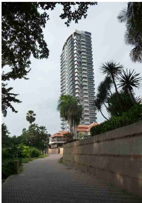
Her er et svært leilighetshotell.