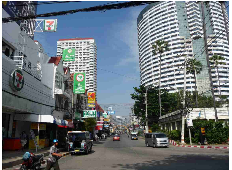
Her er vi kommet bort til sentrum i Jomtien. Det er like tett bebyggt her som i Pattaya og trafikken går like tett.