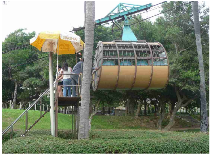
Her har den ene vognen kommet ned igjen og er klar til å ta ombord passasjerer.