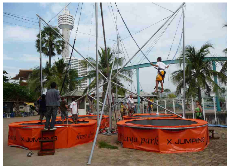
Litt av lekeparksen.