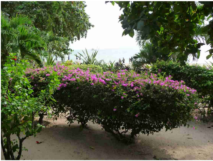
Det er fint beplantet bortover.