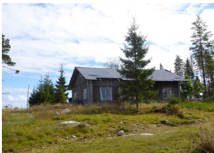
Så kommer vi til øvre Smedtorpet.