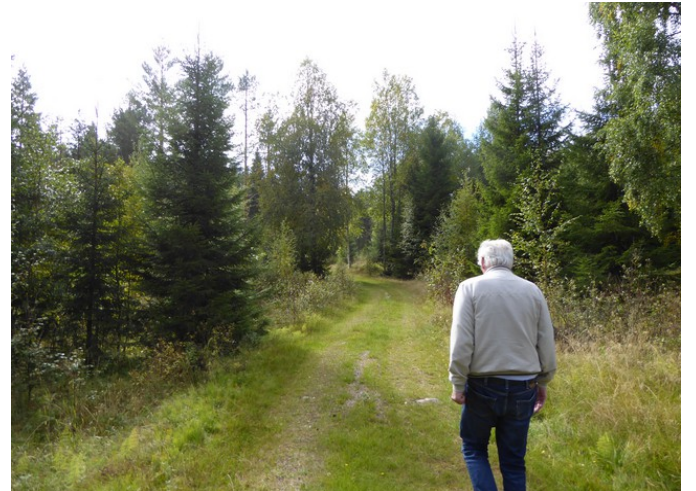
Så går vi tilbake til bilen.