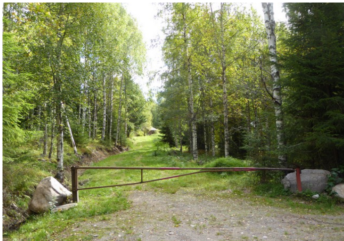
Inngangen til nedre- og øvre Smedtorpet.