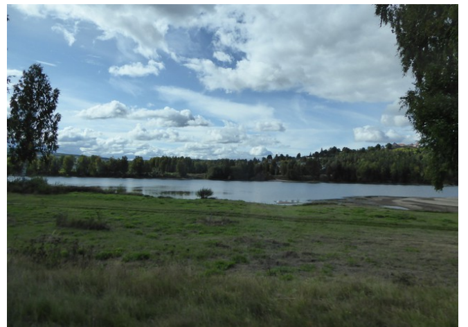
Lite vann i Glomma. Mye sand til høyre.