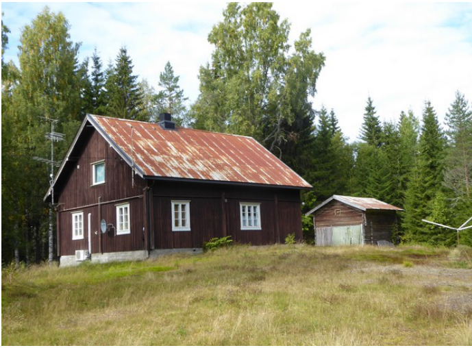
Dette er hovedhuset på nordre Smedtorpet.