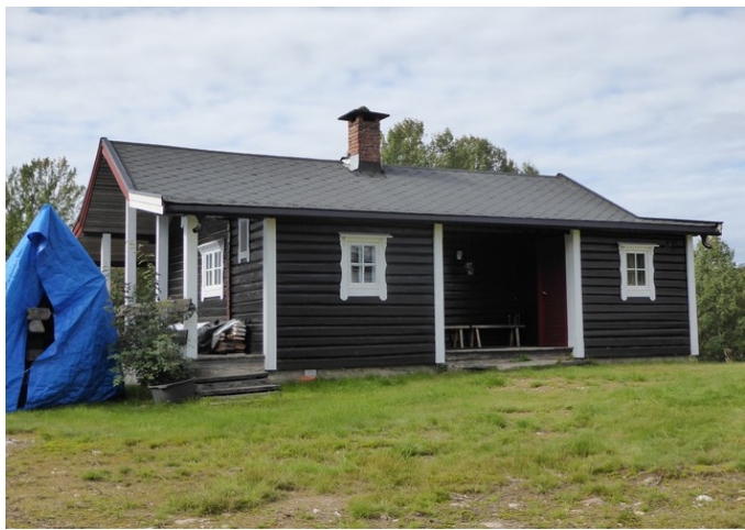
Dette ser ut til å være i bruk som fritidsbolig.