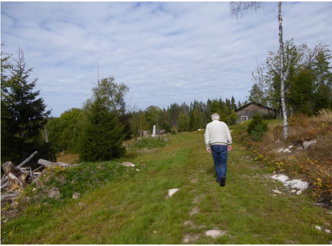
Så går vi nedover igjen.