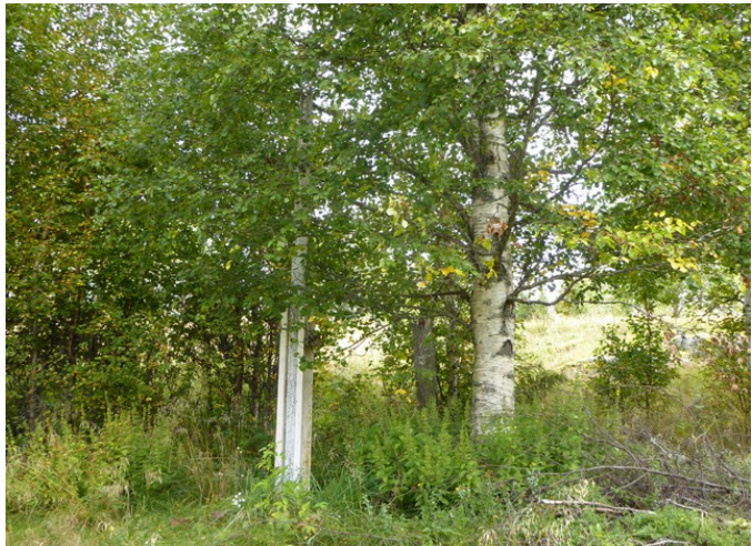
Rester av flaggstanga.