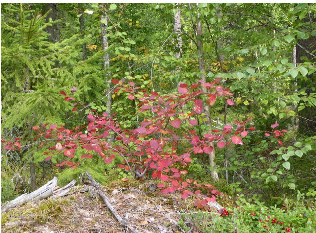
Høstfarger på trærne.