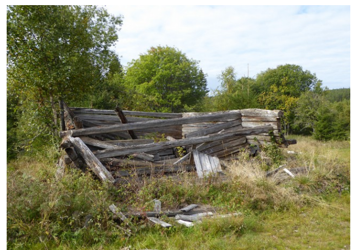
Noen av bygningene forfaller.