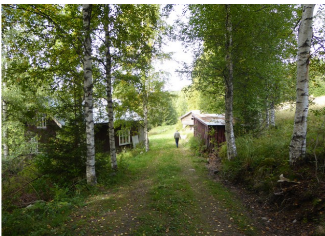
Snart nede igjen.