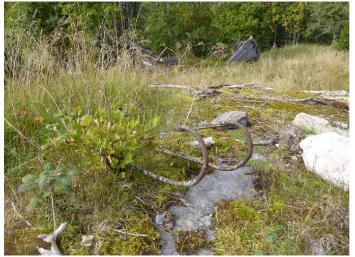
Kjelke eller slede?