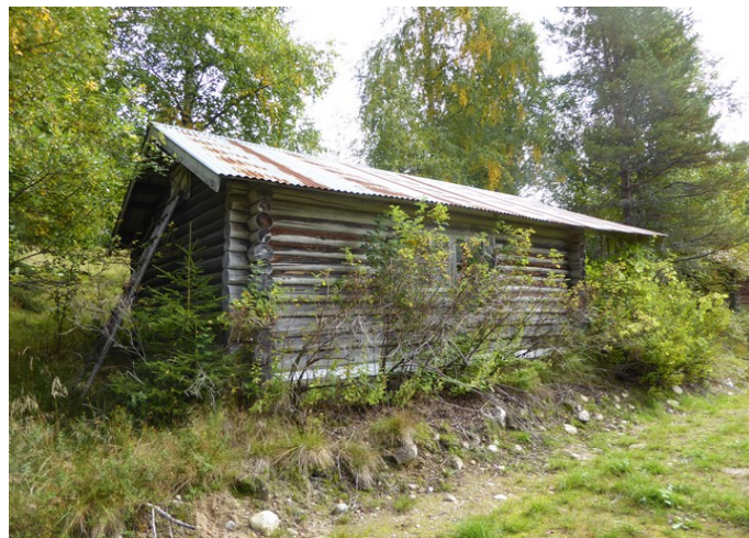
Noen bilder etter hvert som vi går oppover.