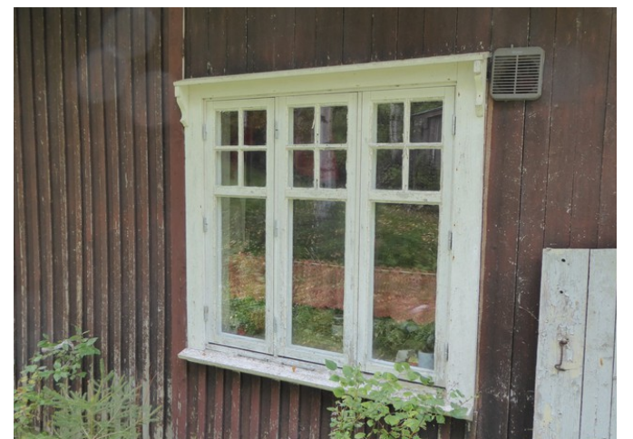
Vindu på hovedhuset på nedre Smedtorpet.