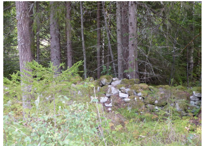
Det lødd en steingard langs veien mot nordre Smedtorpet.