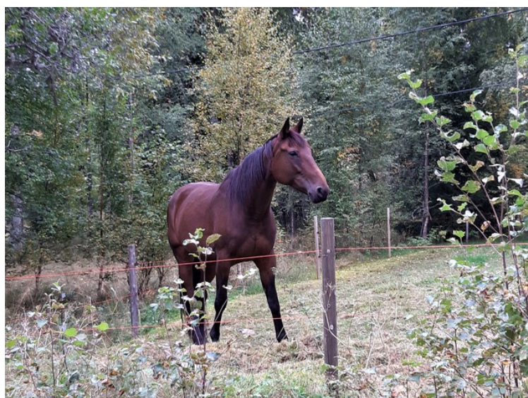
Her har vi kjørt videre mot Græsberget. Denne hesten var veldig nysgjerrig og kom bort til oss da vi stoppet bilen.