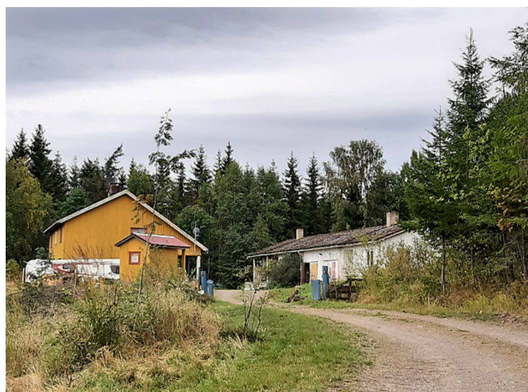
På andre siden av veien, litt lenger nord, ligger Nordre Skasdammen. Den er også fra 1800-tallet. Det er er bare den gamle røykstua som står igjen her. Det er planer om restaurering.