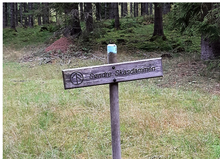
Søndre Skasdammen fra slutten av 1800-tallet. Her er det bare det gamle hovedhuset som står fremdeles. Det er spor etter flere andre bygninger i området rundt.