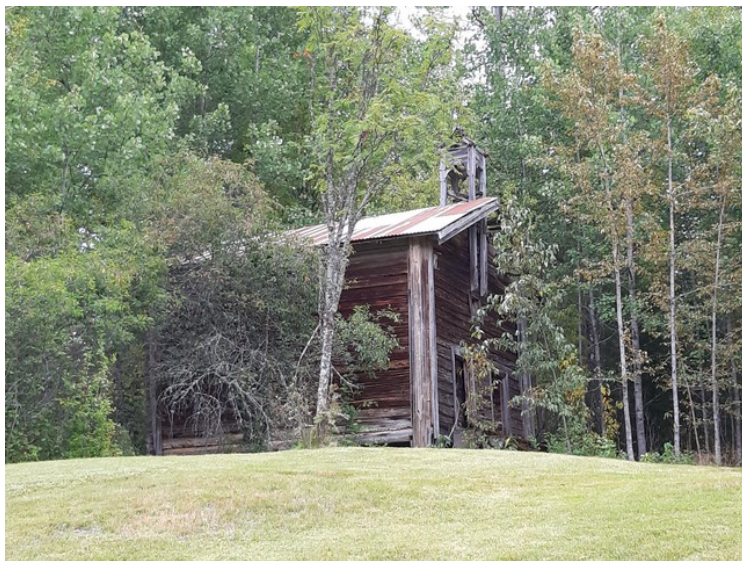
Stabbur i Vestre Græsberget.