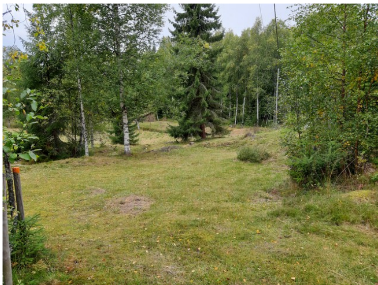
Jorde i Vestre Græsberget.