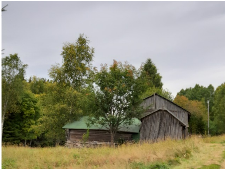
Denne låvebygningen i Østre Græsberget faller snart sammen.