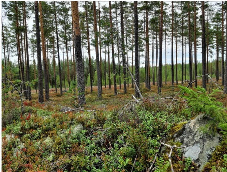
Lenger nordover var det stor og fin furuskog.