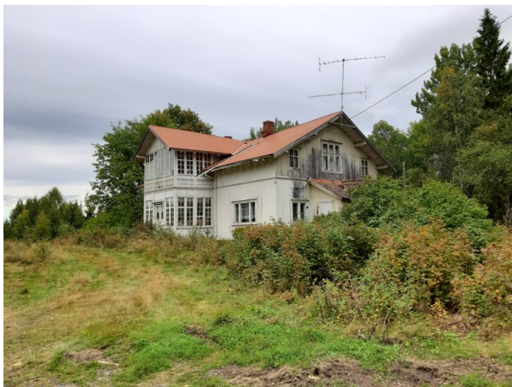
Hus i Vestre Græsberget. Det ble bygget i 1912 og erstattet den gamle røykstua. Uthusene er borte.