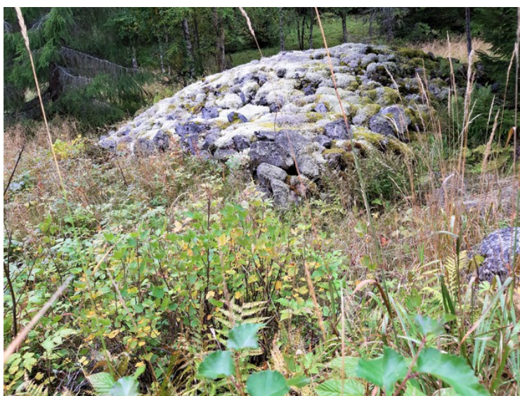
En rydningsrøys i østre Græsberget. Den har ligget her lenge, så den er ganske mosegrodd.

Det er to grender i Græsberget, østre og vestre. Bosetningen startet her rundt 1720. Det så ut til at det var noe jordbruksvirksomhet i Vestre Græsberget, mens i Østre Græsberget er det nok en stund siden det har vært noe aktivitet. Jordene så ut til å være i ferd med å gro igjen.