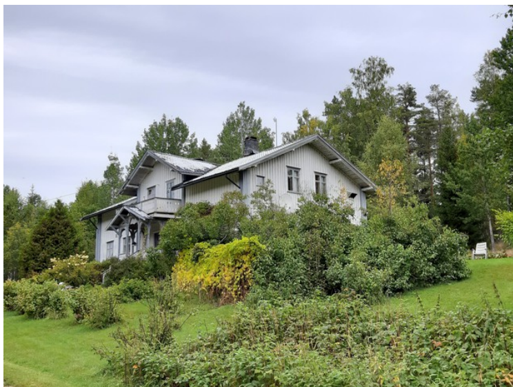
Stort hus i Østre Græsberget. Det er en røykstue fra tidlig på 1800-tallet, med den ble endret på 1900-tallet og påsatt kledning utvendig.