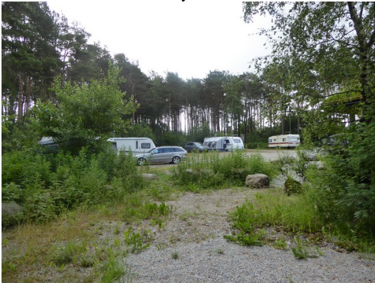
Plassen bak hytta.