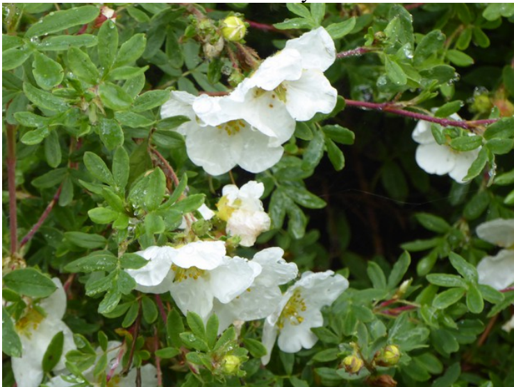
Natur rundt hytta.