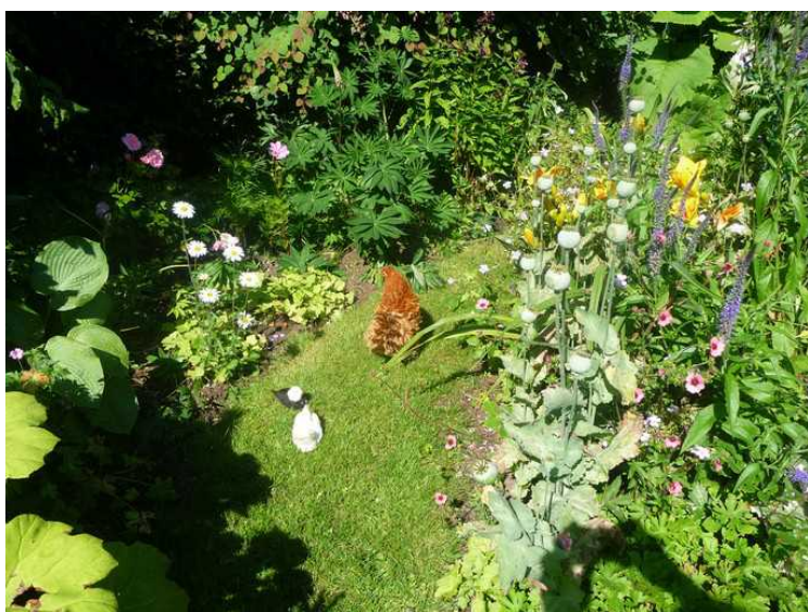
Dverghønsene spiser gress på plenen.