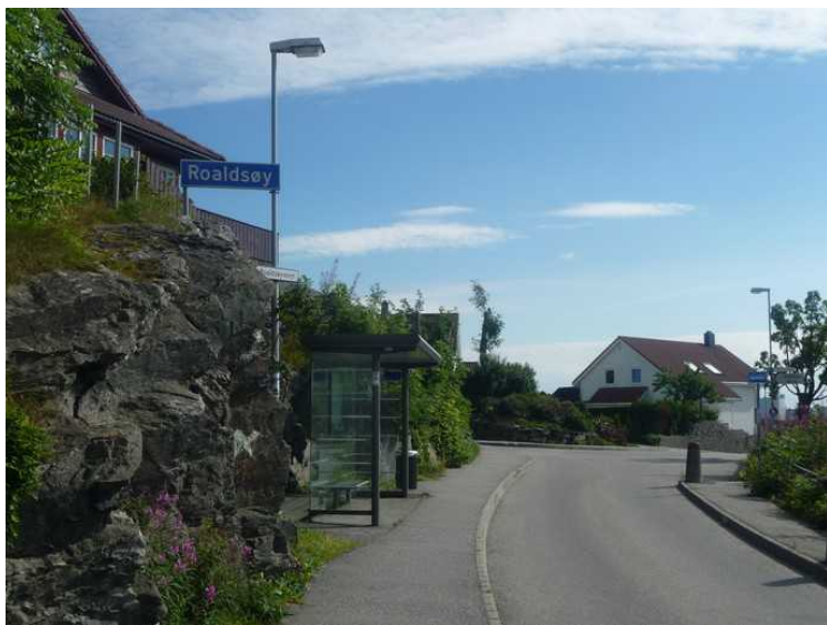
Her har vi parkert bilen på Bjørnøy og gått tilbake over brua til Roaldsøy.