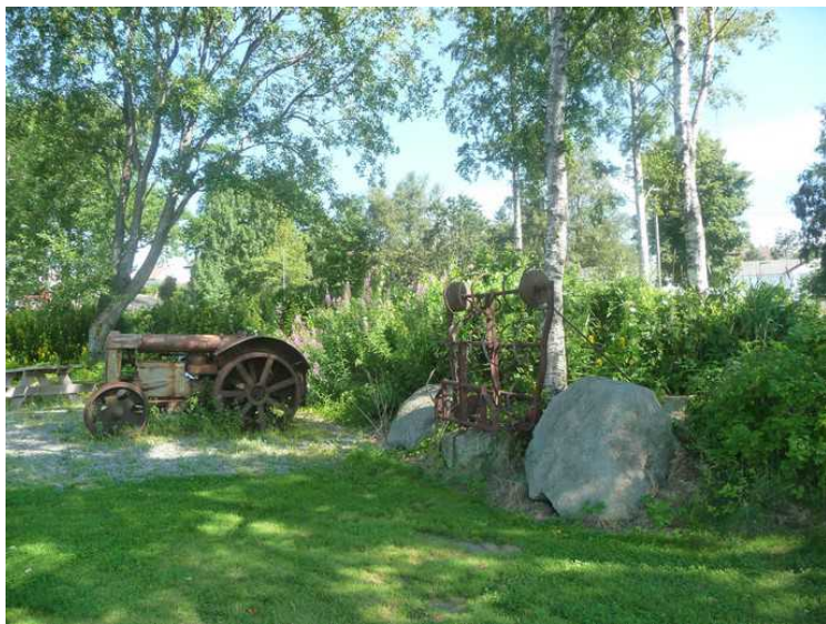
En gammel traktor.