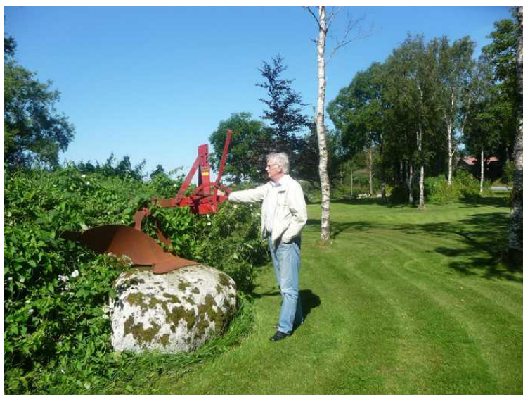
Her står jeg ved siden av samme type plog.