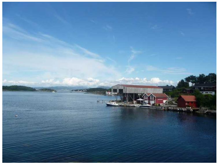
Utsikt fra Bjørnøy mot nordre del av Roaldsøy.