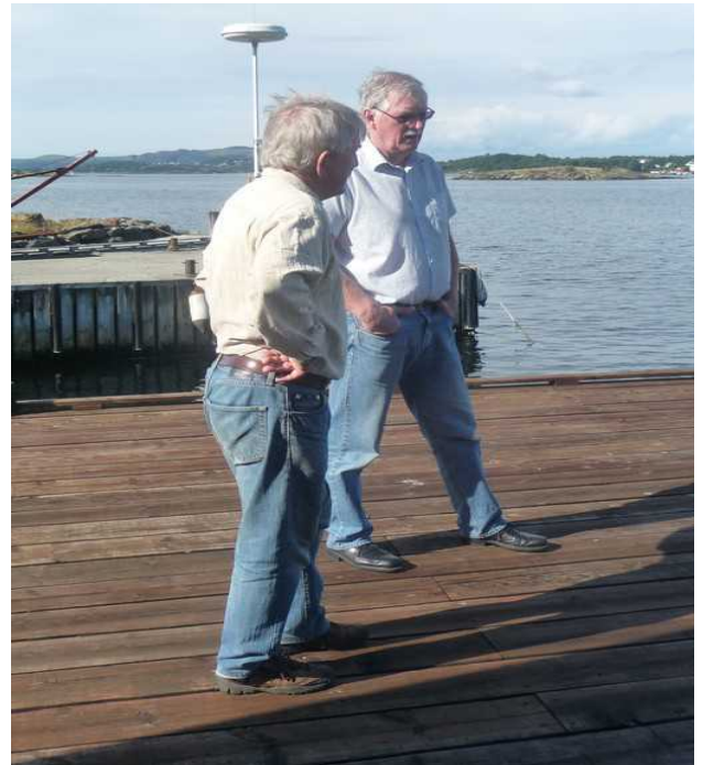
Det var koselig å oppfriske gamle minner.