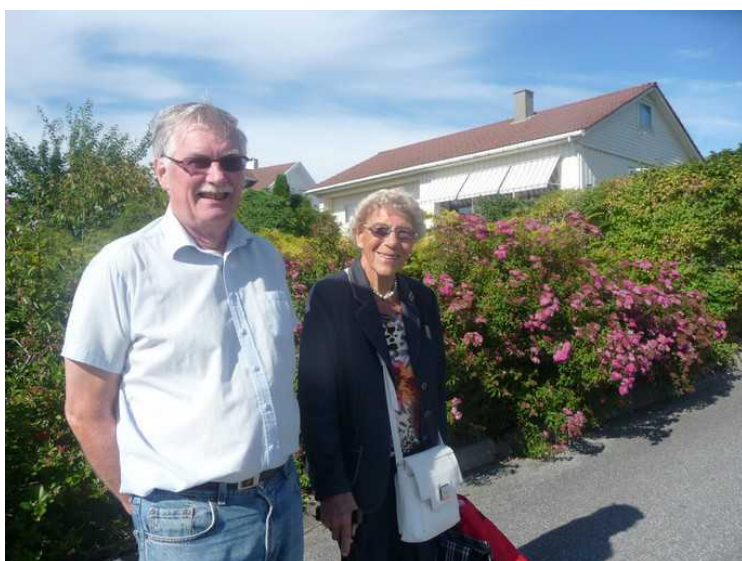
En dame som kom forbi, har bodd der lenge, og visste litt av historien om de som hadde bodd her.