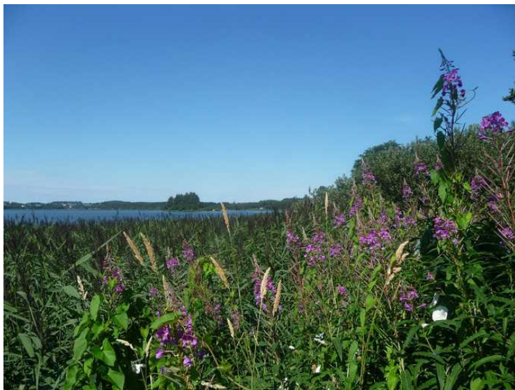
Det er frodig ved Frøylandsvatnet.