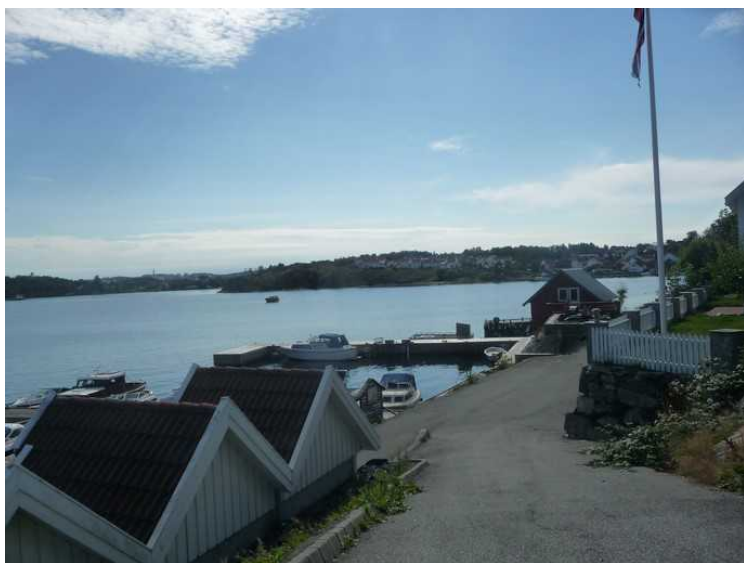
Utsikt fra Bjørnøy mot Hundvåg og Steinsøy .