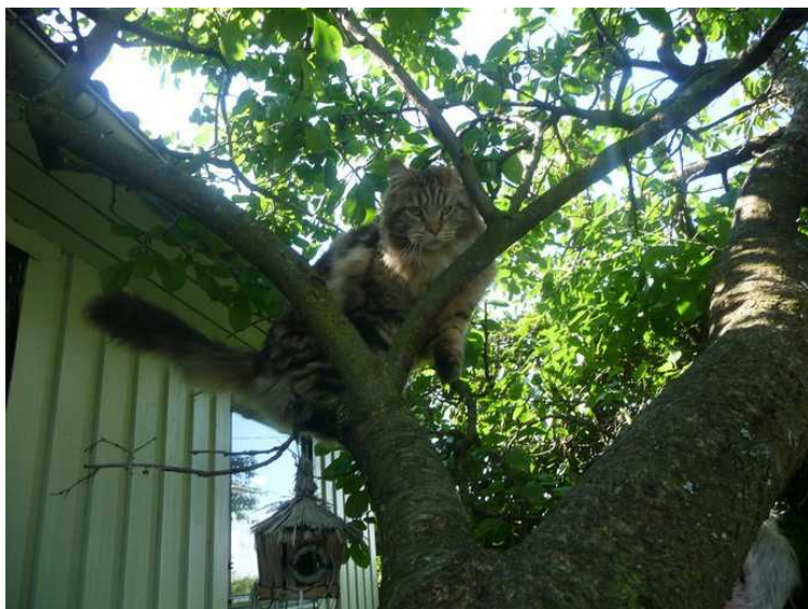
Her har katten klatret opp i treet for å få bedre kontroll.