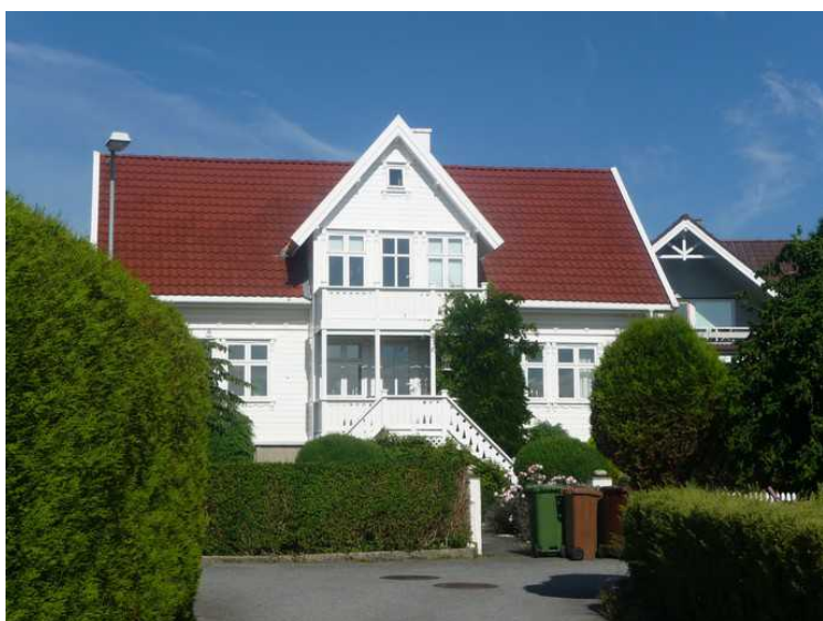
Huset til en slektning av meg, Kasper.