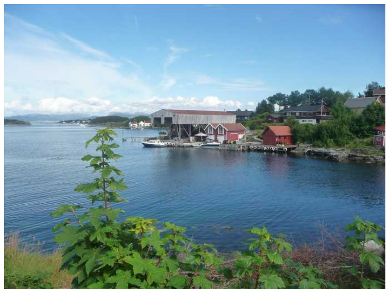
Utsikt fra Bjørnøy mot nordre del av Roaldsøy.