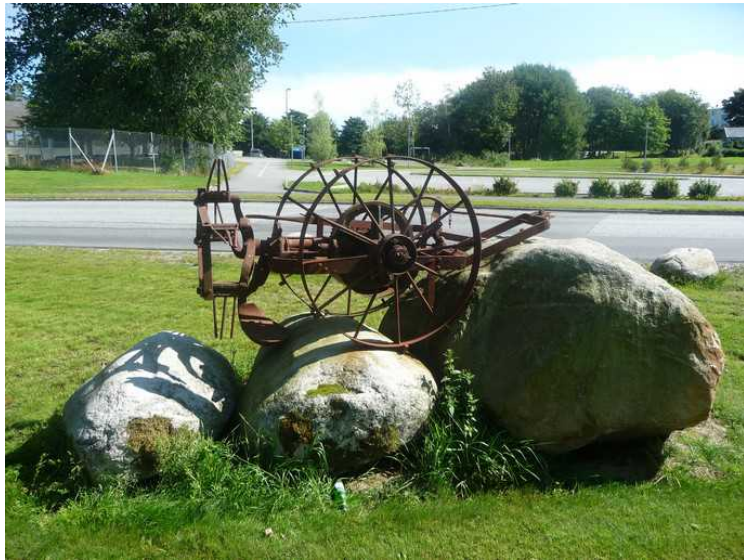
En gammel potetopptaker.