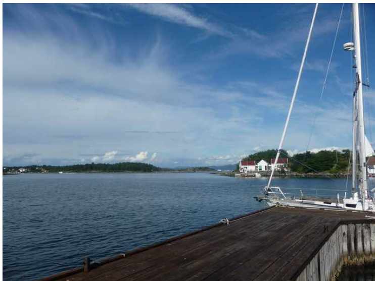
Utsikt fra kaien mot Langøy og Vassøy.