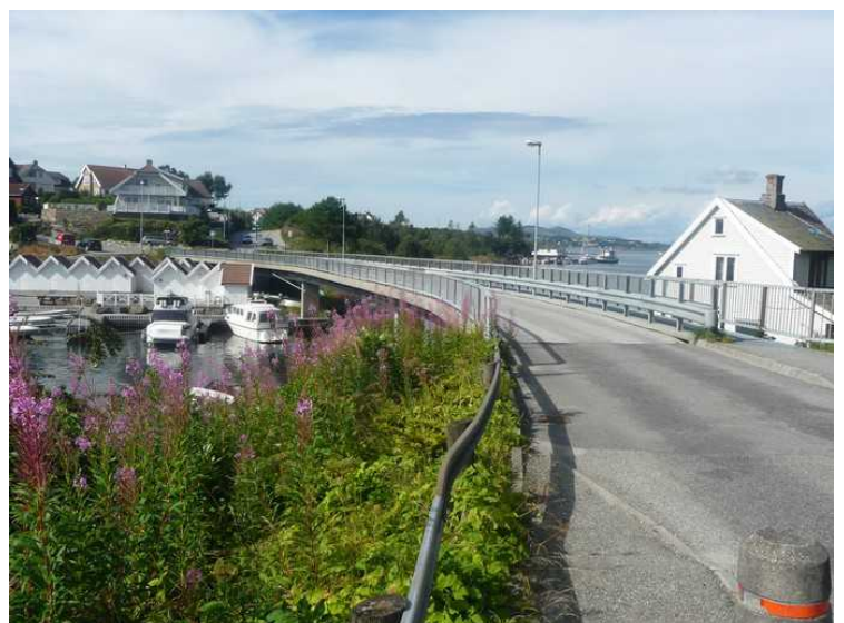
Utsikt fra Roaldsøy over brua mot Bjørnøy.