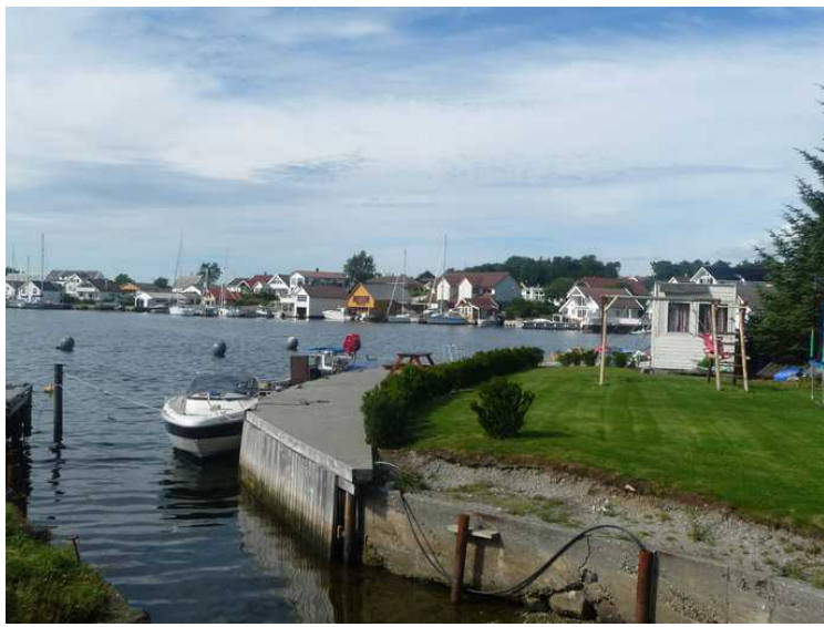
Her ser vi over til Roaldsøy.