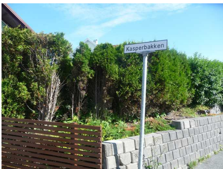
Veistubben har fått navn etter han som bodde øverst i veien.