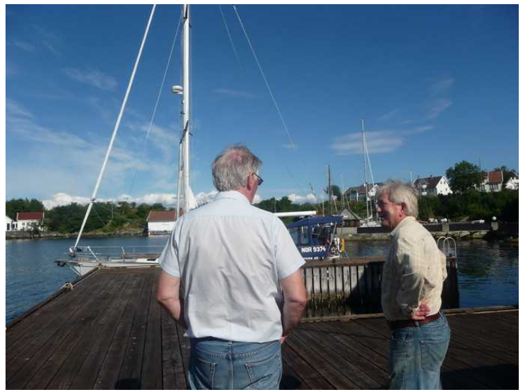
Her er vi på kaien. Seilbåten ligger til kai.