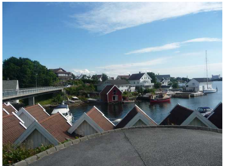
Her er vi på Bjørnøy og ser over mot Roaldsøy.