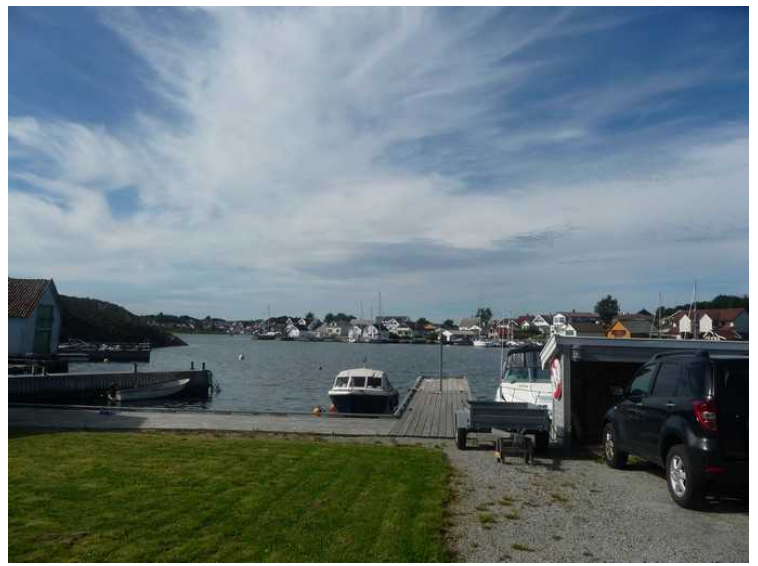
Utsikt mot Roaldsøy.