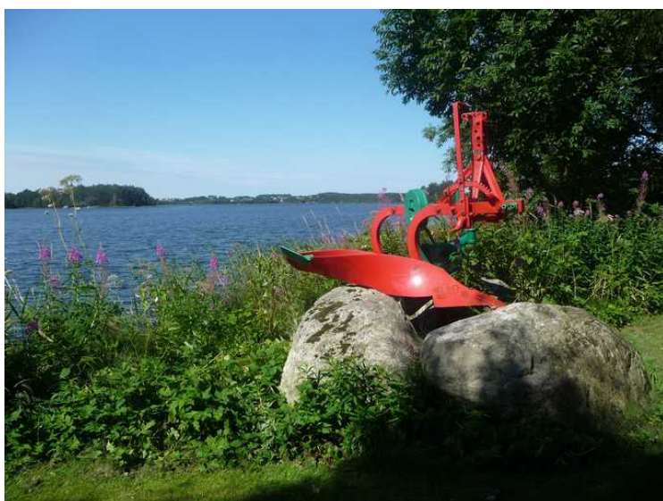
En noe nyere plog.