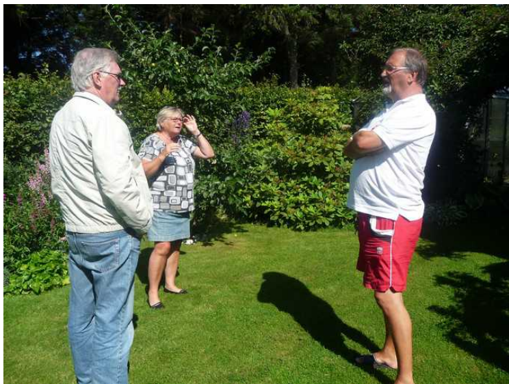
Ute i hagen.