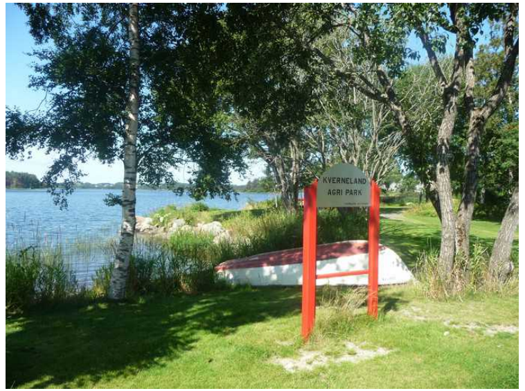
Skiltet med Kverneland Agri Park.