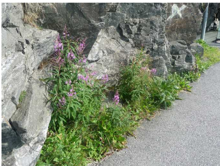
Det er frodig under bergnabben.