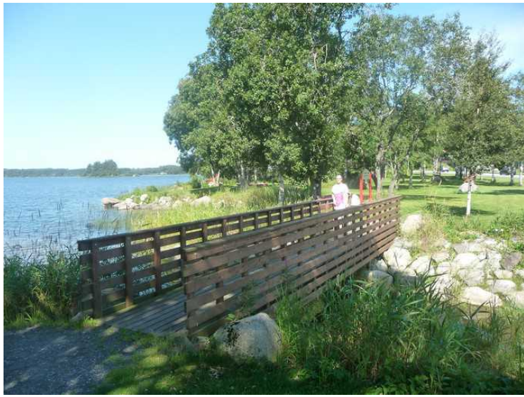
Det er laget gangbru over bekken rett før den renner ut i Frøylandsvatnet.