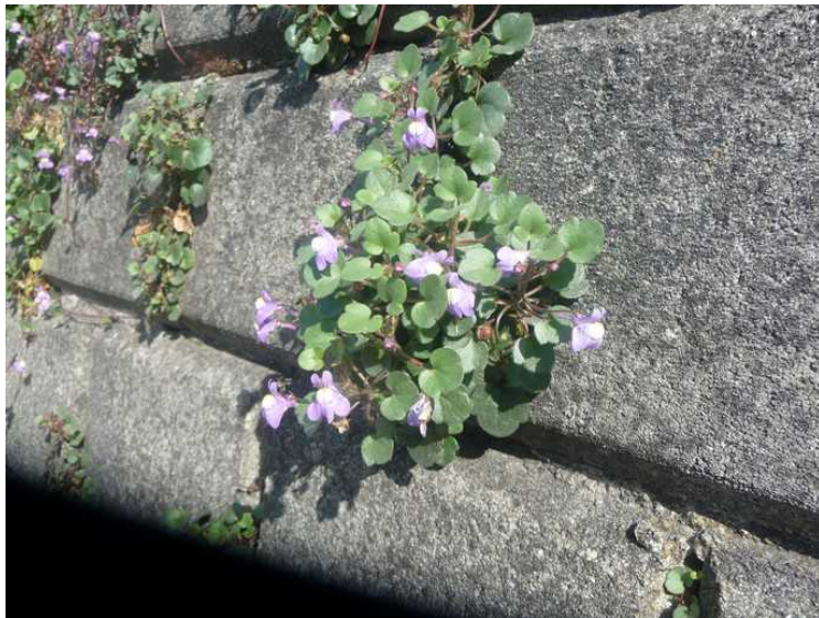
Fine planter på en steinmur.