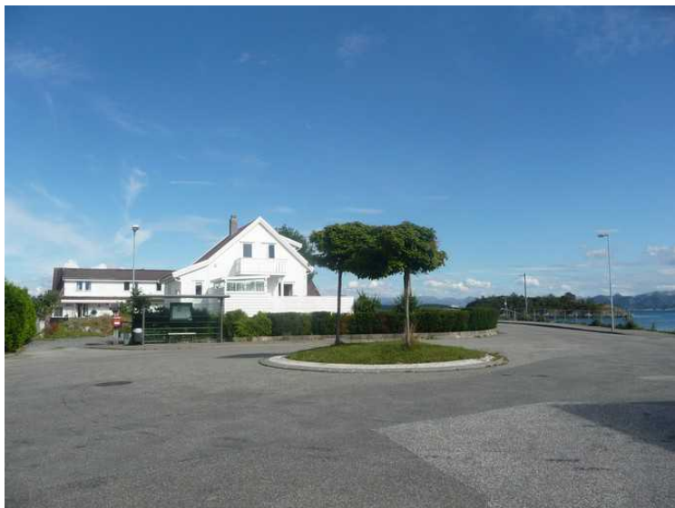
Rundkjøring på Ormøy der bussen snur.