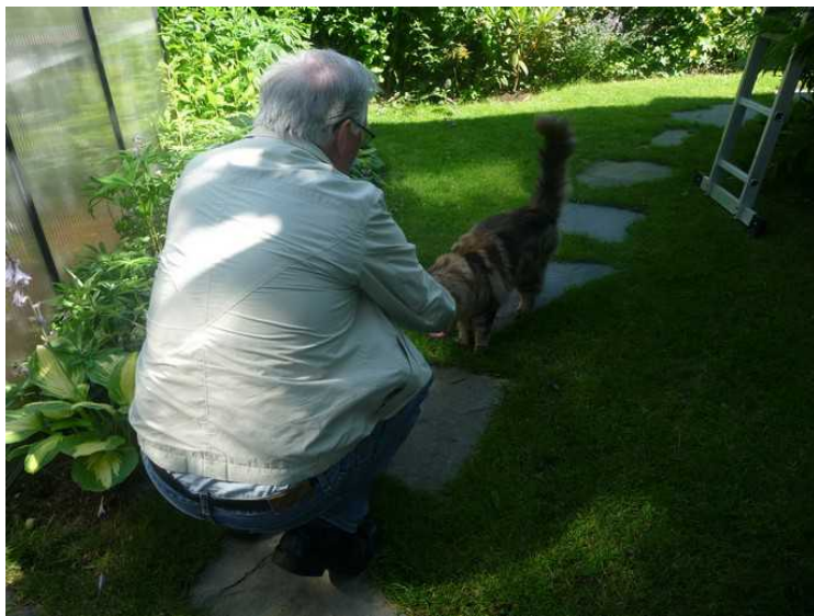
Jeg må snakke litt med katten også.