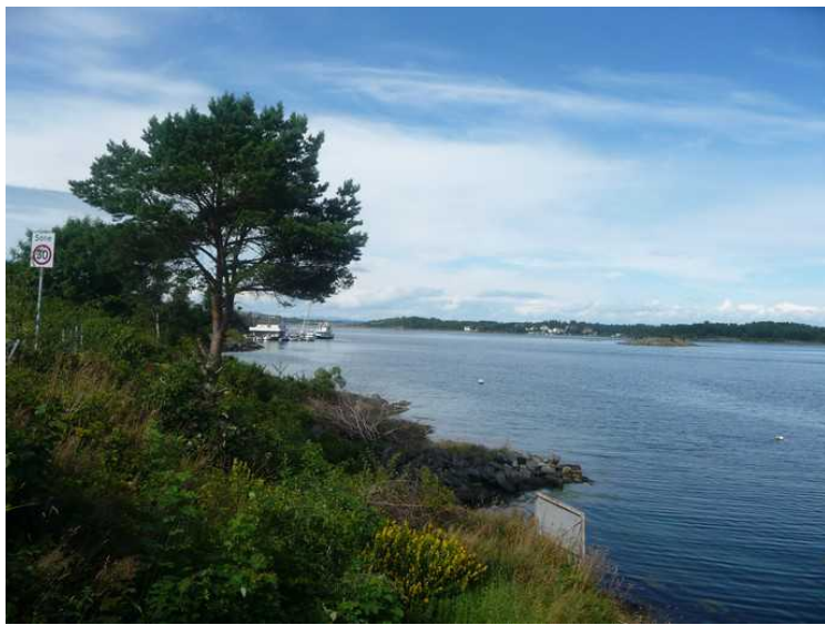
Utsikt fra Bjørnøy mot Langøy .