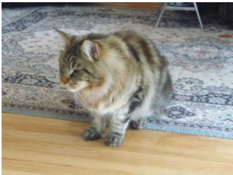
Her har den godtatt meg.