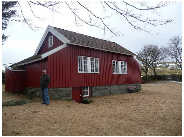
Her står jeg utenfor Jærdikterens skriverstue.