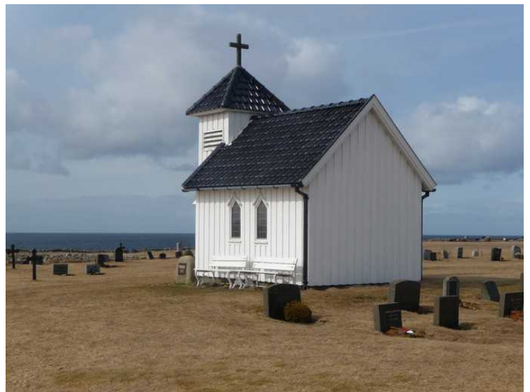
Varhaug gamle kirkegård . Kirkegården og kapellet ligger på gården Varhaug, helt ute mot havet.