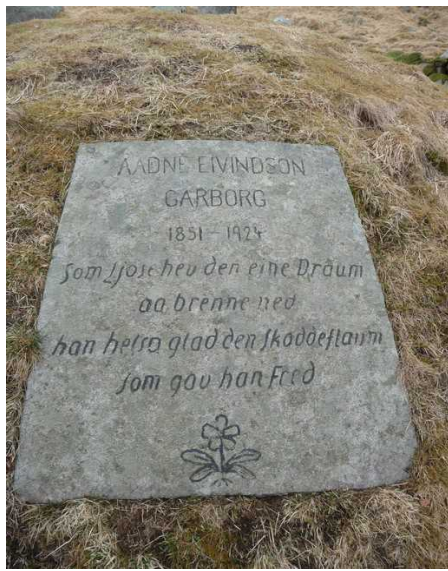
Minnetavla for Arne Garborg.