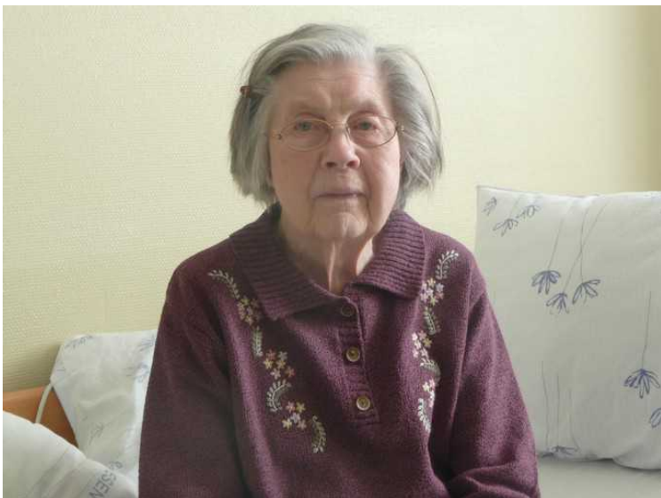
Hun synes alltid det er hyggelig med besøk. Man skulle ikke tro at hun er over 90 år gammel.