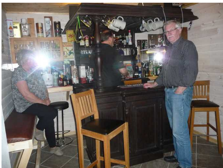
Jeg er helt imponert.