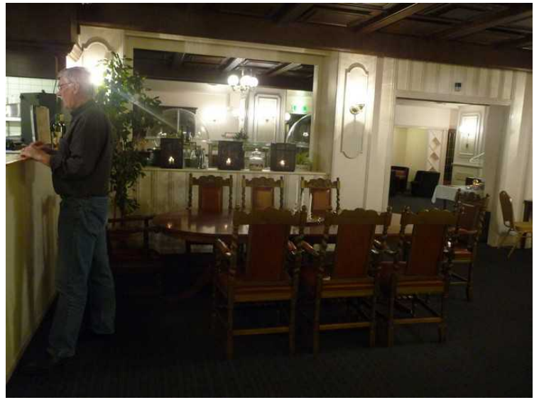
Her betaler jeg for middagen.

Vi har mange flere bilder av familien min, men de vil ikke at disse bildene skal ut på Internet.