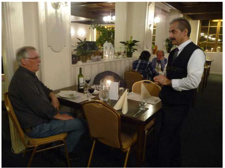
Det var buffét, og det var mye godt.