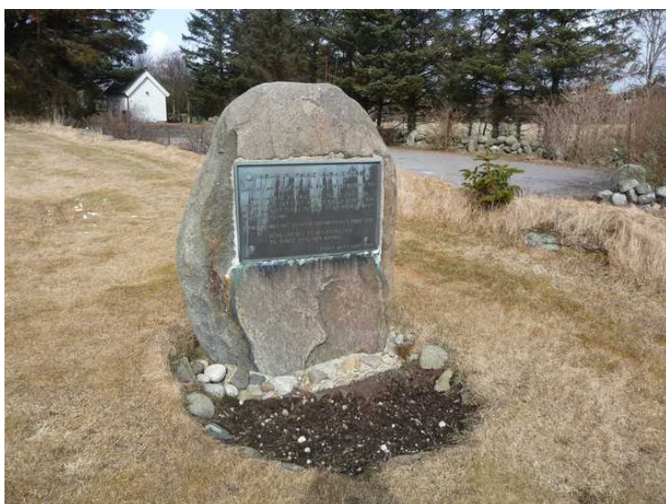
Stein med opplysningstavle står nær inngangsporten.