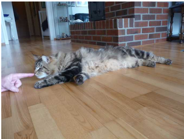
Her prøver jeg å gjøre meg kjent med katten. Det gikk ganske bra. Katten er av typen Main Coon.