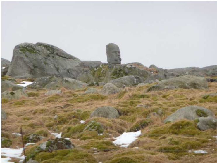
En skulptur i stein av Arne Garborg . Den er laget av Hugo Wathne . Den er plassert på en høyde ovenfor huset.