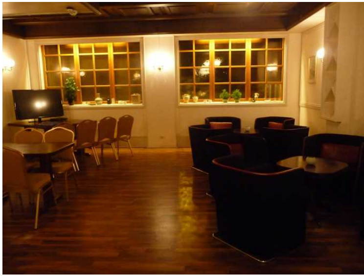
Dette er i resepsjonen.