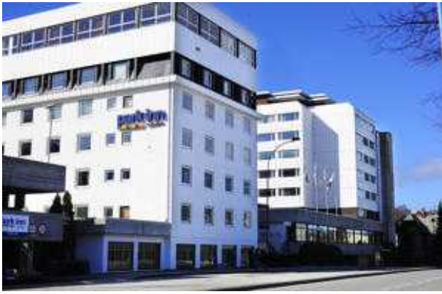
Bilde av hotellet sett fra syd.

Dette var første turen vår dette året for å besøke familien min i Rogaland.