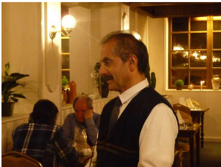
Kelneren var fra Rethymnon på Kreta, og han arbeider hele vinterhalvåret i Stavanger og om sommeren på Kreta.