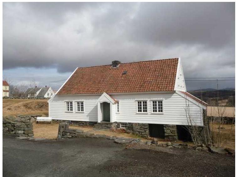
Garborgheimen på Garborg, syd for Bryne. Arne Garborg er født her og bodde her til han var 16 år.