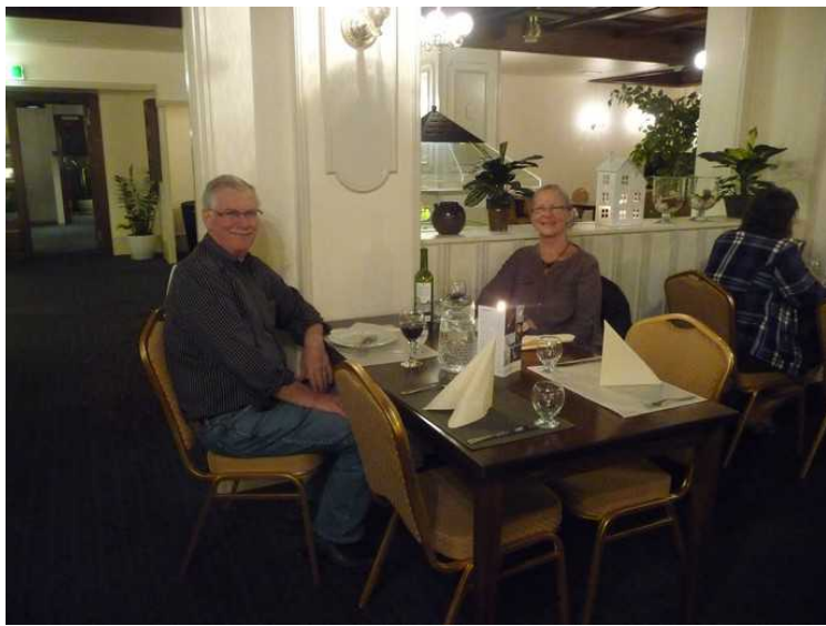
Om kvelden spiste vi middag på hotellet.