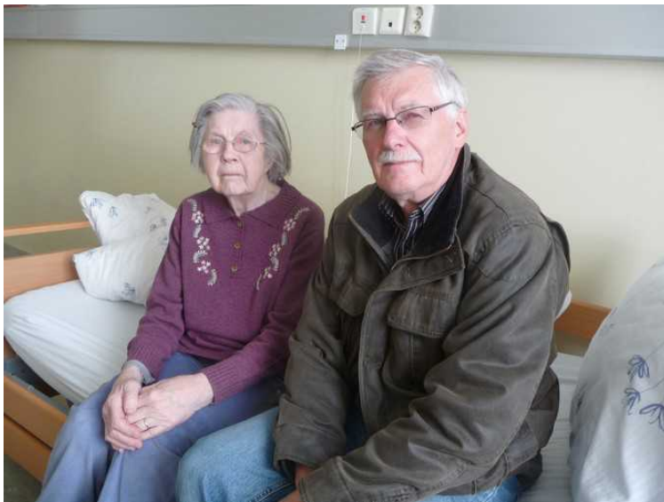
Jeg og min mor på Stavanger Sykehus. Hun hadde fått midlertidig plass her fordi hun var blitt dement.