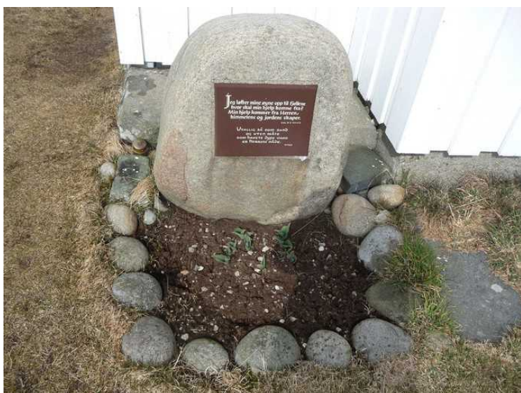
Denne steinen står utenfor inngangsdøra.