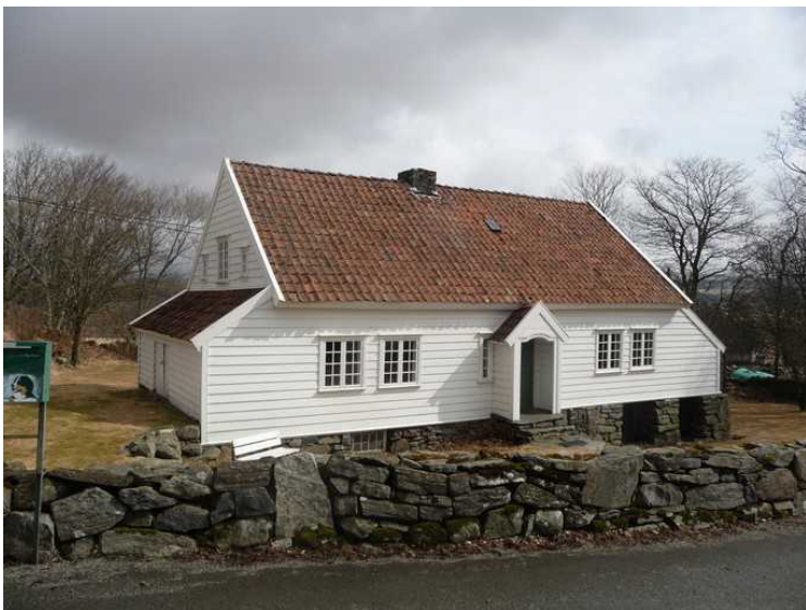
Flere linker til Garborgheimen: Jærmuseet , Time Kommune , Olavsrosa