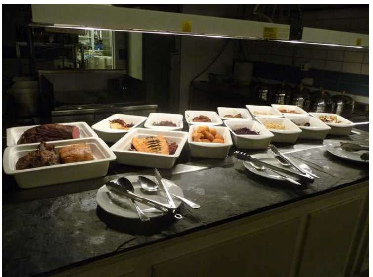
Flere forskjellige retter.