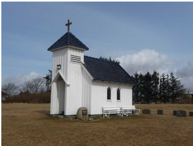
Kapellet har bare 14 sitteplasser (jærstoler).