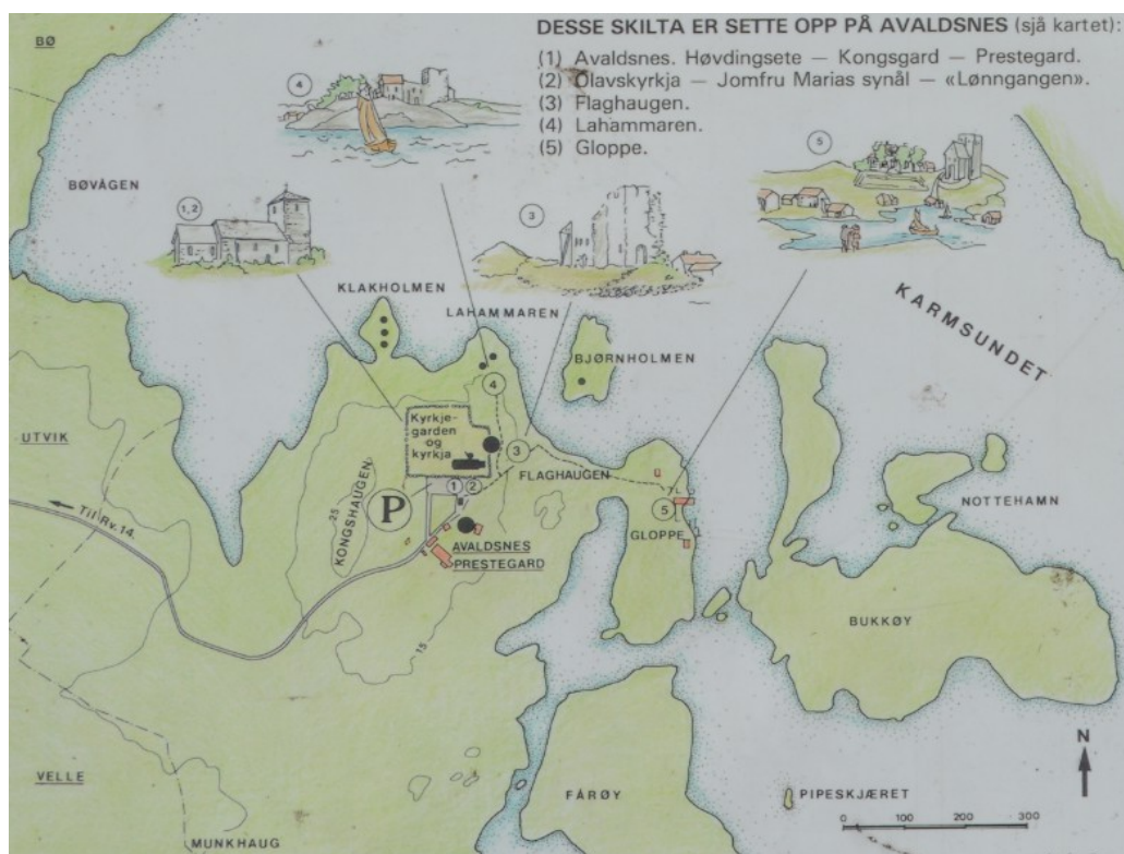
Kart over området.