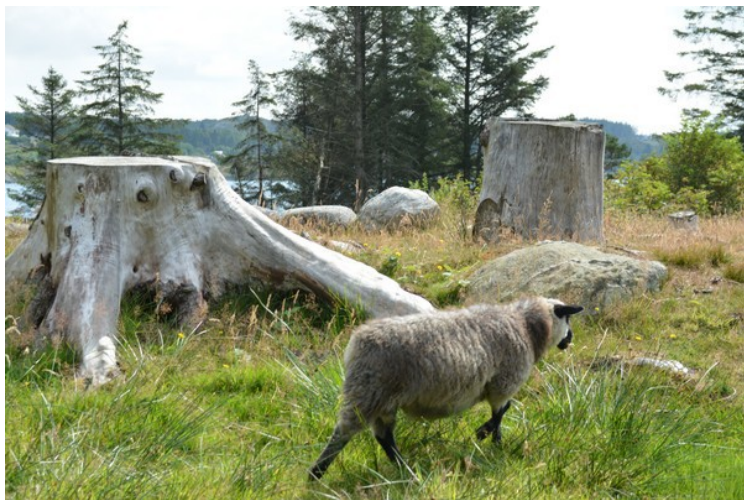
Sauene er på beite.