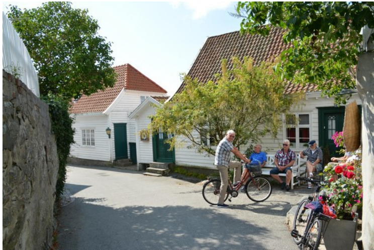
Her er vi i Søragadå .