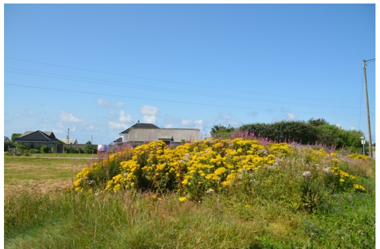
Mange forskjellige slags planter langs stranden og ovenfor.