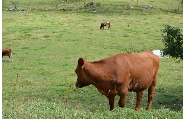
Kyrne bryr seg ikke.