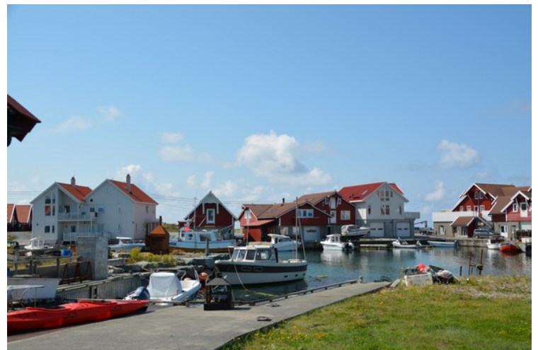
Et parti fra vestsida av Åkrehamn. Åkra Sjømat holder til her.