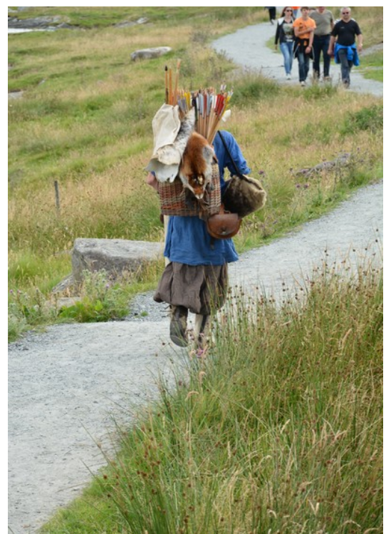
En kar som skal bort til Vikinggarden.