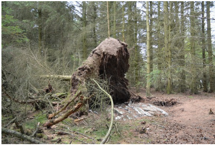
Det var flere rotvelter her.