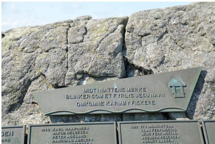
Dette er minneplaten.