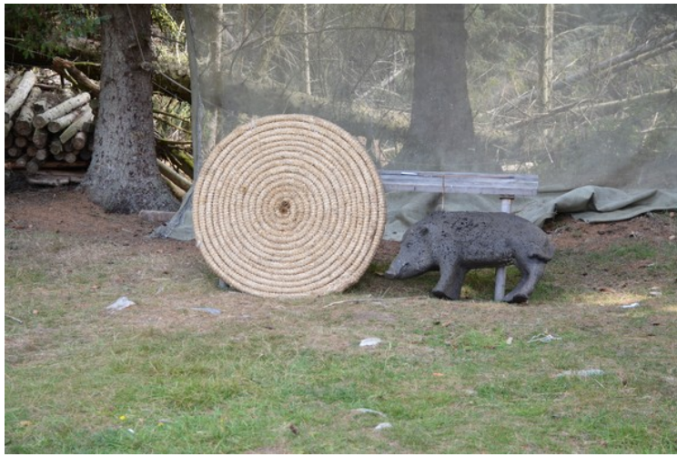
En rund skyteskive og et villsvin som nok ble brukt til øvelsesskyting.