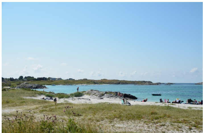
Her ser vi syd-over.