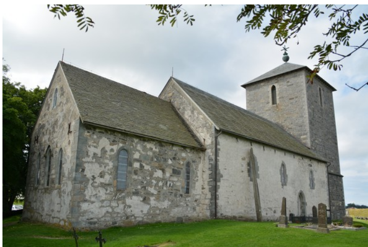
Kirken sett fra nordsiden.

Dette er en bautastein som kalles Jomfru Marias synål . Et av sagnene sier at det hviler en gammel forbannelse over den: Den dagen steinen berører kirkeveggen vil verden forgå . Dette skal, ifølge tradisjonen på stedet, være årsaken til at toppen mangler. Når steinen begynte å lute for nær kirkeveggen, sørget straks noen for å redde verden ved å slå av en bit av steinen.