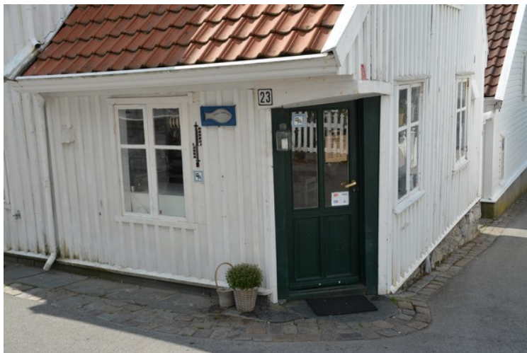
Verdens minste kafe.