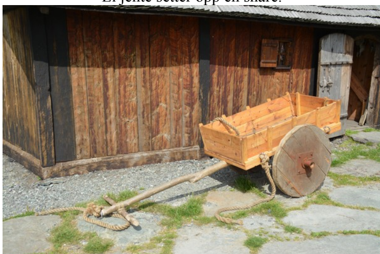
Kjerre med trejul.