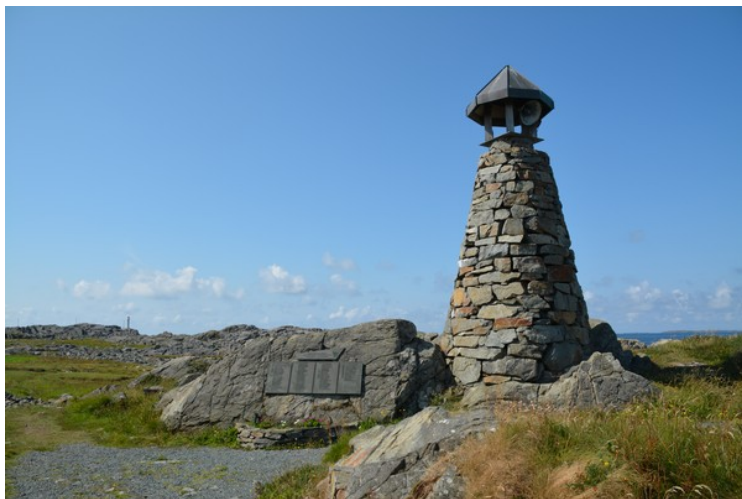
Få steder i Norge har hatt så mange pendlere til Amerika som området rundt Ferkingstad og Vest-Karmøy. Karmøy Fisherman's Memorial på Ferkingstad er reist nettopp for å minnes de karmøyfiskerne som er kommet bort ved ulykker på havet i amerikanske farvann. Dette er korset.