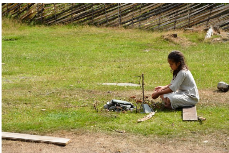
Ei jente setter opp en snare.