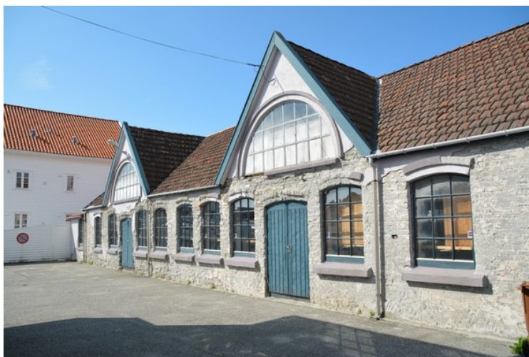
Skudenes Mekaniske Verksted ble bygget i 1916. Her ble Skude-motorene produsert.