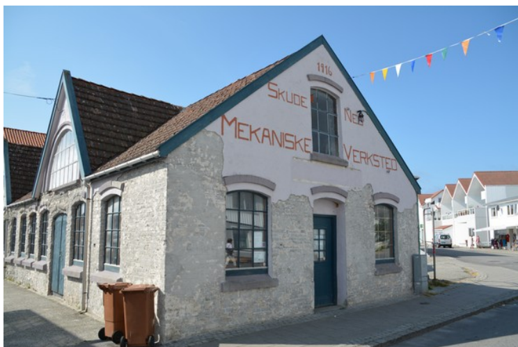
Enden av huset med navnet på veggen.