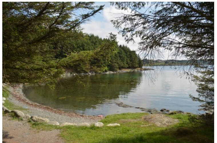
Det er flere fine vikar på øya.