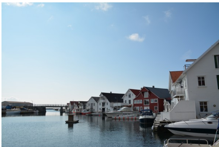
Utsikt sydover mot brua som går over til Steiningsholmen.