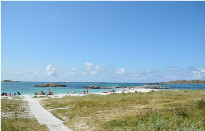
Dette er Åkrasanden .