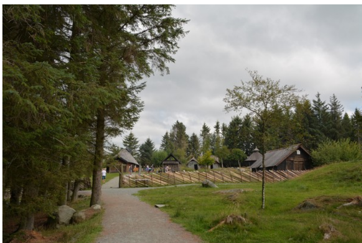
Her går vi oppover mot langhuset.