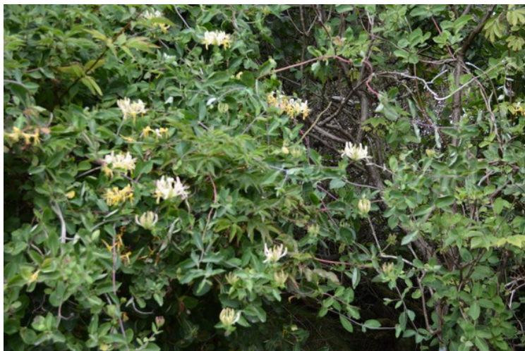
Vivendel vokser på lune steder.

Vivendel er en gammel medisinplante, som sårmiddel og som urindrivende og avførende middel. Men alt på arten er giftig.