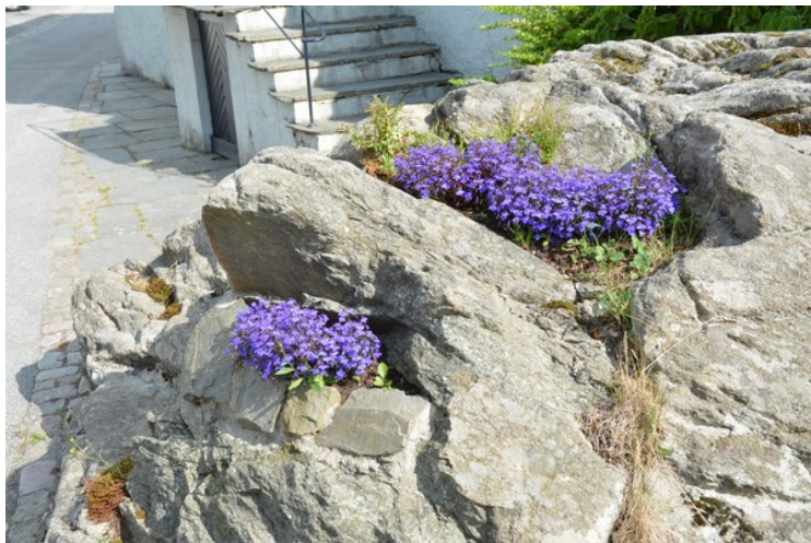
Det blomstrer på bergknattene.