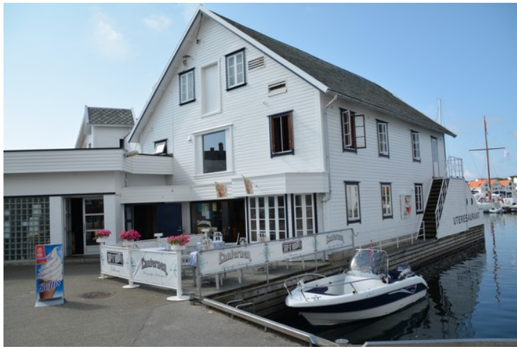
Lanternen Kro & Restaurant ligger rett ved Torget.