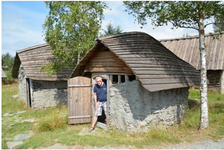
Her kommer jeg ut fra et groppehus. Veggene er laget av flettverk og de er klint inn med en blanding av leire, mold, kumøkk og vann.