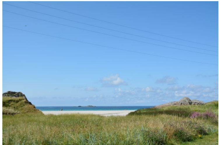
Tirsdag den 29. var vi først på Sandvedsanden som ligger rett vest for Skudeneshavn.