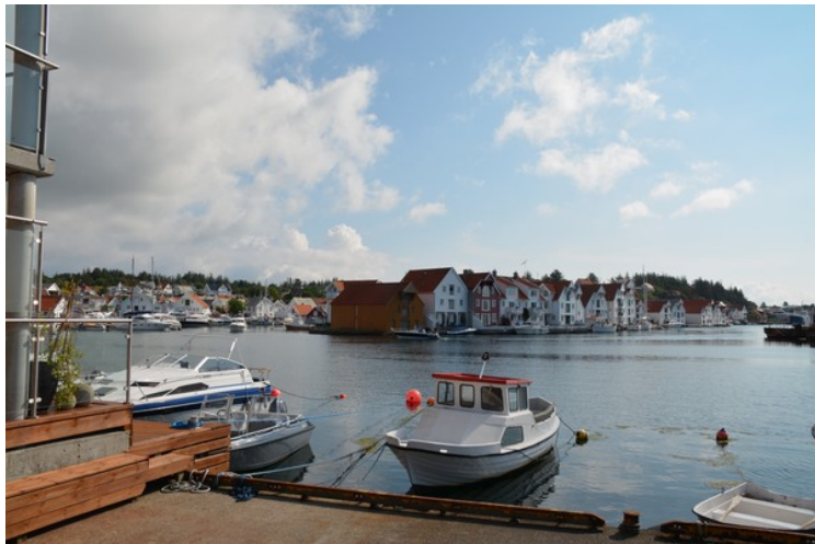
Utsikt tvers over sundet mot Vaholmen.