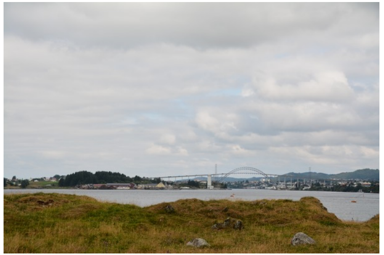
Vi ser mot Karmsunde bru herfra.