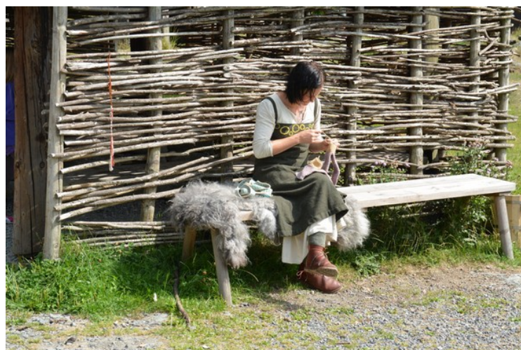
Produksjon av klær.