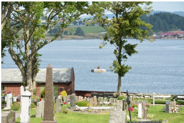
Utsiktspbilder fra kirken.