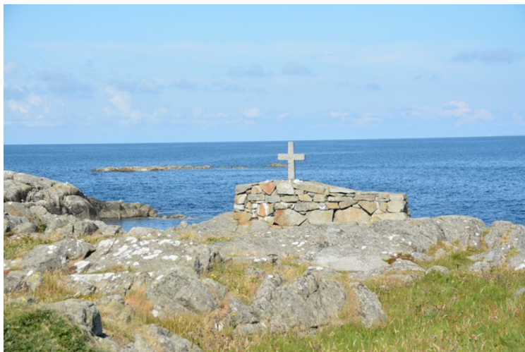
Fra havnen går det en sti syd-over langs sjøen. Etter et lite stykke kommer vi til Karmøy Fisherman's Memorial . Det består av tre deler. Dette er korset.