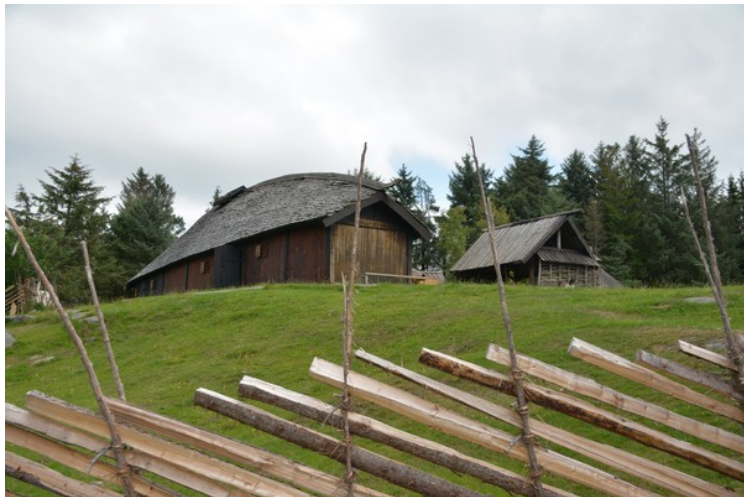
Her ser vi langhuset.