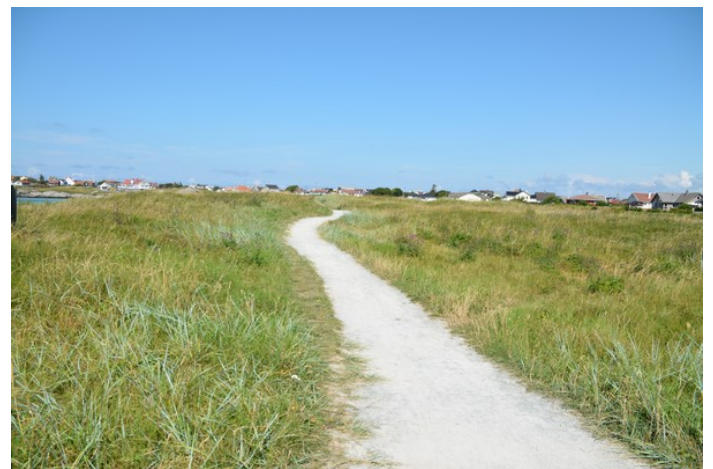
Kulturstien som går fra Ferkingstad til Åkrehamn.