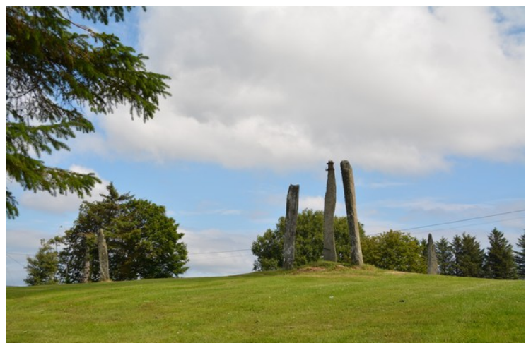
Dette er de fem dårlige jomfruene , 5 bautasteiner. De står på et gravminne som ikke lenger er synlig på grunn av dyrking.

I dag er det seks store gravhauger igjen her, men på en kartskisse fra 1832 er det 14 større og mindre hauger, samt tre små, runde steinsetninger og fem firkantede steinlegninger.