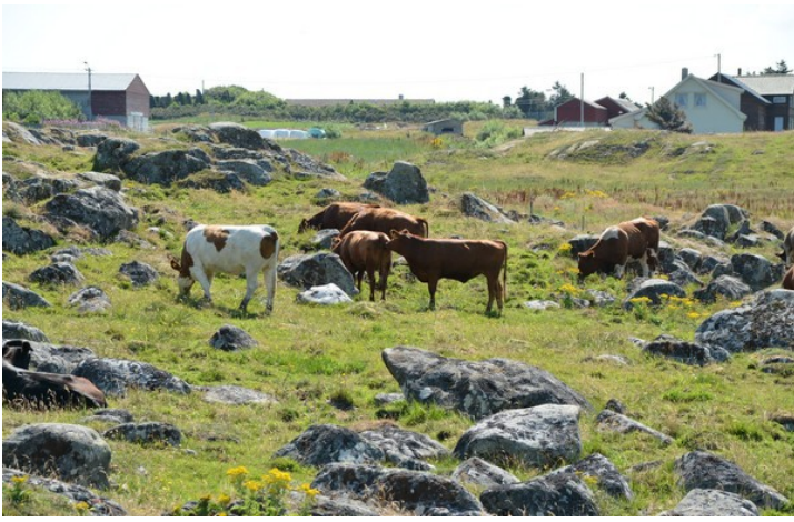
Kyr på utmarksbeite ved minnesmerket.