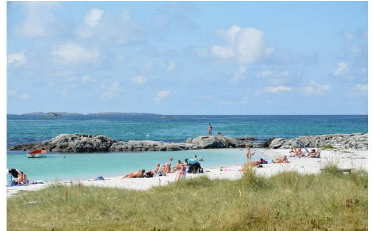
Den består av 7-8 forskjellige strender.