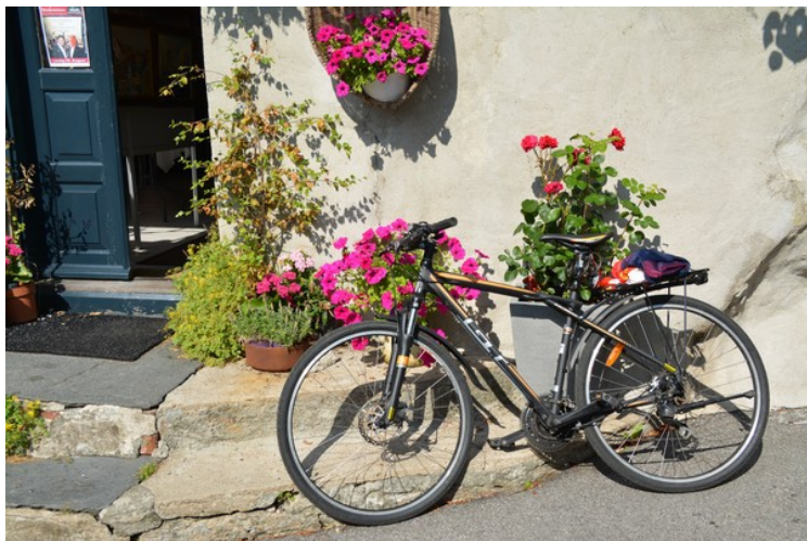
En av dem har syklet hit. Sykkelen står her.