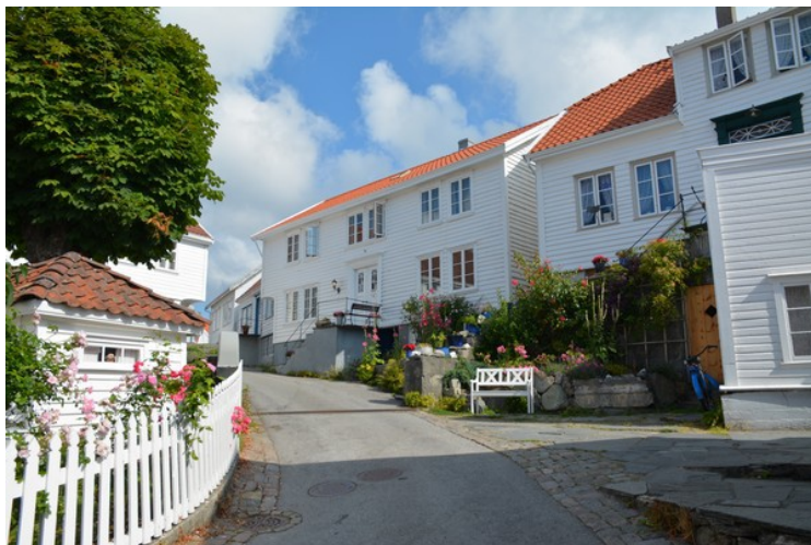
Gata videre bortover.