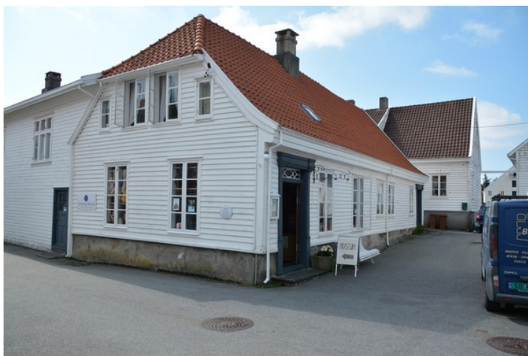
Dette er Mælandsgården , som nå er Museum. Det ligger midt i gamle Skudeneshavn.