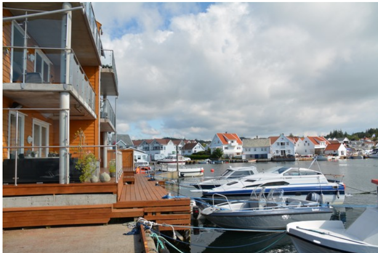
Terrasser med oppankret båt.