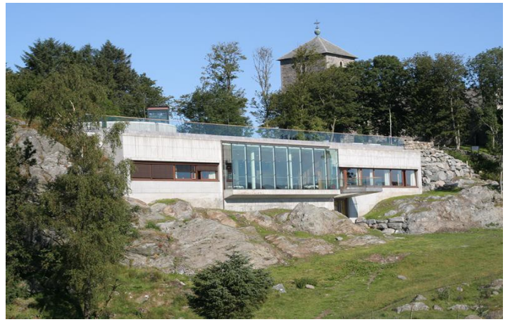
Slik ser det ut på fremsiden. Anlegget er hovedsaklig gravet ned i bakken, slik at det ikke skal virke forstyrrende på Olavskirken.

I 3000 år satt fyrster og konger på Avaldsnes og kontrollerte skipstrafikken som ble tvunget inn gjennom det smale Karmsundet - Nordvegen - den skipsleia som har gitt Norge navn. På Nordvegen Historiesenter får vi høre om de herskerne som satt og styrte Norskekysten fra Avaldsnes. Noen av de kjenner vi fra kongesagaer, heltesagaer og gamle kvad. Andre kjenner vi fra arkeologien. På Nordvegen får vi også se inn i den magiske verden som folk en gang trodde var virkelig. Vi møter seidmenn, skjoldmøyer, og norrøne guder.