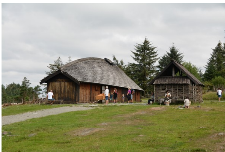
Langhuset til venstre og eldhuset til høyre. Taket på Langhuset er tekt med over 100 000 håndhugde furuspon.