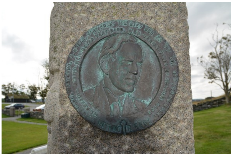
Heming R. Skre ble henrettet i Tyskland.