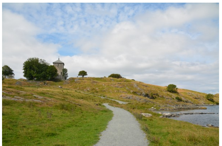
Her er vi på vei mot Vikinggarden og ser tilbake mot Olavskirken.