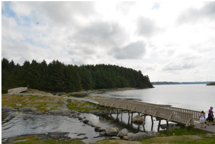
Det er laget bruer over til Bukkøy hvor Vikinggarden ligger.