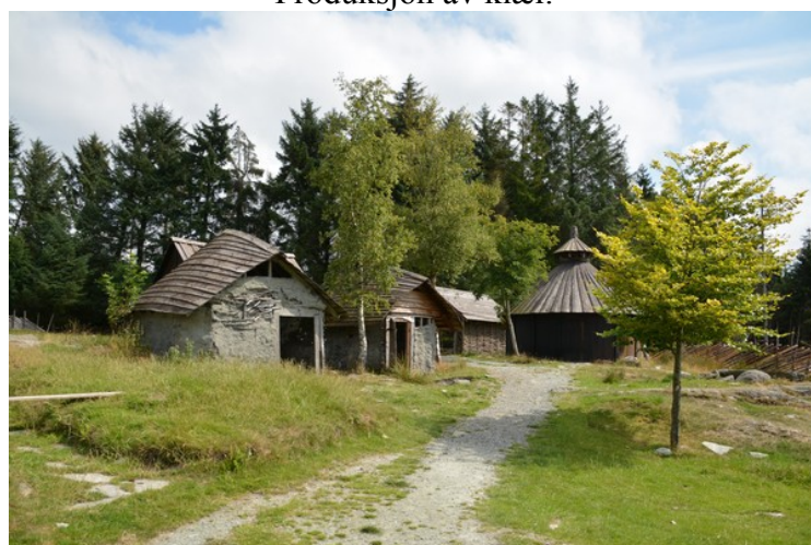
Her ser vi gropehusene bedre. Det er hus som er bygget rundt en stor nedgravning. Disse tror man er arbeidshytter som ble benyttet til forskjellige typer håndverk.