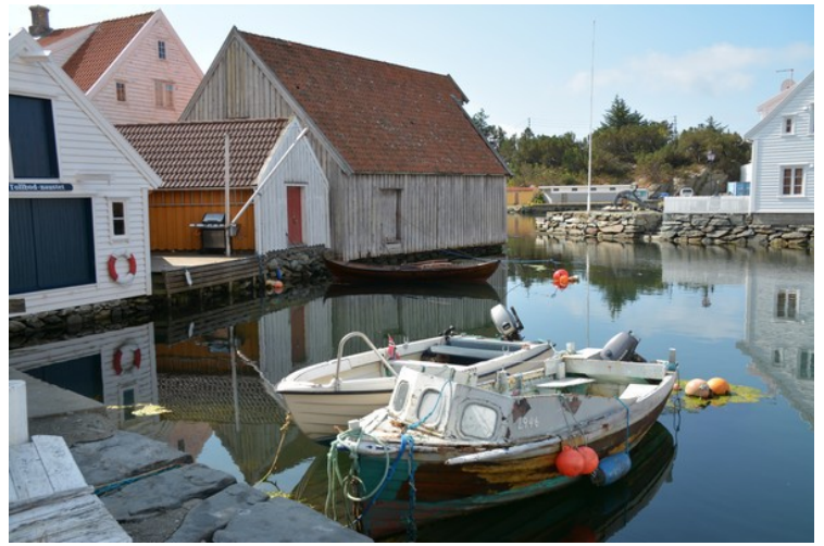
Det er mange småbåter i Skudeneshavn.