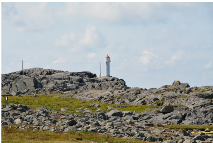
Enda litt lenger syd står dette fyret,