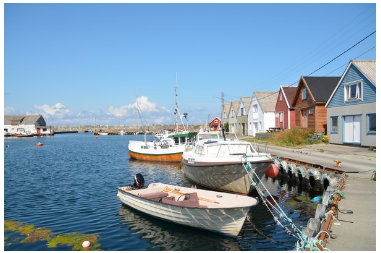
Deretter kjørte vi videre til Ferkingstad havn.