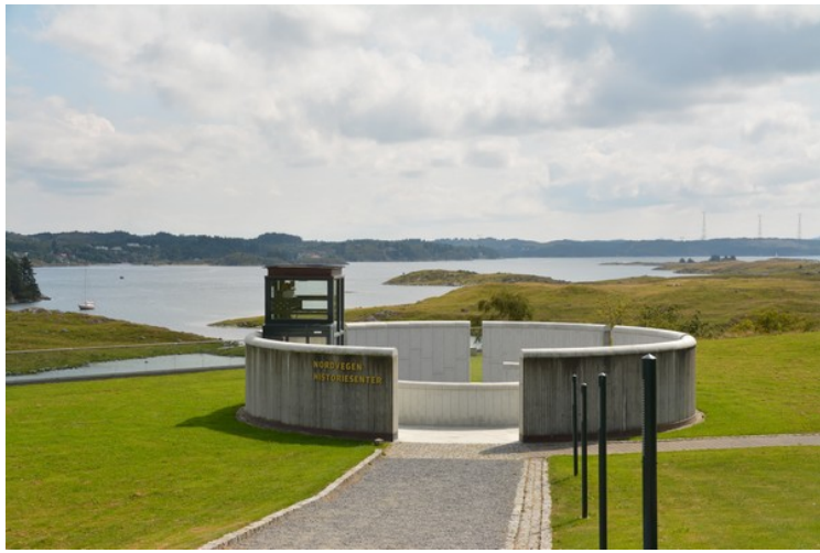
Rett nedenfor kirken ligger Nordvegen Historiesenter . Dette er et av vinduene i taket.