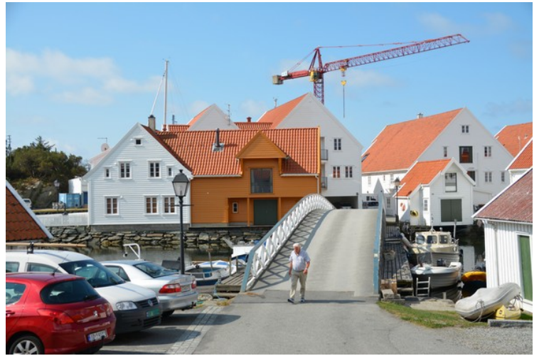
Dette er broen som går over til Vaholmen.