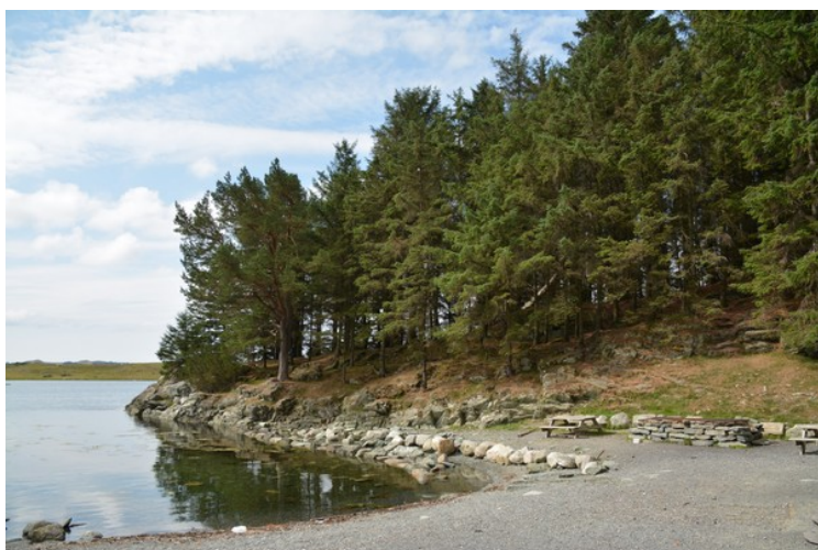
Vika nedenfor nauset.