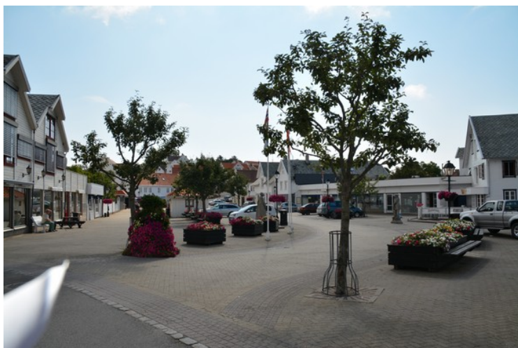
Her kommer vi til torget som ligger nede ved havnen.