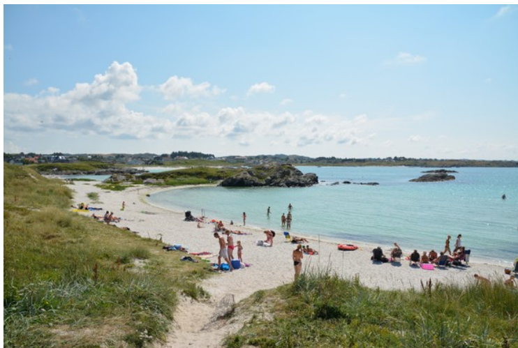
Dette er fra den nordligste biten av Åkrasanden.