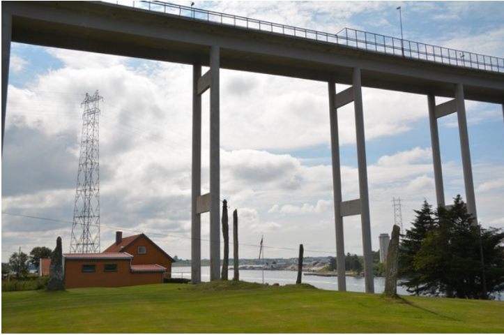
Karmøy og Avaldsnes i bakgrunnen.

En gang var Olav den hellige på vei nordfra til kongsgården ved Avaldsnes . Da han passerte Salhusstraumen fikk han se fem unge jenter som sto på stranden. De ropte til ham, og ville at han skulle komme i land til dem. Men kongen ropte tilbake at de kunne bare stå der i all sin skamløshet og vente til han kom. Da ble jentene til stein, og all tid siden har de stått og sett over mot Avaldsnes og ventet på kongen.