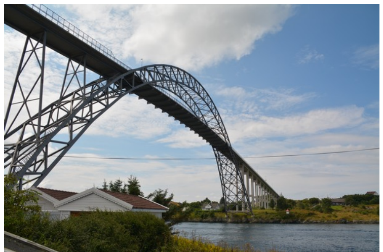
De står rett under Karmsundbrua.