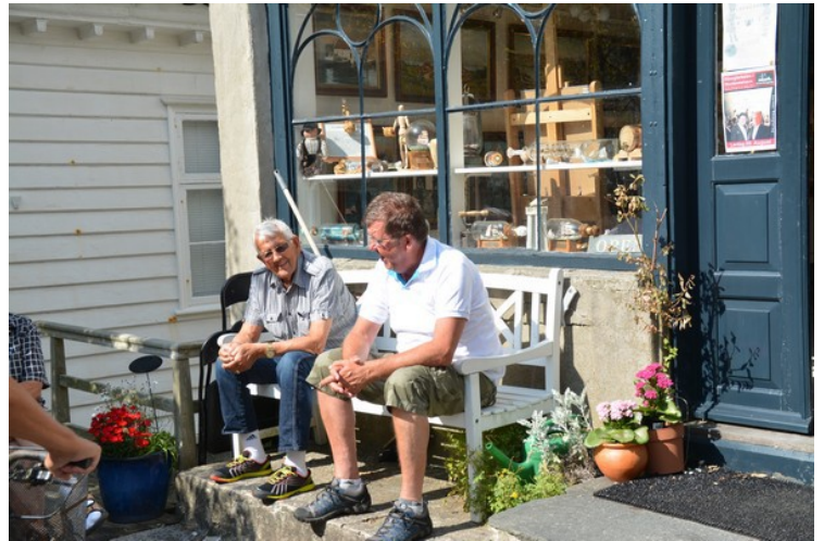
En gjeng sitter og prater i solveggen utenfor en butikk.