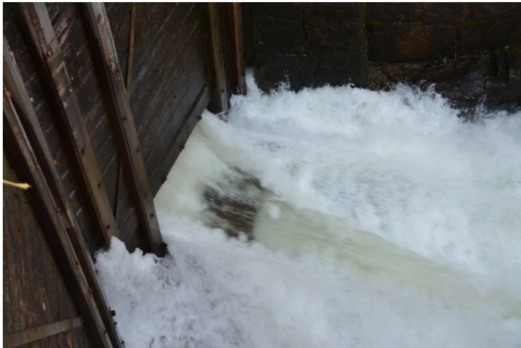
Vannspruten står langt inn i slusa.