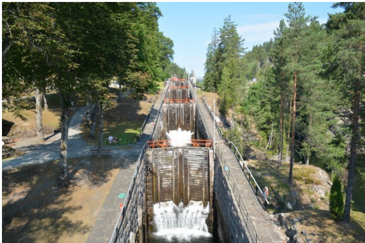
Sluseanlegget sett nedenfra. Det 5 slusekammer her.