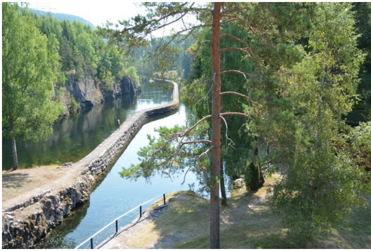
Utsikt nedover kanalen nedenfor den nederste slusa.