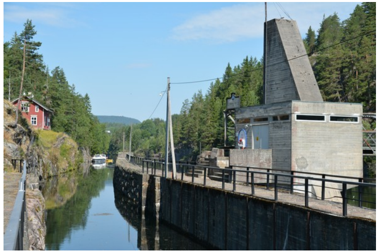
Kanalen videre fra den øverste slusen.