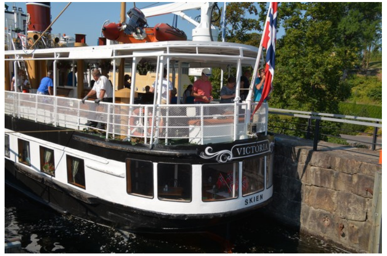
MS Victoria i slusa.