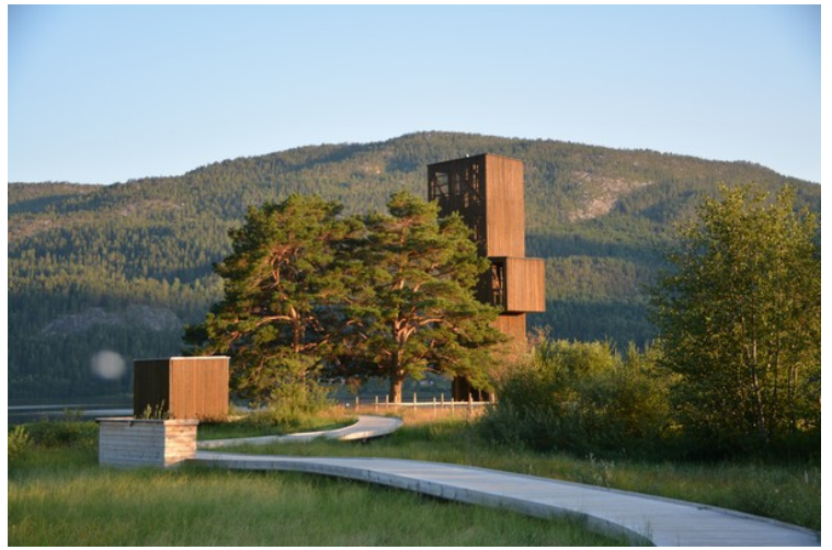
Det er til og med bygget et utkikkstårn, slik at de som er interessert kan stå der oppe for å se om de ser noen tegn til ormen.