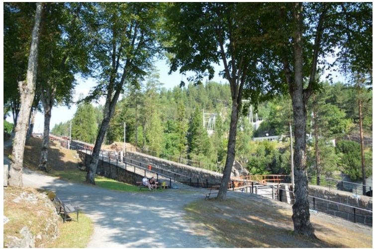
Noen av slusekamrene sett fra siden.

Dette er smia. Smia i Vrangfoss ble satt opp etter at kanalen var ferdig bygget. Den er bygget av materialrester etter anleggsperioden. Vrangfoss-smia er den best utstyrte og mest brukte smia. Det meste som opprinnelig var smidd i kanalen blir vedlikeholdt og reparert med smidde deler. Det gjelder for eksempel rekkverk, lenseklaver, og slidedeler i sluseportene. På den måten holdes det unike i kanalen i hevd.