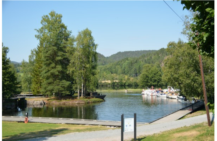
Her kommer vi til Lunde.