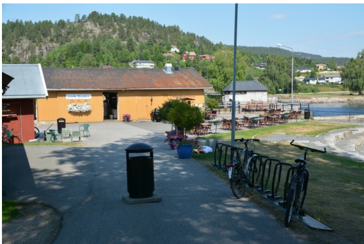
Ved Lunde sluse er det en kafe.