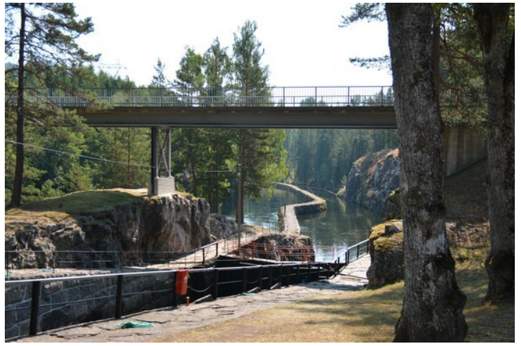
Kanalen nedenfor slusene.