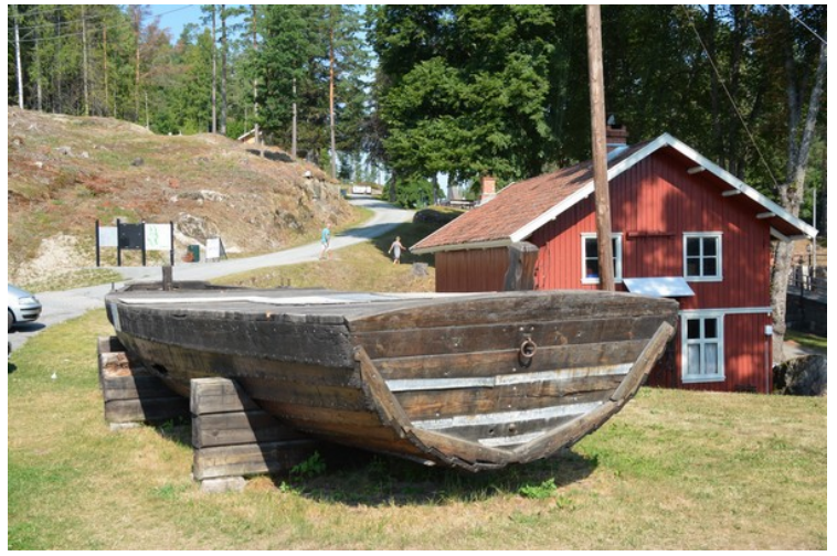
Steinferja. Byggingen av kanalen og oppdemming av vassdraget, skapte nye strandlinjer. De nye elvebreddene var utsatt for ras på grunn av båtølger og strømninger i vannet. Derfor ble deler av breddene steinsatt. Kanalens folk arbeidet i flere tiår med dette etter at kanalen var ferdig. Steinferjene ble brukt i dette arbeidet. Det var 3 stykker av dem.