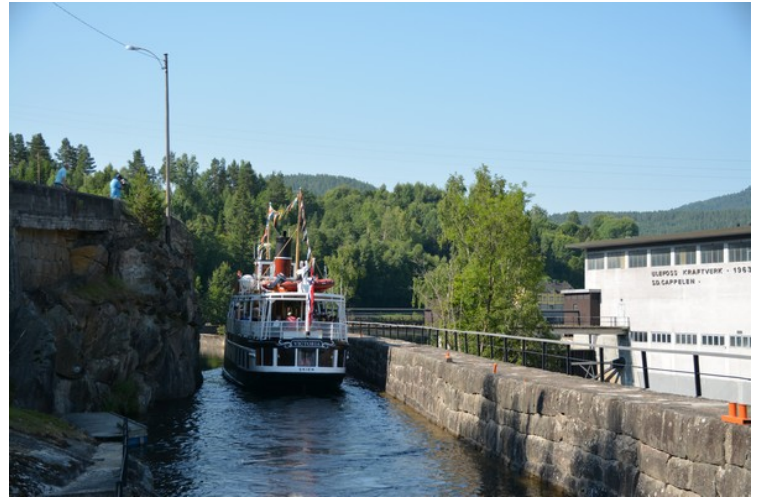
Her kjører den ut av slusa og bortover mot neste sluse.