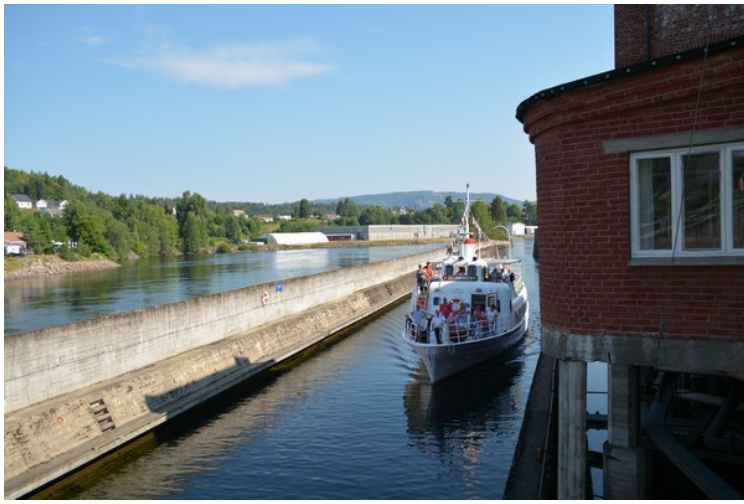
Vi er fremdeles i Ulefoss, og etter en stund kommer M/S Telemarken.