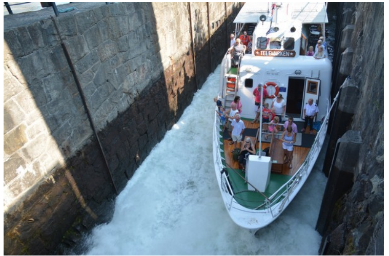
Vannet slippes inn.