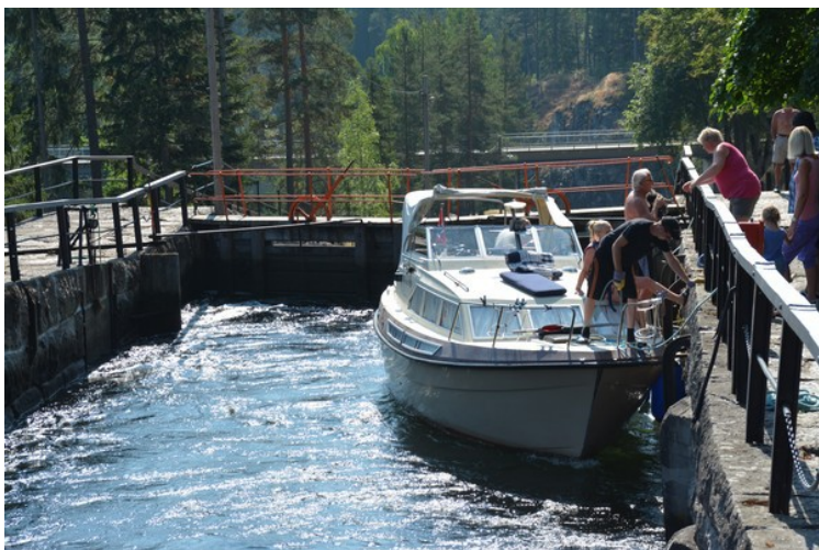
Her er en annen fritidsbåt.