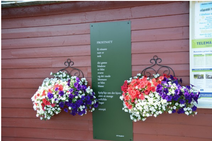
Dikt og blomster på huset ved slusa.