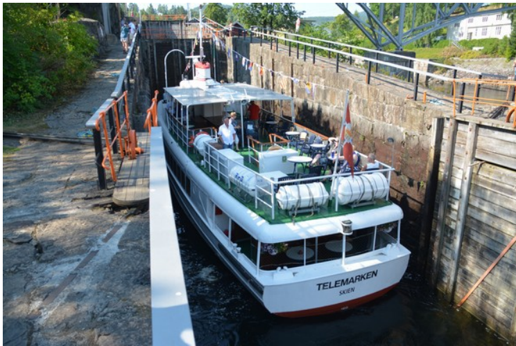
Her er den inne i slusa.