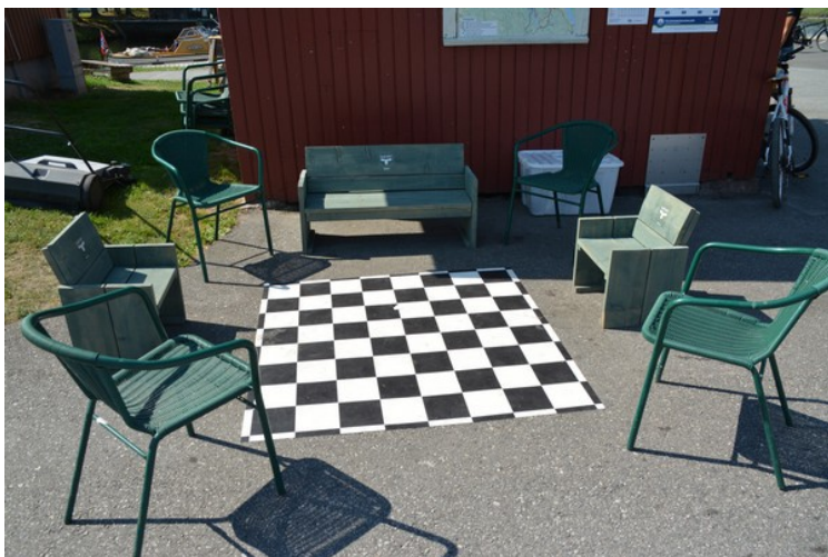
Sjakkruiter på bakken.