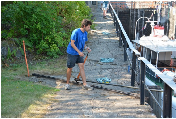
Her er den andre karen.