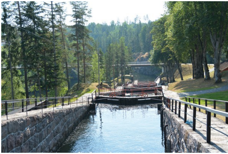
Utsikt nedover slusene.