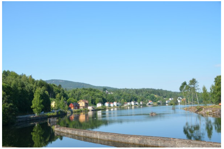
Her kjører vi videre fra Ulefoss mot Vrangfoss.