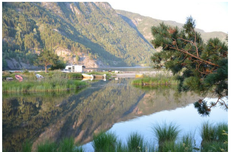
Flere utsiktsbilder ut over vannet.