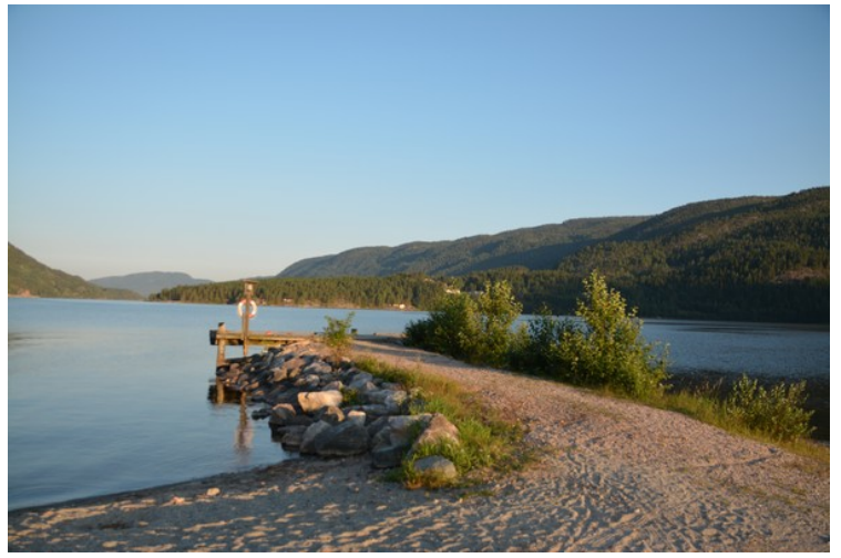
Utsikt utover vannet.