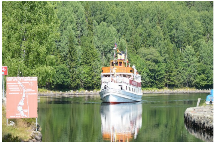
Dette er dagens siste sluse, Hogga sluse . Her får vi også sett den tredje av de båtene som går i rute på Telemarkskanalen, M/S Henrik Ibsen.