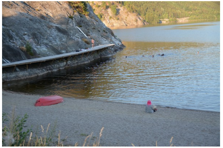
Her er det badebass med stupebrygge.