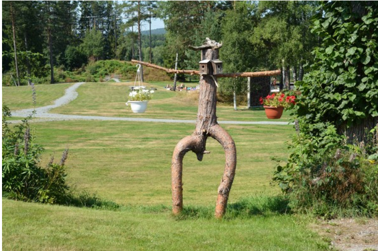
Fantasifullt blomsterstativ i Lunde.