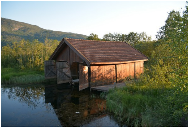
Et naust i en vik.