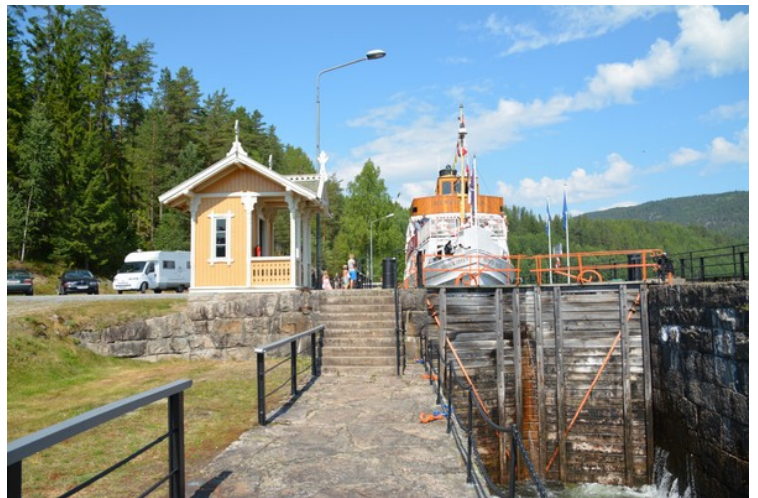
M/S Henrik Ibsen er klar til å bli sluset ned.