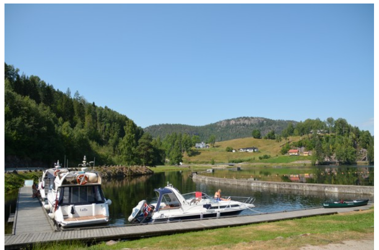
Båter som venter på å gå gjennom slusa.