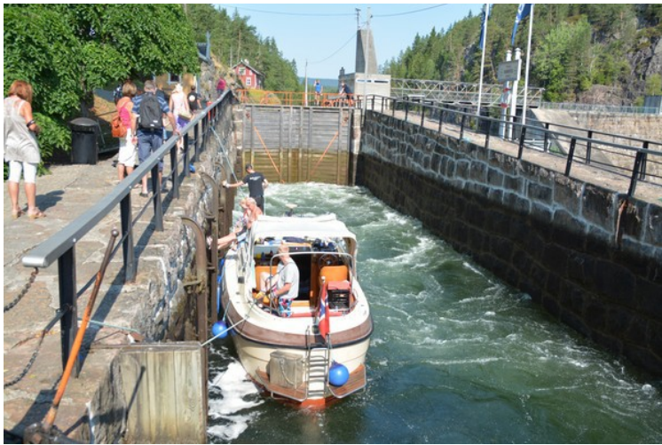
En fritidsbåt i Vrangfoss sluser.