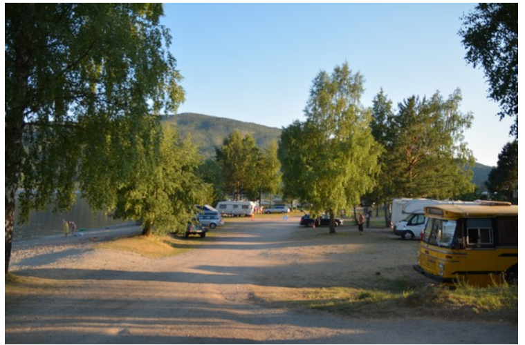
Det er idyllisk nede ved vatnet.