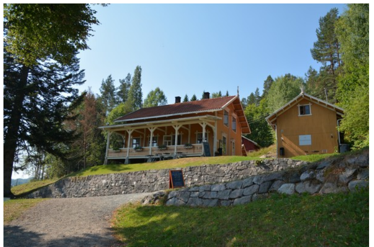
Fint hus ved slusene. Det er her slusemesteren bor.