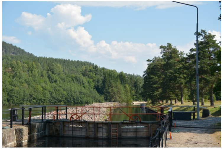
Kanalene nedenfor slusa i Kjeldal.