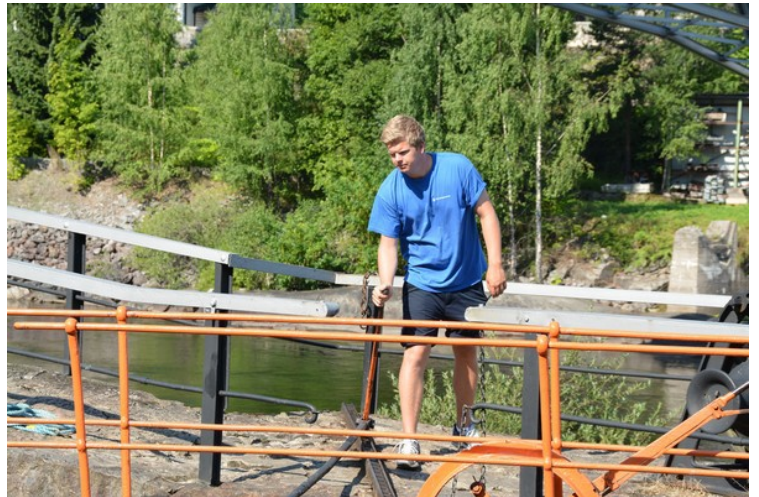
Her er en av de to som jobber med slusene.