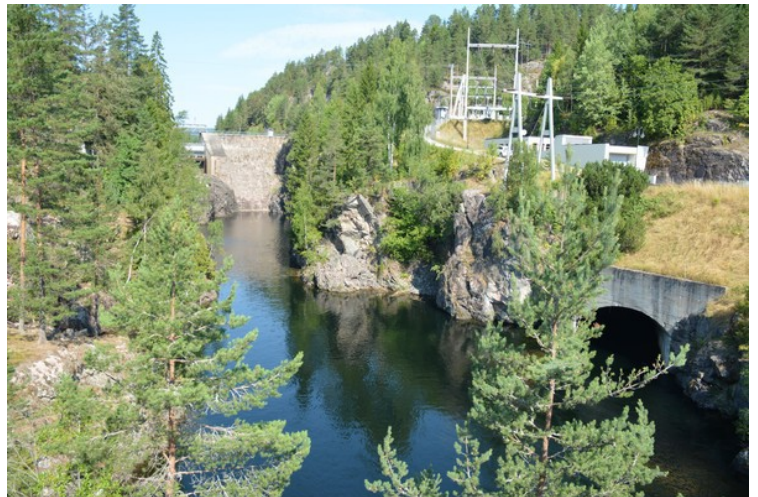
Eidselva går ved siden av kanalen. Det er en demning her og et kraftverk.