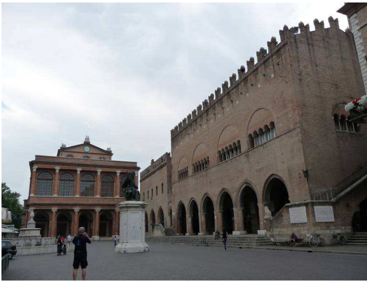
Her er vi på Piazza Cavour og ser Teatro Galli rett frem og Palazzi dell' Arengo e Podestà til høyre.