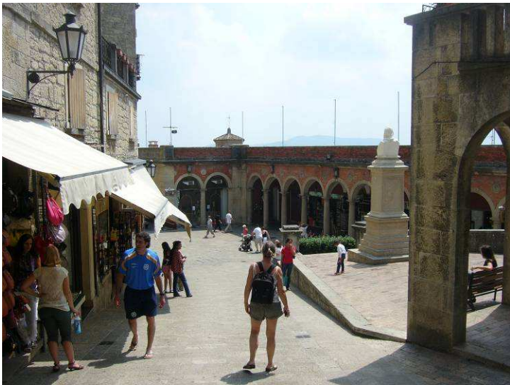
Her er vi på vei nedover i sentrum igjen