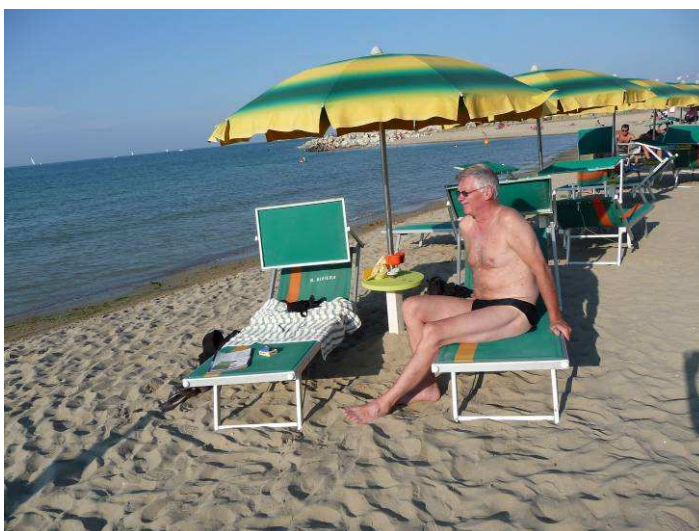
Her er vi på stranden for første gang i Rimini