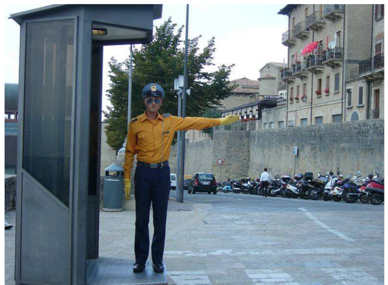
Han her sto og dirigerte trafikken hele dagen