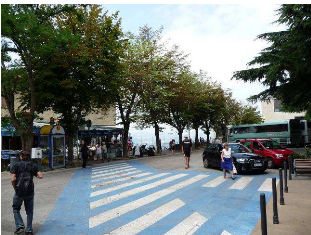
Dette er bussholdeplassen