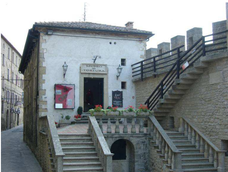
Rett innenfor porten var det et torturmuseum