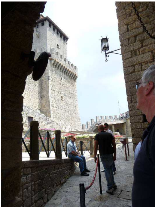
Dette er inngangen til museet og det første tårnet, Guaita.