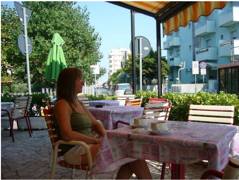
Her sitter vi ute på hotellet