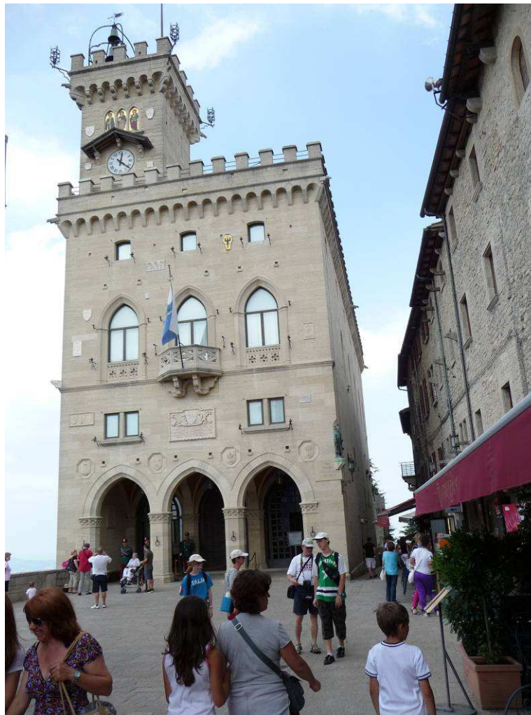
Dette er Palazzo Pubbico som er rådhuset i byen og det er også regjeringsbygningen.