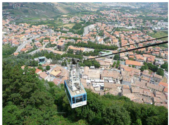
Det går taubane fra Borgomaggiore opp til San Marino