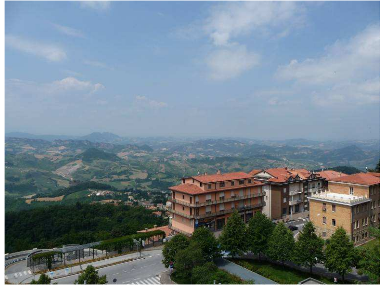
Her har vi kommet opp og ser utover