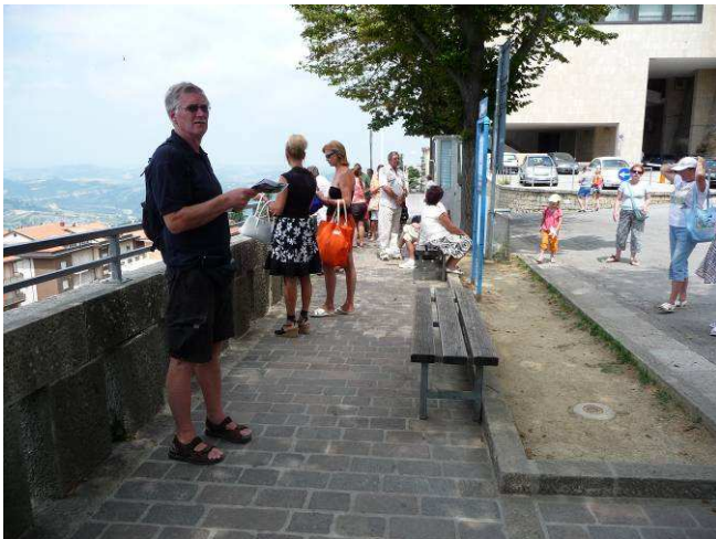
Her står vi og sjekker hva tid bussen går tilbake