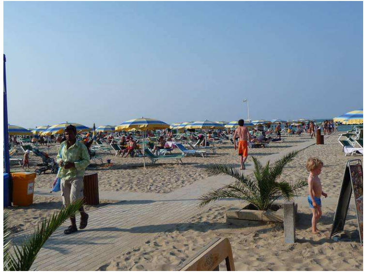
Her er vi nesten nede på stranden

I Rimini var det orkester som spilte til dans på flere forskjellige steder hver dag fra kl 20 til 24. Det var fullt av folk som stilte opp og danset, både gamle og unge, men enda flere satt og så på. Vi kunne ikke motstå fristelsen og måtte danse i et par timer. Vi hadde ikke dansesko, bare sandaler, så det ble nokså slitsomt etter hvert. På tross av dette danset vi alt som ble spilt: tango, swing, polka, vals, masurka, foxtrot, linedans, slowfox, salsa, twist ..... Det ble full pakke så vi gikk svette og slitne hjem.