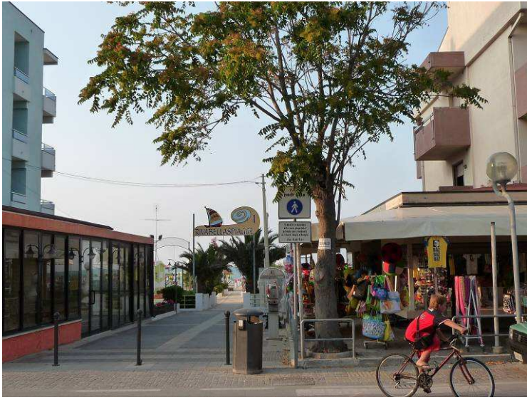
Her er nedgangen til stranden