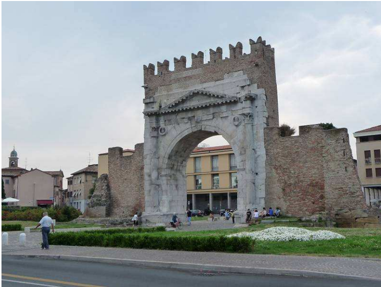
Etter at vi kom tilbake fra San Marino gikk vi av bussen ved Arco d'Augusto. Dette er en port i den gamle bymuren. Den ble bygget 27 BC.