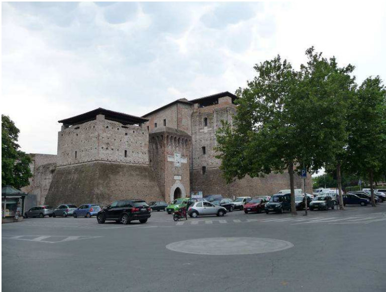
Dette er Castello Malatestiano