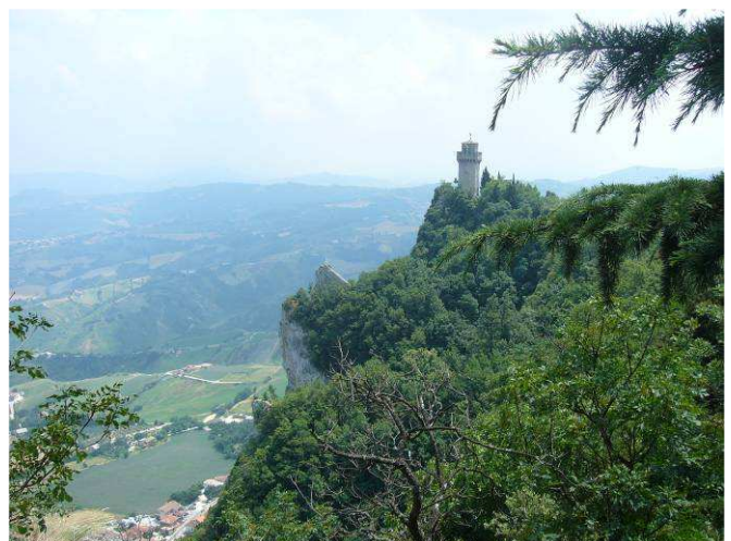
Det tredje tårnet