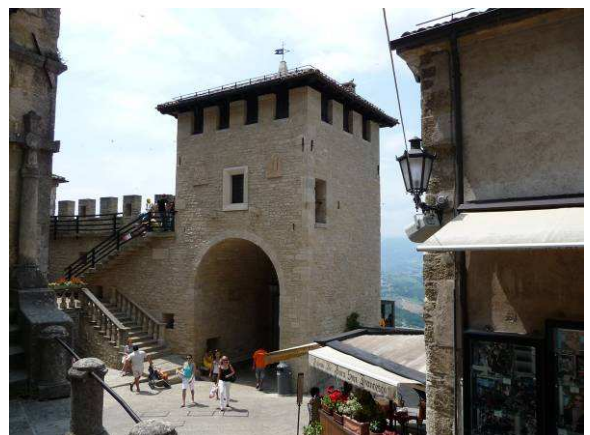
Her er byporten, Porta San Francesco, som vi nettopp har gått gjennom.