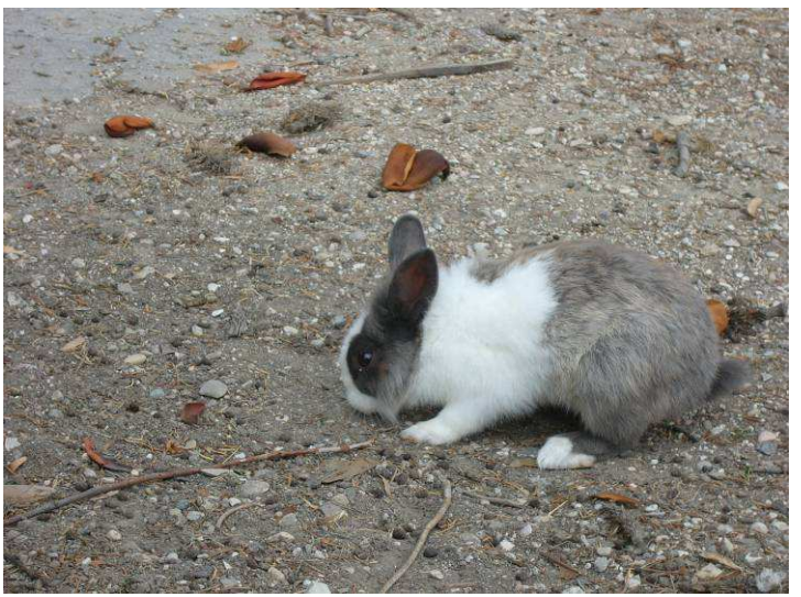
Ved Tiberiusbroen var det litt dyreliv