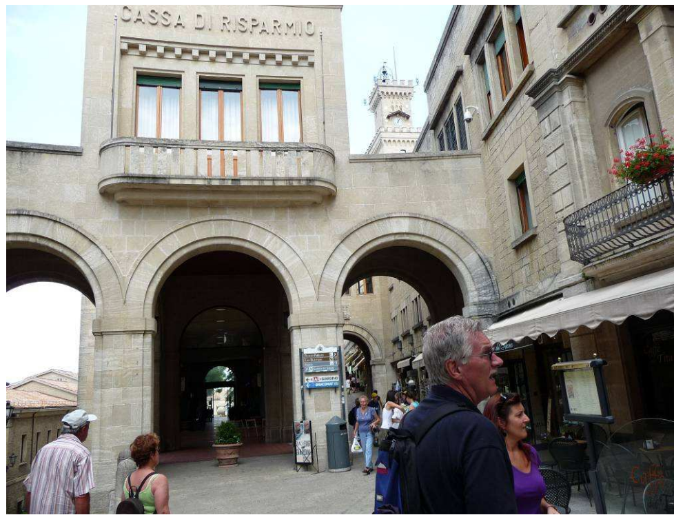
Her går vi oppover gatene. Vi ser toppen av rådhuset i bakgrunnen.