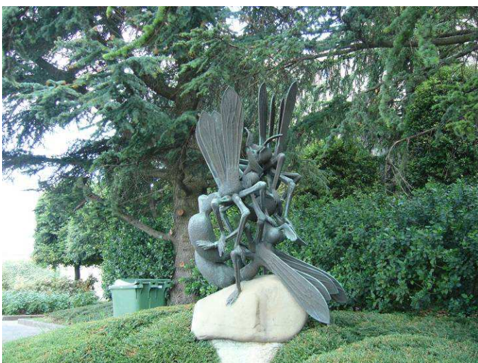
Her er 3 mygg?