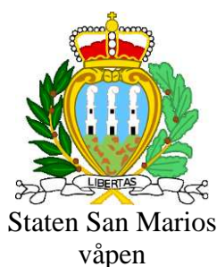
Staten San Marinos våpen