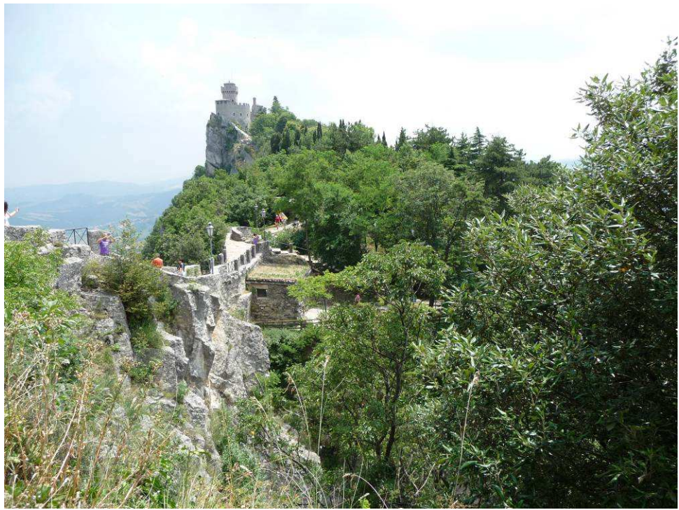
Her ser vi bortover mot det andre tårnet