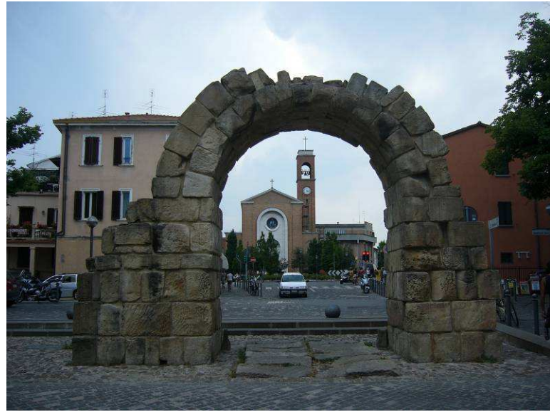
Her er vi på Piazza Mazzini og ser i retning av en kirke