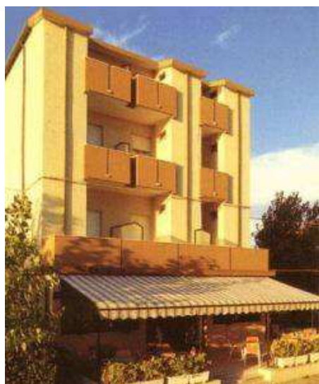
Vi bodde på Hotel Gamma

Byen var involvert i den romerske borgerkrigen og var hele tiden trofast til det regjerende partiet og dets leder, først Marius og deretter Caesar. Caesar besøkte også byen etter at han krysset elva Rubicone (50 f. Kr) og holdt si legendariske appell i byens Forum. Etter ham kom også Augustus (9 f. Kr) som senere byens borgere hedret ved å oppkalle byporten etter ham. Augustus lot bygge en bro over Marecchia. Broen ble senere ferdigstilt av Tiberius som ga broa sitt navn. I denne perioden ble flere prestisjebygninger bygd som Amfiteateret og San Stefano-kirken.