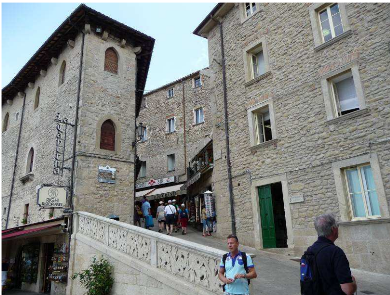
Det er bratte gater oppover