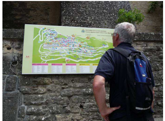
Kjell studerer kartet