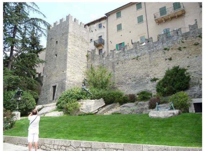
Det er festningsmurer rundt hele byen