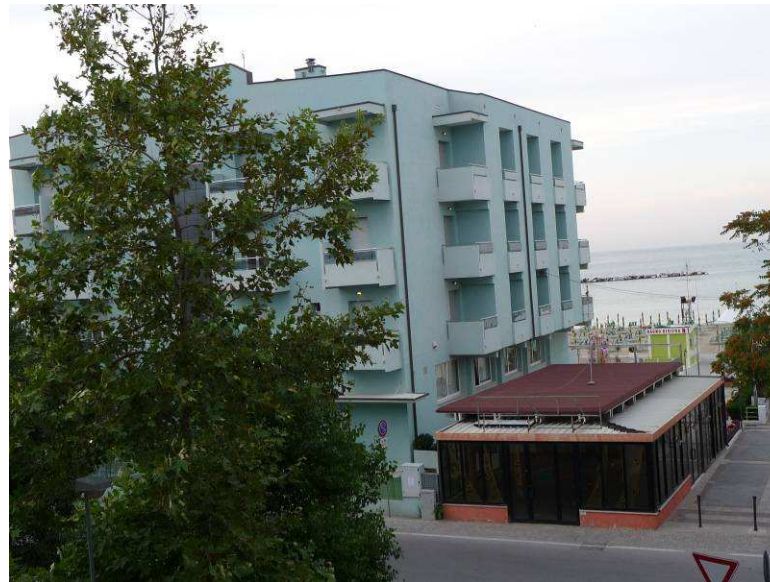
Her er utsikten fra balkongen vår