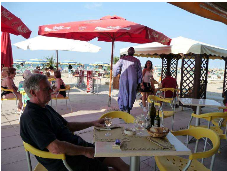
På denne strandbaren spiste vi lunsj et par ganger