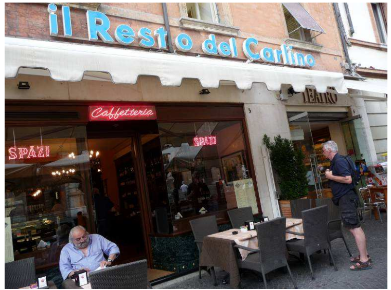
På samme plassen spiste vi lunsj på denne restauranten