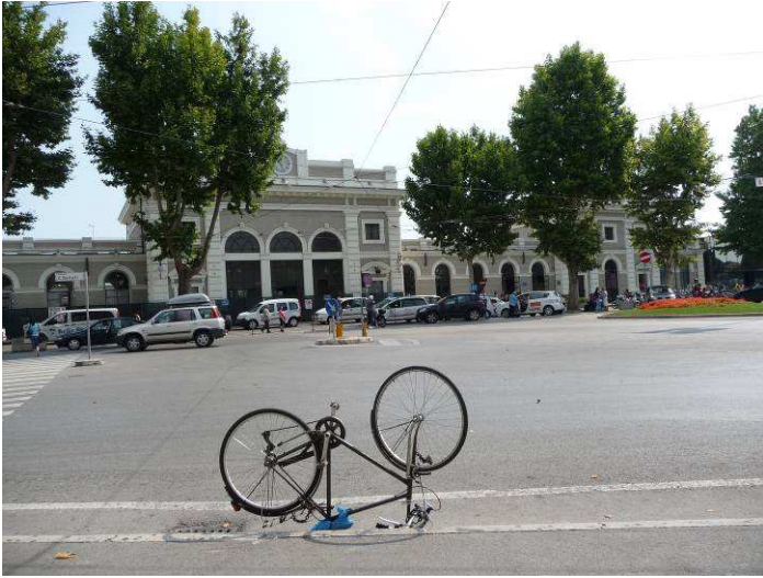
Her sitter vi og venter på bussen som skal til San Marino. Her er det en kar som parkerte sykkelen.

301, og gruppen søkte tilflukt på Monte Titanos skråninger. Her grunnla de et samfunn, som etter hvert ble til en stat. Denne staten ble oppkalt etter grunnleggeren, som senere ble helgenkåret. Byen var derpå i lang tid tilfluktssted for andre kristne som flyktet fra de romerske forfølgelsene. Dermed ble byen den eldste republikken i Europa, idet territoriet San Marino på den tid tilsvarte dagens by.