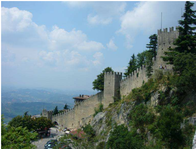
Her ser vi tilbake. Det første tårnet ligger bak murene.