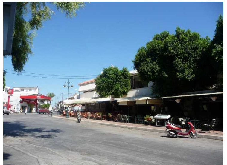
På andre siden av gata er det en hel rekke med restauranter.