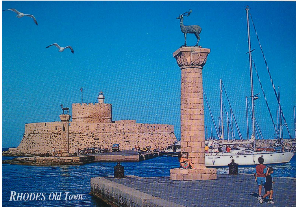
RHODES Old Town