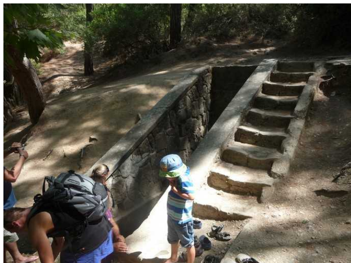
Fra en av kildene er det laget en tunnel ned til en liten oppdemmet sjø.