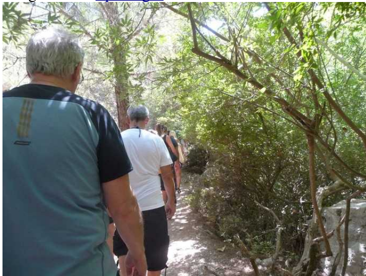
Her er vi på vei fra bussen oppover mot de 7 kildene. Det gikk en sti gjennom tett småskog.

Etter at vi hadde vært på Lindos, stoppet sightseeing-bussen ved noen kilder før vi kom til Afandou. Det er 7 kilder her og de heter Epta Piges .