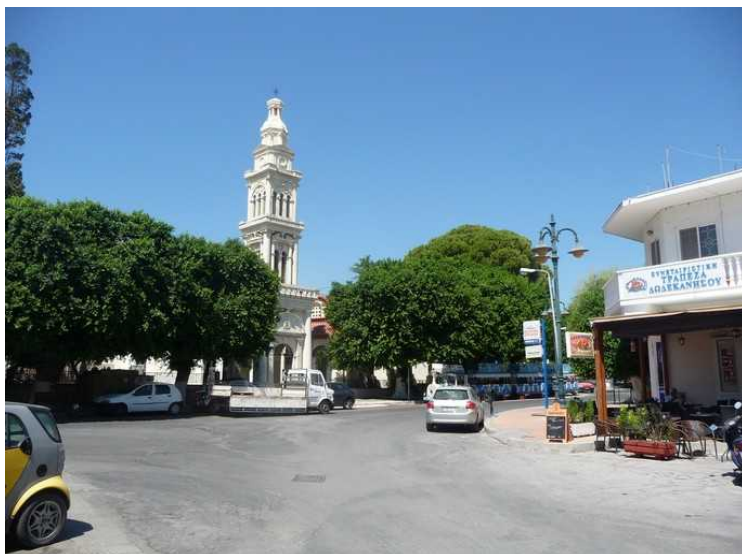
Etter at vi hadde vært ved de 7 kilder, gikk vi av bussen utenfor Afandou , og gikk inn til sentrum.