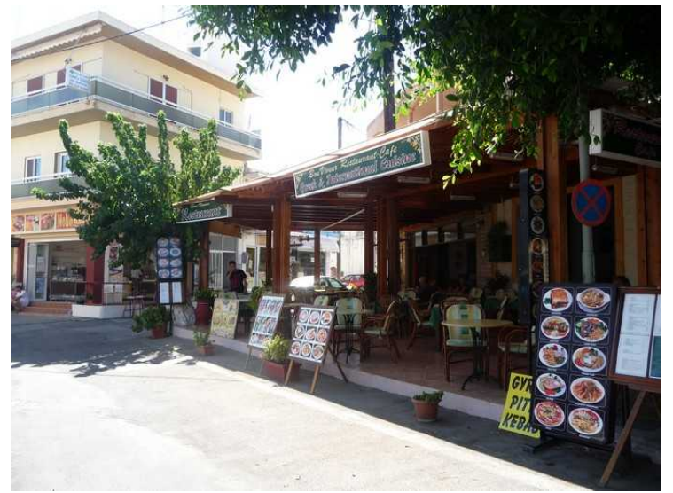
Bilde av restauranten tatt fra gata.