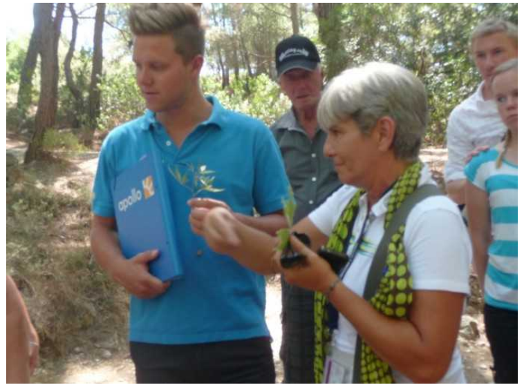
Dette er Apollo-guiden og en lokal guide som var med oss.

Dette er åpningen av tunnelen. Den er mulig å gå gjennom tunnelen. Den er 150m lang, og det er ikke lys. Dessuten må man vasse i bekken som renner gjennom.