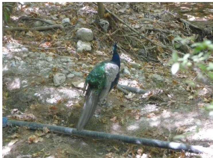
Nærbilde av en fasan.