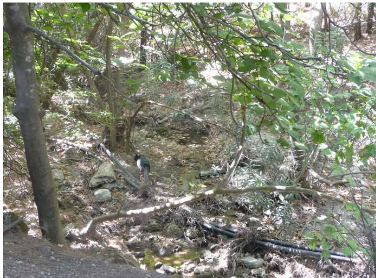
Det var fasaner i skogen.