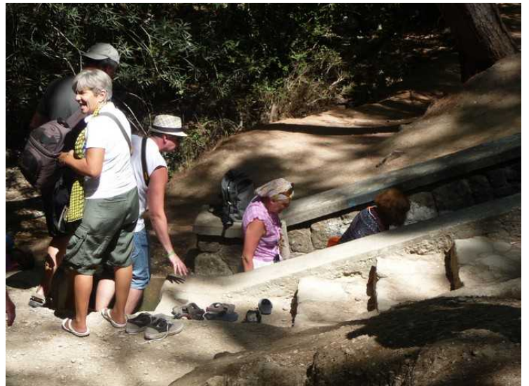
Disse er på vei inn i tunnelen.