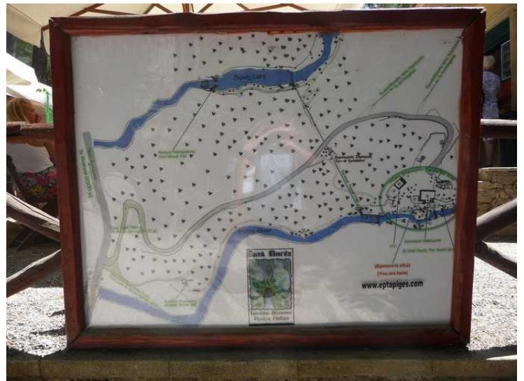
Kart over området.