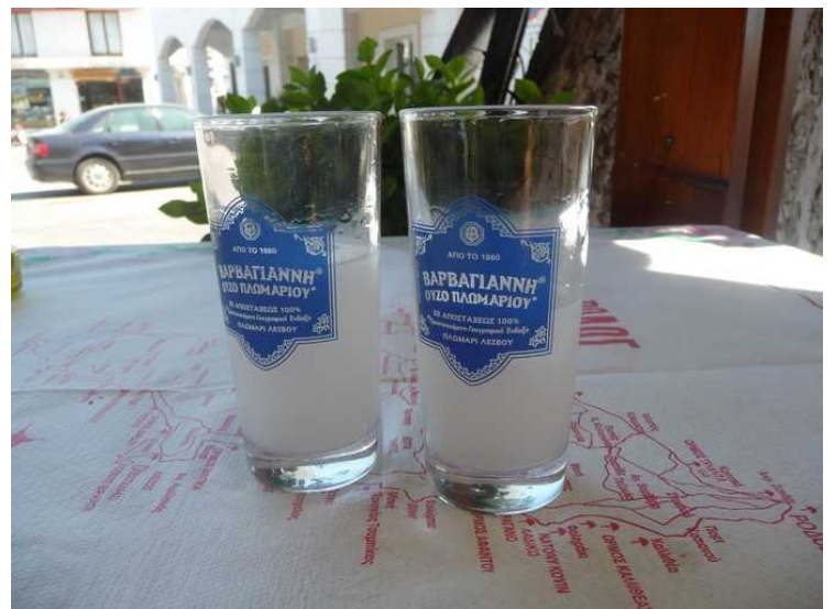
Vi hadde en matbit på en restaurant i sentrum. Da vi skulle betale regningen fikk vi en Ouzo «on the house»