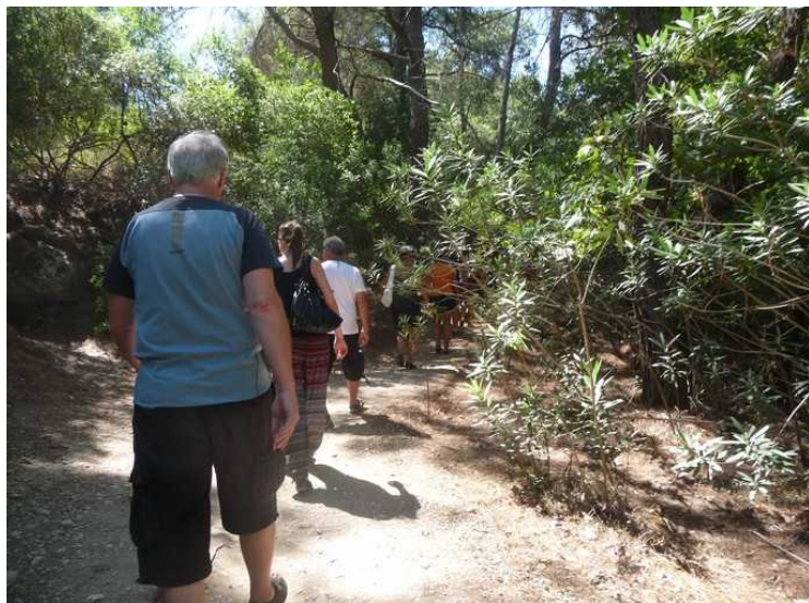
Stien var ganske brei noen steder.