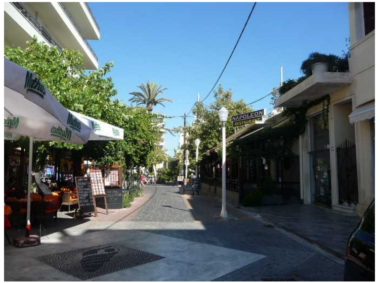
Inne i Rhodos by igjen. Den siste kvelden spiste vi på Napoleon restaurant til høyre.