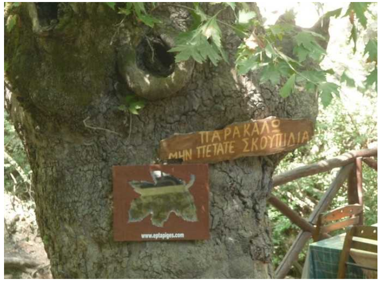
Skilt på et tre.