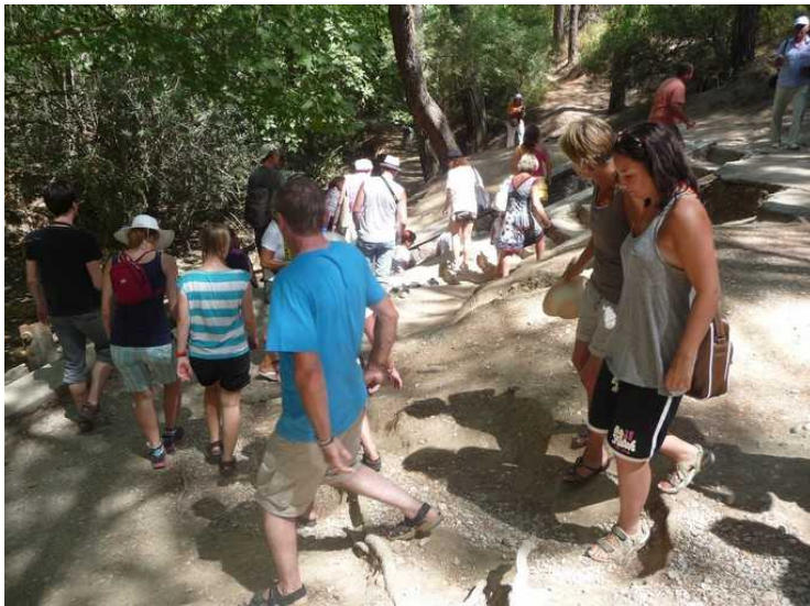
Disse gjør seg klar til å gå gjennom tunnelen.

Dette er åpningen av tunnelen. Den er mulig å gå gjennom tunnelen. Den er 150m lang, og det er ikke lys. Dessuten må man vasse i bekken som renner gjennom.