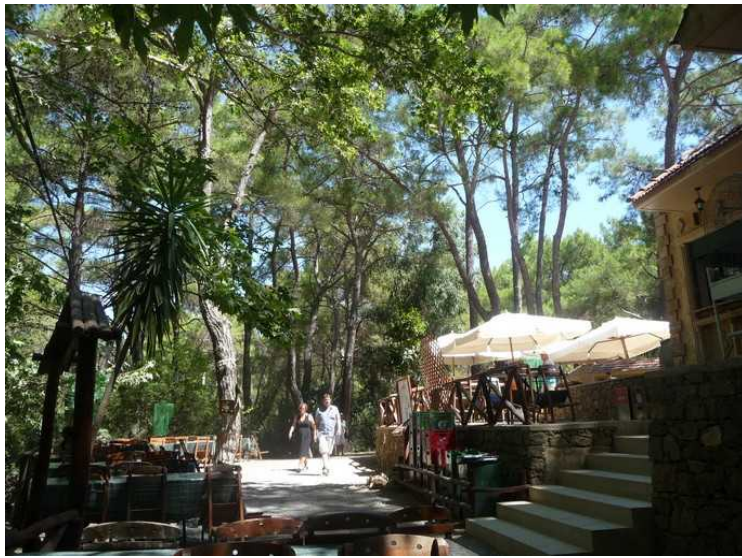
Vi satte oss på denne restauranten.