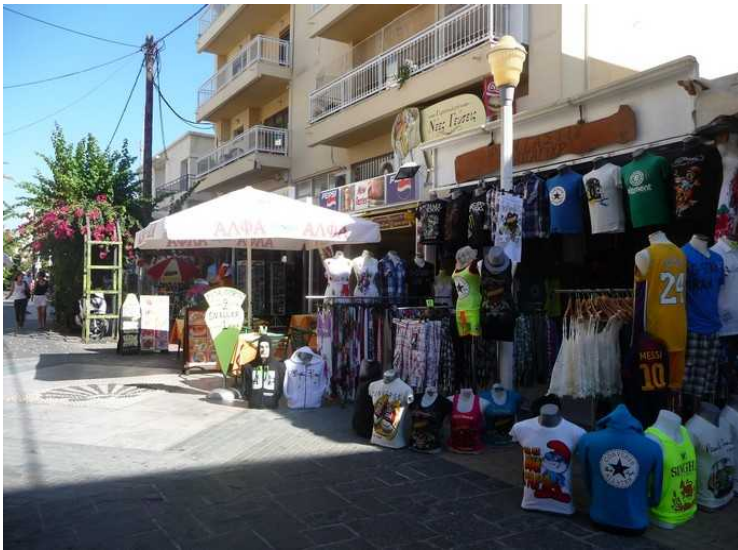
Bilder fra gågata i nybyen.