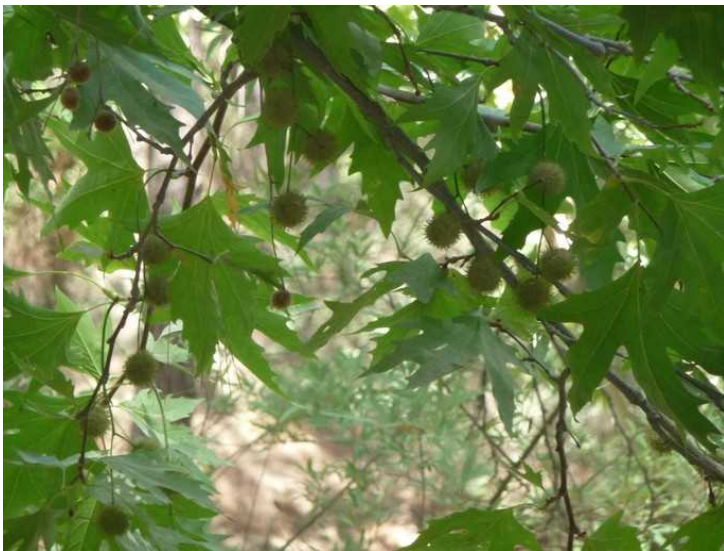
Et platan -tre med piggete frukter.