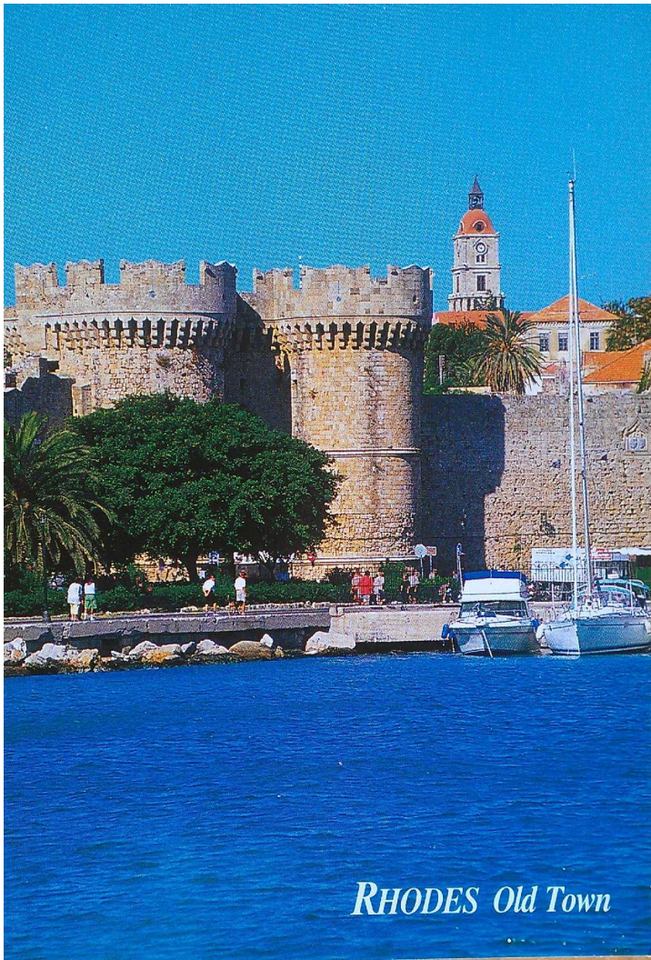
RHODES Old Town