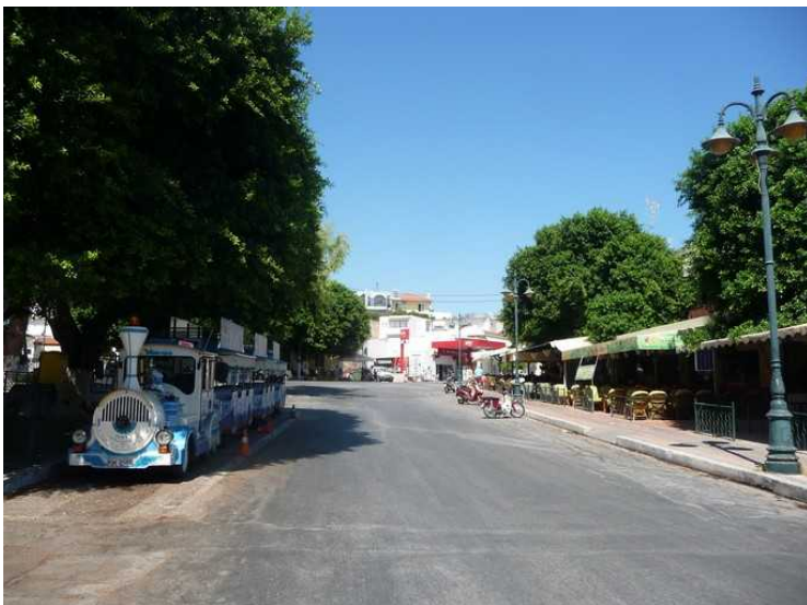
Hovedgata i sentrum med turisttoget.