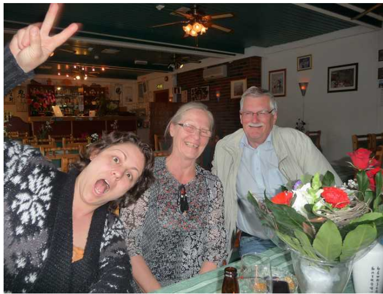
Her blir det liv i leiren.