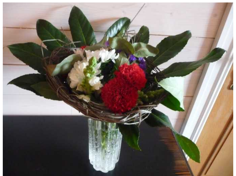
Det ble blomster også fra Silja og Erik.