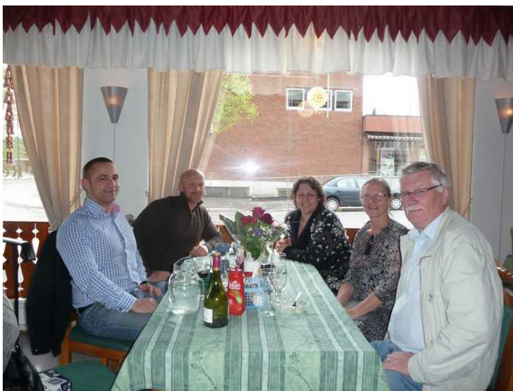
Her har vi roet oss ned igjen.