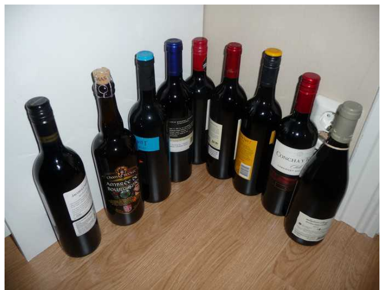
Vin fra ungene mine.