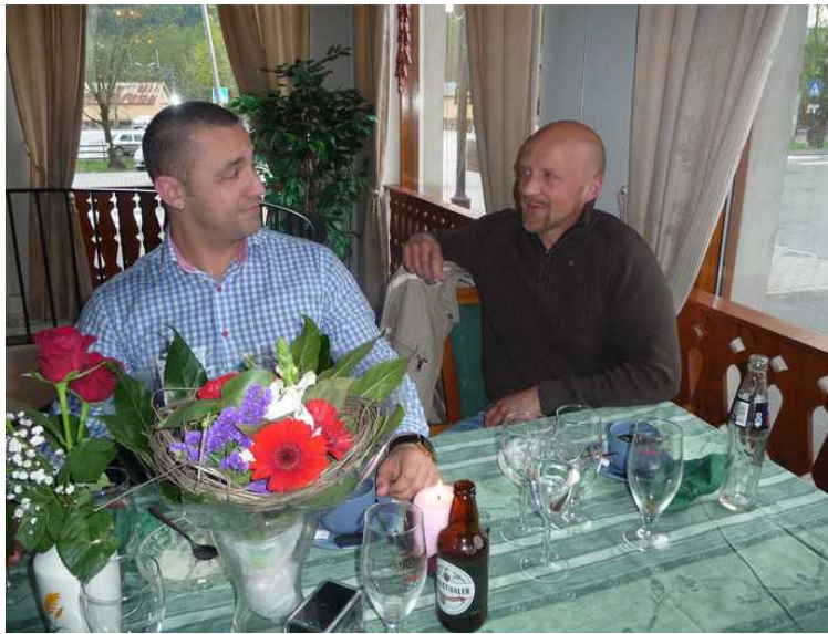
Isak ser skeptisk ut.