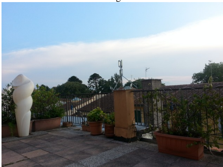
Etter at vi hadde spist gikk vi tilbake til hotellet hvor vi hadde takterrassen for oss selv.