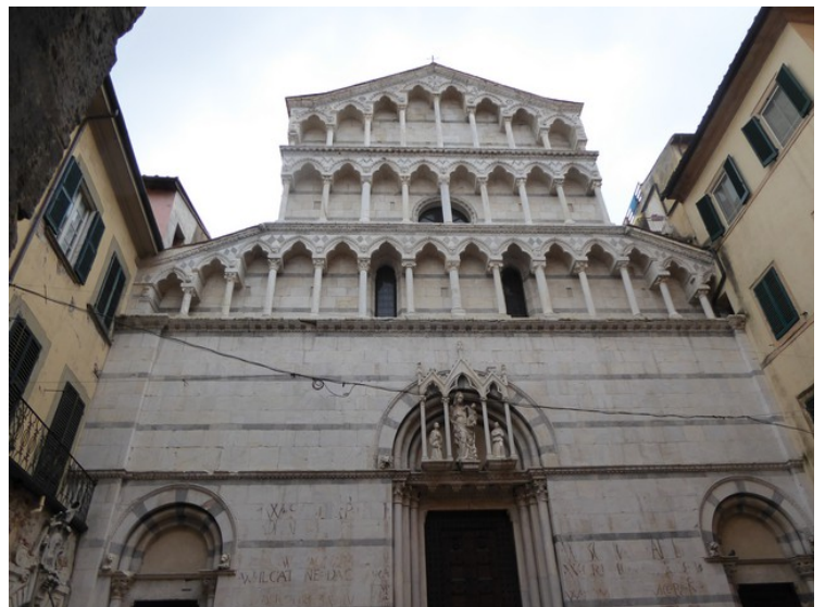
Fronten på en katolsk kirke som heter San Michele in Borgo .