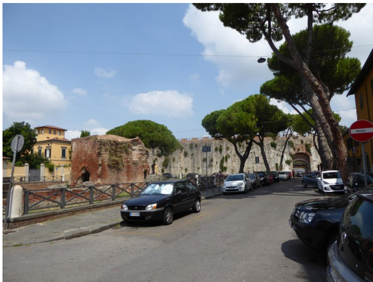
Etter pausen gikk vi til endes av gata. Da kom vi til bymuren.