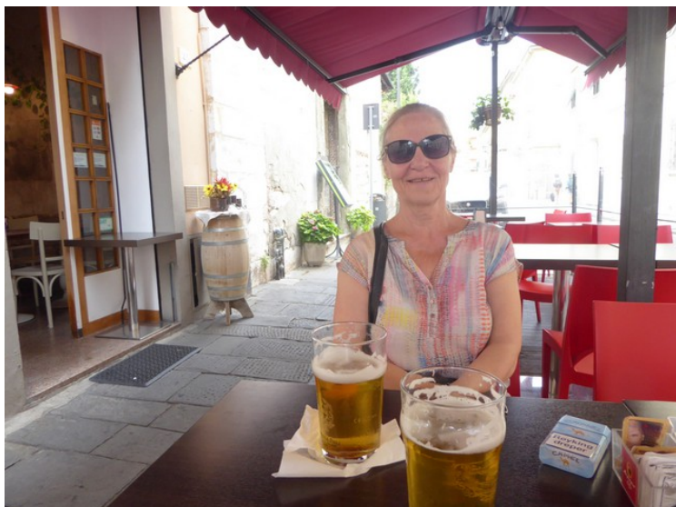
Nå var det tid for en øl.