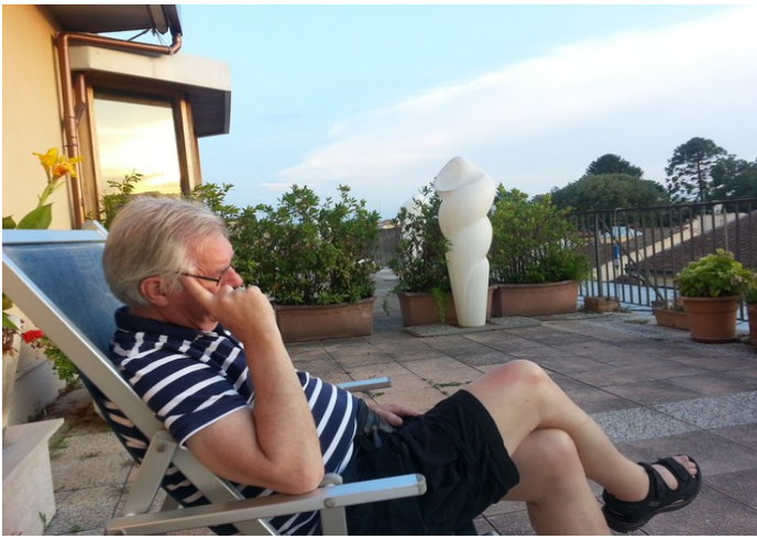
Jeg ble snikfotografert.