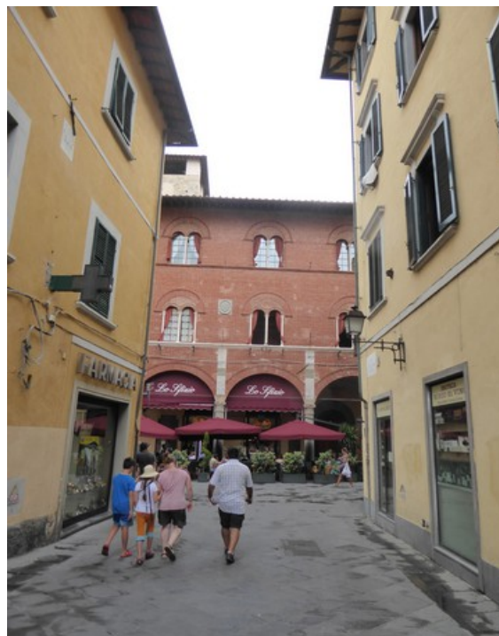
Så kom vi til Via Guglielmo Oberdan . Vi gikk først til høyre der.