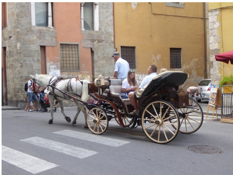
Det var populært med hestedrosje. Vi så mange av dem de dagene vi var i byen.