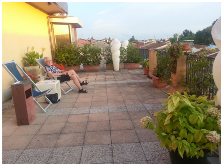
Her sitter jeg.