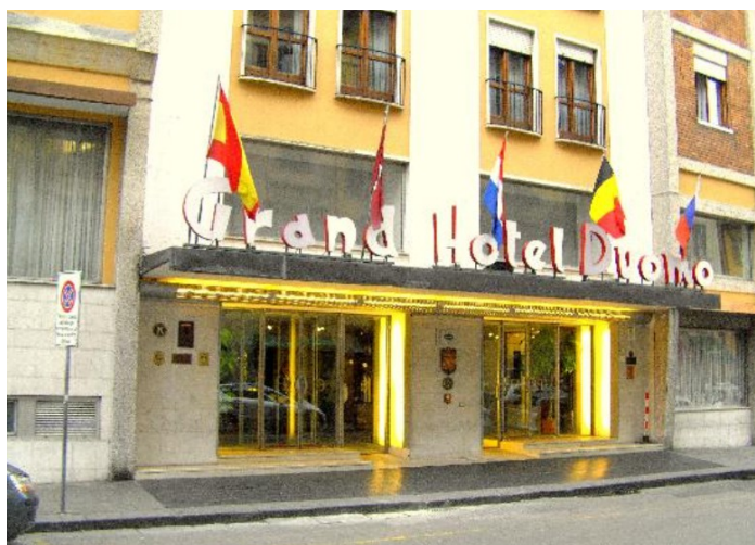
Vi hadde bestilt på et hotell som heter Grand Hotel de Duomo .