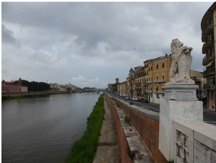
Her ser vi i motsatt retning.