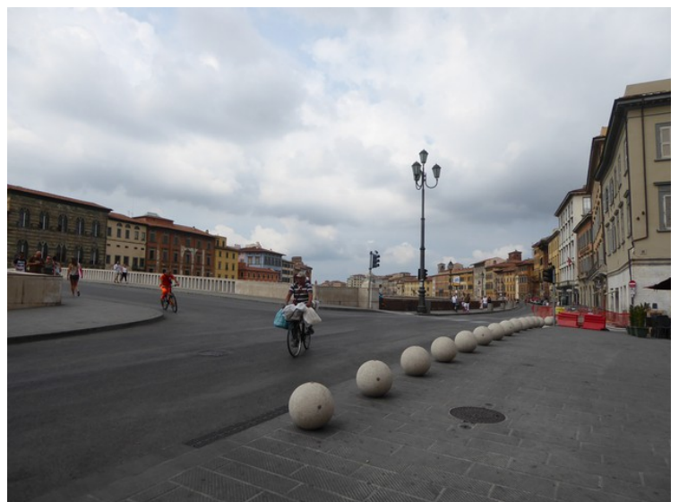
Utsikt fra Piazza Garibaldi nedover elva Arno.