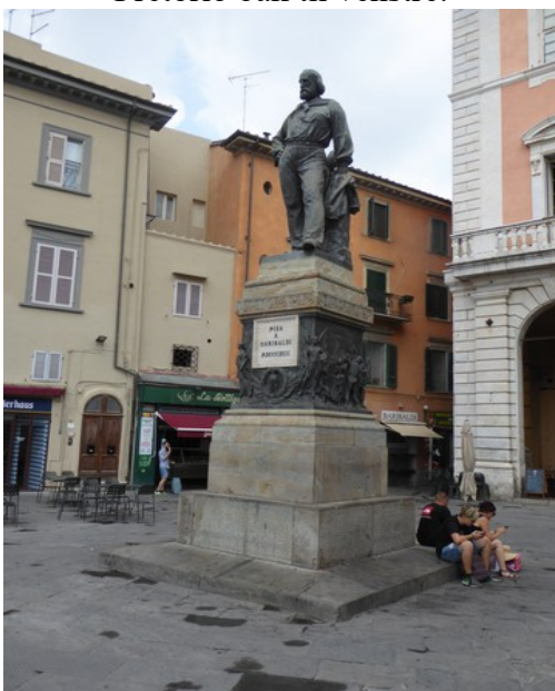
Dette er Piazza Garibaldi med en statue av Giuseppe Garibaldi . Han var en av de mest sentrale personene under samlingen av Italia.