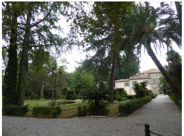
Lenger borte på Via Roma kikket vi inn i den botaniske hagen .