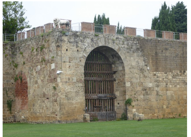
Dette er den gamle porten, Porta del Leone , Løveporten.