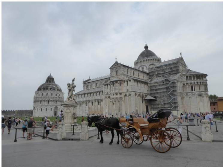
Domkirken og dåpskapellet.

Byggingen av tårnet ble startet 8. august 1173. Det ble bare laget et tre meter dypt fundament, og grunnen er svak og ustabil. Derfor begynte tårnet å helle nokså tidlig. I 1178 ble byggingen stoppet på grunn av at Pisa var i nesten konstant krig med Genova, Lucca og Firenze. Det gikk nesten 100 år til byggingen startet igjen, i 1272. Da ble de neste etasjene bygget i en vinkel for å kompensere for skjevheten. Byggingen stoppet igjen i 1284. Den siste etasjen ble ikke bygget før i 1372. I januar 1990 fant man ut at tårnet måtte stenges for publikum. Klokkene ble fjernet, og tårnet ble forankret med kabler rundt tredje etasje. Hus og leiligheter i risikozonen ble evakuert. Etter stabiliseringsarbeidet ble tårnet igjen åpnet for publikum 15. desember 2001.