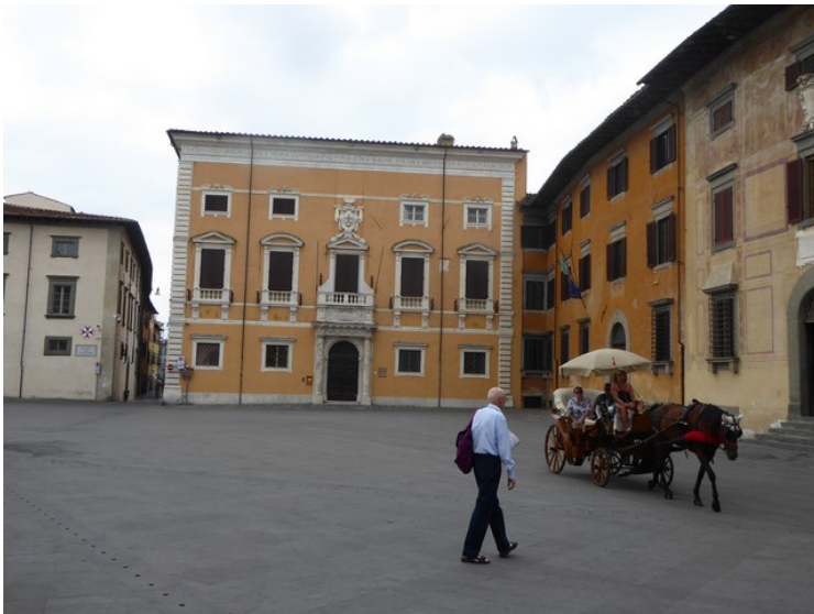
Dette er Palazzo del Consiglio dei Dodici .