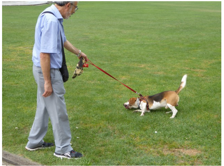
Her er en som går tur med hunden.