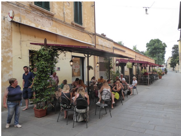
I sidegaten Via Angelo Galli Tassi er det et par restauranter.