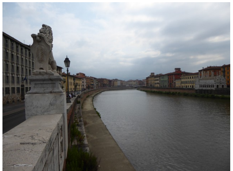
Så kom vi ned til elven Arno . Vi står på broen Ponte Solferino og ser nordøstover.