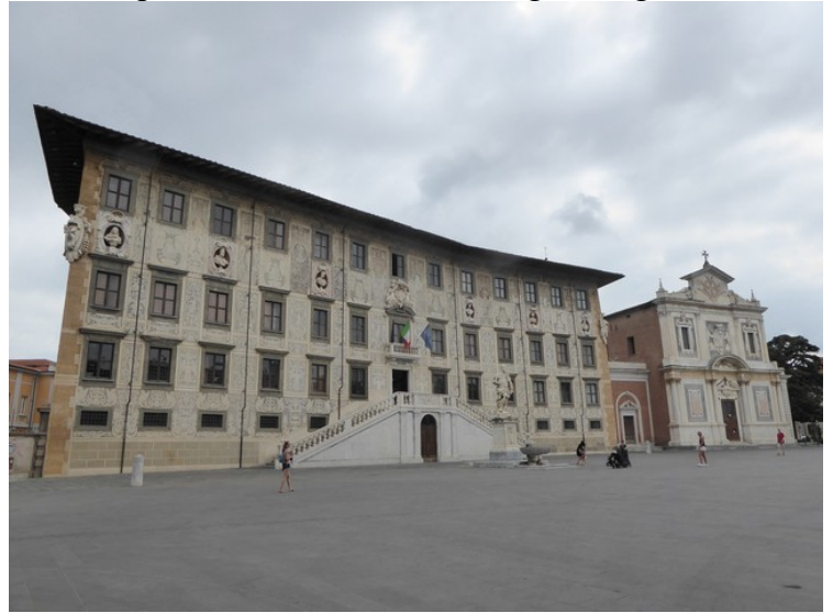
Så kom vi til Piazza dei Cavalieri . Her var det politiske sentrum i middelalderen. Vi har Palazzo della Carovana til venstre. Det er en skole der i dag, Scuola Normale Superiore. Kirken Santo Stefano til høyre.