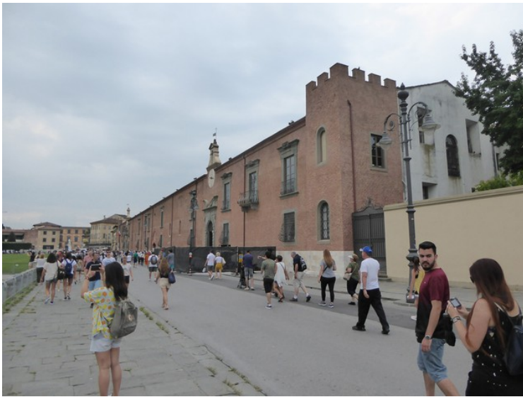
Dette er Sinopie Museum .