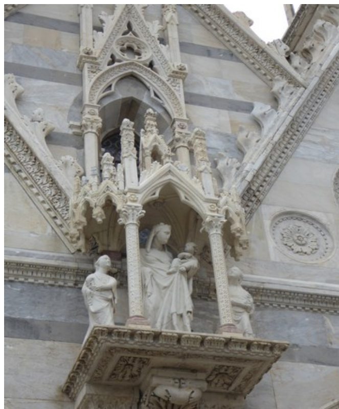
Figurer på frontveggen på kirken.

Kirken var kjent for å ha en torn fra Jesu tornekrone, men etter en ombygging av kirken ble tornen flyttet til Chiesa di Santa Chiara.