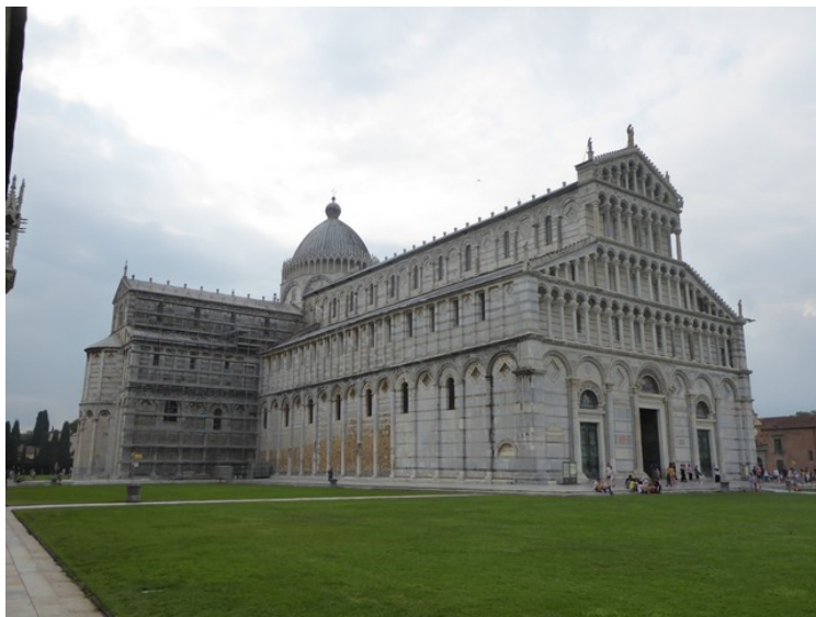
Domkirken sett fra nordvest.