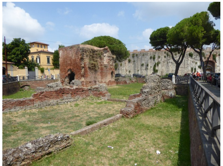
Her ligger badene til Nero .