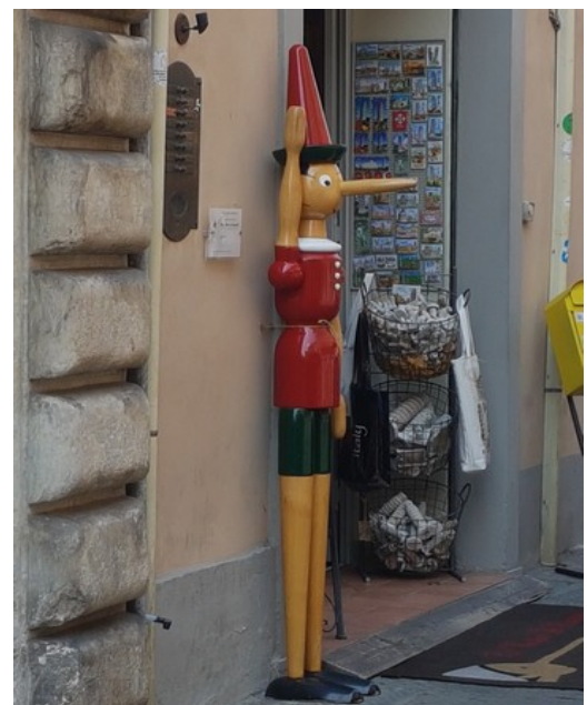
Utenfor butikken ved siden av restauranten oppdaget vi Pinocchio .