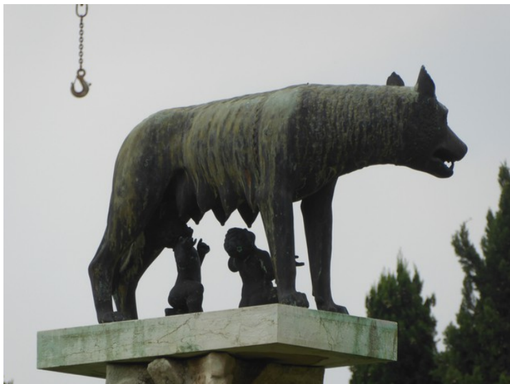
En statue av ulven med Romulus og Remus står på plassen øst for domkirken.