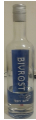
Vi hadde kjøpt Bivrost på flyet. Det er en gin som er produsert i Troms. Den var ganske god.