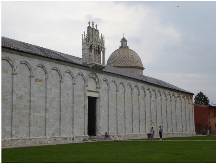
Nord på Piazza dei Miracoli ligger kirkegården Campo Santo .