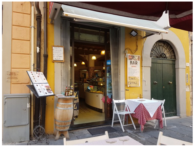
Om kvelden ville vi gå til Osteria i Santi, men de hadde ikke åpnet enda, så vi satte oss på denne restauranten rett ved siden av, Ristoro Pizzeria Bar la Terrazza Pisa. Vi angret etterpå for det var en skuffende opplevelse.