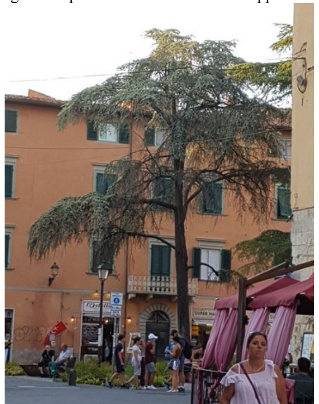
Det samme var utsikten.