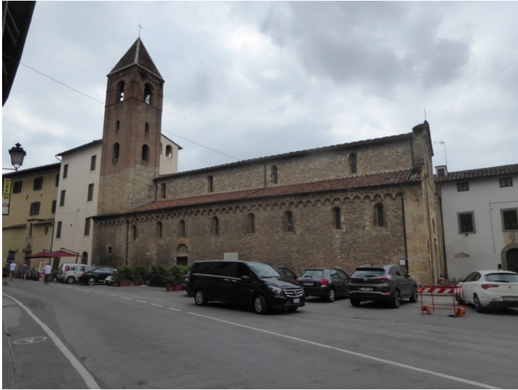
Neste dag, på søndagen, gikk vi en ny sightseeingtur. Dette er kirken San Sisto .