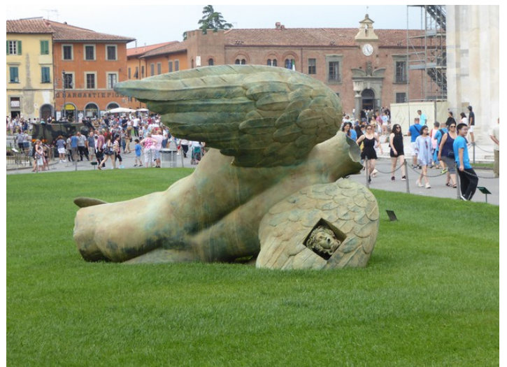
En fallen engel med skade på vinger og hode. Den er laget av Igor Mitoraj .