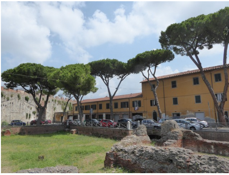
Før vi gikk videre måtte jeg ha et bilde av de fine trærne.