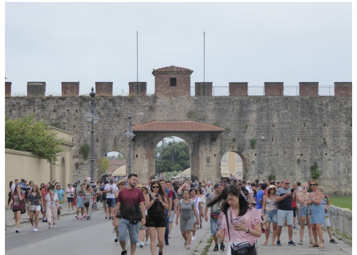
Inngangen til Piazza dei Miracoli gjennom bymuren fra vest, Porta Nuova eller Porta di Santa Maria. ble åpnet i 1562.