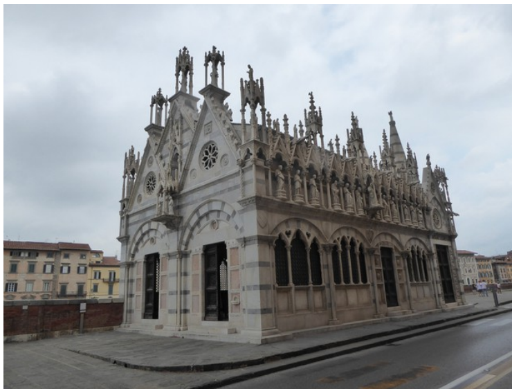
Rett ved Ponte Solferino og rett ved elven ligger kirken Santa Maria della Spina .