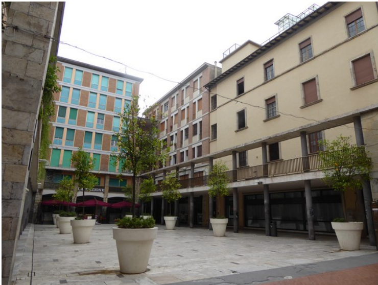
Plassen heter Largo Menotti Ciriaco.