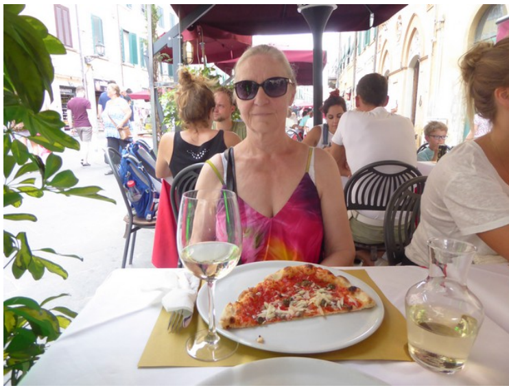
Etter at vi hadde sluppet litt av på hotellet, så gikk vi rett bort i gata for å spise litt. Vi delte en pizza med ansjos.