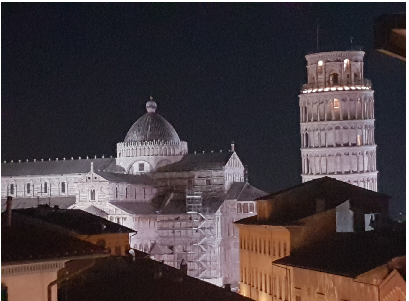
Den siste kvelden vi var i Pisa tok jeg et bilde av tårnet og domkirken. Det ble tatt fra rommet vårt med mobilen min,