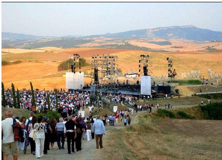
Dette er området hvor konsertene holdes.

Det syntes vi ikke var noe bra alternativ, så vi solgte like godt billettene. Flybillettene fikk vi ikke solgt, så vi reiste like godt på en sightseeingtur til Pisa. Vi snakket med mange nordmenn etterpå som sa at vi kunne være glade for at vi hadde solgt billettene. De var veldig misfornøyde.