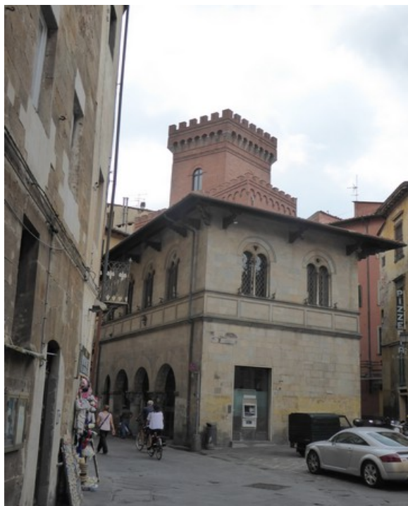
Gata videre bortover heter Via Ulisse Dini . Her kommer vi til Palazzo del Podestà .