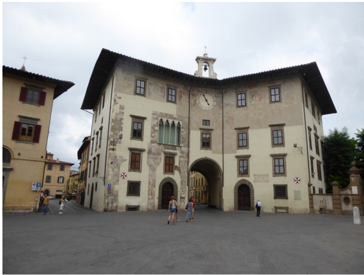
Palazzo dell'Orologio - Torre della Muda o della Fame

Ved siden av Santo Stefano står det en statue av matematikeren Ulisse Dini .