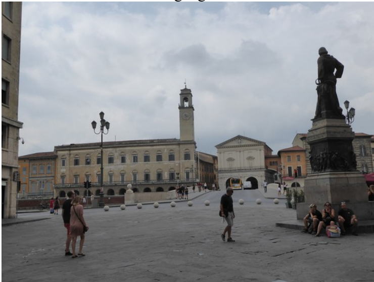
Dette er broen som heter Ponte di Mezzo med Palazzo Pretorio bak til venstre.