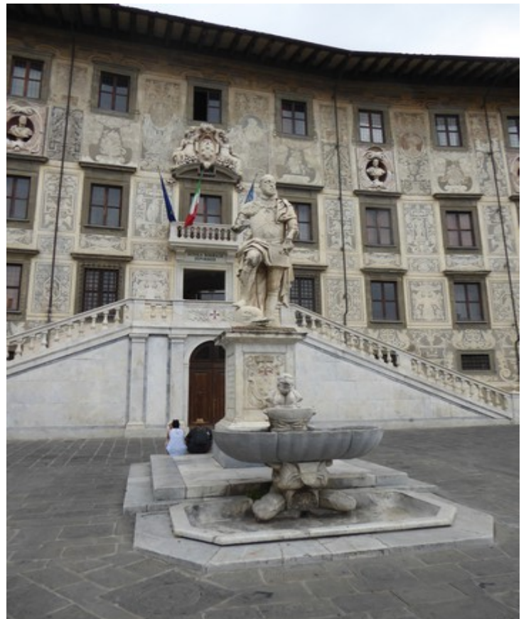
Utenfor Palazzo della Carovana står denne statuen av Cosimo I de' Medici .