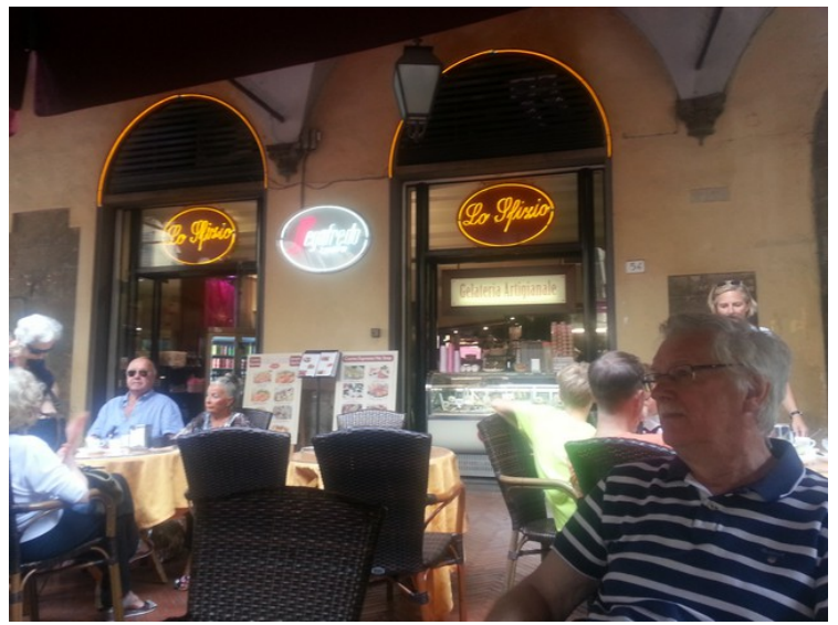
Så måtte vi ha et glass øl på Lo Sfizio .