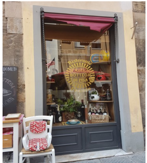
Den heter Ristorante Antica Bottega .