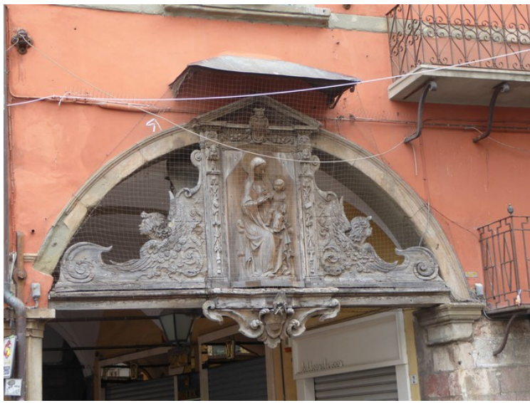
En forseggjort dekorasjon over en buegang.