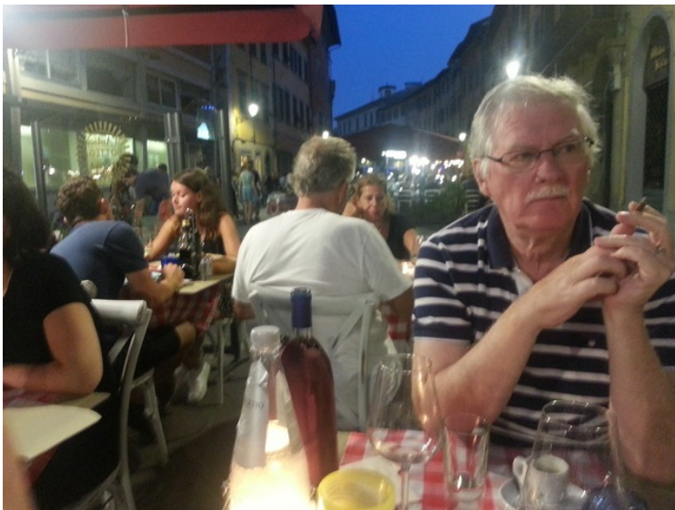
Om kvelden spiste vi på en restaurant rett ute på gata.