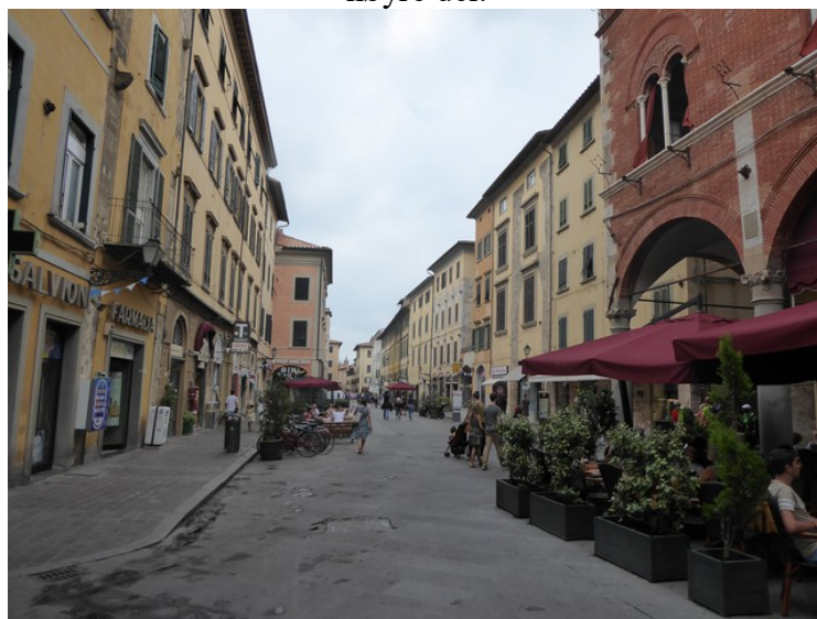
Via Guglielmo Oberdan .