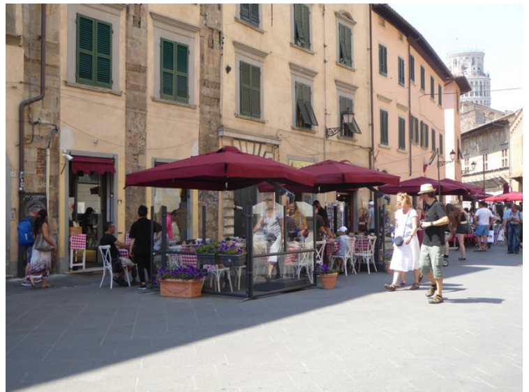
Det var alltid mye folk på gata utenfor hotellet.