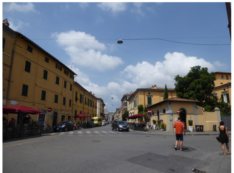
Fra Neros bad ser vi bortover gata som heter Via Maffi Pietro Cardinale. Den går i retning mot det skjeve tårnet.