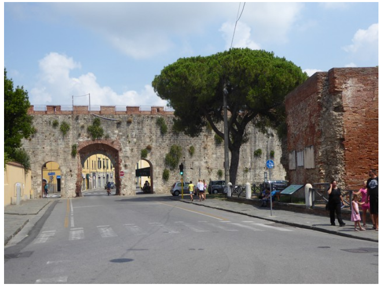
Retten ved siden av Neros bad ligger en byport som heter Porta a Lucca .