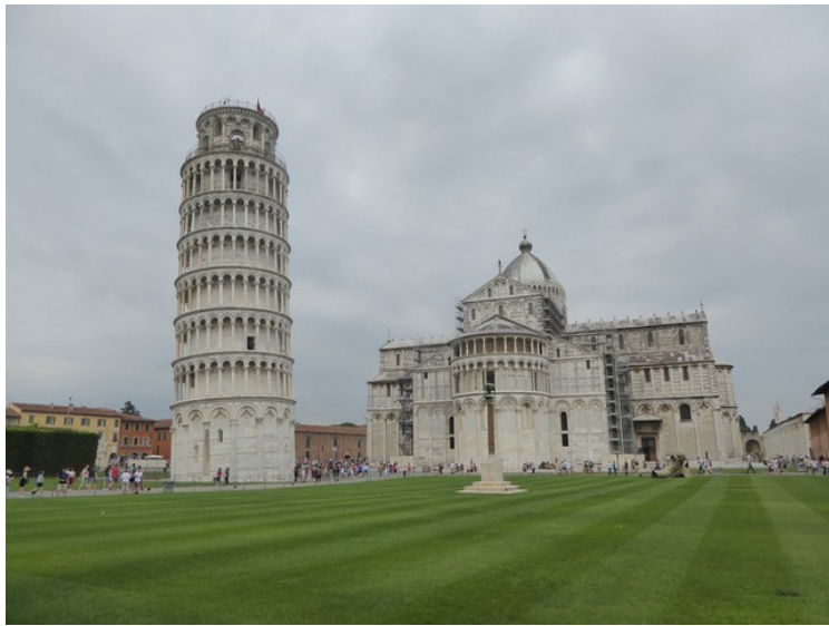
Det skjeve tårnet og domkirken sett fra øst.

Da vi hadde gått rundt på Piazza dei Miracoli, så gikk vi i retning elven Arno på Via Roma. Dette er en gammel slitt dør.