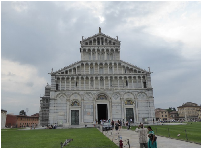
Katedralen sett fra vest.