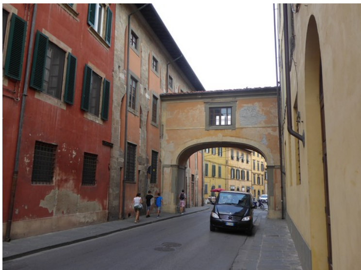
Deretter gikk vi tilbake over elven og oppover Via Santa Maria hvor hotellet vårt ligger.