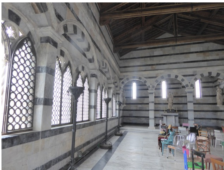
Inne i kirken.

Kirken var kjent for å ha en torn fra Jesu tornekrone, men etter en ombygging av kirken ble tornen flyttet til Chiesa di Santa Chiara.