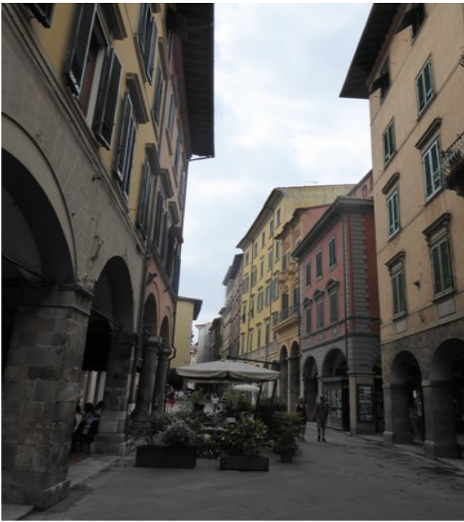
Via Guglielmo Oberdan