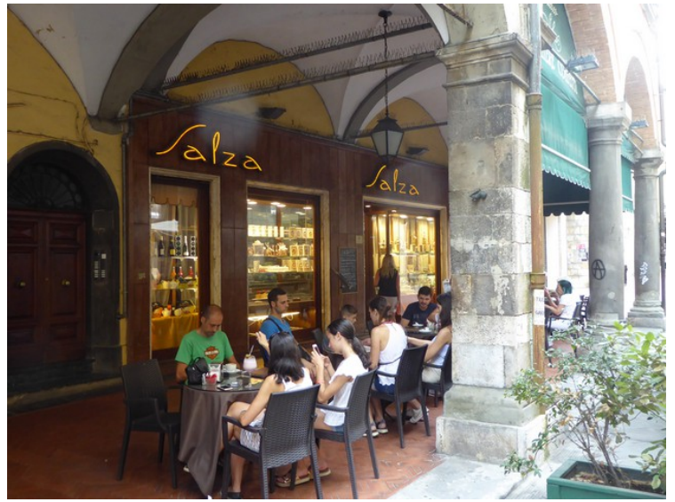
Salza skal være den kaffebaren i Pisa som har best kaffe. Alle bordene var opptatt.