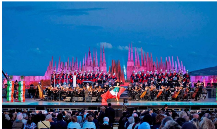
Dette er fra konserten dette året. Det var en operaforestilling, ' Andrea Chénier ' av Umberto Giordano . Dette er den første opera som Andrea Bocelli hørte og lærte i en alder av åtte år.

Konsertene holdes hvert år i juli i et utendørs amfiteater utenfor Lajatico. Amfiteateret heter Teatro del Silenzio .