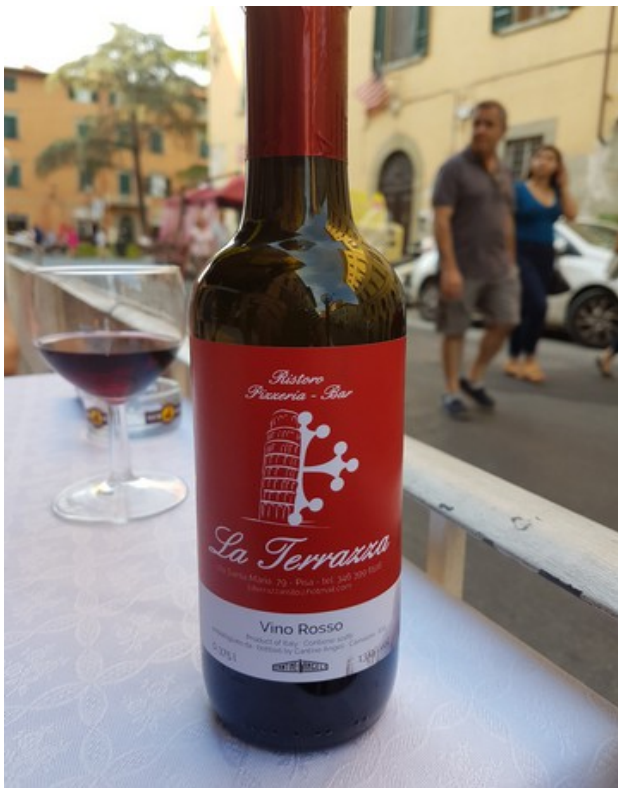
Vinen var grei nok.