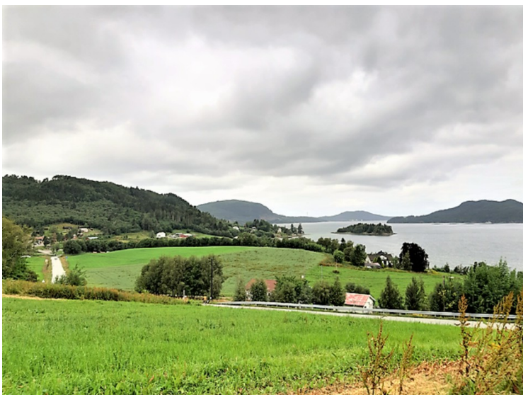
Utsikten nordover fra kirkene.