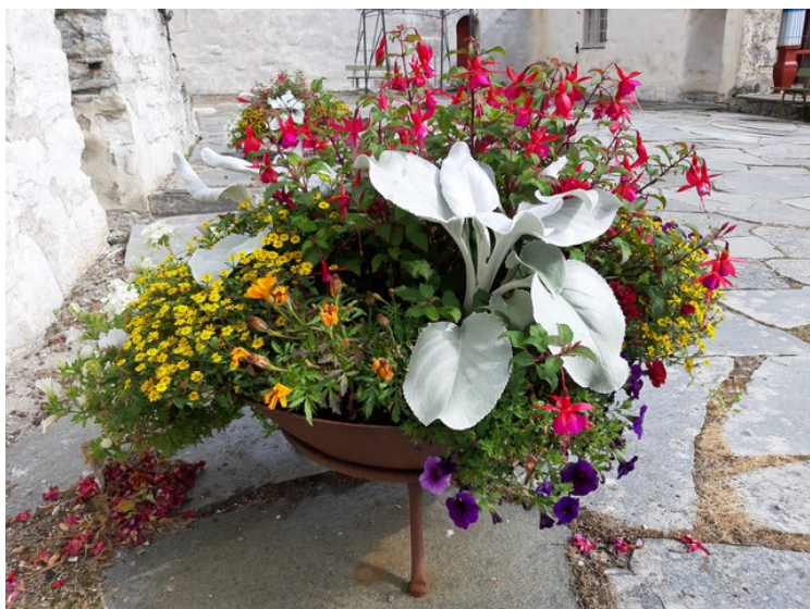
Blomstervase ute i gården.