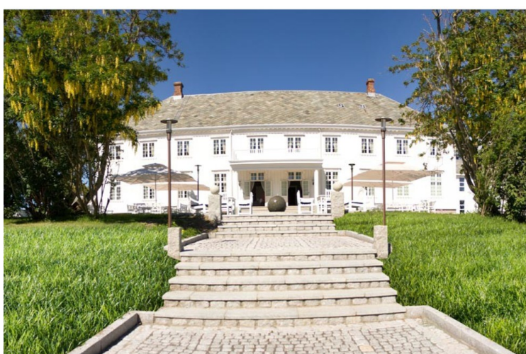
Hovedhuset på andre siden.