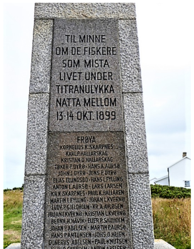
Teksten på monumentet.