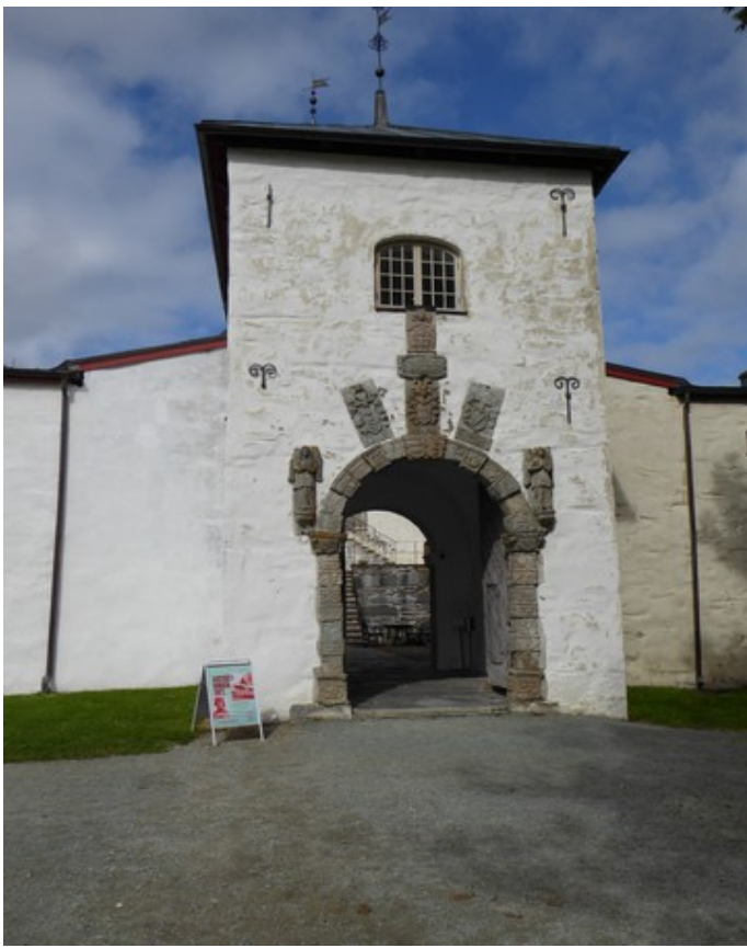
Borgportalen med eierens våpenskjold.