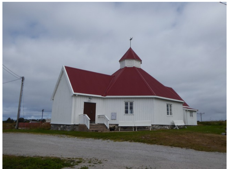
Dette er Titrans kapell .