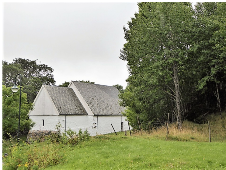
Etter Melandsjø kjørte vi over til Dolmøya . Den ligger på nordsiden av Hitra, bare skilt fra den med Vettastraumen. Dette er Dolm kirke .