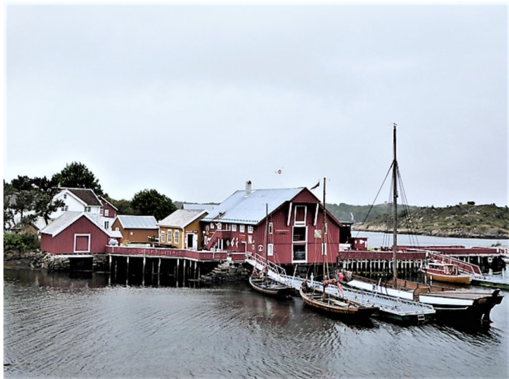
Her er vi på Melandsjø . Dette er Hopsjøbrygga . ( Pilegrimsleden )