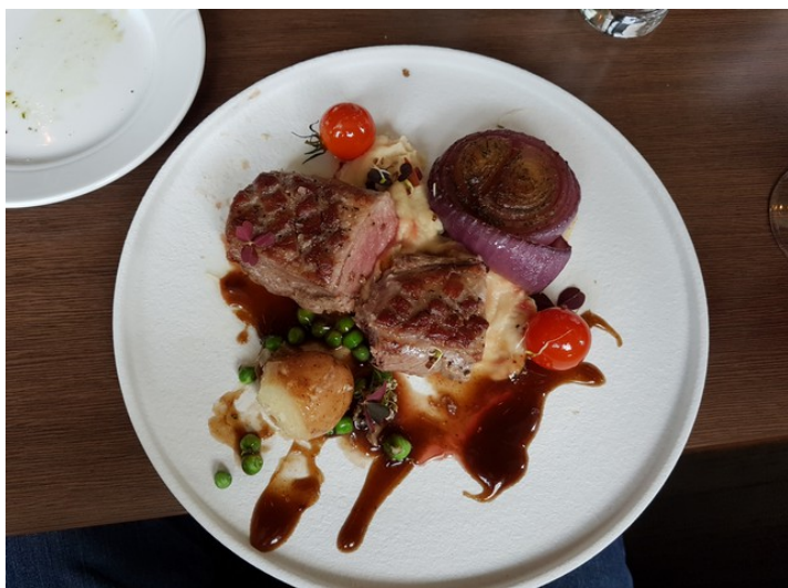
Om kvelden spiste vi villsaufilet.