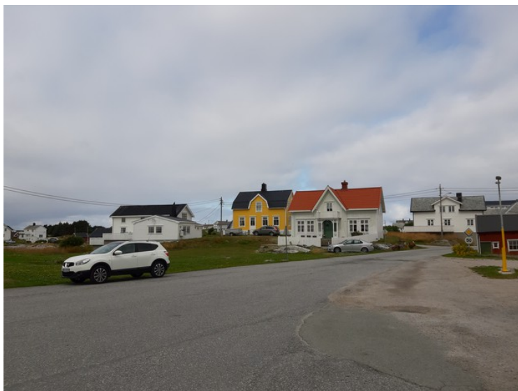
Litt av bebyggelsen.