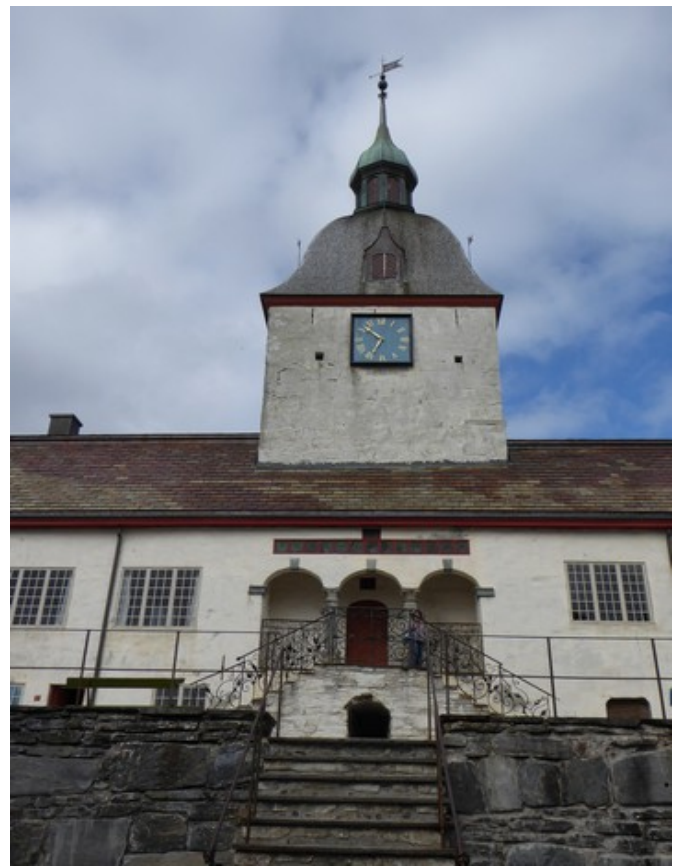
Inne i den nedre borggården.