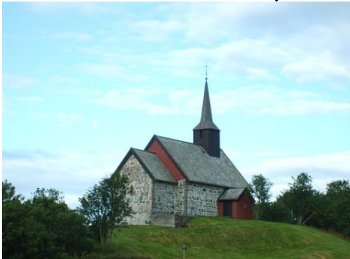
Edøy gamle kirke er en steinkirke fra 1190. Den står på Edøya . ( Pilegrimsleden )

Vi sløyfet altså de følgende to punktene: