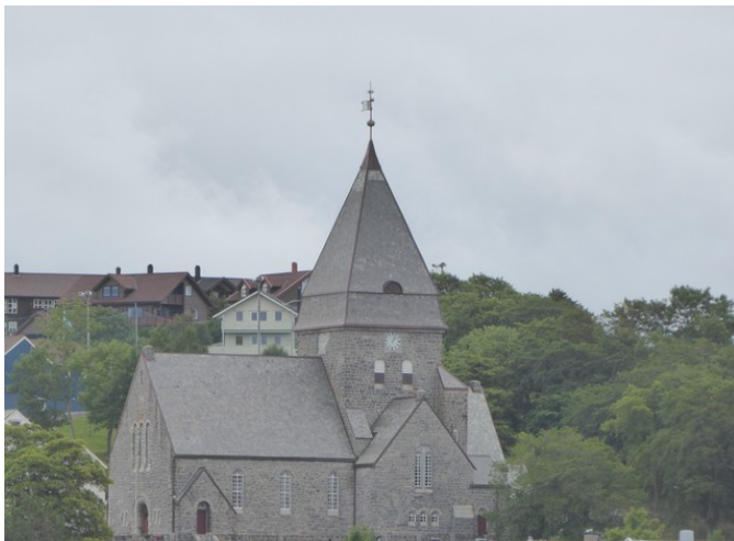
Dette er Nordlandet kirke sett fra havnen.

Teksten inneholder oversatt uttrykket «Tolv vintre hadde kristendommen vært i Norge», dette er den eldste kjente forekomst av ordet «kristendom» i Norge. ( Pilegrimsleden )