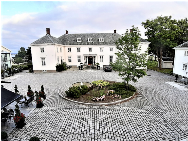
Dette er hovedhuset med gårdsplassen sett fra andre etasje i låven.