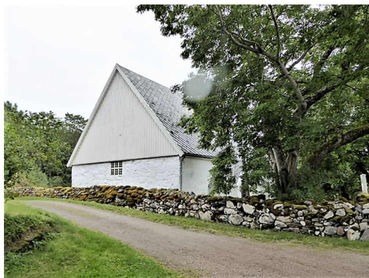
Kirken er det eldste eksisterende byggverk i Hitra. Kirka ble trolig bygget i senmiddelalderen og erstattet den eldre stavkirka Amundarås kirke på Undås. Steinmurene har blitt skadet av flere branner sist i 1920. ( Pilegrimsleden )