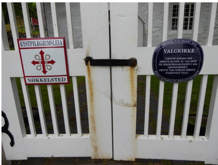
Disse skiltene står på porten.