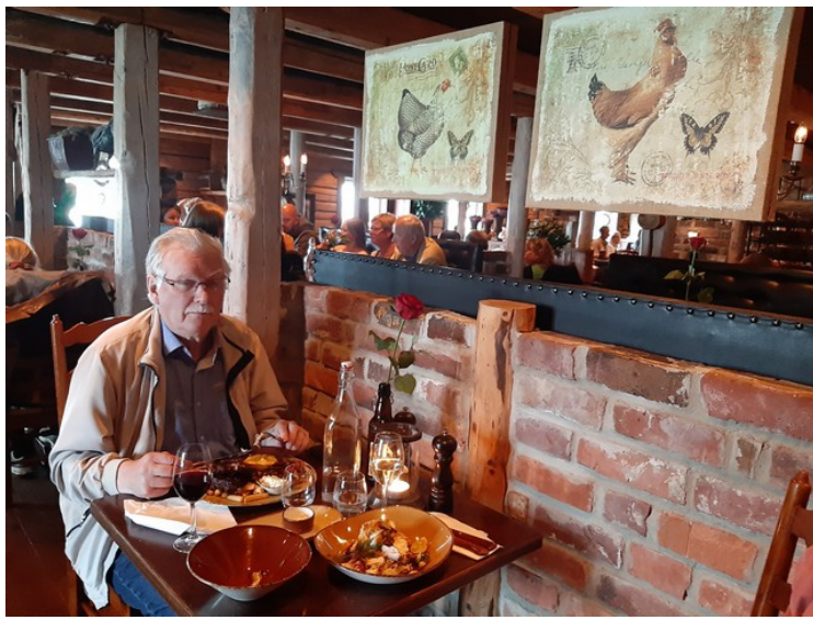
Her spiser jeg. Ribben var kanskje den møreste jeg har spist, men alt i alt var det nokså smakløst.