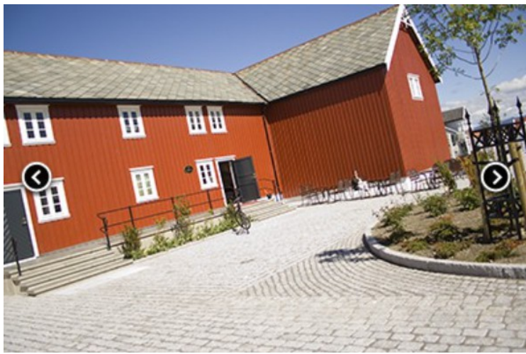
Vi fikk rom i låven, inngang til venstre.