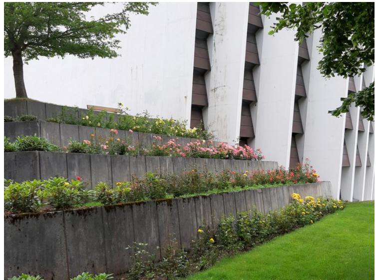
Masse blomster i skråningen.

Den arkitektoniske idéen bak Kirkelandet kirke er «Bergkrystall i rosene», dvs. at kirken skal skinne som en lysende krystall blant rosene i vestskråningen.