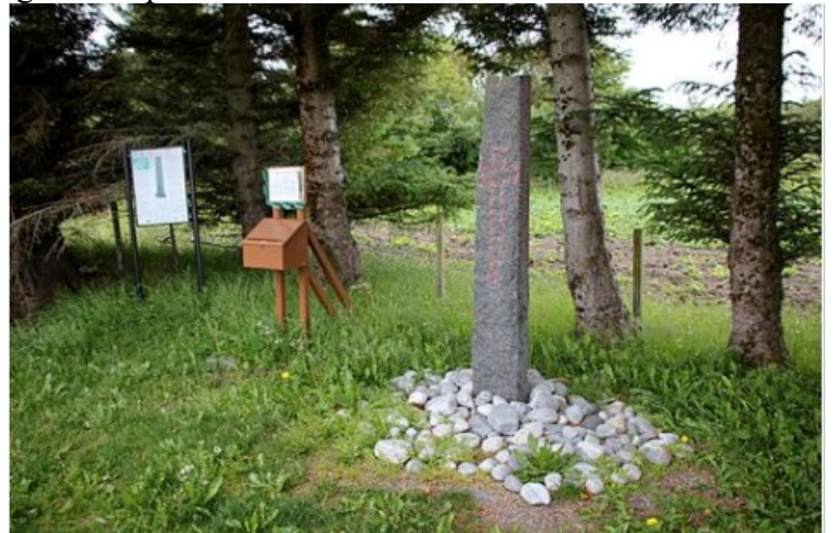
Kulisteinen er en runestein med en kristen runeinskripsjon på øya Kuli. Steinen har det eldste skriftlige belegget for navnet «Norge» i Norge, og kan derfor kalles «Norges dåpsattest».

Kulisteinen er en del av Norges dokumentarv.