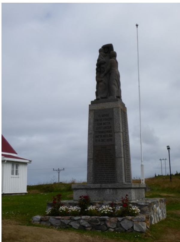
En minnestøtte for Titransulykken .