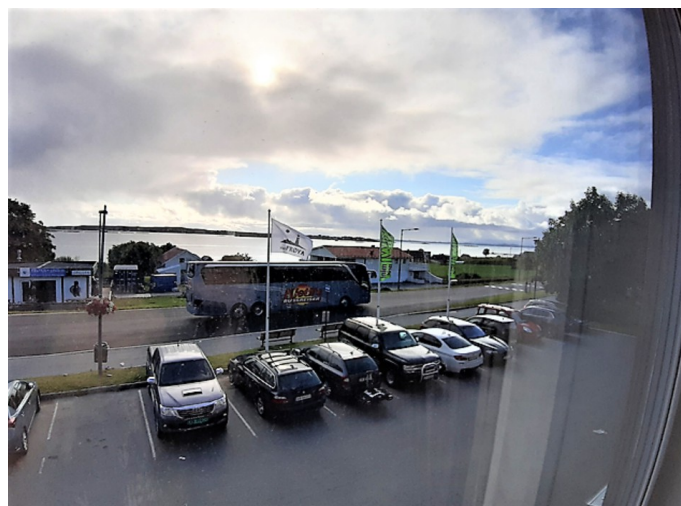
Utsikt fra vinduet på rommet. Vi ser en av bussene til Kjetils bussreiser. De bodde på samme hotellet som oss.