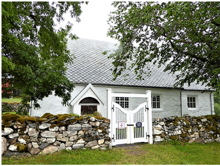
Porten inn til kirken.