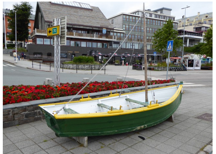
Pynt i havnen.