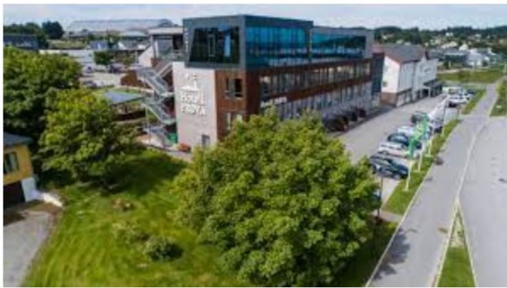
På Frøya hadde vi bestilt på Hotell Frøya . Det ligger på Sistranda som er administrasjonssenteret på Frøya.