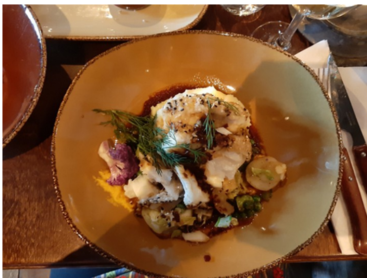
Anne Berit hadde sesampanert torskerygg med stekte grønnsaker, gulrot og ingefærpure, soya- og ingefærsmør med hjemmelaget potetstappe.