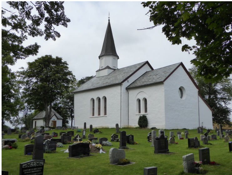
Her har vi kjørt tilbake til Brekstad , til Ørland kirke . Det er den best bevarte middelalderkirken på Fosenhalvøya. ( Pilegrimsleden )