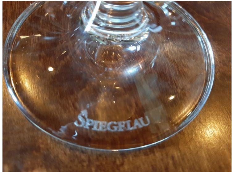
Da vi skulle spise i fjøset fikk vi denne vannkaraffelen på bordet. Spiegelau er et tysk merke som første gang er nevnt i 1521.