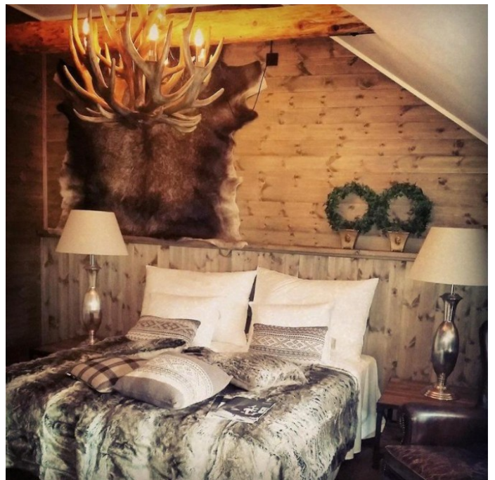
Rommet så omtrent slik ut.