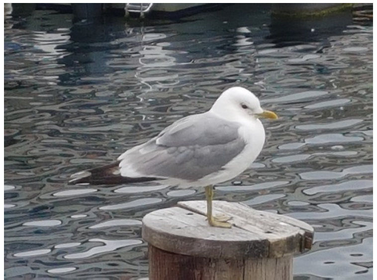
Måken sto rett utenfor.