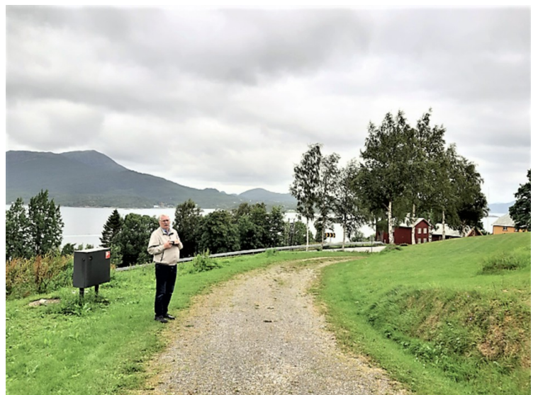
Utsikt sydover fra kirkene.