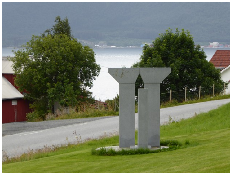
Dette er Tusenårsmonumentet «Solur».