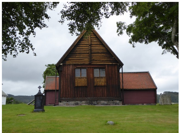
Stavkirken sett nedenfra.