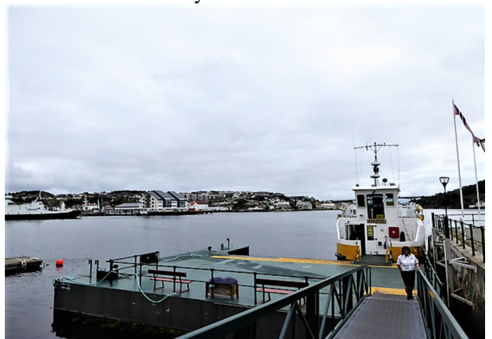
Utsikt over havna.