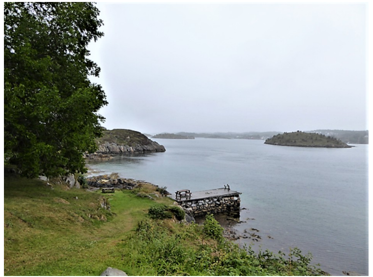
Utsikt fra kirken.