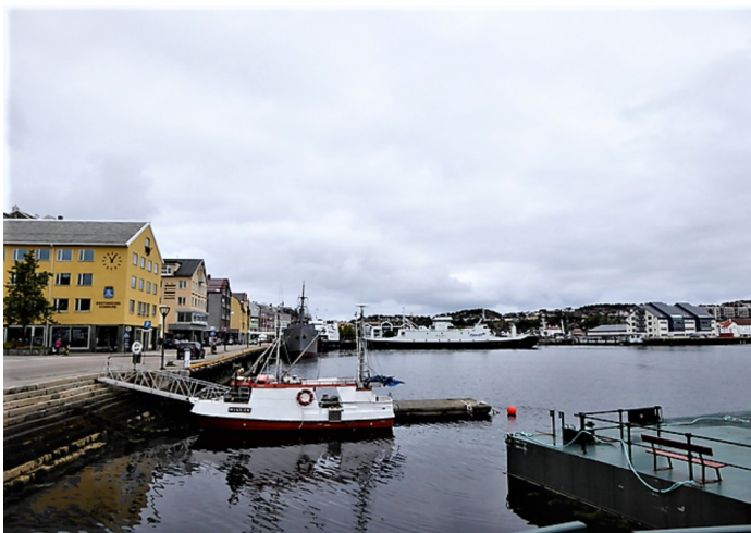
Utsikt over havna.