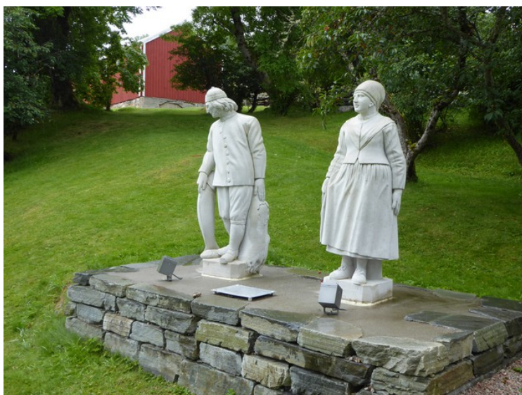
Ved uthuset står disse figurene.