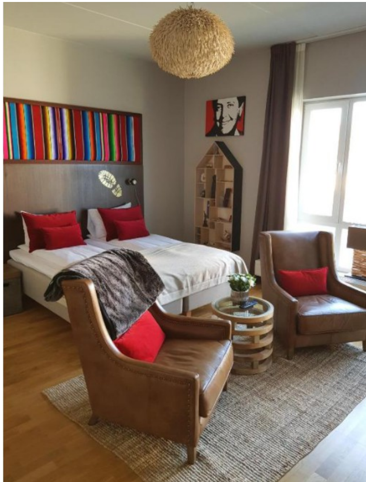
Rommet så omtrent slik ut.