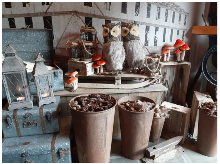
I lokalene var det mange gamle ting som sto over alt.