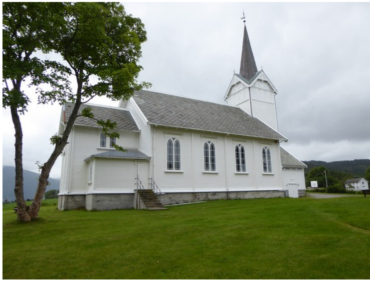
Deretter kjørte vi til Kvernes på Averøy. ( Pilegrimsleden ) Dette er den nye Kvernes kirke .