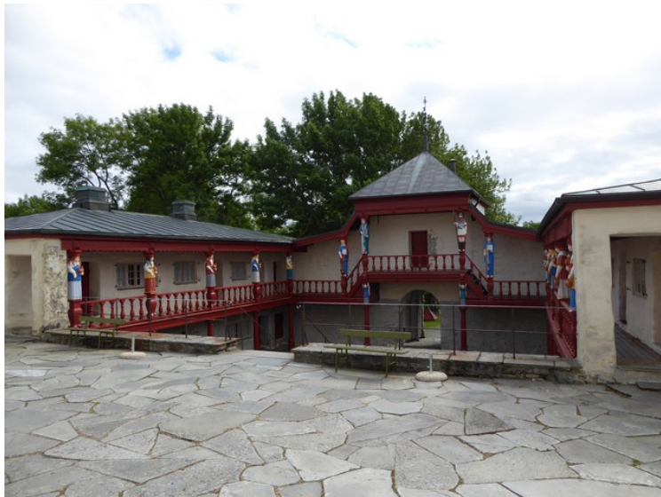
Oppe på den øvre borggården.