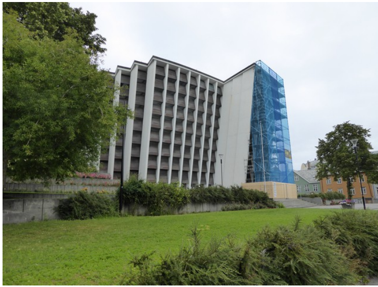
Vi kjørte opp til Kirkelandet kirke . Den ble bygget i 1964. Det var vedlikehold på gang.