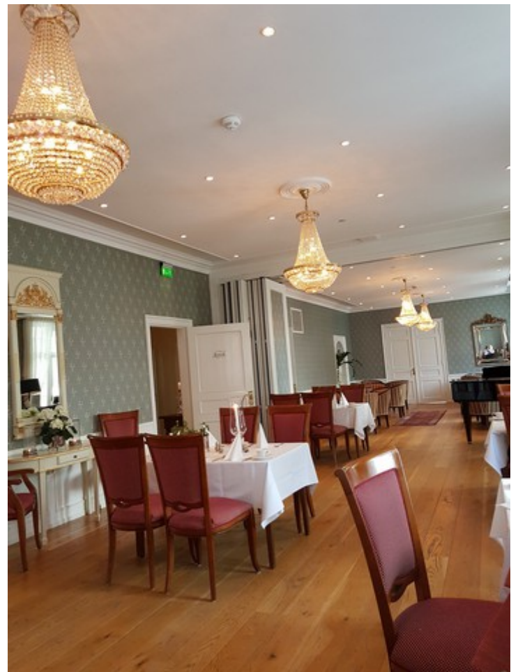
Til slutt en kikk inn i spisesalen i hovedbygningen.