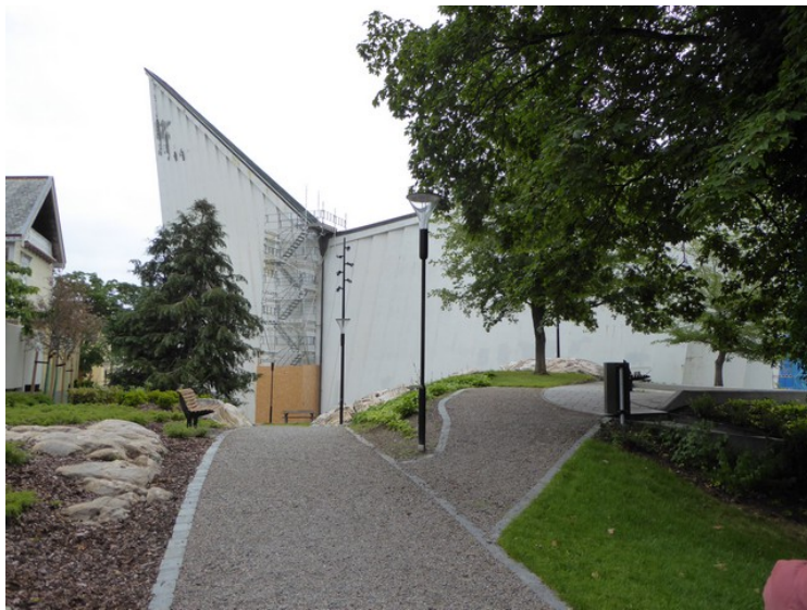
Utradisjonell form på en kirke.

Den arkitektoniske idéen bak Kirkelandet kirke er «Bergkrystall i rosene», dvs. at kirken skal skinne som en lysende krystall blant rosene i vestskråningen.