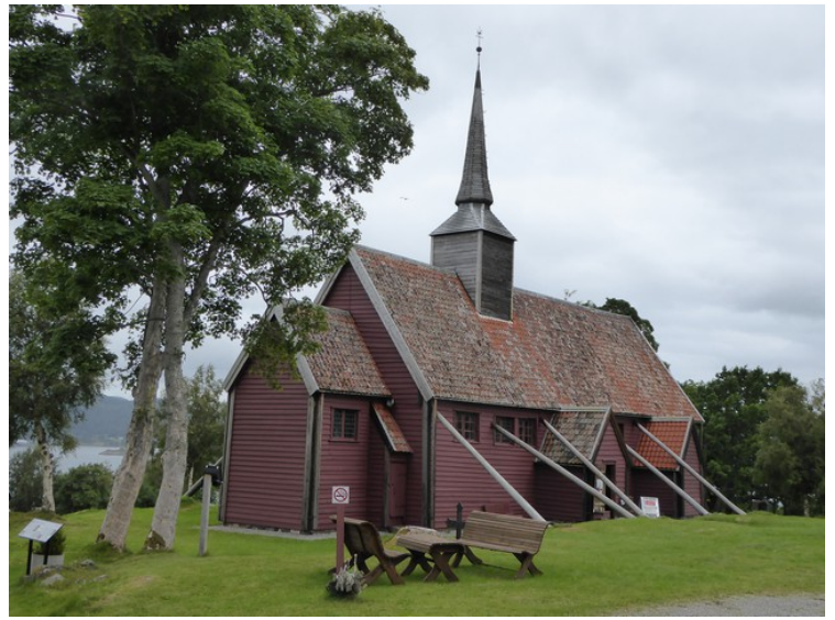
Rett ved siden av står Kvernes stavkirke . Skråstøttene utvendig er nødvendige for å stive av bygget.