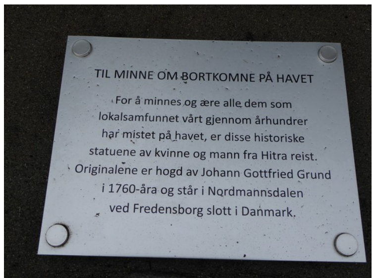
Plakett med forklarende tekst.

Etter at vi hadde vært på Dolmøya kjørte vi videre nordover gjennom Frøyatunnelen til Frøya. Den ble åpnet i 2000. Den erstattet fergeforbindelsen fra Kjerringvåg på Dolmøya til Flatval på Frøya.