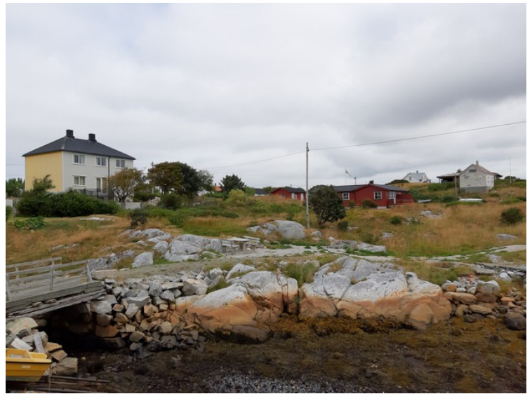
Litt av naturen her ute.