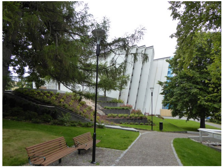
Sett fra en annen vinkel.