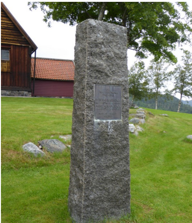
En minnestøtte for de som falt under siste verdenskrig.