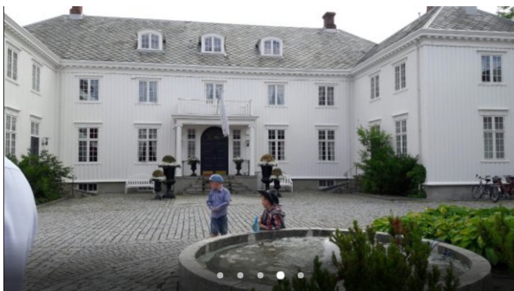
Etter dette kjørte vi bort til Hovde Gård hvor vi hadde bestilt overnatting. Dette er hovedhuset.