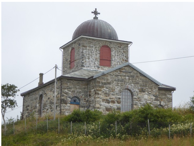
Hitra kirke i Melandsjø.