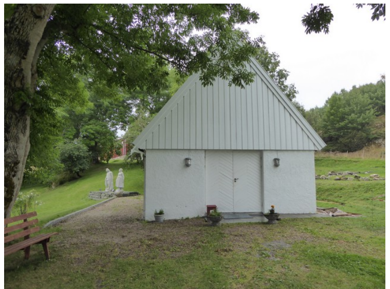
Et uthus som hører til kirken.