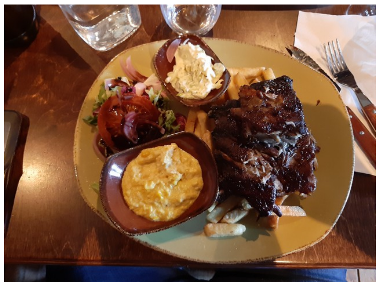
Jeg hadde Hovde gårds «berømte» spareribs med maisstuing, fennikelslaw og pommefrites.