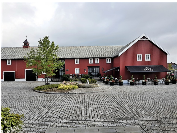
Her er vi ved hovedhuset og ser mot låven til venstre og fjøset til høyre.

Hovde Gård var den første husmorskolen i Sør-Trøndelag da den ble tatt i bruk i 1923. På Hovde lærte de alt fra det å sy, til å melke kyr. Hovde Gård åpnet i mars 2009 som overnattingssted etter en totalrenovasjon