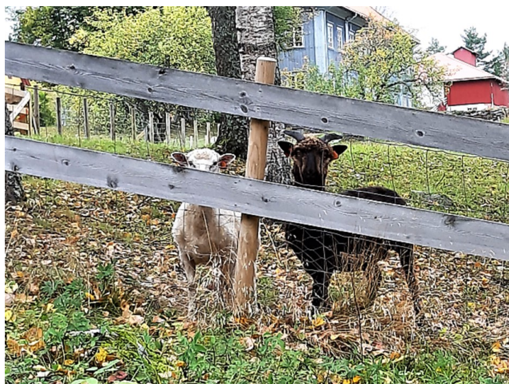
Da vi kjørte derfra var det et par geiter som hilste på oss.