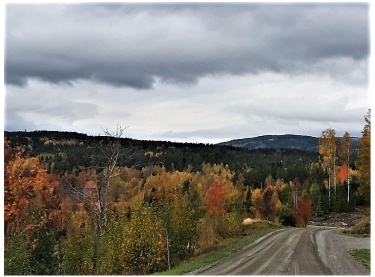
Veien videre. Veihevelen hadde nettopp gått her før vi kom, så grusveien var slett og fin.