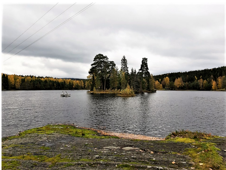
Dette er Fløyta.

Ovenfor brua er demningen i Fløyta. Fløyta har hovedtilførsel fra to andre sjøer, Vallsjøen og Gøralsjøen, som også er regulerte. Verkensåa renner videre nedover til Grimslandsvatnet og deretter ut i Glomma.