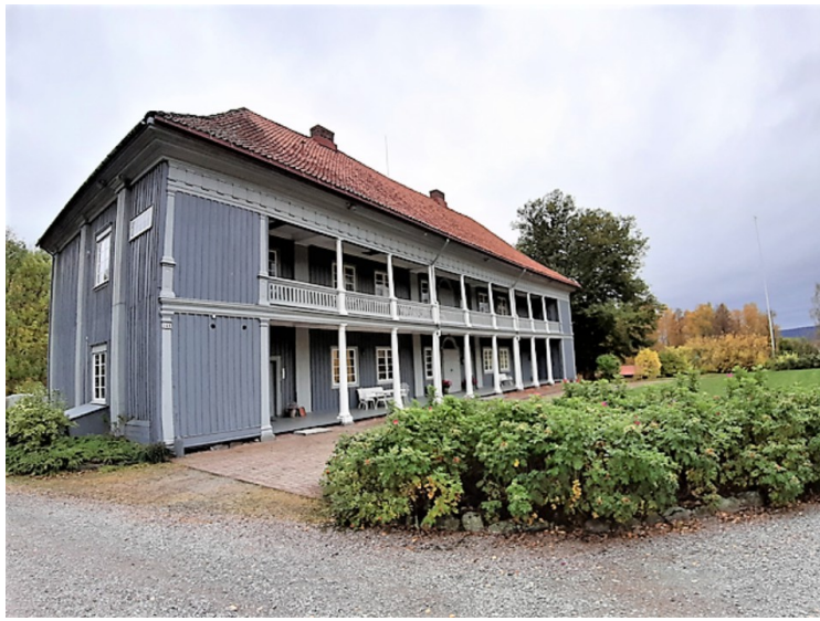
Hovedbygningen sett fra gårdsplassen.