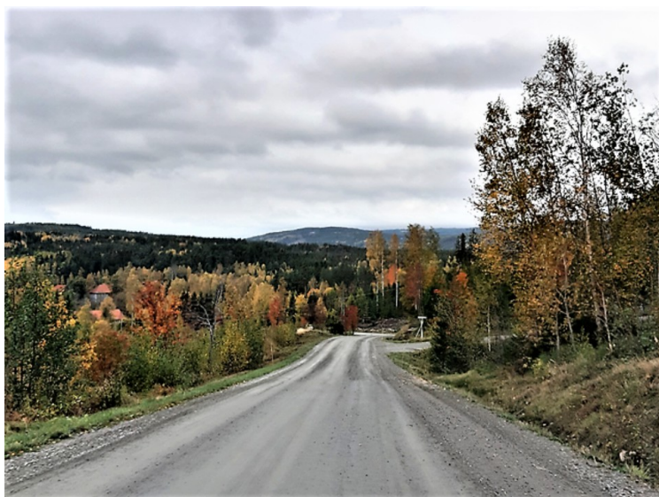
Her har vi kjørt forbi Melby og ser nedover Odals Verkvegen mot Odals Verk.