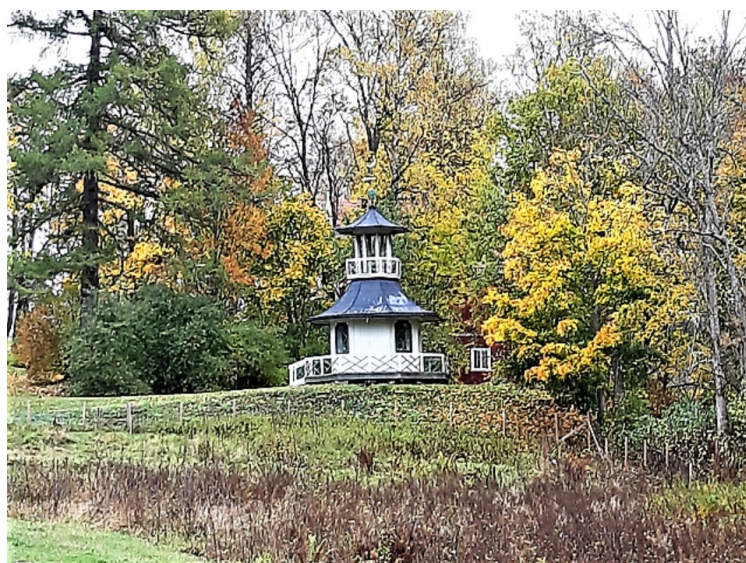
I parkanlegget øst for hovedbygningen ligger Verkets mest særegne bygning - et kinesisk inspirert lysthus.