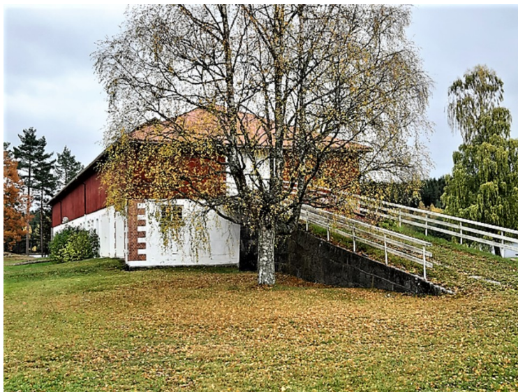
Dette har nok vært en slags driftsbygning eller låve.