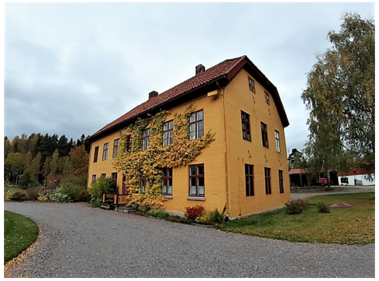
Den ene fløybygningen.