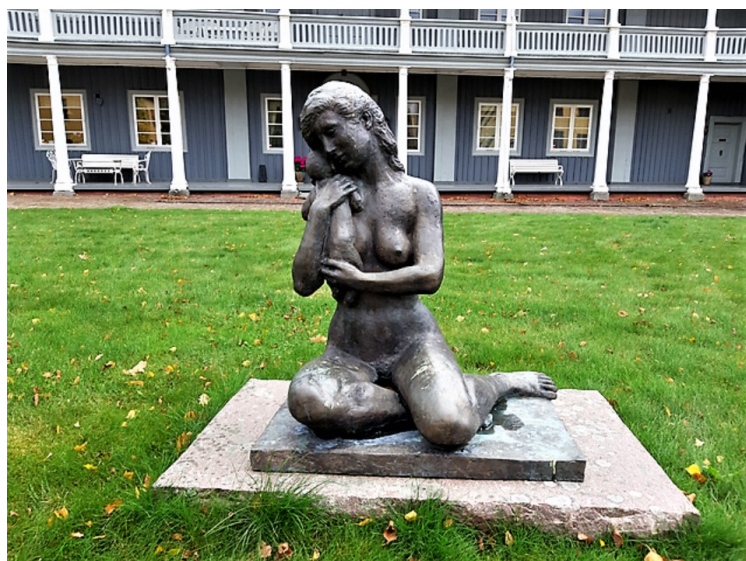
Statue i gårdstunet.

Odals Verk er i dag en ren landbrukseiendom med 900 dekar dyrket mark og 200 dekar beitemarker. Den dyrkede marken ble bortforpaktet i 2003. Skogen består av 41 000 dekar skog og annen utmark