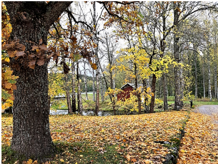
Dette lille huset står ved brua.