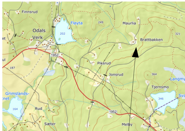
Vi var bortom her og Brattbakken.