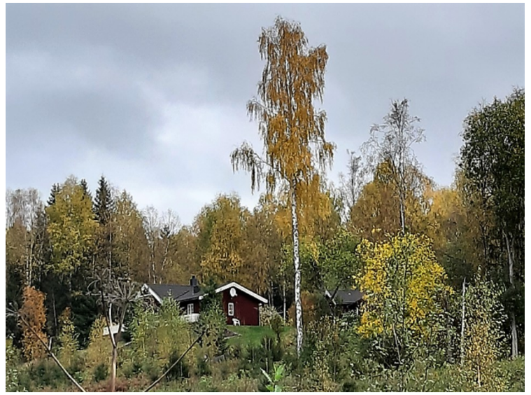
Nabogården til Piksrud.