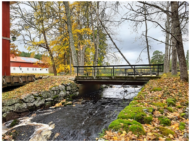
Bru over åa.