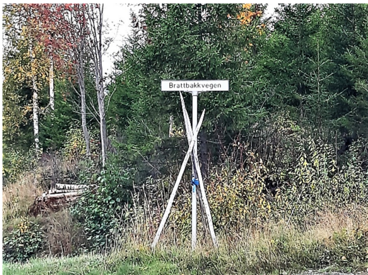
Vi kjørte innover her.