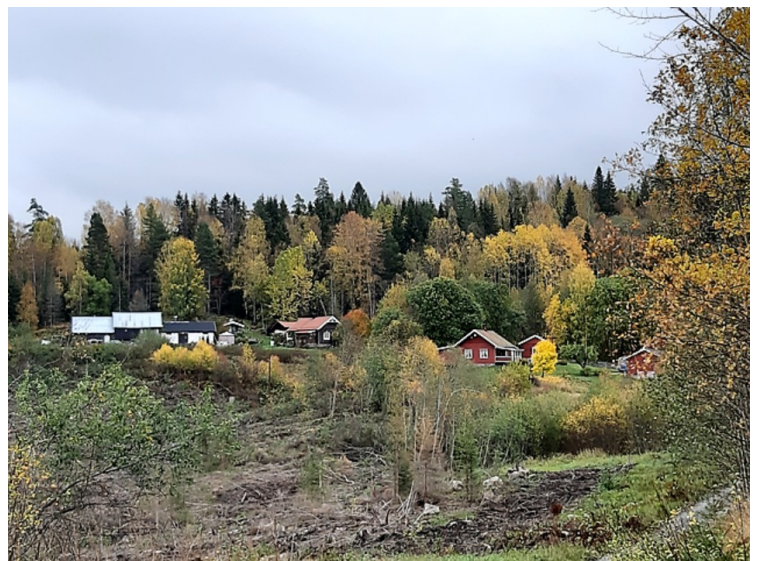
Brattbakken. Dette har vært to husmannsplasser.