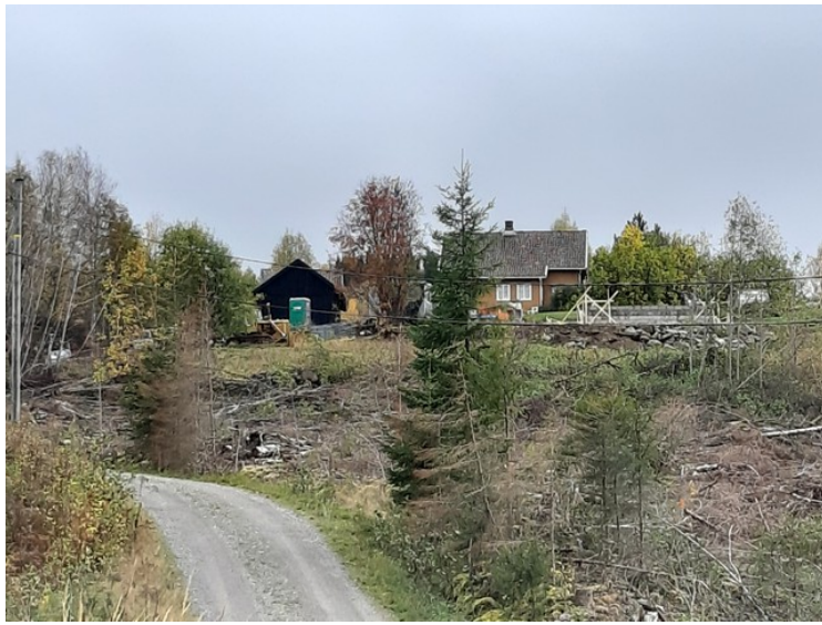
Her heter det Piksrud.