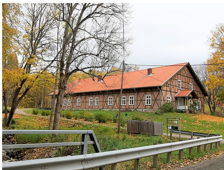
Til slutt tok vi enda et bilde av dette huset.