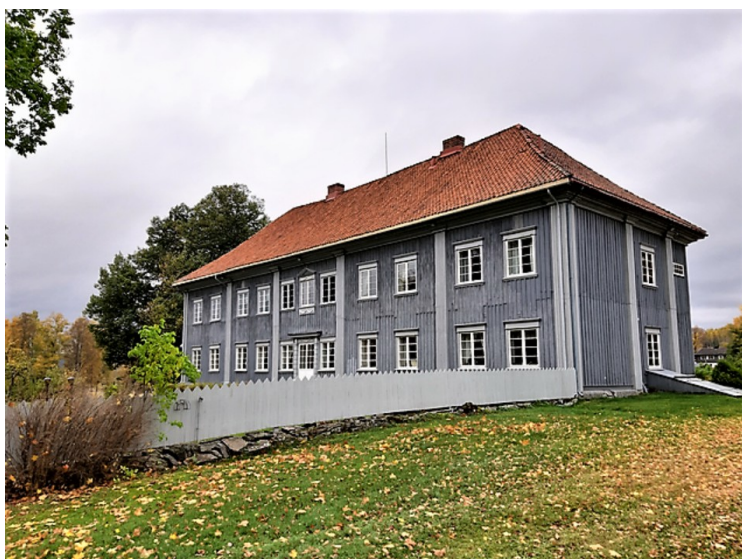
Dette er hovedhuset som ble bygget i 1767.

Bygningen har Norges lengste svalgang, et høyt valmtak og kolonnader i begge etasjene mot gardsplassen. I andre etasje finnes en praktfull festsal utstyrt med brystpanel, vakre dører, beslag og malte overstykker til dørene. Huset ble tegnet av Brede Rantzau, og regnes som et av hovedverkene i 1700-tallets rokokkoarkitektur i Norge.