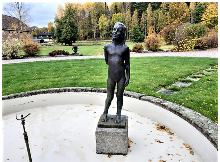
Statue i gårdstunet.