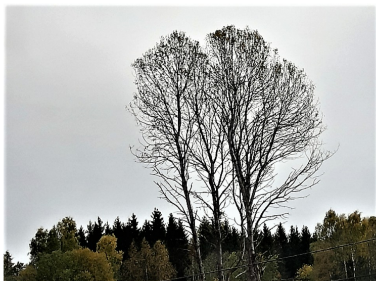
Ikke mye lauv igjen på disse trærne.