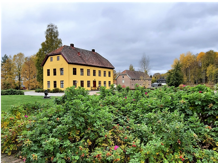
Den andre fløybygningen. Bygningen bakerst ble brukt som stabbur, kornlager og korn tørke helt fram til 1981.

Den ene var kontorbygning med en stor sal i andre etasje. Det andre inneholdt bryggerhus, landhandel, meieri og boliger for ansatte.