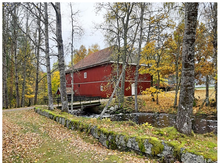
Hjulhuset med vasshjulet.

På Verket utviklet det seg et helt eget samfunn med selvstendig økonomi, eget forsyningssystem, egne rettsregler og eget skole- og fattigvesen. Verkseieren hadde fullmakt til å gi bøter for drukkenskap, slagsmål og andre forseelser. Det ble årlig betalt en fattigskatt av alle som arbeidet på Verket. I 1782 var tallet på antall betalende arbeidere 111.