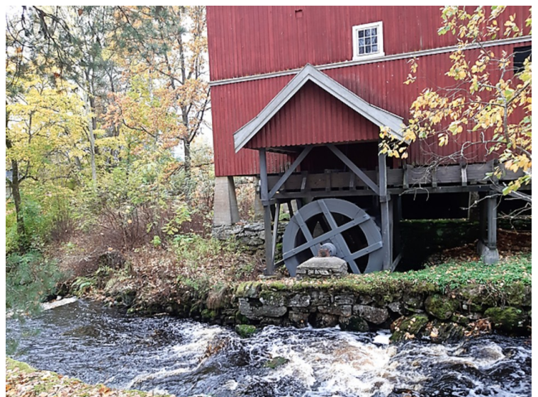
Så kom vi til Odals Verk. Vi kjørte inn til verket her.