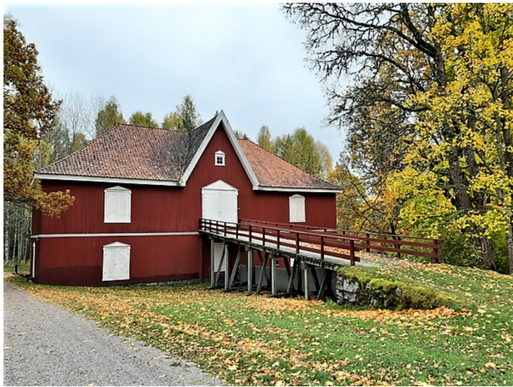
Hjulhuset sett fra andre siden.