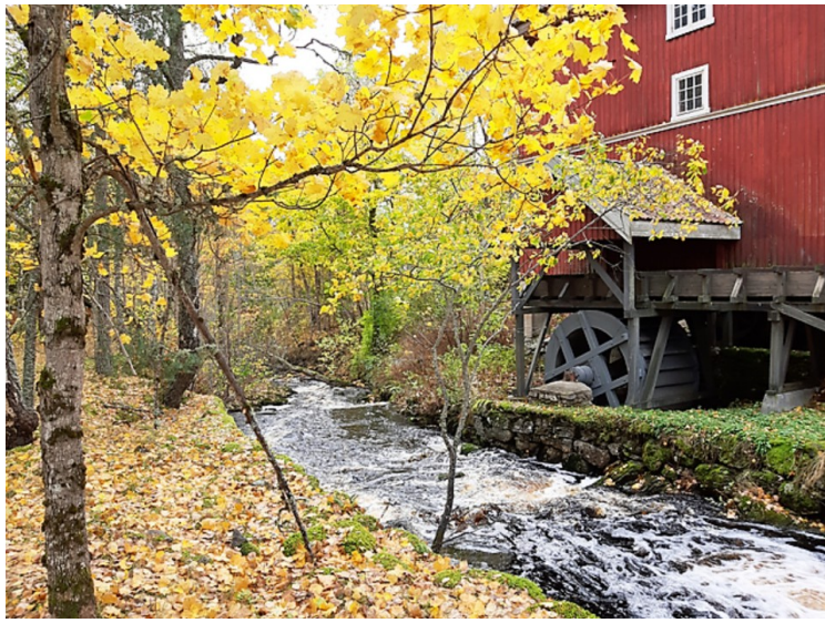
Åa heter her Verkensåa.