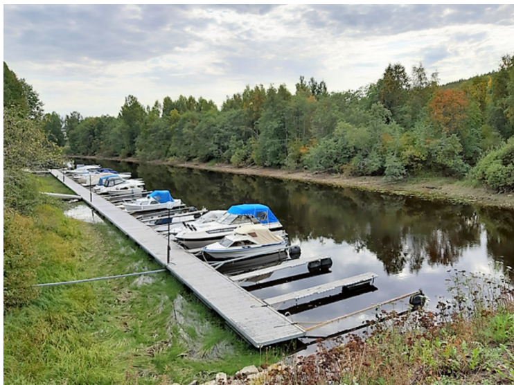
Ved brua som går over dit ligger det båter på begge sider.