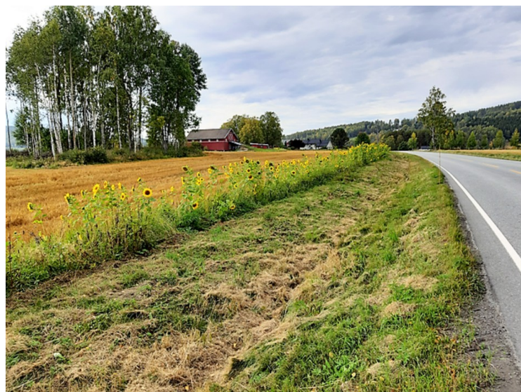
På veien videre mot Mo så vi at det var plantet solsikker på begge sider langs veien.