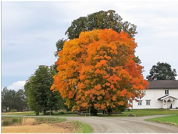
Vi kjørte forbi dette lønnetreet som hadde fått fin høstfarge.