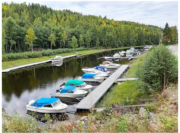
Vi kjørte over til Øyen. Det er en øy som ligger i Storsjøen.