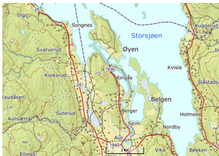
Et kart over området hvor naturreservatet ligger.