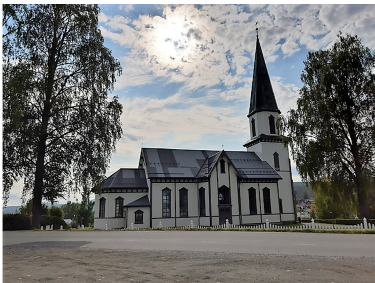
Vi kjørte gjennom Sand som er kommunesenter. Dette er Sand kirke .