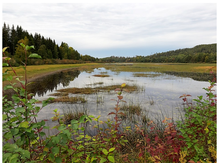
Dette er litt av våtmarksområdet i Midt-Nora.

Formålet med vernet er «å bevare et viktig våtmarksområde i sin naturgitte tilstand og å verne om vegetasjonen, det spesielt rike og interessante fuglelivet og annet dyreliv som naturlig er knytta til området».