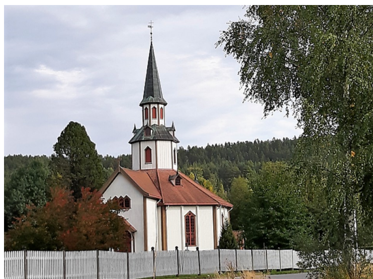
Det siste bildet vi tok var av Mo kirke .