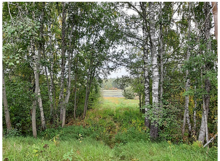
Fra brua ser vi videre innover øya.