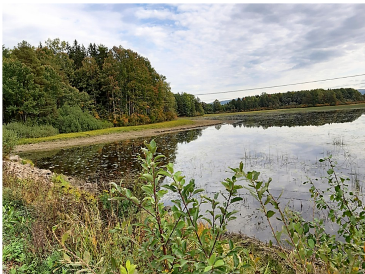
Dette er Sør-Nora.