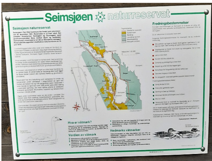
Området er et naturreservat. Det heter Seimsjøen Naturreservat .