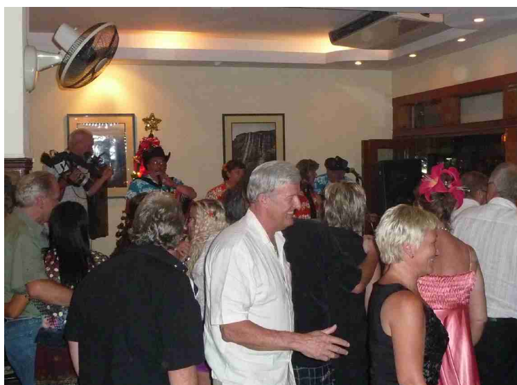
Her var dansen slutt.