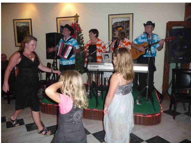
Etterpå spilte Sputnik til dans. Han bor i nabogaten vår hele vinteren og skal underholde i restauranten sammen med et annet par.