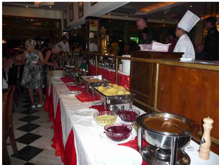
Ribbe i lange baner.