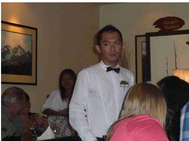
Kelneren som passet på bordet vårt. Veldig dyktig!