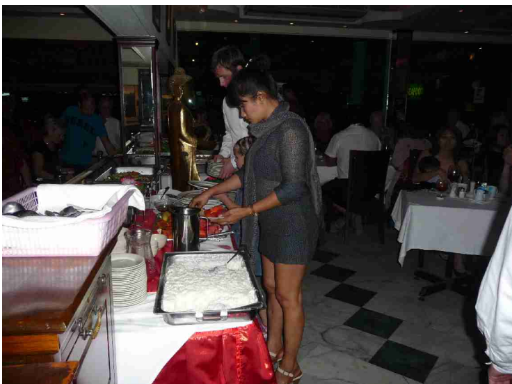
Så ble det dessert, riskrem med rød saus og frukt.