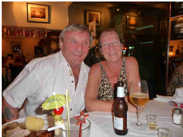
Vi fikk selskap ved bordet vårt etter hvert.