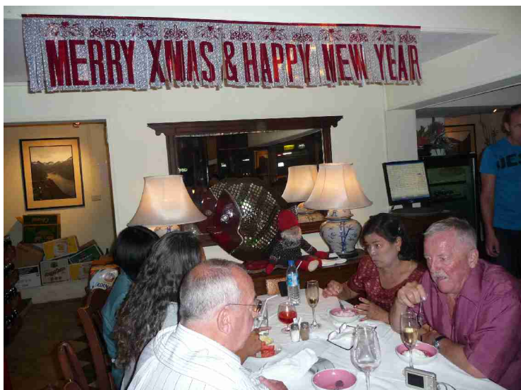
Folk koser seg.