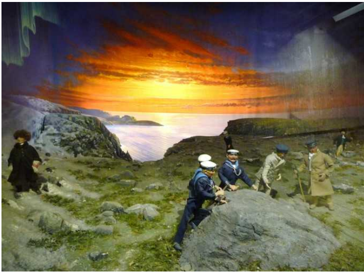
Bilder fra Kong Oscar II's ekspedisjon til Nordkapp.