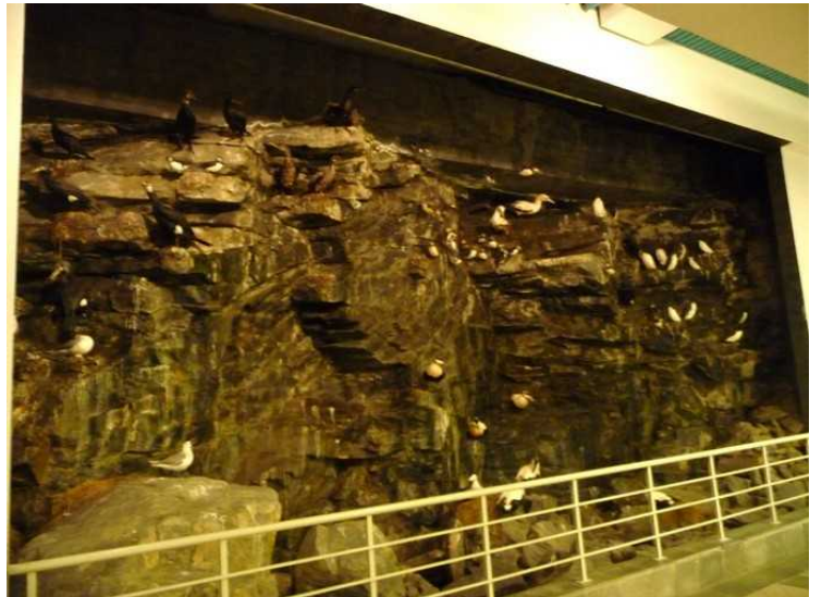
Inne i hallen er det også en modell av et fuglefjell .