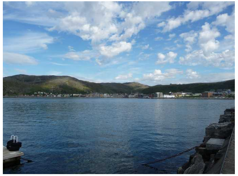
Her ser vi over til Hammerfest sentrum.