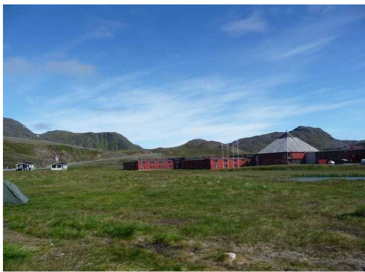
Dette er Nordkapp Camping rett utenfor Honningsvåg.