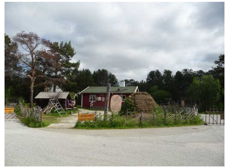
Koier og lavvo .