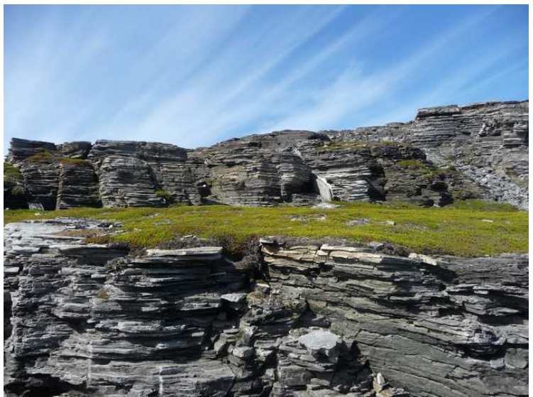
Lagdelt fjell mellom Repvåg og Ytre Sortvik.