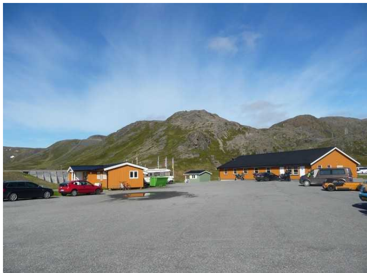
Hus på campingplassen.