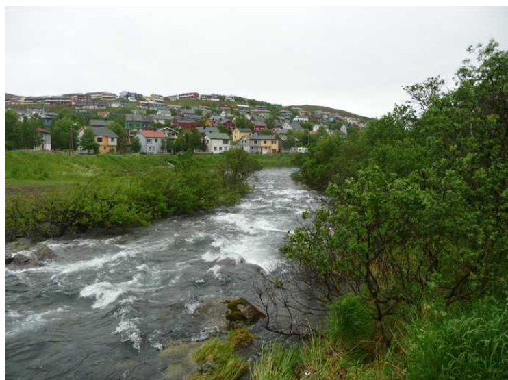
Bekken renner ut i Storvannet.