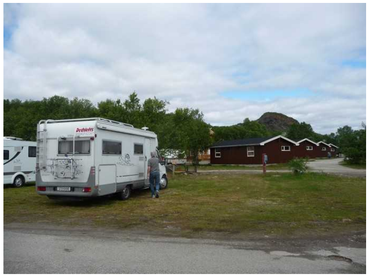
På plass på Stabbursdalen Feriesenter rett før Lakselv.