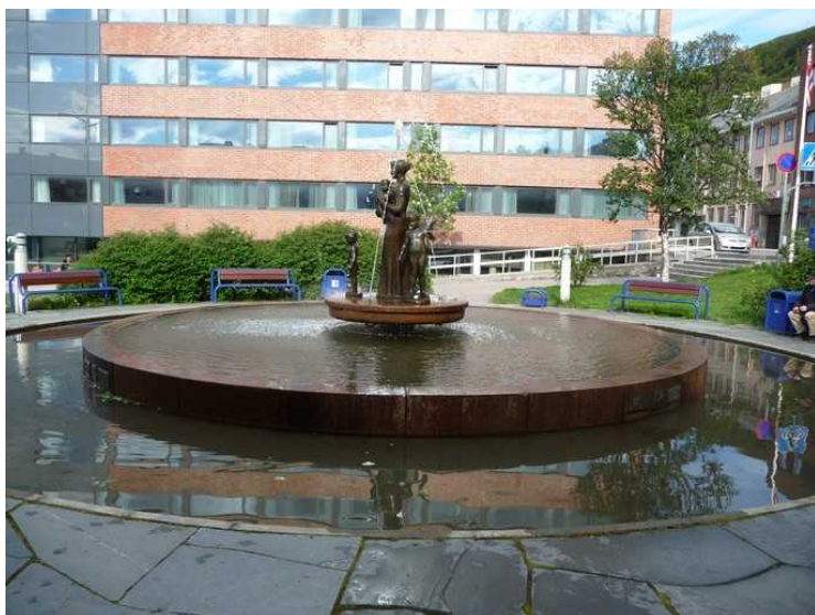
En fontene i parken. Fontenen er en gave fra den tidligere amerikanske ambassadøren i Norge.