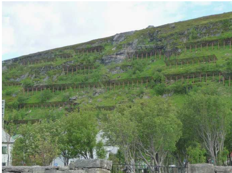
Oppe i lia er det laget snøsperrer.