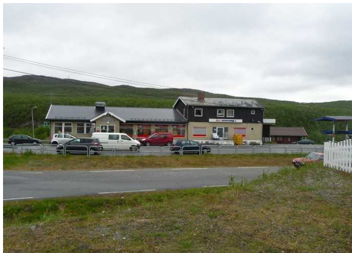
Vi hadde en liten stopp i Masi. Det bor bare 350 mennesker her og 98% er samer. Det ble planlagt at bygda skulle demmes ned under utbyggingen av Alta/Kautokeino-vassdraget, men det ble det ikke noe av.