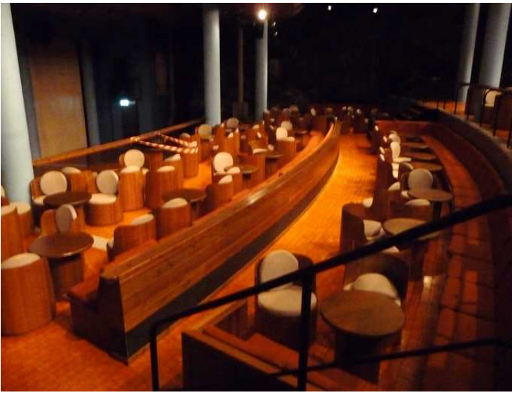
Bar inne i Nordkapphallen.