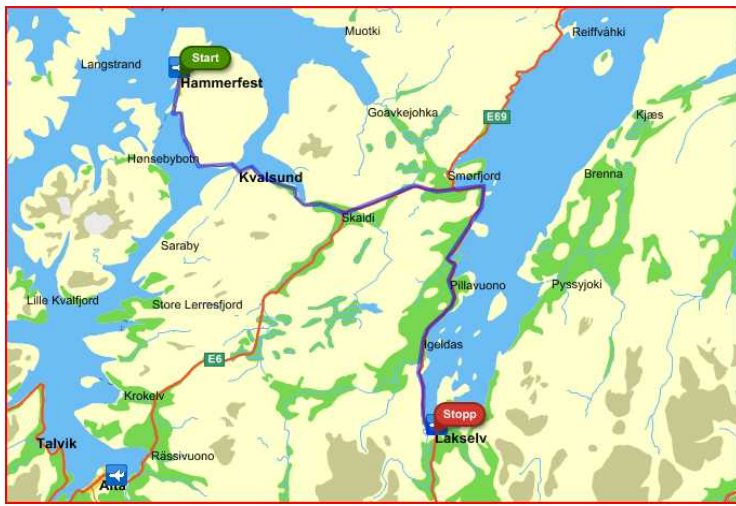
Dag 14 reiser vi fra Hammerfest til Lakselv.