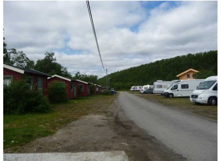
Et par bilder fra plassen.