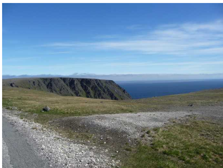
Her nærmer vi oss Nordkapp-platået som ligger i Nordkapp kommune .