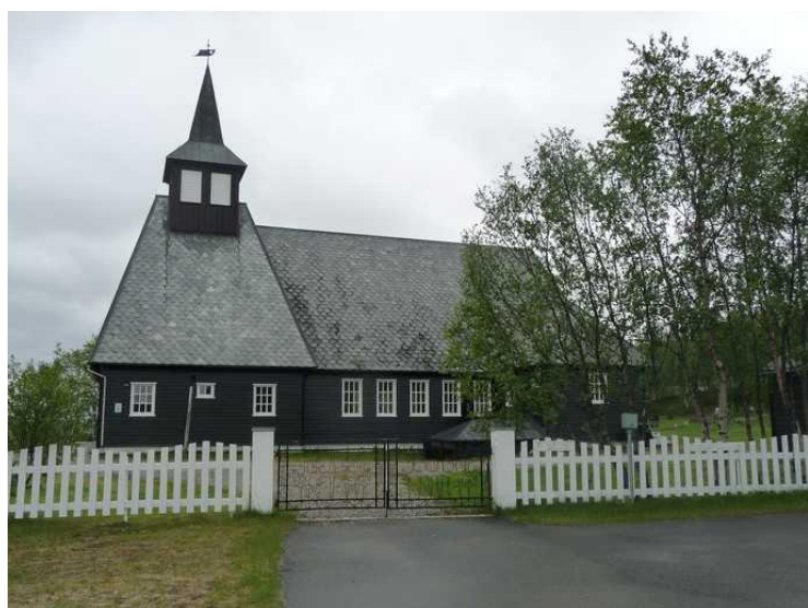
Masi kirke fra 1965.