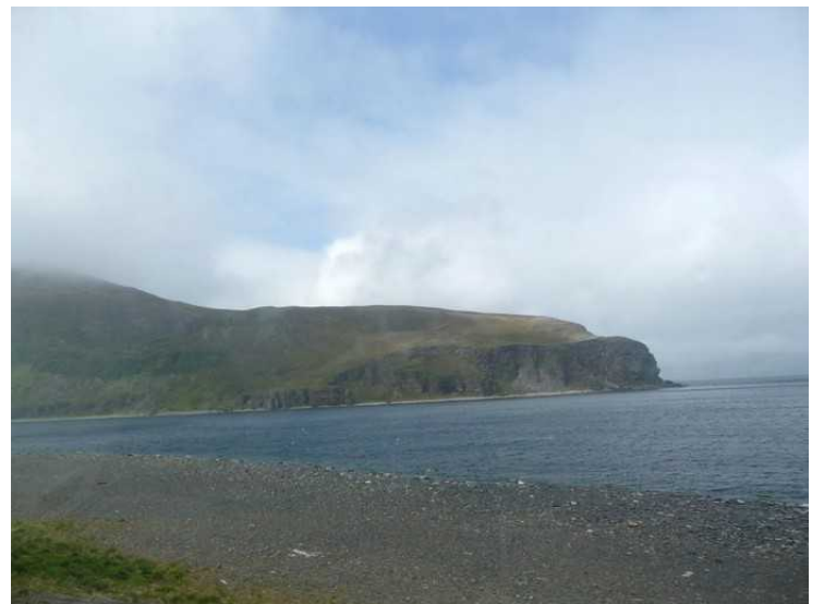
Kåfjorden med Mastebergan.