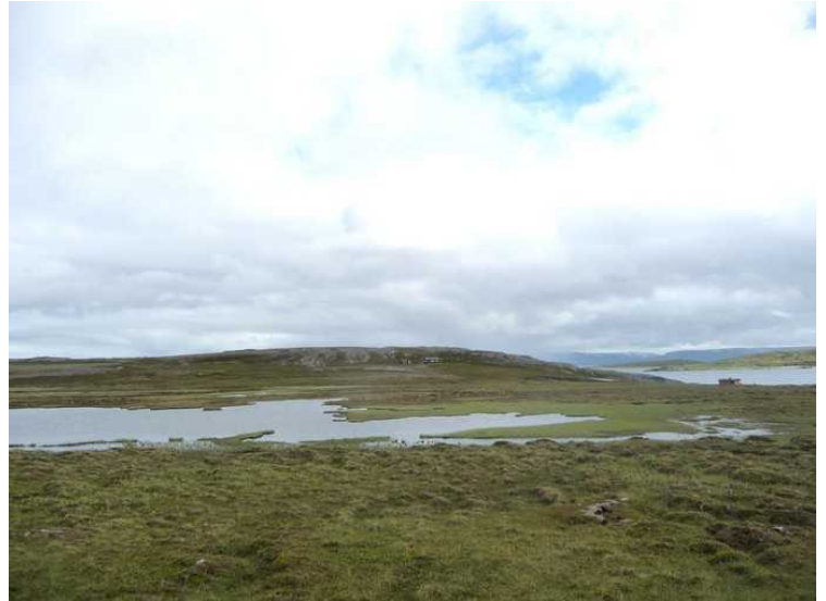
Et tjern med Porsanger-neset i bakgrunnen.