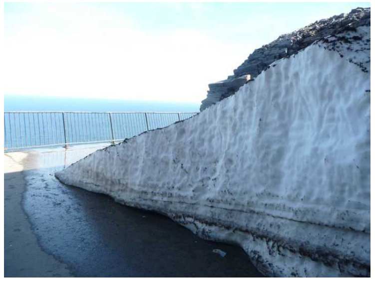
Ute på utsiktsplattformen ligger snøfonna stor ennå.