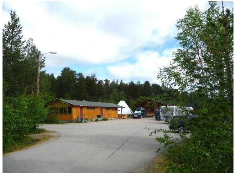
Resepsjons-området med service-bygningene.