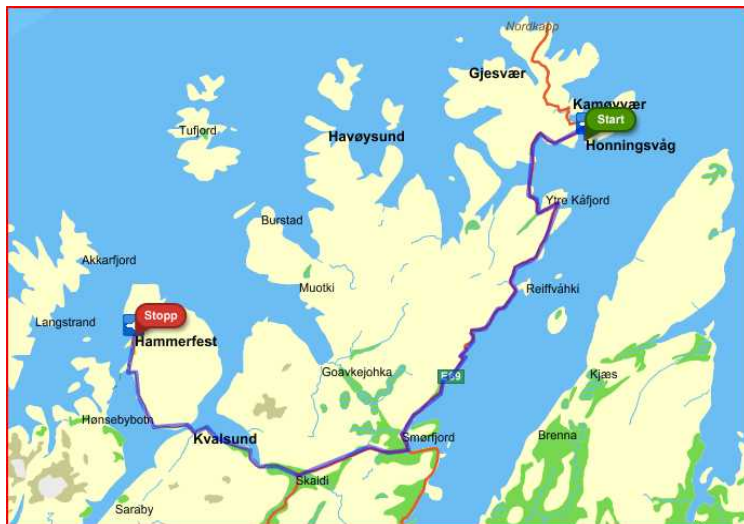
Dag 13 reiste vi først til Nordkapp og deretter til Hammerfest.