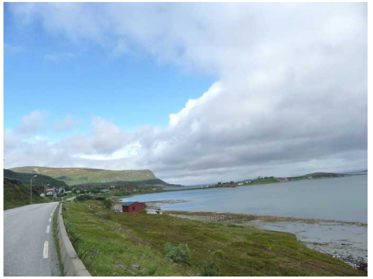
Her har vi passert Lakselv og er på vei langs vestsiden av Porsangerfjorden mot Honningsvåg. Dette er ved Smørfjord .