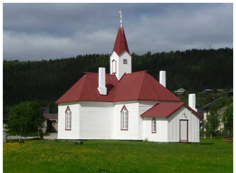
Karasjok gamle kirke er Finnmarks eldste trekirke fra 1807. Det var det eneste byggverket som sto igjen i Karasjok etter 2. verdenskrig.