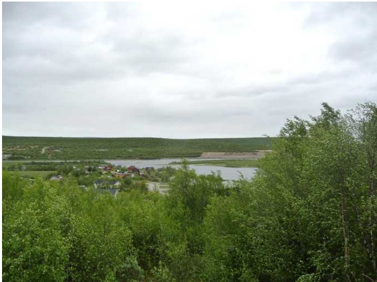
Utsikt nordover langs Karasjokka.

Kautokeino er et ganske grisgrønt tettsted. Kommunen er Norges største i areal og er også den største reindriftskommunen. 90% av innbyggerne er samiskspråklige.