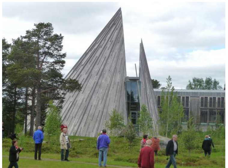
Bygningene sett østfra.