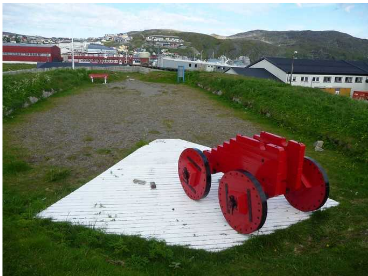
Det er ikke så mye som står igjen av dette festningsverket.