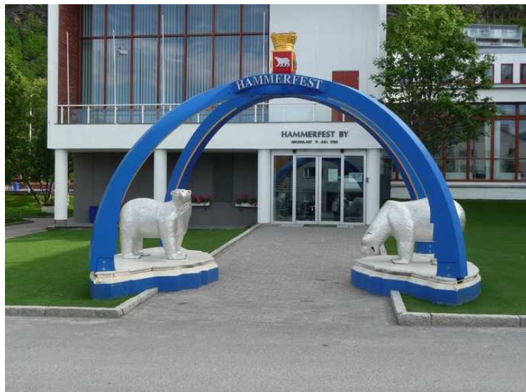
Disse to isbjørnene står utenfor rådhuset. Skulpturen kalles Ishavsportalen og er laget i tre av Knut Arnesen.