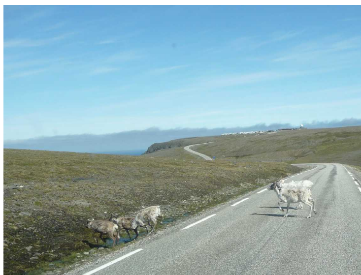
Reinsdyr krysser veien.