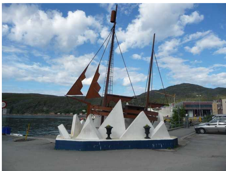
Seilskute i storm på kaien.