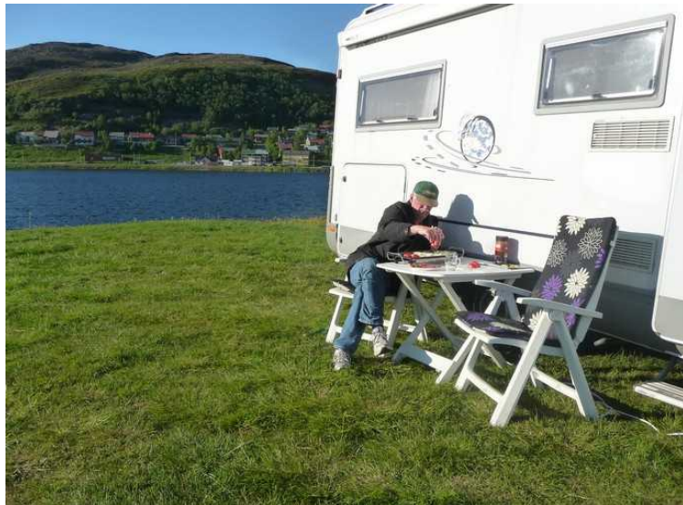
På Storvannet Camping i Hammerfest.