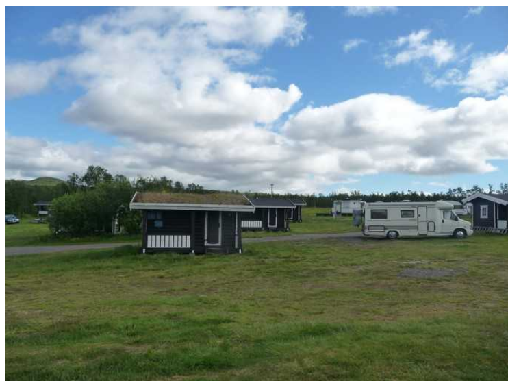
På Tana Familiecamping i Skiippagurra , rett bortenfor Tana bru .