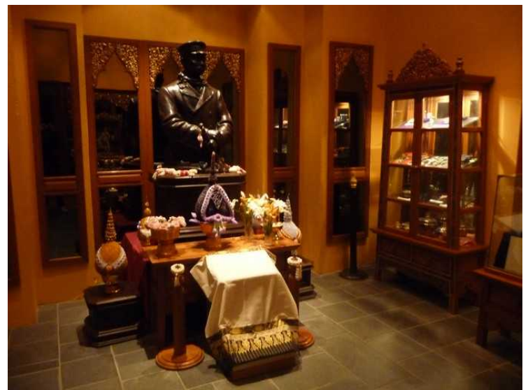
Bilder fra Kong Chulalongkorn (Rama V) sitt besøk i 1907.