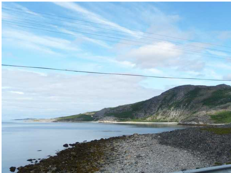
Ved Laksefjorden rett før Ifjord .