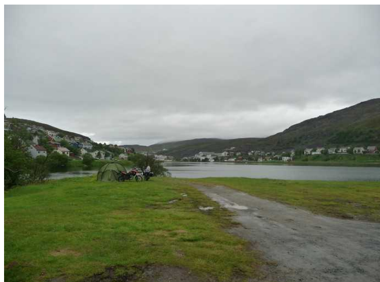
Campingplassen ligger rett ved Storvannet.