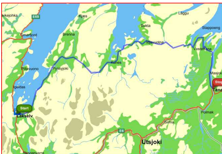
Dag 15 reiser vi fra Lakselv til Tana bru.