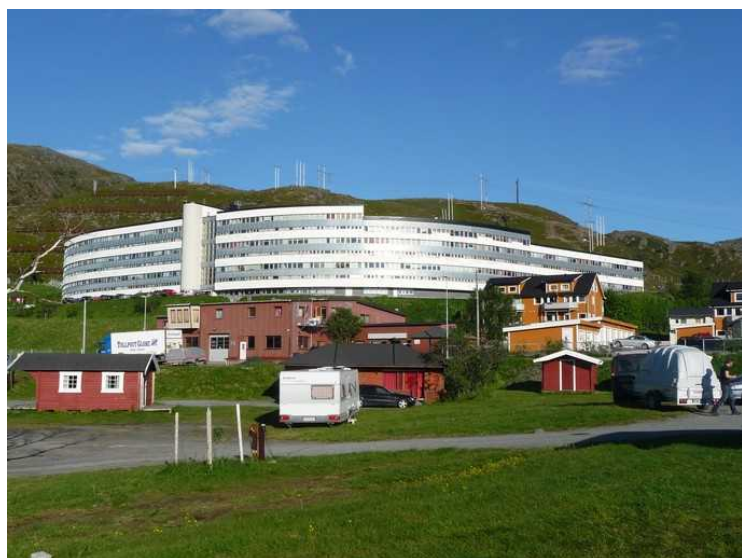
Fra campingplassen ser vi opp på en stor boligblokk.