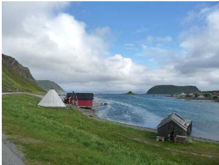
Hytter og lavvo ved Sarnes . Vi ser øya Store Altsula i bakgrunnen.