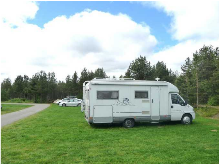
På Karasjok Camping.

Deretter reiser vi over Finnmarksvidda mot Karasjok . Her er vi ved Suotnju.