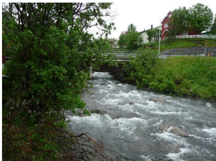
En liten bekk renner forbi plassen.