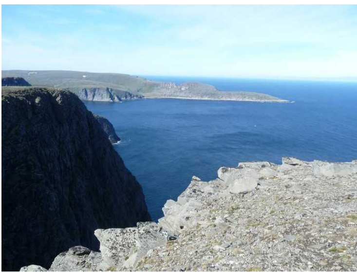
Oppe på platået. Her ser vi vestover over Knivskjelbukta og Knivskjelodden . Odden er Norges nordligste punkt, 1380 m lenger nord enn Nordkapp.