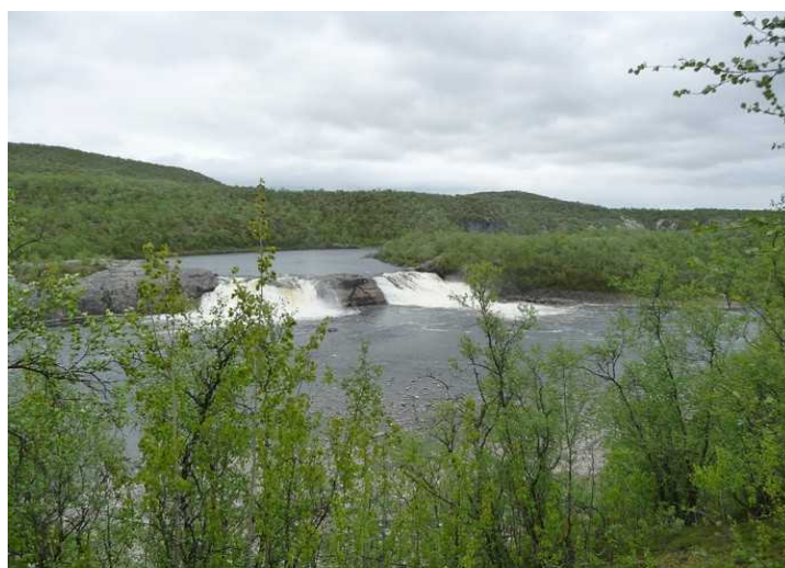
Vi kjører også forbi Pikefossen . Navnet kommer ifølge sagnet av at det vare en jente som ble kastet i fossen fordi hun hadde mistet reinflokken her slik at alle dyrene druknet.