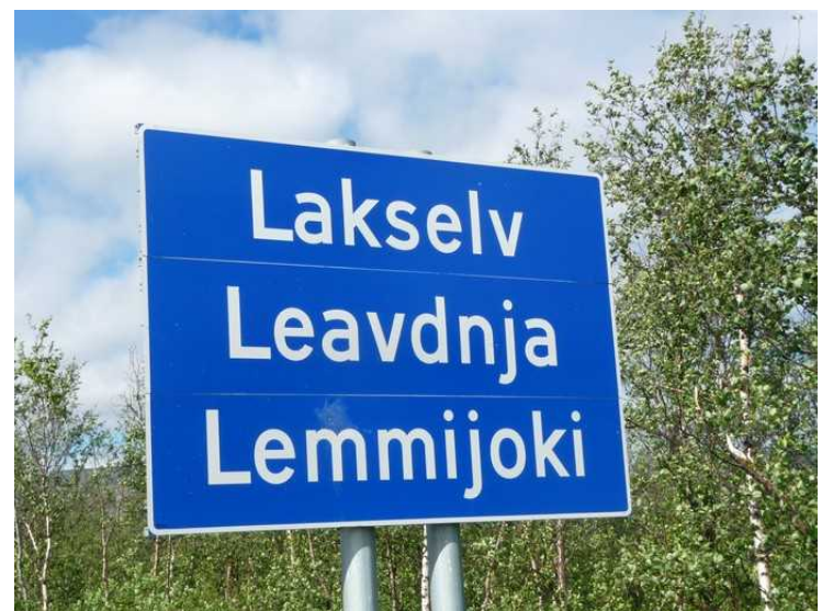
Lakselv er trespråklig, norsk, samisk og kvænsk.