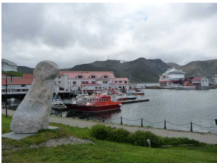
Fra havna i Honningsvåg. Hurtigruten ligger akkurat ved kai.