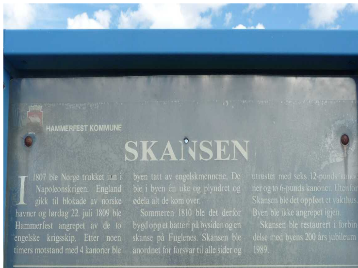
På Fuglenseset ligger også Skansen, et forsvarsverk som ble bygget i 1810.