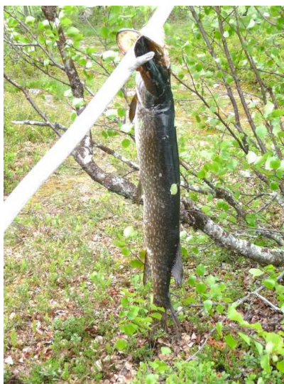
Her er det noen som har gått fra fangsten sin.