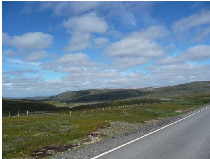
Oppe på Ifjordfjellet.