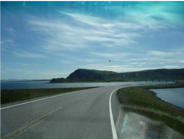
Her vi på vei sydover igjen, ved Kåfjord.