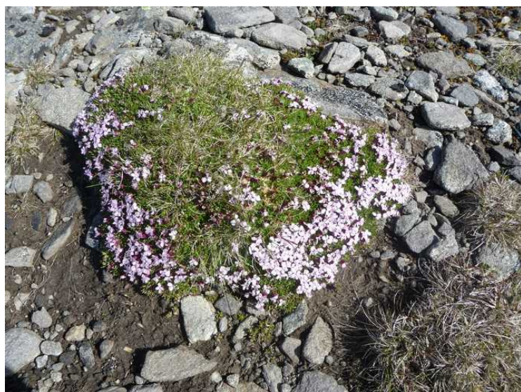
Fremme på Nordkapp tar vi først bilde av en tue med Fjellsmelle .