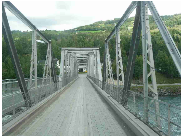
Nede i Gudbrandsdalen igjen. Brua over Gudbrandsdalslågen ved Tretten .