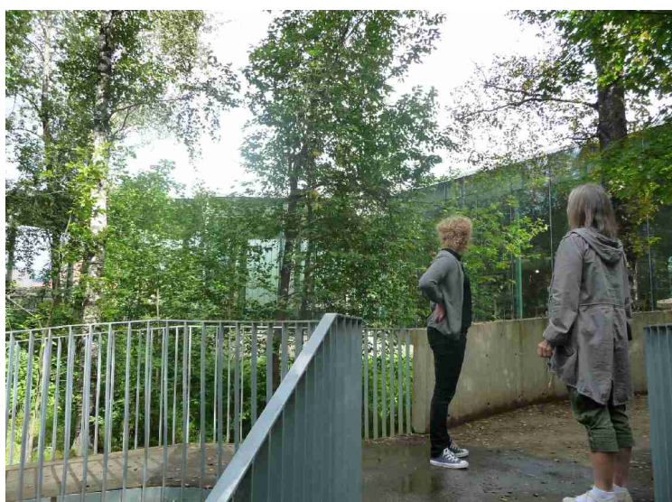
Her er vi tilbake til Publikumsbygget.