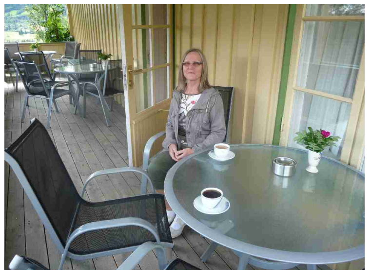
Vi tar en kopp kaffe på kafeen i drengestua mens vi venter på at omvisningen skal starte.