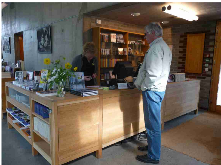
Her kjøper vi billett.