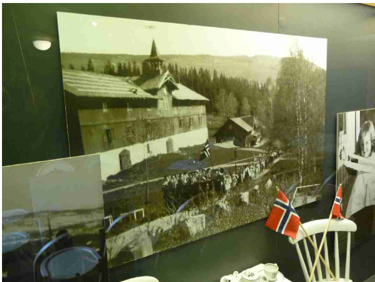
17. mai på Aulestad.