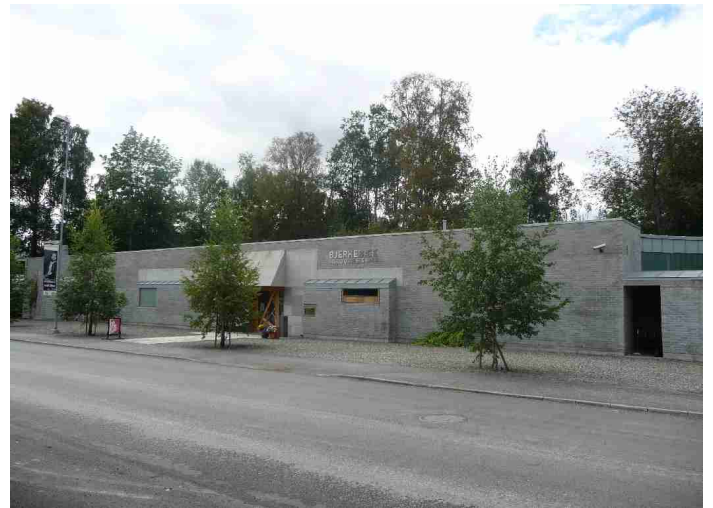
Vi kom for å se Sigrid Undsets hus, som ligger rett ved siden av Håkons Hall. Publikumsbygget inneholder billettsalg, museumsbutikk, museumskafeén Hos møster Sigrid, utstillinger, foredragssal og publikumstoalletter.