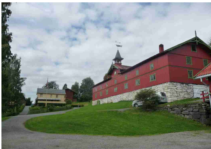
Nå har vi kjørt videre til Aulestad . Her bodde Nobelprisvinneren Bjørnstjerne Bjørnson med sin familie fra 1875 til han døde i 1910. Låven til høyre var under omfattende restaurering.