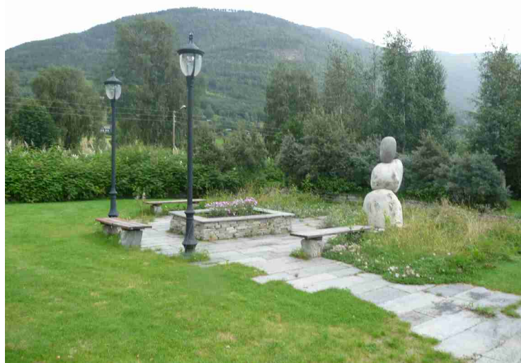
Et bilde fra minnelunden.