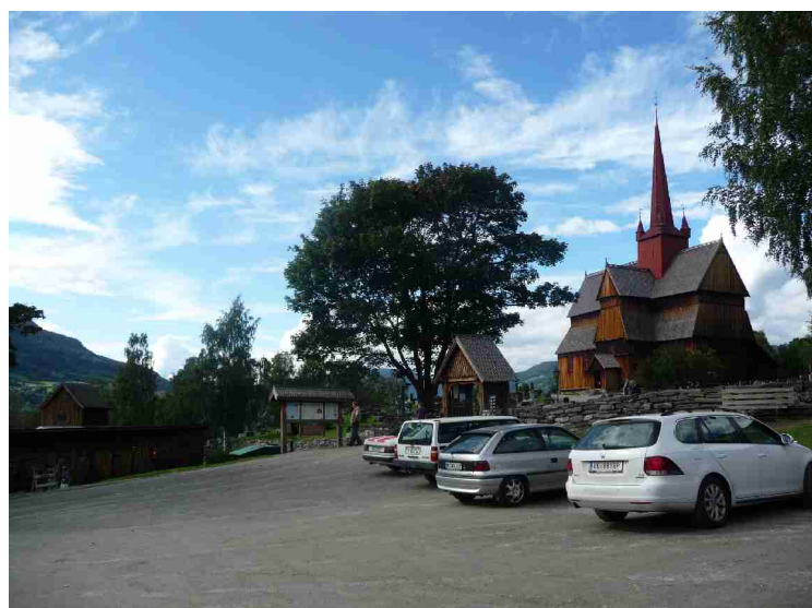
Litt lenger oppe i dalen, kjører vi opp til Ringebu Stavkirke .