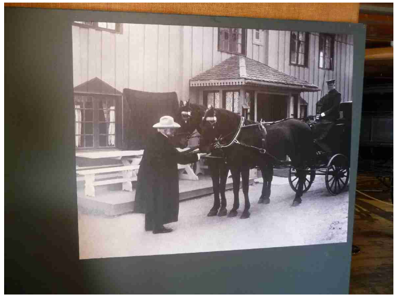
I vognskjulet fant vi et par bilder av Bjørnstjerne Bjørnson.