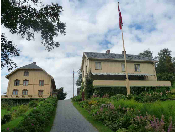
Litt nærmere hovedhuset og drengestua.

Fra 2008 til 2010 holdt museet stengt. Hovedbygningen ble stengt, tømt og tatt ned for restaurering grunnet råte. Det ble avsatt egen post på statsbudsjettet til dette omfattende prosjektet. Huset sto ferdig restaurert til 100-årsmarkeringen av Bjørnstjerne Bjørnsons bortgang i 2010.