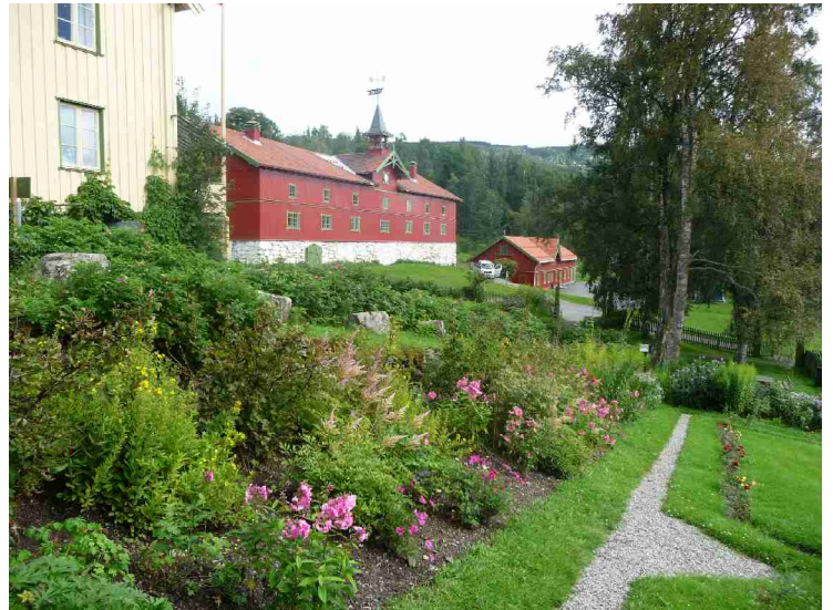
Litt av hagen.