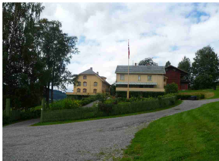
Hovedhuset til venstre og drengestua til høyre.