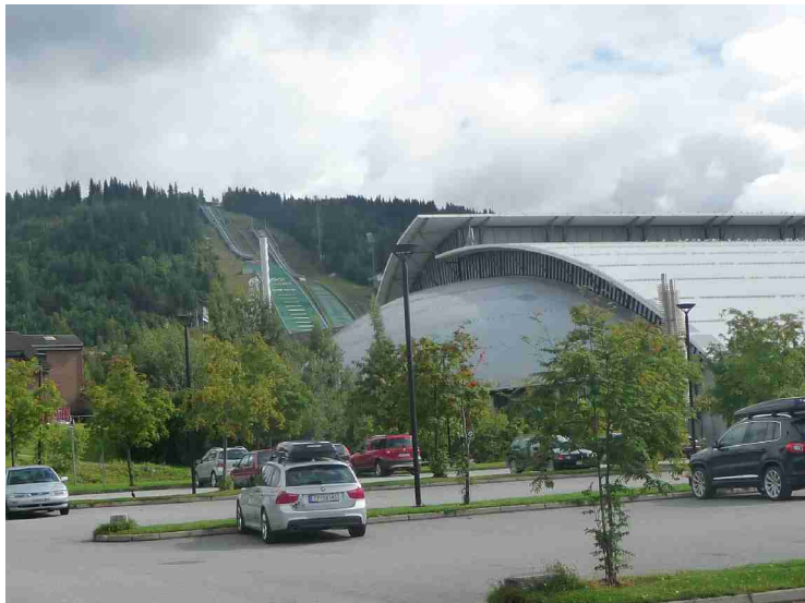
Vi kan se Lysgårdsbakkene i bakgrunnen. Disse ble også bygget for OL i 1994.