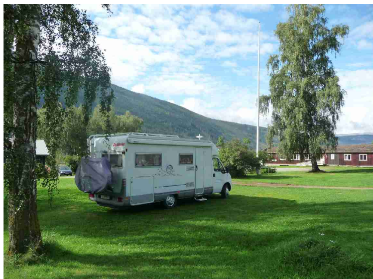
Neste dag er det fint vær igjen. Campingplassen i Kvam heter Kirketeigen Ungdomssenter og Camping .