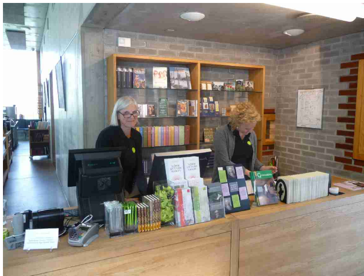
Resepsjonen hvor vi kjøpte billetter.