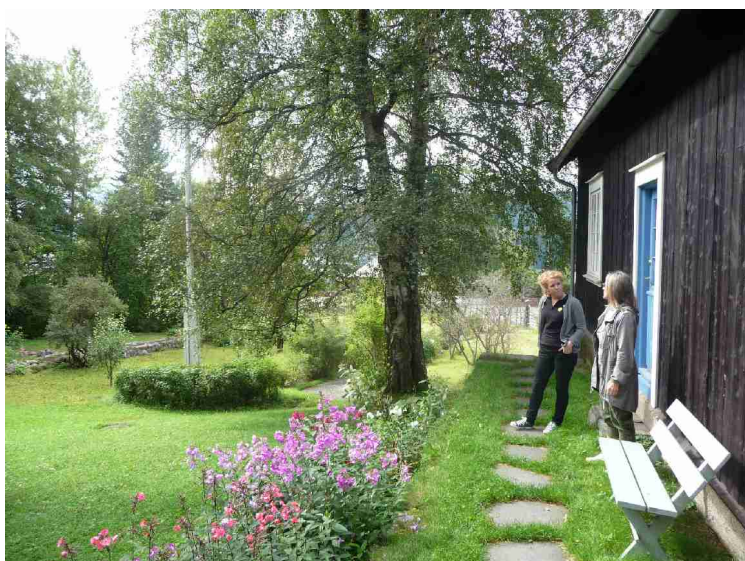
Guiden forteller. Sigrid Undset ga selv navn til hagen. Det ble Bjerkebæk fordi det var mange bjørketrær der og det renner en bekk gjennom eiendommen.