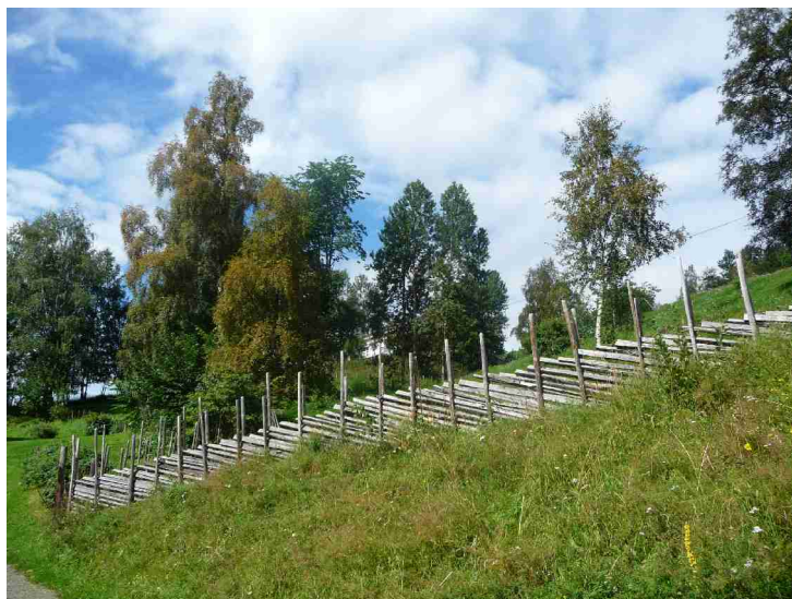
En fin skigard.