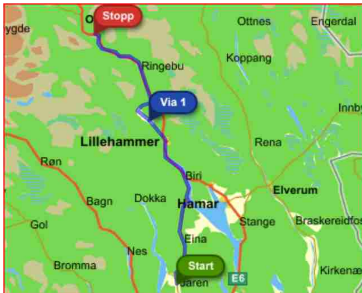
Reiseruten første dagen.