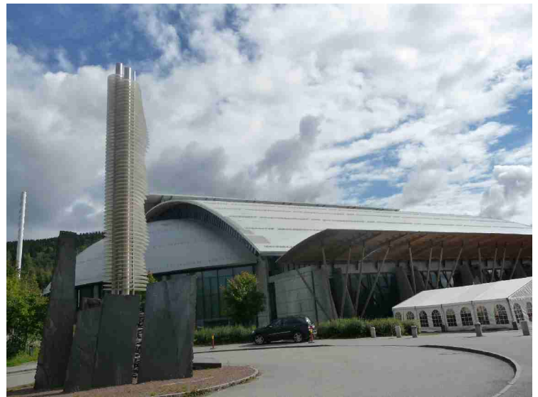
Her vi kommet til Olympiaparken i Lillehammer. Dette er Håkons Hall som ble benyttet under OL i 1994.