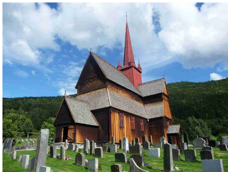
Ringebu stavkirke er bygget ca 1220. Den er en av 28 gjenværende stavkirker i Norge, og en av de største.