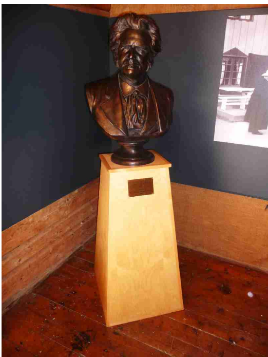
En byste av Bjørnstjerne Bjørnson.