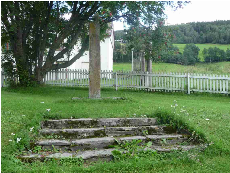
En bauta med Harald Hardrådes navn på.