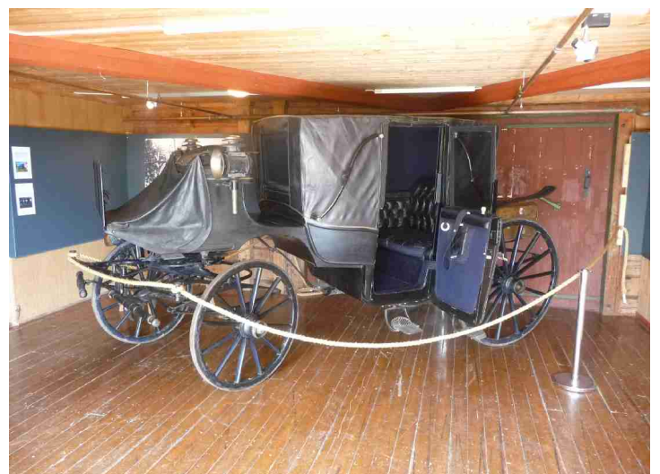
Et par av vognene i vognskjulet.