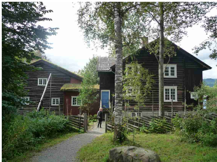
Det er egentlig to hus som er bygget sammen. Begge er gamle tømmerhus som er flyttet fra Gudbrandsdalen.