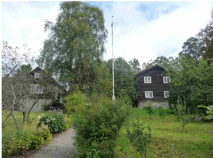
Huset sett nedenfra hagen.