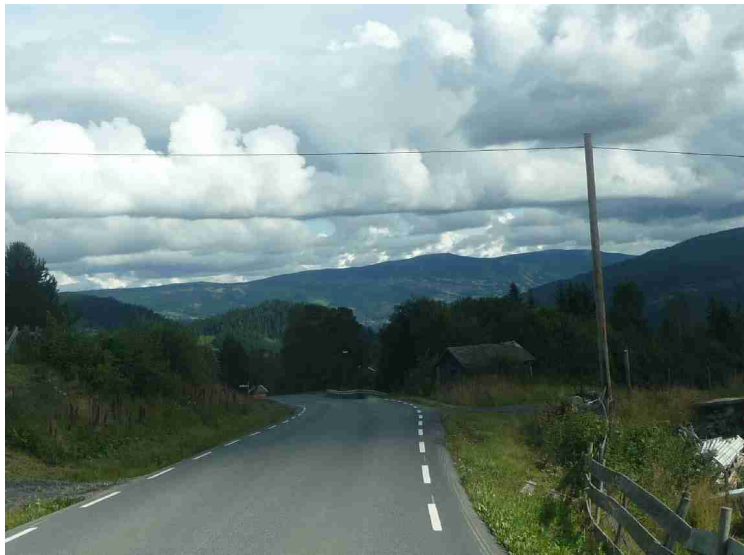
Her er vi på vei videre oppover Gausdalen .