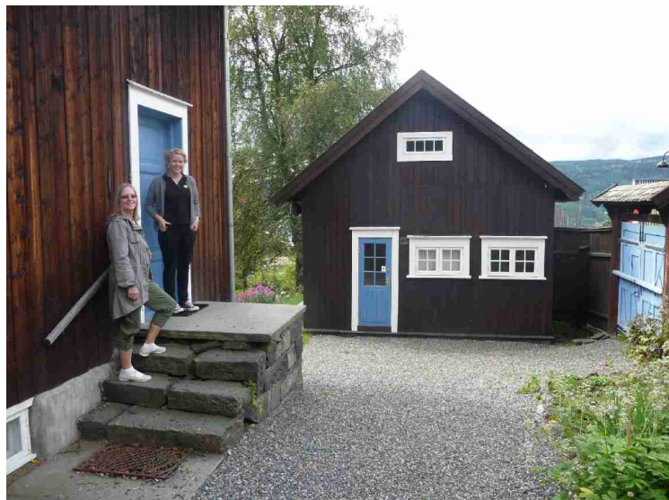
Vi ble guidet gjennom huset. Det var ikke tillatt å ta bilder inne.