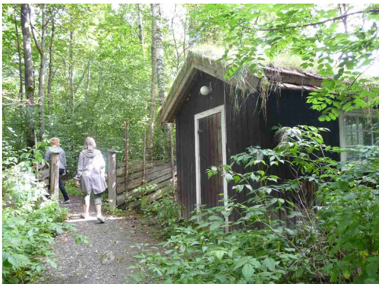
Et liten bu i skogen.