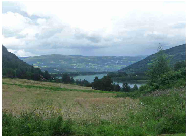
Utsikt ut over Gudbrandsdalen og Lågen.