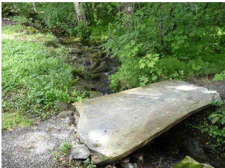
Her går vi over over bekken på en stein-klopp før vi fortsetter oppover gjennom skogen.