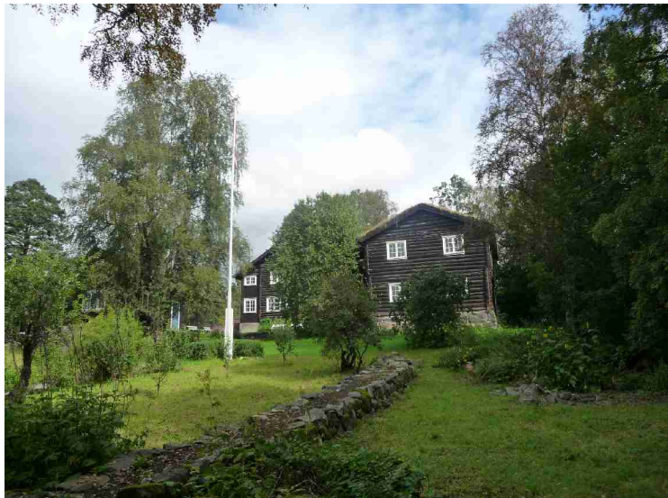
Huset sett fra en litt annen vinkel.