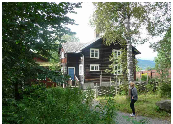
Da vi kom inn ser vi huset som Sigrid Undset bodde i fra 1919 til 1949.