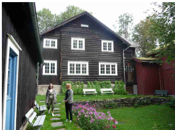
Her har vi vært inne og er på vei ned i hagen .