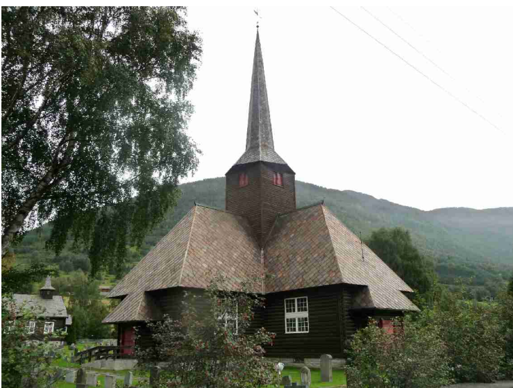
Litt lenger oppe i dalen ligger Kvam . Dette er Kvam kirke som ble bygget i 1952.