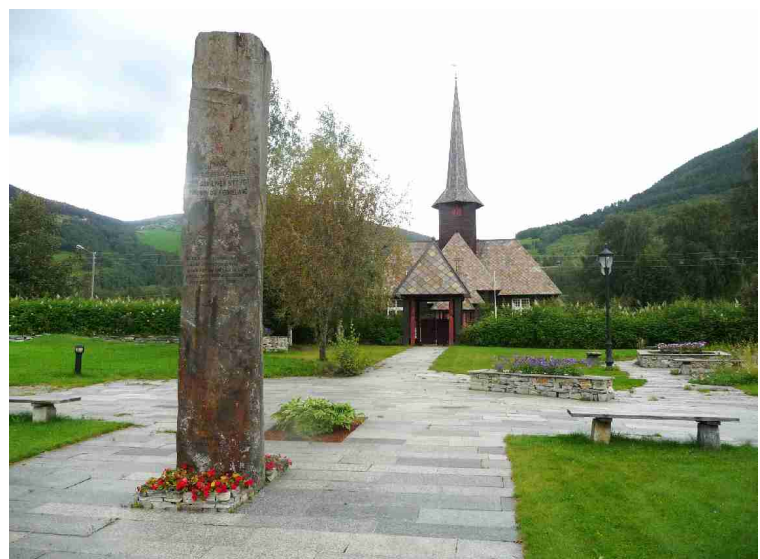
Tvers over veien ligger en minnelund for falne engelsek soldater fra trefninger her i 1940 under siste verdenskrig. Vi ser Kvam kirke i bakgrunnen.