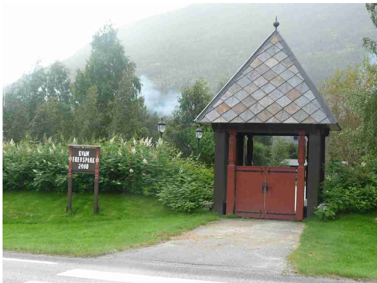
Inngangen til minnelunden.