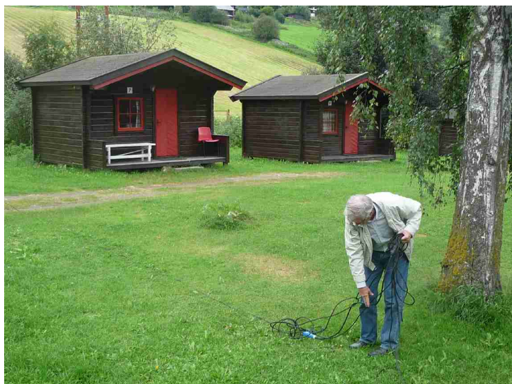
På campingplassen. Kjell er i gang med å kople til strøm, men det ser ut at ledningen er blitt til spaghetti. Det regner litt her.