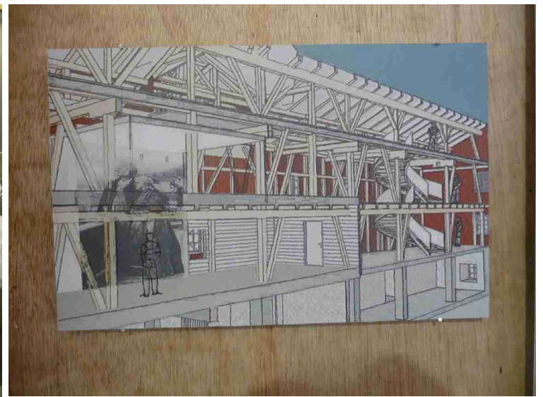
En plakat som viser hvordan låven restaureres.