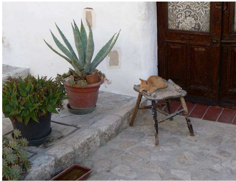
Katten koser seg