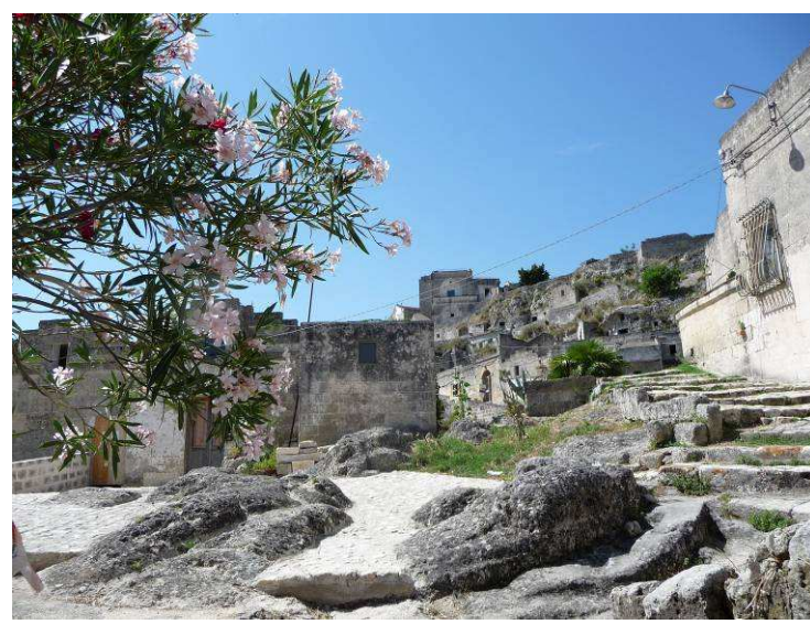
Det er ikke mange rette linjer her