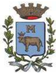
Byvåpenet til Matera