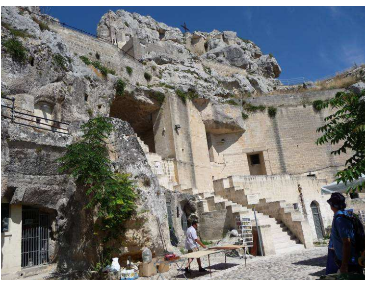
Her er et stort grottehus