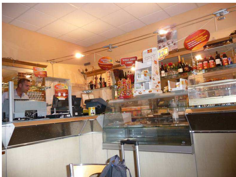
Her er han som jobbet i baren

Mens vi ventet på denne spurte vi hva likøren het. Vi sa at vi syntes den var god. Da fikk vi hele flaska.