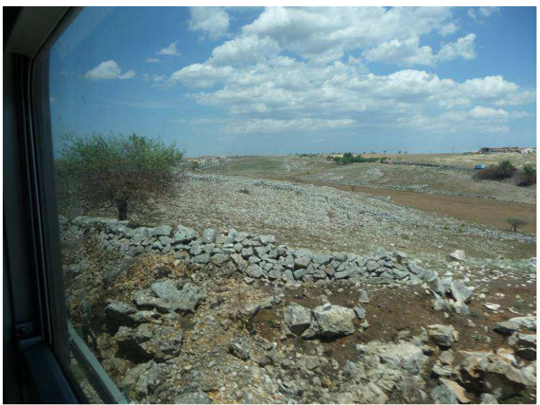
På vei tilbake til Bari med toget ser vi at det er ikke bare på Jæren at det er mye stein