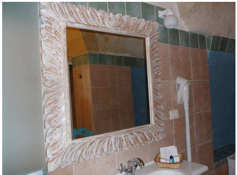
Her er et par bilder fra badet