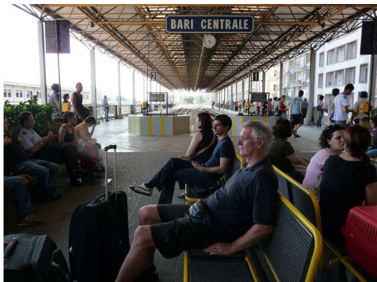
Her sitter vi og venter på toget som skal til Matera

Det var litt vanskelig å finne ut hvor toget til Matera gikk fra, for det var mange lokale tog som gikk ut fra Bari og de ble drevet av forskjellige selskap. Vi spurte rundt og vi ble til slutt henvist til en annen bygning på stasjonsområdet. Her