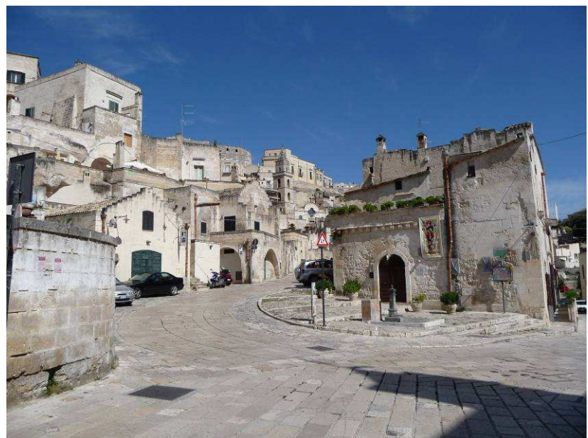
Her er vi på sightseeing i gamlebyen Sassi