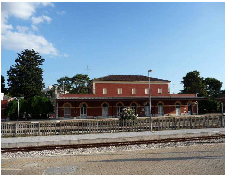
Her er vi på Altamura. Det viste seg senere at vi skulle ha gått av her og skiftet tog, men det var det ingen som fortalte oss