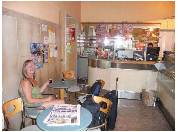
Deretter gikk vi inn i baren på stasjonen og bestilte Grappa. De hadde ikke mer igjen så vi fikk noe lokal likør.