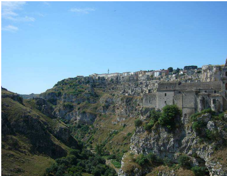
Her ser vi videre nedover dalen. Bygningene oppe på høyden hører til den nye bydelen