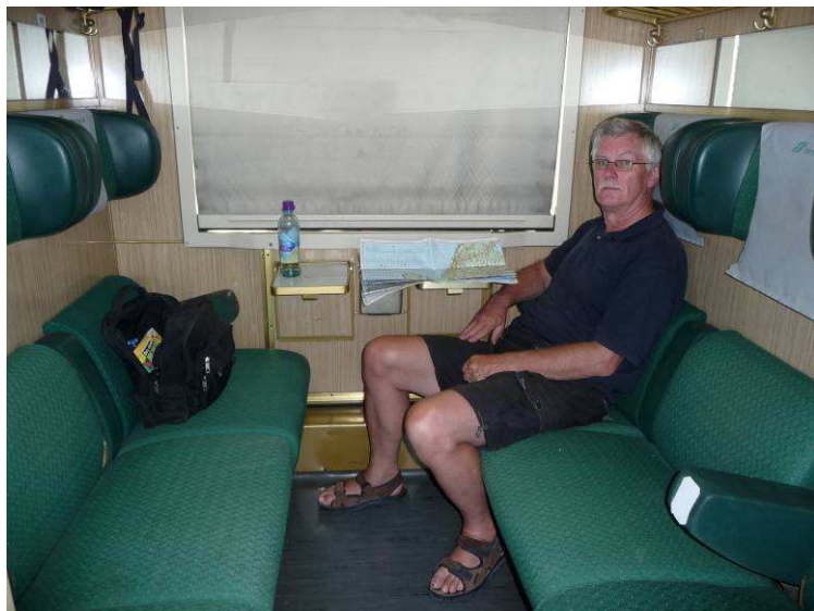
Her er vi på toget fra Pescara til Bari

Denne dagen reiste vi videre med toget til Bari. Derfra skulle vi videre til Matera.