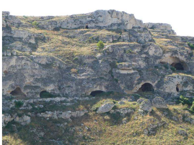
Her ser vi tvers over dalen på noen eldgamle huler som det fremdeles bor folk i