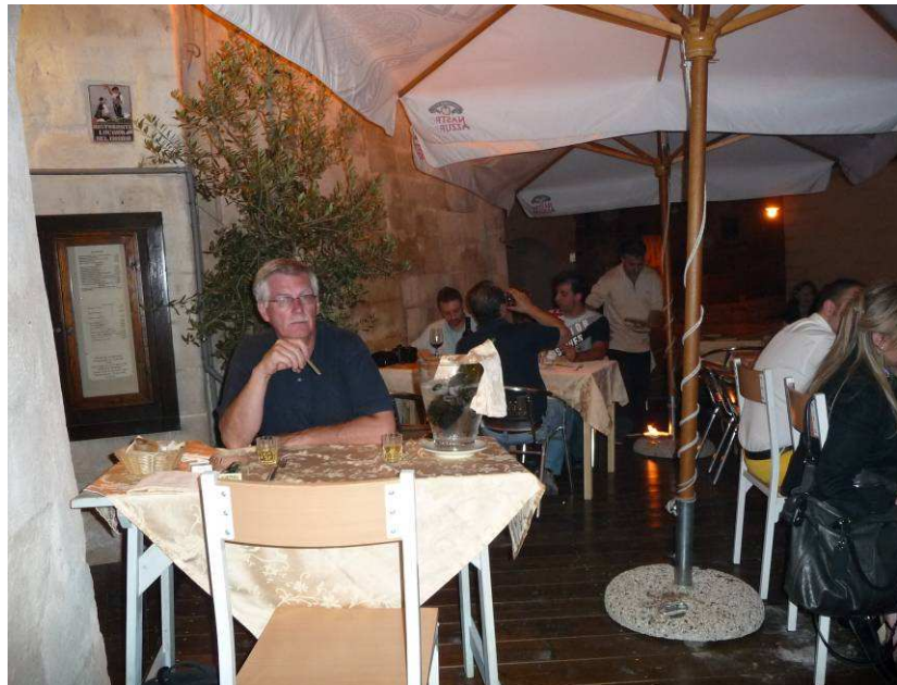
Her er vi ute og spiser om kvelden på en restaurant rett bortenfor hotellet