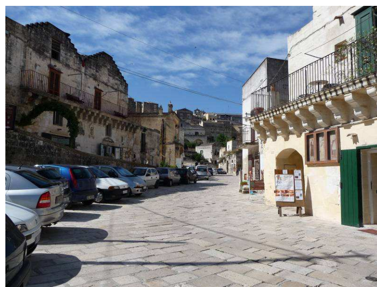
Det er mulig å kjøre bil noen steder