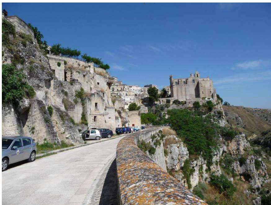
Her ser vi en annen høyde med kirken San Agostino på toppen. Dette er en klosterkirke som ble grunnlagt i 1592 av Eremittmunker, som innlemmet den i kirken Santa Maria delle Grazie, som var blitt bygget av Augustinerne over en gammel 11-talls kirke som var tilegnet St William. Et fryktelig jordskjelv i 1734 la alt i ruiner, men det ble bygget opp igjen.