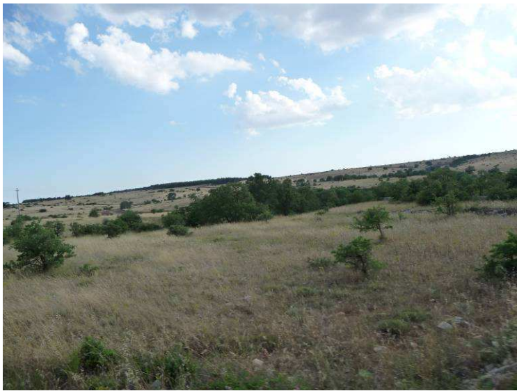
Typisk landskap i dette området