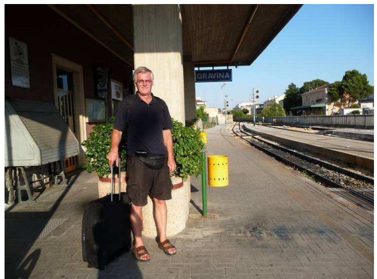
Her står vi og lurer på hva vi skal gjøre nå.