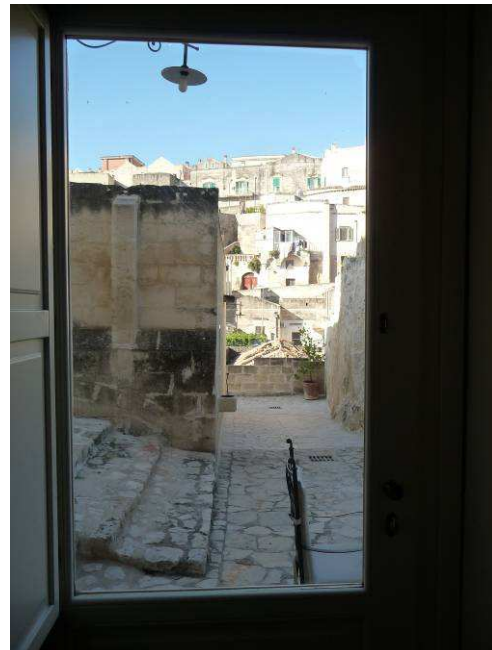
Utsikten ut gjennom døra neste morgen