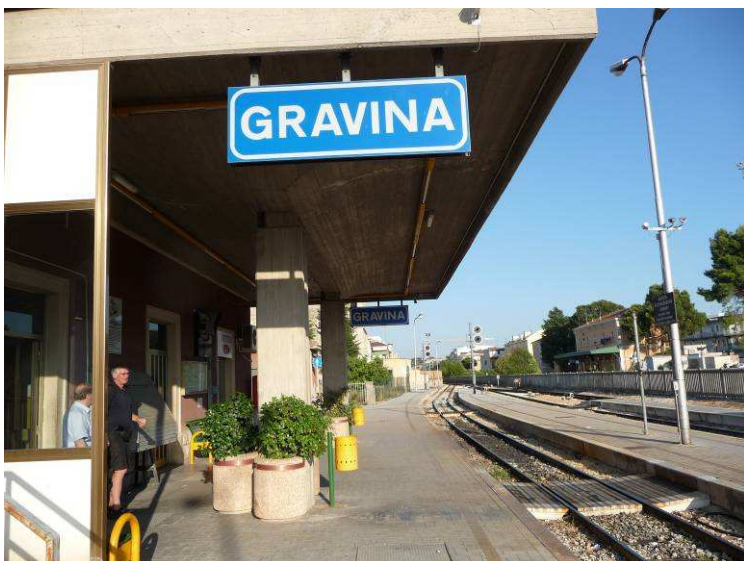
Toget gikk ikke lenger, så her måtte vi bare gå av.