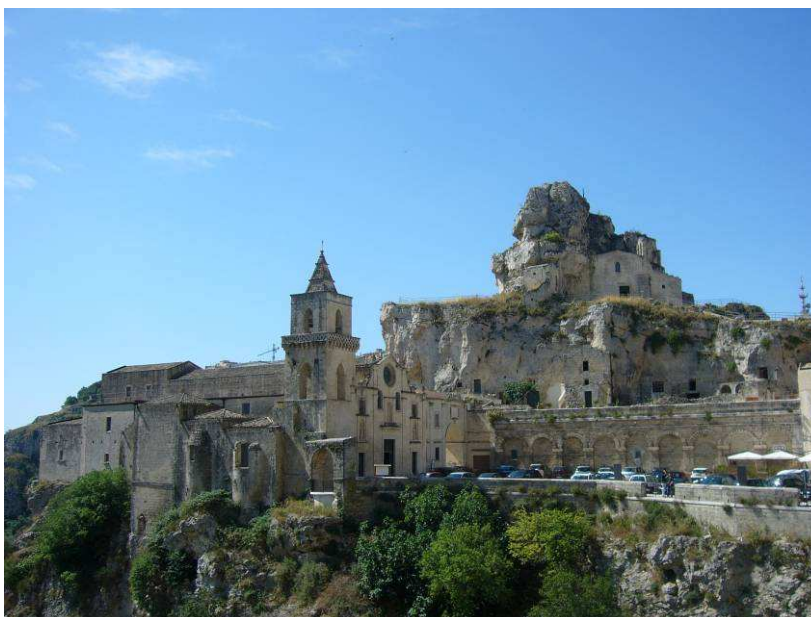
Dette er kirken San Pietro Caveoso