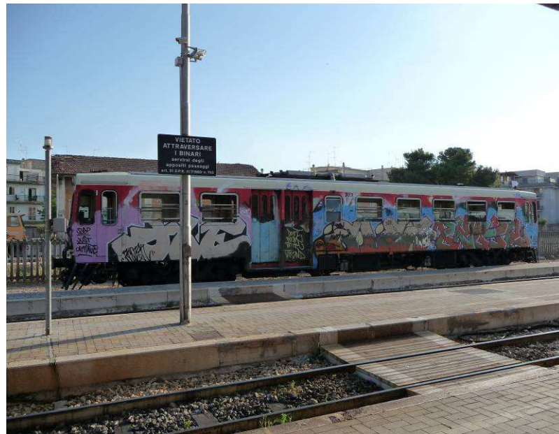
Her er vi kommet til Gravina. Togvogn med mye graffiti.