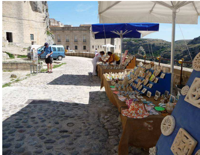
Kjell står i bakgrunnen og kjøper postkort