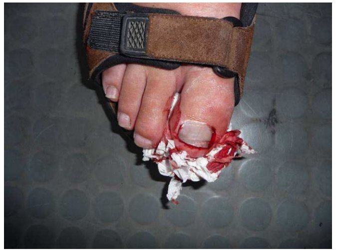
Da Kjell skulle løfte koffertene opp på hylla, hengt neglen seg opp i kofferten og han holdt på å rive av hele neglen så blodet sprutet.