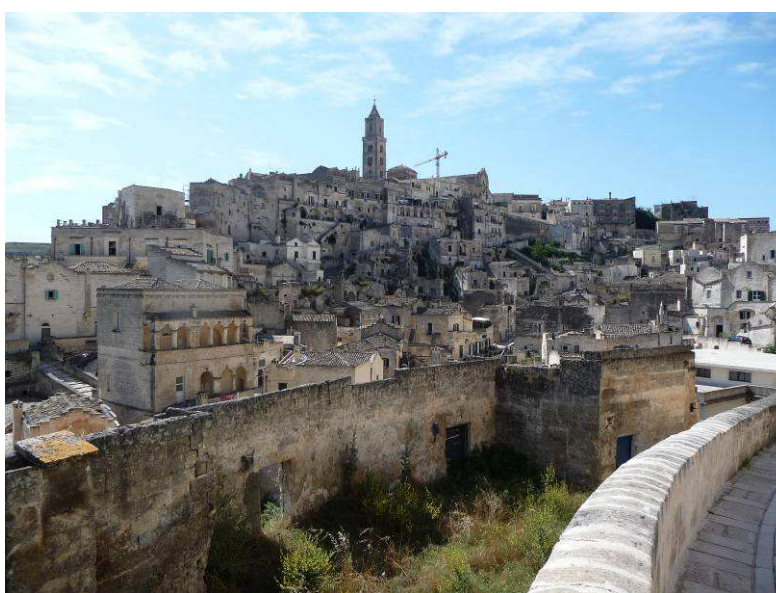
Her ser vi en av høydene i byen med kirken San Francesco d'Assisi på toppen. Den er opprinnelig fra det 1300-hundreåret, men er påbygget og endret flere ganger.