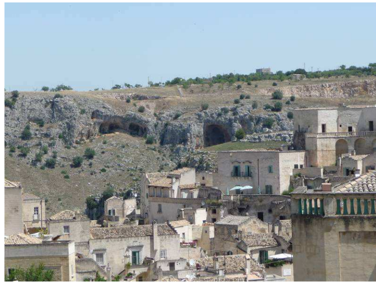
Her ser vi tilbake i retning av de eldste hulene