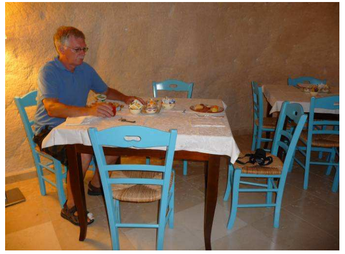
Her spiser vi frokost