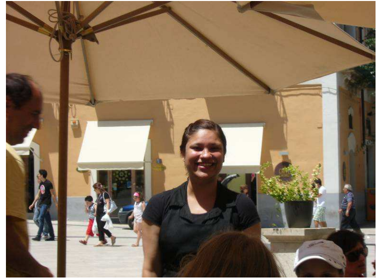
Her er hun som tar bilder av oss