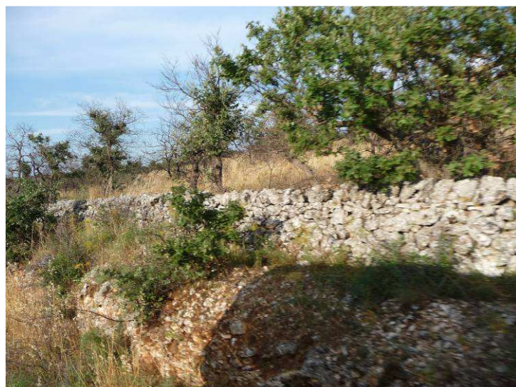
Det var mange olivenlunder langs toglinja