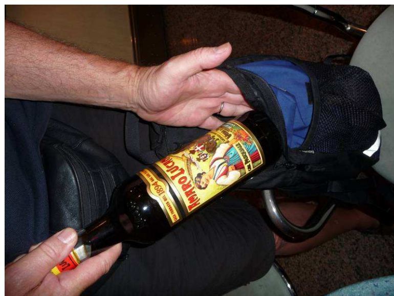
Kjell pakker flaska ned i sekken