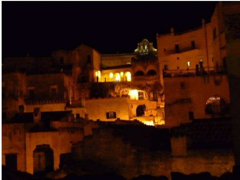
Her er et par kveldsbilder tatt fra terrassen vår. Hotellet vårt lå midt i Sassi, så det var ganske spesielt.