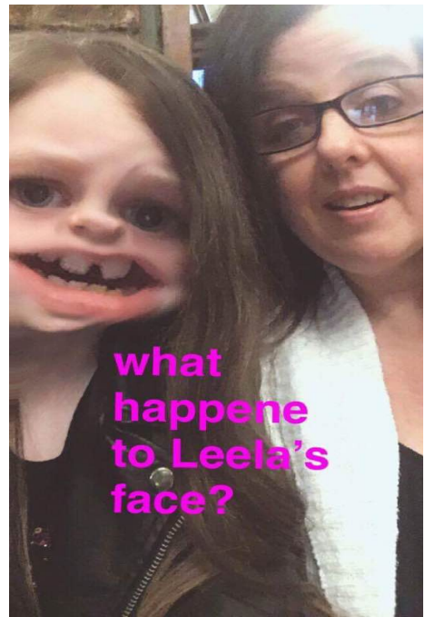
Til slutt noen morsomheter med mobilkameraet.