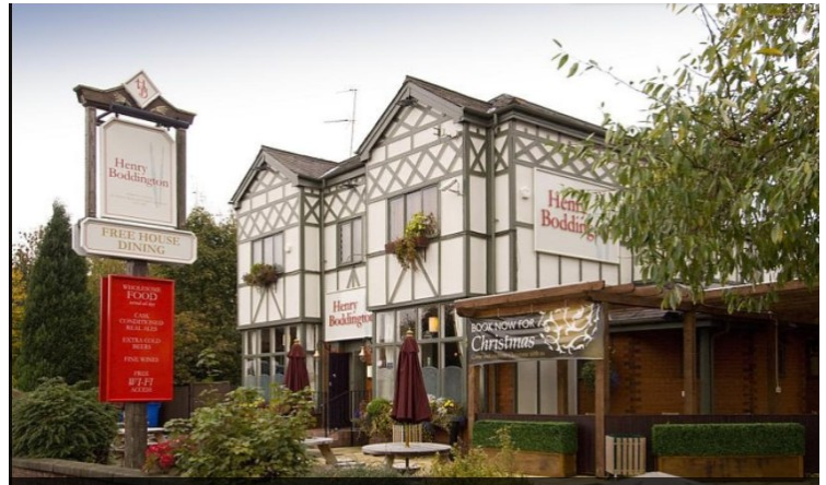
Rett ved siden av hotellet ligger denne puben, Henry Boddington, Swinton . Vi spiste frokost her. Jeg hadde som regel en small breakfast .