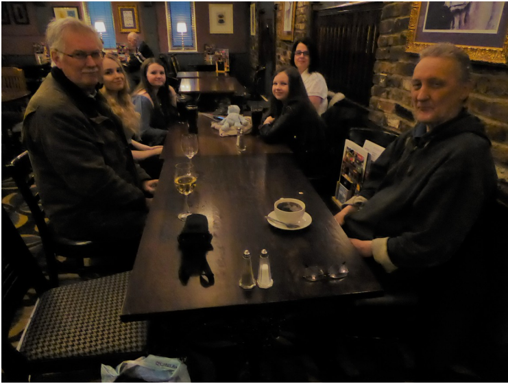
Diverse bilder som ble tatt før vi fikk maten.