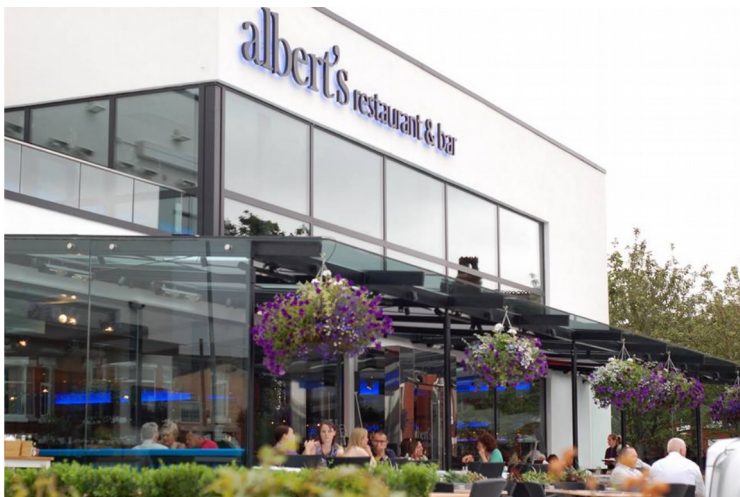
Vi hadde planlagt å spise på Albert's Restaurant & bar , som skulle være blant de beste restaurantene i bydelen.