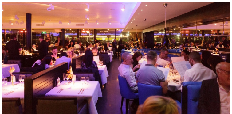
Vi hadde ikke bestilt bord. Det var en stor tabbe, for det var fullbooket. Vi bestemte oss for å spise på Henry Boddington i stedet for. Det er ikke noe å rope hurra for, men det er grei pub-mat.