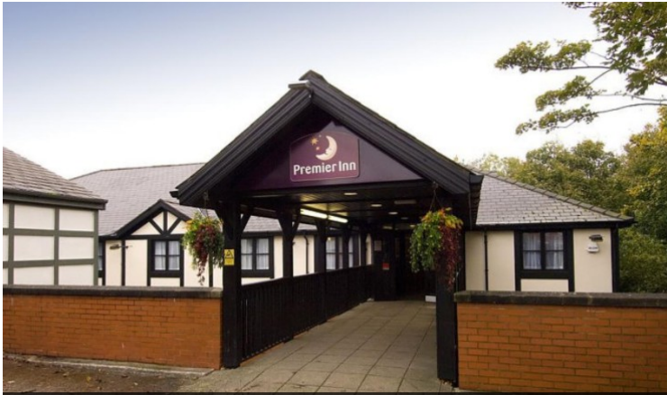
Vi hadde bestilt på Premier Inn Manchester – Swinton. Inngangen