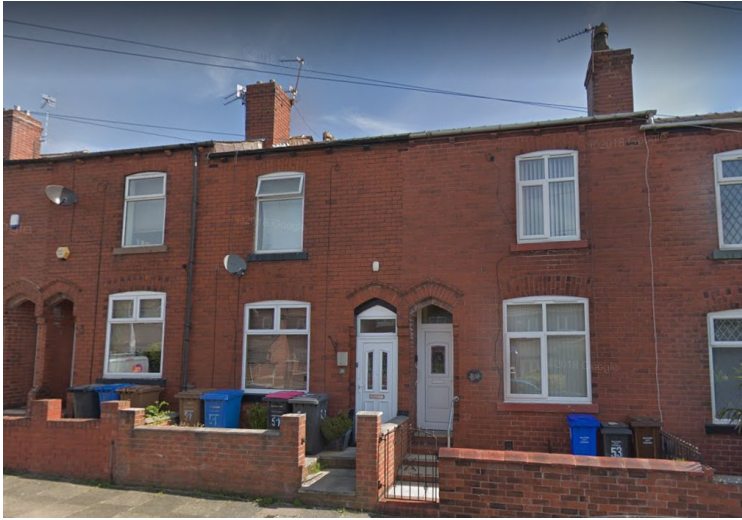
Dette er leiligheten hvor de bor. Bildet er klippet fra Google Maps.