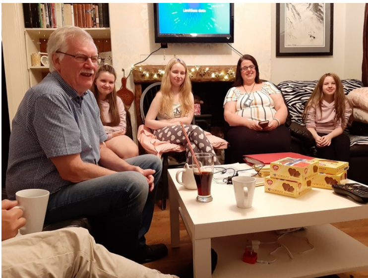
Vi hadde med norsk sjokolade og norsk potetgull med ost og løk.