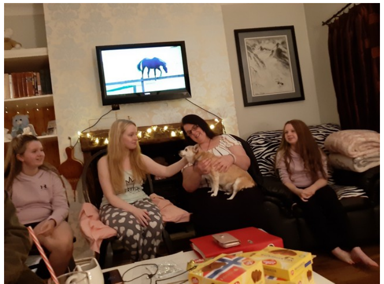
Hunden Love vil også være med på selskapet. Den overtar helt.