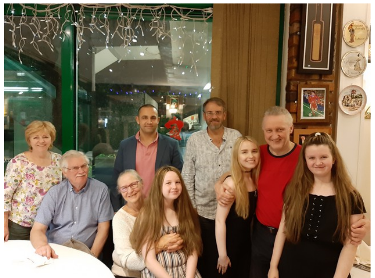
Gruppebilde helt til slutt.

Neste morgen bestilte vi en taxi til klokka 09.00. Så spiste vi en lett frokost på Henry Boddington. Jeg var mett fra kvelden før, så jeg hadde bare en kaffe.