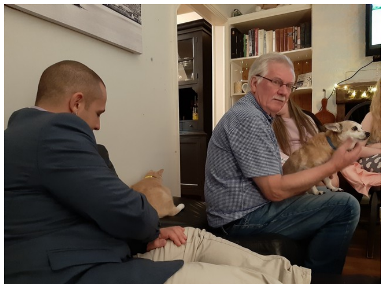
Katten er også med.