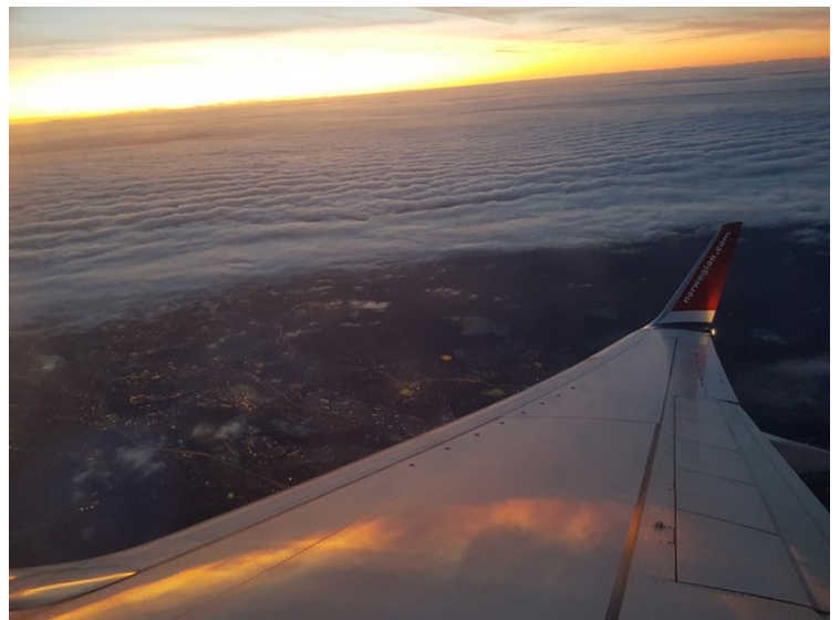
Så fikk vi et bilde av solnedgangen.

Vel tilbake på Gardermoen var det å bli med Dalen Parkering for å hente bilen der. Hjemme igjen i 7-tida.