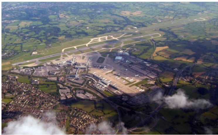
Så forlater vi flyplassen.