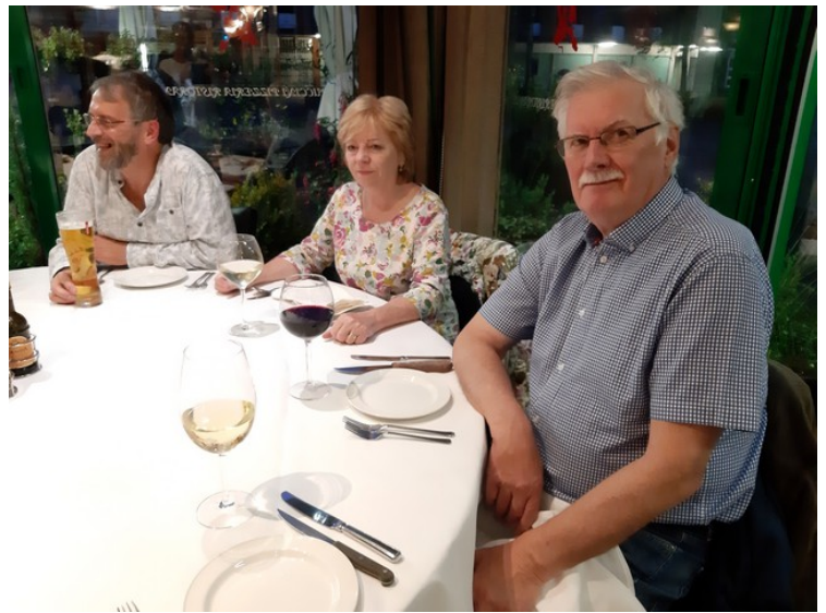
Så følger noen bilder fra restauranten.