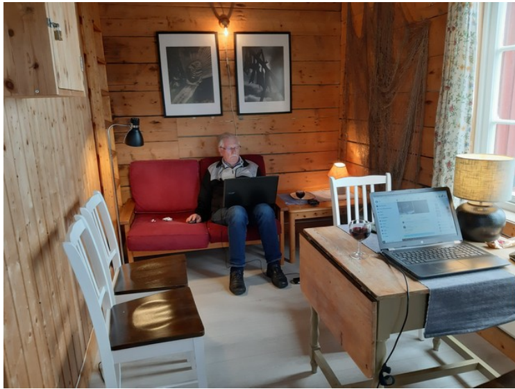
Her er vi på plass i hytta. Jeg sjekker dagens nyheter.

I dag er turismen stadig viktigere for Å, selv om stedet tradisjonelt har vært et fiskevær med blant annet tørrfiskhjeller og trandamperi. På Å finnes to museer: Lofoten Tørrfiskmuseum og Norsk Fiskeværsmuseum .