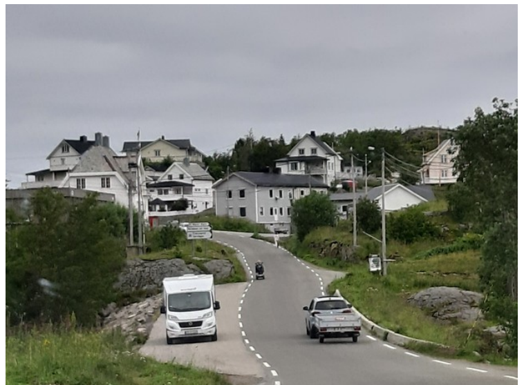
Dagen etter, den. 14. juli kjørte vi tilbake i retning flyplassen. Her kjører vi gjennom Sørvågen .