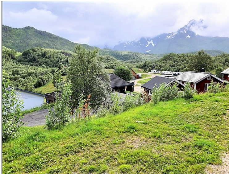
Dette er utsikten fra hytte 5.