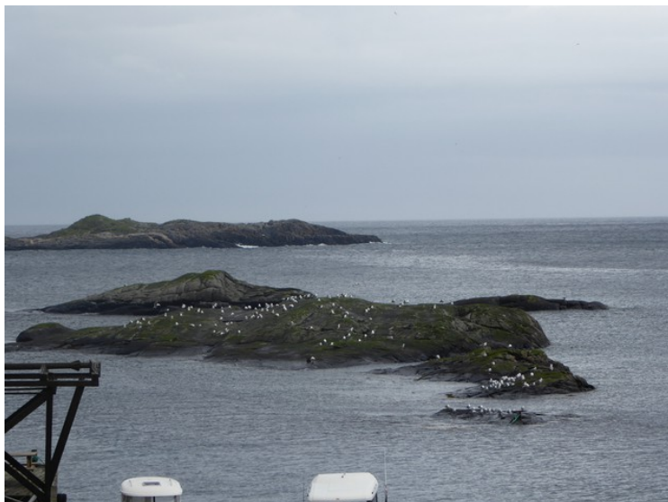
På en holme ute i vågen var det mange fugler. Holmene heter Skarvskjæran.