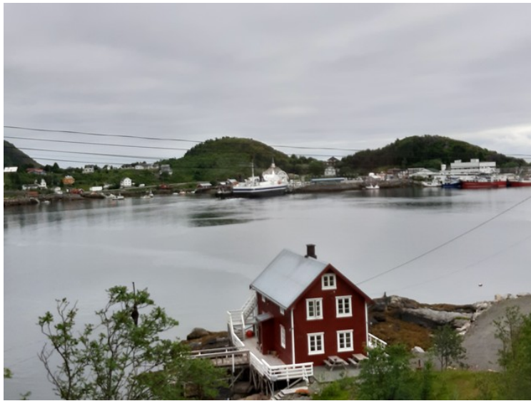
Her ser vi tvers over Moskenesvågen. Der er der fergeforbindelse til Værøy, Røst og Bodø.