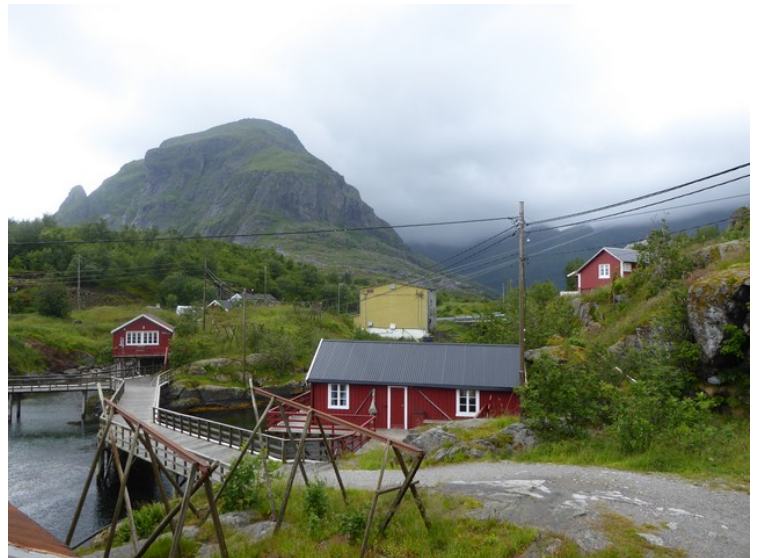
Her går det gangbru over vågen og inn mot sentrum.