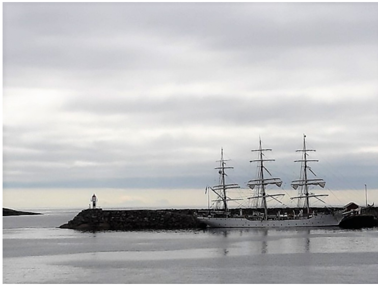
Her ser vi over mot Fiskarskjæret på Reine.