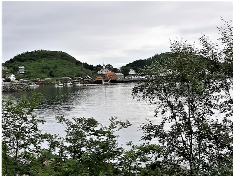
Moskenesvågen. Vi ser Moskenes kirke midt i bildet.