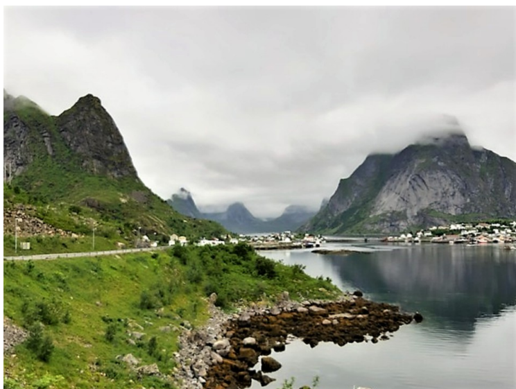
Så kjørte vi videre mot Reinebruene. Vi ser Reinevågen til høyre. Bakerst til høyre ser vi Olstinden.

Vi stoppet på Reinehalsen og tok noen bilder av Reine . Reine er administrasjonssentrum i Moskenes kommune. Over Reinefjorden går hovedveien over flere småøyer som er forbundet med bruene. Bruene kalles for Reinebruene . De var ferdige i 1981. Tidligere gikk det ferge mellom Reine og Hammøy . Disse øyene heter Andøya, Sakrisøya , Olenilsøya og Toppøya.