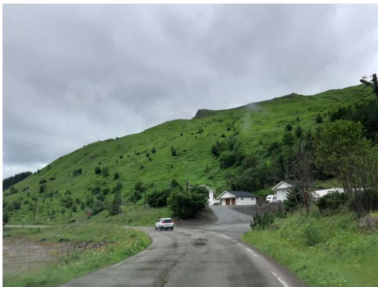
Den 13. juli fortsetter vi turen mot Å i Lofoten.