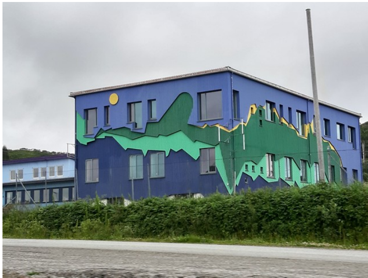
Fra Moskenesøya kjørte vi over Flakstadøya til Vestvågøya . Fargerikt hus på Leknes . Leknes fikk bystatus i 2002, og er sammen med Svolvær en av de to byene i Lofoten.