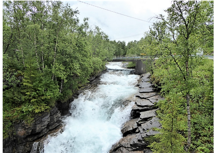
Fossen ovenfor brua.

Før vi kom ut på hovedveien la vi merke til denne fine brua over fossen.