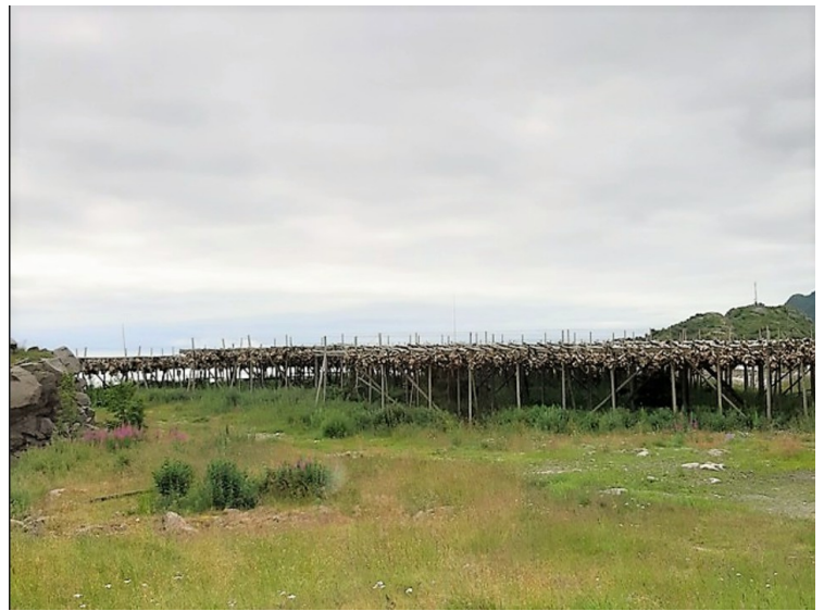
Her er det mange torskeshoder som fremdeles henger til tørk. Det er et biprodukt i tørrfiskproduksjonen og de males ofte opp til gjødsel. Mye eksportere også til Afrika, spesielt Nigeria.