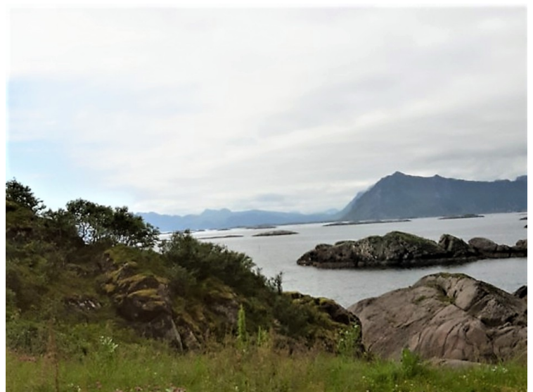
Utsikt tvers over Gimsøystraumen mot Vestvågøya.