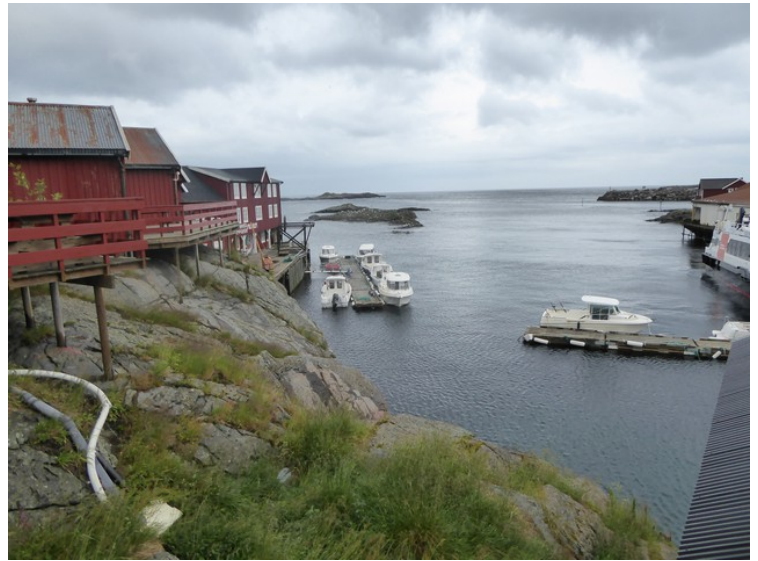
Utsikten fra rorbua.