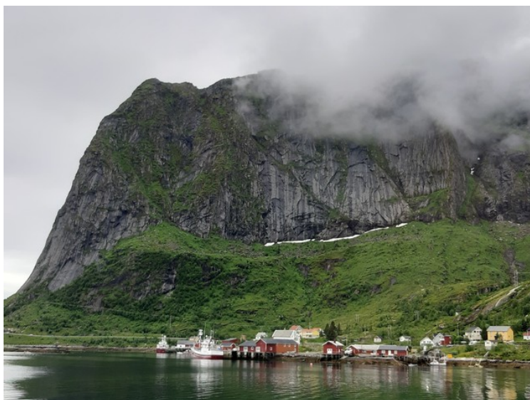
Her ser vi tilbake over Reinevågen og Reinebruene .