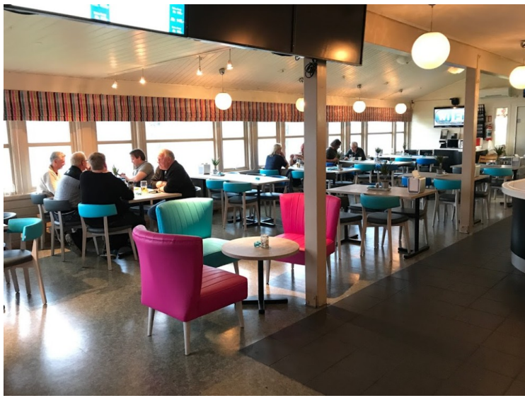
Dette er fra restauranten hvor vi spiste middag og frokost.