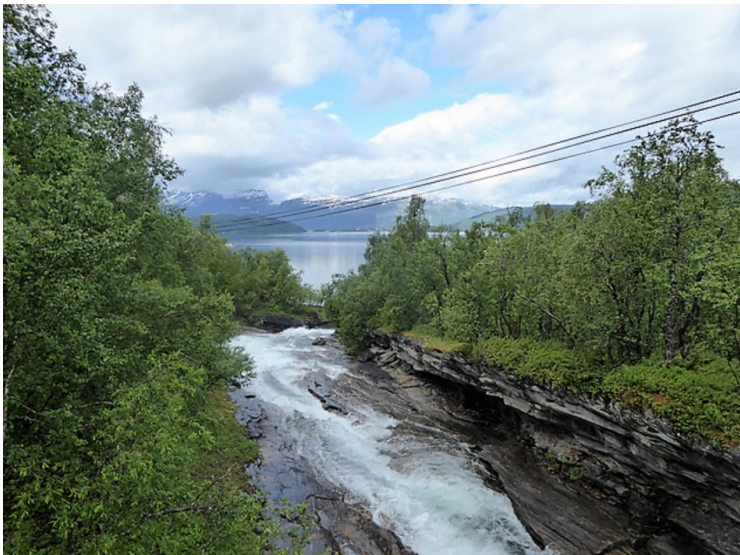
Fossen nedenfor brua.

Elva heter Sagelva. Den har gravet ut mange grotter i fjellet med sammenhengende ganger mellom. Det er flere aktører som arrangerer grottevandring.