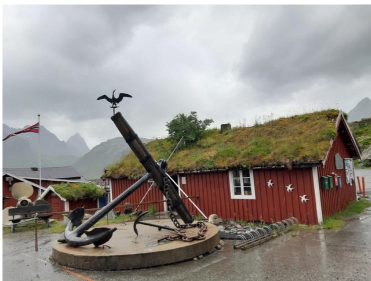
Vi kjørte innom Sund . Det regnes som et av de eldste fiskeværerne i Lofoten. Her er det et fiskerimuseum og smeden i Sund holder til her.