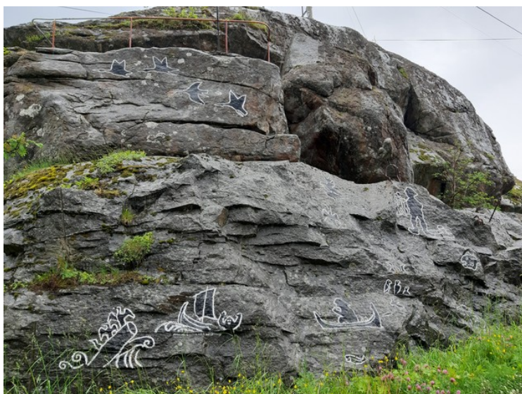
Graffiti på en bergvegg ved fiskerimuseet.