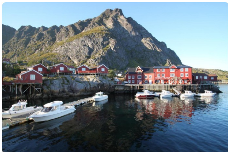
Vi hadde booket en rorbu hos Å-Hamna Rorbuer . Vi fikk rorbu nr. 3 fra venstre.