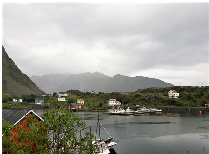
Dette er innerst i Sundvågen.