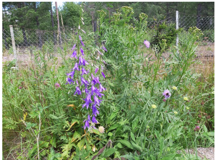
Det vokste en del blomstrende planter langs jernbanesporet.