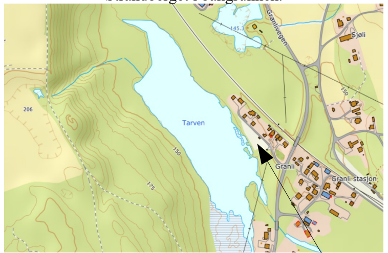
Det parklignende området ligger her.