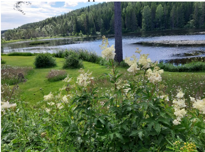
Det er gjort en stor jobb her.