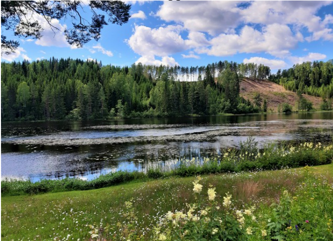
Neste stopp er ved Tarven.