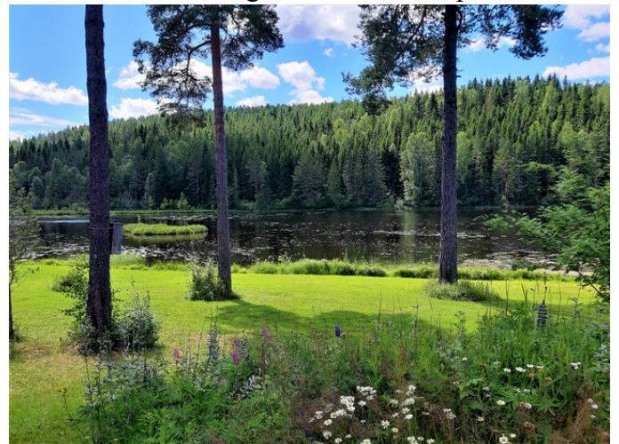
Strandberget i bakgrunnen.