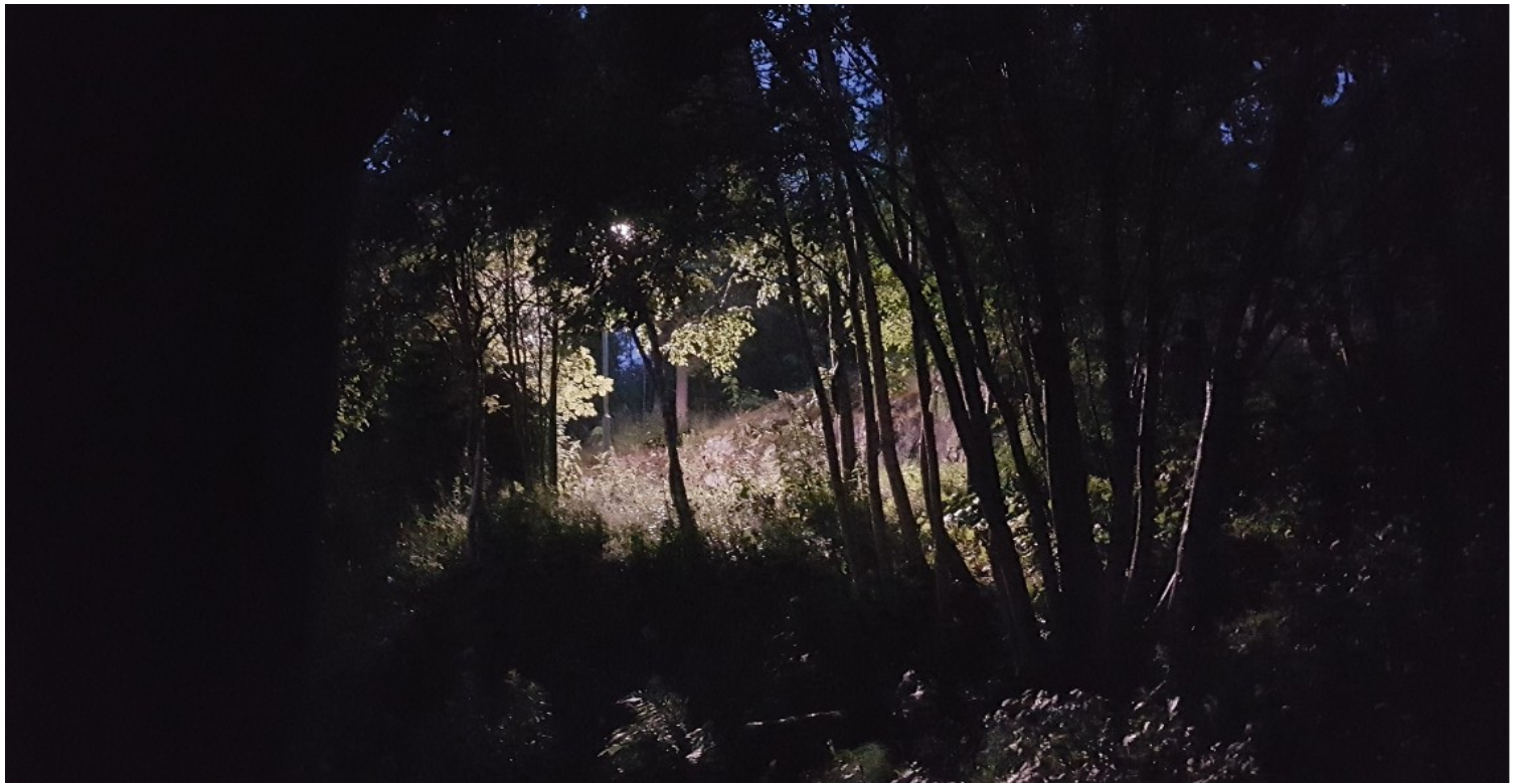
Dette er om kvelden på baksiden av blokka der vi bor.