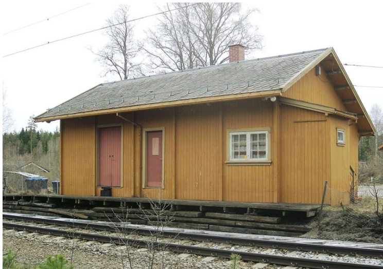
Dette er stasjonsbygningen på Granli. Dette bildet er tatt fra Wikipedia. Da vi var der, så det ut til å trenge maling.

Etterpå reiste vi bort mot Granli stasjon . Det er en nedlagt stasjon på Kongsvingerbanen som går mot Sverige. Når vi tar av fra hovedveien mot stasjonen, står denne trestammen med markering av hvor høyt vannet har nådd når det er flom i Glomma . Den øverste markeringen er et skilt som sier at dette er flommerker. Det høyeste var i 1995. Det nest høyeste var i 1967. Normalt renner vannet fra Vingersjøen ut i Glomma, men når det er flom i Glomma renner vannet fra Glomma inn i Vingersjøen. Når vann-nivået her blir høyt nok renner vannet videre sørover inn i Tarven og videre ned til Vrangselta som fortsetter til Vänern og Götaelv .