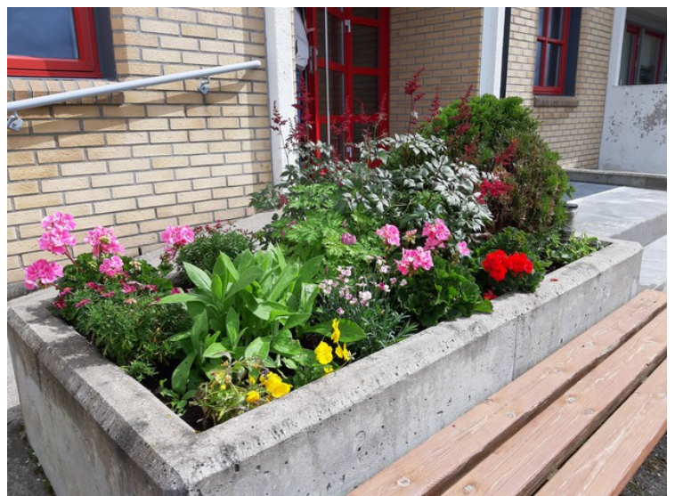
Dette er utenfor inngangen hjemme hos oss.