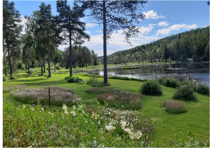
Her er det laget nesten som en park.