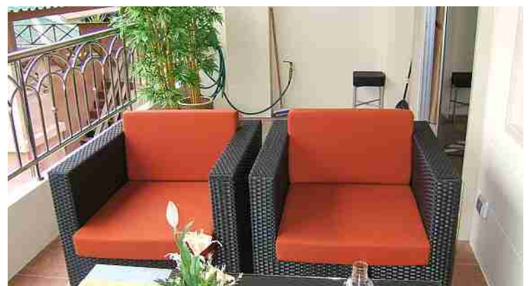
Bilder fra leiligheten.