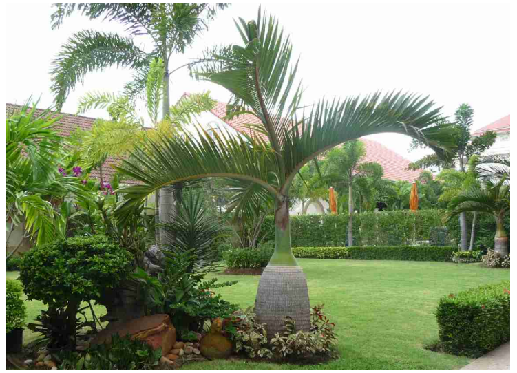
Det er fin beplantning utenfor.