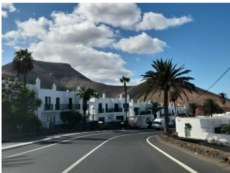
Utkanten av Yaiza . Byen er blitt kalt den vakreste byen i Spania,