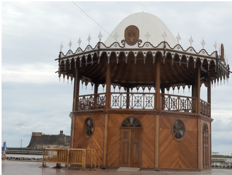
Her er vi på Avenida la Marina med José Ramírez Cerdá Park.