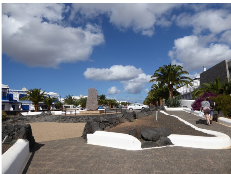
Her kan vi gå fra gata og ned på strandpromenaden.