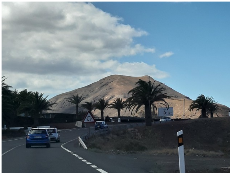
Nesten tilbake i Yaiza.