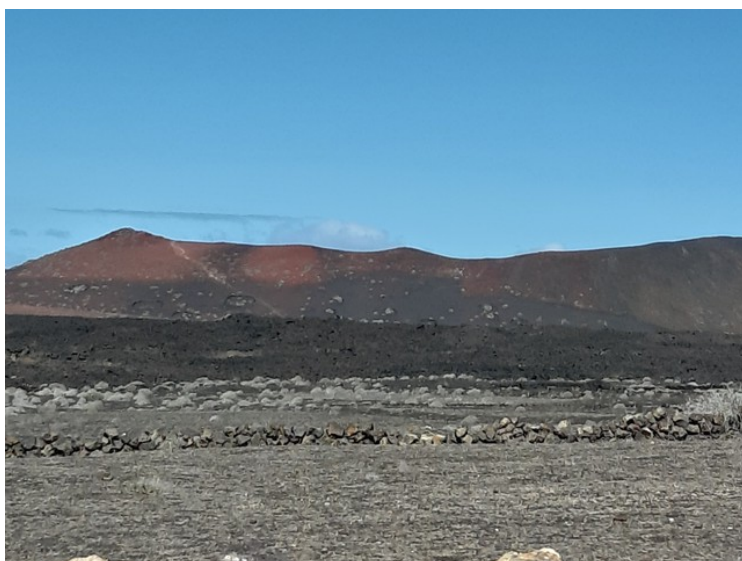
På vei mellom Yaiza og El Golfo,