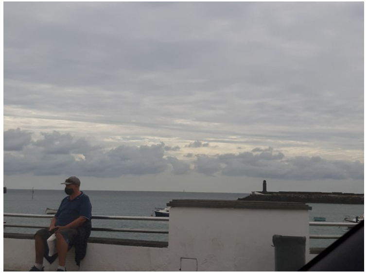
Ytterst til høyre ser vi øya Islote de Fermina. Det er bygget gangbru ut dit.