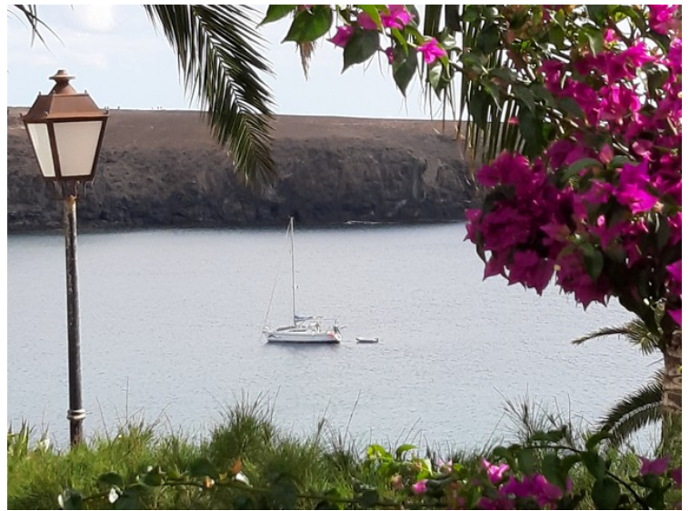
Her ser vi over mot Costa Papagayo.