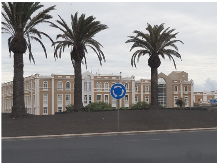
I utkanten av byen kjørte vi forbi denne bygningen. Det er en statlig institusjon som holder til her. Den heter Cabildo de Lanzarote .