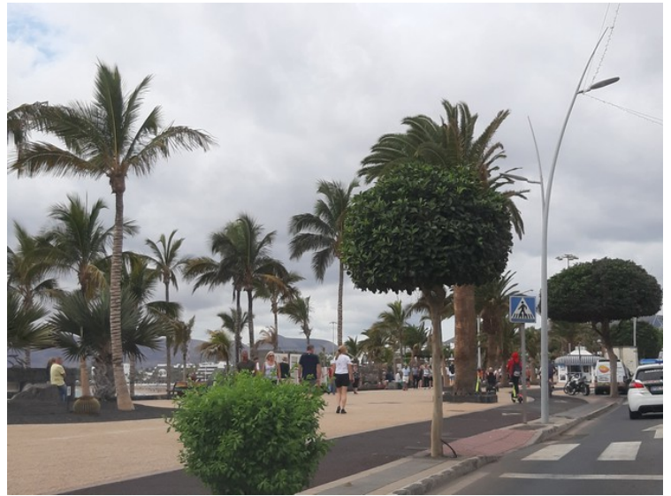
Her nærmer vi oss Puerto del Carmen.