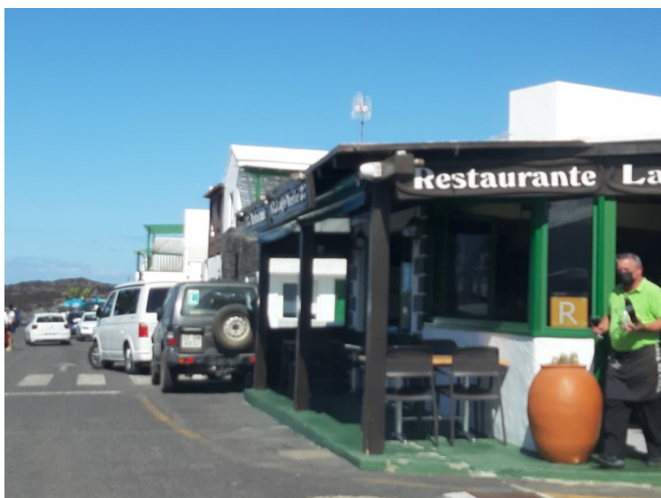
Så er vi i El Golfo .

Det er et lite sted, men det var mye folk der da vi var der.