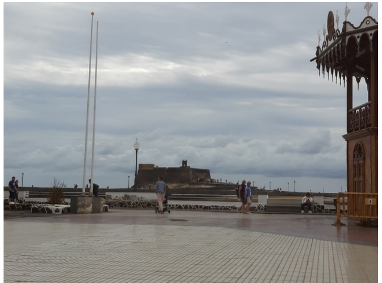
Dette er Castillo de San Gabriel. Barcelo Lanzaroteinformation Spain-lanzarote