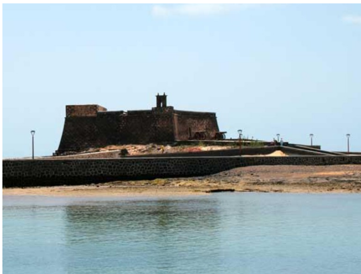
Fortet ble bygget i 1573 som beskyttelse mot piratangrep. Det første fortet var av tre, men det ble ødelagt og brent ned av piratene få år senere. Det ble da bygget opp igjen i stein. Det ligger på en liten øy som heter Islote de los Ingleses.