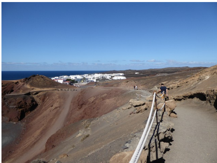
Lenger oppe kan vi se tilbake mot El Golfo.