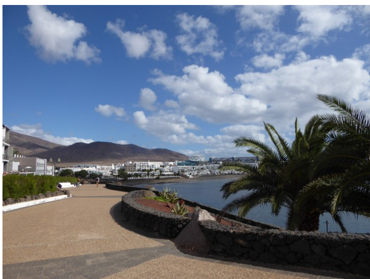
Her ser vi bort mot noen store hoteller i

Det går en strandpromenade her helt fra fyret på Punta Pechiguera til stredene på Costa Papagayo. Mesteparten er hellelagt. Den heter Paseo Marítimo og Avenida Maritima.