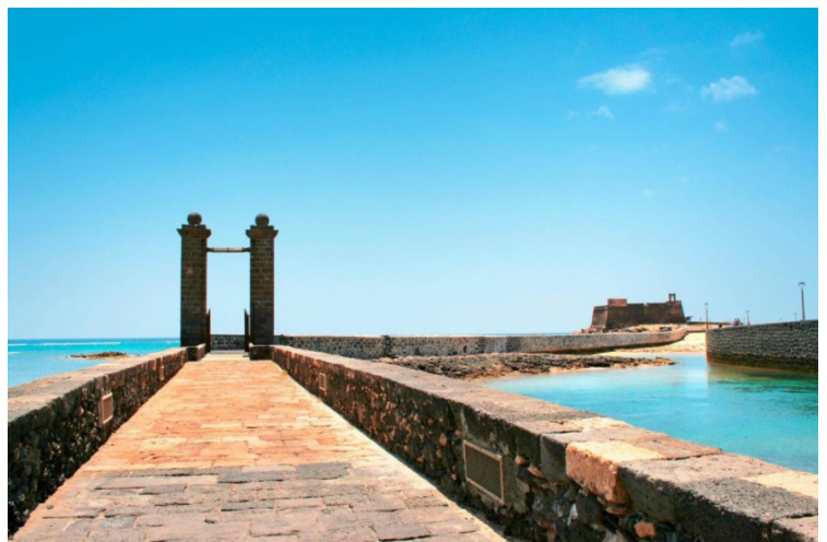
Det ble samtidig bygget en vindebro, Puente de las Bolas, ut til øya. Navnet betyr ballbroen. Det kommer av at det er plassert en kanonkule på toppen av de to pillarene. Det er senere også bygget en bro for biler.