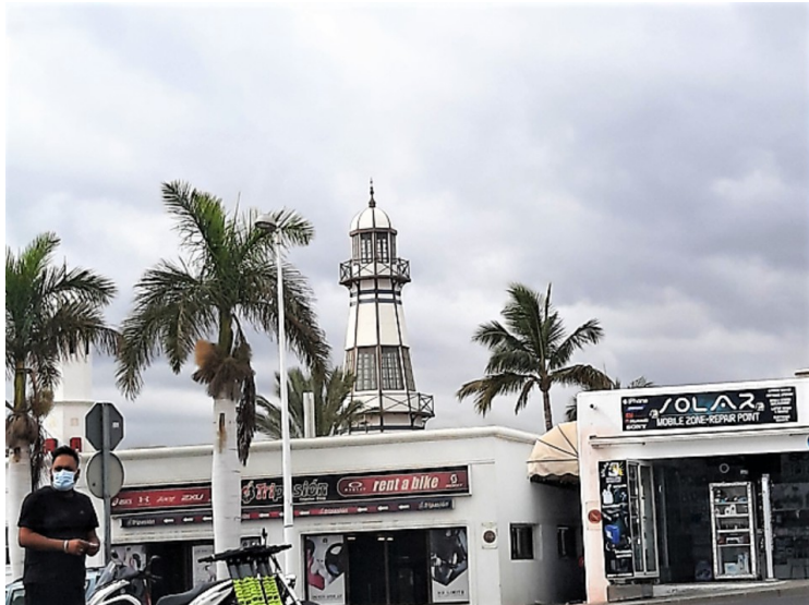
Et fyrtårn i nærheten av den gamle havnen.