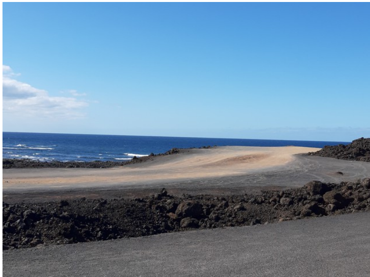
Vi kjørte videre mot El Golfo, men veien var stengt for veiarbeid, så vi måtte snu her.