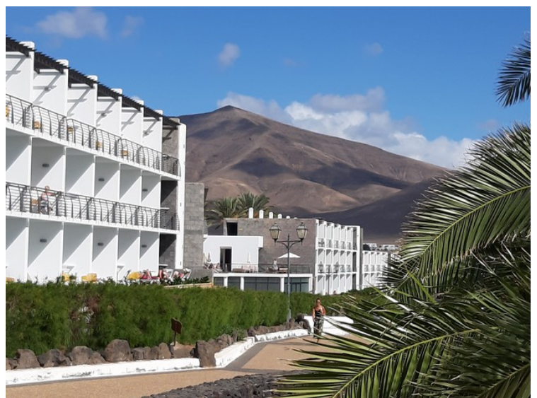
Leilighetsblokker langs strandpromenaden.