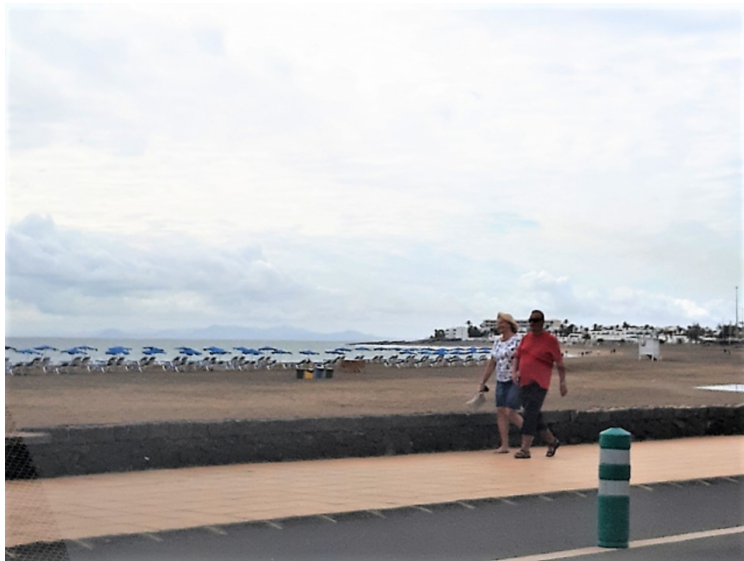
Dette er Playa de los Pocillos