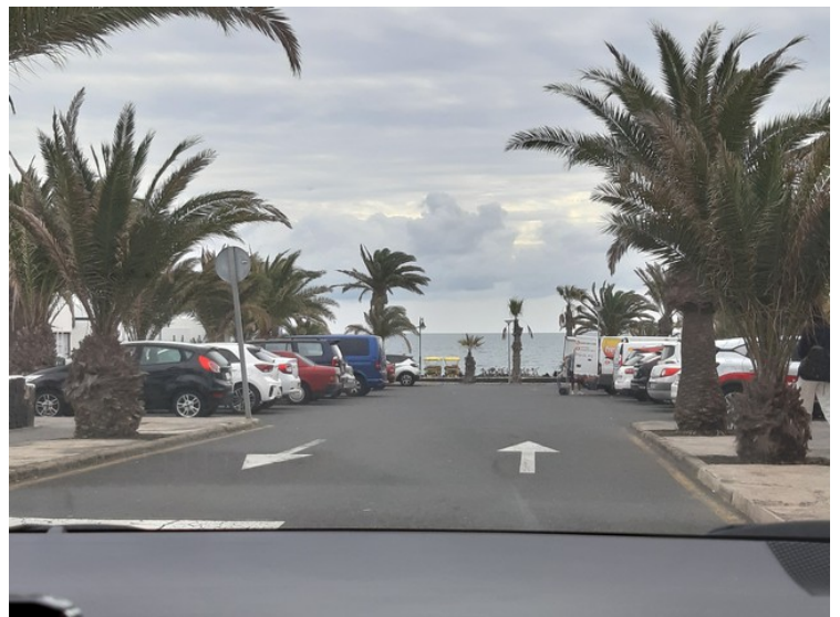
I Playa Honda.