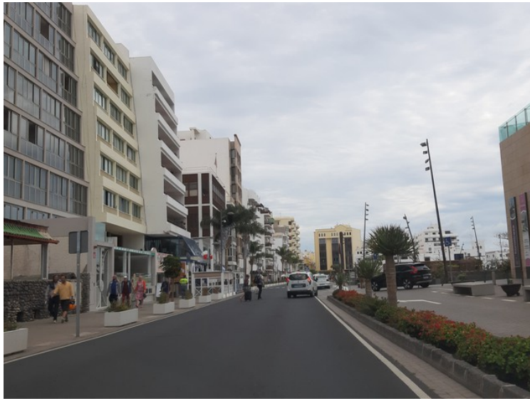
Veien videre langs Calle Dr. Rafael González.