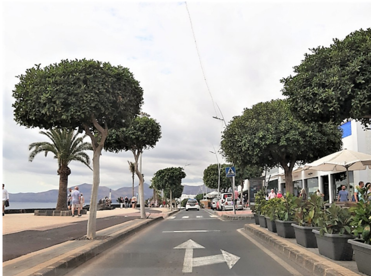
Avenida de las Playas fortsetter videre langs stranden.