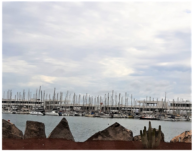
Videre kjørte vi forbi Marina Lanzarote. Her var det mange båter.