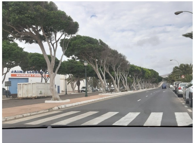
Så er vi på vei ut av Arrecife.