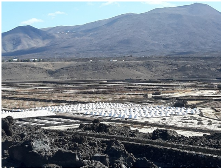
Hauger med lagret salt.