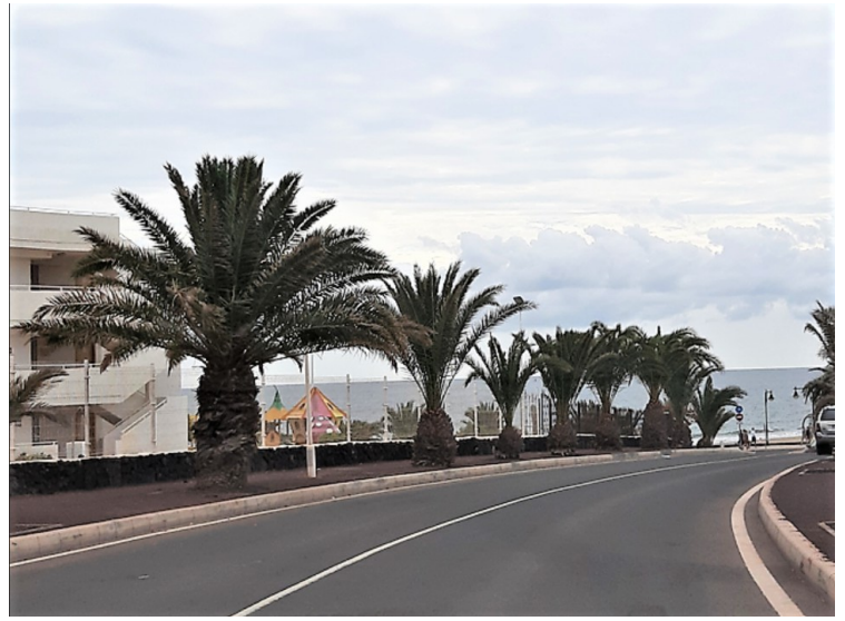
Vi kjørte videre langs kysten.