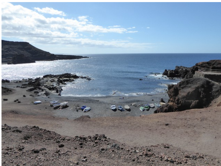
Det ser ut til at dette er eneste stedet i nærheten hvor småbåter kan ligge.