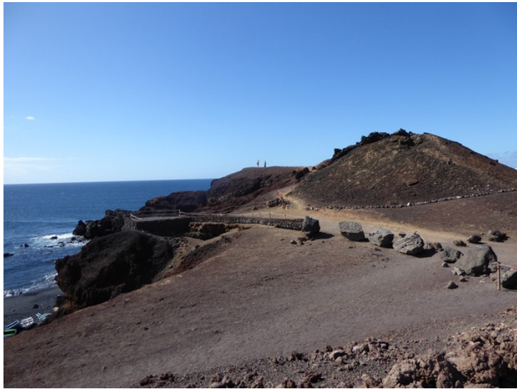
Her ser vi bort mot Mirador El Golfo.