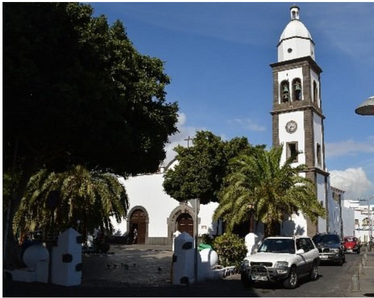
Dette er Iglesia de San Ginés .