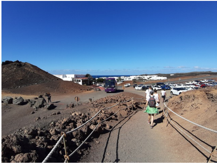
El Golfo er mest kjent for den grønne sjøen som ligger utenfor byen. Her er vi på vei oppover fra parkeringsplassen.