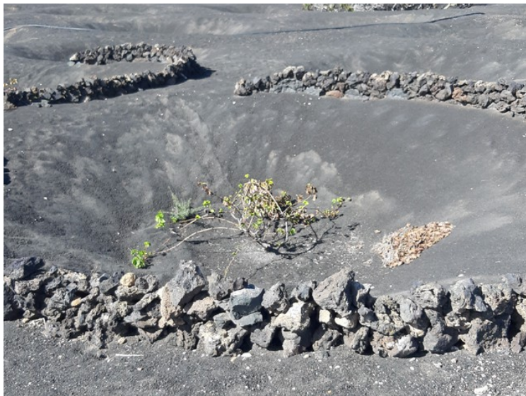
Et eksempel på en plante i en fordypning vulkanske steiner rundt.