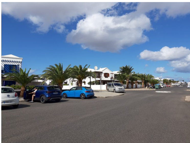
Lørdag den 13. kjørte vi en tur ned til sjøen. Det er ca 1.5 km fra der vi bor. Dette er langs veien.