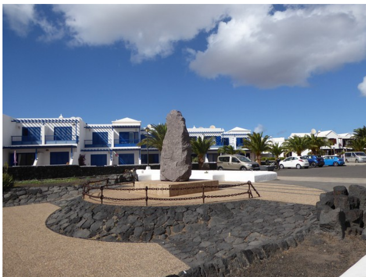
Det står en steinstatue i enden på gata.