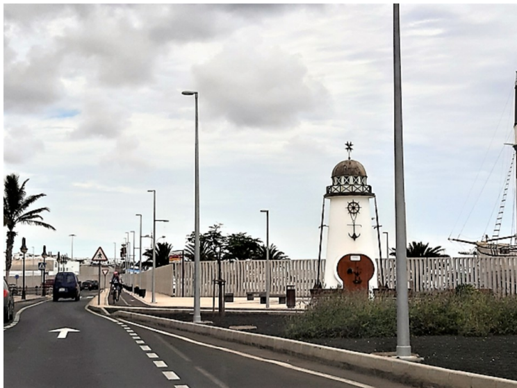
Dette tårnet er et monument til minne om 7 fiskere fra Lanzarote på som ble drept av overfallsmenn den 28. november 1978 da de var ombord i båten «Cruz del Mar». Det ble innviet i 2013.