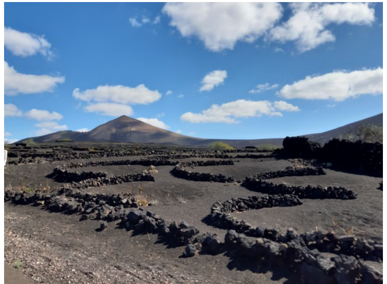
Her er vi kommet forbi Yaiza og Uga. Dette er et område hvor de driver med dyrking av druer.

Mange av vulkanene hadde utbrudd fra 1730-36 og dekket store deler av det sørlige Lanzarote med lava-aske. Bøndene her måtte legge om hele drifta. De fant ut at det gikk bra å dyrke vindruer i asken, men på grunn av de sterke vindene måtte de skjerme plantene for vinden. Det gjorde de ved å grave fordypninger for planten og å bygge legger av vulkansk stein rundt. Den vulkanske jorda er ganske grøderik og den har den fordelen at den suger i seg det regnet som kommer og hindrer fordamping.