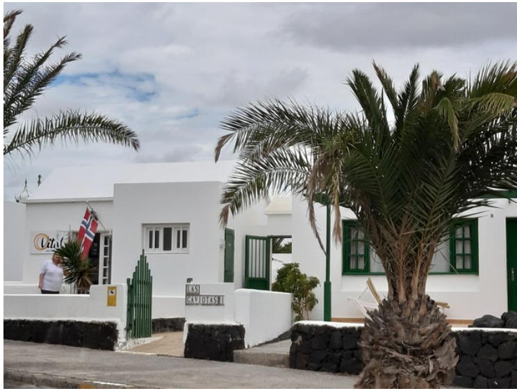
Leiligheter i Playa Hondas.