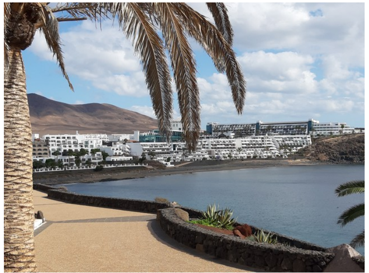
Hotellene inne i vika,