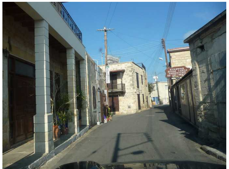
Her er vi på vei ned gjennom Neo Chorio.