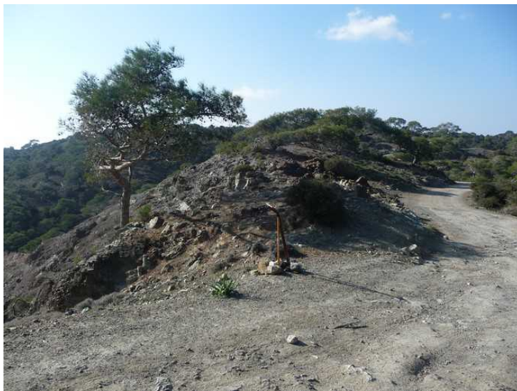
Samme området med erodert lava.