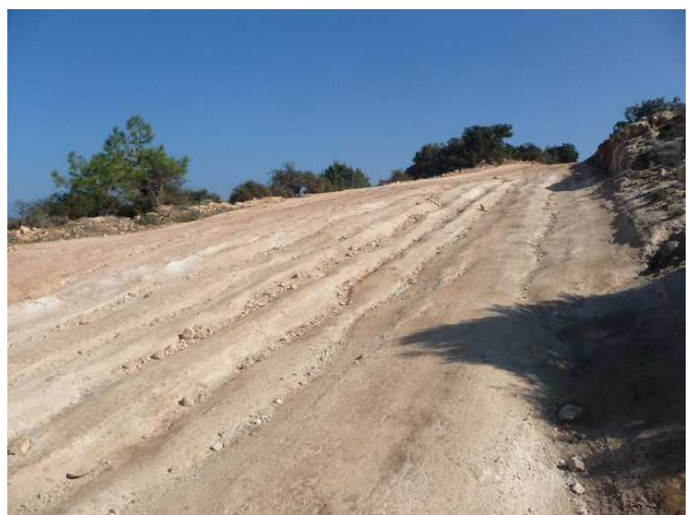
Vi kjørte gjennom Neo Chorio, forbi Smigies og stoppet omtrent her hvor vi gikk en tur og kjørte tilbake samme veien.