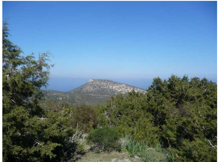
Det er god utsikt herfra. Her ser vi ned mot Pyrgos Tis Rigenas , som visstnok skal være ruinene av et middelalderkloster.