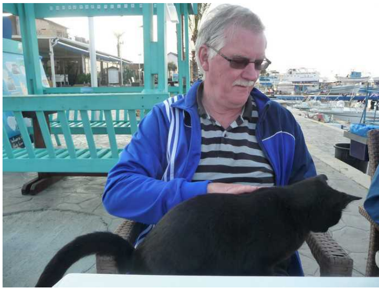
Her har jeg fått besøk av en katt.