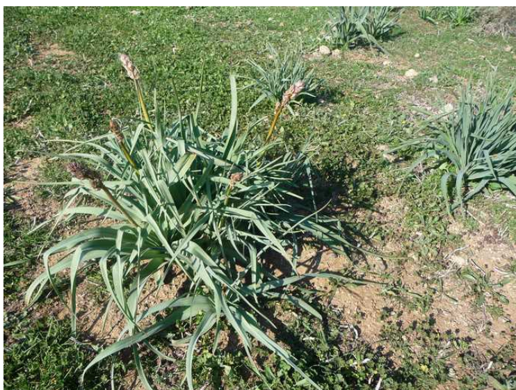
Disse plantene vokser det mye av i hele Pafos-distriktet.