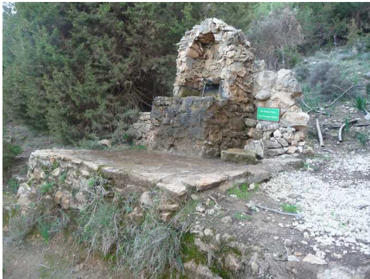
En vannkilde. Det står skilt om at vannet ikke må drikkes.