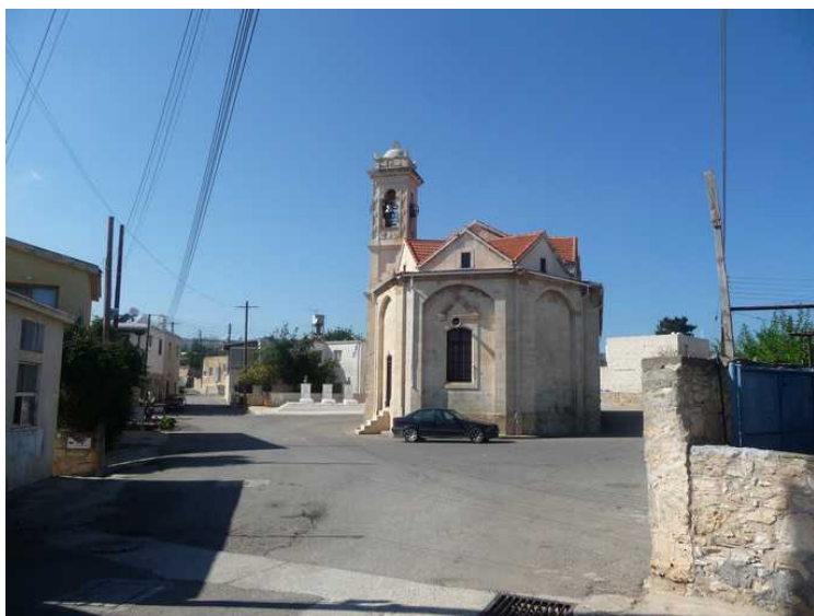
Onsdag den 12. februar var vi på tur på Akamas-halvøya igjen. Denne gangen fra østsiden. Her er vi kommet til den lille landsbyen Neo Chorio et stykke opp fra Latchi. Bilde av kirken. Kirketårnet til høyre.