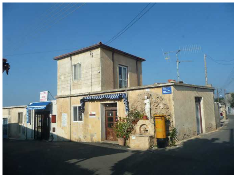
Dette huset er til salgs. Det er en liten vannpost med kran rett utenfor døren og en postkasse rett ved siden av. Nærmeste nabo til venstre er et mini-marked.