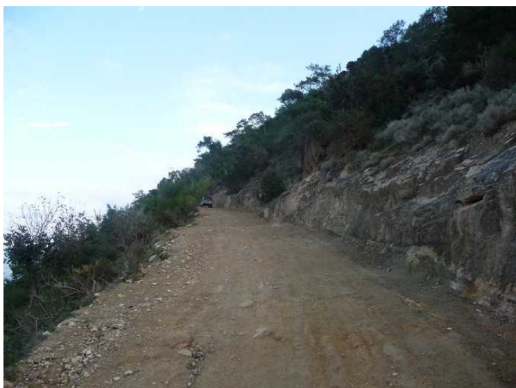
Her forsvinner jeg over bakketoppen.