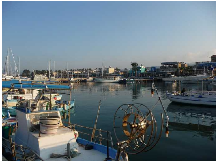
Fiskebåter og fritidsbåter ligger på rekke og rad.