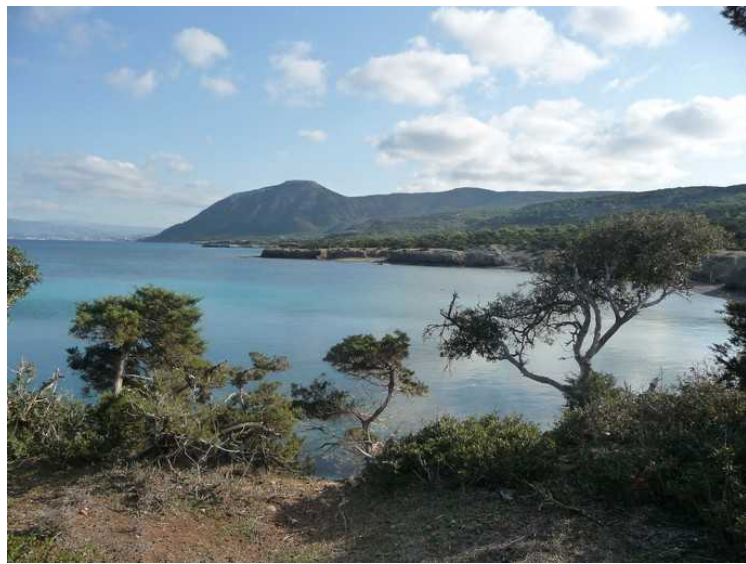
Lenger inne i vika er det busker.