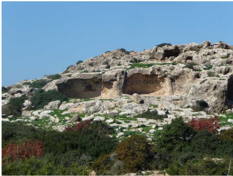
Den kalles Erimites-klippen.