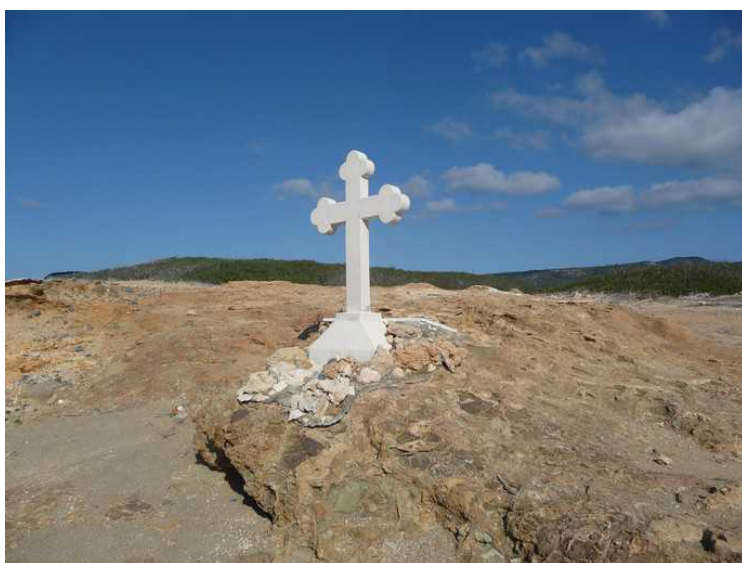
På denne stranden var det kors med inskripsjoner på.