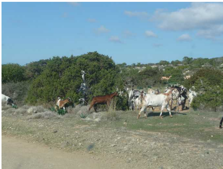
Geitene spiser av de tornete buskene. Det var en gjeter med dem.