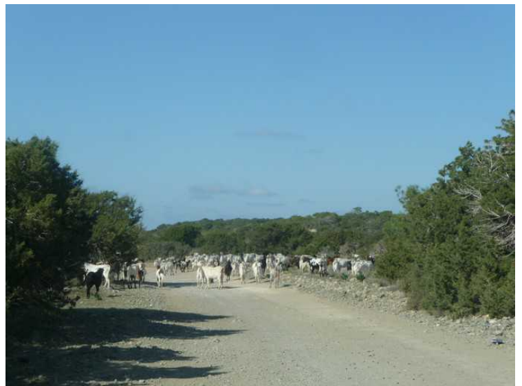
Her har vi kjørt videre og vi kommer til en flokk med geiter.