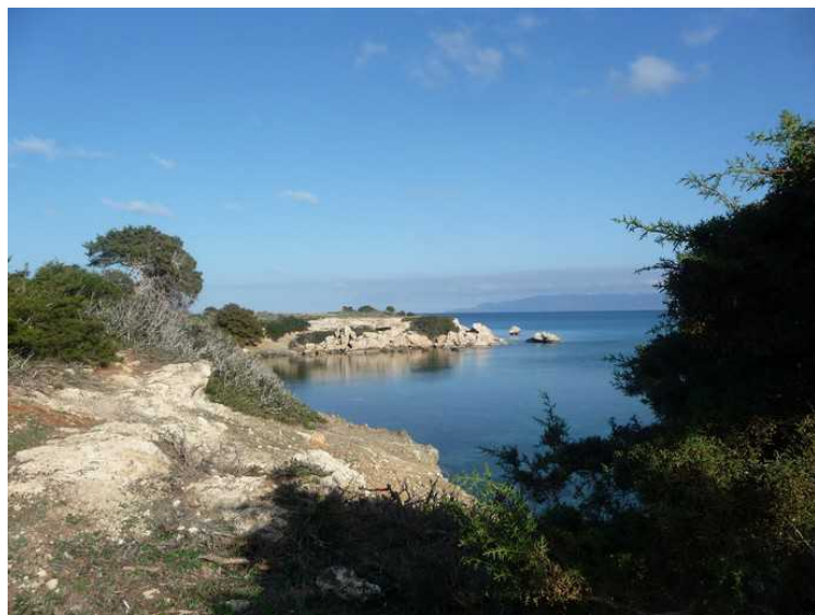
Flere bilder fra denne bukta.