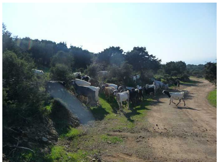
En geiteflokk fulgte etter oss et stykke.