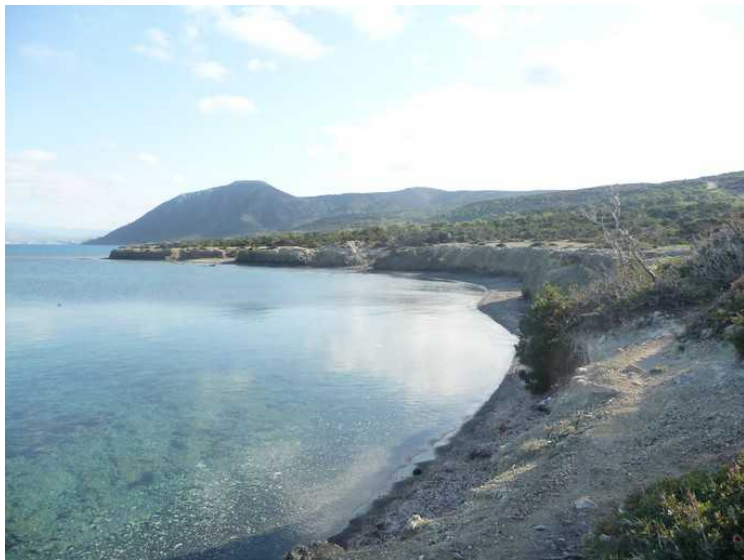
Utsikt østover, retning Polis.