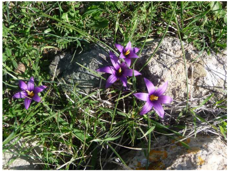
Det er mange planter som blomstrer på denne tiden.