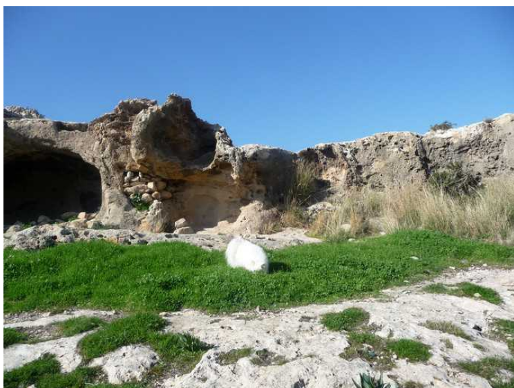
Aki blir også med.