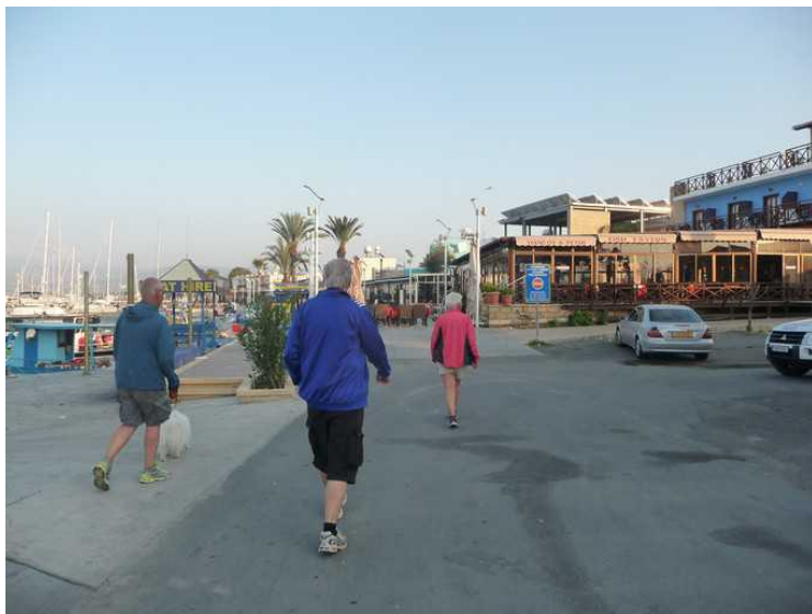
Så var denne turen også slutt. Her er vi på vei tilbake til bilen.