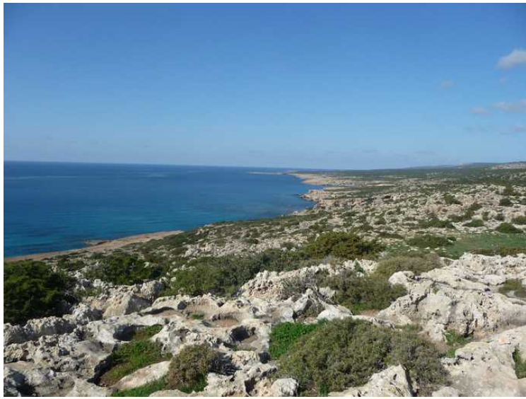
Dette er utsikten fra toppen og videre nordover.