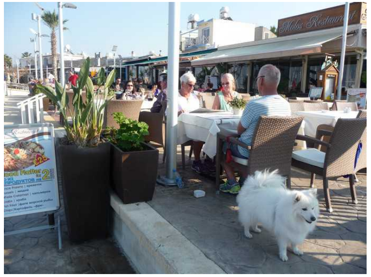
Dette er nede ved marinaen i Lachi. Vi måtte ha litt mat.