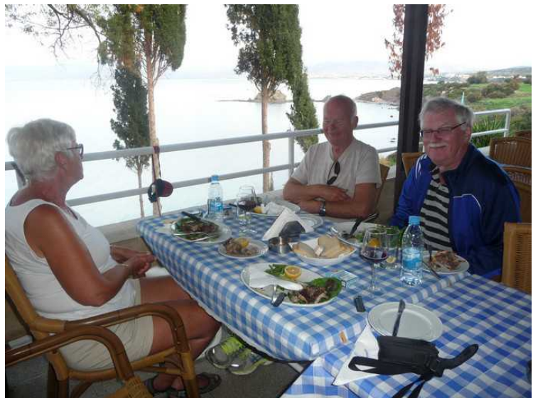
Vi avsluttet med et måltid på restauranten nedenfor Afrodites bad . Alle hadde Kleftiko .