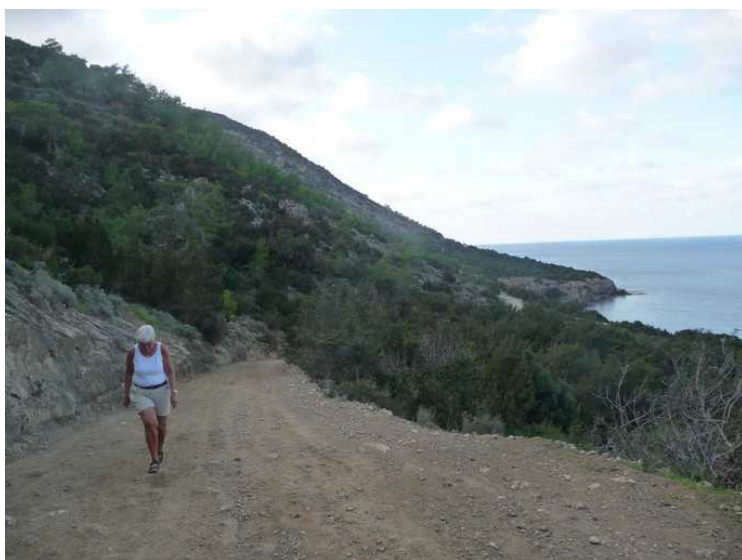
Bente danner baktropen.