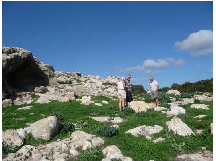
Vi syntes den var så spesiell at vi måtte se litt nærmere på den.