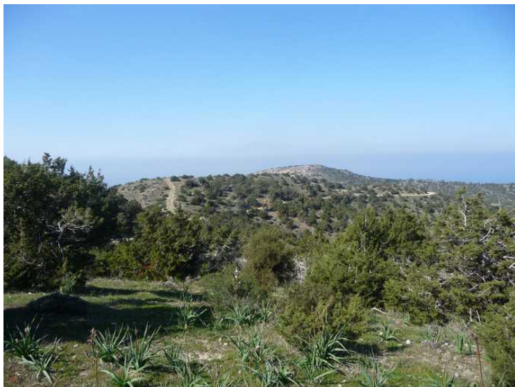
Akamas fyrstårn ligger på den borte høyden. Nesten ute på spissen av halvøya.