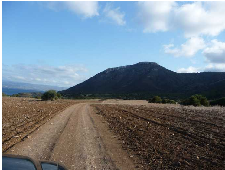
Et sted går veien over et jorde som er harvet og klargjort for såing.