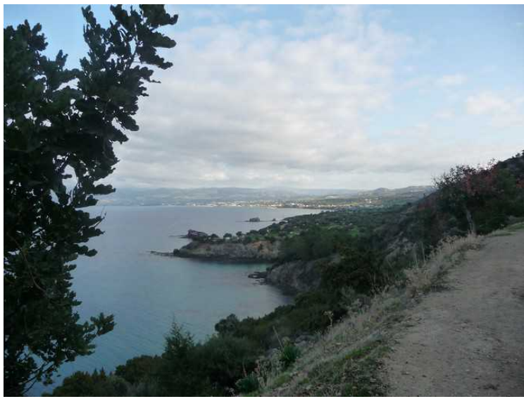
Nå nærmer vi oss sivilisasjonen. Lakki og Polis i bakgrunnen.