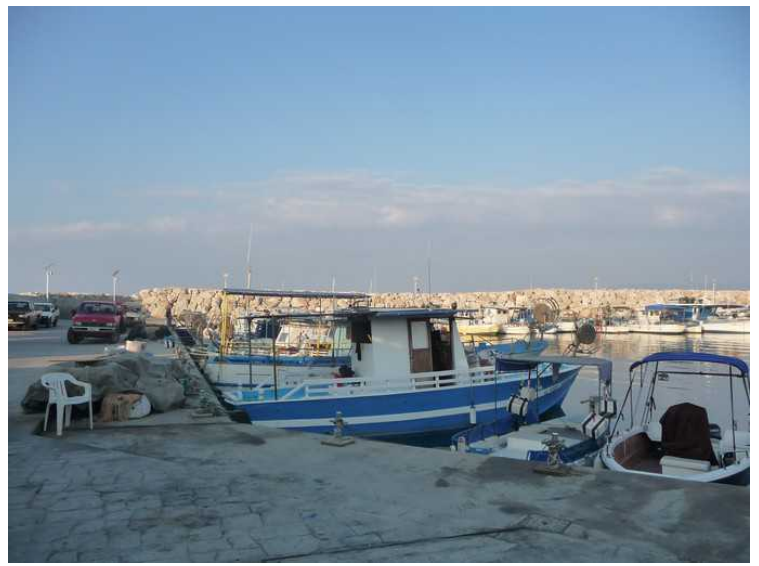
Etter at vi hadde spist gikk vi en tur bortover langs marinaen.