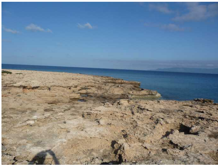
På den nordligste neset er det et slags månelandskap.