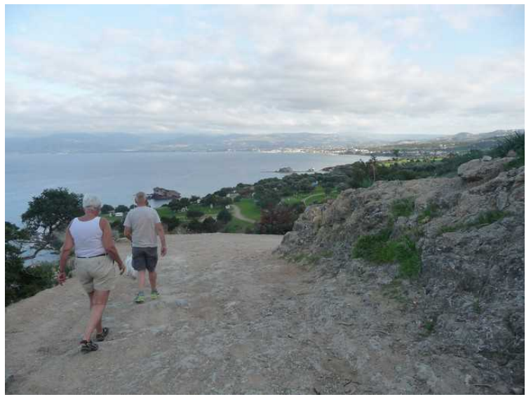
Her går veien i en 90 grader høyresving.