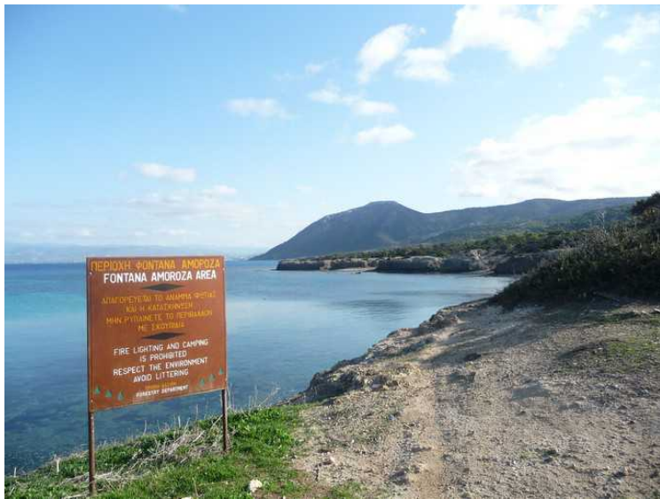
Skilt som viser hvor vi er.