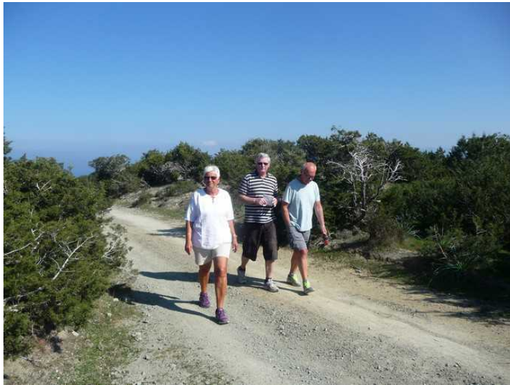
Da vi var kommet opp på det høyeste punktet parkerte vi bilen og spaserte en liten tur i landskapet.