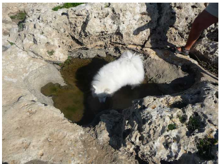
Aki har funnet en vannpytt på toppen å drikke av.