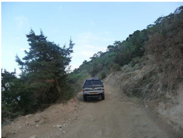
Her gikk alle ut av bilen, og jeg kjørte videre alene. Veien var så smal og det var så bratt ned på siden at de ikke turte å sitte på.