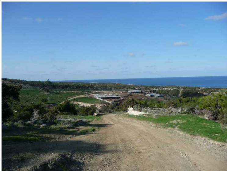
Her har vi kjørt tvers over halvøya og kommer ned mot Fontana Amorozo.