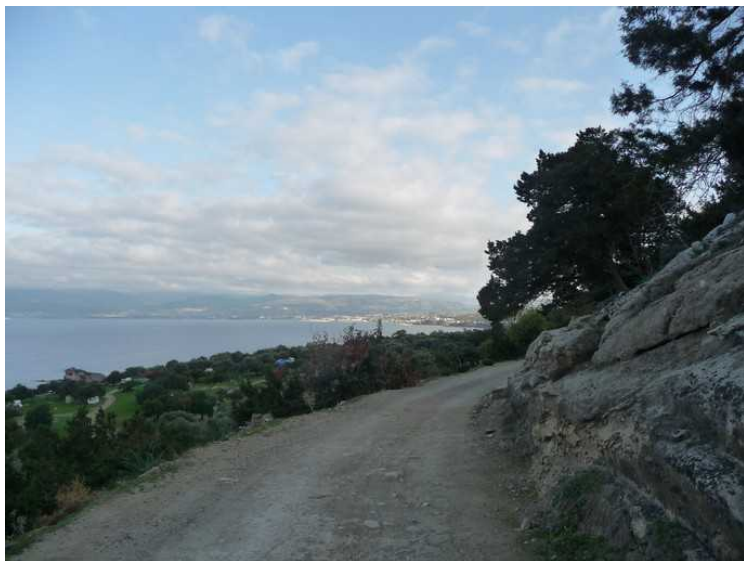
Dette er straks før vi kommer til Afrodites bad. Campingplassen ned til venstre.