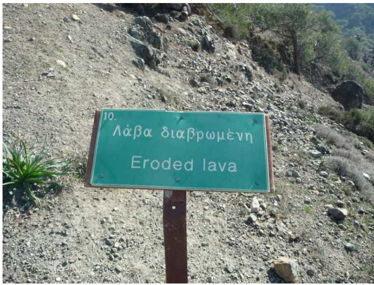
Vi la merke til dette skiltet.