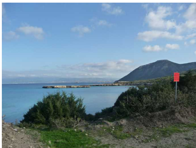
Den lille øya til venstre heter Chamili. Vi ser også et rødt skilt som sa at jakt var forbudt. Det var også mange skilt underveis som sa at man ikke måtte røre gjenstander som måtte ligge igjen etter militærøvelsene. De kunne eksplodere.