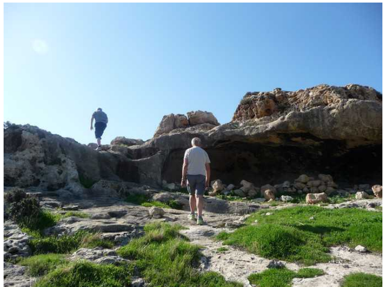
Vi skal helt til topps.