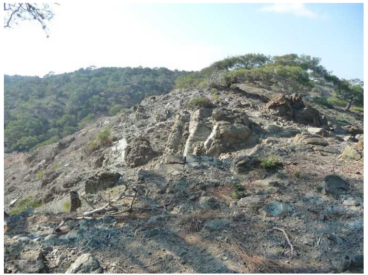
Her er det erodert lava.