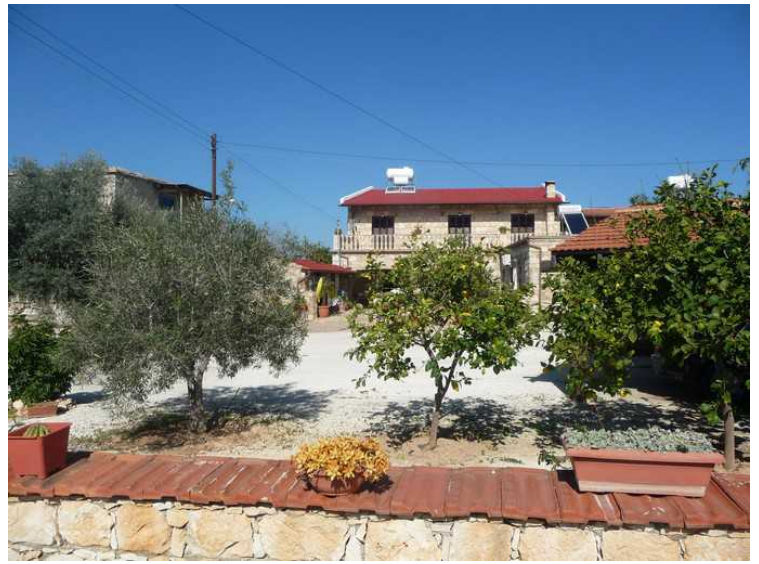
Her er noen fine hus med flotte hager.