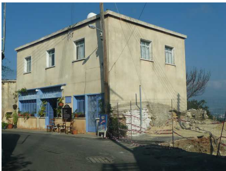
Kafeen er åpen.