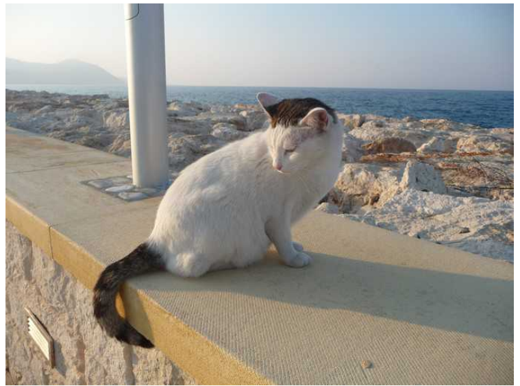
Det var mange katter her som lurte på om vi hadde noe fisk til dem. Vi så et par fiskere som ga dem småfisk tidligere. Her er to av kattene