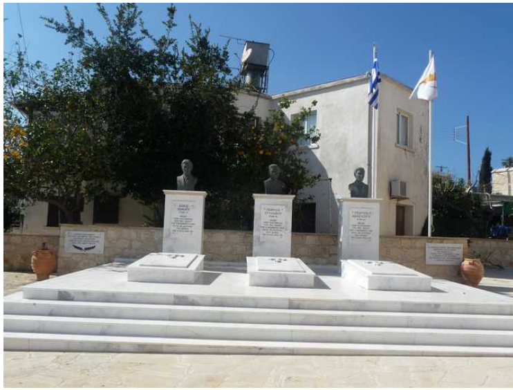
Rett ved siden av kirken er det et minnesmerke for tre frihetskjempere fra urolighetene i 1955-59. Avdukingen fant sted 7. november 2010.