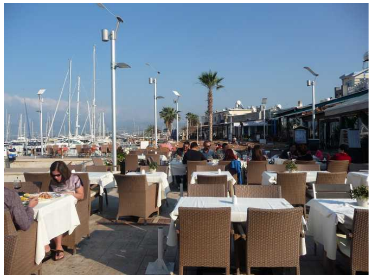
Noen bilder fra området.