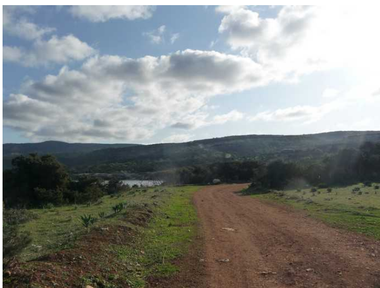
På vei sydøstover langs havet.