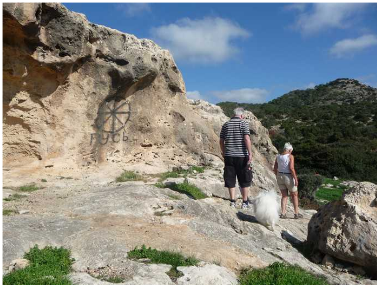
Det er noen som har risset inn figurer i klippeveggen.