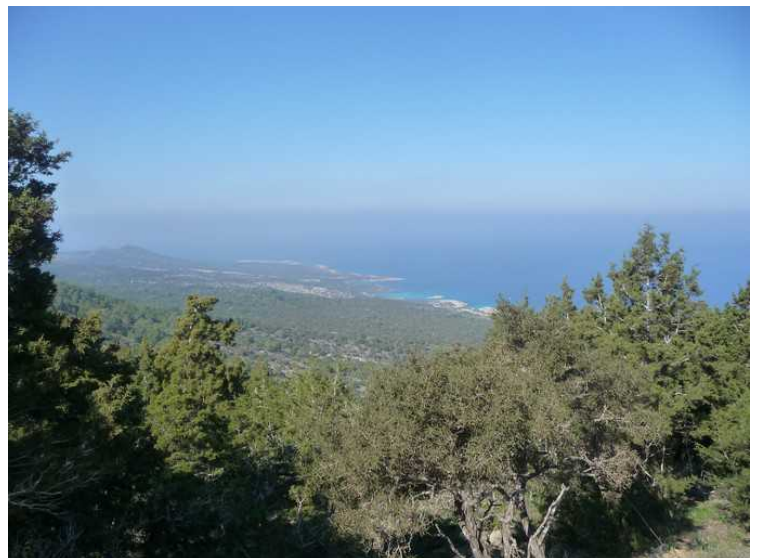
Her ser vi ned mot Blue Lagoon og Fontana Amoroza .