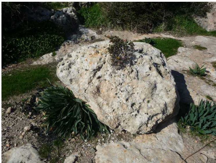
En liten busk vokser midt i steinen.