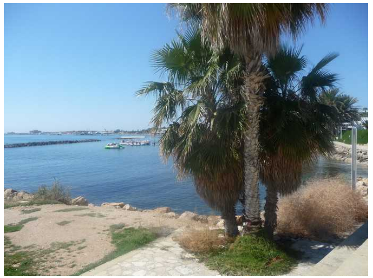
Utsikt mot havnen i Kato Paphos.