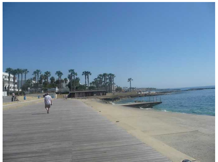
Strandpromenaden går videre sydløst, helt til Paphos Airport .