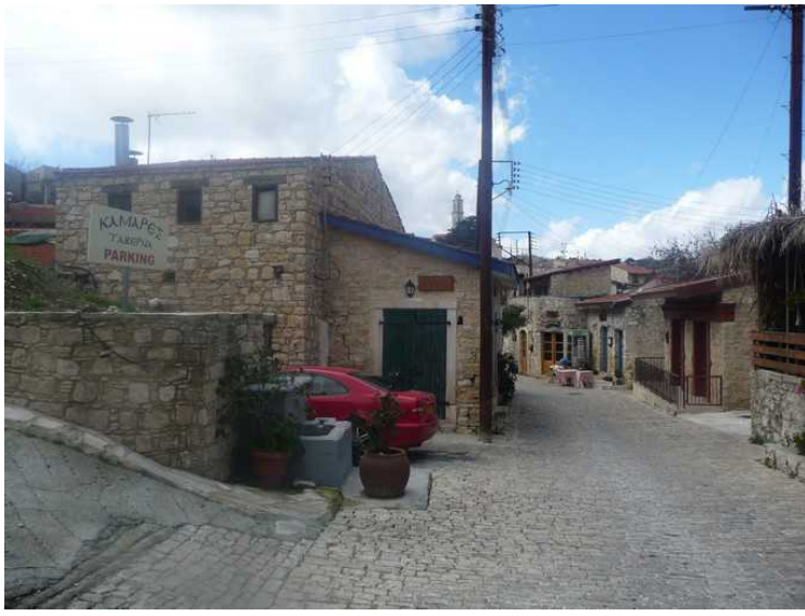
Gaten nedenfor restauranten.