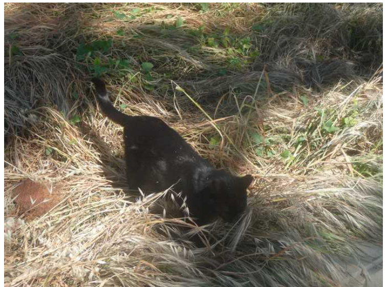
Jakten er slutt.