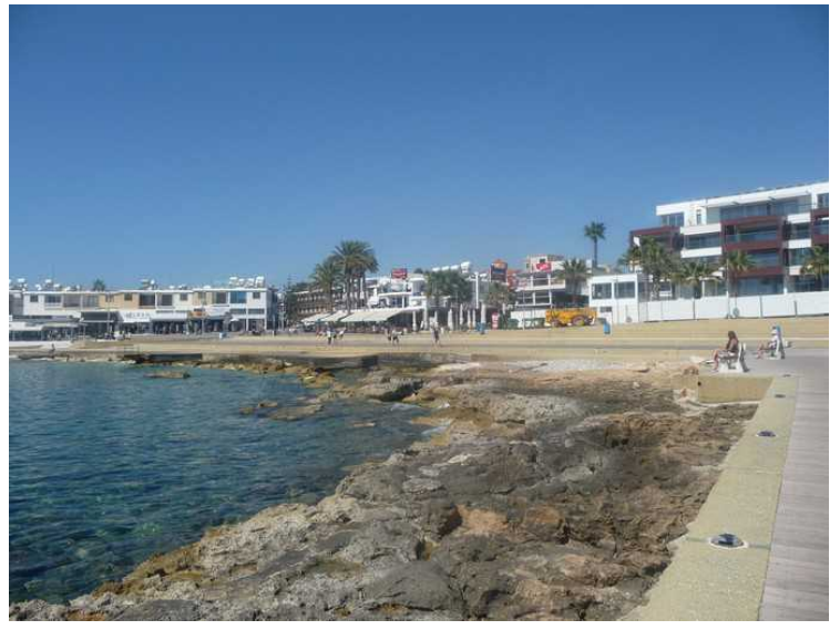
Her ser vi nordover mot sentrum i Kato Paphos.