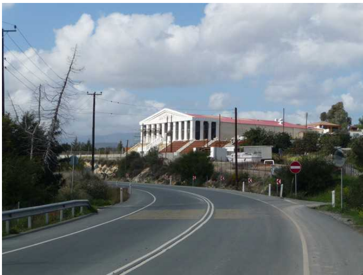
Her kjører vi forbi en imponerende bygning i nesten ingenmannsland.