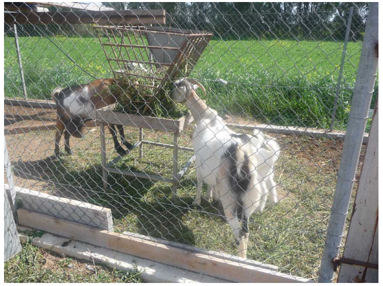
Her går de voksne geitene.