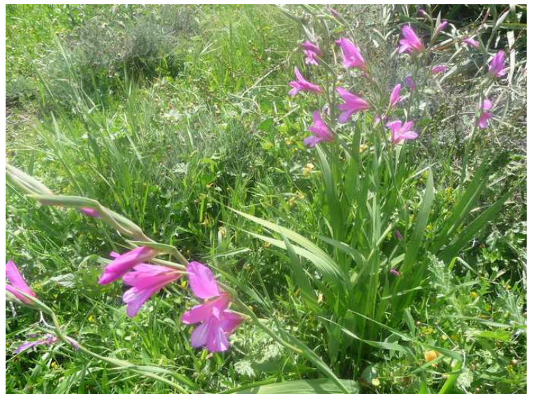
Den 18. februar gikk vi en tur langs kysten igjen. Da var det mange blomster. Flere blomsterbilder følger.