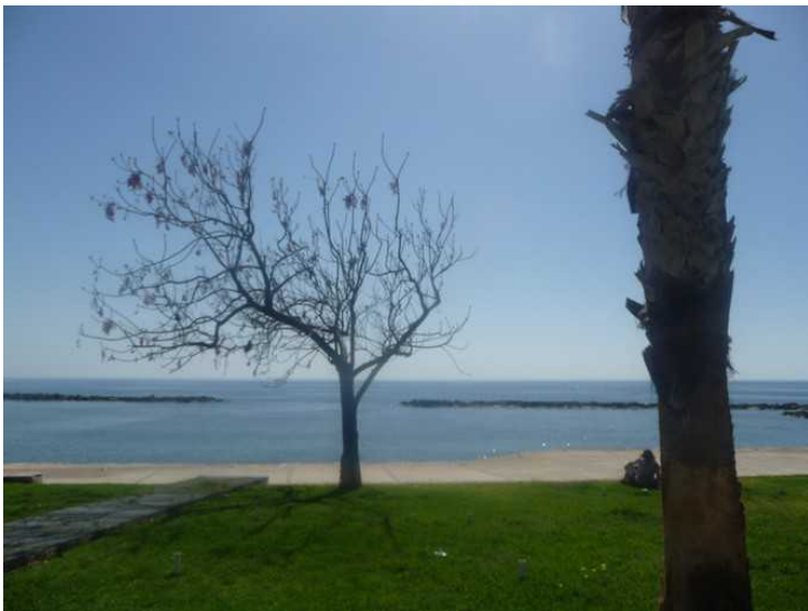
Det er noen trær som mister bladene i løpet av vinteren.