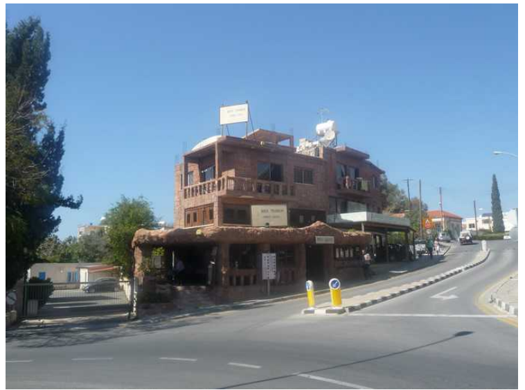
Rock Taverna Restaurant på hjørnet ser ut til å være murt av lokal stein. Den ligger midt i Kato Paphos.