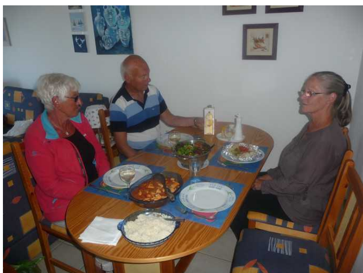
Her har jeg fått lov til å være fotograf.