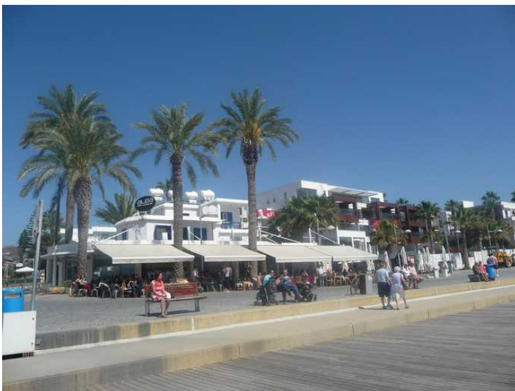
Dagen etterpå, den 19. mars, går vi på strandpromenaden i Kato Paphos . Nærmest sentrum er det mange restauranter langs kysten.