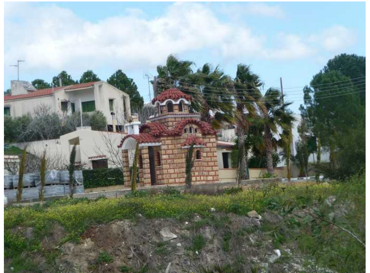
Et par bilder fra Alassa.