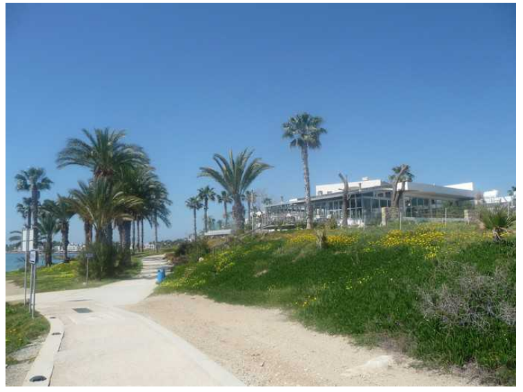
På innsiden av strandpromenaden ligger hotellene på rekke og rad.