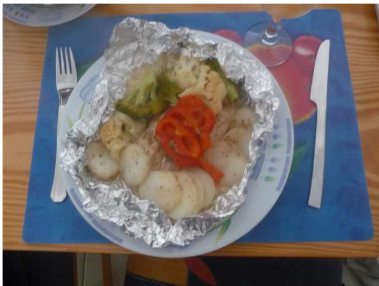
Dette er kylling kokt i folie.