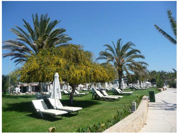
Dagen etterpå, den 20. mars, fortsetter vi videre sydover. Her ligger hotellene tett.