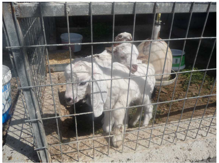
Et sted hadde de dyr i bur. Her er det noen geitekillinger. De hadde ikke så god plass, men de hadde både mat og vann.