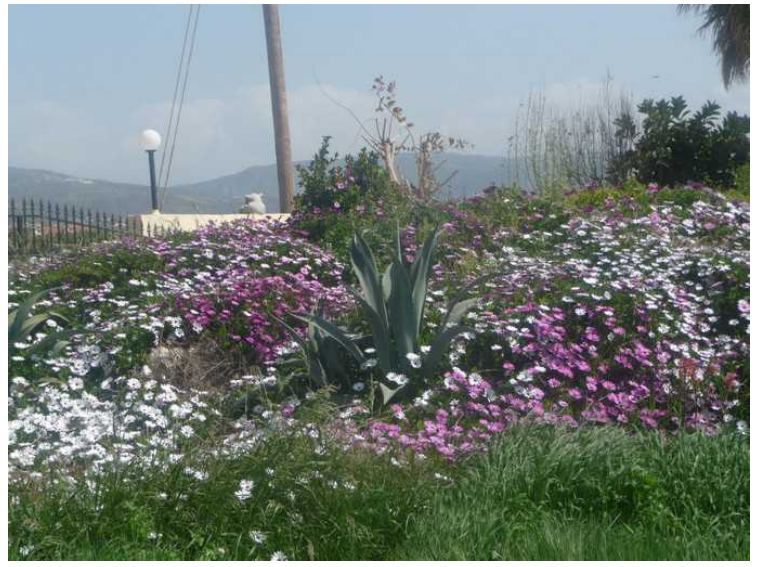
I denne skråningen var det et enormt blomsterflor.