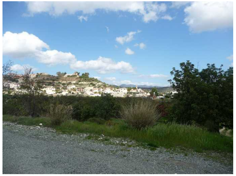
Dette er Alassa slik som det ser ut nå, etter at den er flyttet.