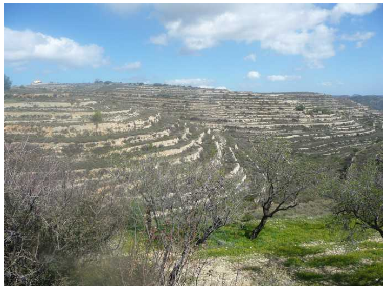
Terrasser oppover hele dalsidene. Det ser ut som naturlige terrasser.