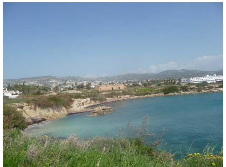
Her er vi tilbake hvor vi parkerte bilen. Vi ser her Corallia Beach.