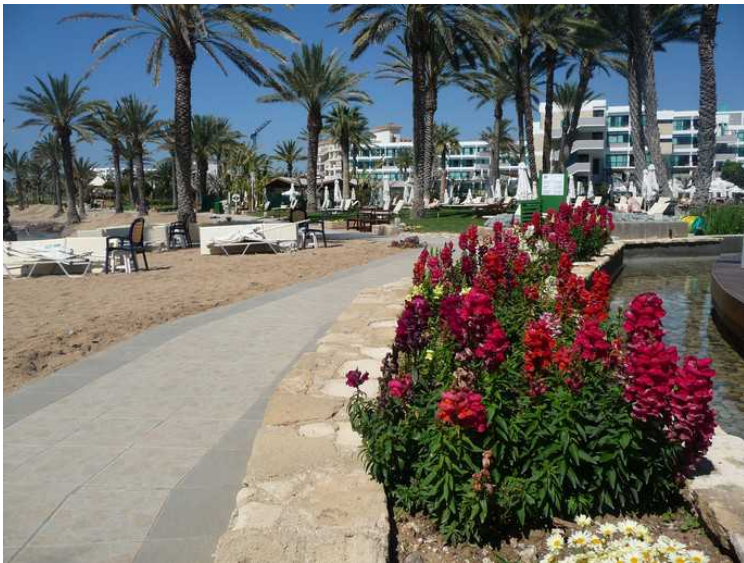
Deretter gikk vi tilbake den samme veien til der vi hadde parkert bilen.