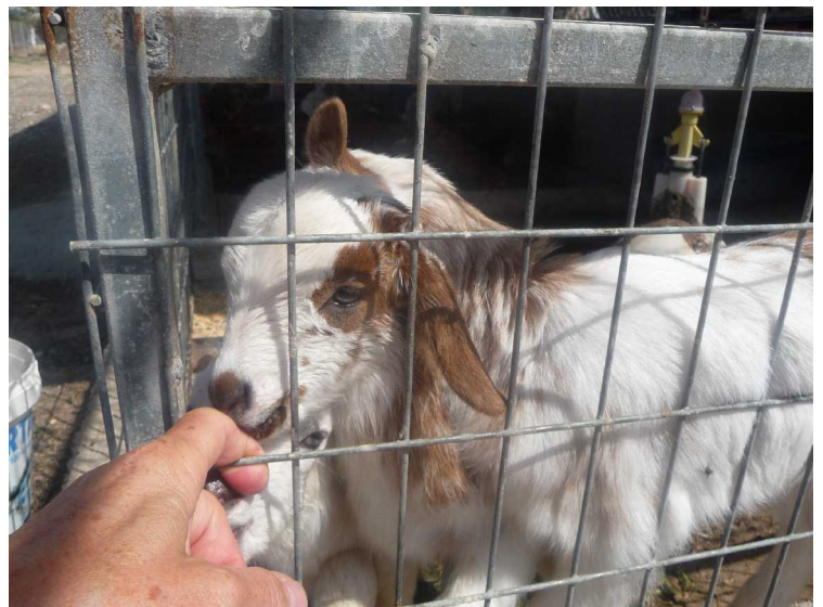
Geitekillingene var veldig nysgjerrige.