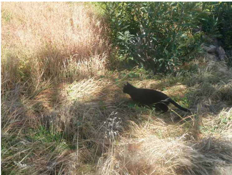
Katten jakter på noe.