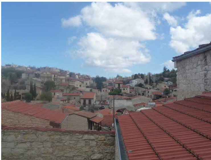
Her ser vi over hustakene i byen.