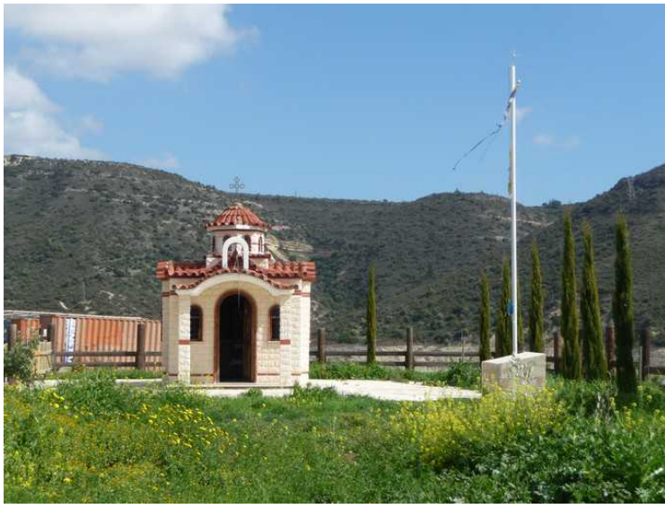
Et kapell som ligger litt høyere opp.