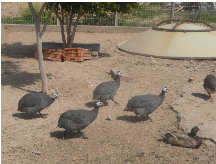
Det var også ender, høner og disse fuglene som vi tror er perlehøns..