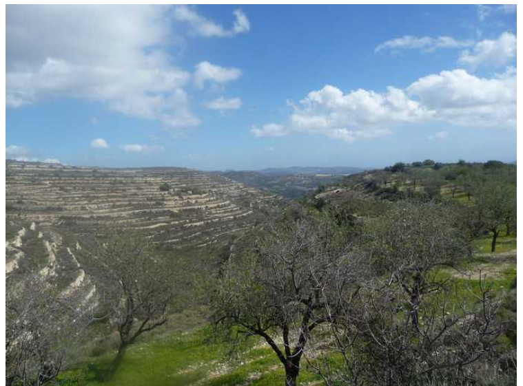
I dalen nedenfor er det mange terrasser i liene.