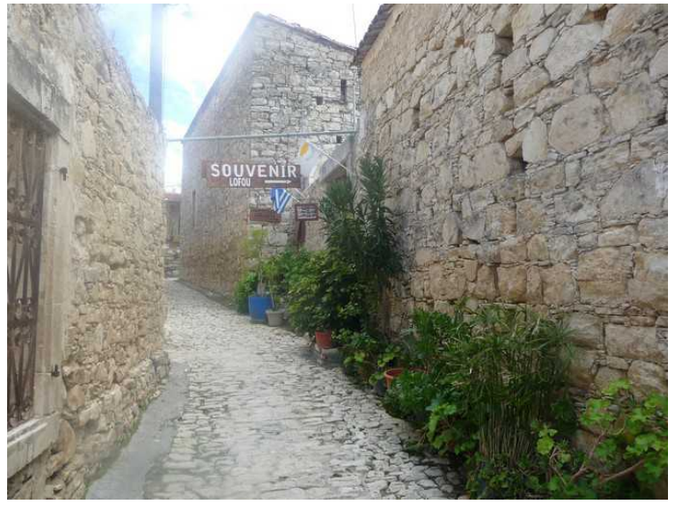
Gaten ovenfor restauranten.