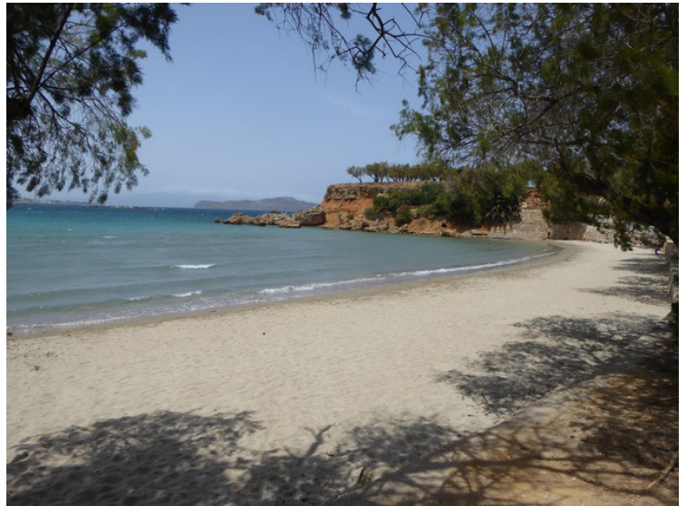
Glaros stranden ligger vestenfor halvøya. Vi ser halvøya til høyre i bildet.