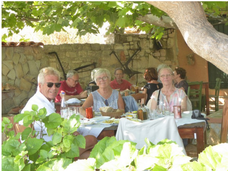
Et siste bilde fra restauranten.