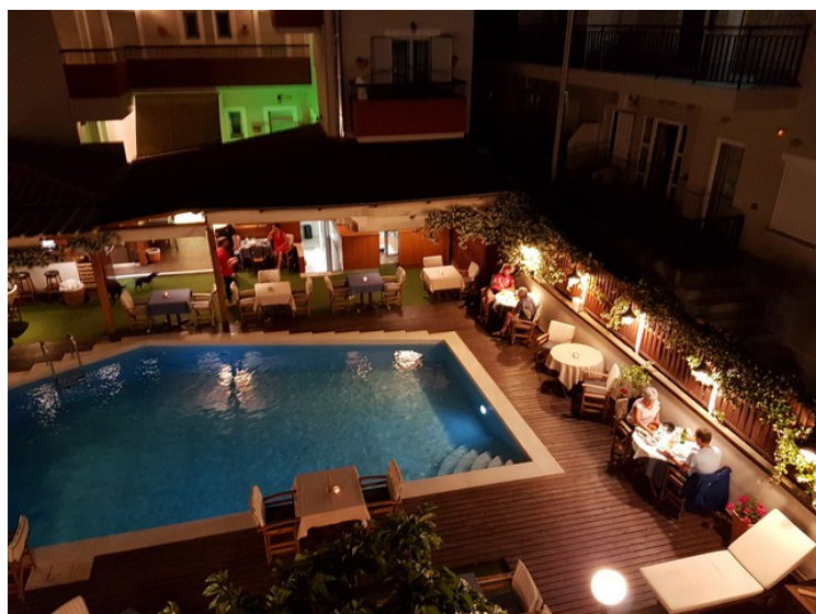
Restauranten og bassenget sett fra leiligheten vår om kvelden.