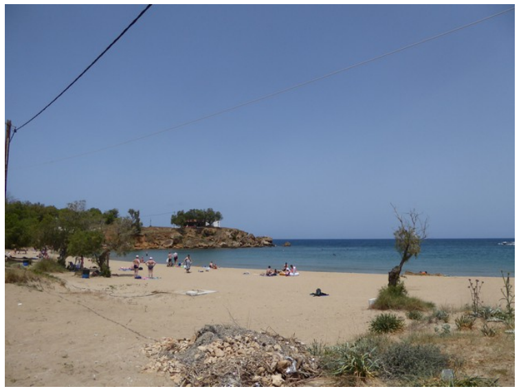
Dette er Iguana-stranden som ligger østenfor en av halvøyene i området. På denne halvøya står det en kirke som heter De hellige apostlers kirke (Agii Apostoli). Den har gitt stedet navn.