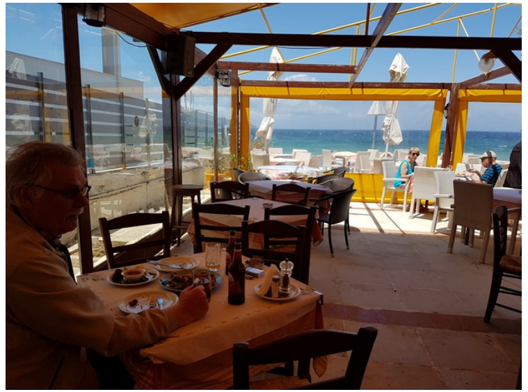
Her er jeg igang med lunchen på Siroccos Restaurant, som er rangert som nummer 5 av 14 restauranter av TripAdvisor . Helt grei mat.