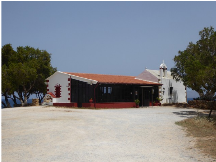
Et par bilder av kirken.