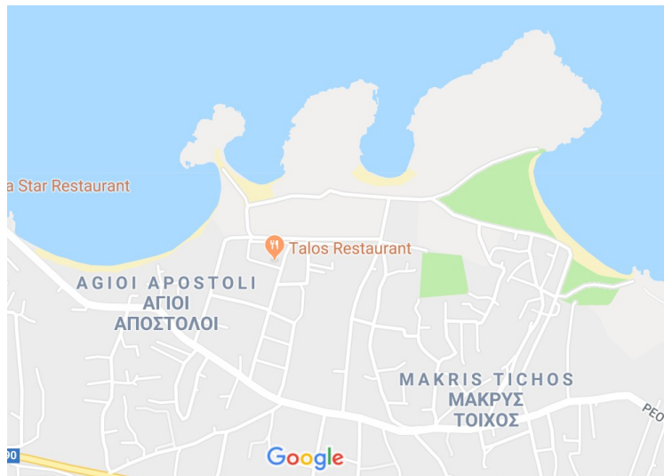
Et litt mer detaljert kart som viser hvor hotellet ligger. Hotellet heter Talos .

Hotellet er ganske enkelt men OK. Ifølge TripAdvisor er det rangert som nummer 14 av 33 overnattingssteder i området. Vi syntes det var fint å bo der en uke, og det var fredelig uten støy av noe slag. Vi spiste for det meste på restauranten på hotellet. De hadde veldig bra mat der, og ifølge TripAdvisor er restauranten rangert som nummer 1 av 14 restauranter i området.