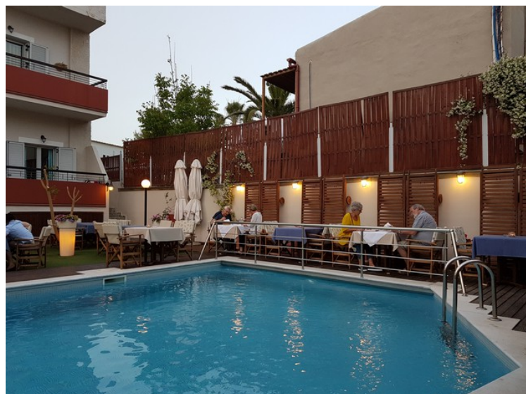
Restauranten var plassert rundt bassenget.