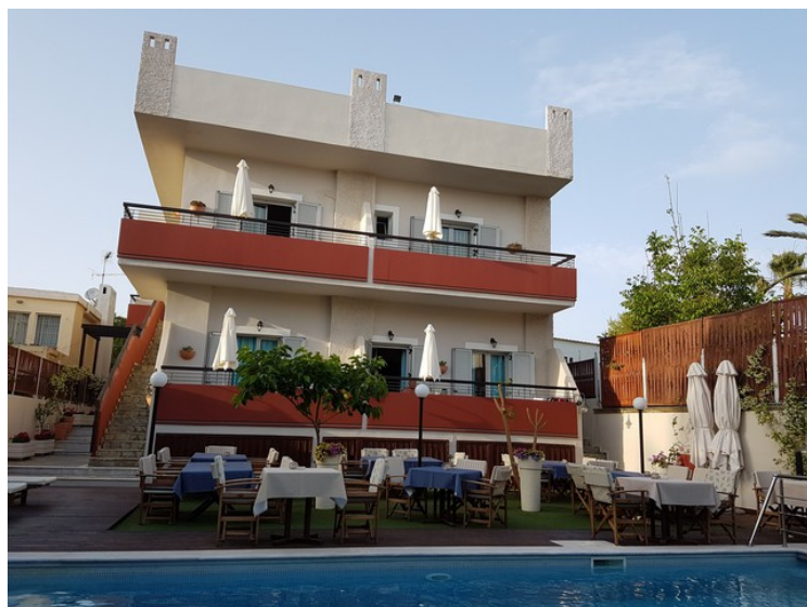
Bygningen hvor vi bodde sett fra restauranten. Leiligheten vår var øverst til venstre.

Hotellet er ganske enkelt men OK. Ifølge TripAdvisor er det rangert som nummer 14 av 33 overnattingssteder i området. Vi syntes det var fint å bo der en uke, og det var fredelig uten støy av noe slag. Vi spiste for det meste på restauranten på hotellet. De hadde veldig bra mat der, og ifølge TripAdvisor er restauranten rangert som nummer 1 av 14 restauranter i området.