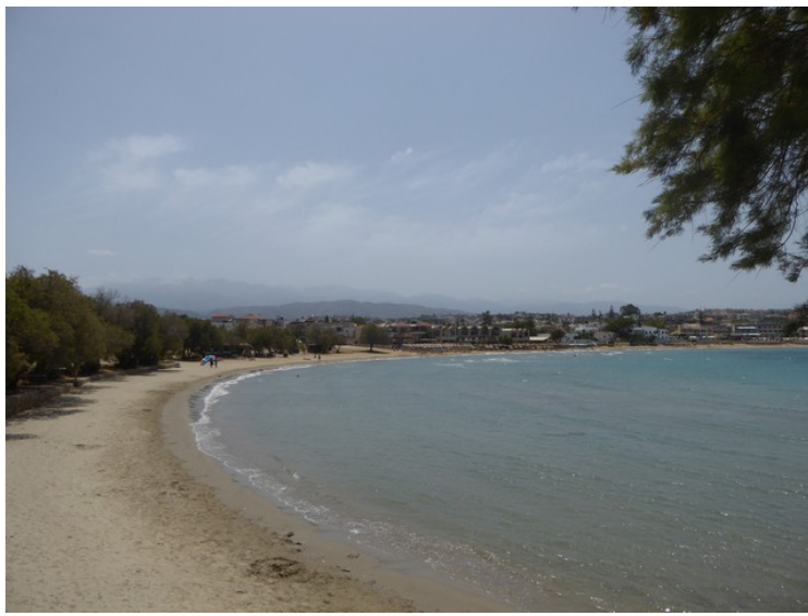
Glaros-stranden sett fra halvøya i retning Agii Apostoli.