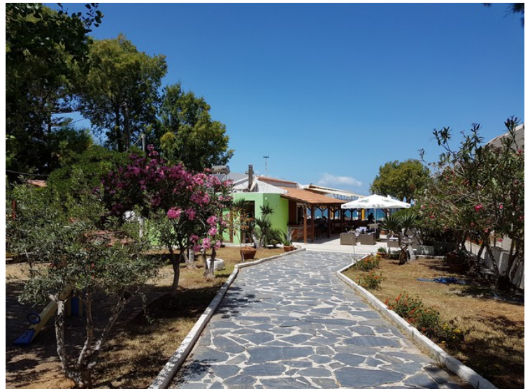
Vi spiste lunch en gang på denne restauranten. Den ligger litt lenger vest og heter Siroccos Restaurant .