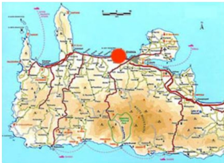
Kart over vest Kreta. Den røde flekken viser hvor Agii Apostoli ligger. Flyplassen vises også.