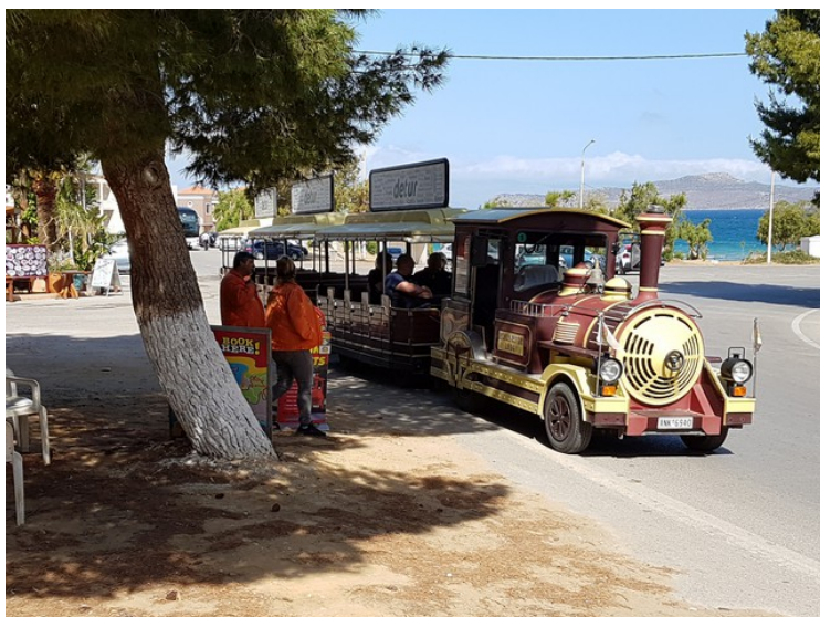
Dette er et turist-tog som kjører langs kysten vestover mot Afrata og inn på øya så langt syd som Meskla og Therissos. De kjørte 7 forskjellige ruter.