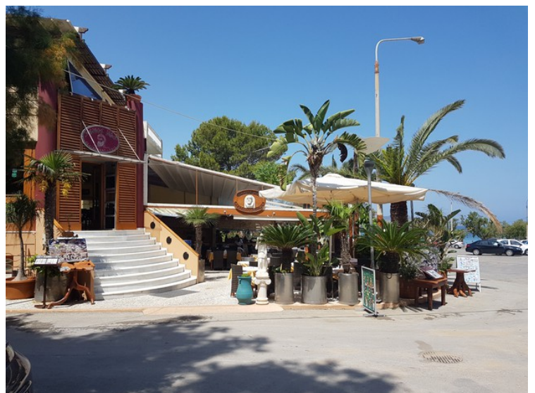
Vi spiste et par ganger på denne restauranten som ligger rett bortenfor hotellet vårt, i retning stranden. Den heter Xenios Dias , og er rangert som nummer 11 av 14 restauranter i Agii Apostoli. Vi merket forskjellen i forhold til maten på Talos.

Agii Apostoli er et lite område, men det er ifølge TripAdvisor 33 hoteller og 14 restauranter i området.