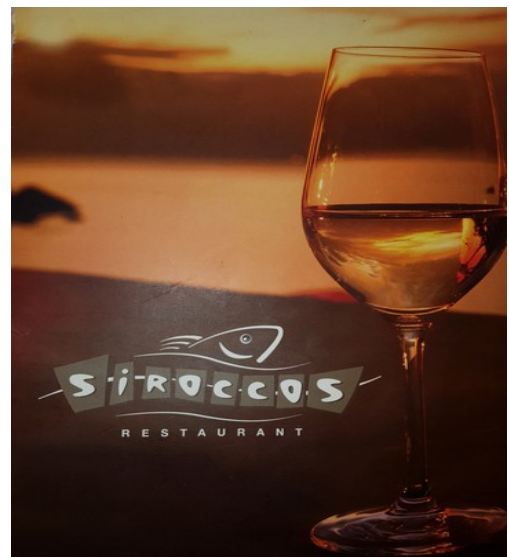
Forsiden på menyen.