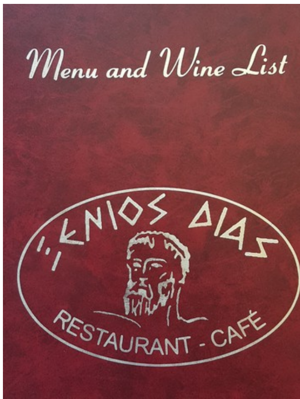
Forsiden på menyen på Xenios Dias.