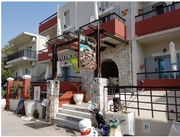
Dette er hovedinngangen til restauranten og hotellet.