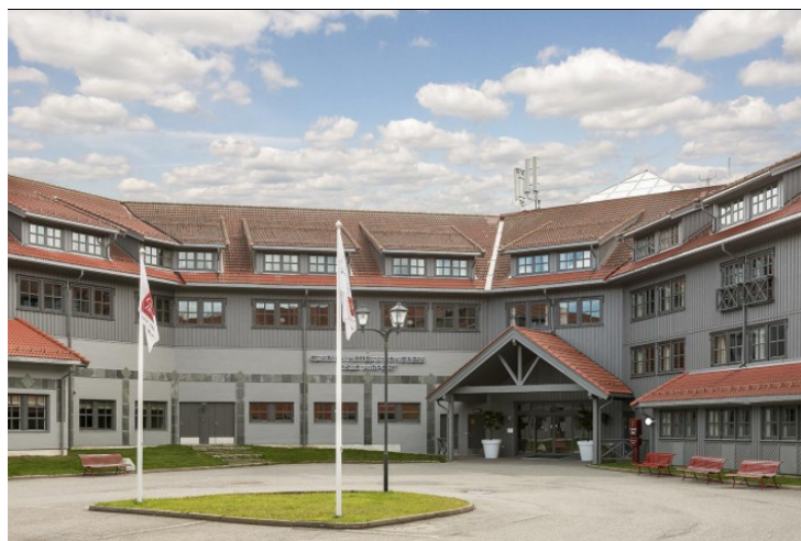
Dette er inngangspartiet på Clarion Hotel.