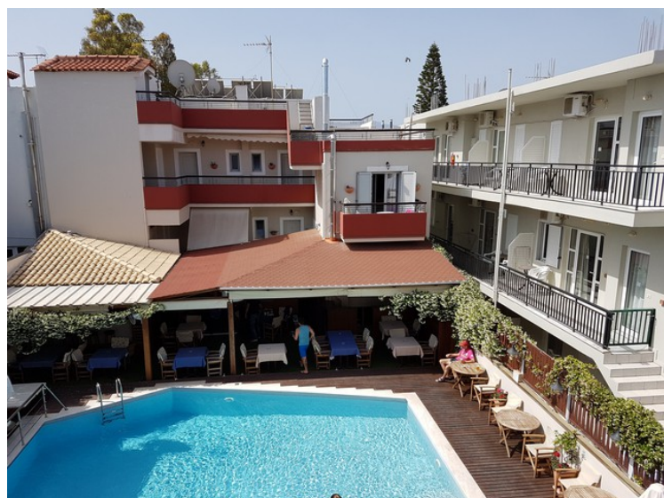
Det samme om dagen.