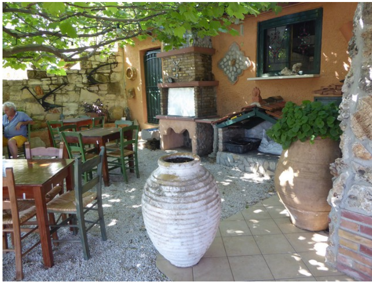
I gårdsrommet i restauranten har de flere gamle ting.