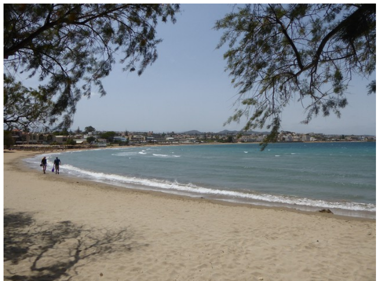
Samme strand sett vestover.

Agii Apostoli er mest kjent for de tre strendene som ligger her i hver sin bukt. Vi tok bilder fra to av disse, Iguana-stranden og Glaros-stranden. Den tredje, Chrissi Acti, er mest kjent og ligger noen hundre meter lenger øst. Navnet betyr den gyldne strand.