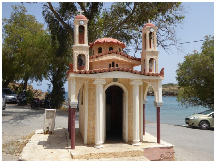
Denne står ved starten på halvøya.