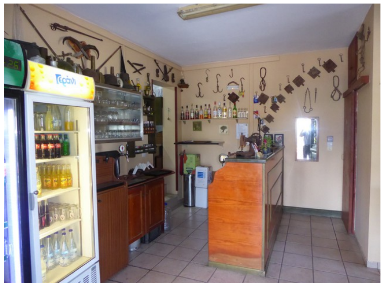
Jeg tok også et bilde inn døra i restauranten.