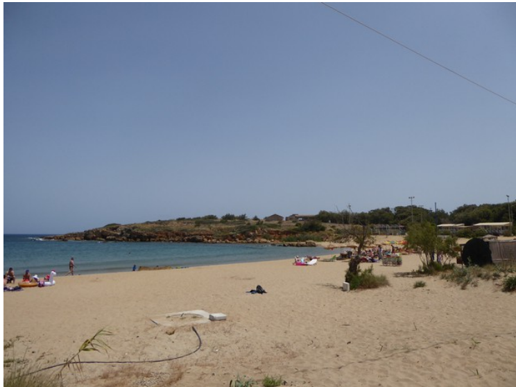
Iguana-stranden sett videre østover.