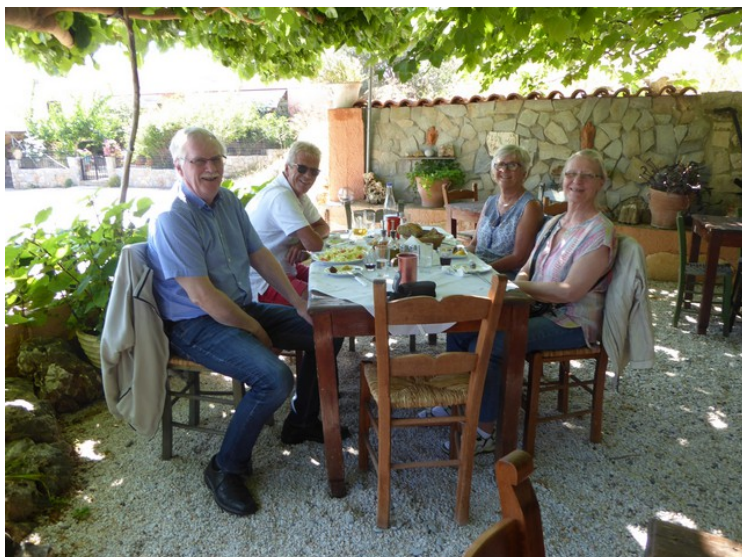
En av gjestene på restauranten tok et bilde av oss alle.