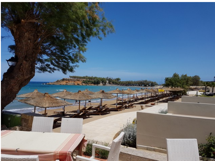
Utsikten mot øst fra Siroccos.