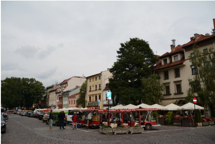
Her er vi kommet til Szeroka . Det er en kort gatestubbe med en del restauranter.

Torsdag den 25. var i Kazimierz. Etter at vi hadde tatt en pause på en restaurant gikk vi videre.