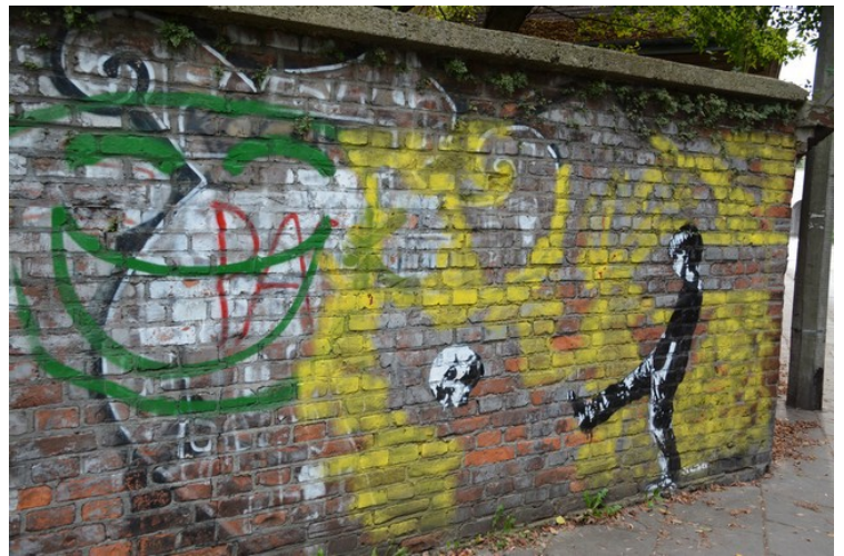
«Street art» på muren.