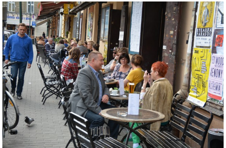
Her er vi ved Plac Nowy . I nordre enden er det flere restauranter.