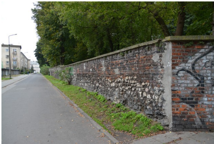
Den utvendige muren rundt gravplassen.