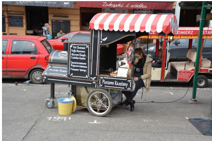
Her selges nybrente kastanjer.