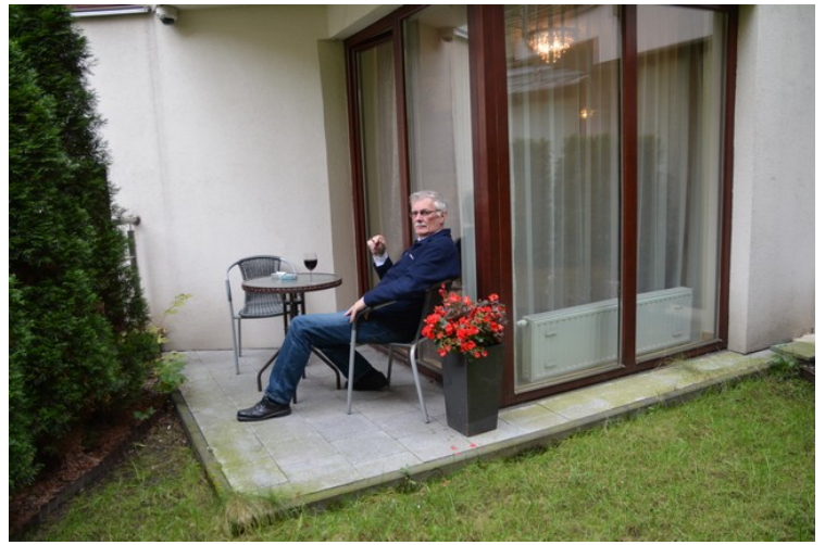
På terrassen utenfor leiligheten.