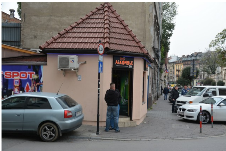
I dette lille huset får man kjøpt alkohol 24 timer i døgnet i gaten som heter Miodowa.