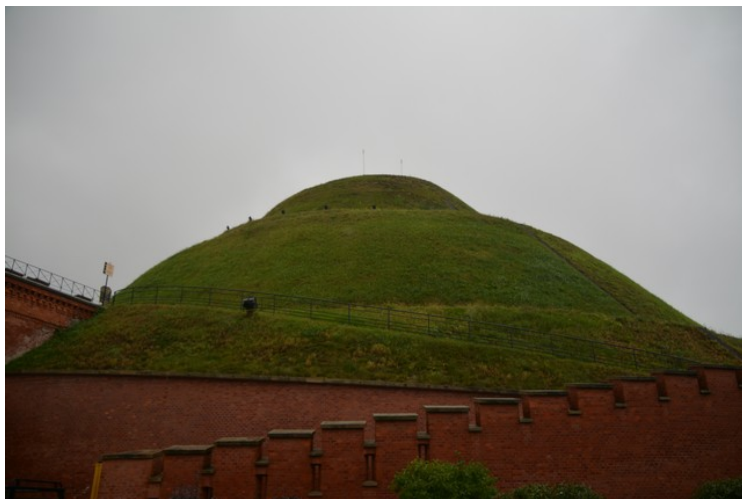
Utsikt opp mot haugen.