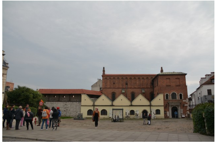
Helt syd ligger den gamle synagogen. Det var til høyre her vi satt på en restaurant tidligere på dagen.