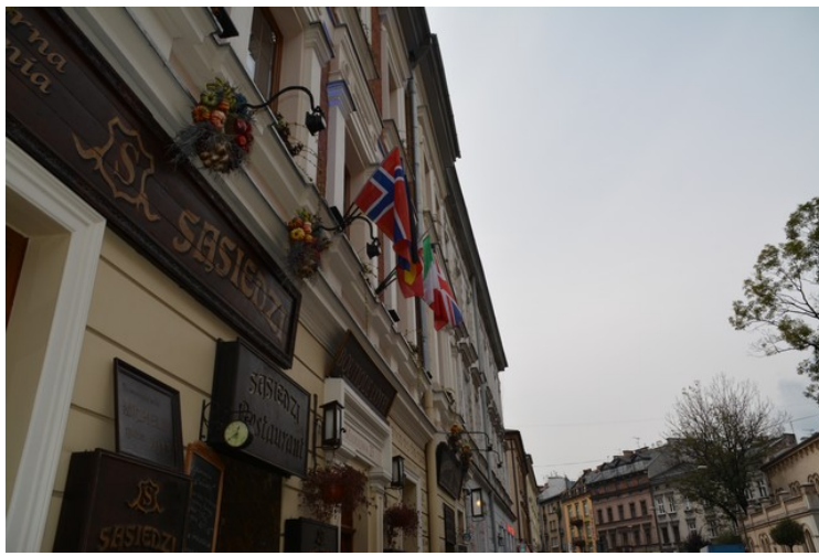
Her var det hotell og restaurant med norsk flagg, så det syntes vi at vi måtte ha et par bilder av.