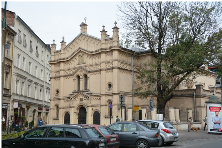
Lenger borte i den samme gata ligger tempelsynagogen . Det er den ene av to aktive synagoger i Krakow.