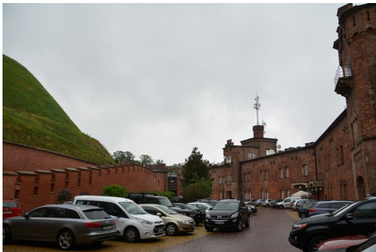
Plassen mellom citadellet og haugen.