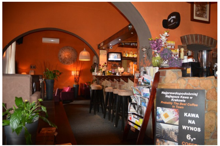
Inne i restauranten. Den heter Tajemniczy Ogród (Hemmelig Hage) De har god mat.