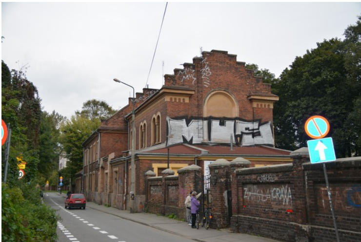
Vi fortsetter videre østover, under jernbanen. Her ligger den nye gravplassen .