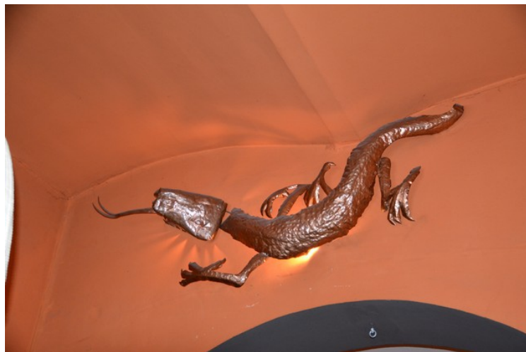
Vi spiste ikke ute. Vi gikk inn i denne restauranten. På veggen var denne dragelampen.