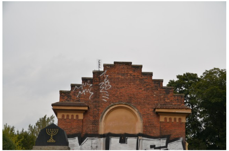
Dette er bårehuset som ble bygget i 1903.