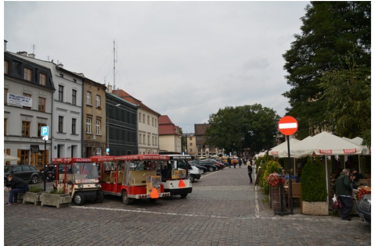
Her står det også flere små sightseeing-biler.