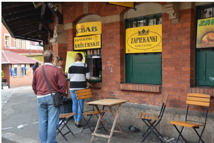
I rotundaen kjøpes stort sett mat til å ta med.