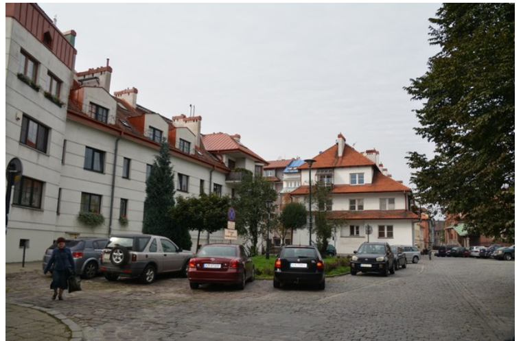
Dette er Plac Bawol.