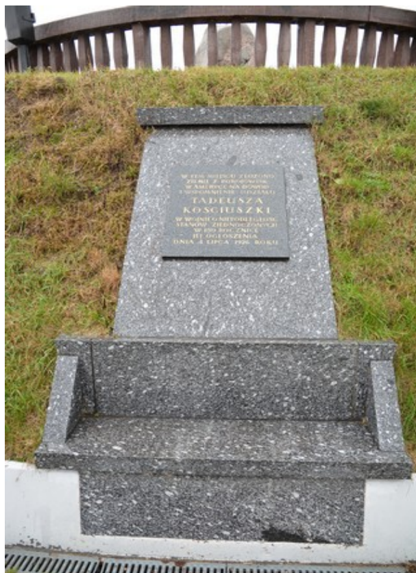
Minneplate på toppen.