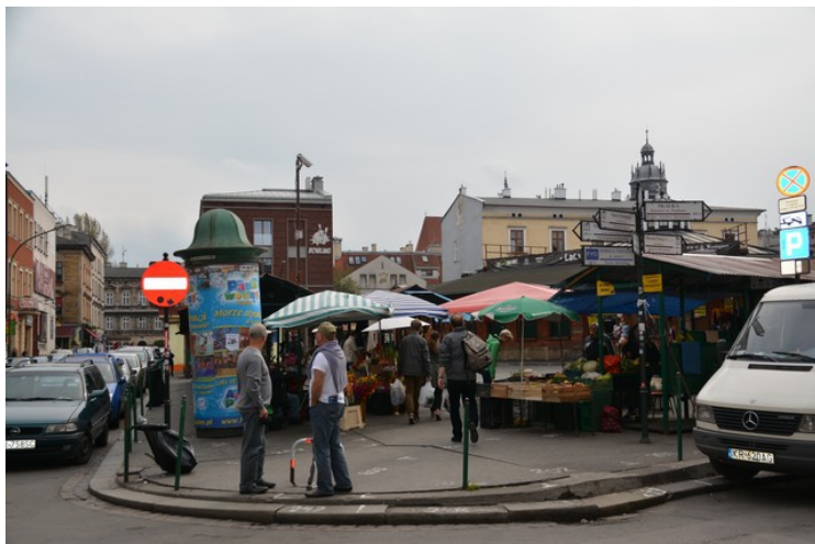
Fra nordre ende ser vi sydover inn mot midten av plassen.