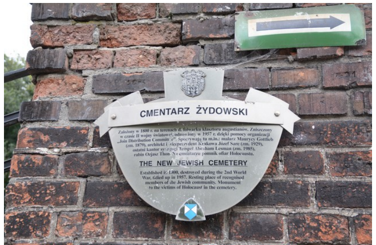
En plakat som forteller litt av historien til gravplassen. Den ble anlagt i år 1800, ble ødelagt i løpet av 2. verdenskrig, men ble reparert i 1957.