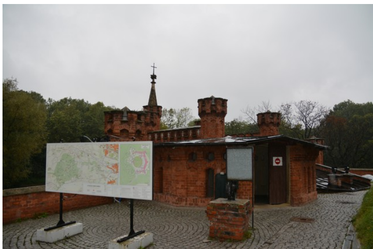
Her er vi kommet opp på toppen av inngangspartiet.