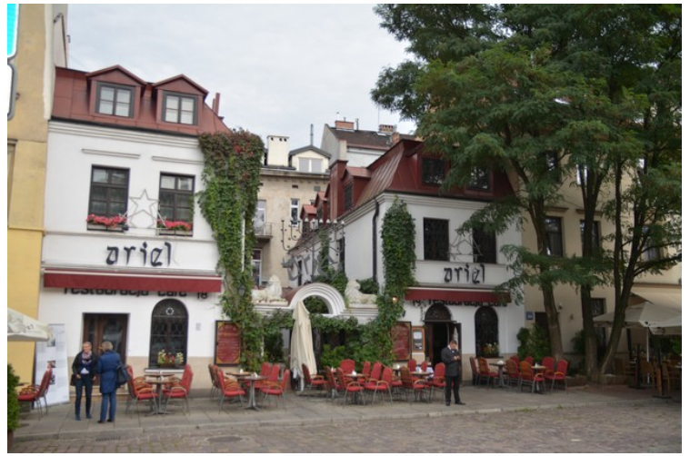
Mer av restauranten.