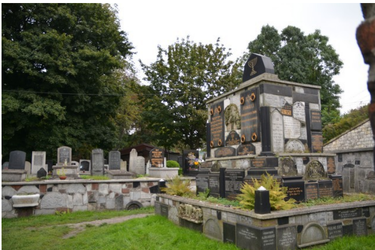
Enda et bilde.