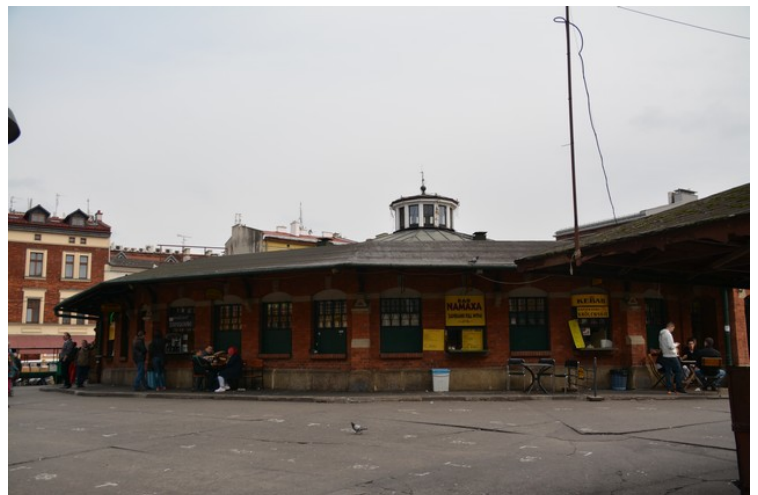
I midten ligger denne rotundaen. Her er det blant annet små pølseboder.