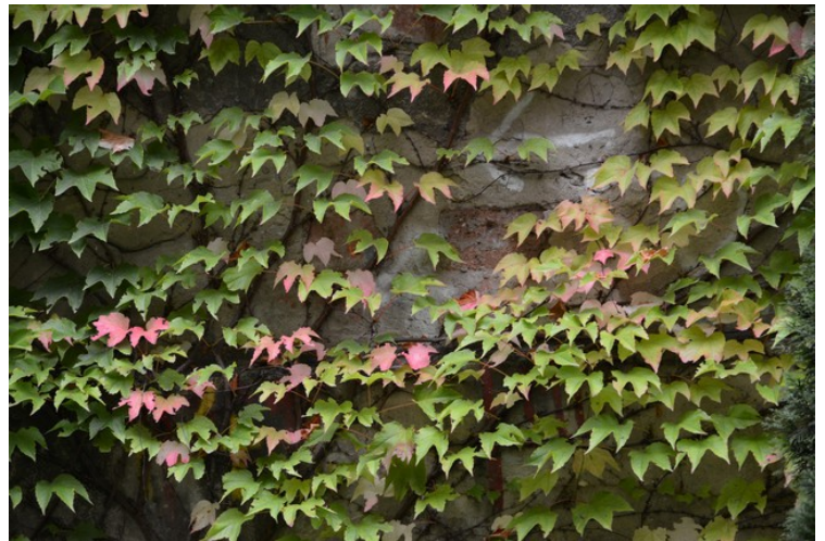
Klatreplanter på muren.