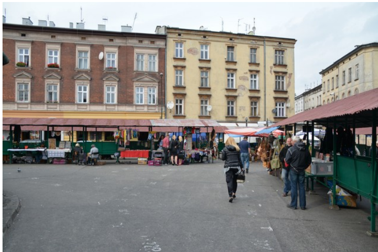
Denne dagen er alle salgsbodene plassert langs kanten av plassen.