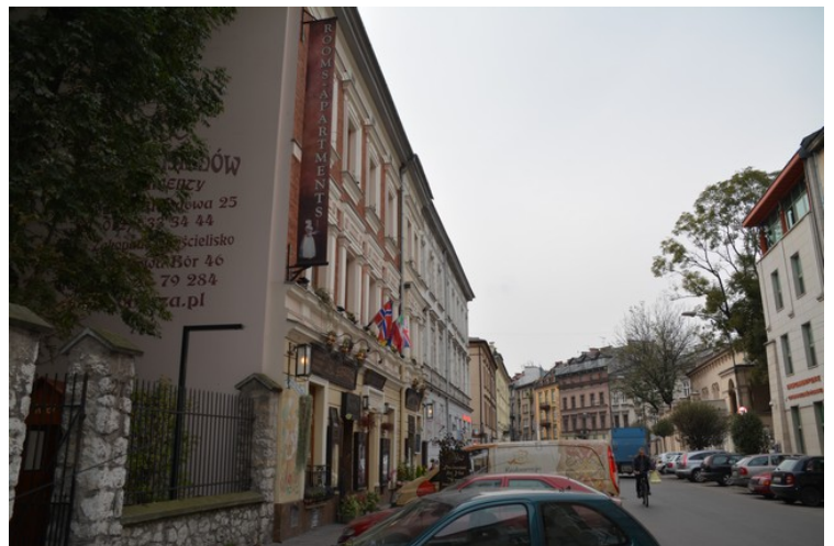
Videre bortover gaten ser det slik ut.