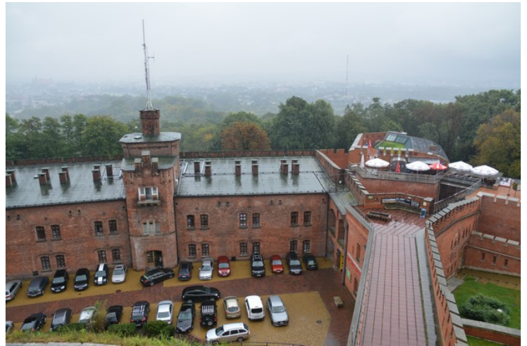
Utsikt ned til der vi sto mens det regnet som verst og hvor vi kjøpte billetter.

Etter at vi var ferdige her bestilte vi en taxi på billettkontoret og kjørte tilbake til leiligheten. Vi syntes ikke at det var så spennende å rusle rundt i regnvær, selv om vi hadde vanntette sko og paraplyer. Vi slappet i stedet av i leiligheten og spiste en tidlig middag på stamrestauranten vår.