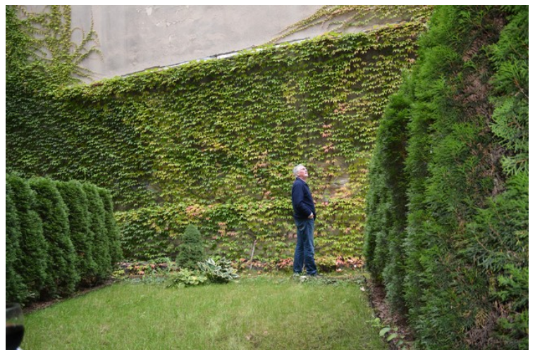
Jeg er ute på inspeksjon.