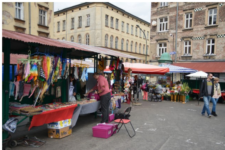
Noen av salgsbodene