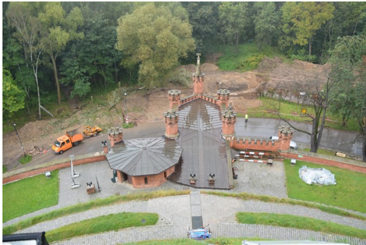
Utsikt ned til inngangspartiet.