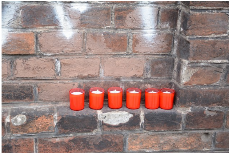
Lys er tent utenfor porten.