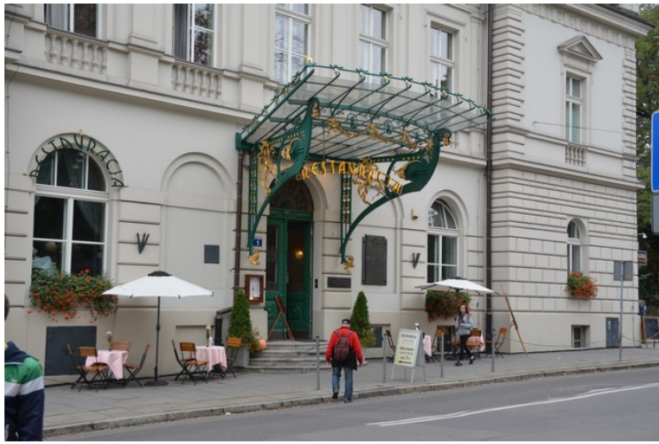
På vei tilbake til leiligheten går vi forbi et stort hotell.