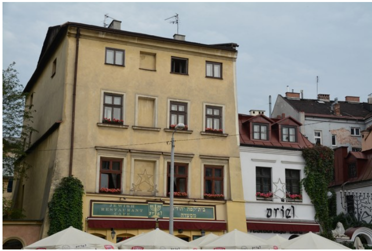
Så er vi tilbake på Szeroka. Her ligger denne jødiske restauranten som heter Ariel . De leier også ut leiligheter.