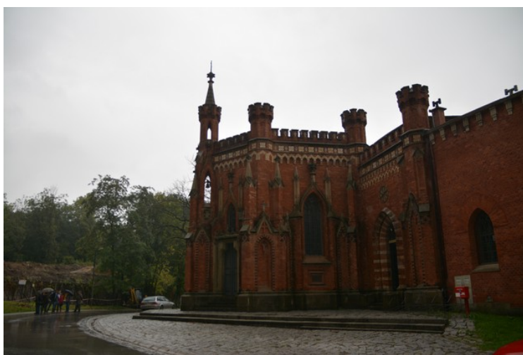
Sett fra andre siden.