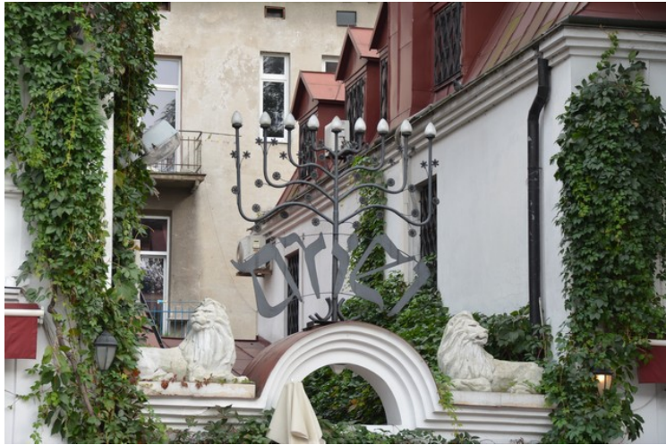
Ni-armet lysestake over inngangen.