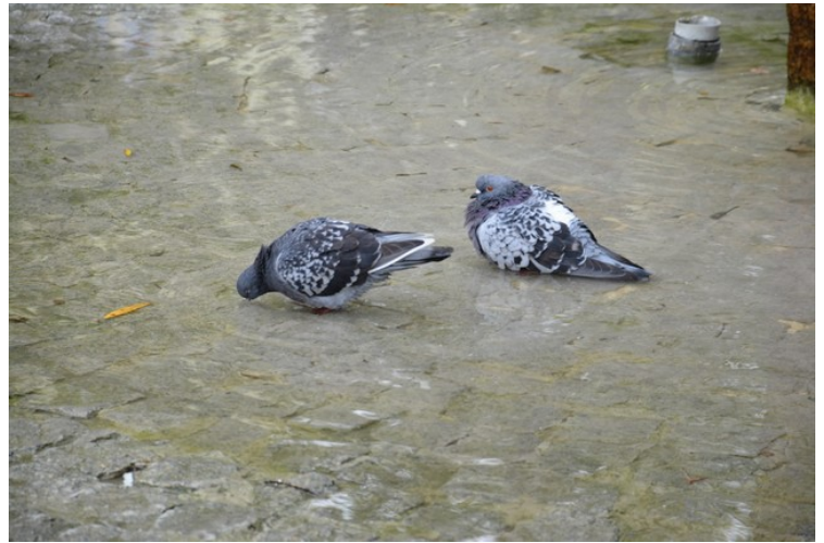
Duene bader i vanddammene på plassen.