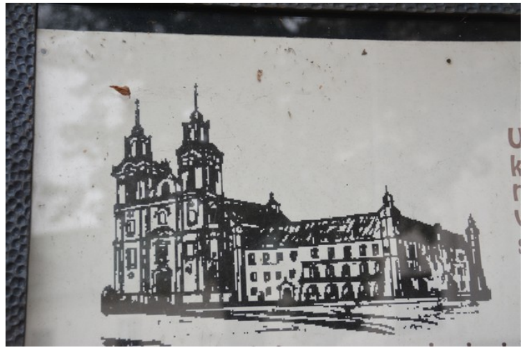
En tegning av kirken og klosteret.