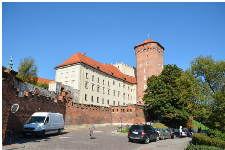
Tårnet og slottet.