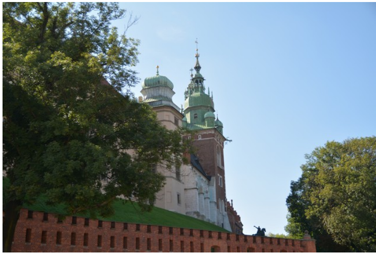
Vi ser her opp mot den største kirken i Krakow, Wavelkatedralen .