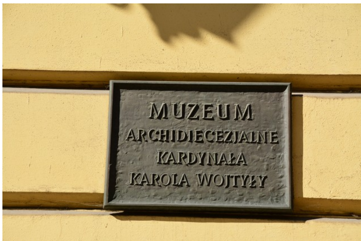
Nå er begge husene museum.