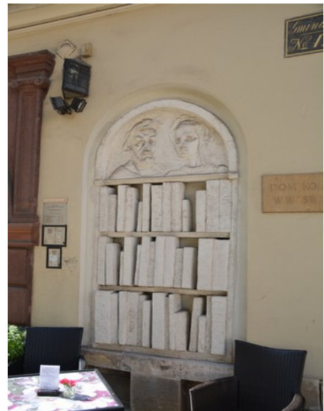
En bokhylle med steinbøker utenpå veggen.