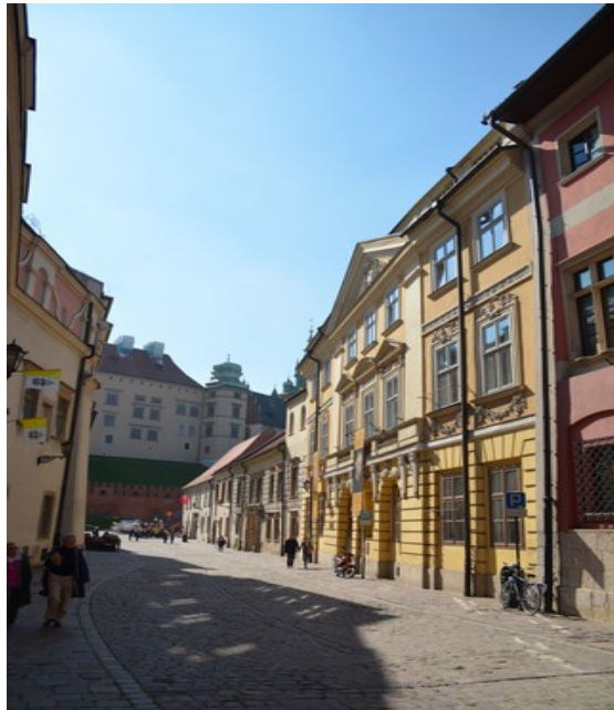
Den sydligste enden av Kanonicza. Pave Johannes Paul II har bodd i hus nr. 19 og 21.