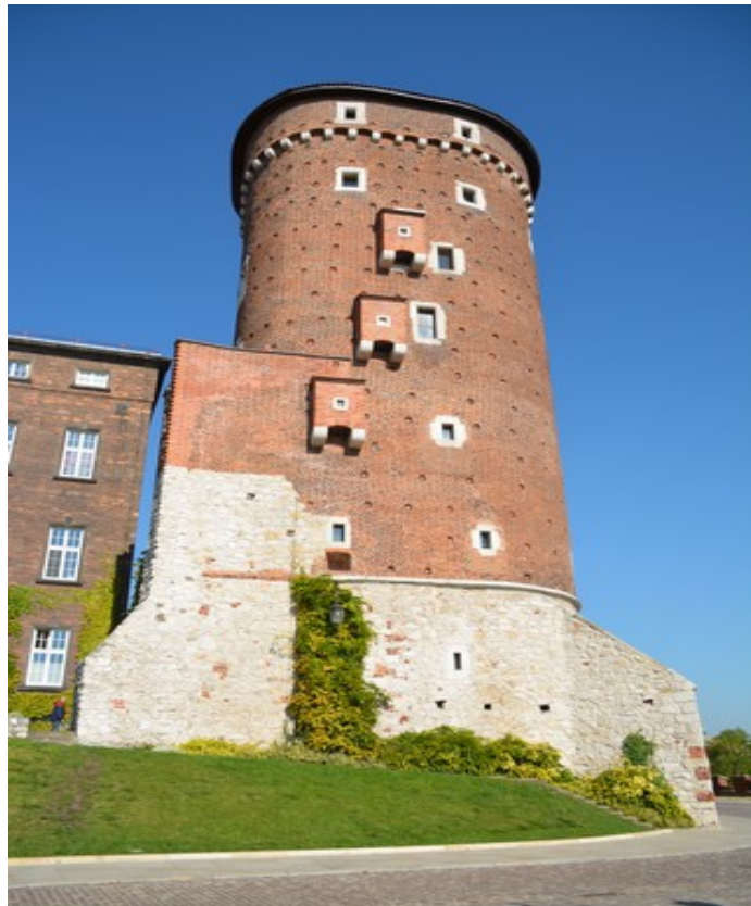
Tårnet sett fra en annen vinkel.