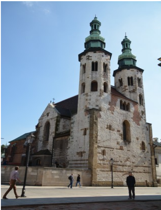
St. Andreas-kirken. Dette er en festnings-kirke som sto imot angrepet fra mongolene i 1241.