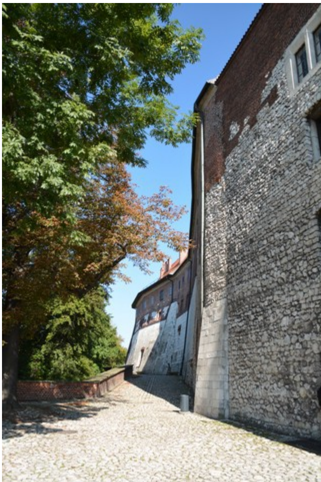
Festningsmuren videre bortover.