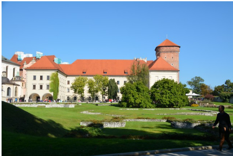
Det kongelige slottet.