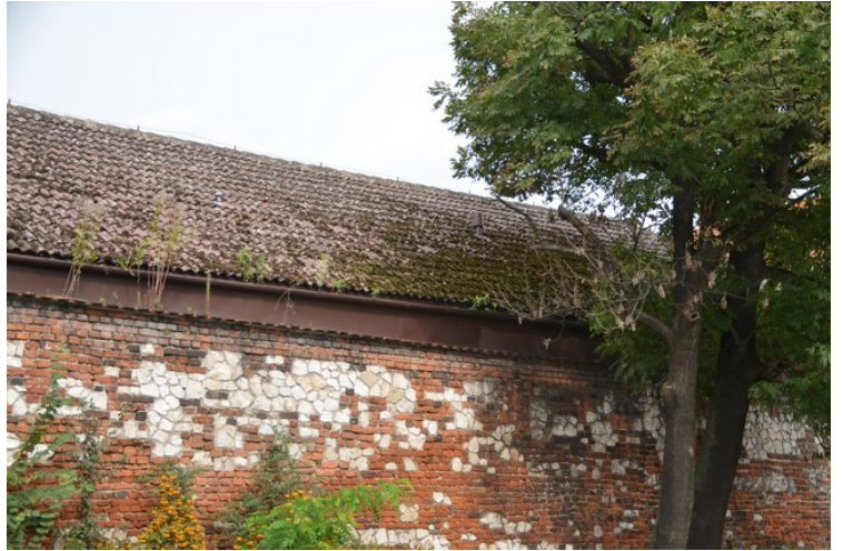
Et mosegrodd hus.