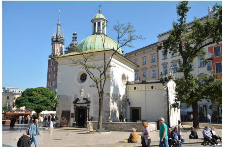
St. Adalbert-kirken står helt syd på Rynek Główny. Det er en av de eldste steinkirkene i Polen. Den ble bygget på 1200-tallet og oppkalt etter misjonæren Adalbert.

Dette er det sydligste delen av Tøyhallen og Vaktårnet.