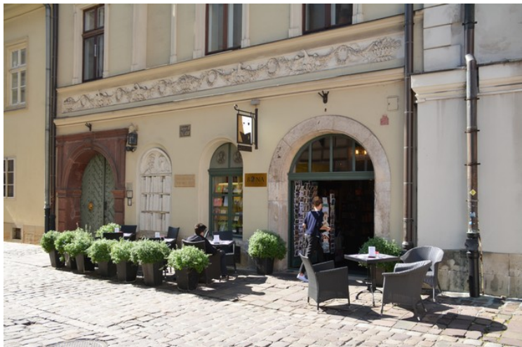
Et slags kulturhus.