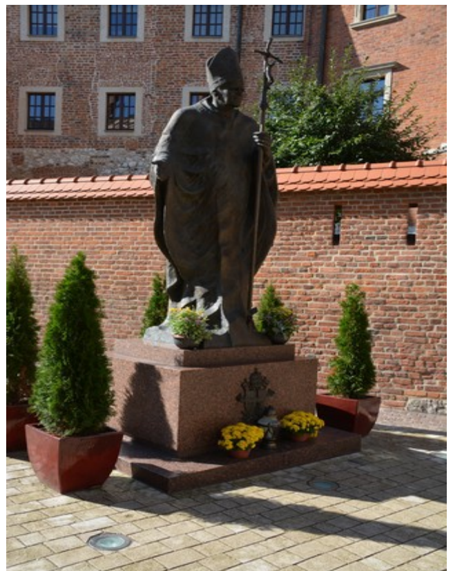
På plassen foran domkirken står pave Johannes Paul II som kom fra Polen.