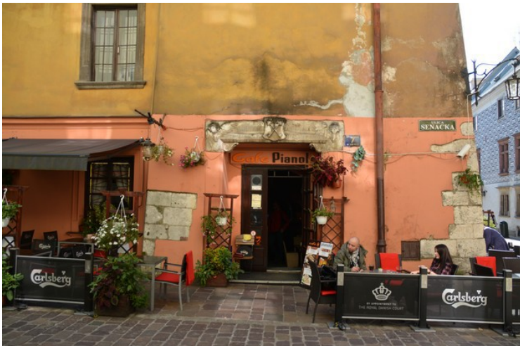
Dette er Cafe Pianola idet vi svinger inn i Kanonicza , Kannikens gate som er en av de best bevarte gatene fra middelalderen.

I denne kirken blir det oppbevart en sertifisert kopi av likkleedet i Torino.