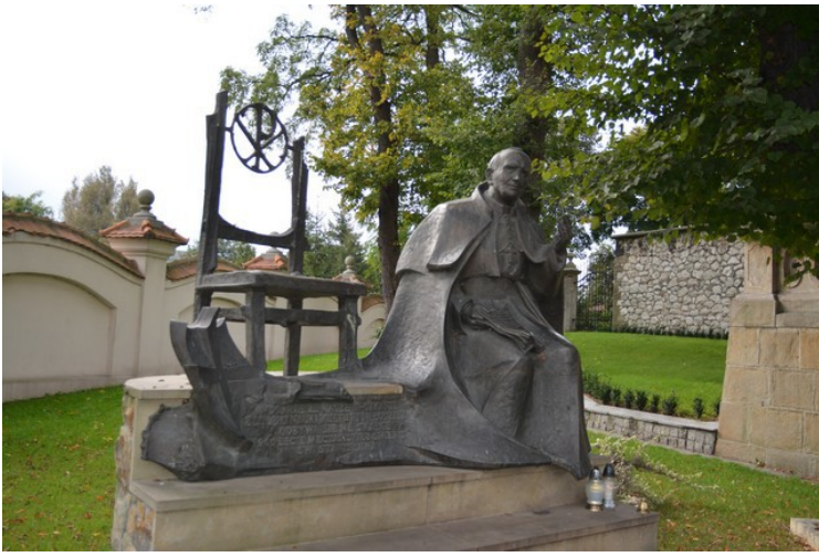
Her sitter St. Stanislaw.