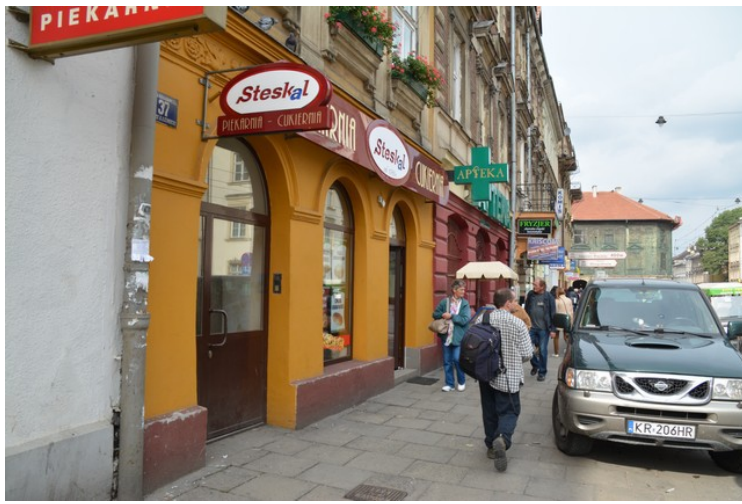
Gatebilde rett før vi kommer til Plac Wolnica .