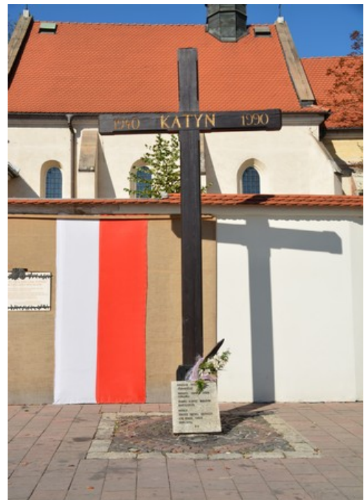
Retten nedenfor Wavel-høyden står dette minnesmerket for Katyn-massakren i 1940, da russerne massakrerte en mengde soldater blant annet i Katyn i Vest-Russland. Antall drepte er anslått til rundt 20 000.