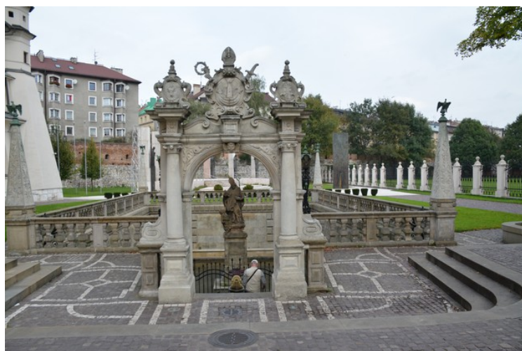
St. Stanislaws basseng.

I 1079 ble biskop Stanislaw av Krakow myrdet av den daværende polske kongen, Boleslaw II , da han forrettet messen i kirken. Han ble kastet i dette bassenget.