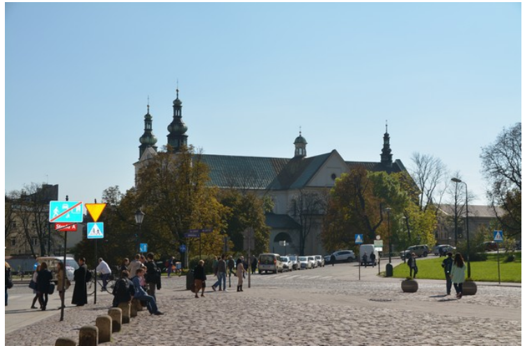
Bernardiner-kirken ligger rett øst for Wavel høyden. Den forrige kirken ble brent i 1655, men ble bygget opp igjen. Det er god akustikk i kirken, så det er ofte korkonserter her.