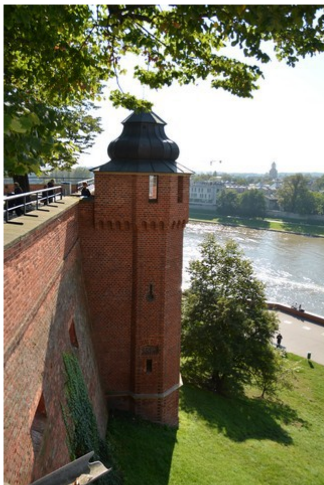
Ett av försvarstårnene utenpå muren.