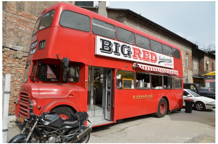
En mobil pølsebod.