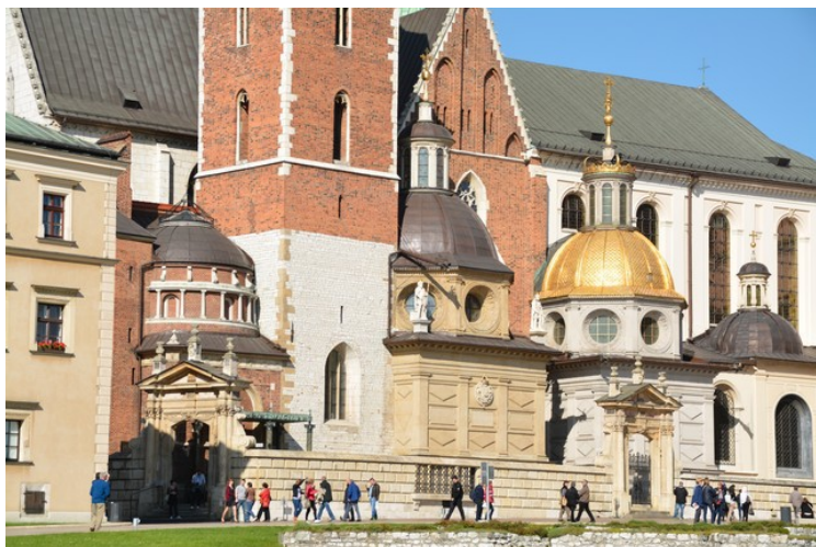
Mange kupler på domkirken.