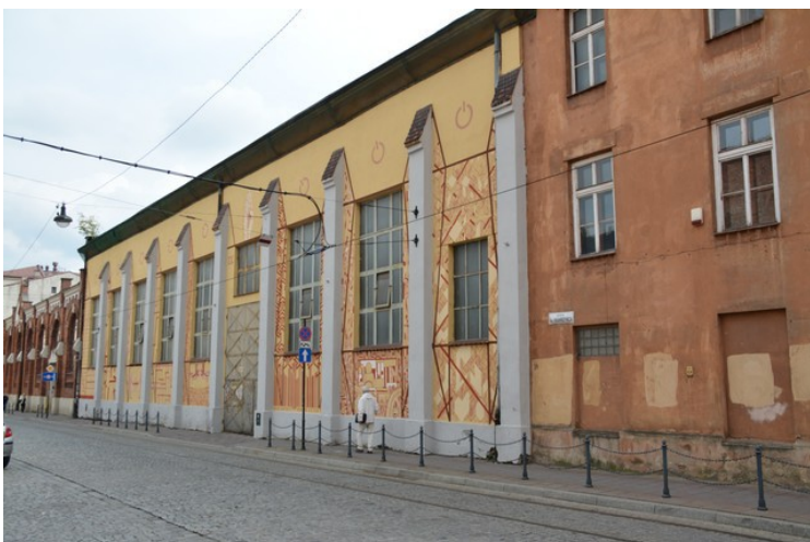
En gammel fabrikkbygning.