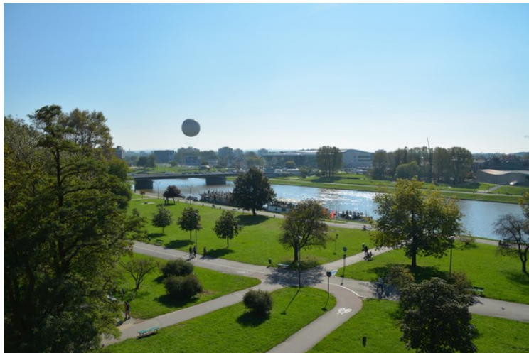
Utsikt sydover over Wistula-elven mot Podgórze.