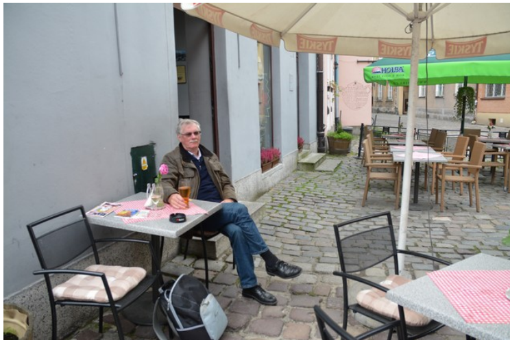
Jeg tok bildene mens vi satt her og hadde et glass øl.