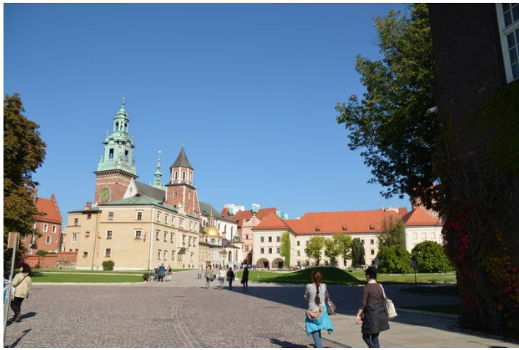
Her kommer vi inn i festningen. Domkirken til venstre og slottet til høyre.