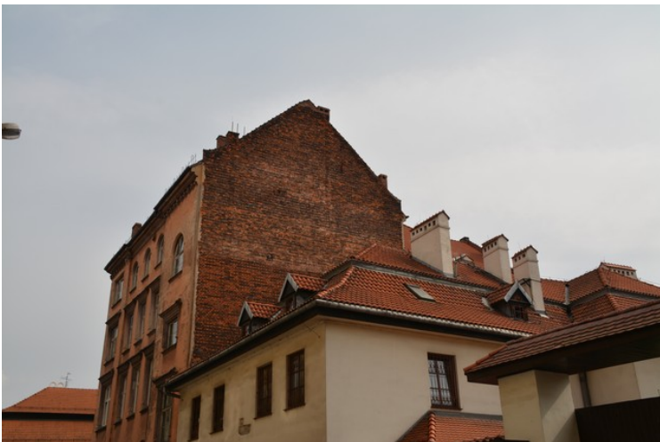
Så noen gamle hus.