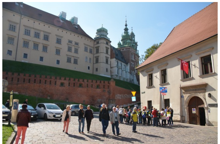
I den sydligste enden av gata ser rett opp på Wawel-høyden .