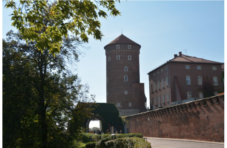
Vi ser her det Sandomierske tårnet . Det ble bygget i 1460 som et forsvarstårn med artilleri.