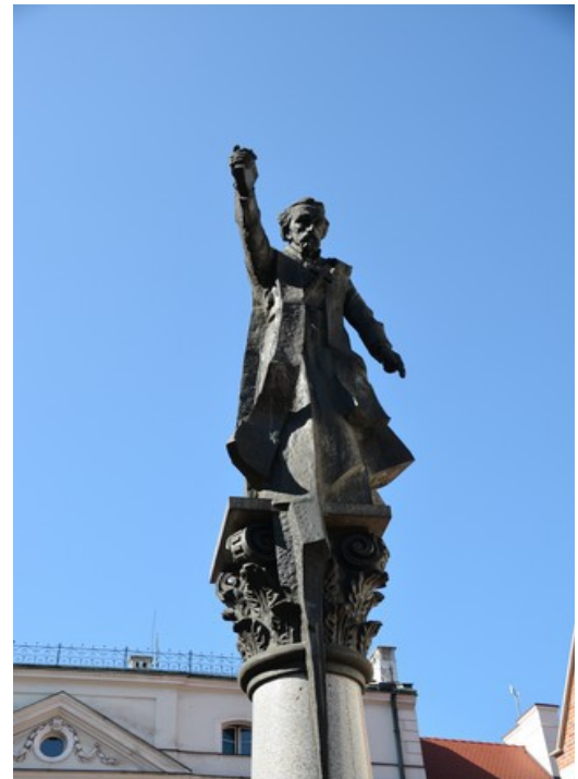
En statue av Piotr Skarga står på St. Maria Magdalena-plassen.