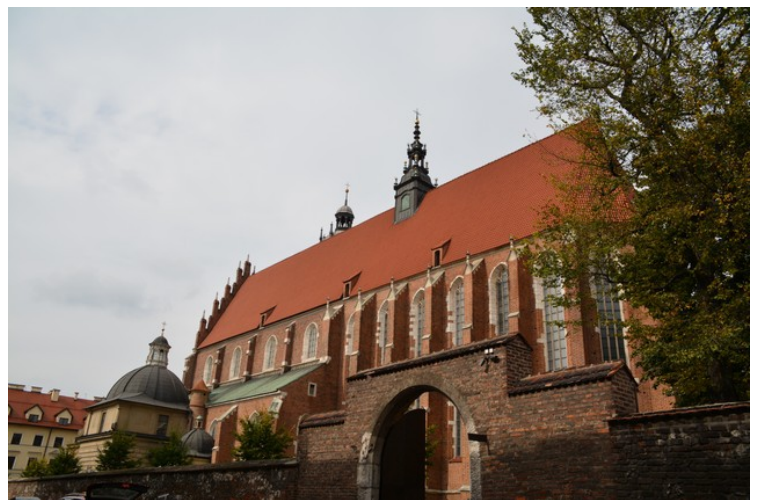
Her går vi forbi Kristi Legemsfest Kirke .