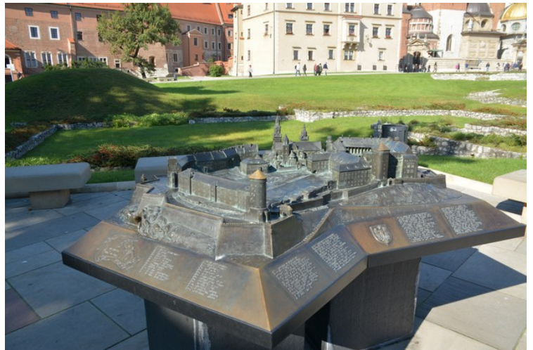
En modell av Wawel-høyden.