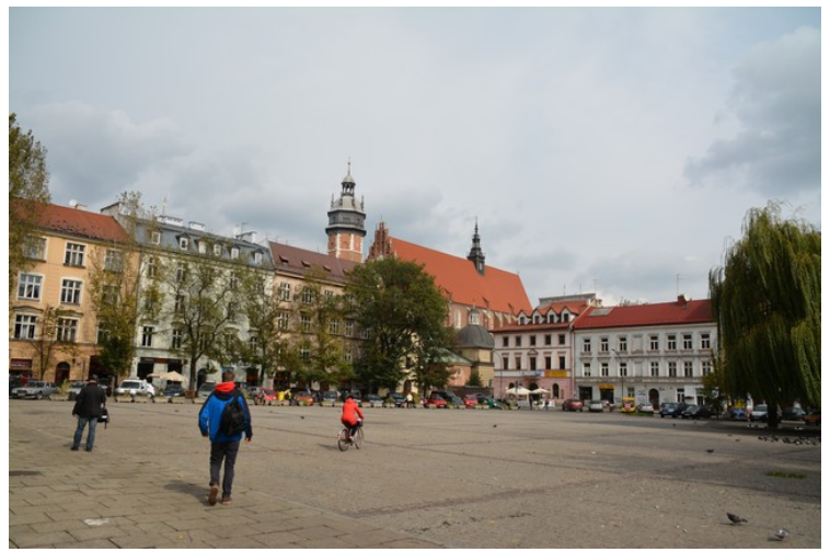
Dette er Plac Wolnica med Kristi Legemsfest Kirke i bakgrunnen. Plac Wolnica var den nest største markedsplassen i Polen og kanskje Europa med 195x195m. Bare 5m kortere sider enn Rynek Glowny.