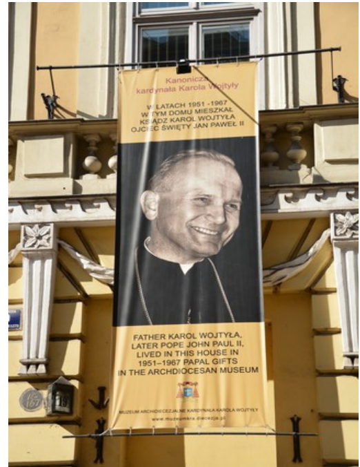
Plakat utenfor hus nr. 19.