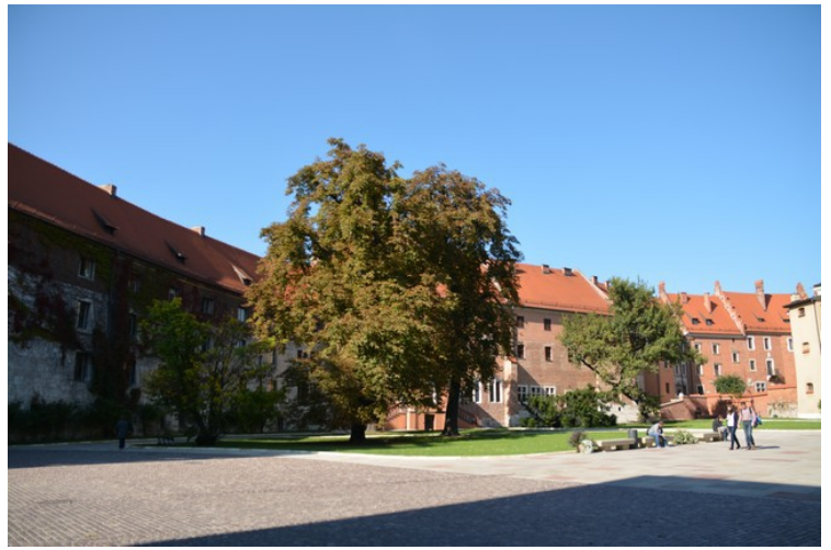
Boliger til venstre.