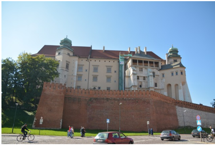
Østsiden av slottet.