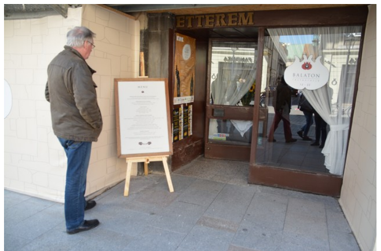
Jeg leser menyen utenfor en restaurant, for nå må vi ha litt å spise.