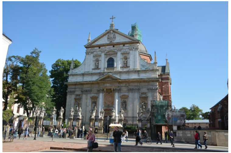
St. Peter og Paulus-kirken. Det står statuer av de 12 disiplene foran kirken.