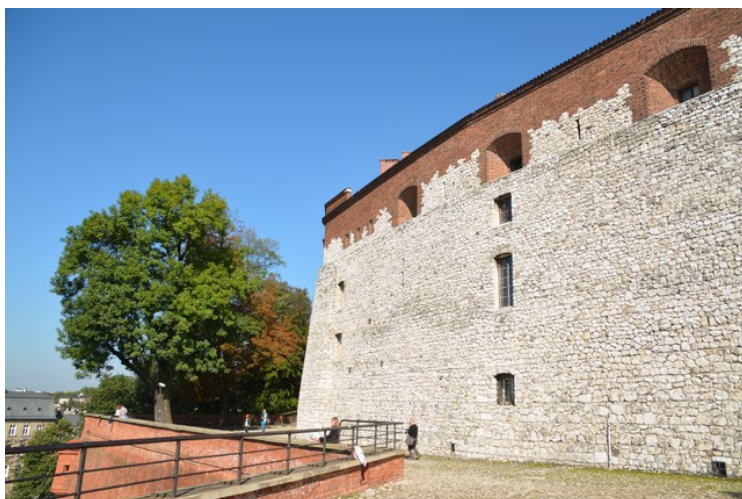
Noe av festningsmurene på vestsiden.