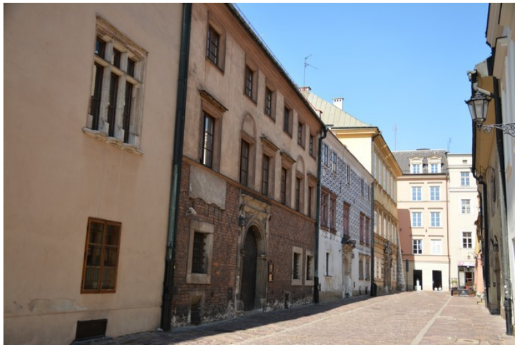
Her ser vi langsetter gata.