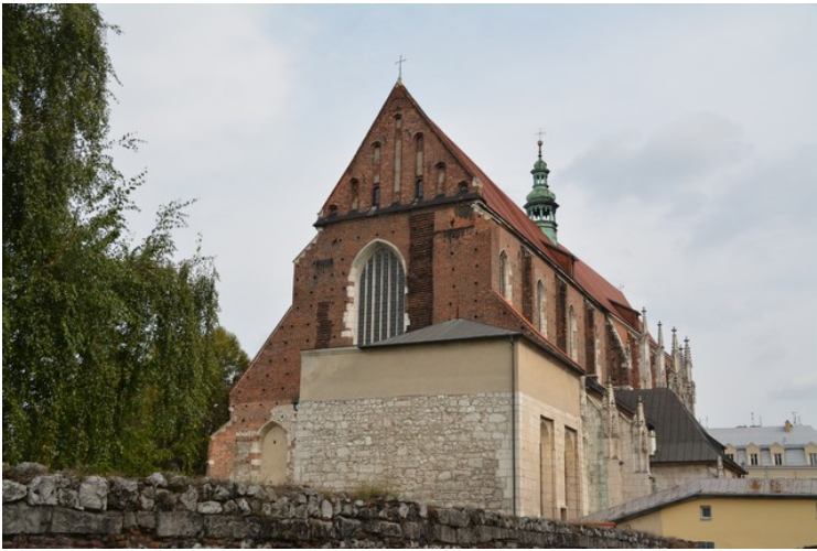
Vi går viderere innover i Kazimierz-distriktet og kommer forbi St. Katarina-kirken .