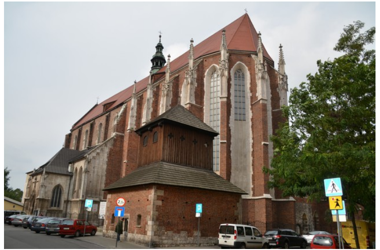
Her har vi gått litt videre.