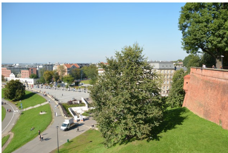
Elvepromenaden nordvest for høyden.