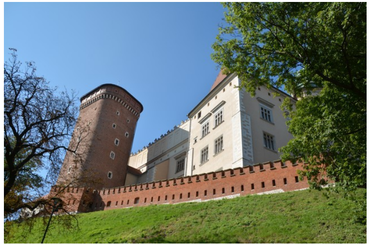
Vi går opp på høyden fra østsiden.