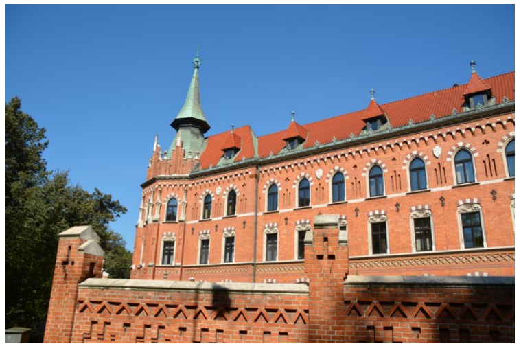
Dette er Wyższe Seminarium, som er en slags presteskole.