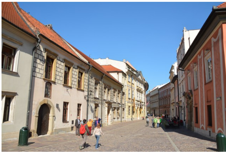
Her er vi i enden av Kanonicza, rett nedenfor Wavelhøyden, og ser nordover.