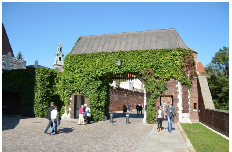
Den Bernardinske porten.