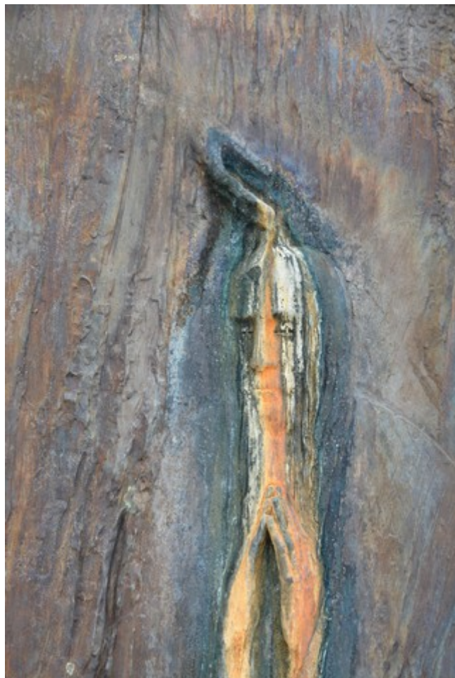
Denne monolitten står rett foran de 7 statuene.