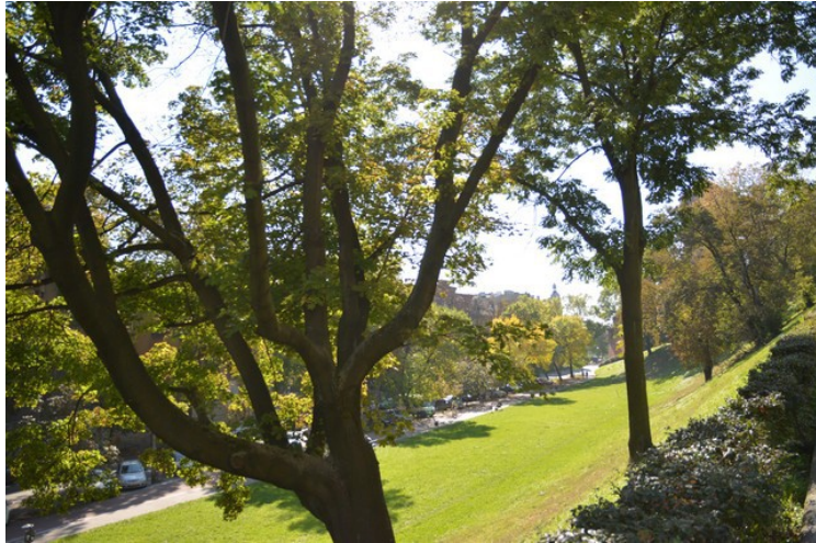
På sydsiden er det en park.