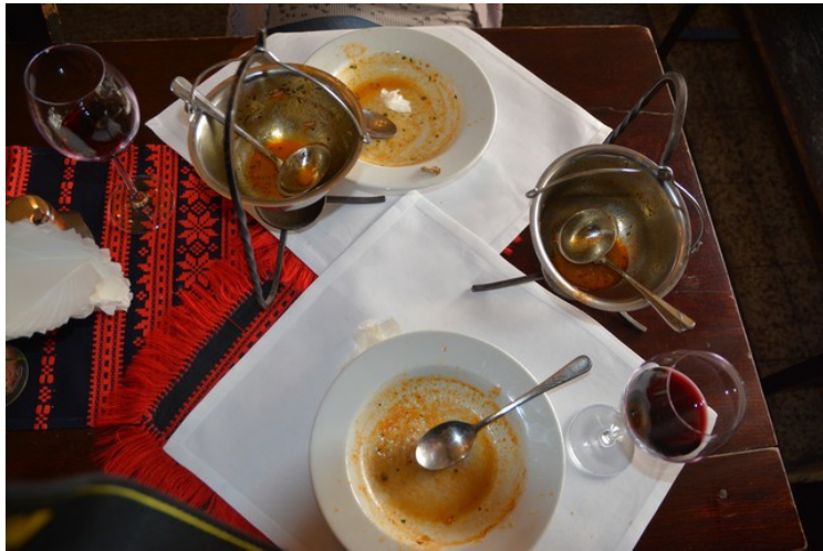
Suppen er oppspist. Den var god.