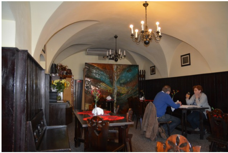
Inne i restauranten.