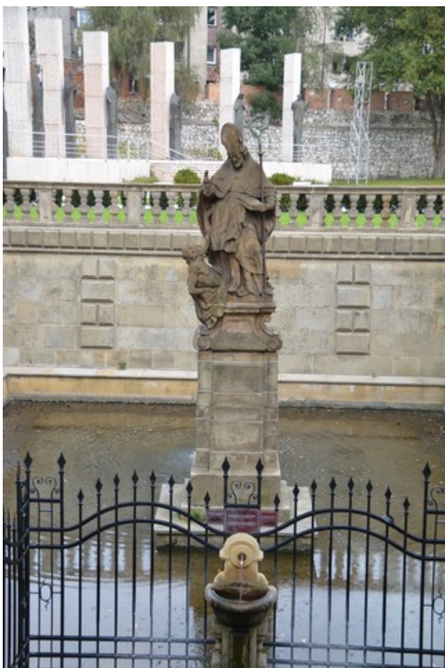
Statuen av St. Stanislaw står i bassenget.