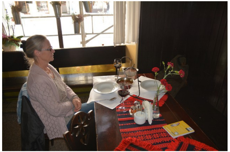
Her har vi nettopp bestilt gulasj , og venter på maten.