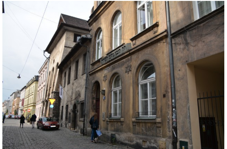
Her er vi i gaten som heter Jozefa. Her er det flere jødestjerner på veggene.