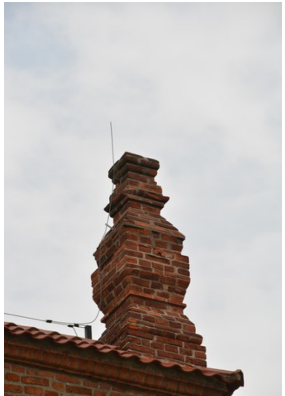
Noen bygningsdetaljer på den gamle synagogen . Den er Polens eldste bevarte synagoge. I dag er det et museum.