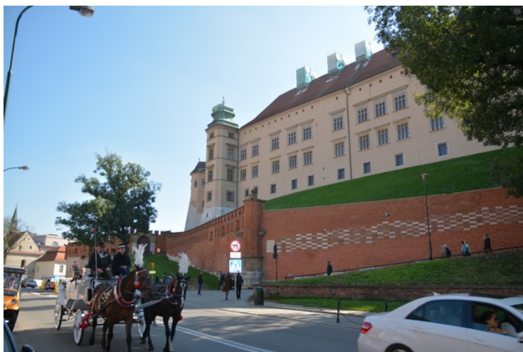
Her ser vi opp mot østre delen av Slottet.