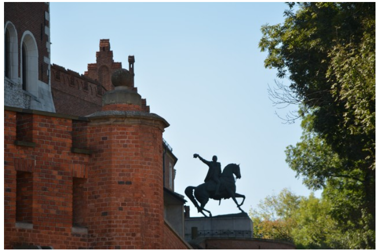
Her ser vi en rytterstatue av Tadeusz Kościuszko , den mest kjente polske fridomshelten.