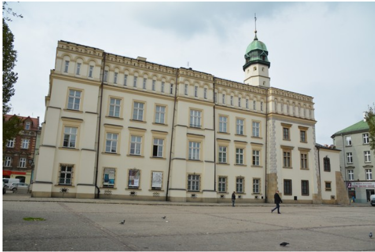
I ene enden av plassen er det etnografiske museum. Det var før det gamle rådhuset i Kazimierz.