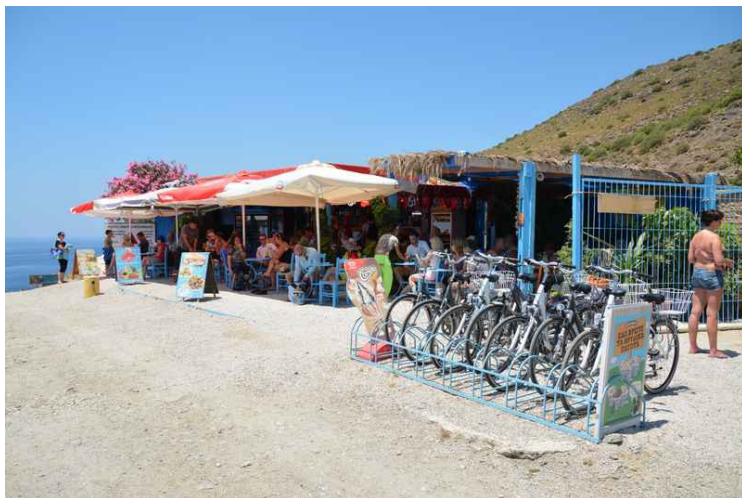
En liten kafe.