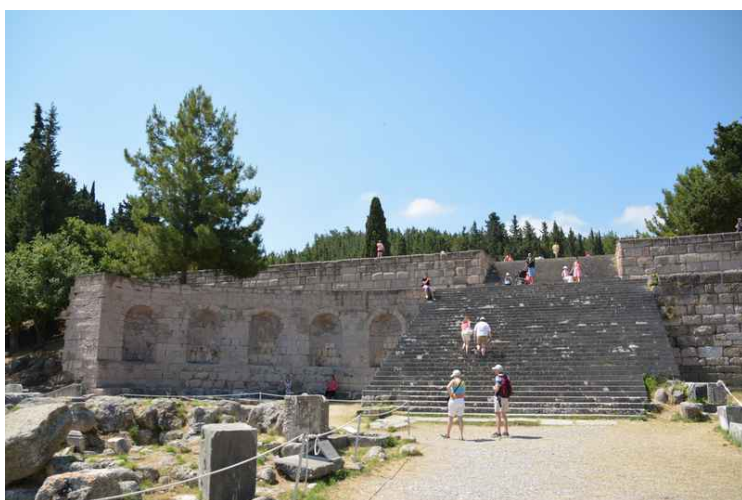
Trappen opp til 4. nivå.