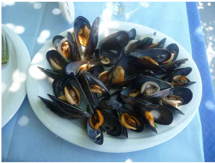
Jeg hadde blåskjell.