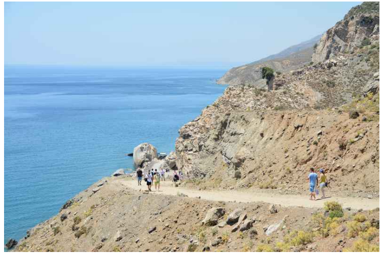
Det er bratt nedover.