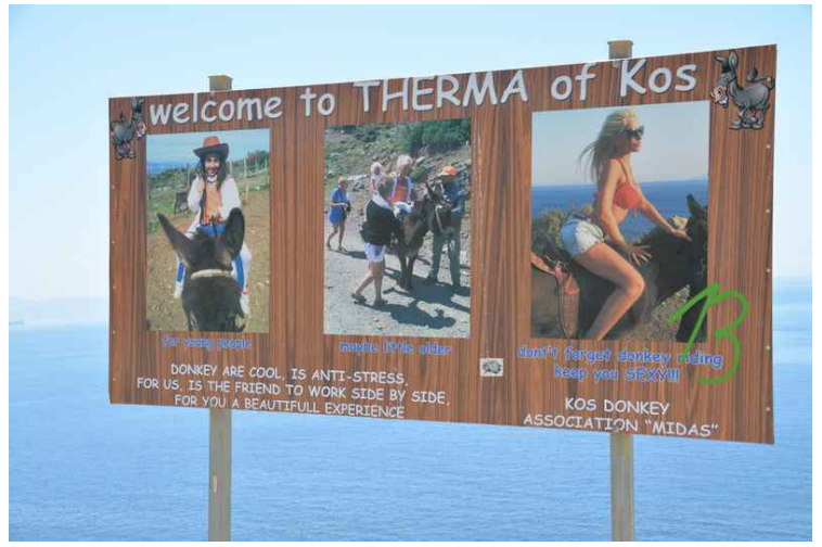
Skiltet som står ved veien nedover.