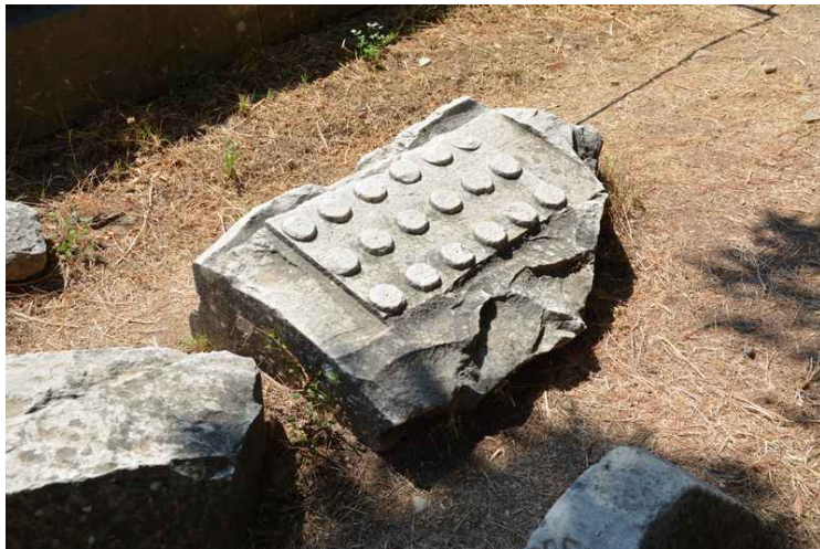
Førløperen til Lego-klossene?