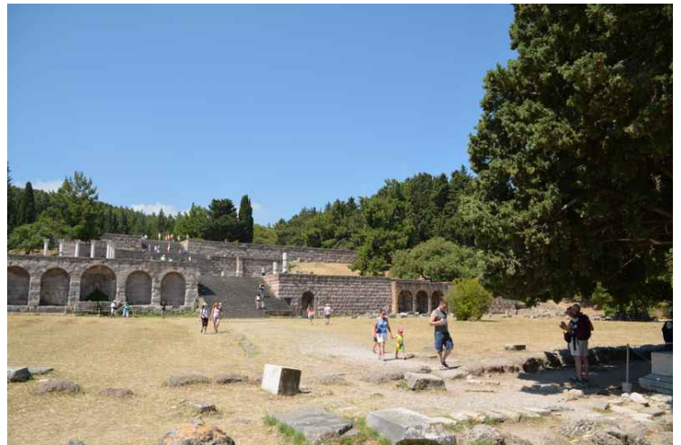
Trappen opp til tredje plan.