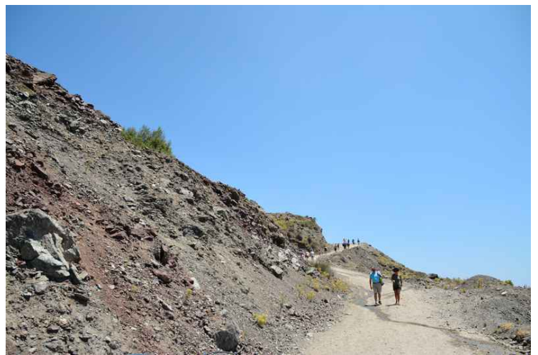
Veien hvor vi kom ned.