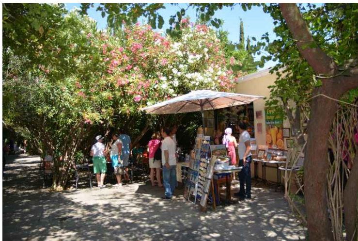
En liten restaurant rett innenfor porten.