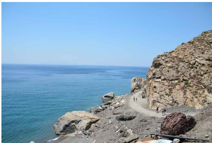
Veien videre nedover.