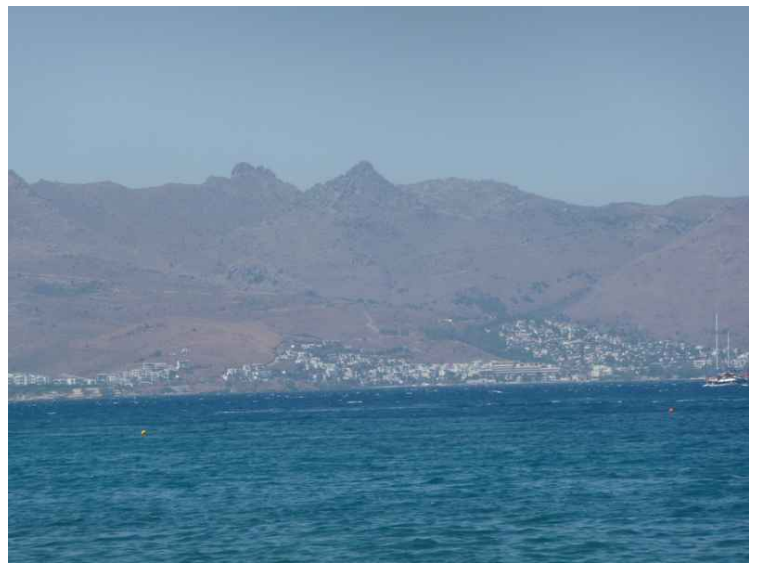
Utsikt mot Ayarlar i Tyrkia.