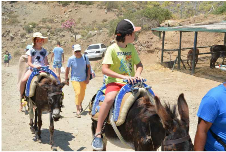
Det var noen som red på esler i stedet for å gå. Vi gikk.