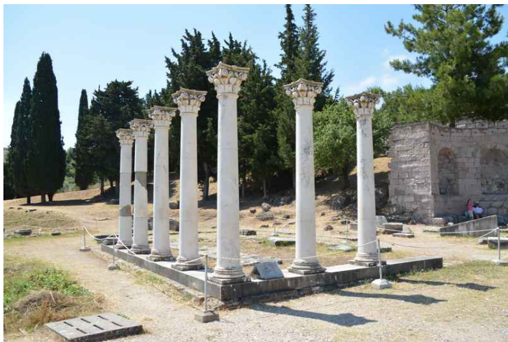
Rester av et tempel.