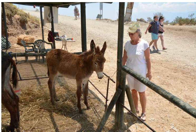
Øverste stasjonen for eslene.