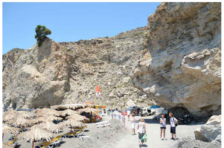
Rett før vi kommer til de varme kildene er det en badestrand.