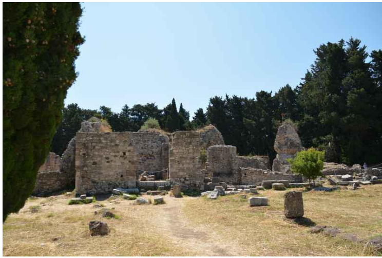
Dette er badeanlegg.