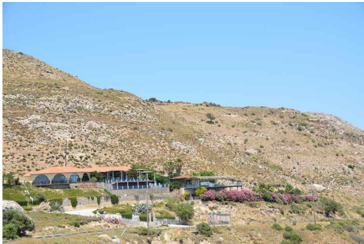
Leiligheter litt lenger opp i bakken.