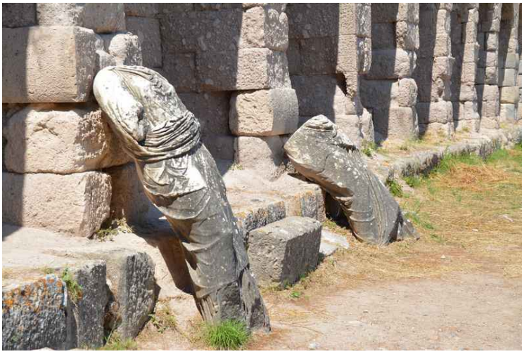
Rester av statuer