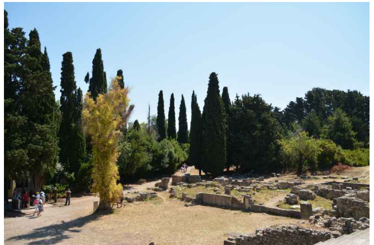
Her har vi gått opp trappene til 2. plan og ser i retning av inngangen.