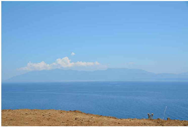
Vi ser tvers over sundet til Tyrkia som ikke ligger så langt borte.