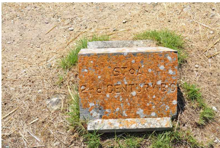
Det var en stoa her, dvs. en overdekket søylehall.