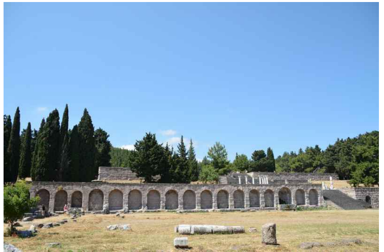
Forstøtningsmuren for tredje platå.