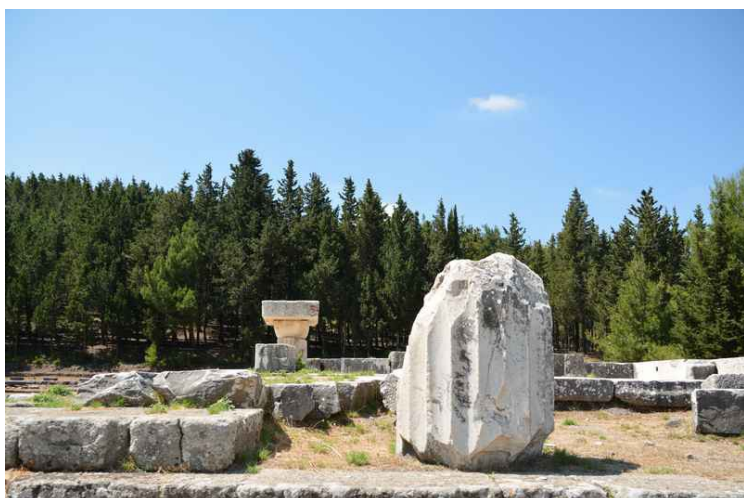
Her var det et dorisk tempel som var dedikert til Asklepien.