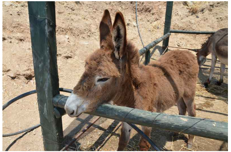
Det var et par esler til inne.