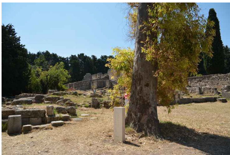
Dette er innenfor billettkontrollen.