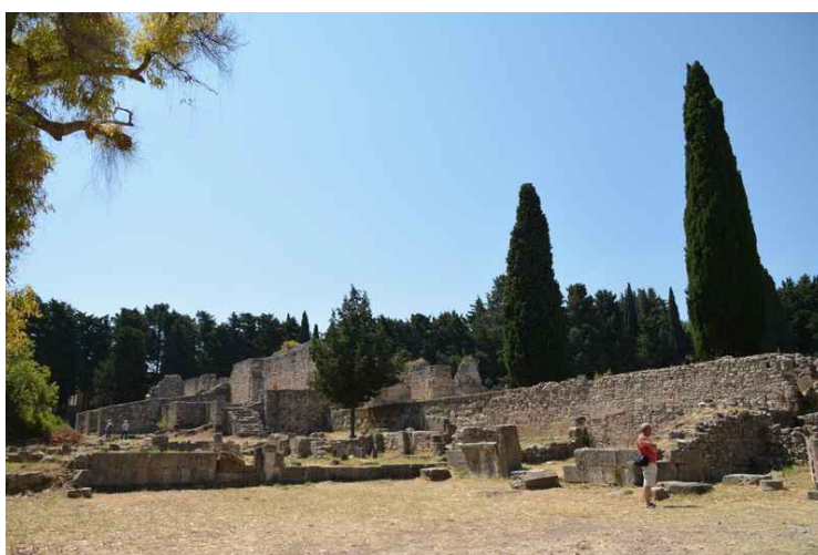
Forstøtningsmur for første platå.

Asklepieion er et gammelt medisinsk senter som ligger 4 km utenfor Kos. Det er fra første halvdel av det 3. århundre f.Kr. og det ble bygget etter dødsfallet til den berømte gamle greske legen Hippokrates for å hedre guden for helse og medisin, Asklepios . Det karakteristiske symbolet på denne institusjonen var en slange, som grekerne hedret på grunn av dens evne til å velge helbredende urter. Legene på dette sykehuset var også prester og det var også en helligdom som var tilgjengelig for alle som ønsket å be.