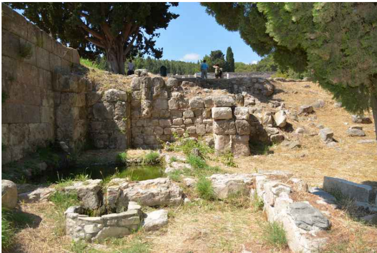
Her er en kilde.