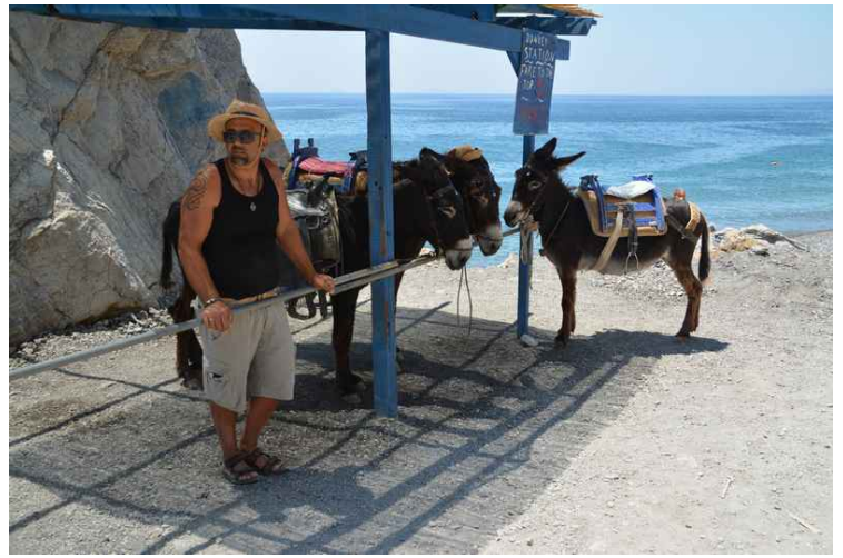
Her er vi kommet til den nederste stasjonen for eslene.