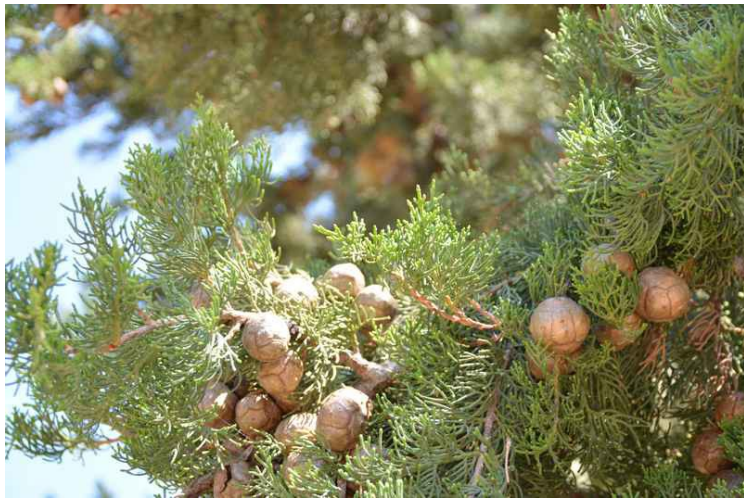
Kongler på et tujatre.