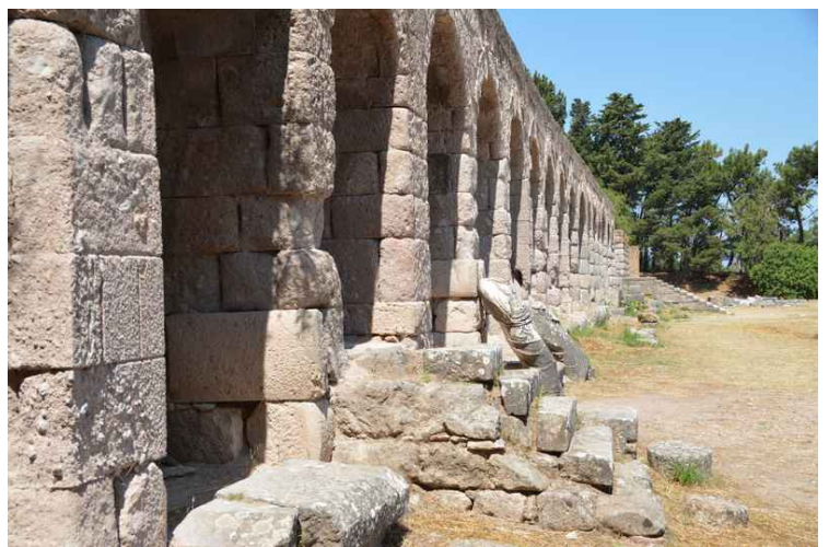
Her ser vi langsetter muren for 3. platå.