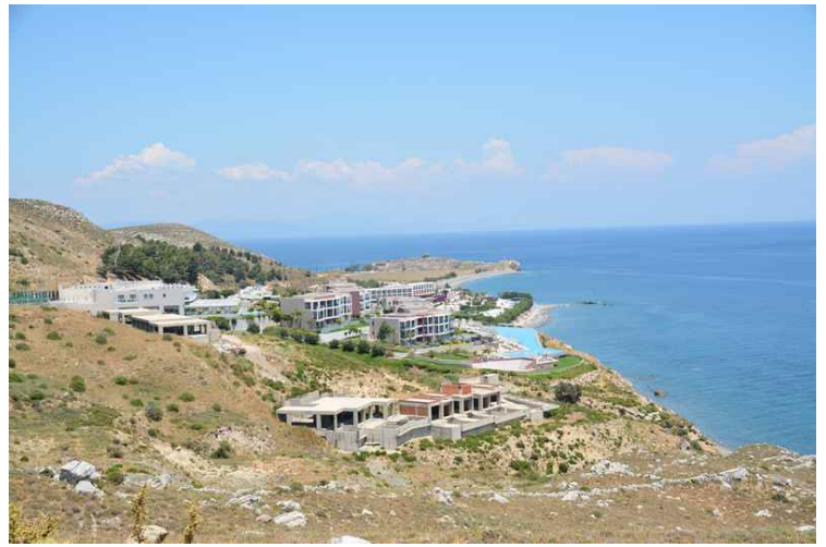
Hoteller i Aklafti/Agios Fokas.