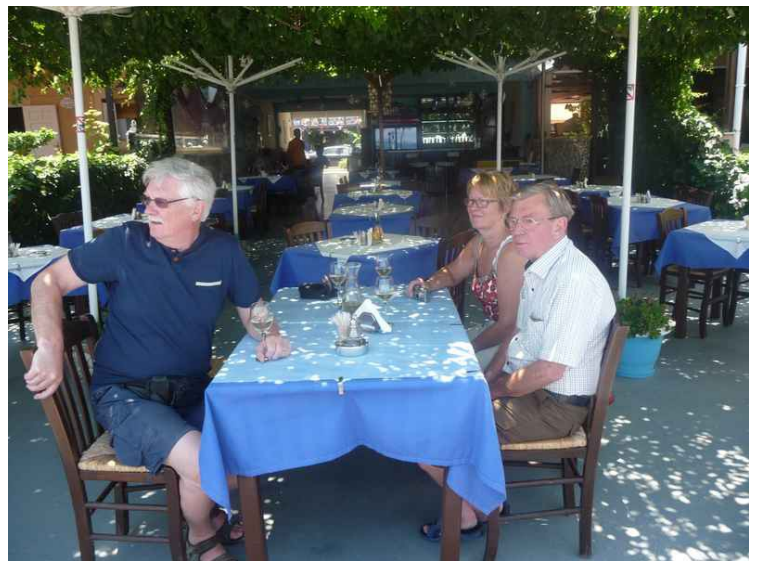
Vi hadde lunsj på en restaurant som ligger ved stranden. Den heter Agkyra.