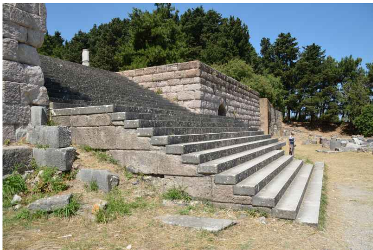
Trappen opp til 3. nivå.