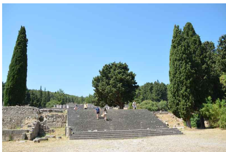
En brei trapp går opp til første platå.