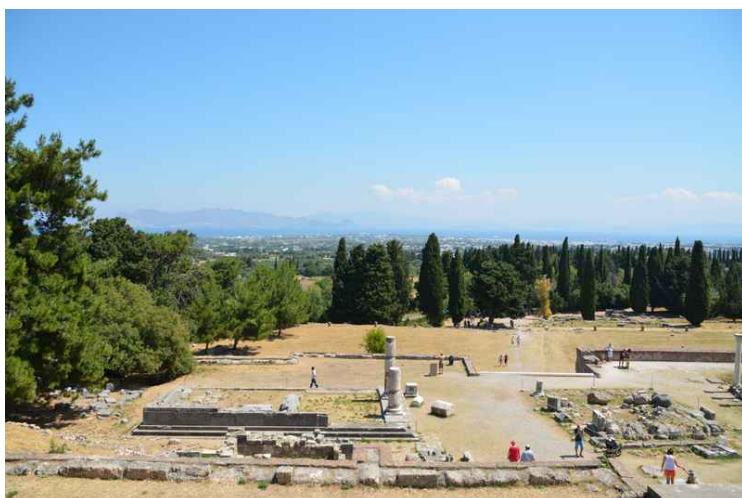
Utsikt over området fra toppen.