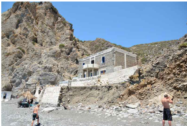
Et forlatt hus.