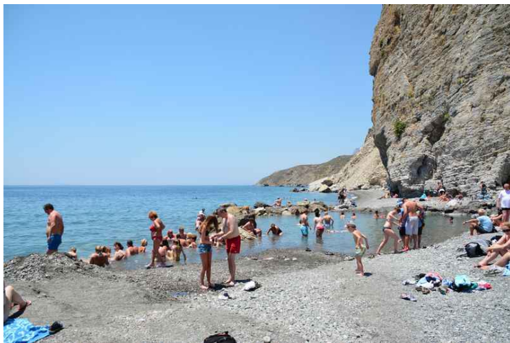
De varme kildene. Enda en link .