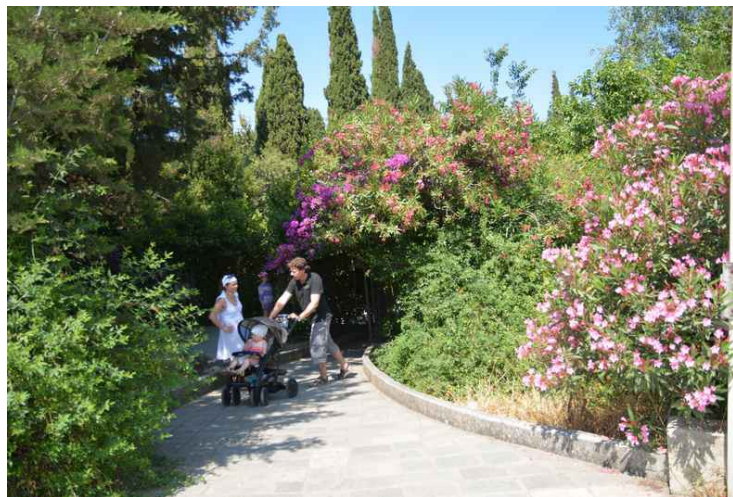
Den siste dagen, torsdag den 12. juni, kjørte vi bort til Asklepion . Her er vi ved inngangen.