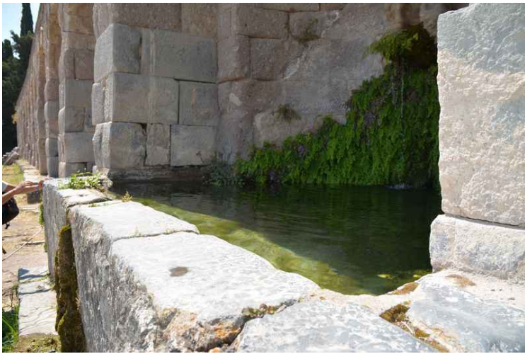
Det gror en del mose der hvor vannet renner.