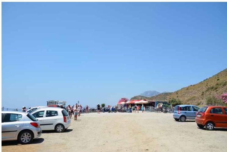
Her har vi kjørt videre til Therma. Dette er det den øverste parkeringsplassen.