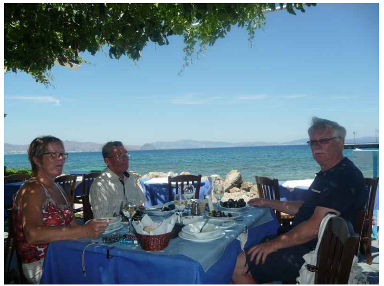
Utsikt mot Tyrkia.