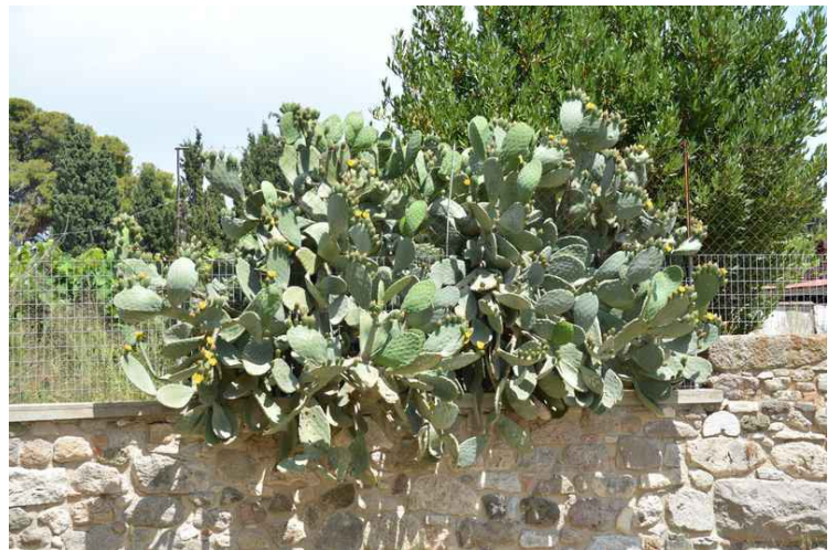
Så noen planter og blomster.