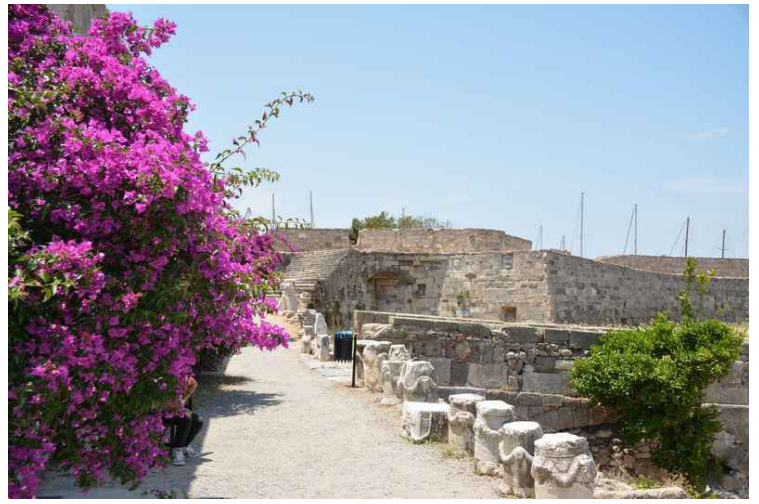
Festningen, Nerantzia Castle, ble bygget av Temperidderne i løpet av mange år, stort sett fra 1380 - 1514. Det ble bygget delvis av og på restene av en eldre bygningsmasse. Diverse bilder.