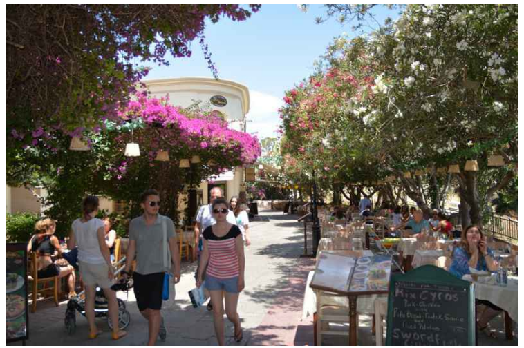
Ved utgangen fra restaurantgata.