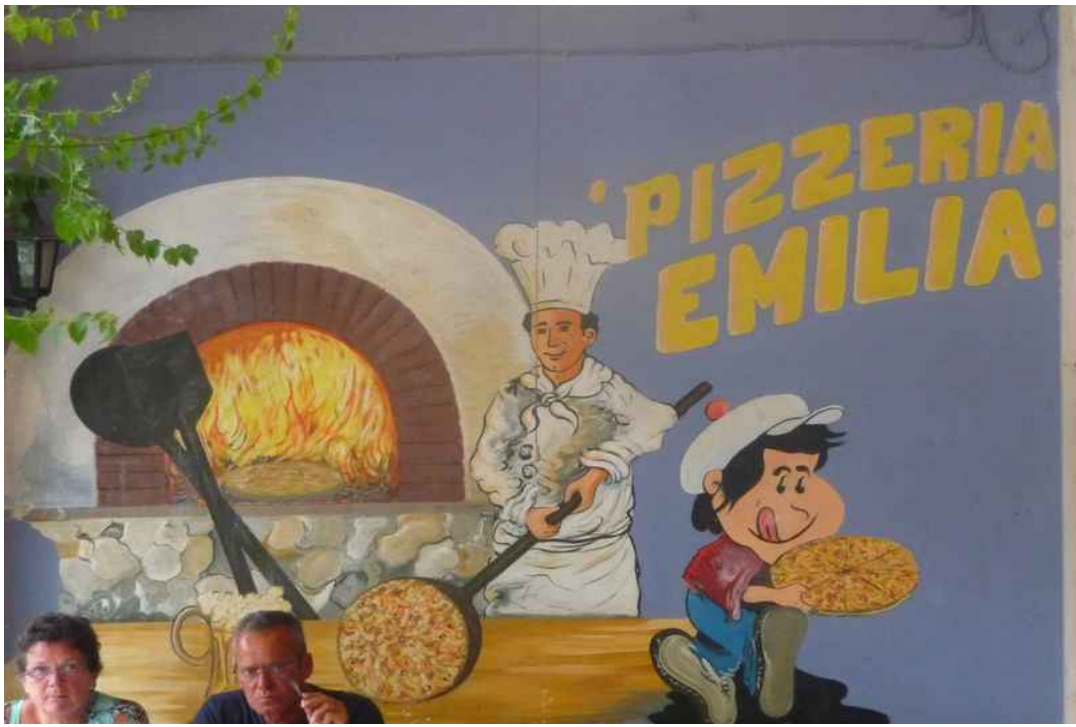
Om kvelden spiste vi på denne restauranten. God mat.