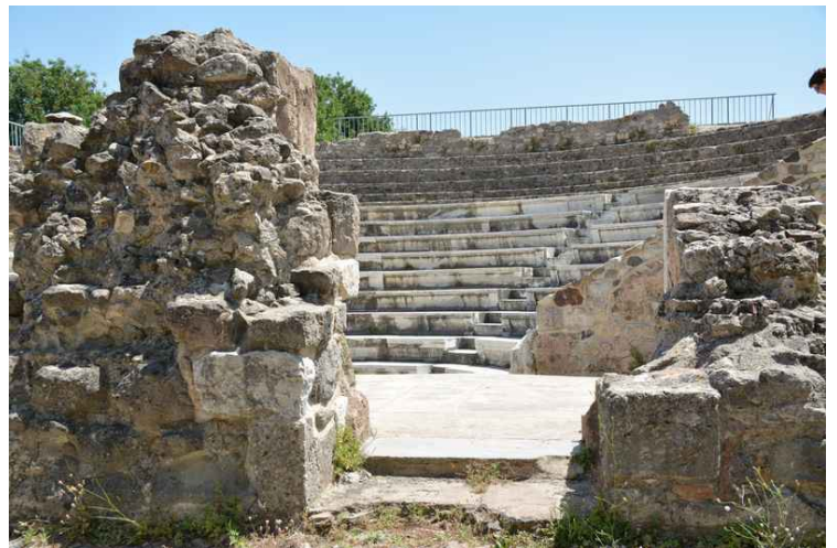
Det er ganske godt bevart.