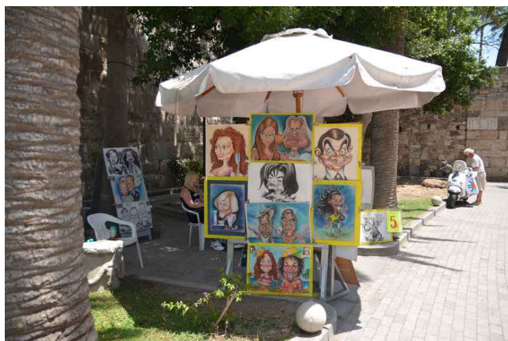
Her er resultatet fra en som lager karikaturtegninger.