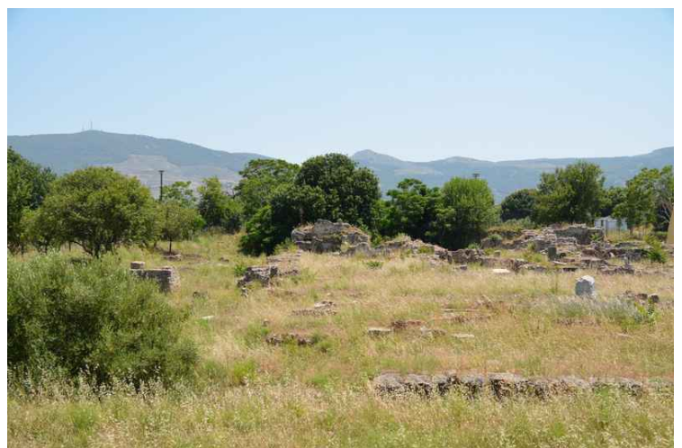
Her ser vi bort mot Casa Romana , Det Romerske Hus. Vi gikk ikke bort dit, men det skal være fint.