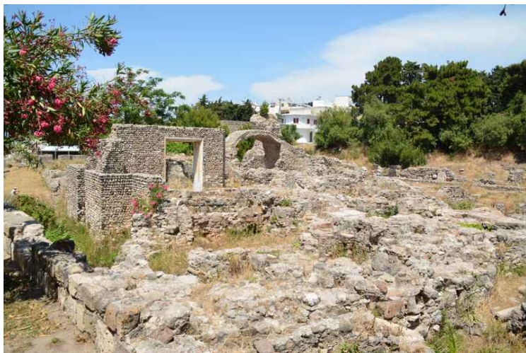
Mer arkeologiske utgravninger fra The Western Archelological Site .