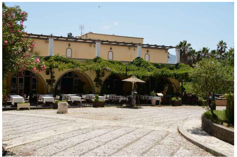
Vi hadde lunsj på denne restauranten på platanplassen.