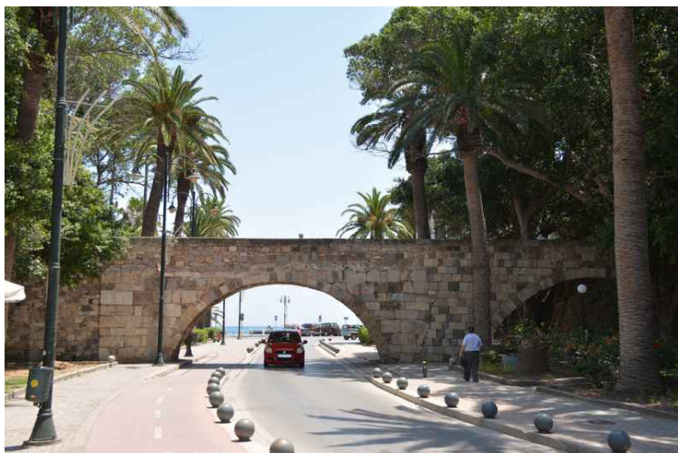
Dette er gangbroen som fører til inngangen til festningen. Vi var ikke klar over at innganger var der, så vi gikk først rundt hele festningen uten å finne inngangen.