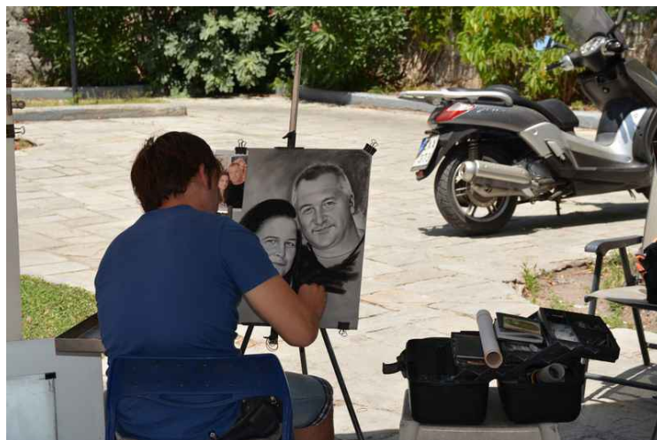
Ved broen var det flere kunstnere som satt og tilbød seg å tegne de som gikk forbi.