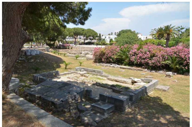
Dette er Dionysos' alter . Når vi ser på linken er jeg ikke sikker på om vi så dette.