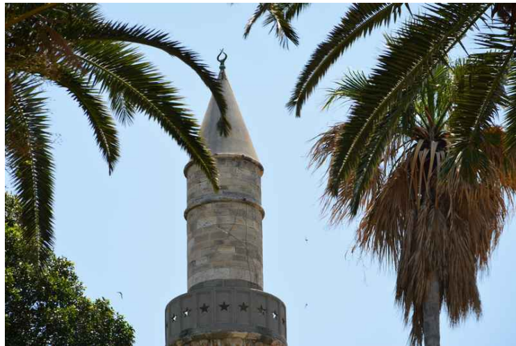
Dette er minareten på Pasha Gazi Hassan moskéen.