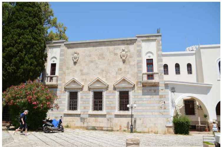
Tvers overfor moskeen ligger denne bygningen.