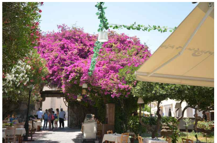
På nordsiden av agoraen er det rekke restauranter.