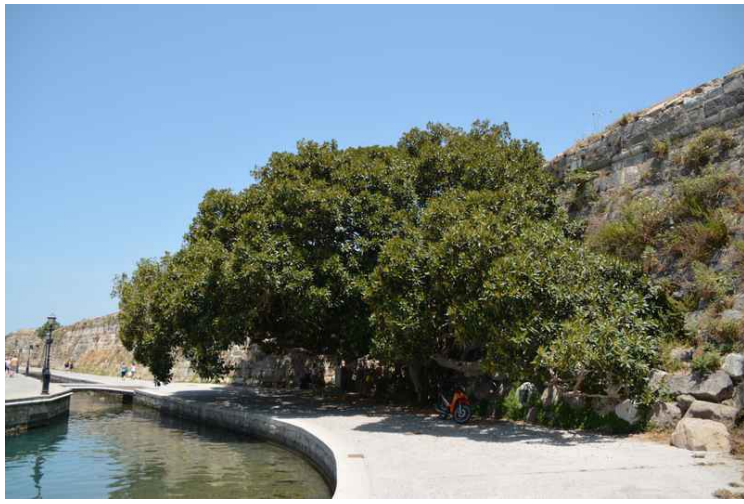
Her ser vi treet på litt avstand. Det sto mellom muren og havnen.