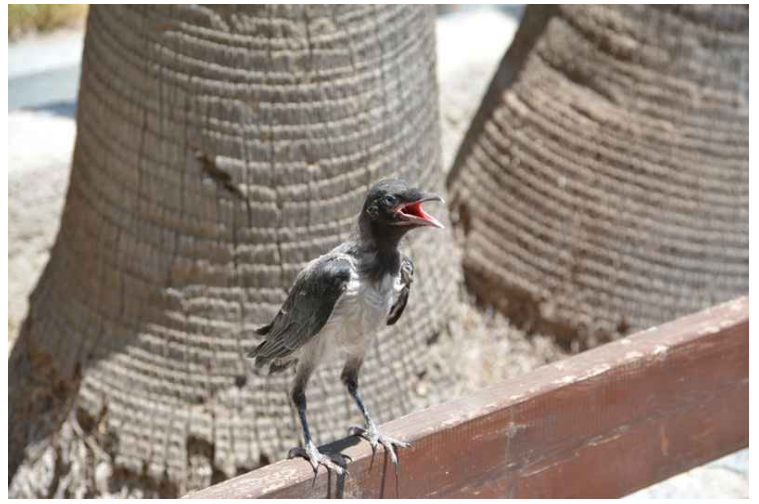
Denne skjære-ungen satt på krakken og hadde ikke vett til å være redd.