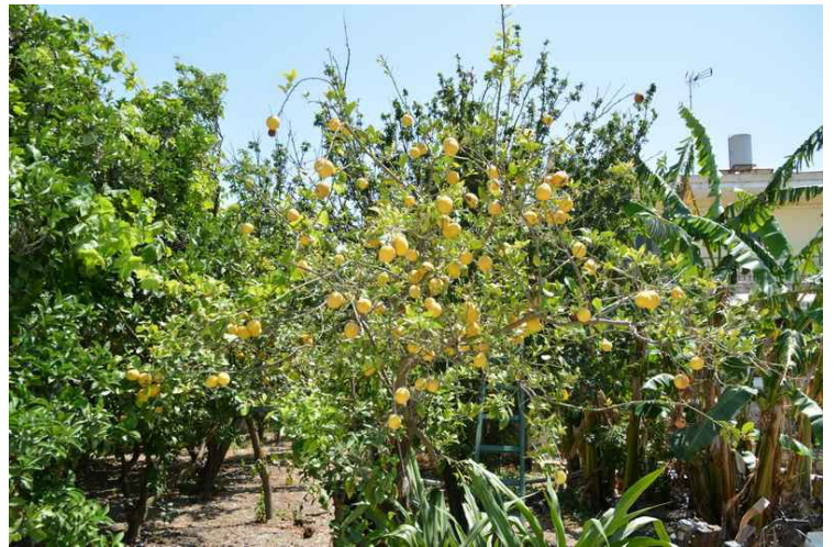
I hagen innenfor var det masse sitroner på dette treet.