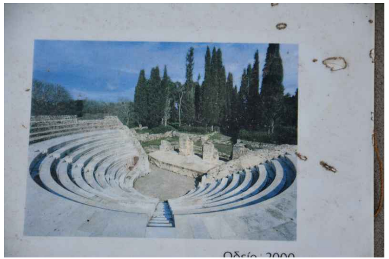
Et bilde av Odeon som sto på et opplysningsplansje.