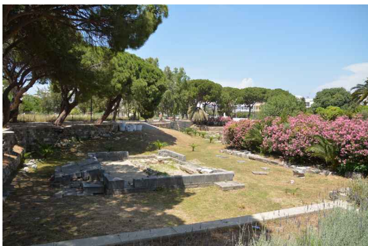
Et bilde til av Dionysos' alter.