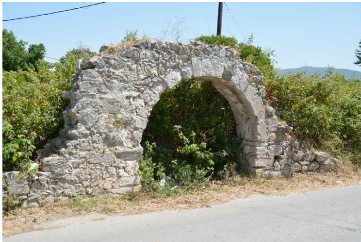
Vi så etter Odeon, men vi gikk feil og kom forbi denne buen i muren. Vi måtte bare ha bilde av den.