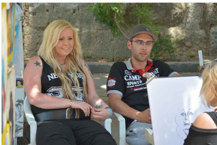
Her er det et par som blir tegnet.