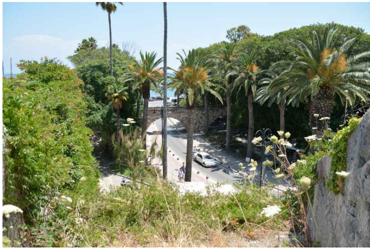
Utsikt fra murene ned på gata og broen som fører inn til festningen.