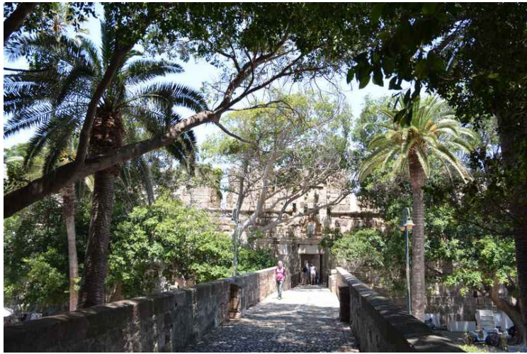
Rett ved siden av er inngangen til broen som fører inn til festningen .