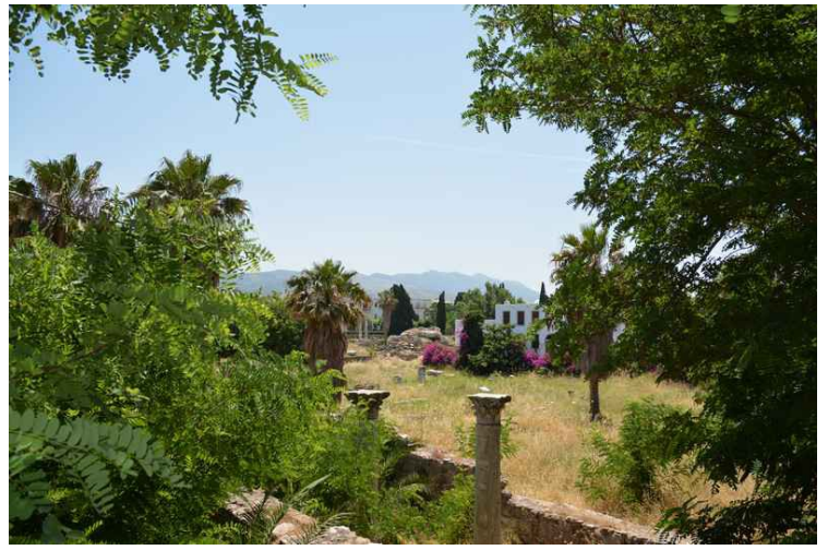
Fra platanplassen kan vi se rett bort på den gamle Agora , som var markeds plass og møtested for byens borgere.