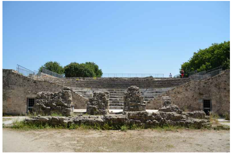
Dette er Odeon . Amfiteateret i Kos.