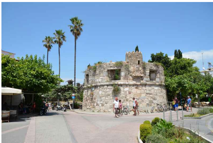
Her er vi på Elftherias plass, rett utenfor restaurantgata.