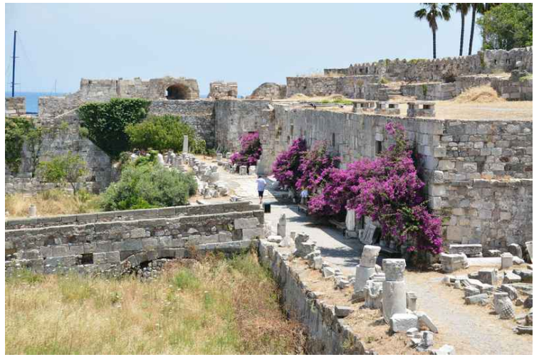
Restaureringsarbeid pågår ennå. Det som festningen ligger på var en øy helt til tidlig på 1900-tallet.