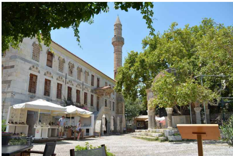
Der vi sitter på restauranten kan vi se bort på Hippokrates' platantré til høyre og moskeen til venstre. Platantréet som står der nå er ikke mer enn 500 år gammelt, men det kan være en avlegger av det gamle tréet.