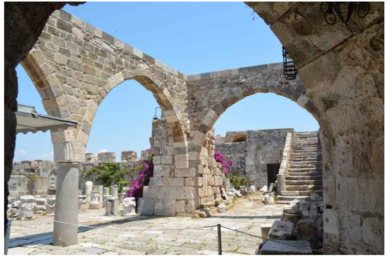
Her er vi inne.