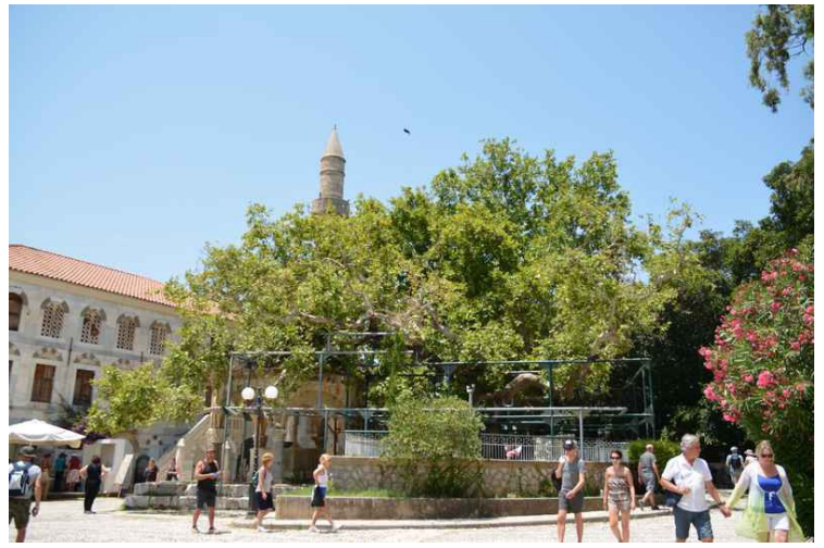
Dette er det treet som Hippokrates skal ha sittet under og undervist elevene sine i legekunstens mysterier.