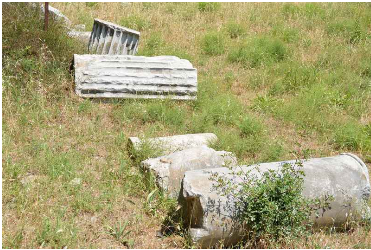
Her er rester av søyler.