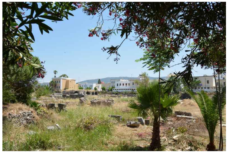
Bilder fra den gamle Agora.