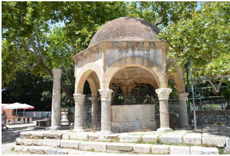
Hippokrates' brønn ved siden av platantreet.