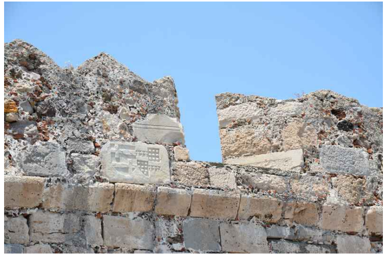
Dette er murene rundt festningen.