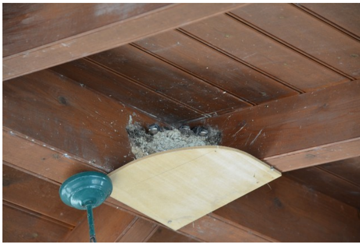
I baren var det et svalereir i taket.