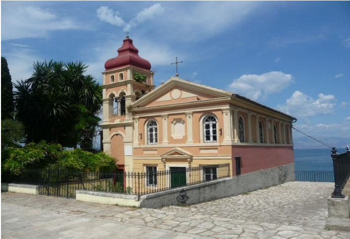
Ute av parken kommer vi forbi Mandrakinas Church som er viet til Jomfru Maria og Sant Panteleimonas. Den ble svært ødelagt i løpet av den siste krigen, men er nå fullstendig restaurert.