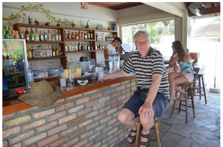
Her har vi fått en velkomstdrink i baren der vi bodde.