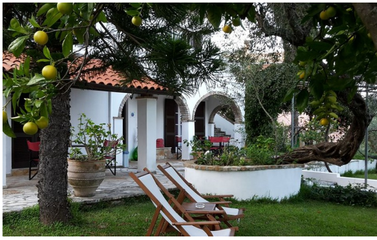
Vi hadde bestilt leilighet på Gina Studios i Benitses.