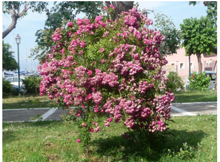
På denne tiden er det mange av buskene som blomstrer .