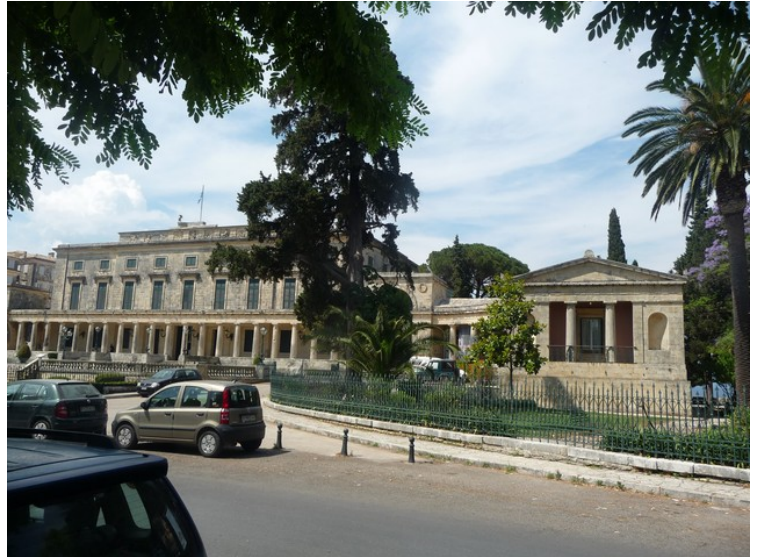
Museum for japansk kunst.