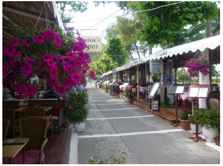
Fra restaurantgata i gamlebyen.