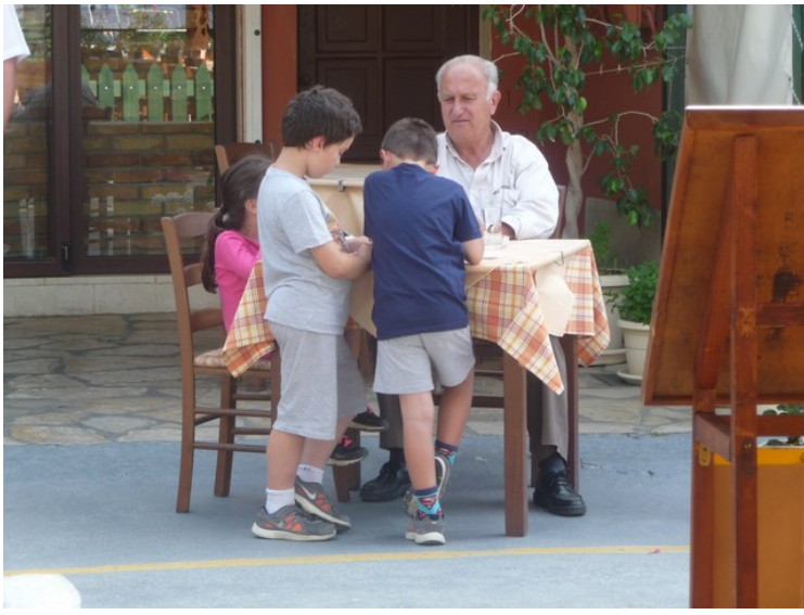
Her ser vi dem bedre. Vi la merke til at det var veldig mange unger av alle aldre i denne byen.