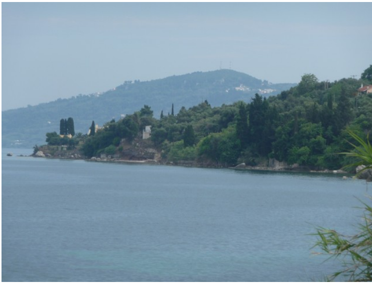
Her ser vi videre syddover.