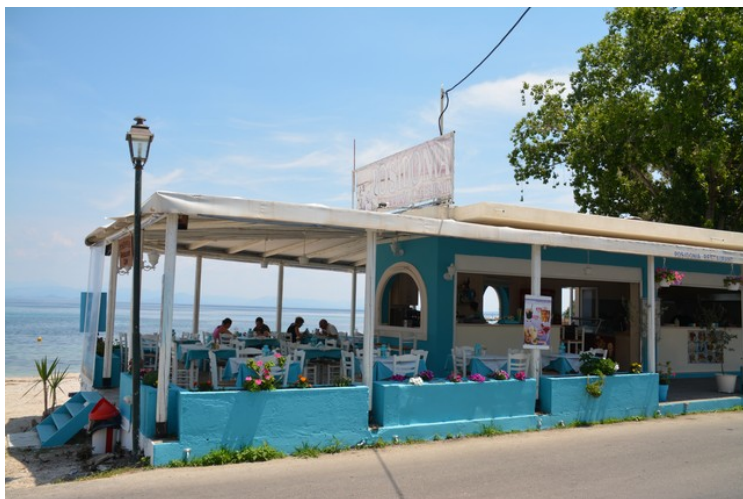
En strandrestaurant rett nedenfor der vi bodde.