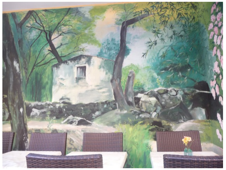
Her er det malt et landskap på veggen.