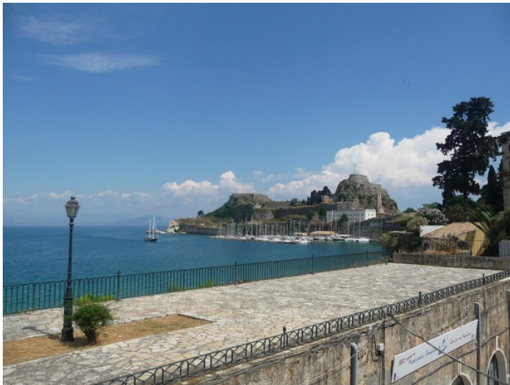
Utsikt tilbake mot den gamle festningen.