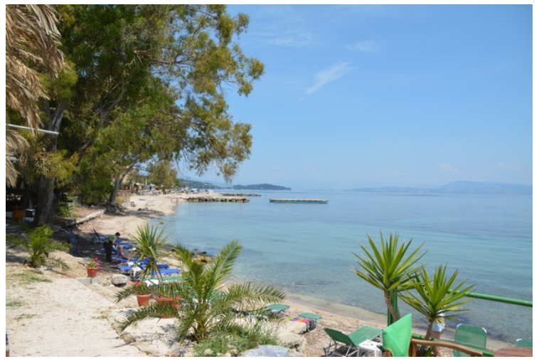
Den første dagen gikk vi en kort tur på strandpromenaden.