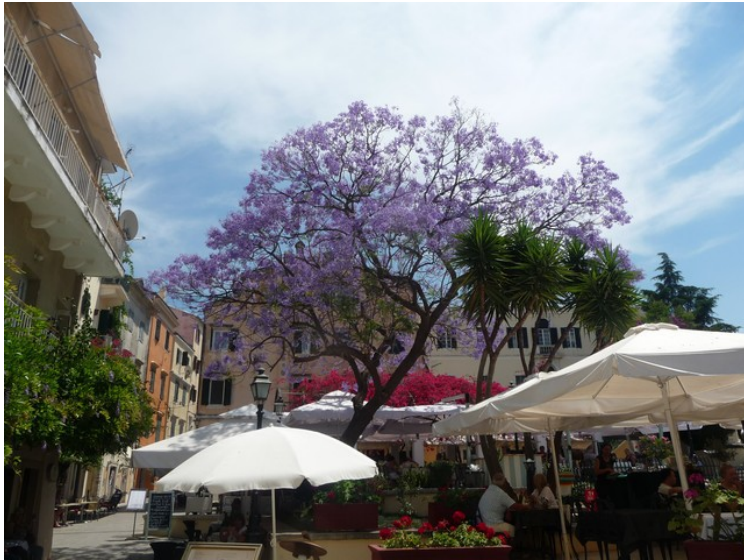
På plassen står dette treet med masse blå blomster. Vi hadde en øl på denne restauranten.

Annunziata-tårnet. Dette er det som er igjen av en av de viktigste katolske kirkene i Korfu by. Den ble bombet i 1943.