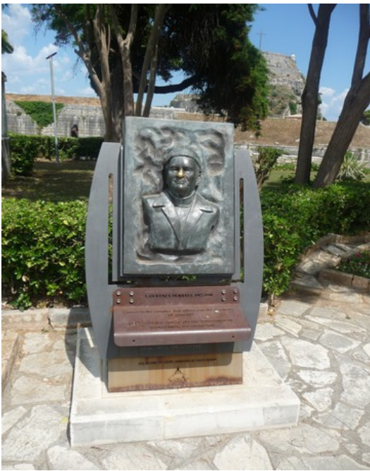
I parken står det en statue av forfatteren Lawrence Durrell som bodde noen år i Korfu.