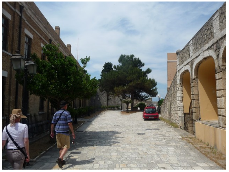
Her vi på vei inn i festningen.