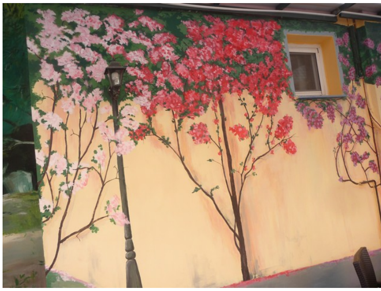
Malte blomster på veggen.