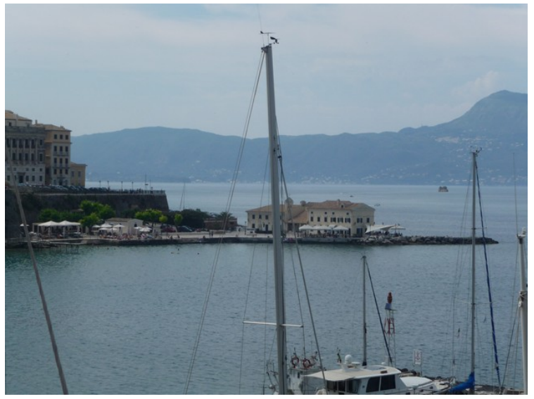
Her ser vi over til bygningene på Faliraki . Her er restauranter og en liten badestrand.