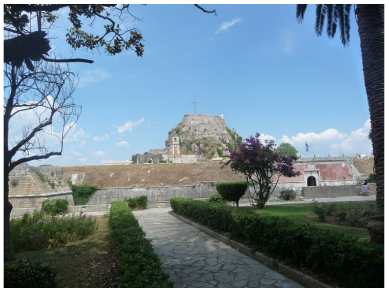
Her er vi inne i parken og ser tilbake mot festningshøyden.