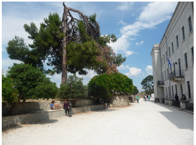
Her er vi inne.