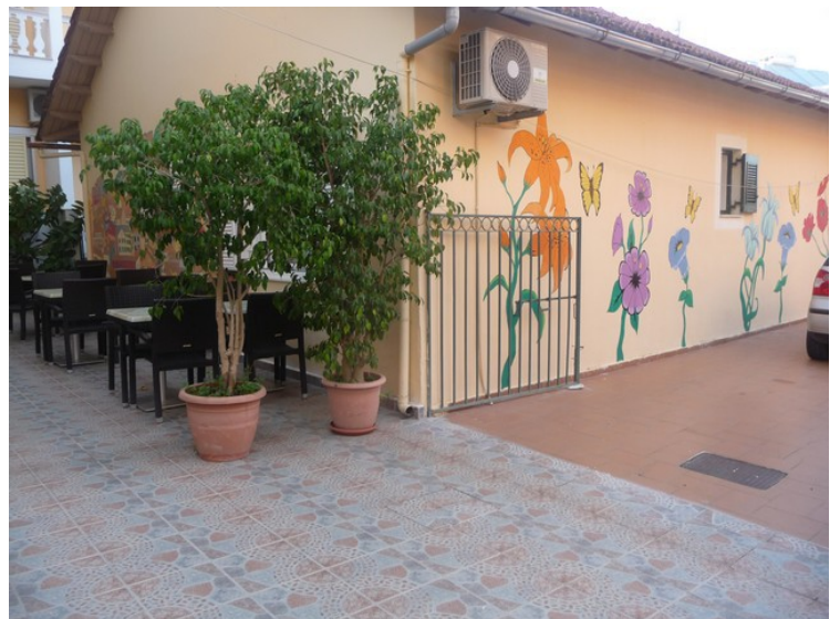
Veggene på et hotell ved veien opp mot der vi bodde, var dekorert med malte blomster og trær.