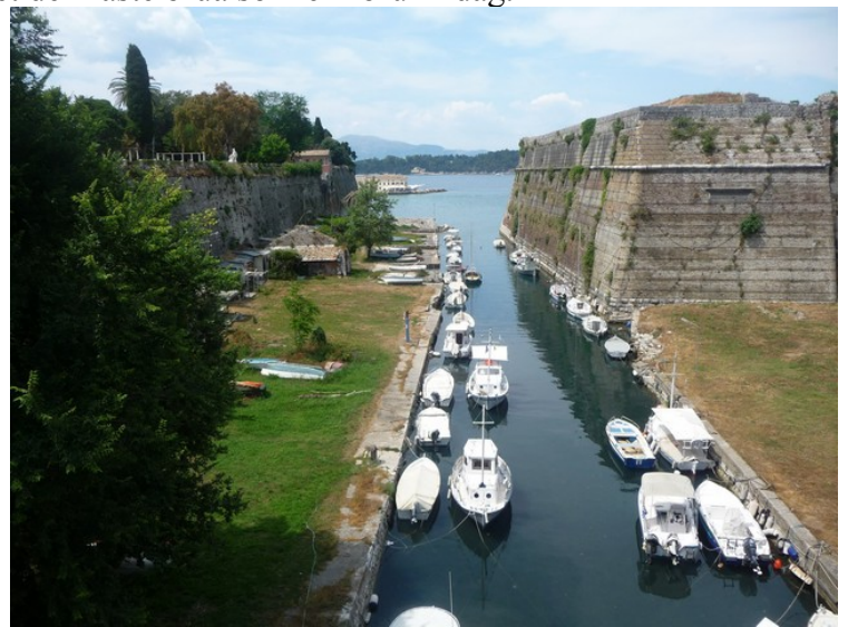
Her ser vi nordover.