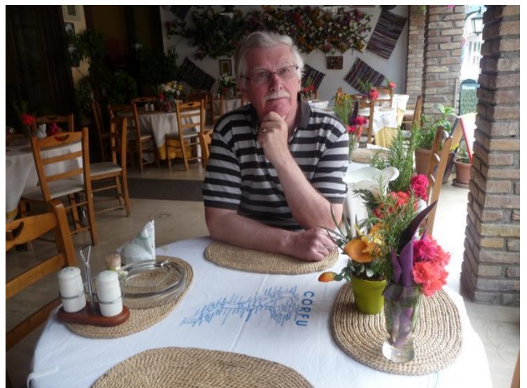
Her skal vi bestille mat på en restaurant i hovedgata.