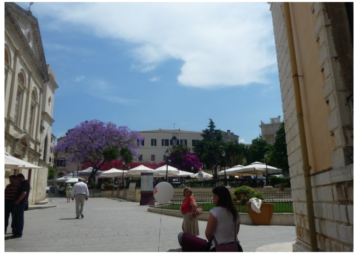
Her ser vi opp mot Platia Dimarchiou.

Annunziata-tårnet. Dette er det som er igjen av en av de viktigste katolske kirkene i Korfu by. Den ble bombet i 1943.