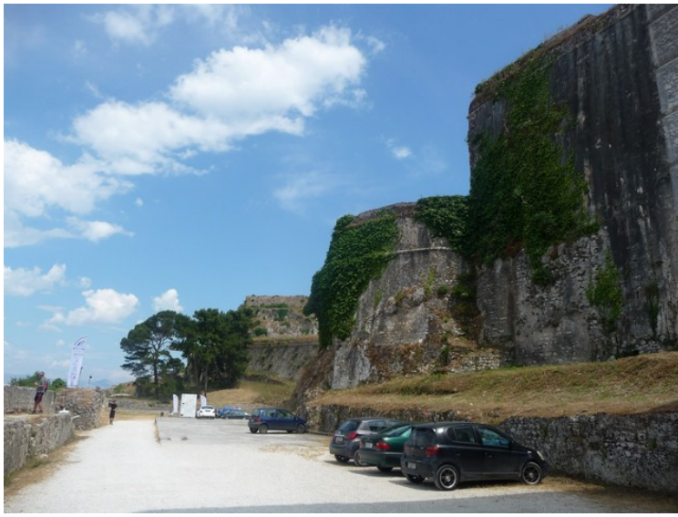
Murer på nordsiden.