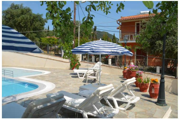
Basseng og bar nedenfor leiligheten.