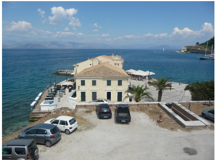
Her ser vi ned mot bygningene ved Faliraki.