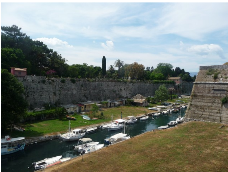
Her har vi gått ut av festningsområdet og ser tilbake over kanalen.