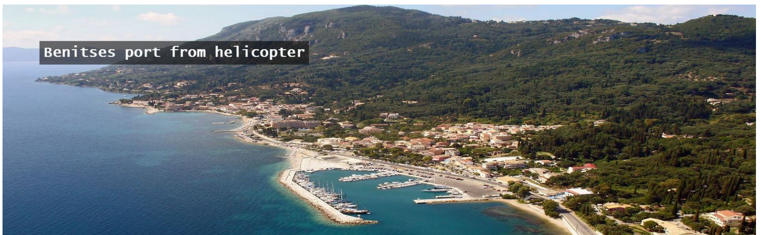
Oversiktsbilde fra Benitses .

Benitses ble befolket ganske tidlig på grunn av god vanntilførsel. Det renner to elver gjennom stedet. Det er anslått at 80% av vannet på øya kommer fra fjellene overfor byen. Romerne bygget badeanlegg her, og rester av dem finnes fremdeles. Romerne bygget akvedukter som ledet vannet inn til Korfu by. Under britisk styre ble det også bygget vannledninger herfra mot Korfu by.