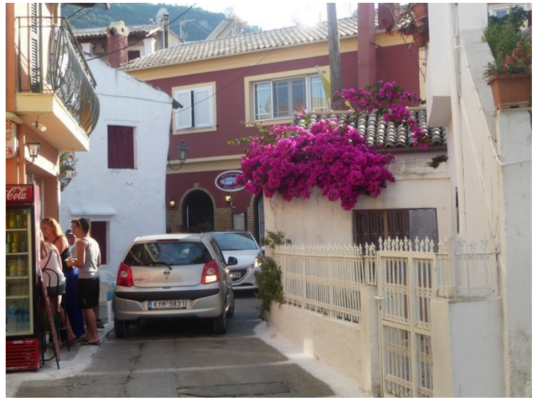
Trange gater i gamlebyen.