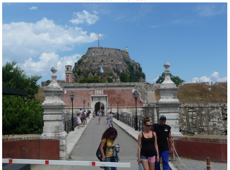
Her er vi kommet til inngangen til den gamle festningen .