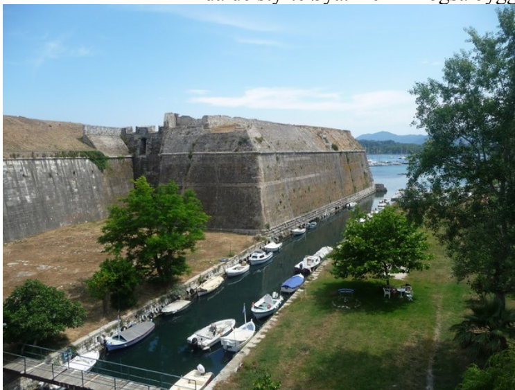
Her står vi på brua og ser sydover kanalen.

Det var bysantinerne som først befestet den nærmeste høyden på bildet, men det var venetianerne som sto for det meste av byggingen. De gravde også en kanal som skilte neset fra resten av øya. Det ble brukt en trebrua for å komme seg over kanalen. Trebrua kunne dras inn på festningssiden når den ikke var i bruk. Venetianerne satte også opp en rekke bygninger på området, men det er ingen igjen av disse. De bygningene som vi ser i dag, er satt opp av britene da de styrte øya. De fikk også bygget den faste brua som er i bruk i dag.