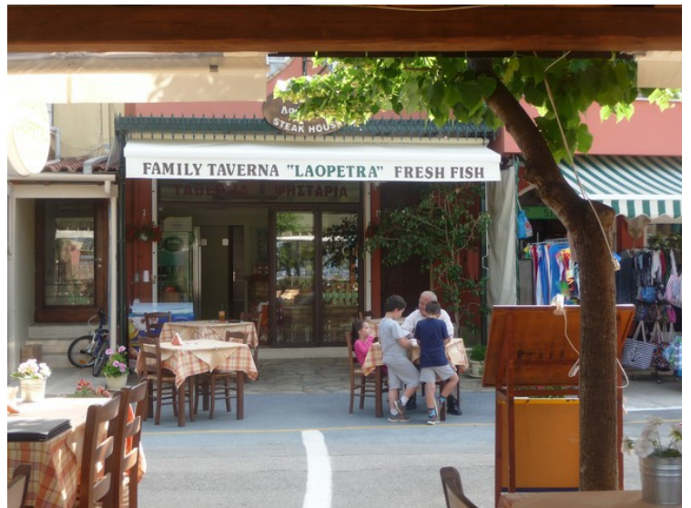
Vi spiste noen ganger på denne restauranten. Den heter Laopetra .