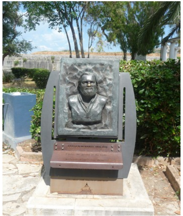
Ikke langt fra står det en statue av broren Gerald Durrell .