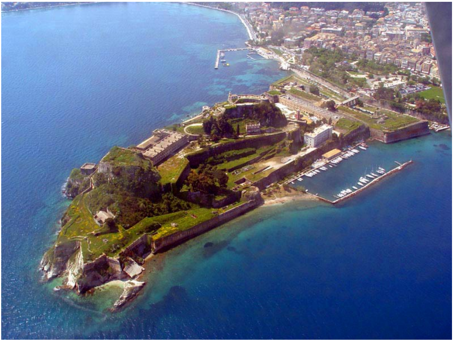
Bilde av den gamle festningen.

Det var bysantinerne som først befestet den nærmeste høyden på bildet, men det var venetianerne som sto for det meste av byggingen. De gravde også en kanal som skilte neset fra resten av øya. Det ble brukt en trebrua for å komme seg over kanalen. Trebrua kunne dras inn på festningssiden når den ikke var i bruk. Venetianerne satte også opp en rekke bygninger på området, men det er ingen igjen av disse. De bygningene som vi ser i dag, er satt opp av britene da de styrte øya. De fikk også bygget den faste brua som er i bruk i dag.