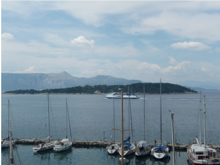
En marina rett nord for den gamle festningen.