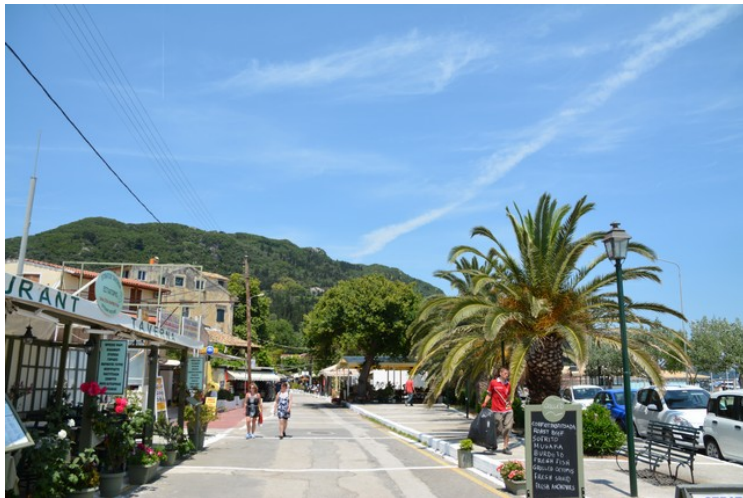
Her er vi på strandpromenaden nedenfor gamlebyen.