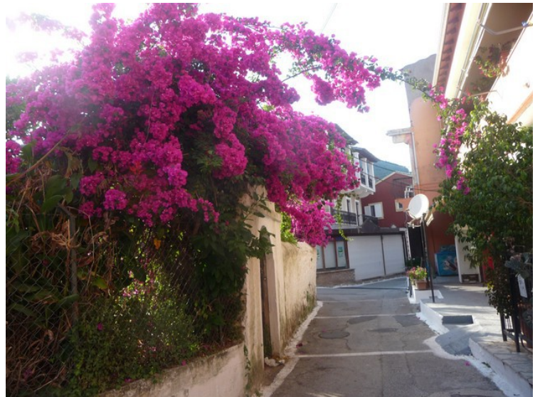
Flere bilder fra gamlebyen.