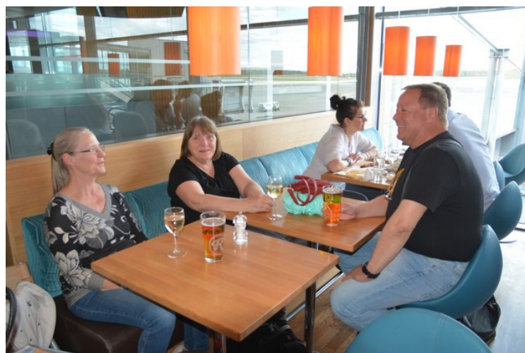
Vi fikk tid til øl og vin før flyene våre gikk.