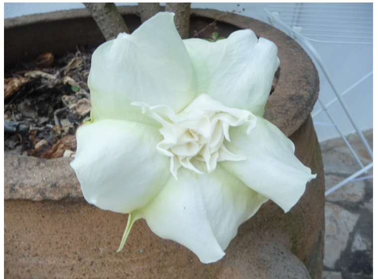
Blomster i hagen «vår».