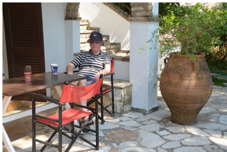
Her er jeg på plass i leiligheten.