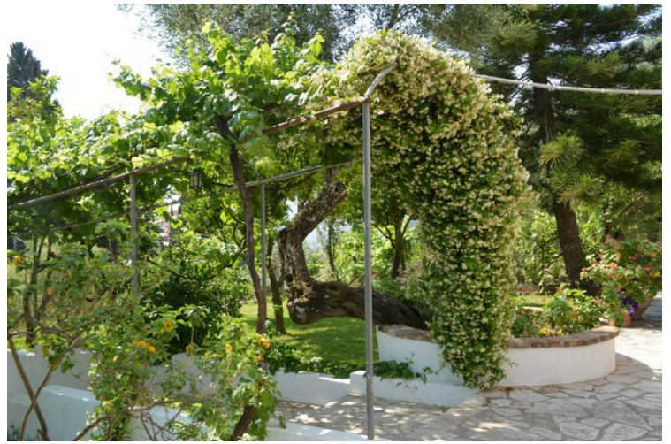
Noen bilder fra hagen nedenfor leiligheten.