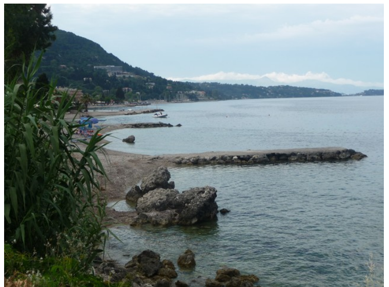
Her har vi gått et stykke syd for byen og ser nordover.