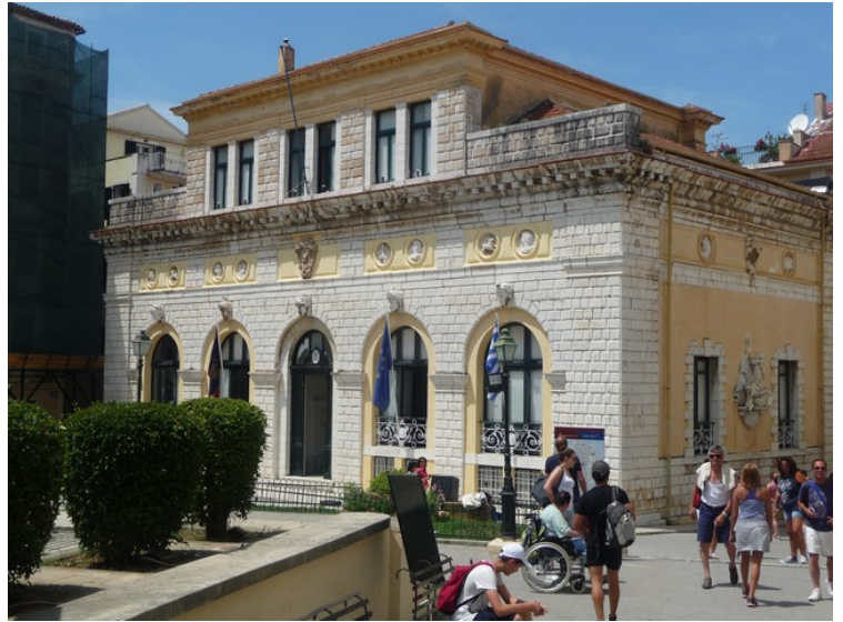
Ved plassen ligger rådhuset . Dette var en gang det første teateret i Hellas.