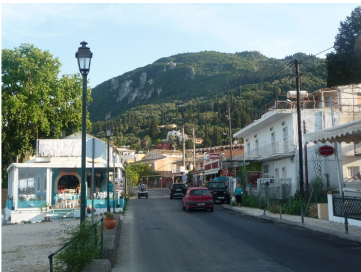
Hovedgata og gjennomfartsveien rett nedenfor der vi bodde.