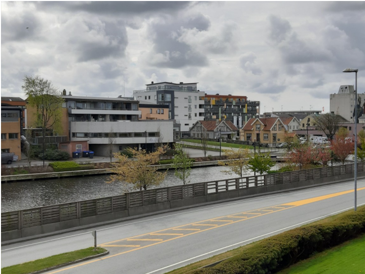
Utsikt fra hotellet.