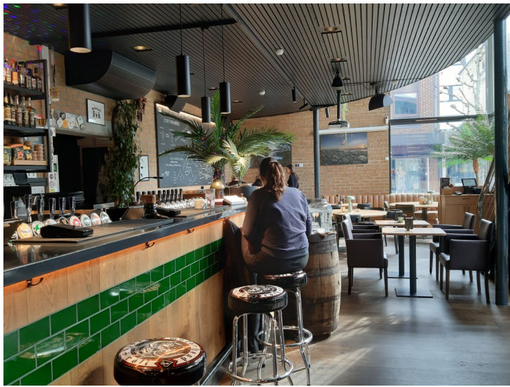
Vi var så tidlig ute at det var nesten ingen der da vi kom.