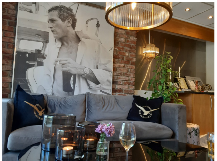
Etter at vi hadde sjekket inn hadde vi en øl og vin i resepsjonen. Her var det et stort bilde av skuespilleren Paul Newman.