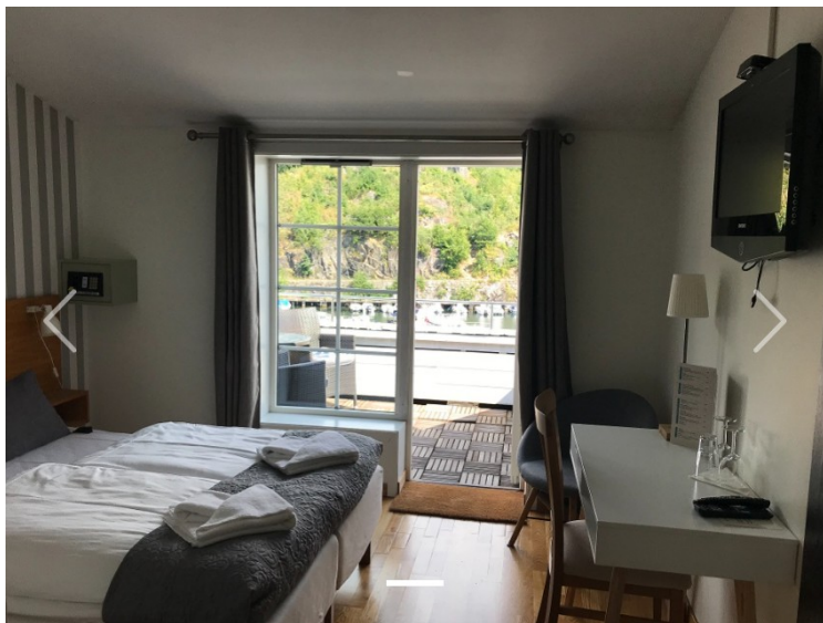
Vi hadde booket et rom med sjøutsikt.