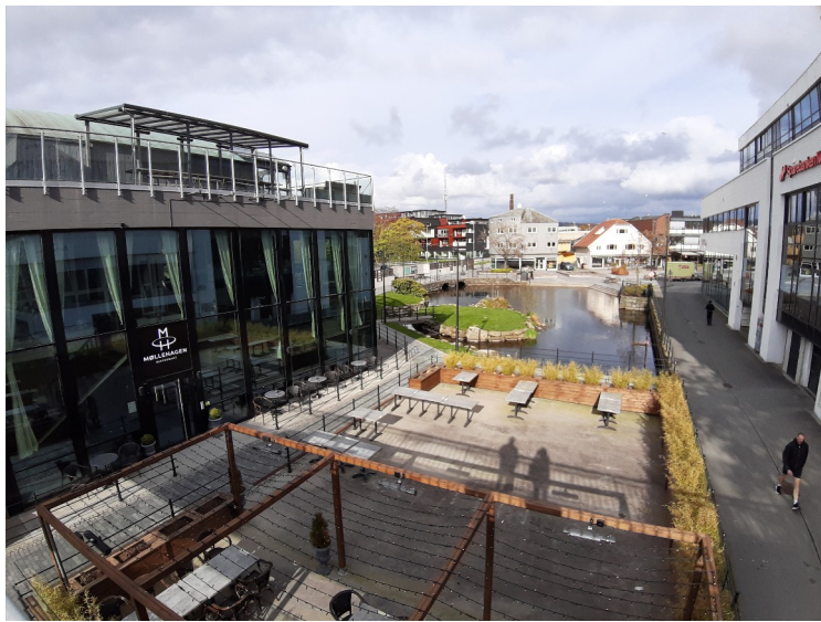
Utsikten fra gangbrua som går over Bryneåna og Arne Garborgs veg.