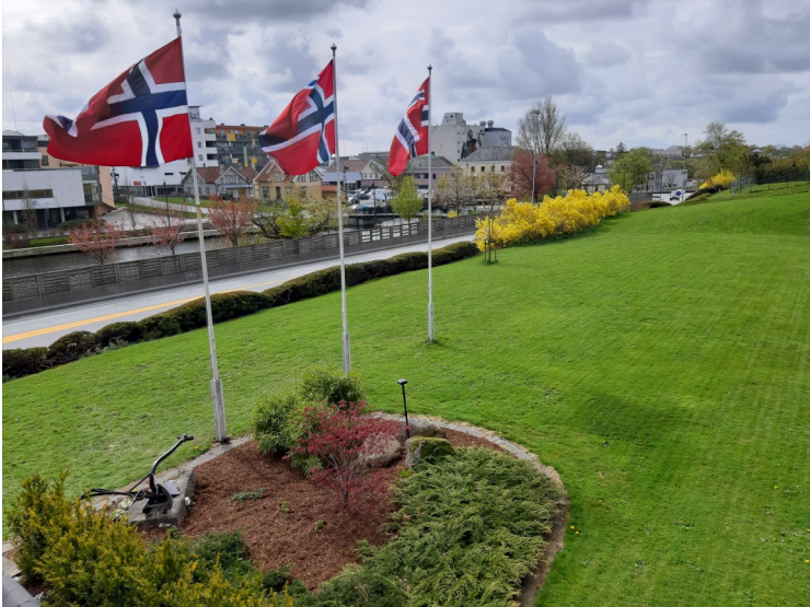
Det var konfirmasjon denne dagen også og flaggene var heist.