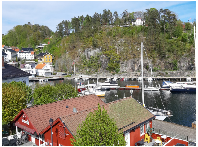
Noen bilder fra omgivelsene før vi reiste hjem.