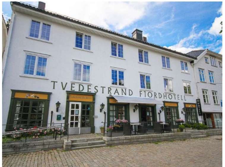
Dagen etterpå reist hjemover. Underveis overnattet vi på Tvedestrand Fjordhotell.