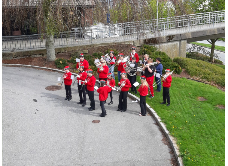
Et korps spilte utenfor hotellet.