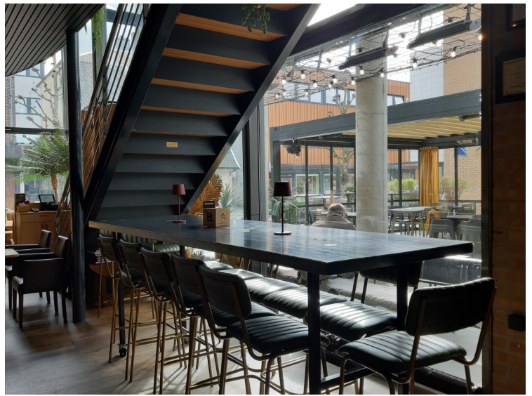
En gjest har satt seg ute. Vi spiste fish and chips