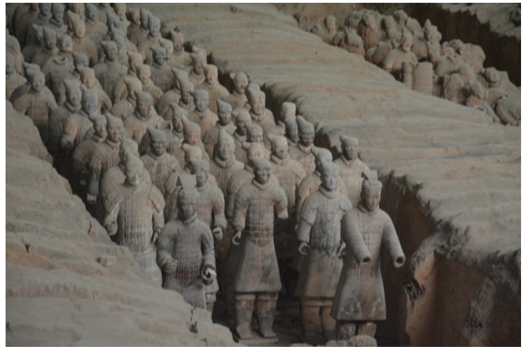
Så følger bilder av noen av figurene som er gravd ut.