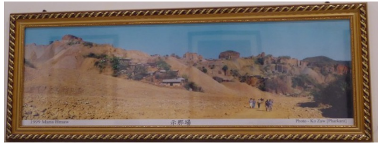
Bilde av et sted hvor jade hentes ut av fjellet.

Den 7. dagen skulle vi først besøke en jade-fabrikk . Jade er en bergart som hovedsakelig finnes i Kina, Burma og Mellom-Amerika. Vanligst er grønn og oransje jade, men det finnes også hvite, gule, røde og blå varianter.