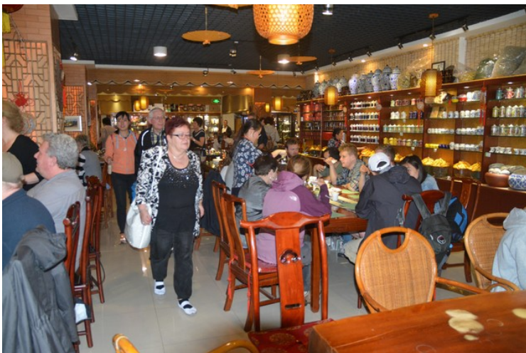
Etter lunsj skulle vi på tesmaking.