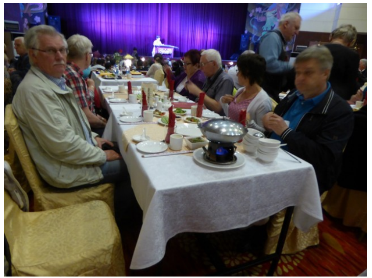
Her sitter vi ved bordene.