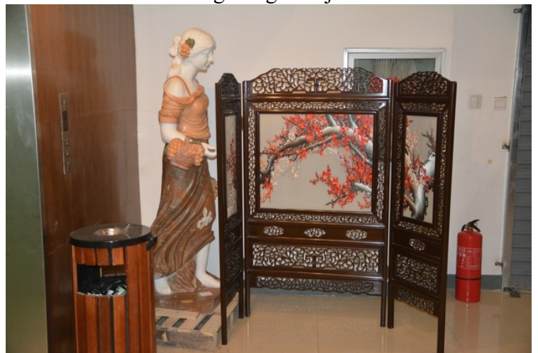
Nedenfor følger et lite utvalg av figurer som var utstilt.