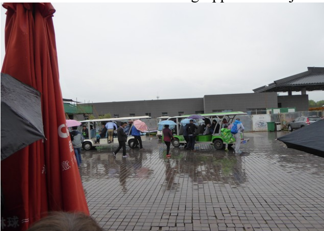
Vi ble kjørt med elektriske biler fra bussen til hallene som var bygget over terrakottahæren. Det regnet denne dagen.