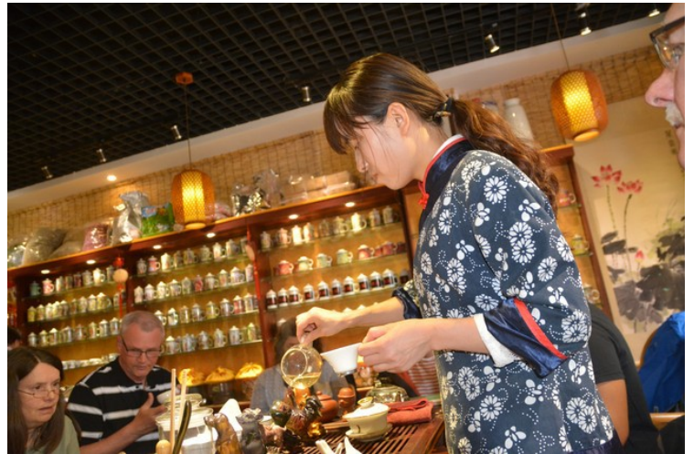
Her er vi i gang med teseremonien .