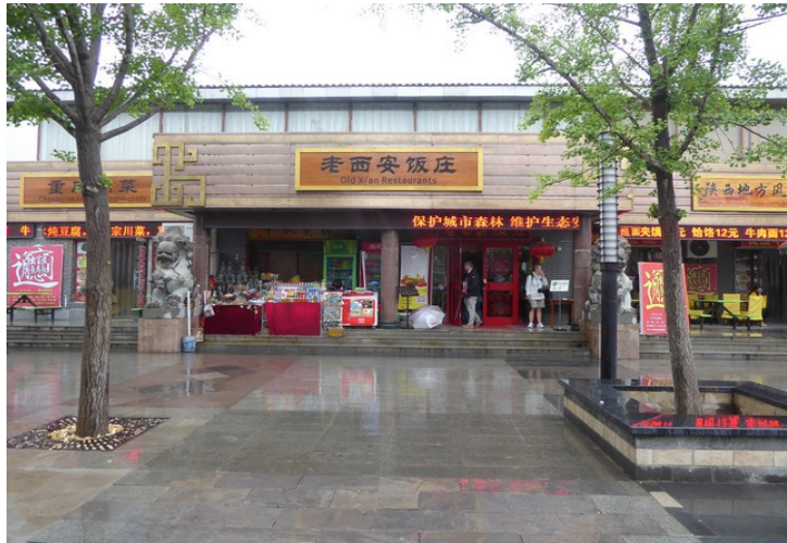
Så var det tid for lunsj. Vi skulle spise her.