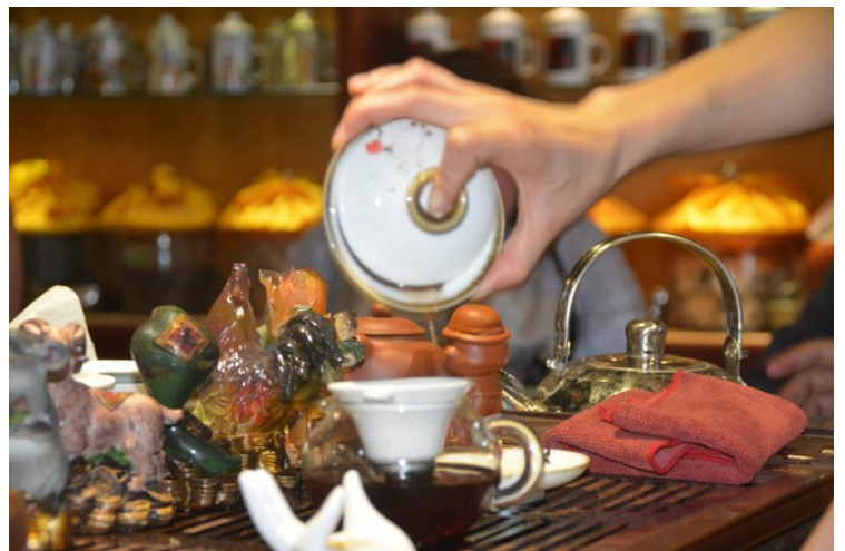
Jeg lukter på tebladene.