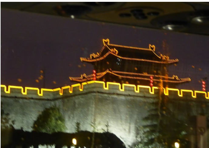
På vei tilbake til hotellet ser vi at muren er opplyst.