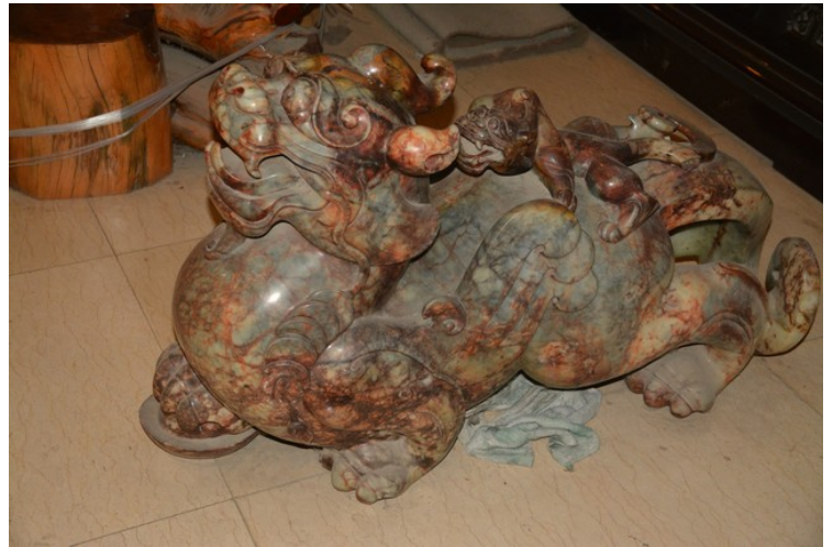
En figur laget av jade.