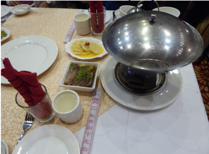
Før showet skal vi spise dumplings .