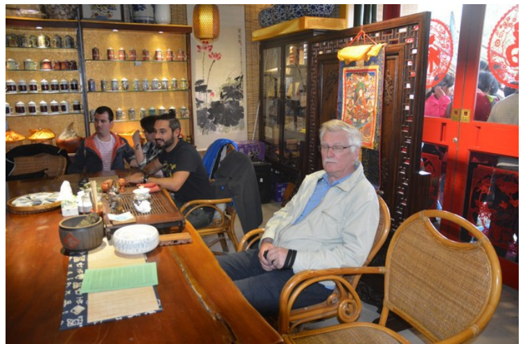
Det var på samme restauranten hvor vi hadde spist lunsj.