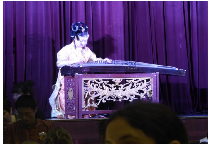
Så starter showet. Nedenfor følger bilder fra de forskjellige scenene.