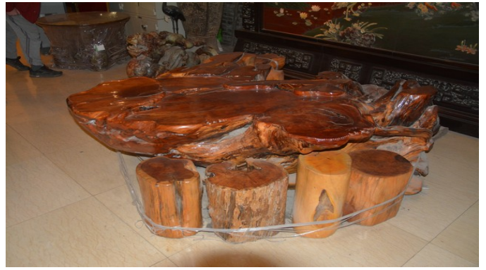
Pyntegjenstand laget av jade .

Den 7. dagen skulle vi først besøke en jade-fabrikk . Jade er en bergart som hovedsakelig finnes i Kina, Burma og Mellom-Amerika. Vanligst er grønn og oransje jade, men det finnes også hvite, gule, røde og blå varianter.