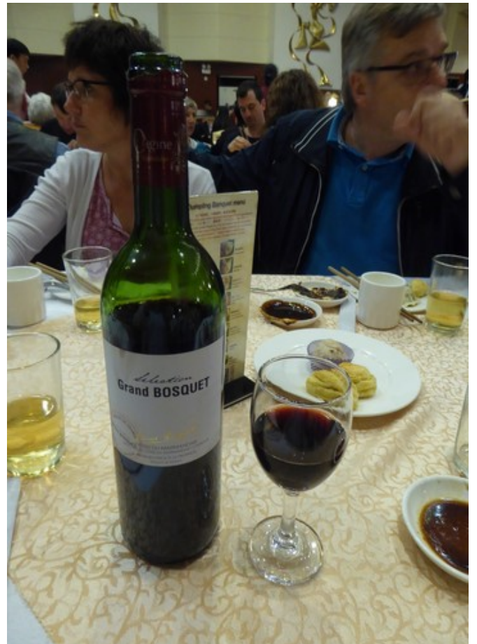
Vi hadde denne vinen til.