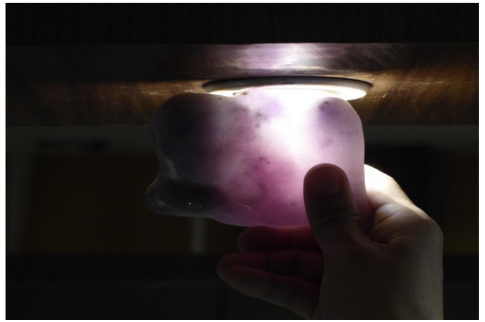
Gjennomlysning for å sjekke kvaliteten.