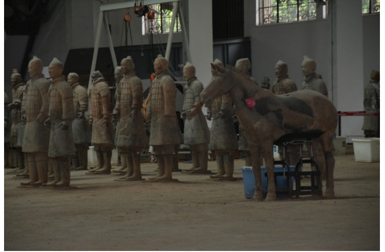
Her jobber de med å reparere figurer som er ødelagt.