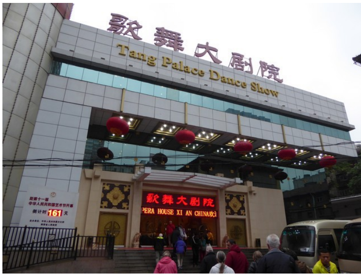
Om kvelden skulle vi se på tangdans .