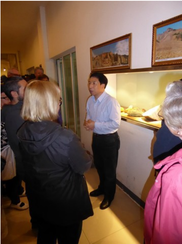
Her blir vi ønsket velkommen.