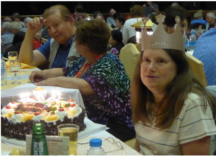
Bursdagsbarnet fikk kake.