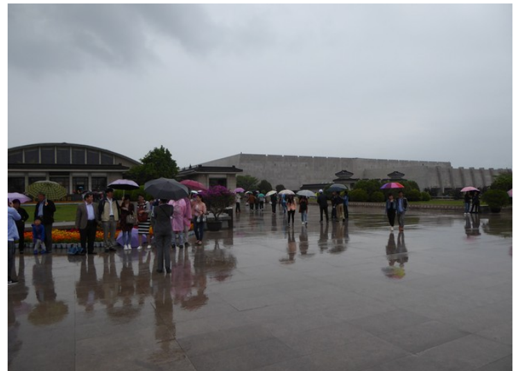
Her kommer vi til hallene.