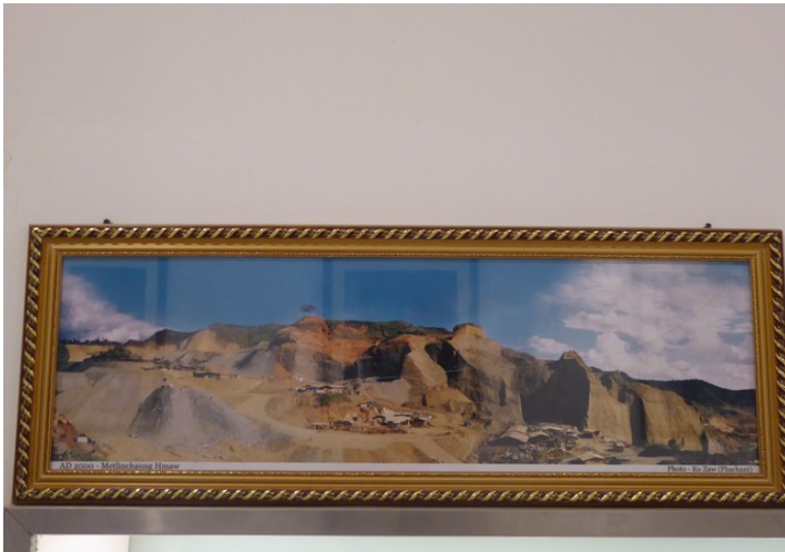
Et annet sted hvor jade hentes ut.