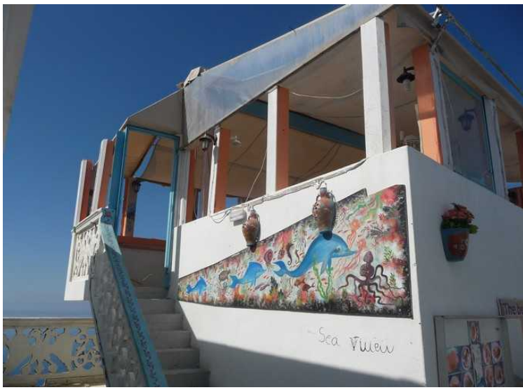
Da vi kom opp her, så viste det seg at restauranten var stengt for vinteren, og de hadde startet oppussing.