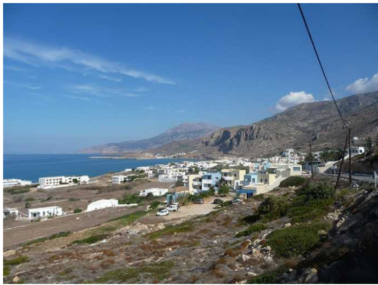
Når vi følger veien videre kommer vi til Arkasa . Arkasa er en fin liten by.