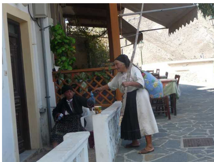
Alle jobbet med et eller annet.