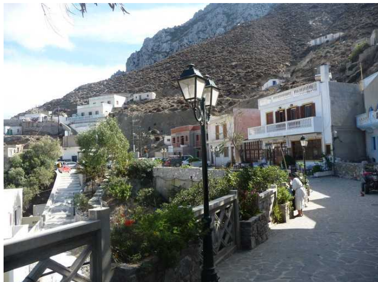
Vi så ikke mange karer i byen, mest eldre kvinner.