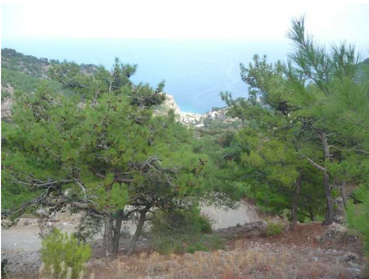
Her skimter vi noen hus nede ved sjøen.