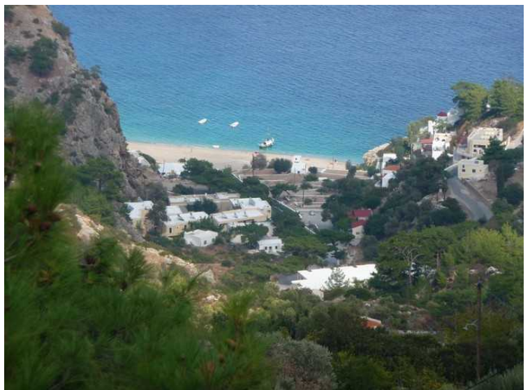
Kyra Panagia ser ut til å være et idyllisk lite sted. Video fra Kyra Panagia .