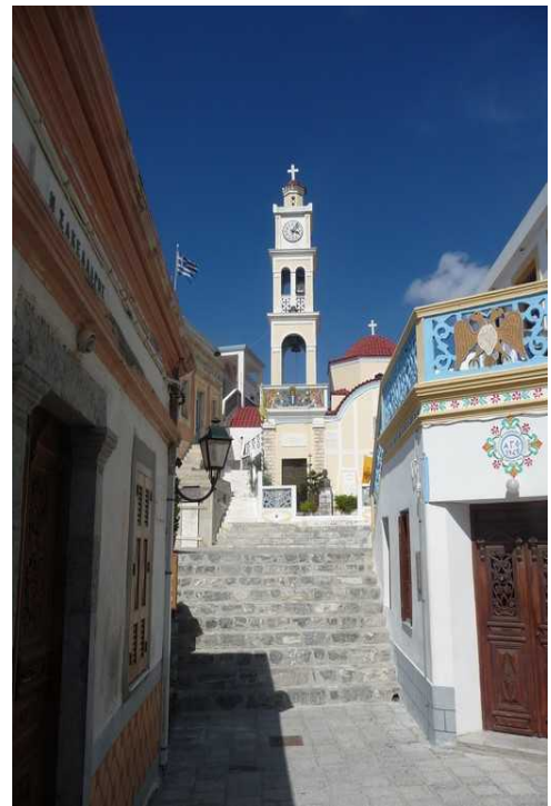
Den største kirken i byen, Jomfru Maria-kirken.