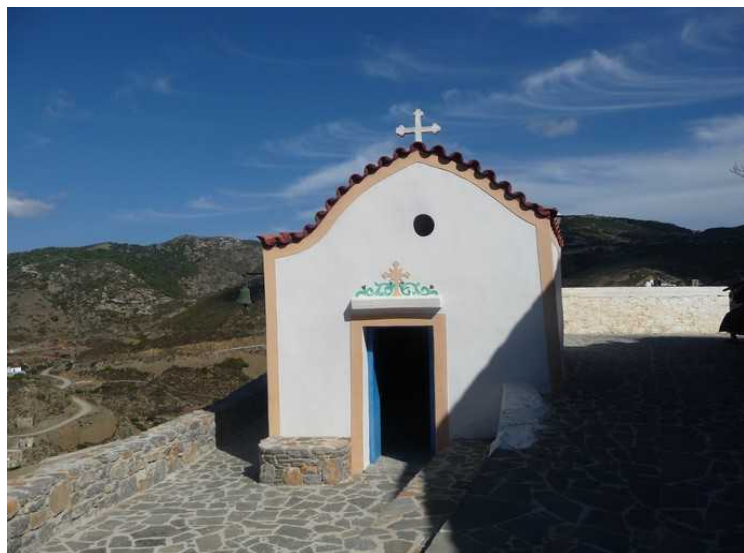
Her går vi forbi et lite kapell.