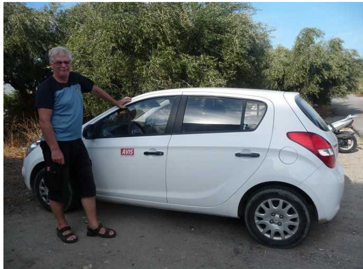
Her er bilen vi leide, en Hyundai i30. Den hadde god plass og var grei å kjøre.