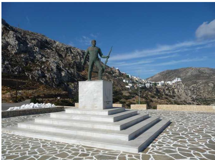
Dette er et krigsminnesmerke i utkanten av byen.