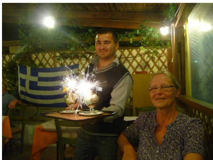
Om kvelden gikk vi for å spise på Nisiotiki. Som dessert hadde vi is. Her kommer isen.