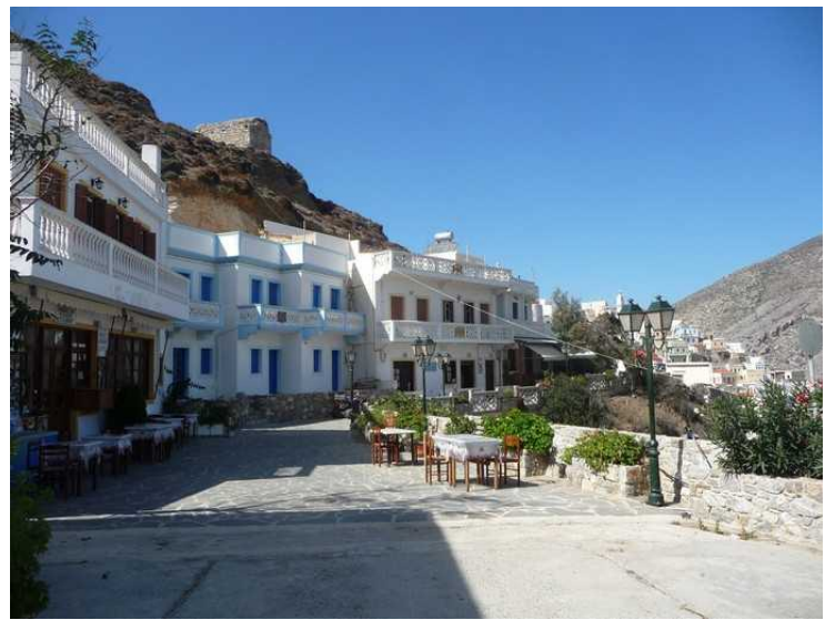
Her er vi tilbake i Olympos . Vi har parkert i utkanten av byen, for det er ikke bilveier i byen.