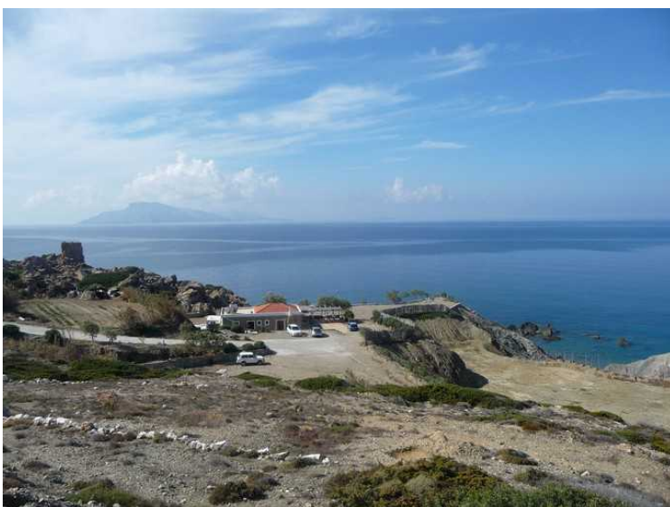
Her kjører vi forbi den restauranten vi var på under øy-rundturen med buss.