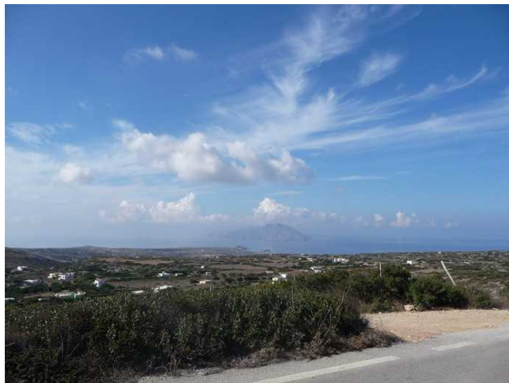
Her er vi kommet over på vestsiden av Karpathos. Vi ser over til en øy som heter Kassos .