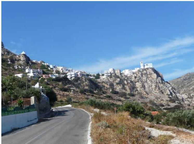
Den siste dagen leide vi en bil for å kjøre en lengre tur på øya. Her kommer vi til Menetes.