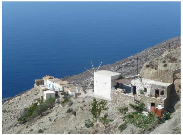
Fra restauranten så vi ned på denne gamle vindmøllen.