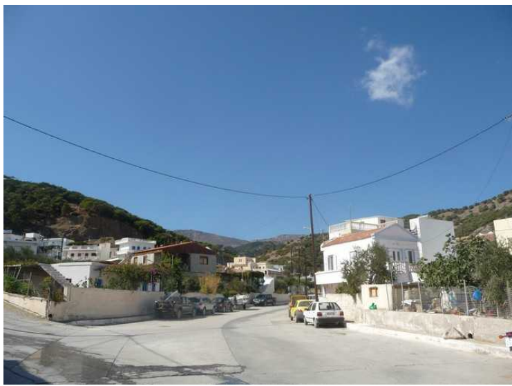
Dette er veien tilbake. Veien opp til venstre går mot Olympos.