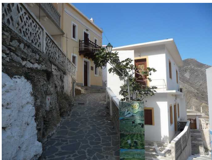
Vi går rett fram her.