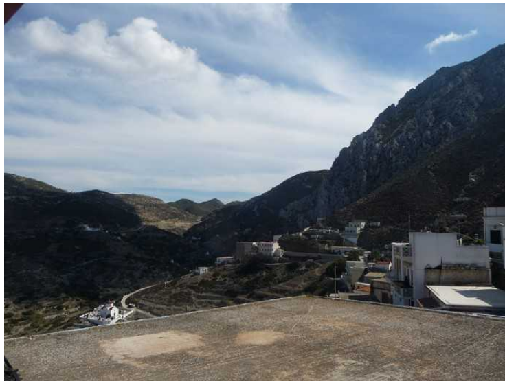
Her ser vi sydoover.