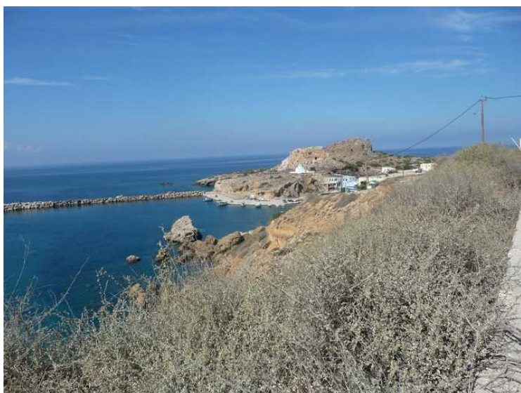
Fra Arkasa kjører vi nordover langs kysten. Her kommer vi til Finiki .