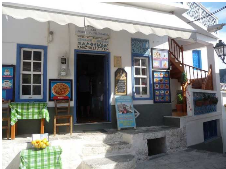
Denne restauranten er åpen.