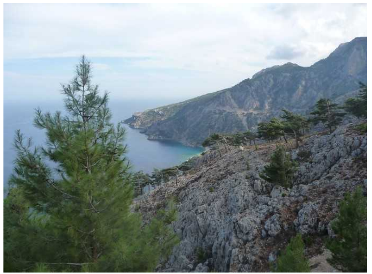
Her kommer vi til et område der det er en del pinjeskog.