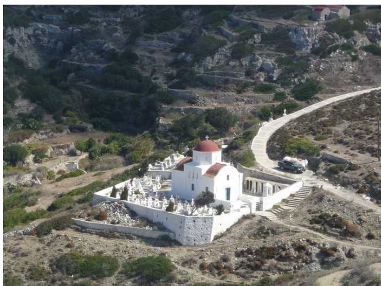
Her ser vi rett ned på et lite kapell.