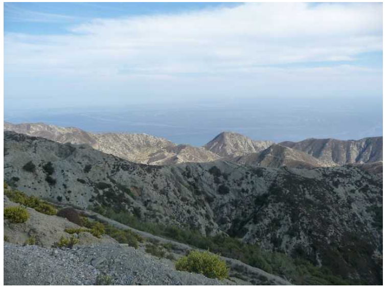
På vei syddover igjen. Det er mye fjell her.