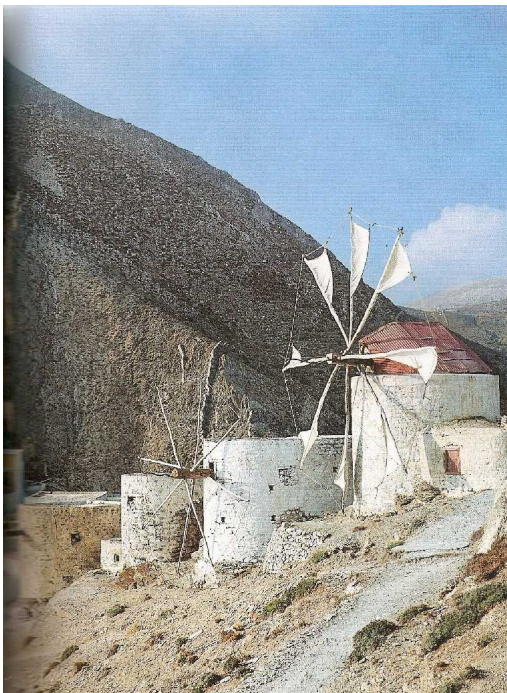
Flere vindmøller. Det var en gang over 80 stykker. Omtrent hver familie hadde sin egen vindmølle.