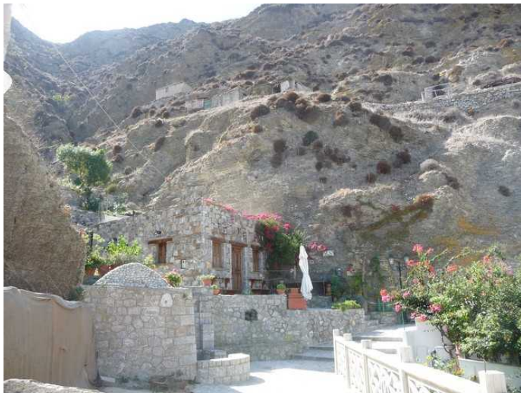
Det er ganske bratt her, og akkurat her er det bare et par hus på nedsiden av gata.