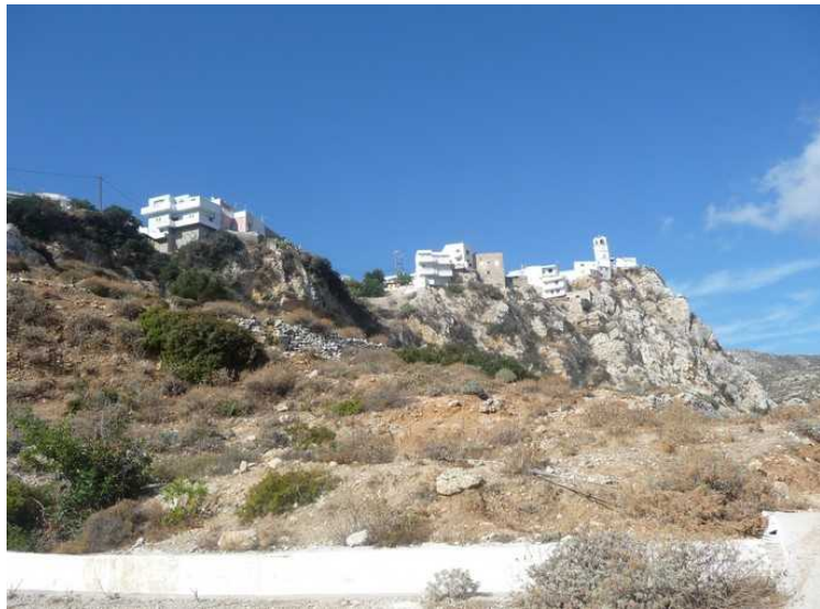
Menetes ligger høyt oppe på en klippeavsats og har god utsikt over den sydligste delen av øya.