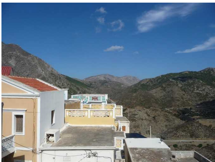
Restauranten var på taket, og det var derfor god utsikt. Her ser vi nordover.