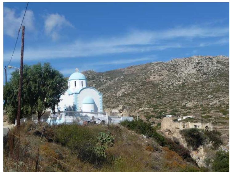
En annen av kirkene i Menetes.