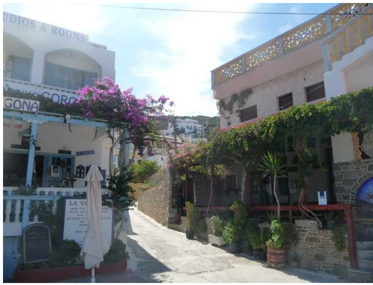
Det er ganske idyllisk innover i sidegatene.