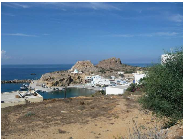
Finiki er kjent for sine gode fiskerestauranter.