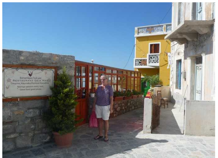
En restaurant ved siden av kirken. Den var også stengt.