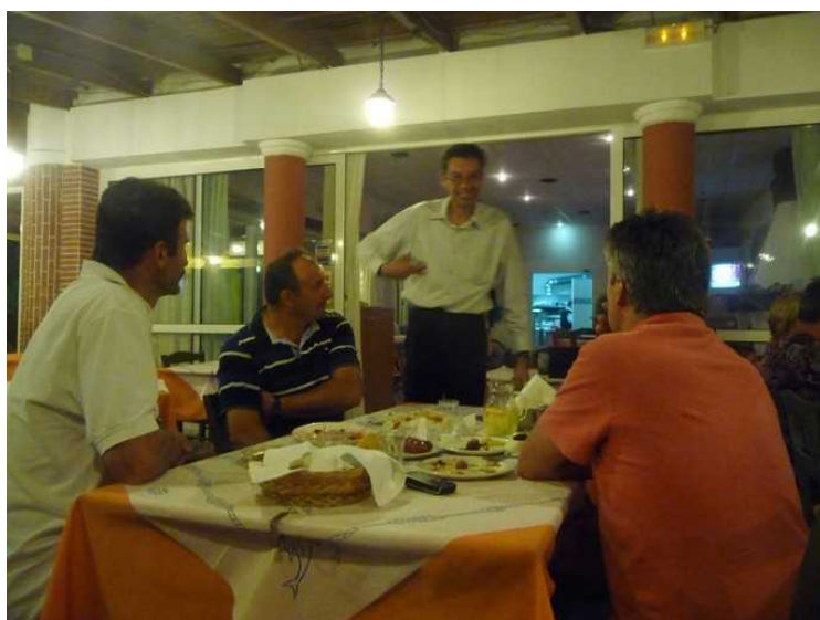
Bildet av nabobordet.