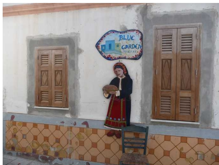
Det var en gruppe som hadde vært her dagen før. De anbefalte denne restauranten, så vi gikk for å ta en matbit før vi reiste videre.