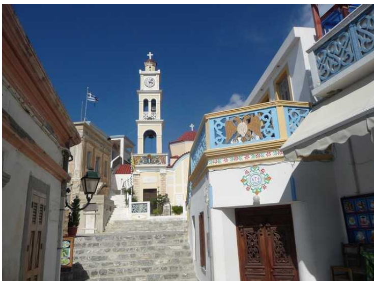
Kirken er fra det 600-tallet.