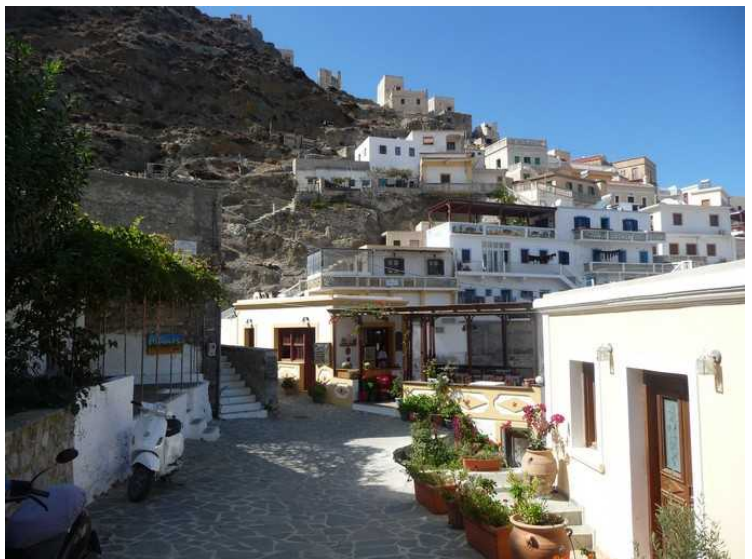
Her går vi videre bortover.