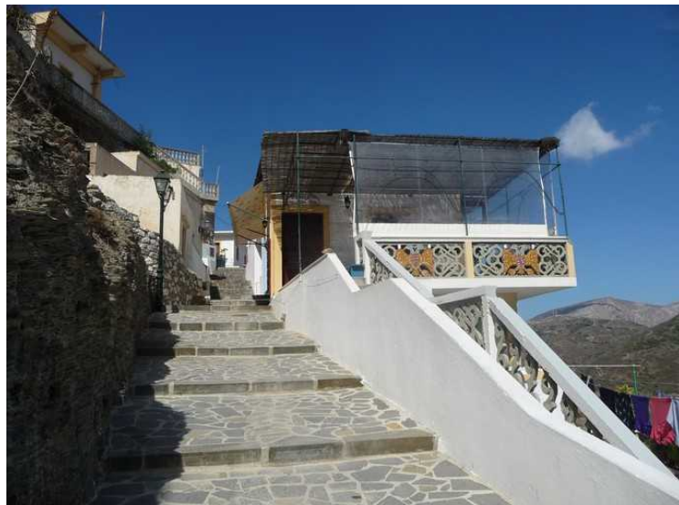
Her kommer vi til en utsiktrestaurant.