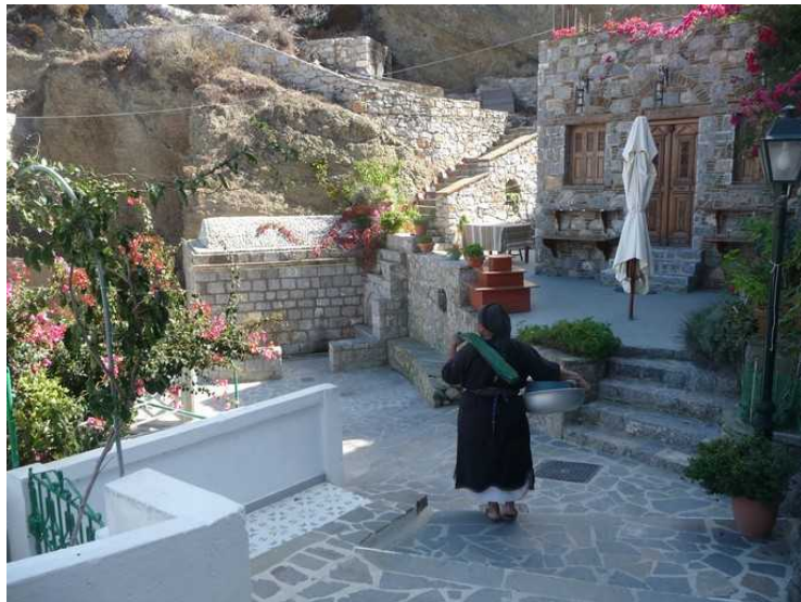
Etter at vi har spist, går vi nedover i byen igjen, i retning av der vi parkerte bilen.