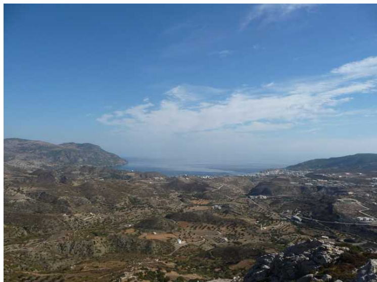
Her ser vi i retning av Panagia (Karpathos by).