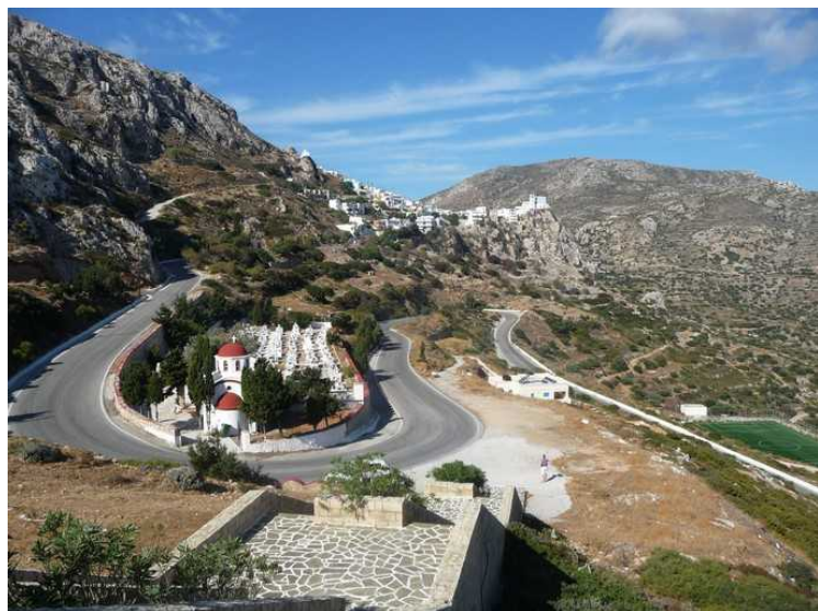
Utsikt fra krigsminnesmerket. Vi ser opp til Menetes. En liten kirke rett nedenfor.