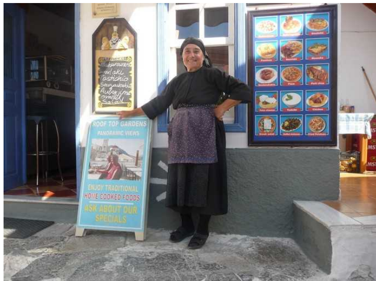
Her blir vi invitert inn.