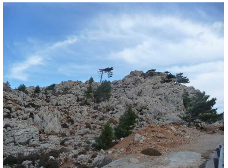
Det er likevel for det meste fjellknauser som stikker fram.