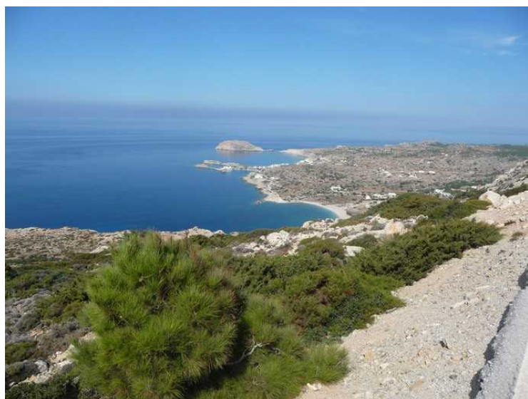
Her ser vi ned mot Lefkos .