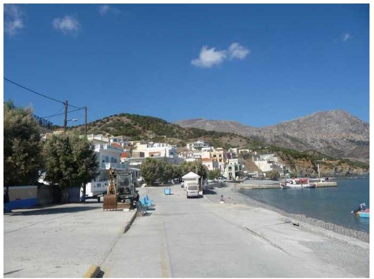
Enda et bilde fra Diafani.