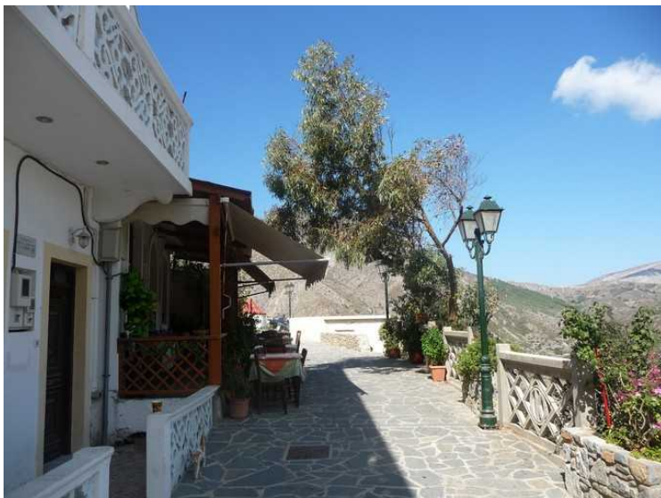
Det er flere små kafeer bortover, men det ser ikke ut til at det er noen gjester der. Vi er nok noen av de siste som besøker Olympos denne sesongen og vi var akkurat da de eneste turistene i byen.