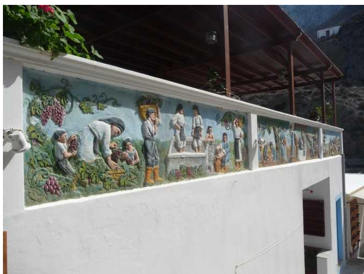
En vegg med fine relieffer.