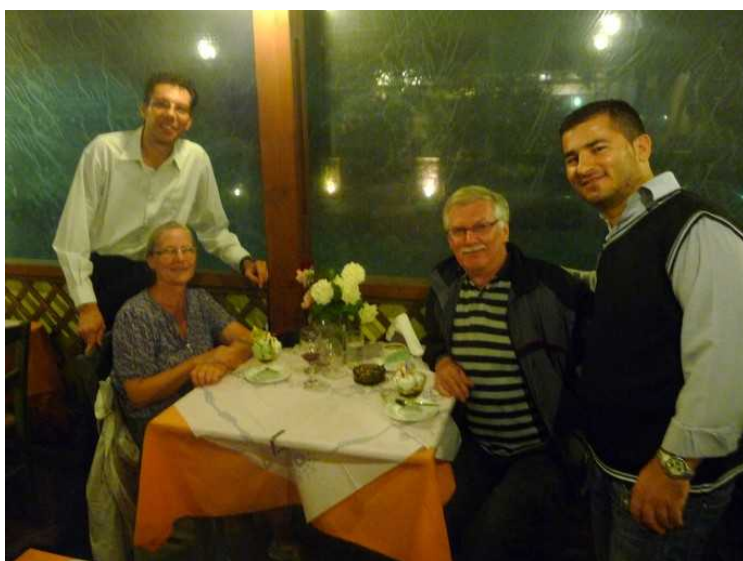
Bilde av oss og kelnerne. Veldig hyggelig betjening.