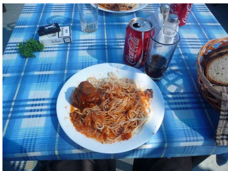
Vi valgte pasta med kjøttboller, og den retten var veldig god.