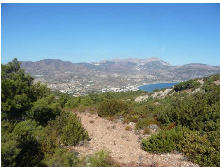
Her ser vi nordover mot byen igjen.