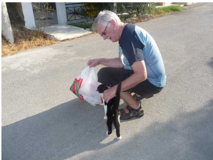
Katten lurere på hva vi har i posen.