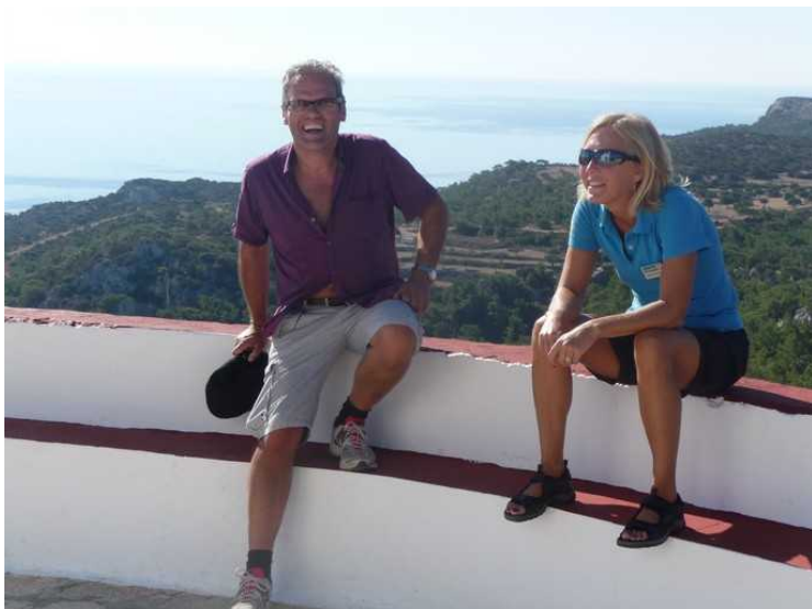
Oppe ved kirken. En i tur-gruppa og Apollo-guiden til høyre.