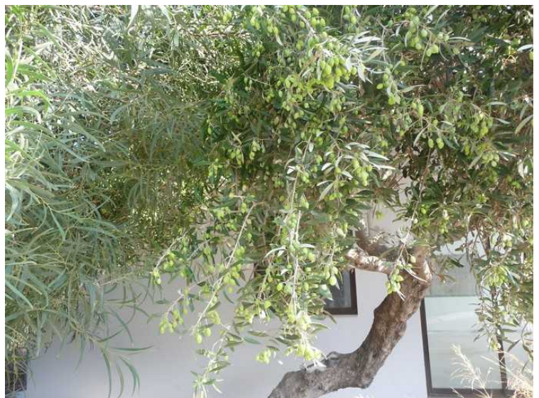
Oliventre. Det er veldig mange oliven på hvert tre, men de er noe mindre enn det vi er vant til.