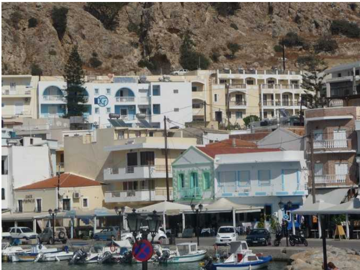
Her ligger husene opp mot en høy klippe.