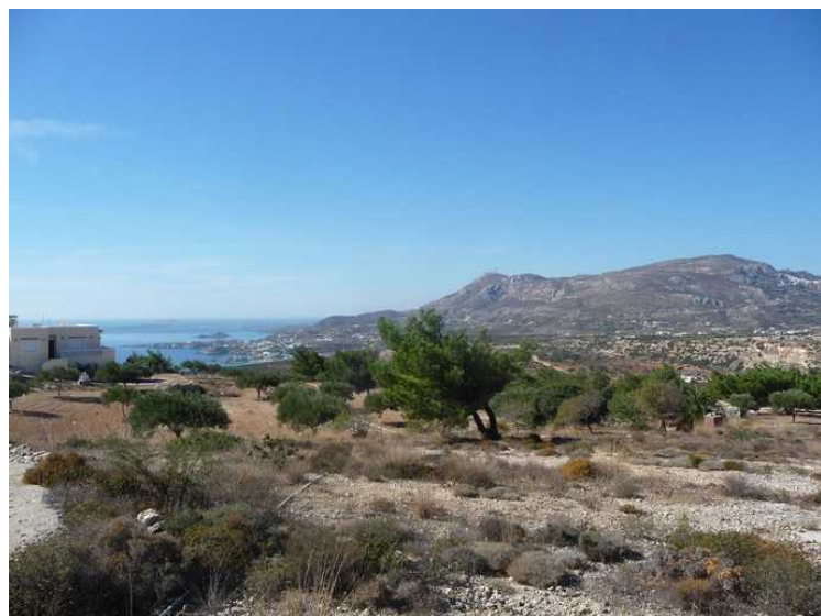
Vi har fremdeles sikt sydover langs kysten.