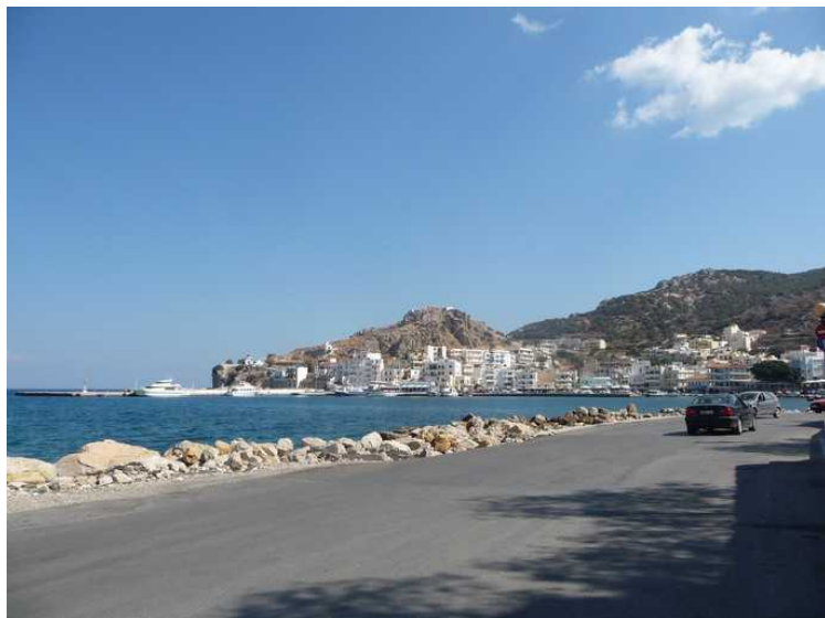
Vi gikk så nær kysten som vi kunne, hele veien.