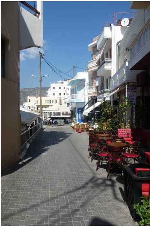
På vei ned til havnen igjen.