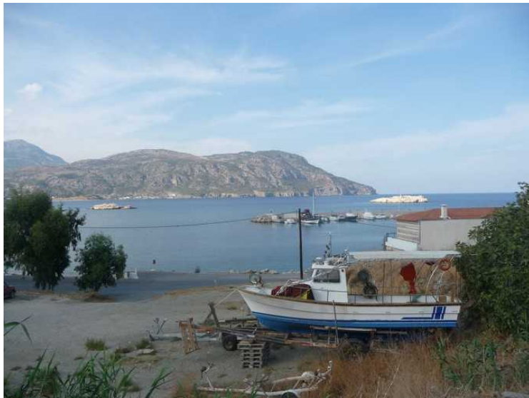
Båten er satt på land for vinteren.