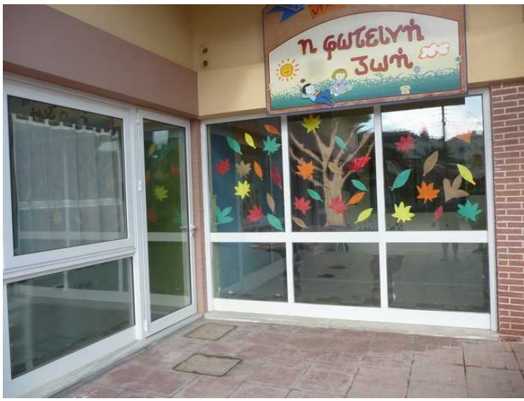
Etterpå går vi bort til barnehagen som ligger rett ved siden av.