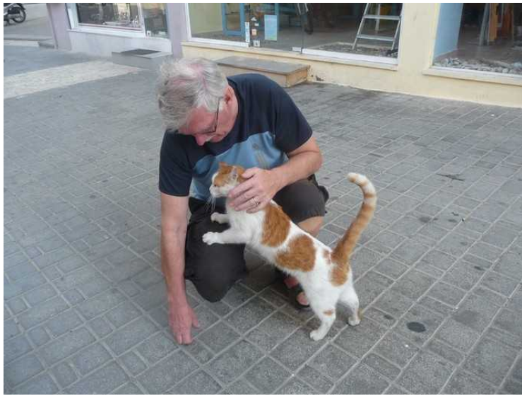
Den vil bli med oss, men den får ikke lov.