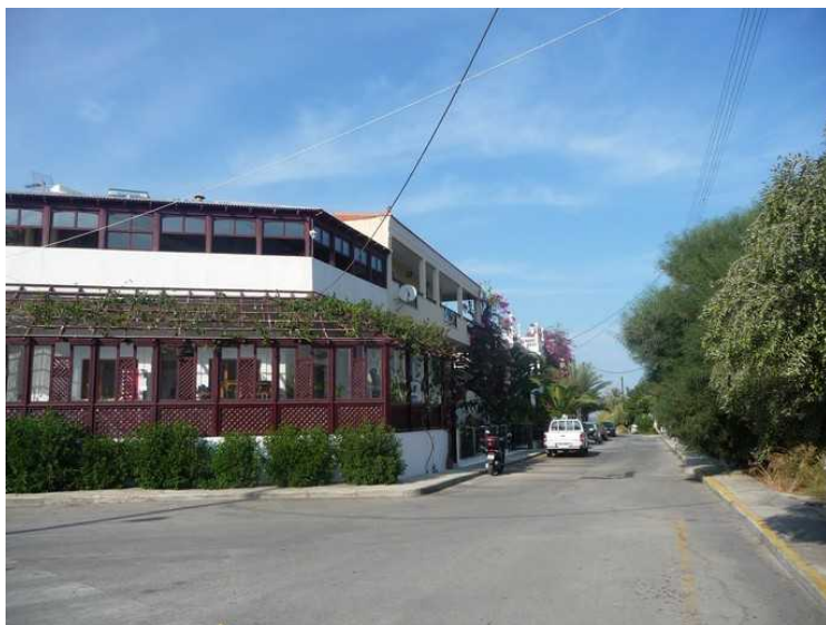
Her ser vi fra hovedveien og bortover den sidegata hvor hotellet vårt ligger.