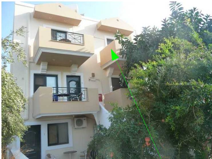
Her ser vi opp mot vår balkong.