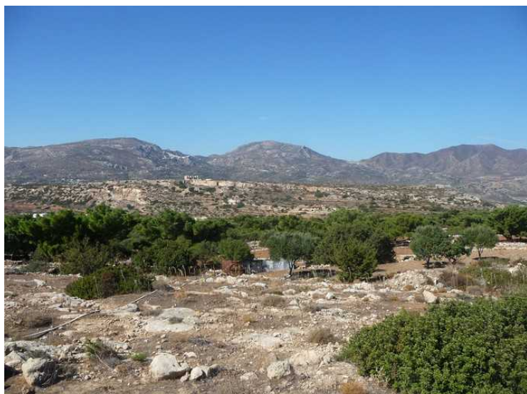
Bebyggelse i høyden vest for byen. Rett etterpå var vi nede i byen igjen.