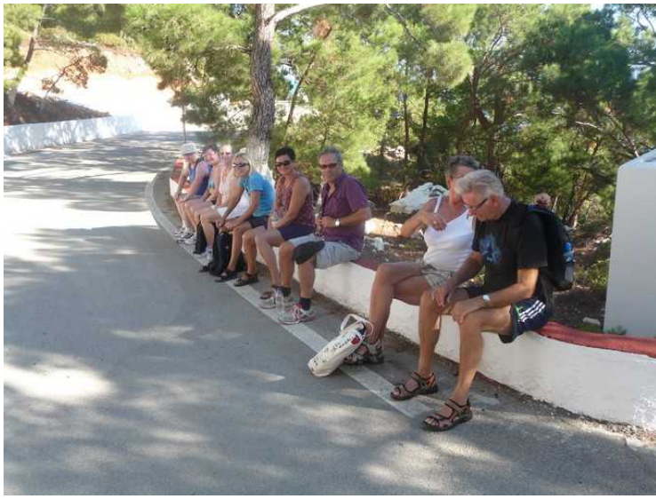
Her tar hele gjengen en pust i bakken.