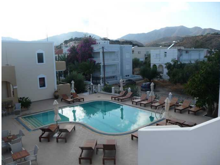
Bassenget etter at solen har gått ned.