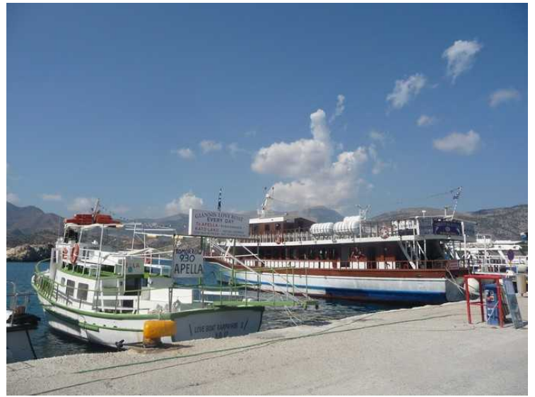
Noen sightseeing-båter ligger i havnen. Den største båten til høyre skal gå til Diafani neste dag.