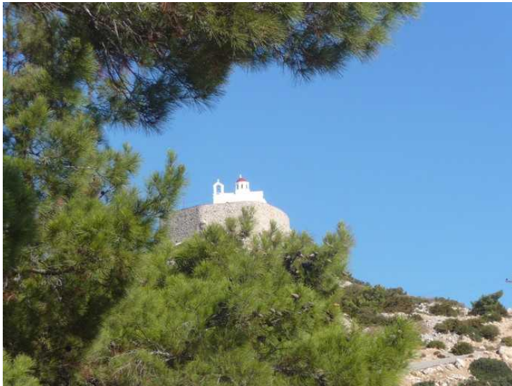
Vi skal gå forbi denne kirken.