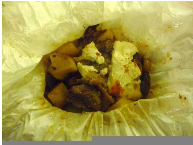
Denne gangen hadde vi Kleftiko . Det smakte veldig godt.