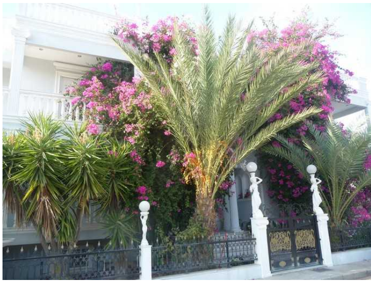
Veldig frodig i denne hagen.