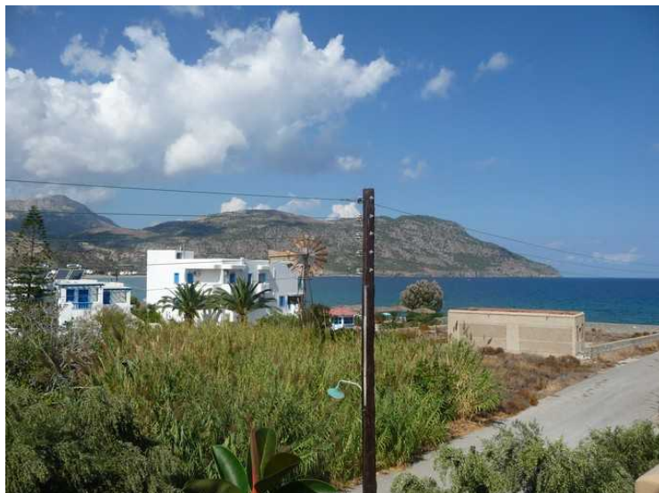
Utsikt fra balkongen og nordover langs kysten.