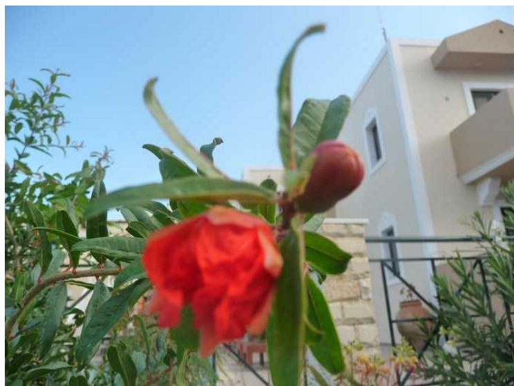
Blomst som senere blir et granateple.