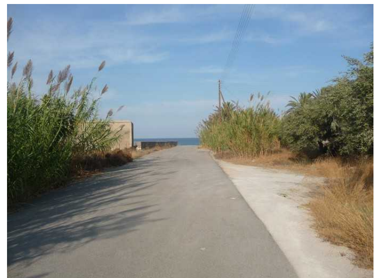
Veien fra hotellet og ned til stranden.