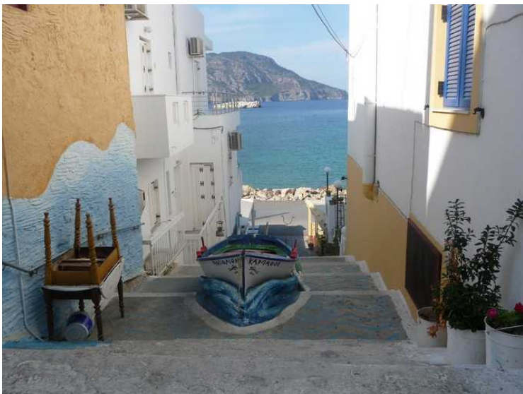
En båt i gata.