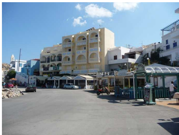
Her er vi kommet nesten inn til sentrum.