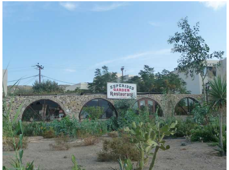
Stor hage utenfor en restaurant.