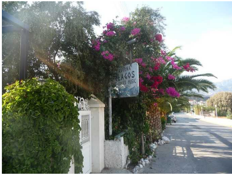
Her går vi forbi en restaurant som heter Pelagos.