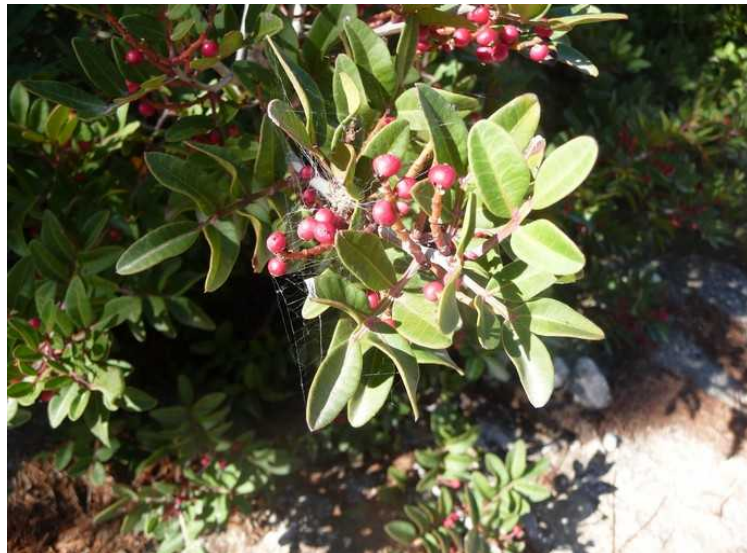
Vet ikke hva slags bær dette er.