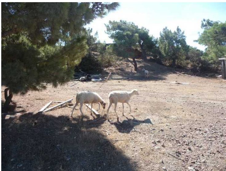
På vei nedover igjen mot byen kommer vi forbi disse sauene.