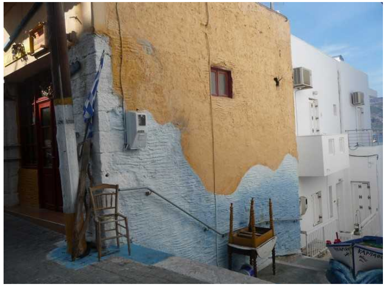
Dette huset har tatt bølgen.