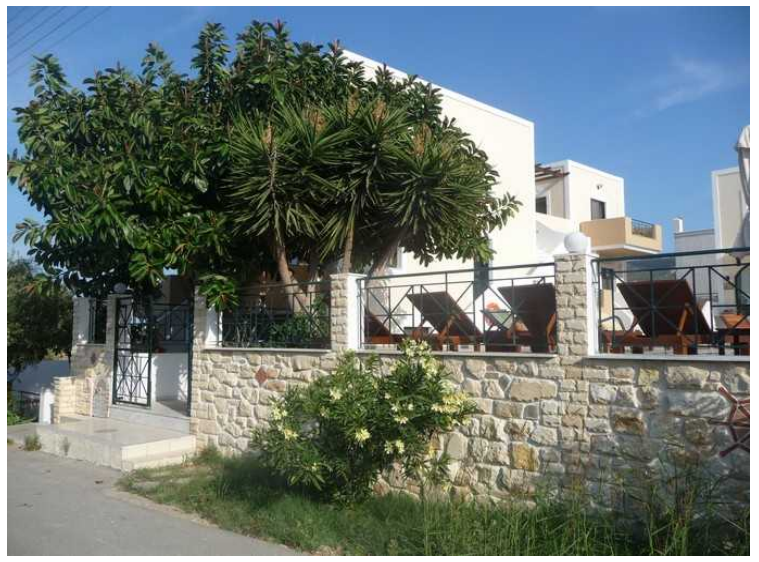
Dette er hotellet vårt. Bassengområdet til høyre.