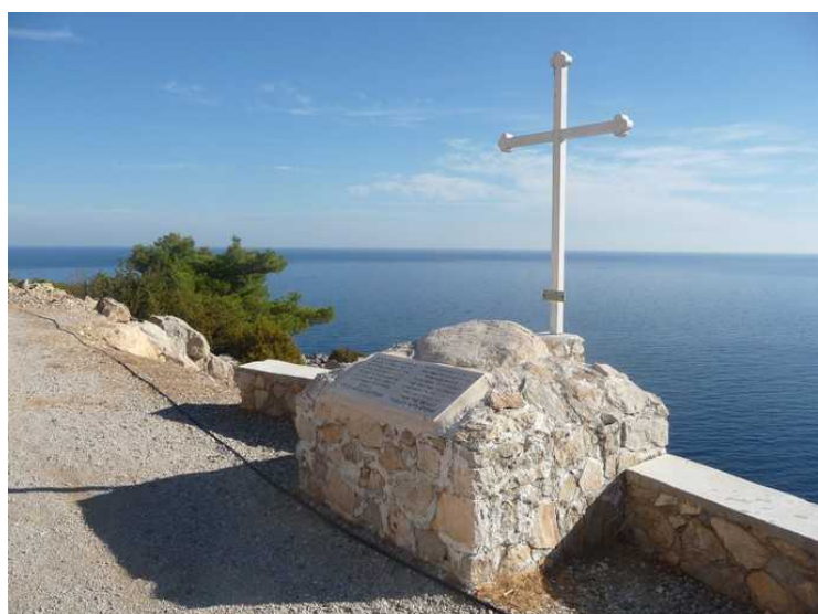
Et kors i veikanten.