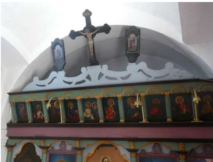
Dette er også inne i kirken.