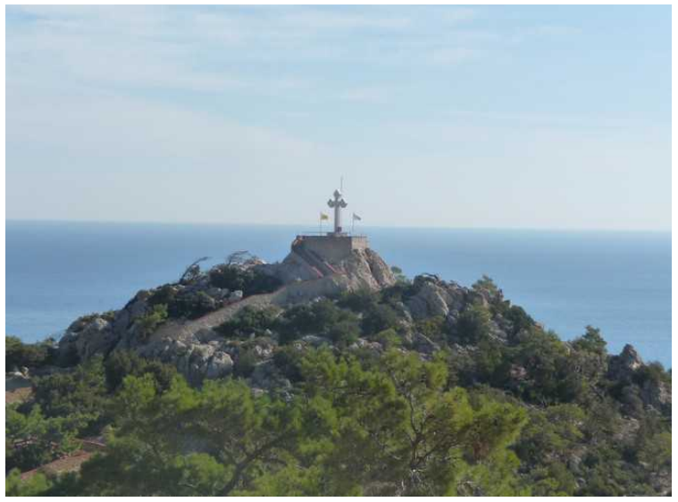
Her får vi et bedre glimt av korset på toppen.