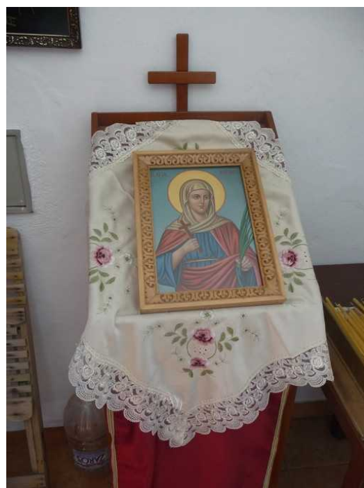
Inne i kirken.