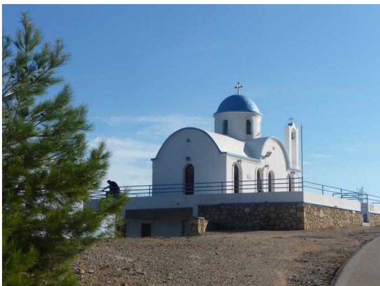
En liten kirke.