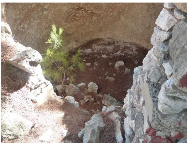
En gammel murt brønn, som var tom nå.