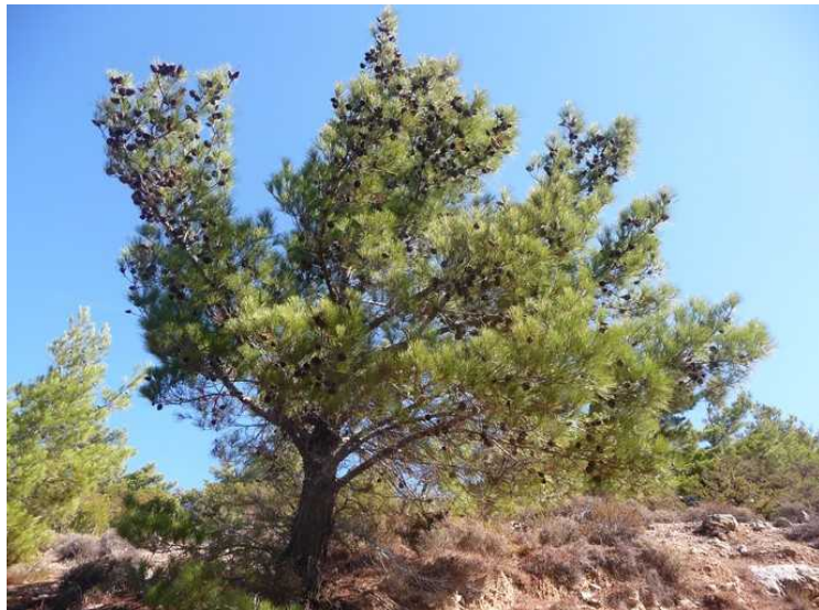
En pinje med en mengde kongler.