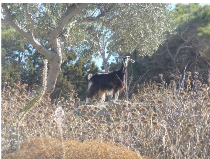
Her er den.