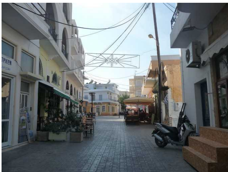
Det er ikke lov å kjøre bil i denne gata, og det er et par restauranter her.