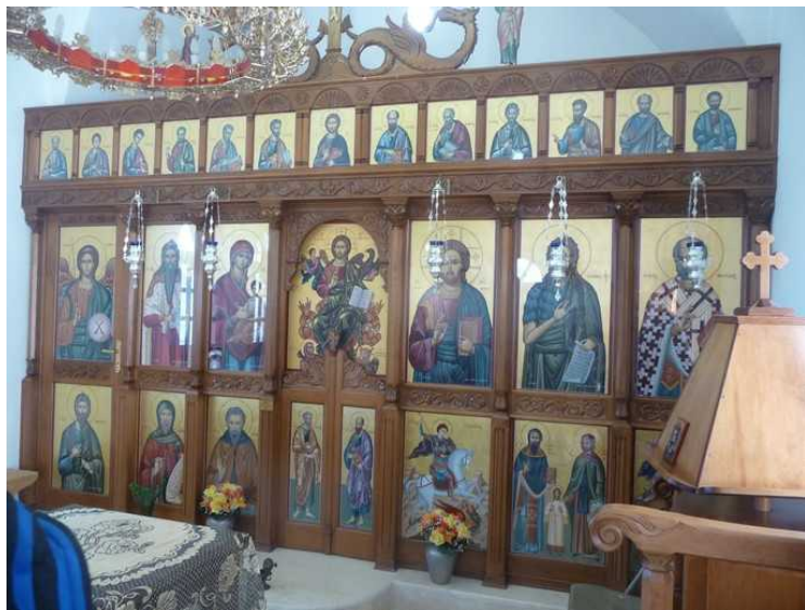
Inne i kirken.