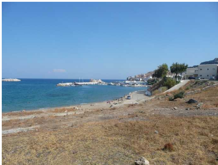
Dagen etter at vi hadde vært på øy-rundtur gikk vi en tur inn til Pigadia.