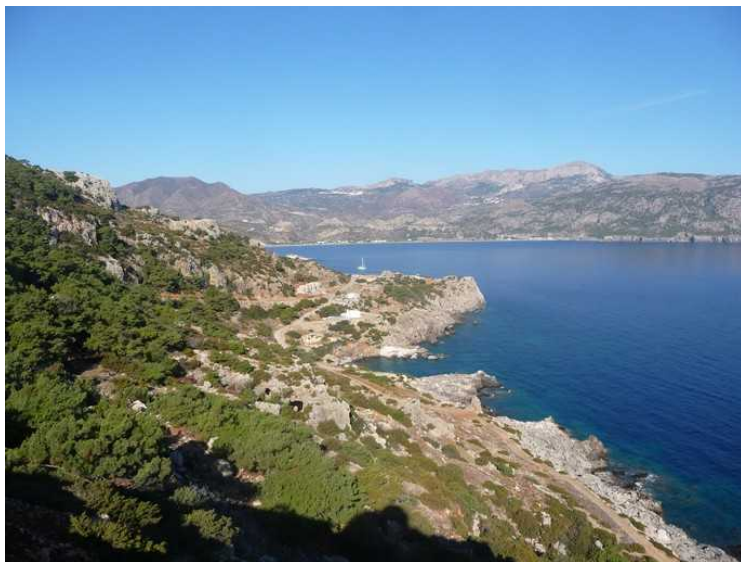
Utsikt fra plattformen ved kirken.