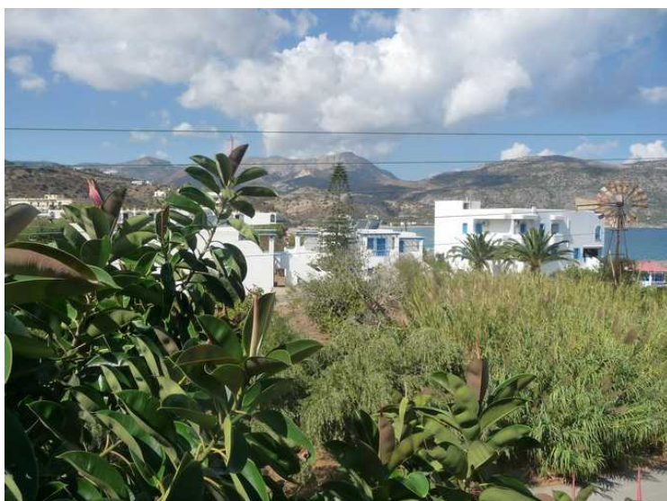
Utsikt litt lenger innover land.