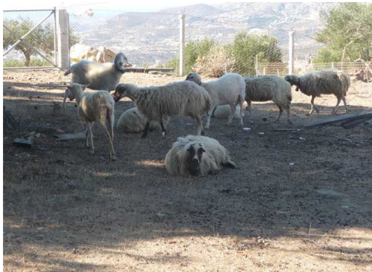
De fleste står i skyggen under trærne.