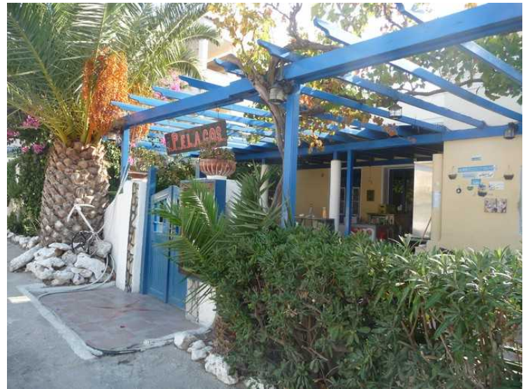
Vi spiste her den første dagen vi var her. Dagen etterpå var den stengt for vinteren.