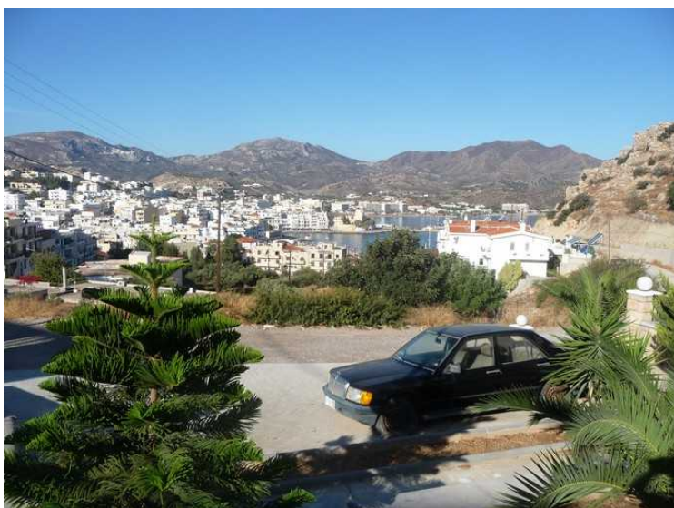
Neste dag skal vi gå tur i utkanten av byen. Vi trodde at det var ut i naturen, men det ble på asfalt nesten hele veien. Her ser vi tilbake mot byen.