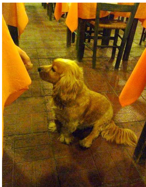
Her får den visst en liten matbit.