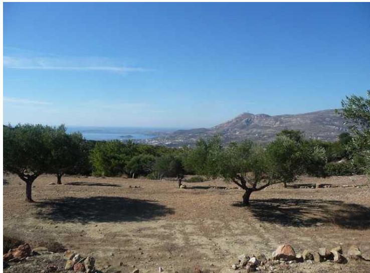
Utsikt sydover langssetter kysten.