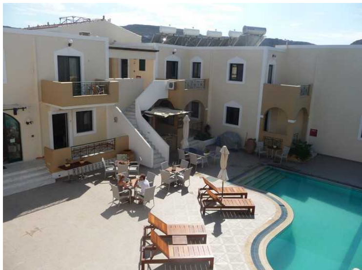
Bassenget og en liten bassengbar.