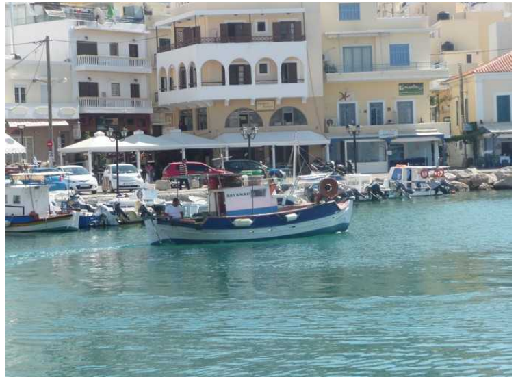
En fiskebåt er på vei ut.