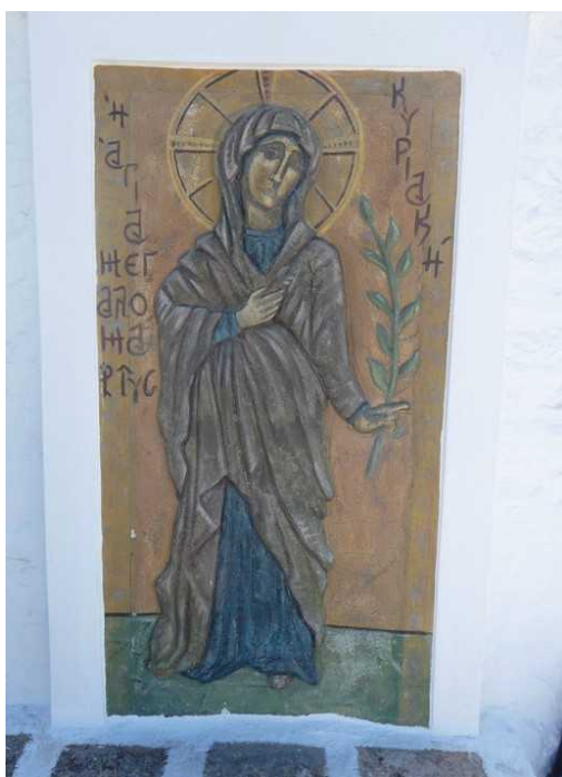
Et bilde på veggen på utsiden av kirken.