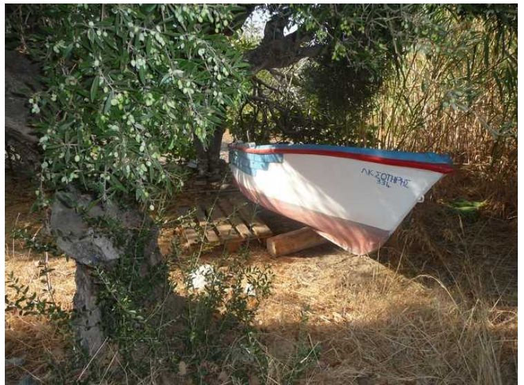
En båt i buskaset bak hotellet.