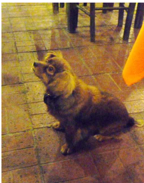
En hund kommer inn og tigger ved bordene.