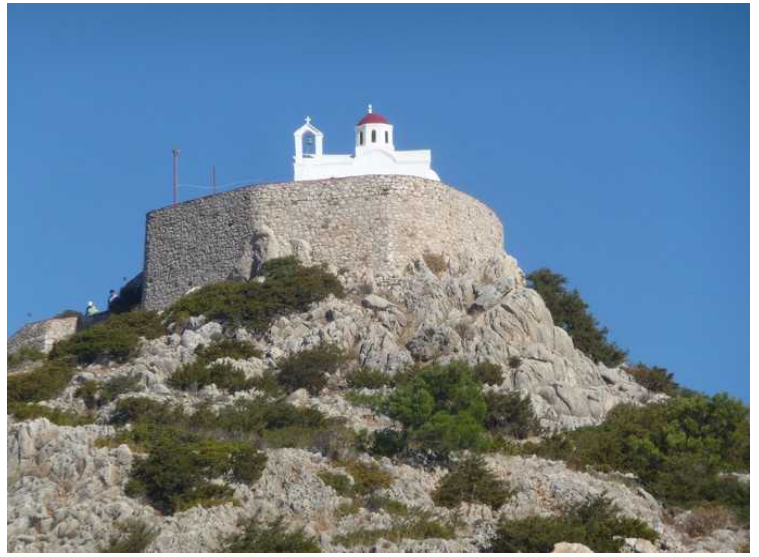
Vi nærmer oss.