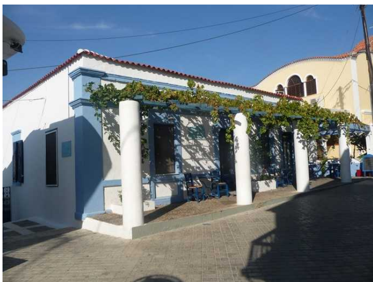
Mange slyngplanter på dette huset.