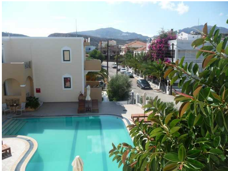
Dagen etterpå tar vi bilder fra leiligheten vår og ned mot bassenget.