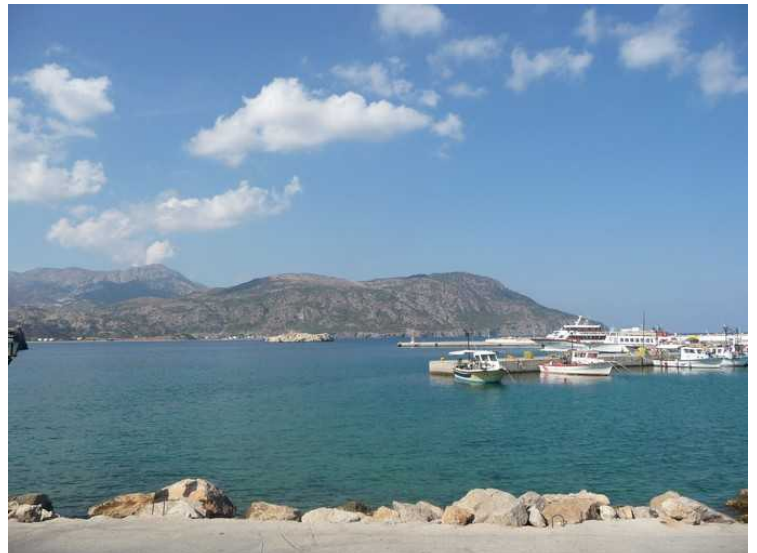
Utsikt fra havnen og nordover.