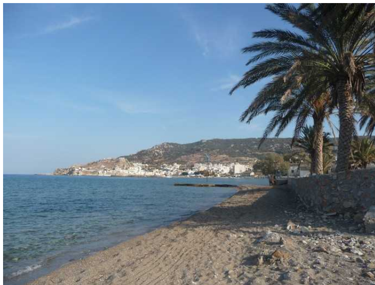
Nede på stranden ser vi bortover i retning av Pigadia.