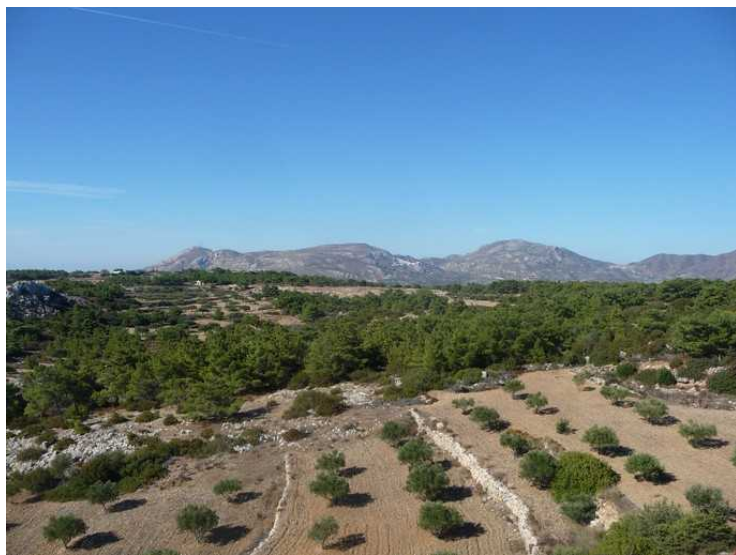
Det er en del oliventrær nedenfor kirken.