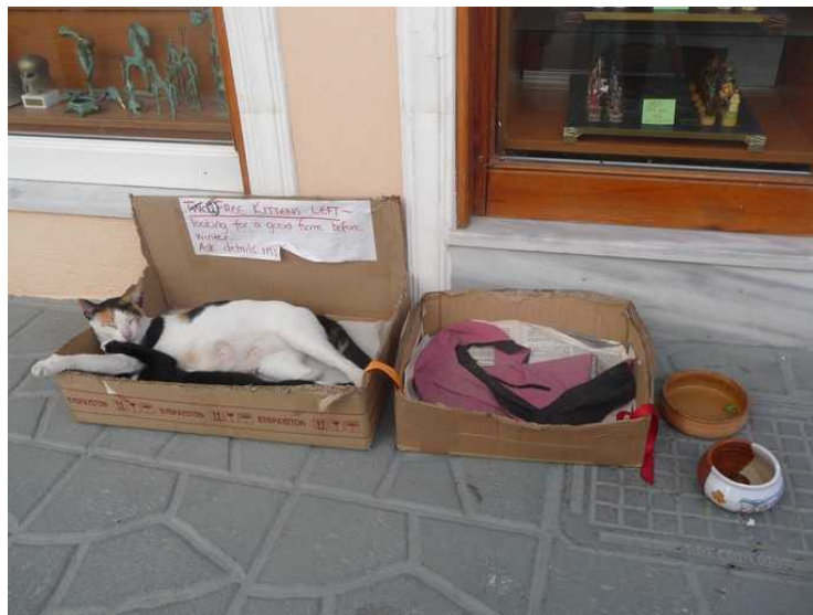
På vei tilbake til hotellet kommer vi forbi et sted der de gir bort herreløse katter.