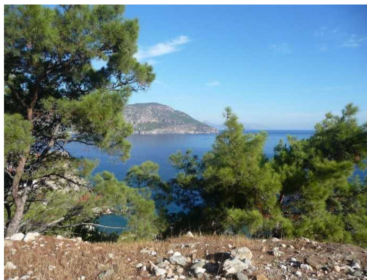
Vi går syddover fra byen. Her ser vi nordover forbi byen.