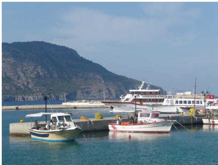
Et siste bilde fra havnen.