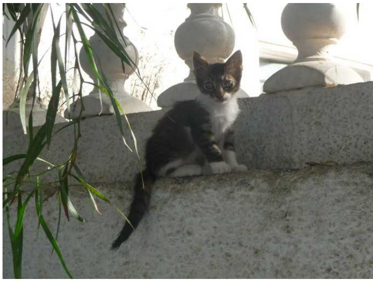
Denne lille tassen sitter og ser etter oss.