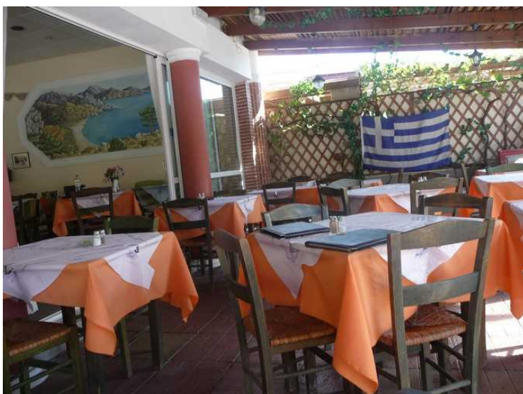
Utpå dagen går vi bort til Restaurant Nisiotiko for å spise lunsj.