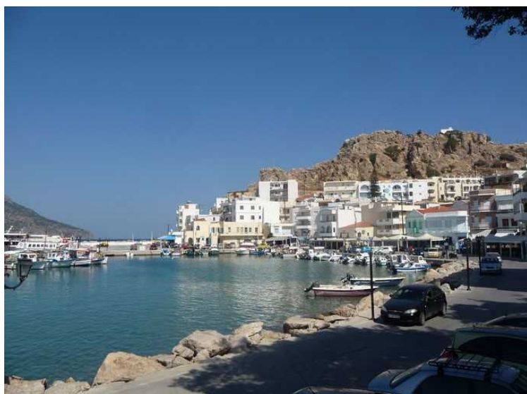
Sentrum og havnen.