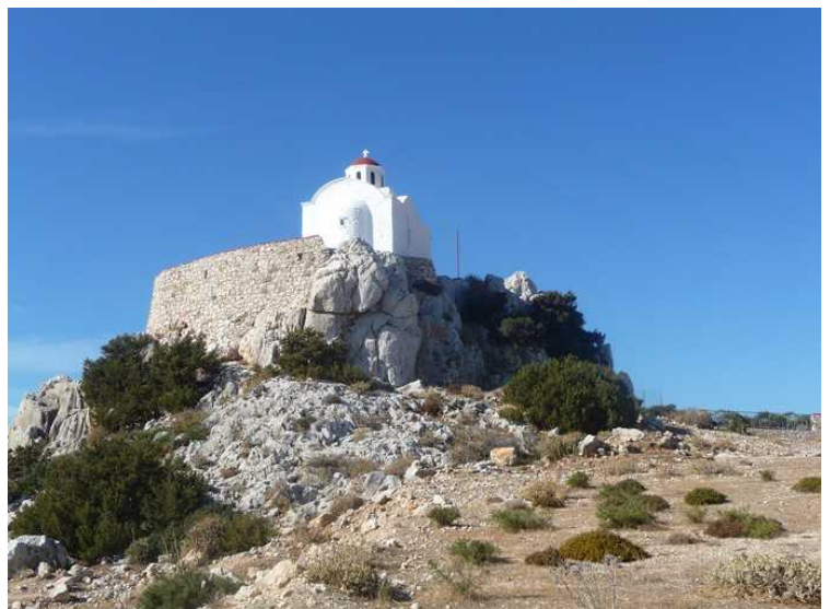
Snart oppe ved kirken.