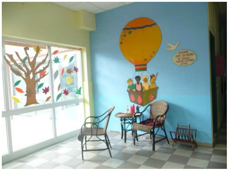
En rask titt inn. Det er så langt på dag at ungene er hentet av sine foreldre.