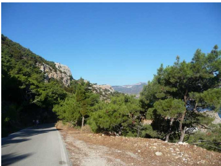
Vi kom denne veien.