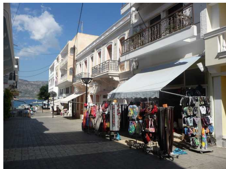
Inne i en av gatene i sentrum.