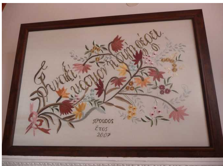
Brodert bilde på veggen.