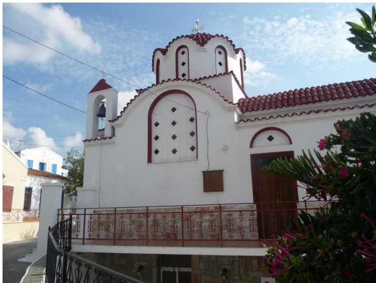
Kirken sett fra en annen vinkel.