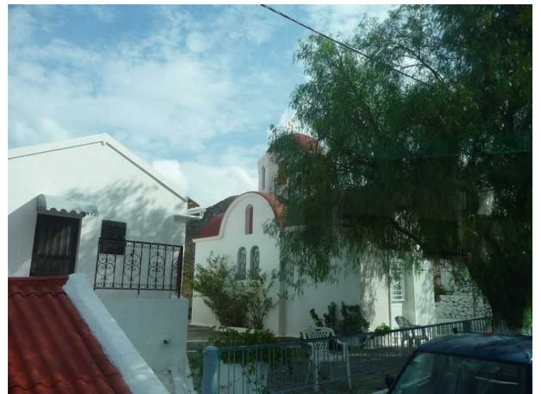
En liten kirke. Det bor bare ca. 300 mennesker i Othos.