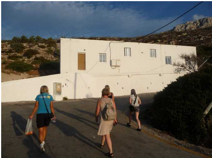
Rett før vi er tilbake til bussen. Dette er en olivenoljefabrikk som er nedlagt.