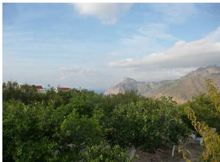
Det vokser masse oliventrær og frukttrær i området.