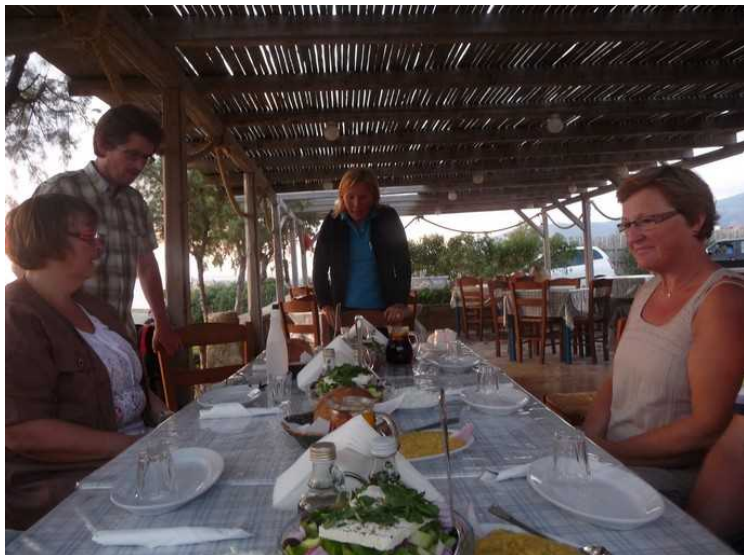
Apollo-guiden forteller et eller annet.