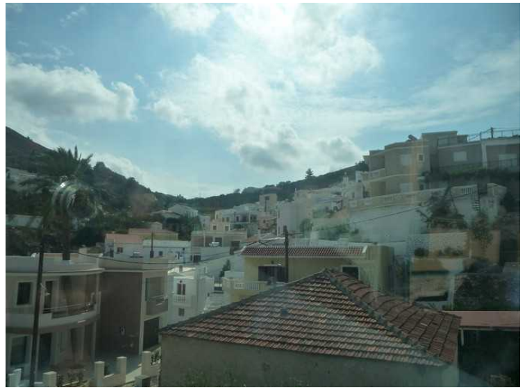
Neste by heter Volada .