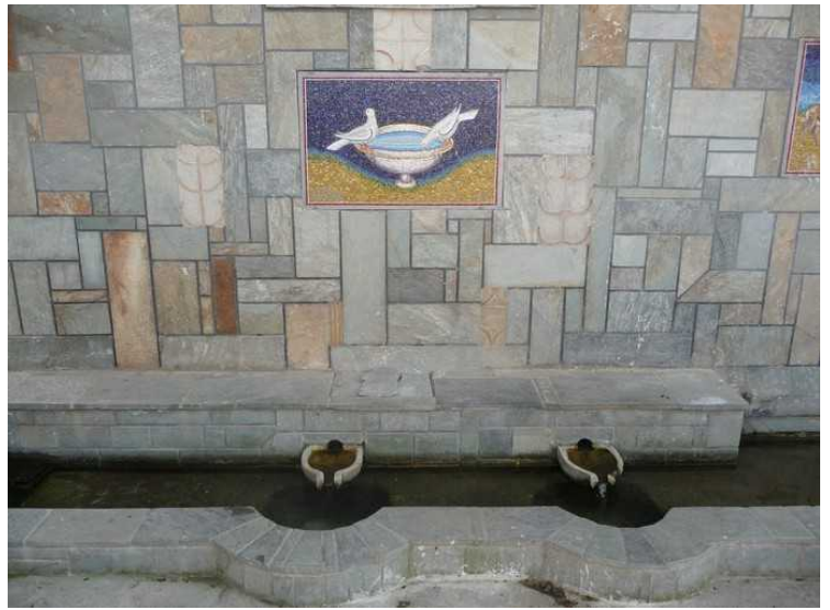
Under kirken er det et oppkomme. De kvinnene som drikker dette vannet er garantert å bli gravide. Det var ingen i i følget som ville smake på vannet.