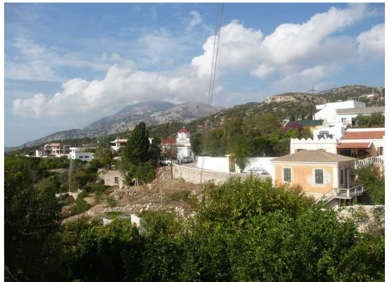
Etterpå går vi videre bortover mot kirken som vi skimter midt i bildet..