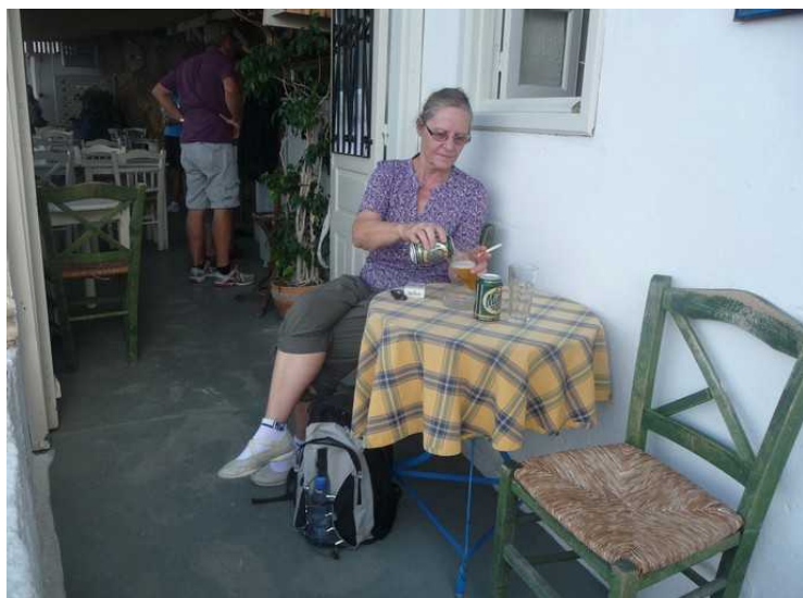
Vi kjøper en øl og setter oss ute ved dette bordet.