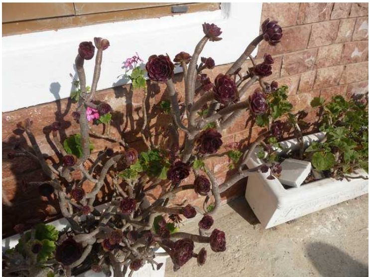
Det vokser noen spesielle blomsterplanter her.