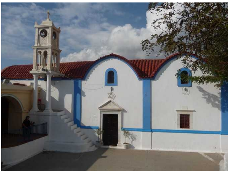
Et hus ved siden av kirken.