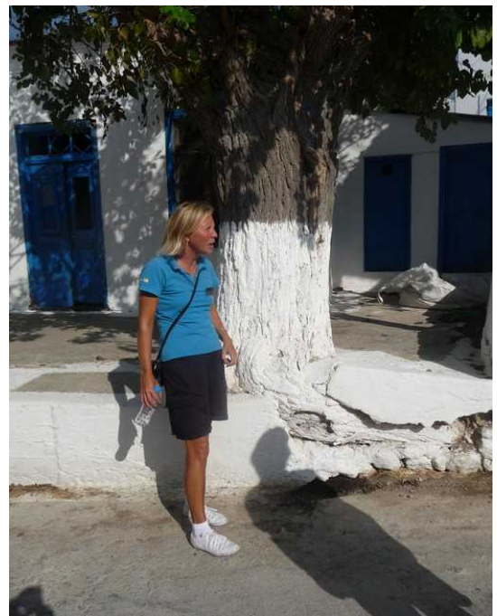
Apolloguiden forteller om kirken.