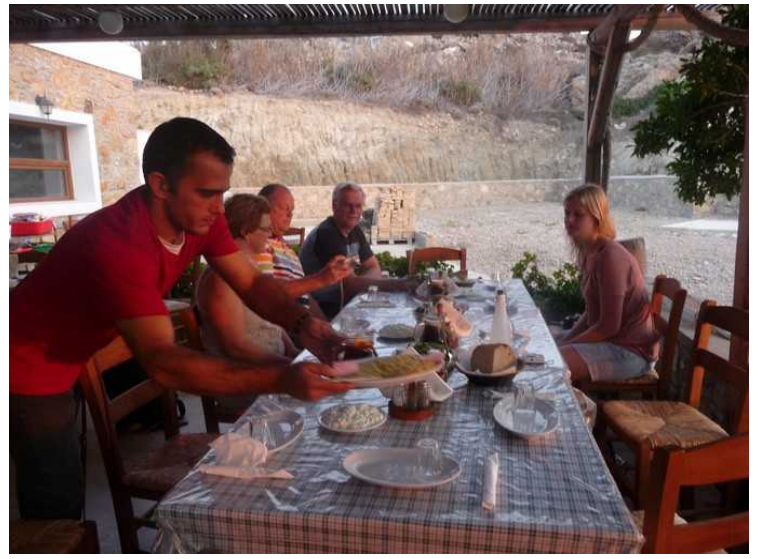
Betjeningen serverer de første rettene.