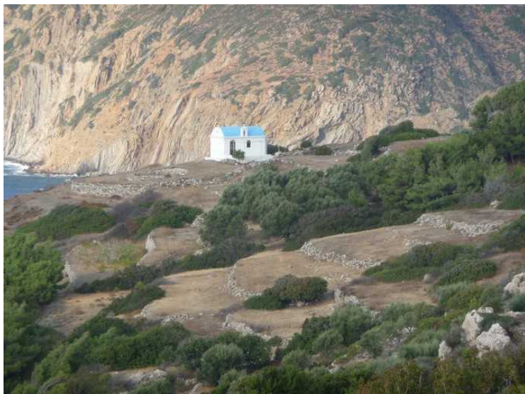
En liten kirke helt borte på skrenten.