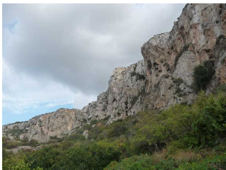
Det er noen bratte knauser ovenfor byen.