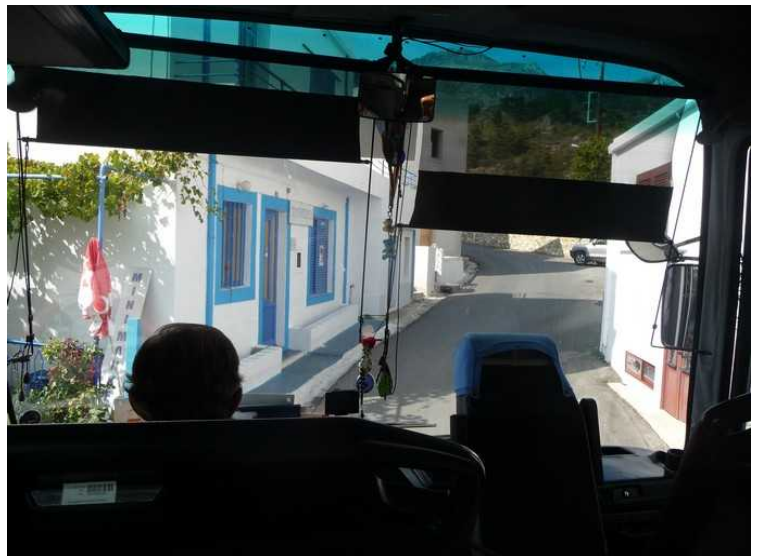
Her kommer vi til Othos .

Hovedveien går midt gjennom byen. Veien er smal og svingete, og det er godt gjort av sjåføren å greie å smyge bussen gjennom. Vi stoppet ikke i disse byene.