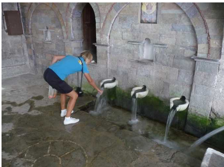
Under denne kirken også, er det en kilde, og det er laget åpninger i muren hvor vannet renner hele tiden.