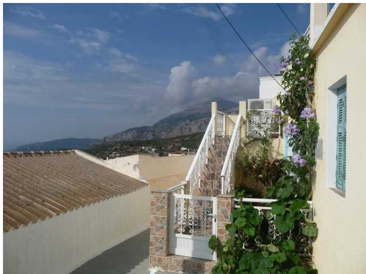
Det er mange planter utenfor husene.