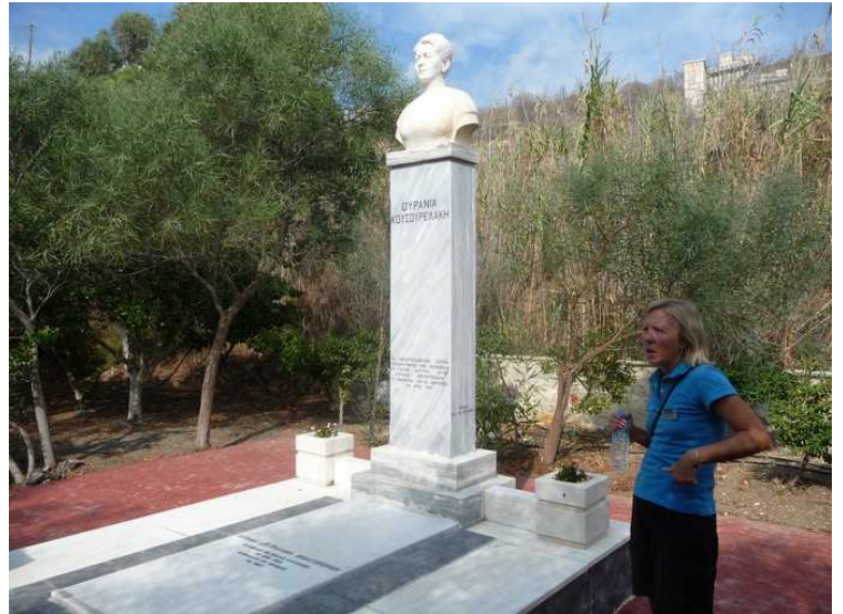
Apolloguiden forteller om Piles. Etter at bussen har parkert, går vi opp noen lange trapper opp til et monument over en innflytelsesrik kvinner her i Piles.