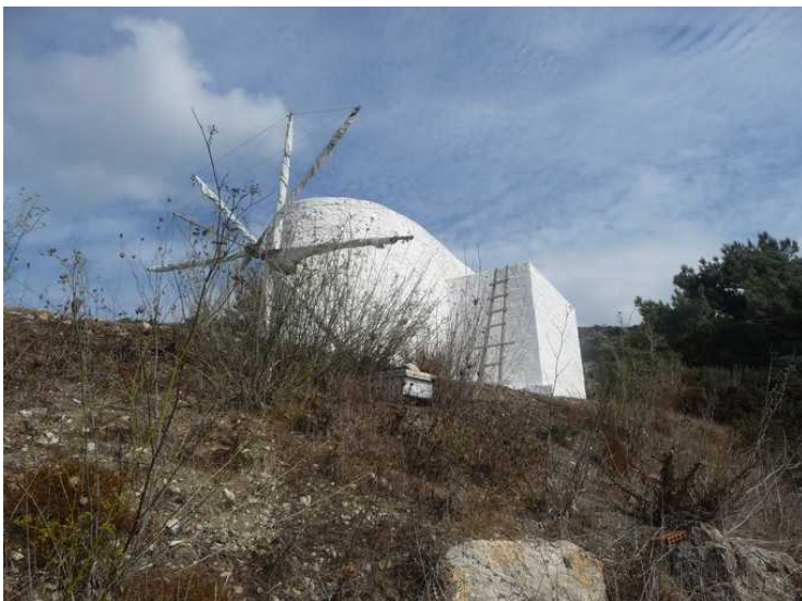
En tradisjonell vindmølle står borte i bakken.