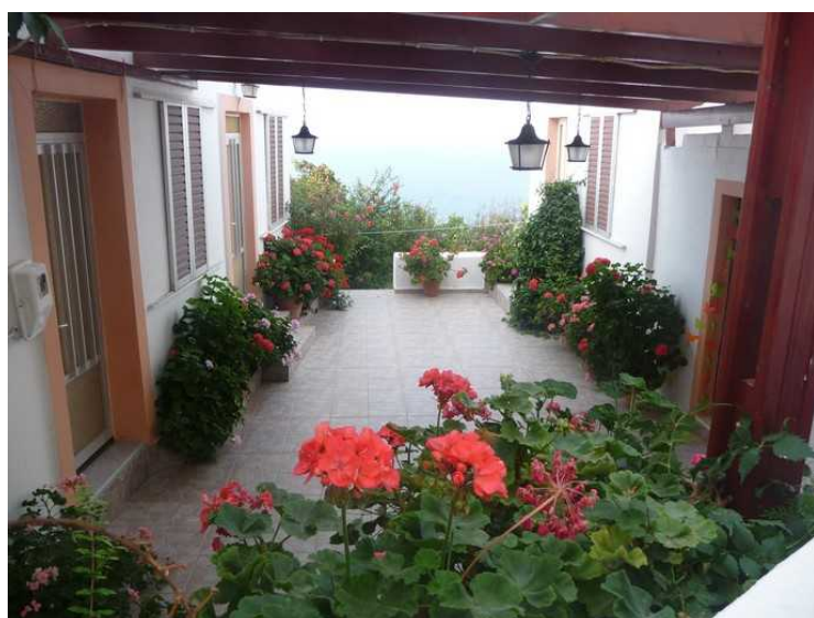
Vi går forbi et annet flott gårdsrom.