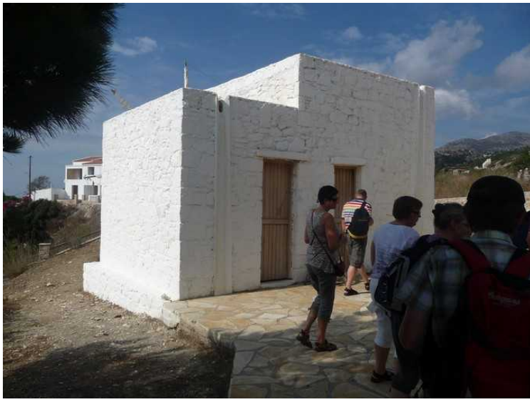
En del av museet.