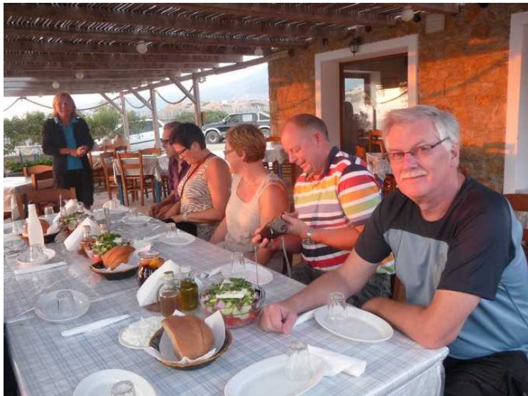
Vi sitter ved et stort langbord.