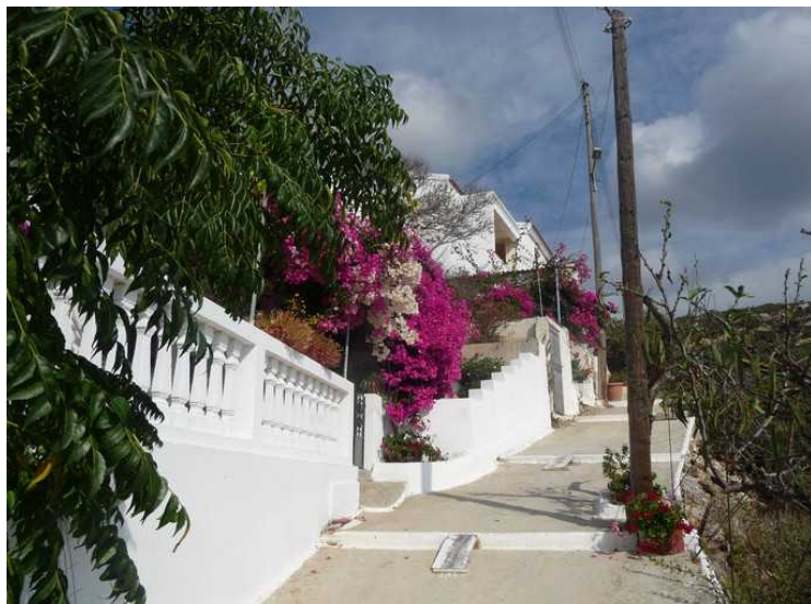
Gata går i mange buktninger nedover med slake trapper.