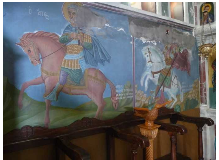
Veggmalерier inne i kirken.