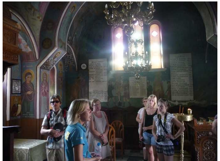
Inne i kirken.