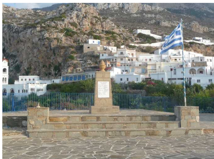
Et monument for å minnes de falne under den andre verdenskrigen.