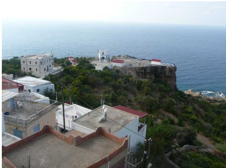
Her ser vi ned og bort på en stor åpen plass.