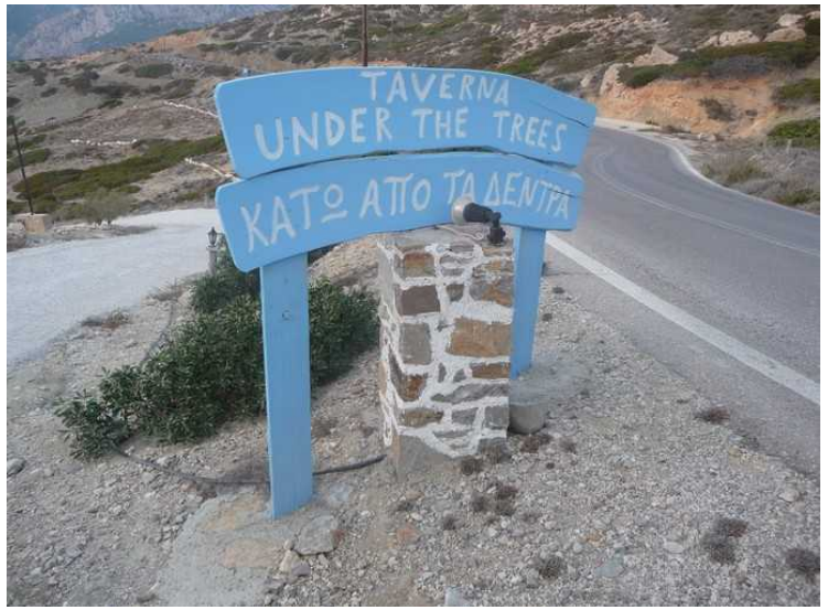
Neste stopp, «tavernaen under trærne». Dette skiltet står oppe ved hovedveien. Her skal vi få servert tradisjonell gresk mat.