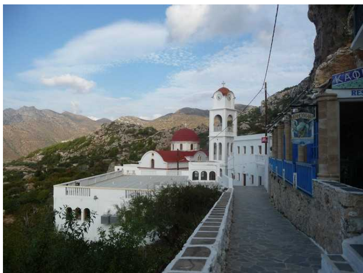
Her er vi kommet nesten ned til kirken. Dette er hovedkirken og kalles Jomfru Marias Fødselskirke.