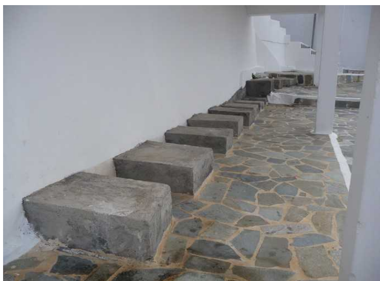
Ved siden av er det en rekke steiner som er blitt benyttet som vaskebrett under klesvasken.