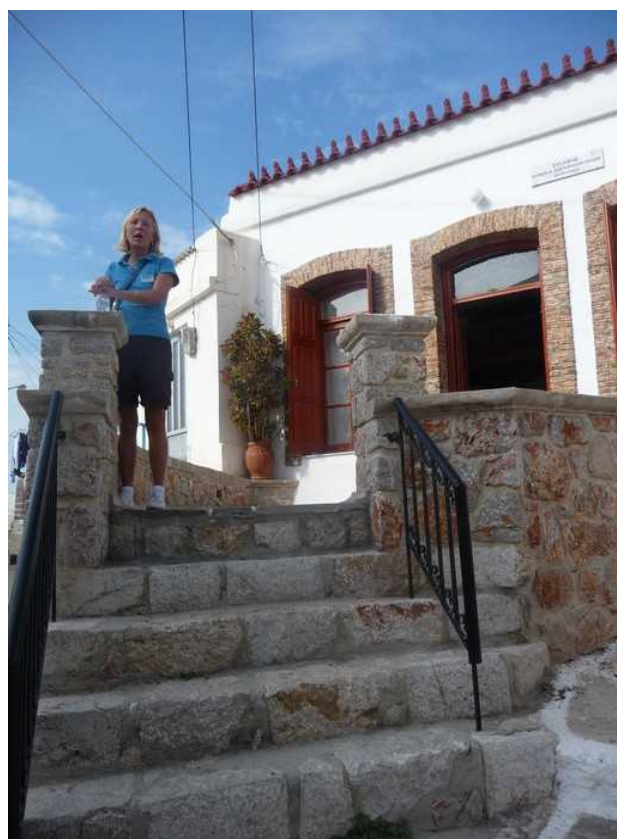
Apolloguiden tar oss med til et utsalg som lokale kvinner produserer varer for.