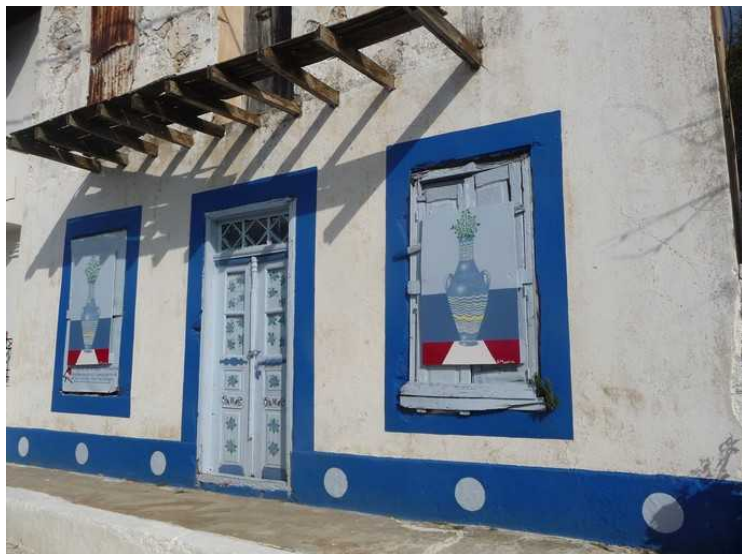
I denne byen er det mye blått og hvitt.