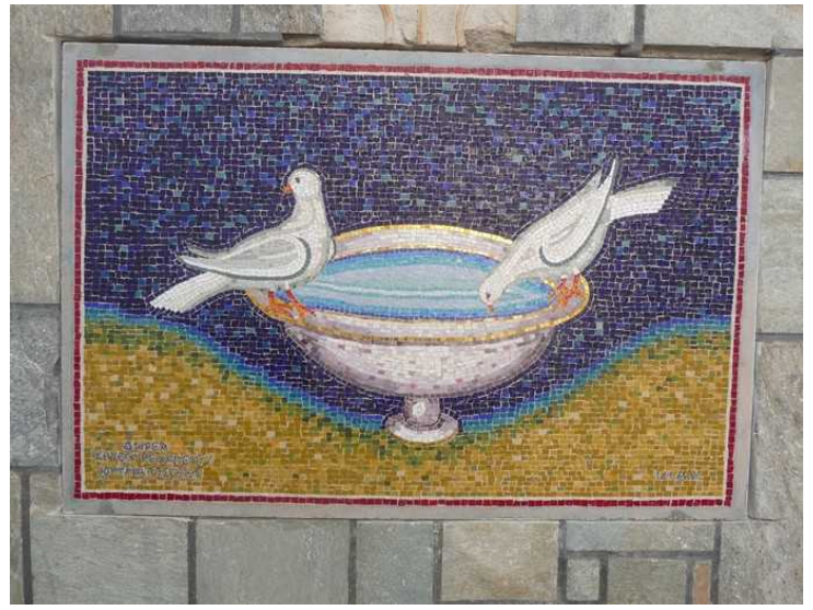
På veggen ved oppkommet er det noen fine mosaikk-bilder.