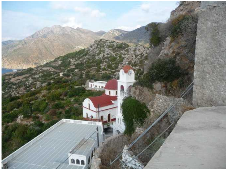
Fra der som bussen stopper, kan vi se ned på en kirke.