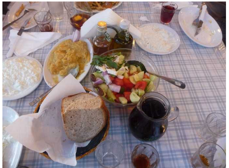
Vi får flere retter etter hvert.