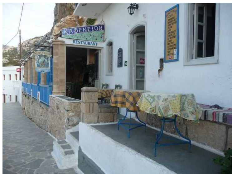
På vei til kirken stopper hele gjengen på denne restauranten, og vi får fri noen minutter.