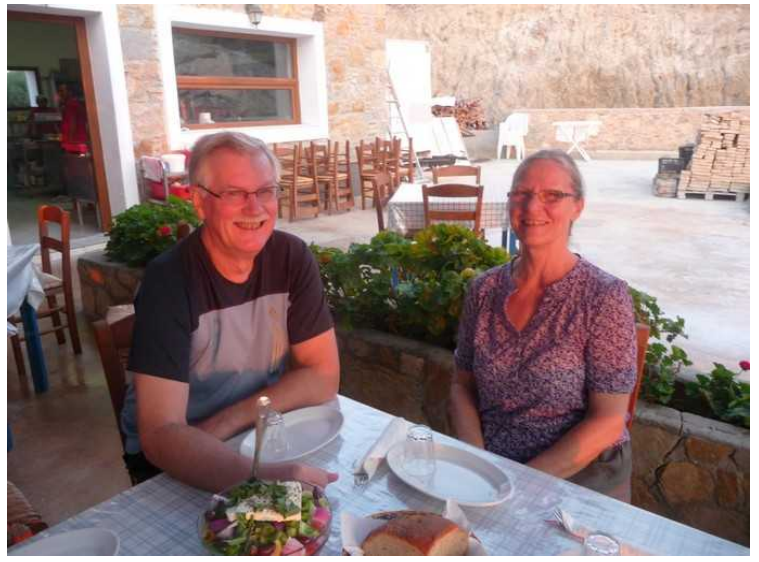
Her har vi satt oss ved bordet.