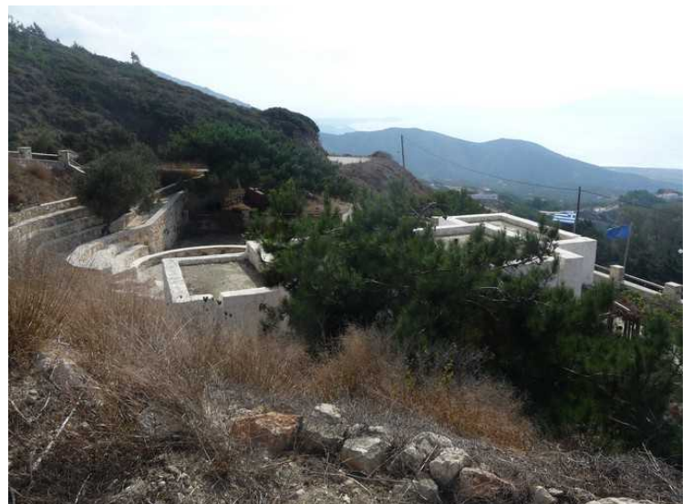
Det er et jordbruksmuseum her, men det var ikke åpent så sent i sesongen.