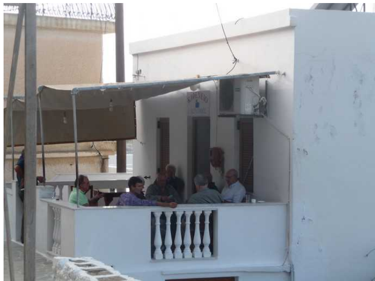
Borte på nabokafeen sitter en gjeng karer og diskuterer høyllytt.