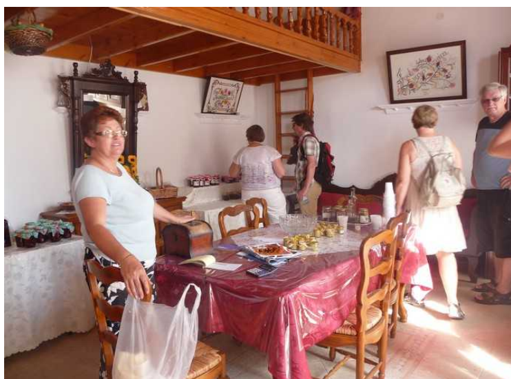
Produktene er utstilt på bord og hyller.