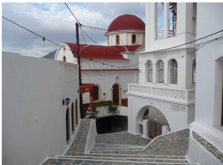
Veien videre nedover til kirken.