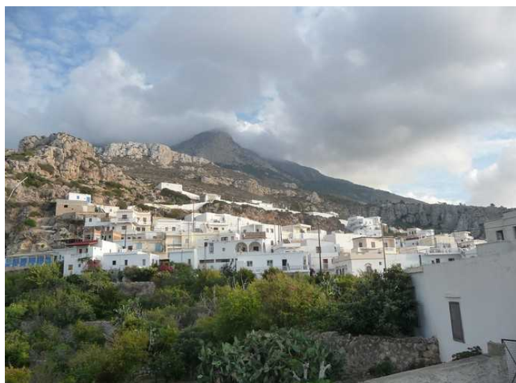
Fra plassen kan vi se tilbake mot byen.