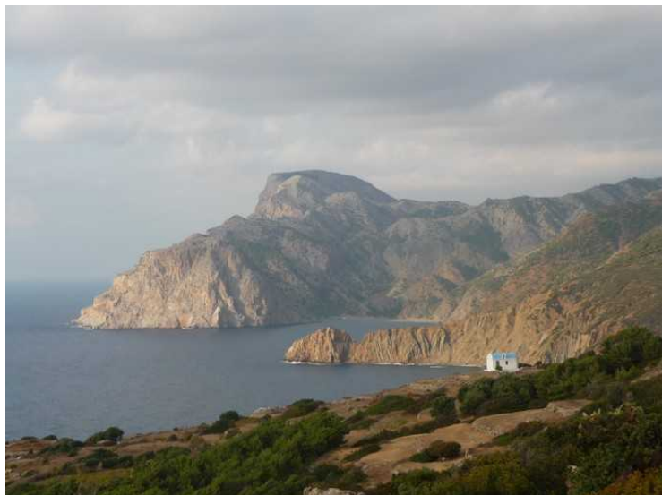
Enda et blick nordover kysten og den lille kirken.