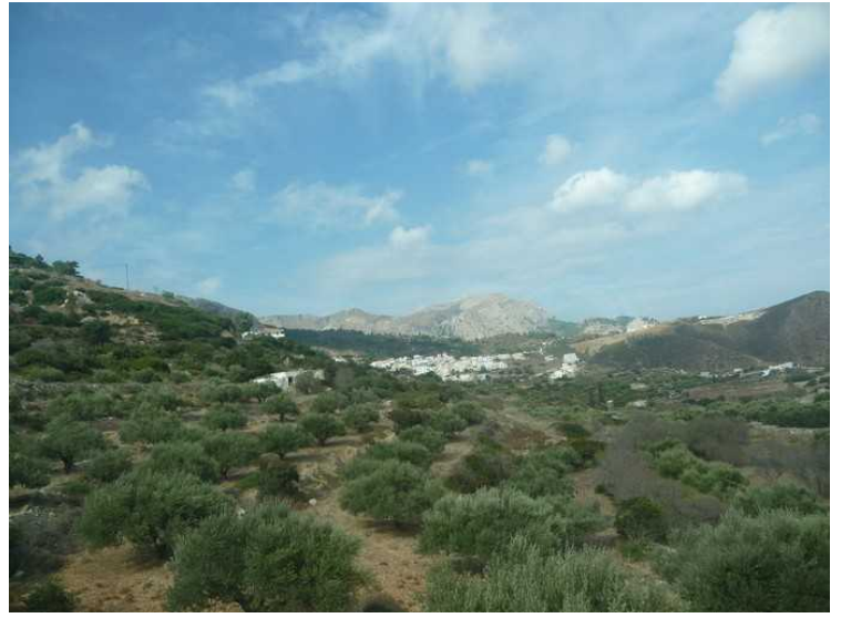
Et stykke lenger borte skimter vi Piles . Der skal vi gjøre et stopp.