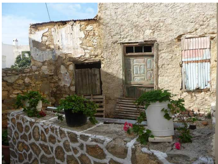
Det er fint pyntet utenfor her også, men det hadde nok gjort seg med litt vedlikehold av murpussen og vinduer, dører og karmen.