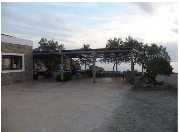
En stor pergola i inngangspartiet.