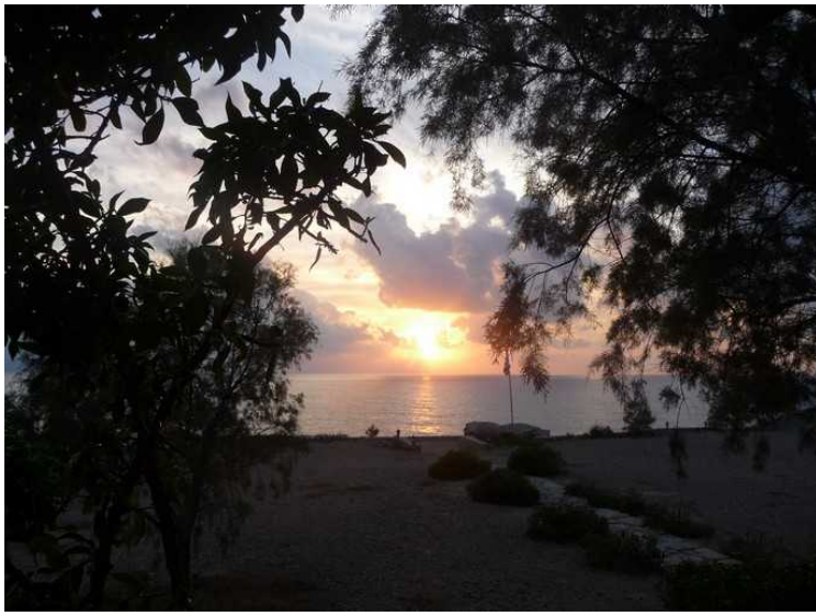
Vi kommer dit akkurat idet sola går ned.