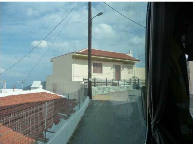
Nesten på toppen.

Hovedveien går midt gjennom byen. Veien er smal og svingete, og det er godt gjort av sjåføren å greie å smyge bussen gjennom. Vi stoppet ikke i disse byene.