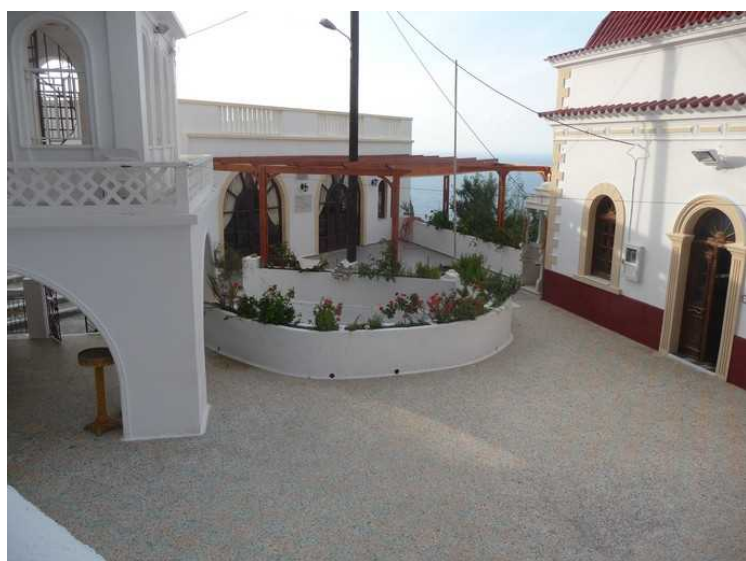
Vi går tilbake igjen forbi plassen utenfor forsamlingshuset.