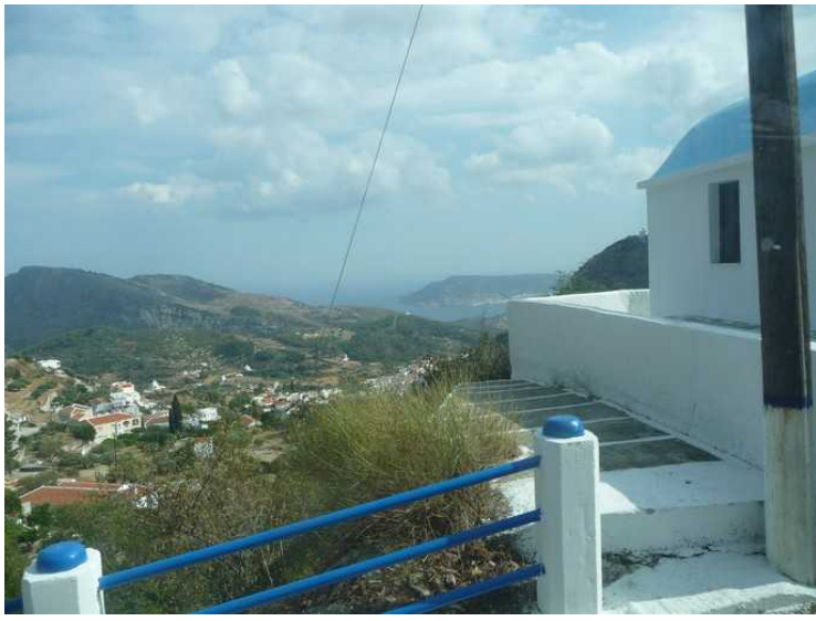
Her kjører vi videre oppover. Vi ser ned til Pigadia.