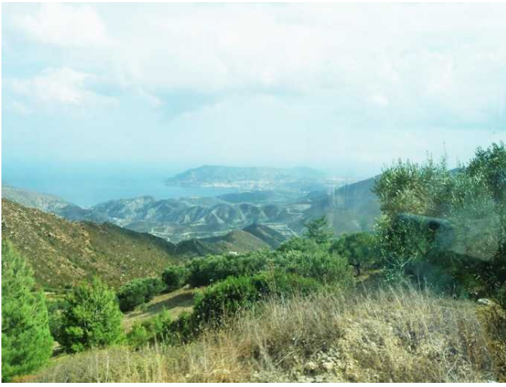
Omtrent på det høyeste punktet på veien. Vi ser sydover mot flyplassen.