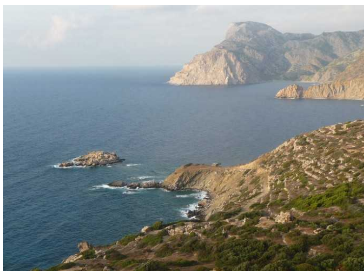
Enda et blikk nordover vestkysten.