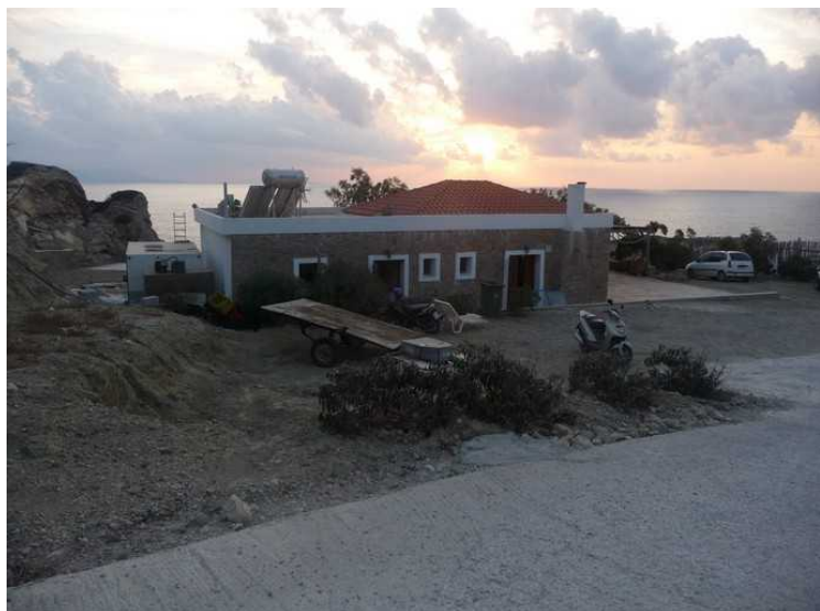
Her kommer vi ned til tavernaen.