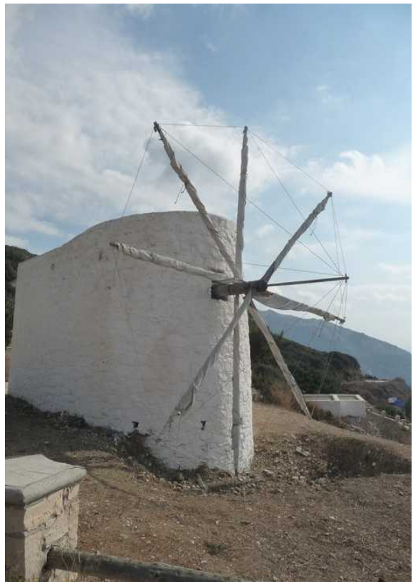
Vindmølla sett fra en annen vinkel.