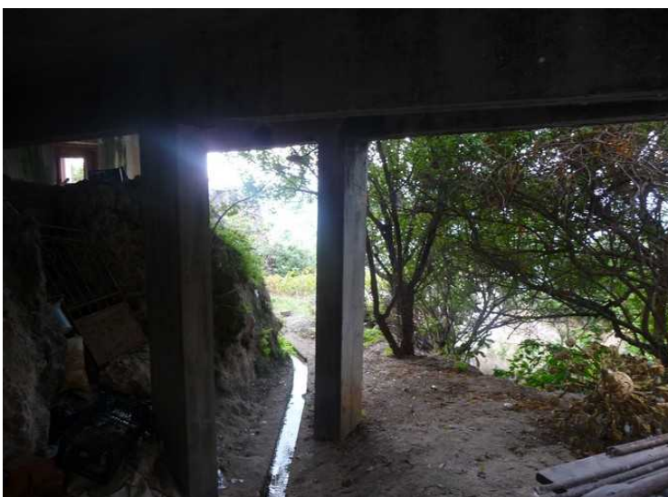
Her ledes vannet videre i en kanal ut over markene, og det brukes til vanning.