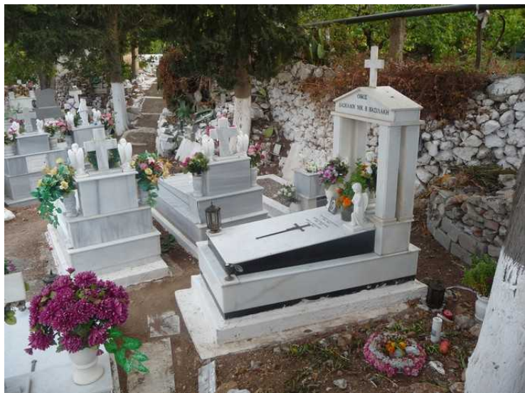
Noen har flotte minnesteiner.