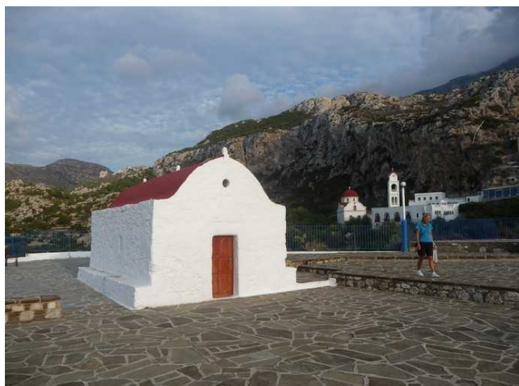
Det er en knøtt liten kirke her også.