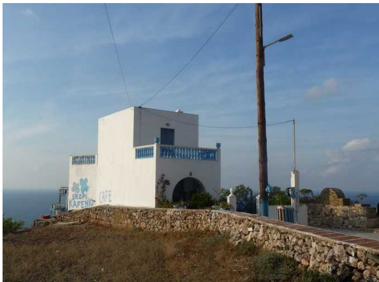
Her kommer vi til den store åpne plassen som vi så da vi kom ut av bussen.