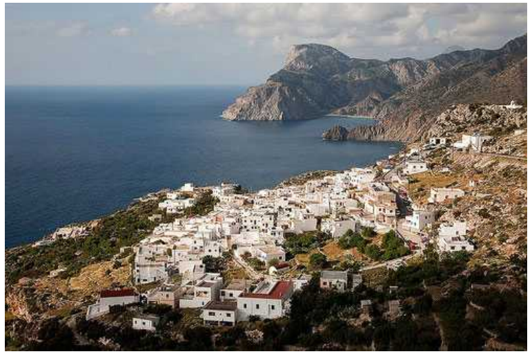
Til slutt et bilde av Mesochori som er hentet fra Internet på følgende adresse .