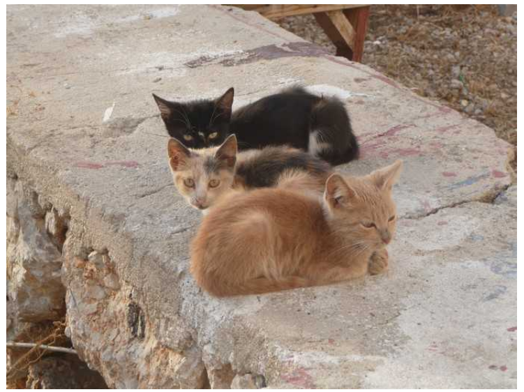
Kattene ligger på muren i kveldssola.