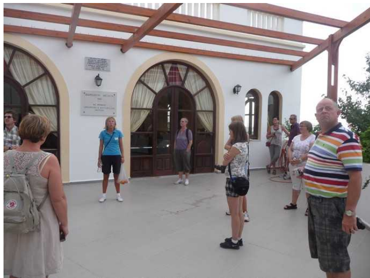
Rett ved siden av er det også et forsamlingshus med en stor åpen plass utenfor.