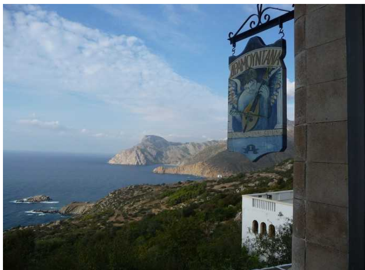
Skiltet til restauranten med kysten nordover i bakgrunnen.