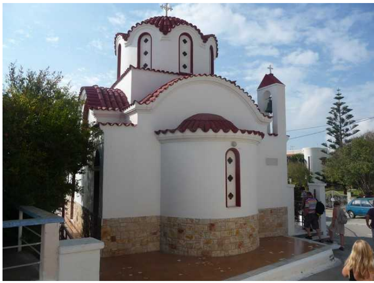
Dette er Jomfru Maria-kirken, en gresk ortodoks kirke. Her feires minnet om Jomfru Maria som blir tatt opp til himmelen da hennes jordiske liv tok slutt. Dette feires den 15. august.