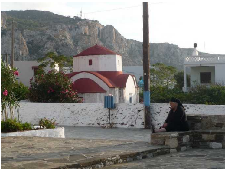
Nå er vi på vei ut av plassen igjen, og da ser vi bort på enda en liten kirke.