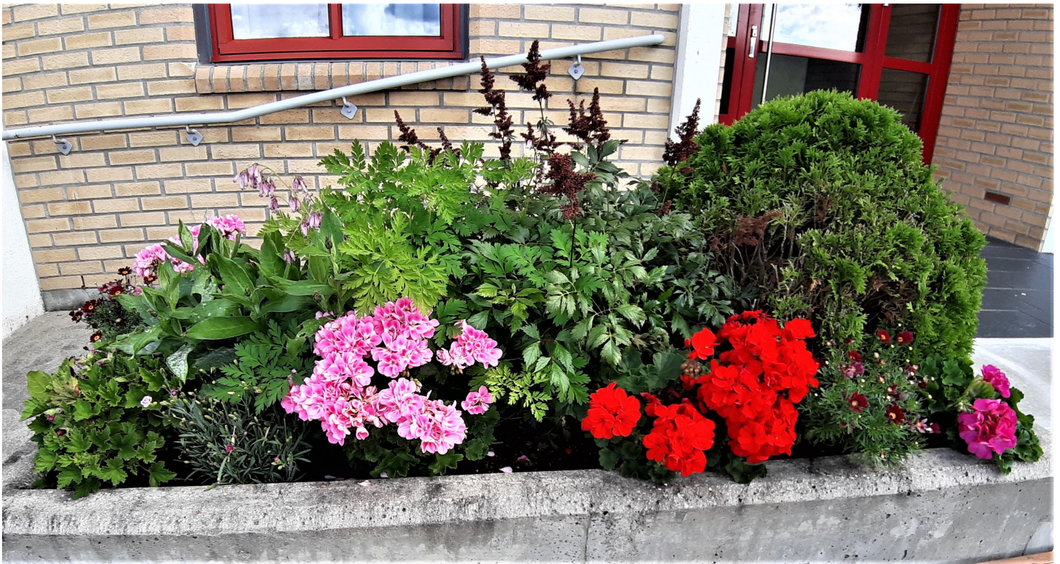
Blomsterkassen utenfor inngangen vår.