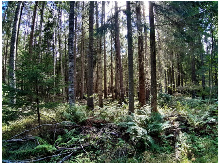
Det burde være sopp her.