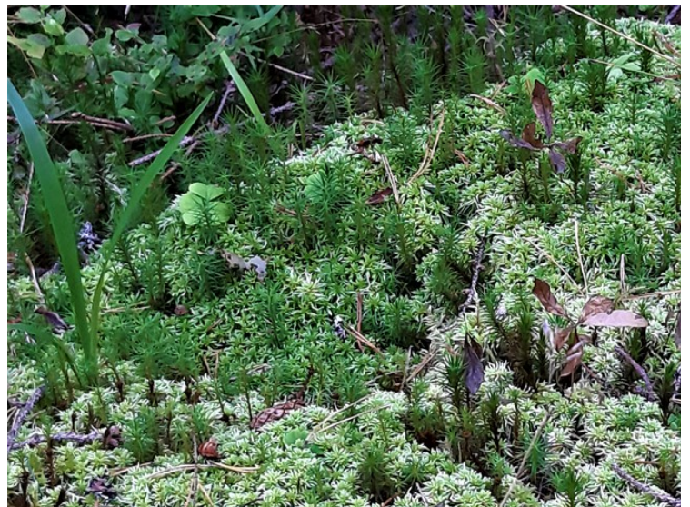
Mose og lav.